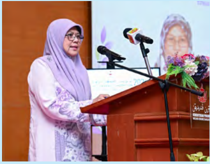
MENTERI Pendidikan, Yang Berhormat Datin Seri Setia Dr. Hajah Romaizah binti Haji Md. Salleh semasa berucap pada Majlis Konvensyen Pemimpin Sekolah Ke-8 Tahun 2026 pada Rabu, 6 Mei 2026 yang berlangsung di Pusat Persidangan Antarabangsa BRIDEX, Jerudong.