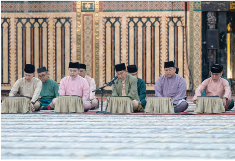
YANG Berhormat Menteri Hal Ehwal Ugama hadir pada acara Takbir Beramai-ramai sempena Hari Raya Aidiladha bagi Tahun 1447 Hijrah di Jame' 'Asr Hassanil Bolkiah (atas dan kanan).