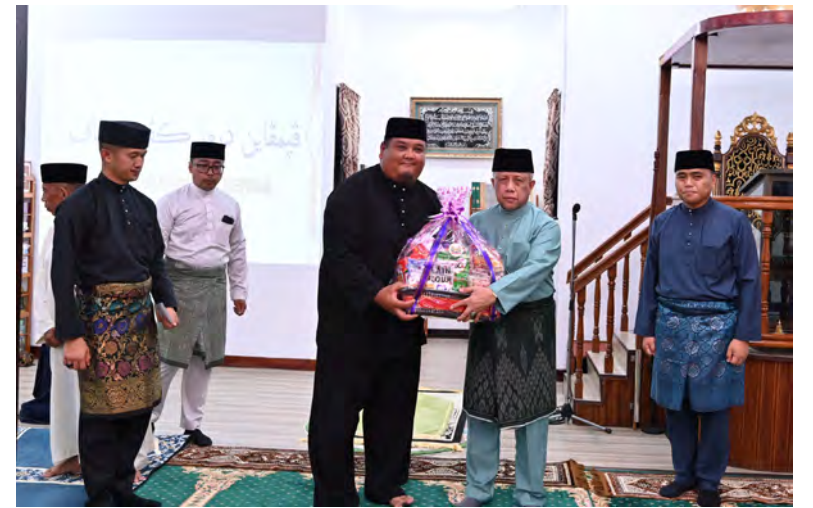
YANG Berhormat Menteri di Jabatan Perdana Menteri dan Menteri Pertahanan II hadir pada Program Jangkauan dengan tumpuan majlis berlangsung di Masjid Kampung Puduk, Mukim Kota Batu (atas dan kiri).

Program Jangkauan berkenaan merupakan salah satu pembaharuan dalam aktiviti bermasyarakat yang dilaksanakan oleh Kementerian Pertahanan di seluruh daerah, melibatkan Masjid