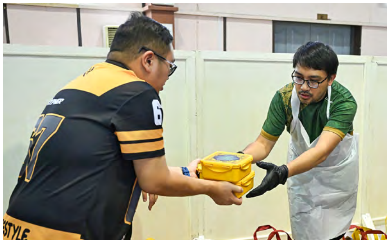
PENGAGIHAN daging-daging korban di Dewan Muhibbah, Jabatan Daerah Brunei dan Muara.

Oleh : Haniza Abdul Latif