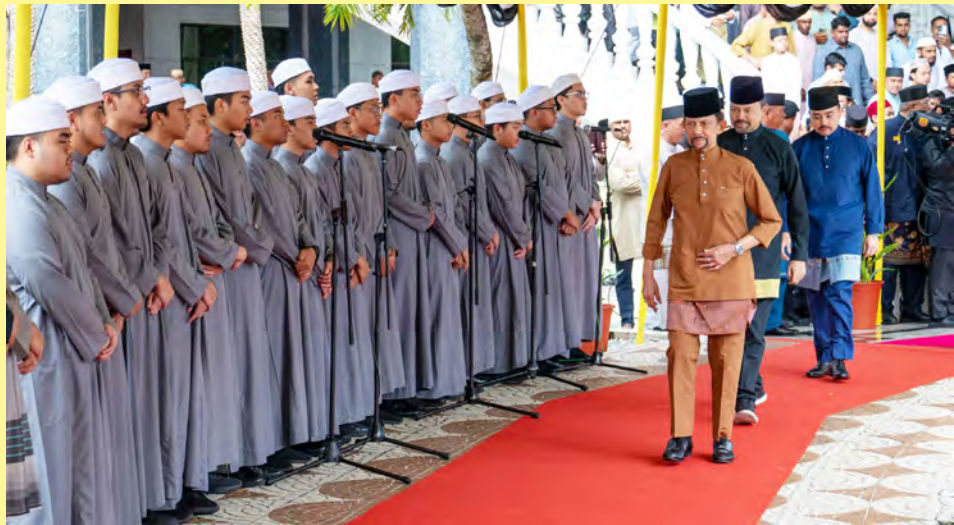
KEBAWAH Duli Yang Maha Mulia Paduka Seri Baginda Sultan Haji Hassanal Bolkiah Mu'izzaddin Waddaulah ibni Al-Marhum Sultan Haji Omar 'Ali Saifuddien Sa'adul Khairi Waddien, Sultan dan Yang Di-Pertuan Negara Brunei Darussalam dan paduka-paduka anakanda baginda berkenan berangkat ke pekarangan Jame' 'Asr Hassanil Bolkiah, Kiarong (atas), manakala gambar kanan, baginda berkenan menyempurnakan penyembelihan haiwan korban.