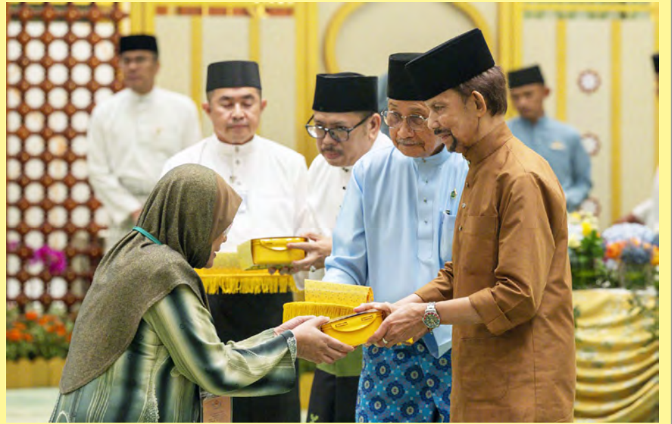
KEBAWAH Duli Yang Maha Mulia Paduka Seri Baginda Sultan Haji Hassanal Bolkiah Mu'izzaddin Waddaulah, Sultan dan Yang Di-Pertuan Negara Brunei Darussalam berkenan mengurniakan daging ibadah korban kepada para penerima khas (kiri dan kanan).