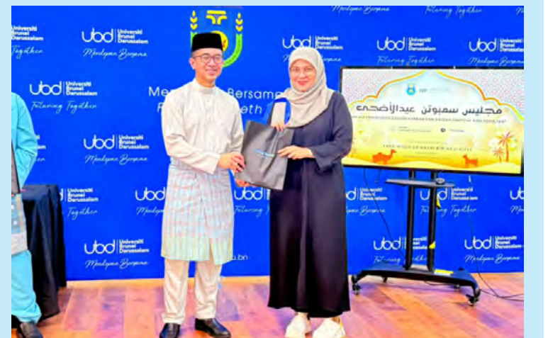
NAIB Canselor UBD mengagihkan daging korban dan akikah kepada para peserta dan penerima.

Program ini juga menyediakan para mahasiswa dan mahasiswi peluang berharga untuk membangunkan kepimpinan, kerja berpasukan dan kemahiran organisasi melalui penglibatan komuniti dan juga pengalaman secara langsung. Turut hadir pada majlis tersebut, tetamu jemputan dan warga universiti.