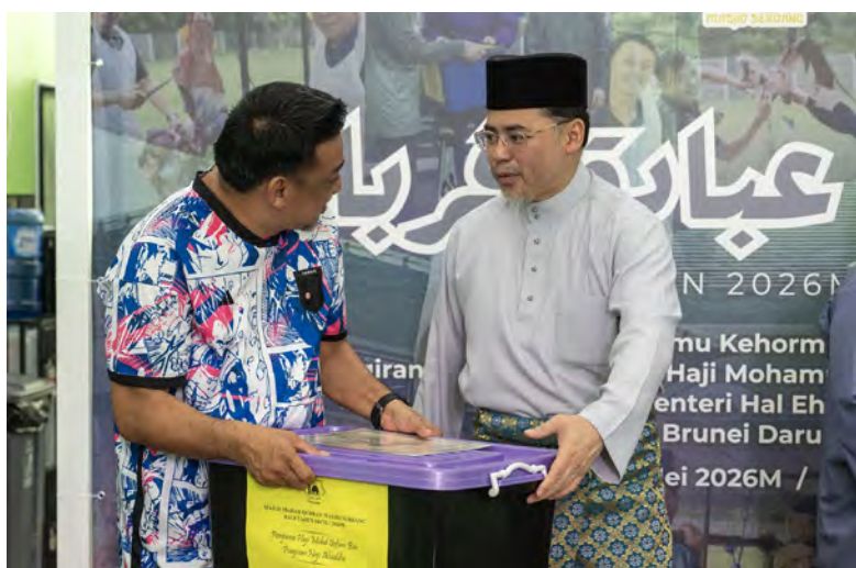
Oleh : Hajah Siti Zuraiyah Awang Haji Sulaiman

Majlis tersebut diadakan sebagai salah satu usaha memperkukuhkan semangat kebersamaan, perpaduan dan sikap saling bantu-membantu dalam kalangan masyarakat di samping menghayati pengertian sebenar ibadah korban.