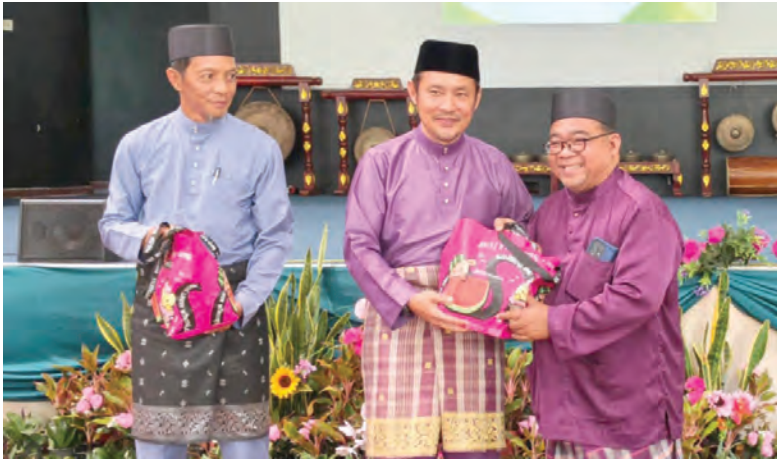
■ Berita dan Foto : Siti Rokiah Abdullah

TANAH JAMBU , Jumaat, 29 Mei. - Sebanyak dua ekor lembu dikorbankan dan dagingnya diagihkan kepada 33 orang penerima sempena Majlis Ibadah Korban Institut Pendidikan Teknikal Brunei (IBTE) Kampus Pusat IBTE yang berlangsung petang tadi di Dewan Serbaguna IBTE Kampus Nakhoda Ragam, Tanah Jambu, di sini.