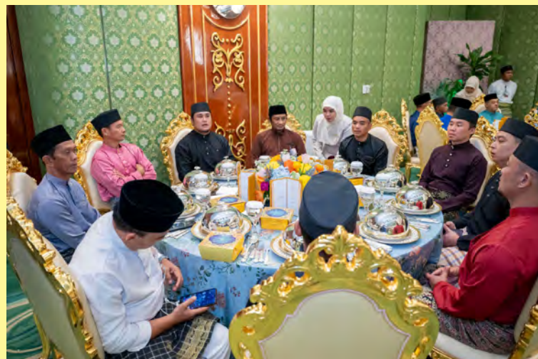
KEBAWAH Duli Yang Maha Mulia Paduka Seri Baginda Sultan dan Yang Di-Pertuan Negara Brunei Darussalam dan Kebawah Duli Yang Maha Mulia Paduka Seri Baginda Raja Isteri serta kerabat diraja berkenan berangkat ke majlis berkenaan (atas).