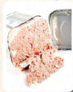
3 sudu makan Corned Beef