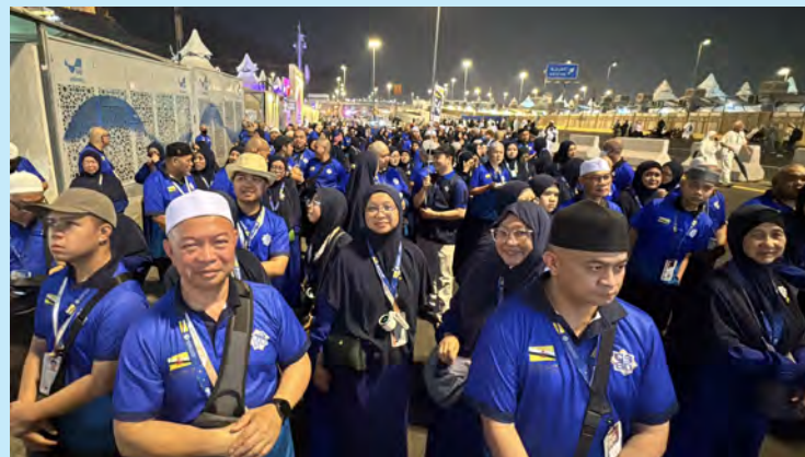
JEMAAH haji Darussalam Services Sdn. Bhd. meneruskan pelaksanaan ibadah haji di Mina dengan melaksanakan ibadah melontar jamrah mengikut jadual yang telah ditetapkan (atas dan bawah).