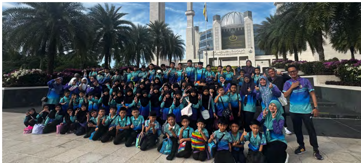
PARA guru dan pelajar dari Sekolah Rendah Lamunin, Kluster 5 semasa mengadakan lawatan ke Balai Khazanah Islam Sultan Haji Hassanal Bolkiah.

BANDAR SERI BEGAWAN , Rabu, 27 Mei. - Seramai 74 orang dari Sekolah Rendah Lamunin, Kluster 5 yang terdiri daripada 14 guru dan 60 murid telah mengadakan lawatan ke Balai Khazanah Islam Sultan Haji Hassanal Bolkiah (BKISHHB), di sini.