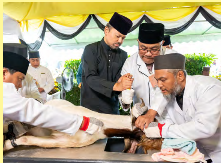
PADUKA anakanda baginda, Duli Yang Teramat Mulia Paduka Seri Pengiran Muda Mahkota Pengiran Muda Haji Al-Muhtadee Billah, Menteri Kanan di Jabatan Perdana Menteri berkenan menyempurnakan penyembelihan haiwan korban.