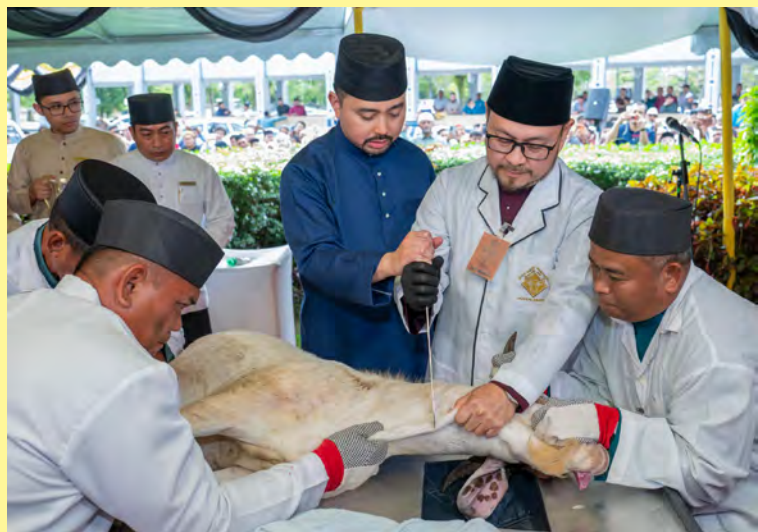
PADUKA-paduka anakanda baginda, Duli Yang Teramat Mulia Paduka Seri Pengiran Muda 'Abdul Malik dan Duli Yang Teramat Mulia Paduka Seri Pengiran Muda 'Abdul Mateen berkenan menyempurnakan penyembelihan haiwan-haiwan korban (atas dan kanan).

Pada tahun ini, sebanyak 210 ekor haiwan korban, iaitu 196 ekor sapi, dan 14 ekor kambing dikorbankan dan sebahagian daging ibadah korban sunat berkenaan diagihkan kepada sejumlah 18,527 asnaf fakir dan miskin di seluruh negara.