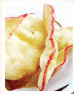
1 bungkus kecil Keropok Udang Tempatan