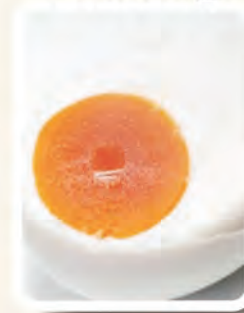
Sebiji Telur Masin