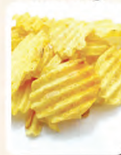
1 bungkus kecil Keropok Ubi Kentang