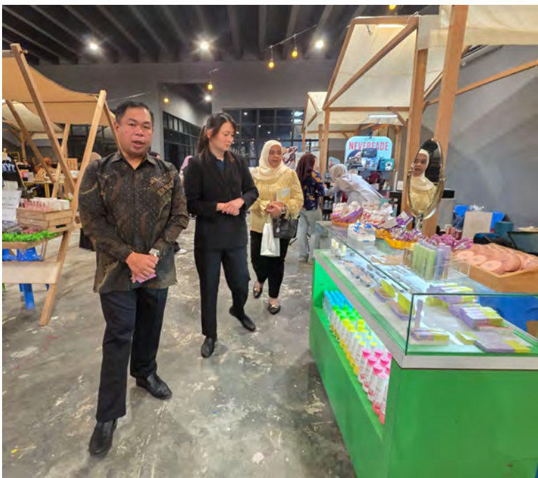
■ Oleh : Pg. Siti Redzaimi Pg. Haji Ahmad

BANDAR SERI BEGAWAN , Jumaat, 29 Mei. - Pusat Pembangunan Belia (PPB), Kementerian Kebudayaan, Belia dan Sukan (KKBS) dengan kerjasama Future Brands Group menganjurkan acara IN:Stall x YDC: Glow-up 2026, sebuah platform pop-up kecantikan, kesenian dan gaya hidup yang berlangsung selama lima hari bermula 27 hingga 31 Mei 2026 di Hab Belia dan Hab Sukan, Stadium Negara Hassanal Bolkiah.