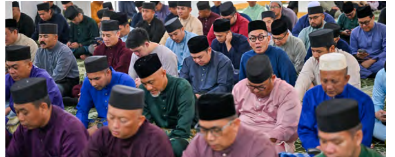
Oleh : Pg. Vivy Malessa Pg. Ibrahim