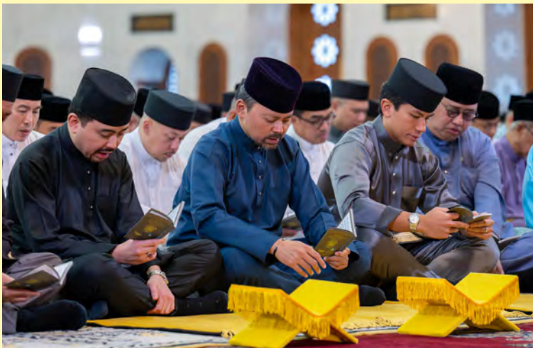
DULI Yang Teramat Mulia Paduka Seri Pengiran Muda Mahkota serta kerabat diraja semasa membaca Surah Yaa Siin (atas). Manakala gambar kanan dan bawah, antara jemaah yang hadir pada majlis tersebut yang diadakan di Jame' 'Asr Hassanil Bolkiah, Kiarong.

Majlis Kesyukuran Sembahyang Fardu Zuhur Berjemaah, Membaca Surah Yaa Siin dan Doa Kesyukuran sempena Sambutan Ulang Tahun Hari Kebangsaan NBD Ke-42, Tahun 2026 turut diadakan secara serentak di semua masjid, surau dan balai ibadat seluruh negara dengan beberapa buah masjid di daerah-daerah lain juga sebagai tumpuan utama majlis.