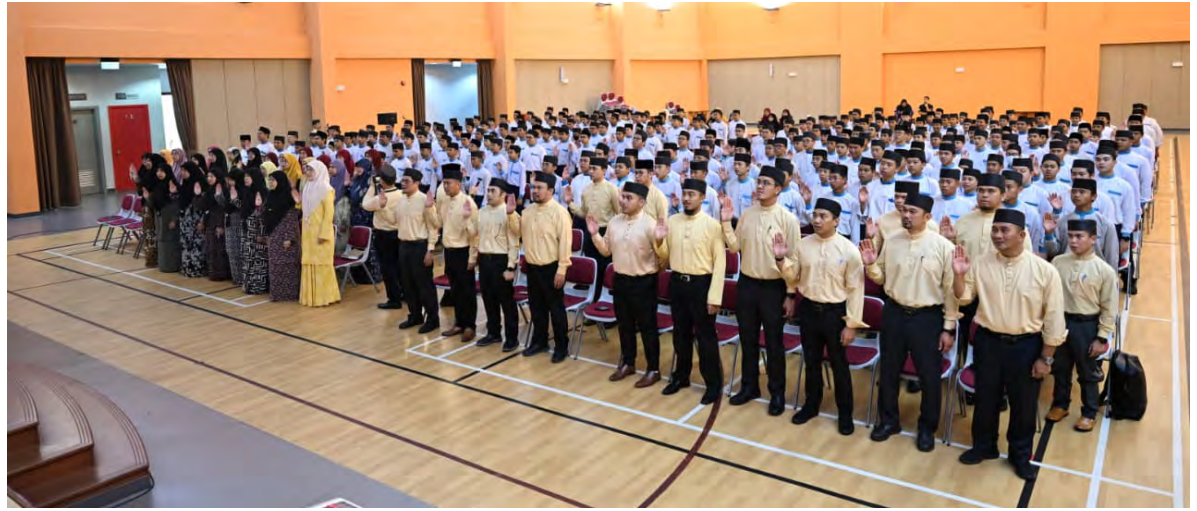
SUASANA bacaan ikrar pada Majlis Sambutan Ulang Tahun Hari Kebangsaan Negara Brunei Darussalam Ke-42, Tahun 2026 di Sekolah Arab Sultan Haji Hassanal Bolkiah, Kampung Rimba.

Acara diteruskan dengan tayangan rakaman Titah Kebawah Duli Yang Maha Mulia Paduka Seri Baginda Sultan Haji Hassanal Bolkiah Mu'izzaddin Waddaulah ibni Al-Marhum Sultan Haji Omar 'Ali Saifuddin Sa'adul Khairi Waddien, Sultan dan Yang Di-Pertuan Negara Brunei Darussalam sempena Sambutan Ulang Tahun HK NBD Ke-42, Tahun 2026, disusuli dengan bacaan ikrar dan diakhiri dengan laungan takbir.