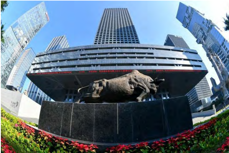
LOKASI Bursa Saham di Shenzhen, Wilayah Guangdong selatan Republik Rakyat China.

BEIJING, 24 Feb. - Saham Republik Rakyat China ditutup lebih tinggi pada Selasa, dengan Shanghai Composite Index penanda aras meningkat 0.87 peratus kepada 4,117.41 mata.