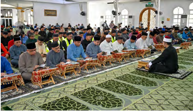
YANG Berhormat Menteri di Jabatan Perdana Menteri dan Menteri Kewangan dan Ekonomi II hadir selaku tetamu kehormat majlis (atas). Manakala gambar kanan, antara yang hadir pada majlis tersebut.

BELAIT , Isnin, 23 Februari. - Majlis Kesyukuran Sembahyang Fardu Zuhur Berjemaah, Membaca Surah Yaa Siin dan Doa Kesyukuran sempena Sambutan Ulang Tahun Hari Kebangsaan (HK) Negara Brunei Darussalam (NBD) Kali Ke-42, Tahun 2026 turut diadakan secara serentak di semua masjid, surau dan balai ibadat seluruh negara dengan beberapa buah masjid di daerah-daerah lain juga sebagai tumpuan utama majlis.