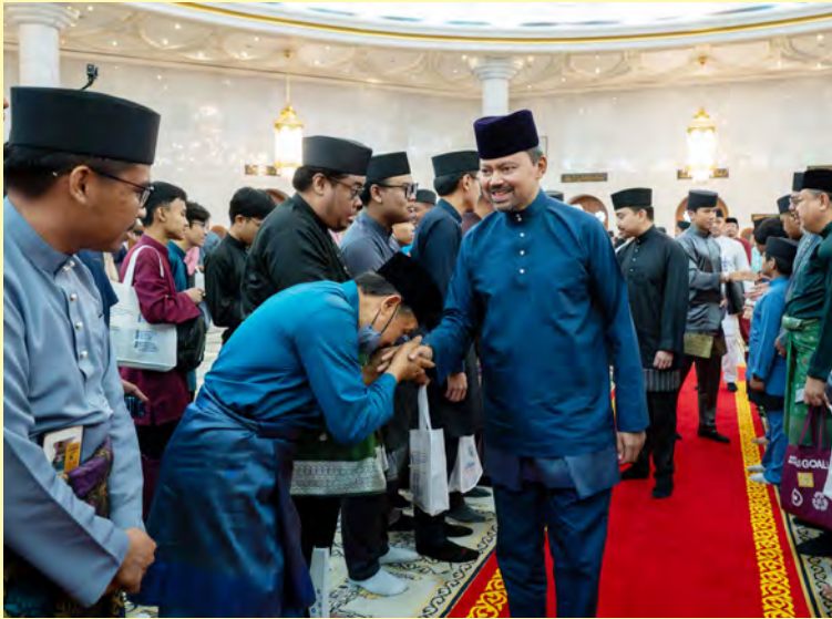
Oleh : Nooratini Haji Abas