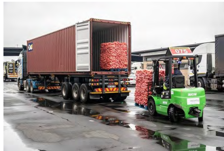
SEORANG pekerja memandu forklift sedang memuatkan kotak buah-buahan ke dalam trak di Pasar Hasil Segar Johannesburg di Afrika Selatan, pada 29 Okt. 2025.

Pengendali menara itu berkata pihaknya akan menjalankan pemeriksaan lengkap ke atas menara itu pada Isnin.