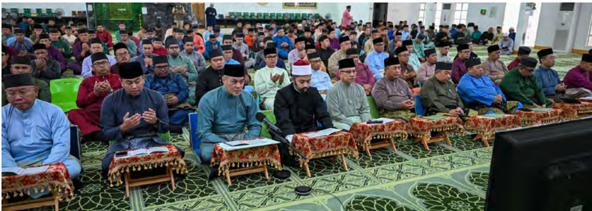
YANG Berhormat Menteri Hal Ehwal Dalam Negeri dan Yang Berhormat Menteri Pembangunan ketika hadir pada Munajat Khas sempena Sambutan Ulang Tahun Hari Kebangsaan Negara Brunei Darussalam Ke-42 di Masjid Muhammad Jamalul Alam, Kuala Belait (atas). Sementara gambar kanan, antara jemaah perempuan yang hadir pada majlis berkenaan.