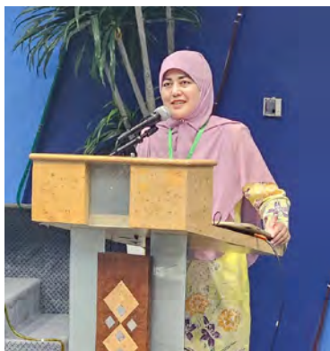
YANG Mulia Timbalan Menteri Kewangan dan Ekonomi (Fiskal) hadir selaku tetamu kehormat majlis (atas kiri). Manakala gambar atas dan kiri, sekitar majlis tersebut.

Majlis pada tahun ini diselenggarakan oleh Bahagian Pelaburan, MOFE.