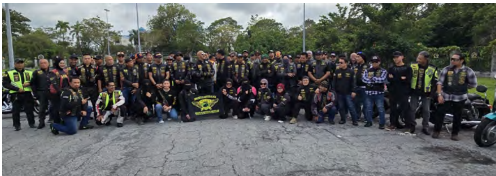
SEKITAR 'Patriotic Ride' yang diselenggarakan dengan Majlis Tahlil, Doa Kesyukuran dan Berbuka Puasa bertempat di Aman Hills Hotel.

Oleh : Pg. Siti Redzaimi Pg. Haji Ahmad