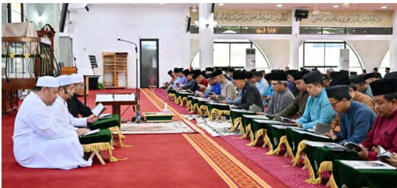
YANG Berhormat Menteri Pembangunan hadir selaku tetamu kehormat majlis yang diadakan di Masjid Hassanal Bolkiah, Pekan Tutong (atas dan kanan).

TUTONG , Isnin, 23 Februari. - Majlis Kesyukuran Sembahyang Fardu Zuhur Berjemaah, Membaca Surah Yaa Siin dan Doa Kesyukuran Sempena Sambutan Ulang Tahun Hari Kebangsaan (HK) Negara Brunei Darussalam Ke-42, Tahun 2026 diadakan serentak di semua masjid, surau dan balai ibadat seluruh negara dengan beberapa buah masjid sebagai tumpuan mengikut daerah-daerah.