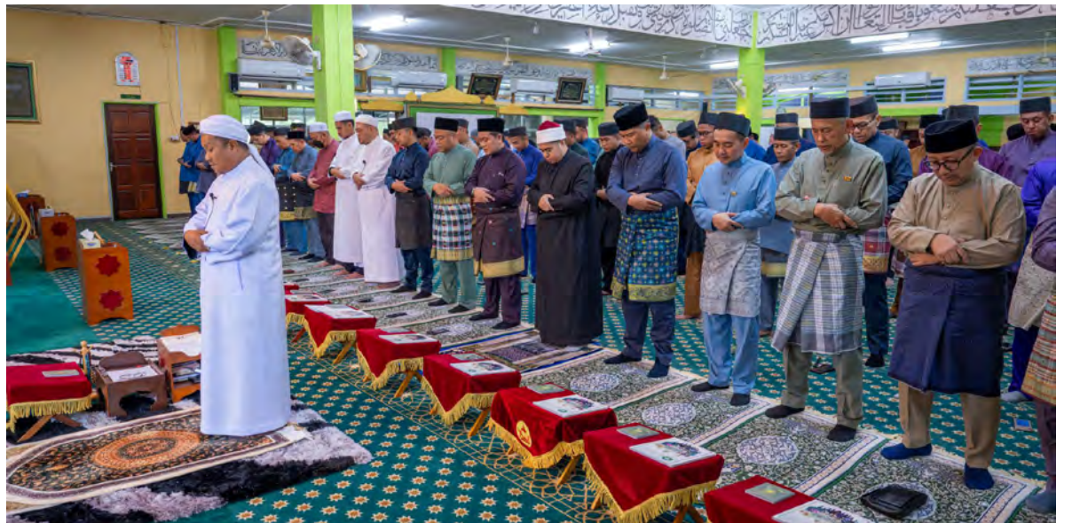
YANG Berhormat Menteri Pengangkutan dan Infokomunikasi hadir selaku tetamu kehormat Majlis Kesyukuran Sembahyang Fardu Zuhur Berjemaah, Membaca Surah Yaa Siin dan Doa Kesyukuran yang diadakan di Masjid Utama Mohammad Salleh, Pekan Bangar.

Majlis keagamaan yang diadakan setiap tahun di ambang Sambutan Ulang Tahun HK NBD berkenaan adalah penzahiran