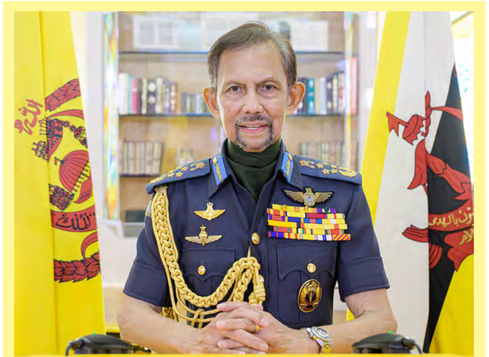
KEBAWAH Duli Yang Maha Mulia Paduka Seri Baginda Sultan Haji Hassanal Bolkiah Mu'izzaddin Waddaulah ibni Al-Marhum Sultan Haji Omar 'Ali Saifuddien Sa'adul Khairi Waddien, Sultan dan Yang Di-Pertuan Negara Brunei Darussalam berkenaan mengurniakan Titah Perutusan Khas bersempena Sambutan Hari Kebangsaan Negara Brunei Darussalam kali Ke-42 Tahun 2026 pada Ahad 22 Februari 2026.

Kesemua inisiatif ini, termasuk yang digariskan di bawah Rancangan Kemajuan Negara Ke-12 mencerminkan kesungguhan Kerajaan dalam mentransformasikan landskap ekonomi negara serta memastikan setiap elemen pembangunan ekonomi saling