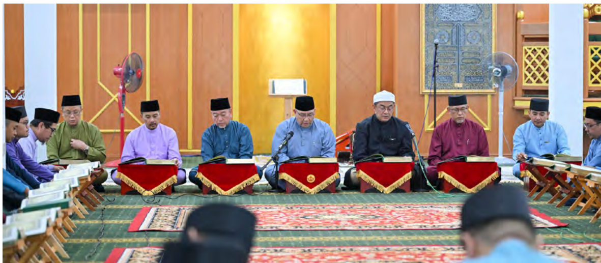
YANG Mulia Timbalan Menteri di JPM (Urustadbir Perkhidmatan Awam) hadir selaku ketua rombongan pada majlis berkenaan dan seterusnya menyampaikan sumbangan wakaf kepada Imam Masjid RPN Kampung Rataie (atas dan atas kiri).