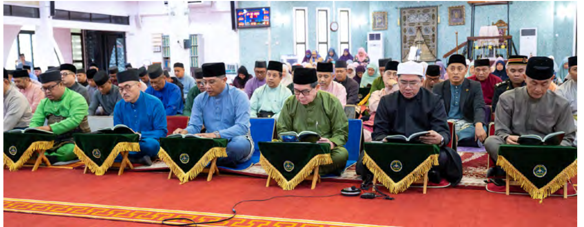
YANG Berhormat Menteri di Jabatan Perdana Menteri dan Menteri Kewangan dan Ekonomi II dan Yang Berhormat Menteri Pengangkutan dan Infokomunikasi hadir bagi sama-sama menyemarakkan lagi Munajat Khas di Masjid Hassanal Bolkiah, Pekan Tutong (atas). Manakala gambar kiri, antara yang hadir pada majlis tersebut.

Oleh : Pg. Vivy Malessa Pg. Ibrahim