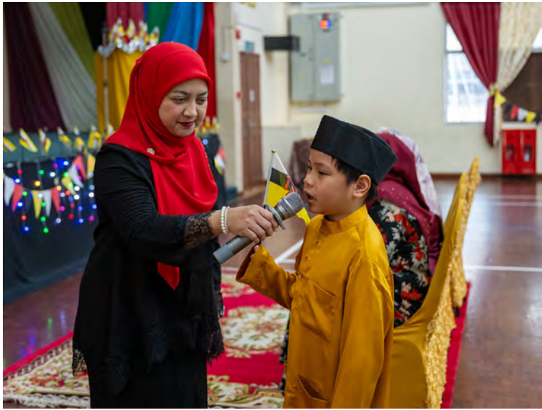
PELBAGAI acara dan aktiviti dilaksanakan seperti aktiviti kuiz bagi murid-murid bersempena Sambutan Hari Kebangsaan (HK) Negara Brunei Darussalam (NBD) Ke-42 (atas). Manakala gambar bawah, sesi bergambar ramai sempena majlis tersebut.

BANDAR SERI BEGAWAN, Selasa, 24 Februari. - Sekolah-sekolah rendah, menengah dan maktab serta pusat tingkatan enam di seluruh negara hari ini mengadakan Sambutan Ulang Tahun Hari Kebangsaan (HK) Negara Brunei Darussalam (NBD) Ke-42, Tahun 2026 secara serentak di keempat-empat daerah. Antara yang menjadi tumpuan sambutan berkenaan ialah di Sekolah Rendah Datu Ratna Haji Muhammad Jaafar, Kampung Kiarong. Pelbagai acara dan aktiviti dilaksanakan termasuk Doa Khas HK, nyanyian Lagu Kebangsaan dan persembahan lagu-lagu patriotik, bacaan lkrar HK, serta aktiviti kuiz