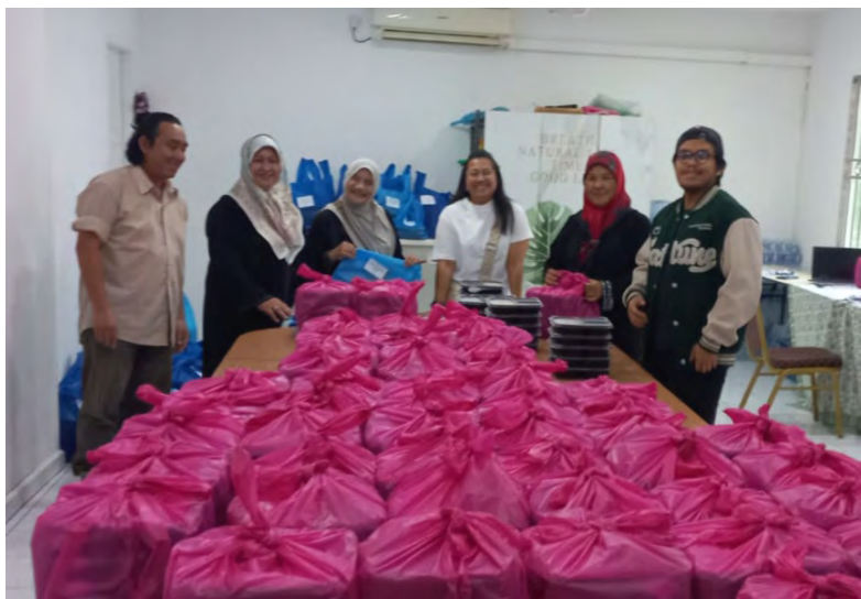
ANTARA yang turut serta menjayakan Projek Sungkai Ramadan Brunei (atas). Manakala gambar atas kanan, pek sungkai yang diagihkan kepada salah seorang penerima.

BANDAR SERI BEGAWAN, Isnin, 23 Februari. - Inisiatif Majlis Kesejahteraan Masyarakat (MKM) dalam mengumpul dana dapat meneruskan lagi aktiviti tahunan dengan mengagihkan juadah iftar kepada lebih 839 klien di keempat-empat daerah selama 15 hari berturut-turut bersempena menyambut Ramadan Al-Mubarak kali ini.