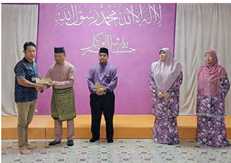
SUASANA pada Majlis Infaq Kasih Ramadan dan Sambutan Hari Kebangsaan (HK) Negara Brunei Darussalam (NBD) Ke-42 yang diadakan di Masjid Pehin Khatib Abdullah Kampung Kulapis (atas dan kanan).

Berita dan Foto : Ihsan Sekolah Cahaya Bina Insan