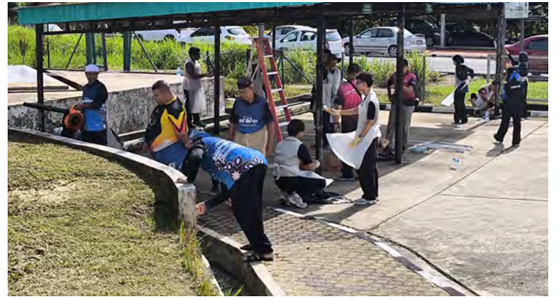
PROGRAM Pengayaan Antarabangsa UM-UBD memberi tumpuan kepada pertukaran budaya, penglibatan masyarakat, jangkauan pendidikan dan pembangunan pelajar melalui pembelajaran berasaskan pengalaman.

Program diakhiri dengan ucapan penghargaan yang diarahkan kepada penduduk Kampung Setia 'A' atas kerjasama dan sokongan mereka sepanjang