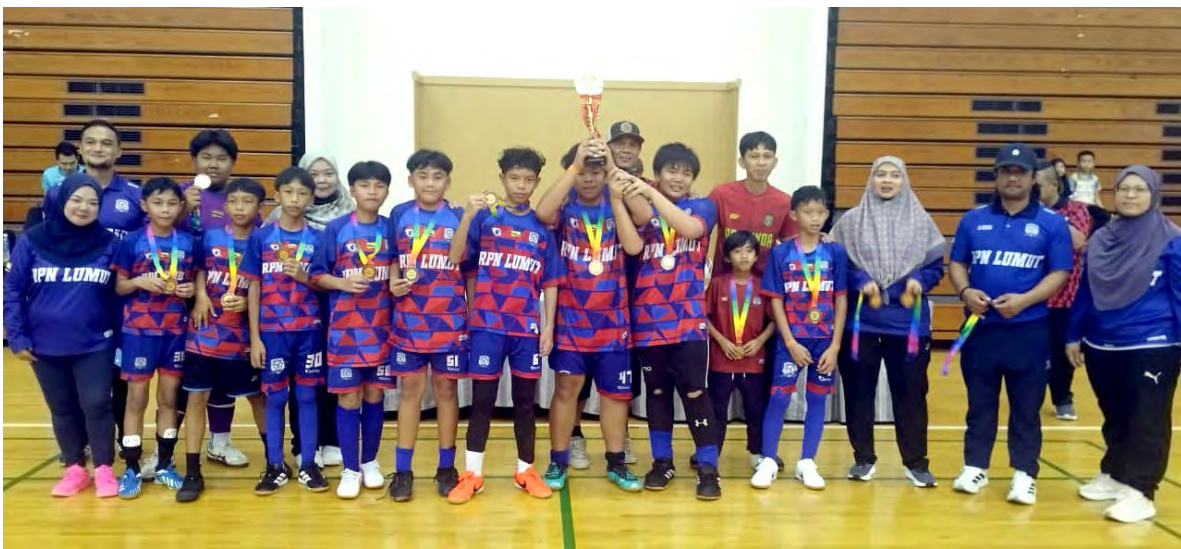
PASUKAN yang menyertai Kejohanan Battle of BD Inter-District Futsal 2026 semasa bergambar ramai bersama pingat masing-masing (atas). Sementara gambar atas kiri, salah seorang pemain yang menerima piala.

Kejohanan berkenaan merupakan kesinambungan siri kejohanan sukan futsal yang dihasratkan untuk membentuk pembangunan peringkat akar umbi dalam bidang sukan futsal di Negara Brunei Darussalam.