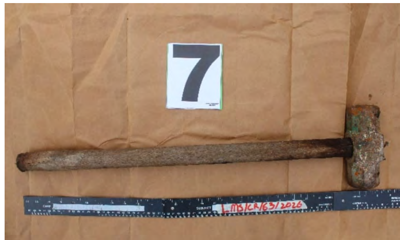
GAMBAR mugshot menunjukkan suspek seorang wanita warganegara tempatan (kiri), manakala gambar kanan, menunjukkan senjata yang dipercayai digunakan oleh suspek.