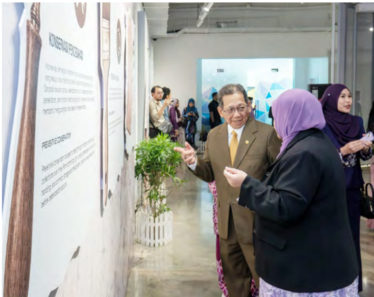
YANG Berhormat Ahli Majlis Mesyuarat Negara hadir selaku tetamu kehormat majlis dan seterusnya merasmikan pelancaran majlis tersebut (kiri dan kiri sekali).

Oleh : Marlinawaty Hussin