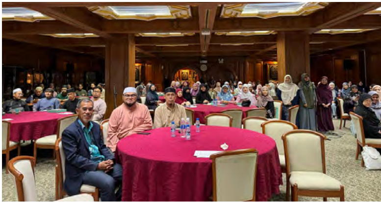
PROGRAM Pra Perkahwinan Bersiri 2026 dihasratkan dapat menjadi platform yang bermanfaat dalam membantu masyarakat memahami kepentingan ilmu dan persediaan dalam mendirikan rumah tangga (atas dan kanan).