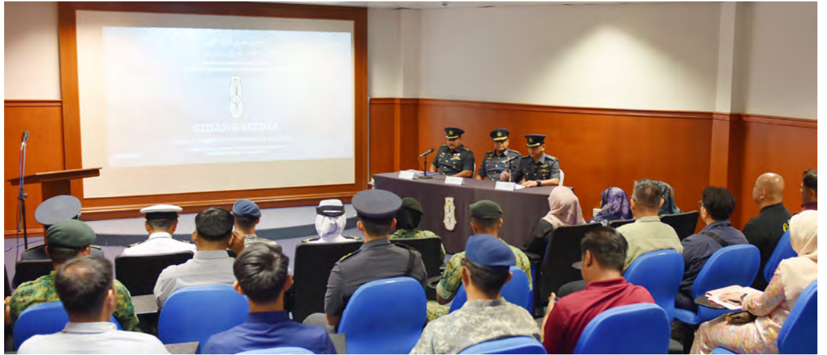
SIDANG Media sempena Sambutan Hari Ulang Tahun Angkatan Bersenjata Diraja Brunei (ABDB) Ke-65 diadakan di Bilik Alap-Alap, Markas Tentera Udara Diraja Brunei, Pangkalan Tentera Udara Rimba (atas kanan dan atas).