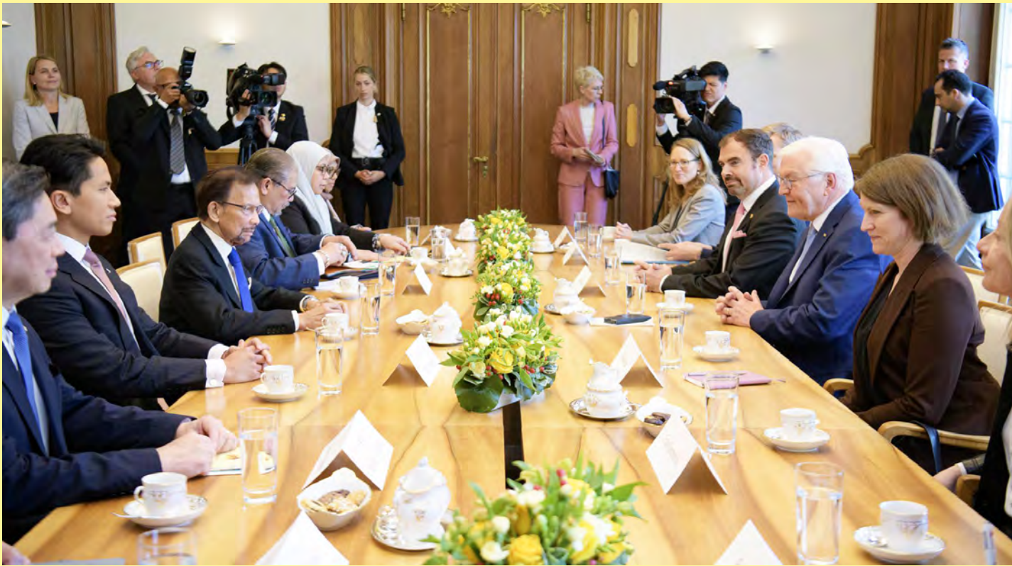
KEBAWAH Duli Yang Maha Mulia Paduka Seri Baginda Sultan Haji Hassanal Bolkiah Mu'izzaddin Waddaulah ibni Al-Marhum Sultan Haji Omar 'Ali Saifuddien Sa'adul Khairi Waddien, Sultan dan Yang Di-Pertuan Negara Brunei Darussalam berkenan berangkat menghadiri Majlis Perjumpaan Dua Hala bersama Presiden Republik Persekutuan Jerman, Tuan Yang Terutama Frank-Walter Steinmeier. (Lihat muka 3)