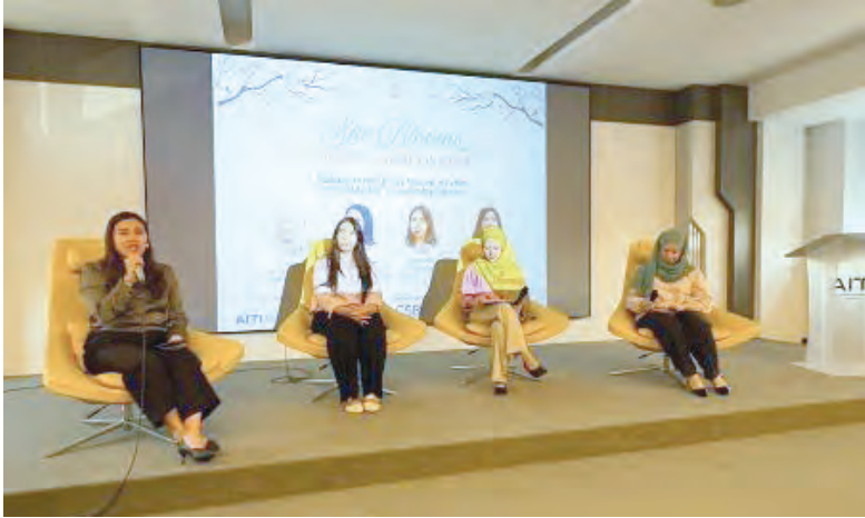
LADIES in Cyber 2026 : She Blooms - Growing Women in Cyber merupakan acara yang didedikasikan untuk memperkasakan wanita dalam keselamatan siber melalui pembelajaran praktikal, wawasan pakar dan penglibatan komuniti (atas dan kanan).