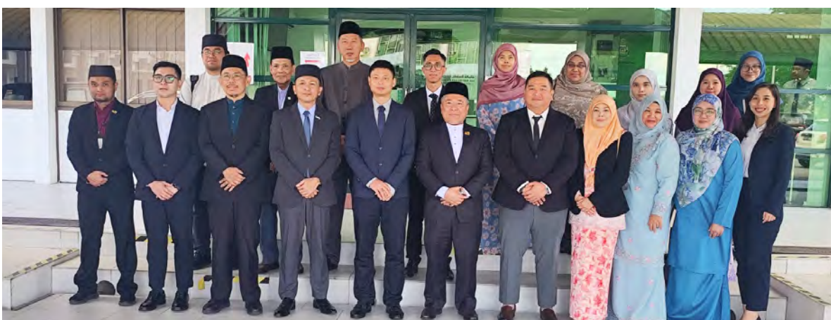
REKTOR UNISSA dan Ketua Pegawai Eksekutif MPC semasa sesi bergambar ramai.

Bagi maklumat lanjut, orang ramai boleh menghubungi Talian Darussalam 123 atau layari laman sesawang www.moh.gov.bn atau mengikuti media sosial Kementerian Kesihatan @mohbrunei.