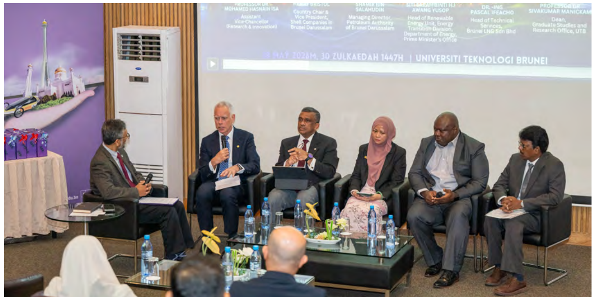
NAIB Canselor UTB hadir selaku tetamu kehormat pada UTB Energy Spectrum Symposium: Integrating Upstream, Downstream and Renewable Frontiers (atas kiri). Manakala gambar atas, para ahli panel semasa sesi perbincangan tersebut.