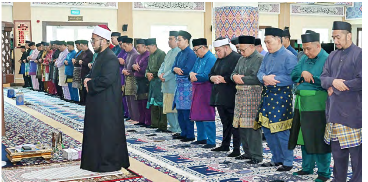
SETIAUSAHA Tetap Kementerian Pengangkutan dan Infokomunikasi hadir pada Majlis Doa Kesyukuran yang berlangsung di Masjid Suri Seri Begawan Raja Pengiran Anak Damit, Kampung Manggis / Madang.

kukuh dan mampan bagi menyokong keterhubungan serta ketahanan digital yang berterusan.