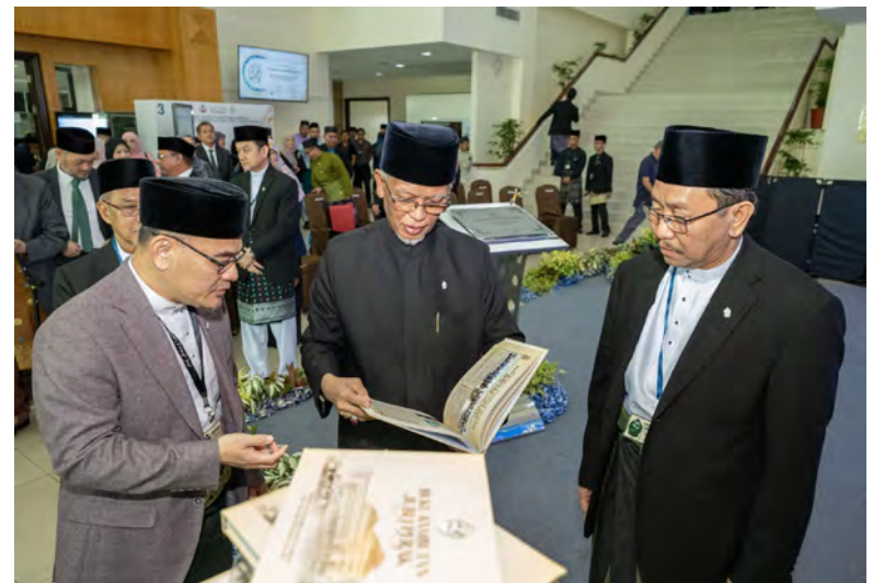
Asnaf Zakat (PROPZ).

Juga turut diundang bagi memeriahkan lagi suasana Hari Terbuka Mahkamah Syariah 2026 ialah penyertaan beberapa buah syarikat peniaga makanan dan minuman tempatan yang kebanyakannya terdiri daripada usahawan yang berdaftar di bawah naungan Program Pengupayaan