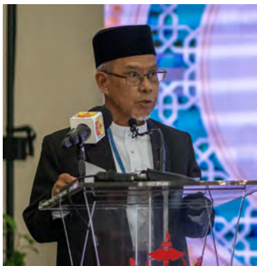
SEKITAR majlis tersebut yang diadakan di Ruang Legar, Ibu Pejabat Bangunan Mahkamah Besar dan Mahkamah-mahkamah Syariah (atas dan kanan).

selama dua hari bermula hari ini bertempat di Ruang Legar, Ibu Pejabat Bangunan Mahkamah Besar dan Mahkamah-mahkamah Syariah, di sini.