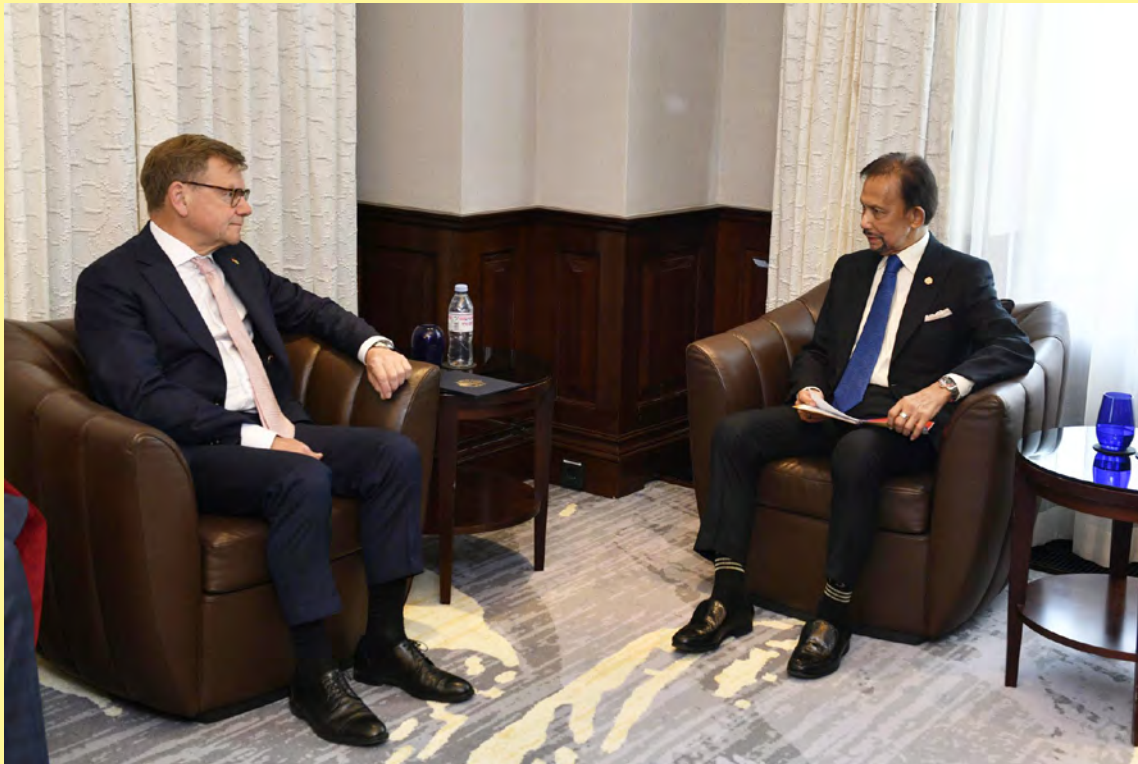
KEBAWAH Duli Yang Maha Mulia Paduka Seri Baginda Sultan Haji Hassanal Bolkiah Mu'izzaddin Waddaulah ibni Al-Marhum Sultan Haji Omar 'Ali Saifuddin Sa'adul Khairi Waddien, Sultan dan Yang Di-Pertuan Negara Brunei Darussalam berkenan menerima mengadap Federal Minister for Foreign Affairs of Germany, Tuan Yang Terutama Dr. Johann Wadephul yang diadakan di Berlin.