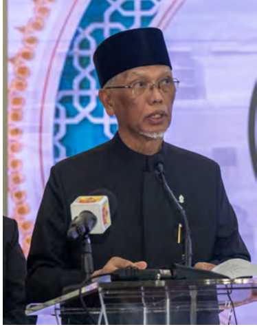
YANG Amat Arif / Yang Berhormat Ketua Hakim Syarie ketika berucap.

BANDAR SERI BEGAWAN , Selasa, 19 Mei. - 25 tahun merupakan satu tempoh yang sarat dengan pengalaman, cabaran dan pencapaian. Mahkamah Syariah memainkan peranan penting dalam menegakkan keadilan berlandaskan hukum syarak serta peruntukkan undang-undang yang berkuat kuasa.