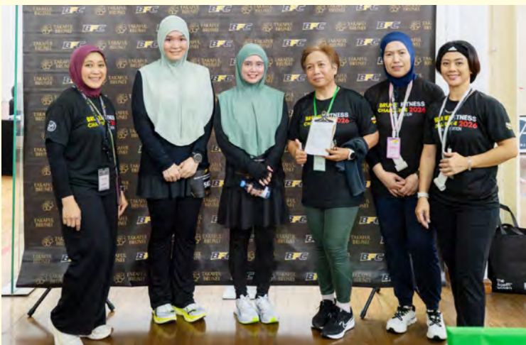
Oleh : Rohani Haji Abdul Hamid

BANDAR SERI BEGAWAN , Ahad, 19 April. - Seramai 208 peserta menyertai Brunei Fitness Challenge 2026 (Mile Edition)