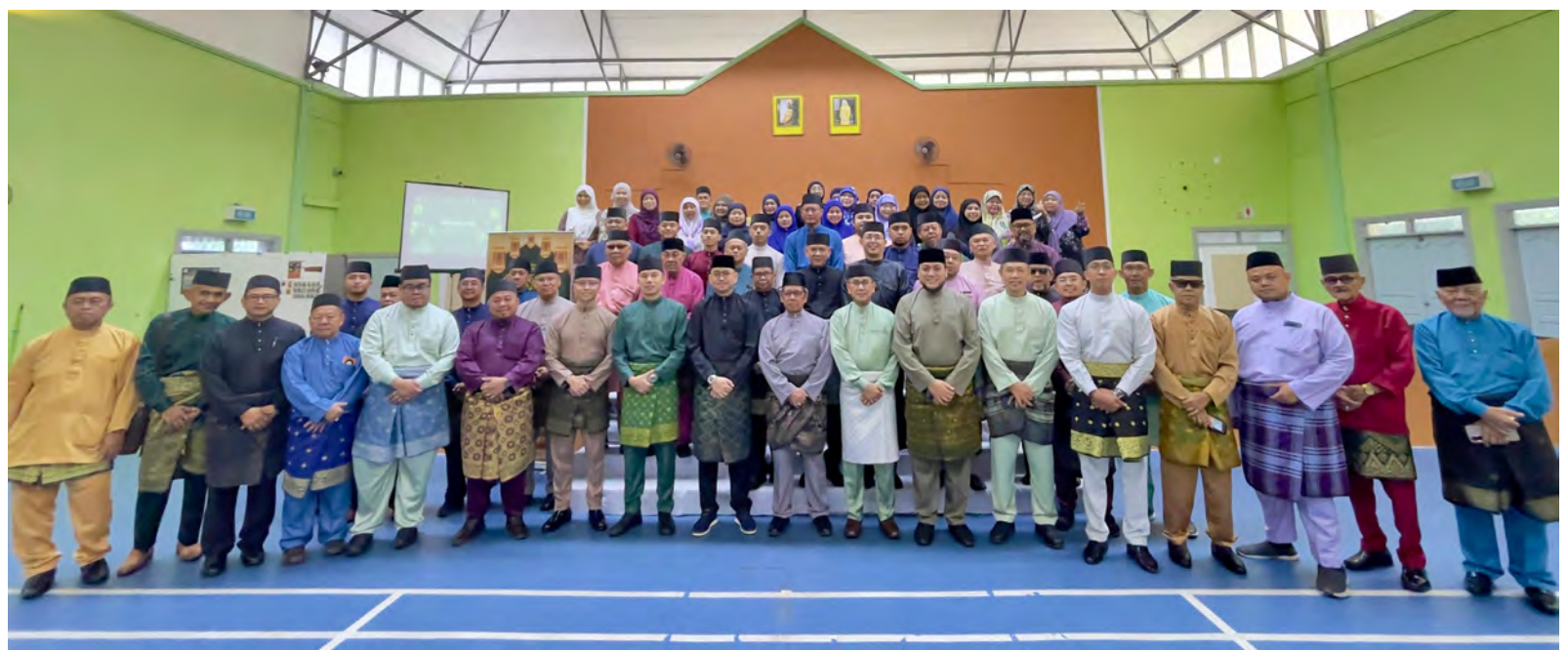
SESI bergambar ramai pada Sambutan Hari Raya Aidilfitri 1447 Hijrah / 2026 Masihi bertempat di Dewan Kemasyarakatan 1, Jalan 2, Lambak Kanan anjuran Unit Kemasyarakatan Kejiranan Polis, Focal Point Balai Polis Berakas dengan Kerjasama Mukim Berakas 'A', Mukim Berakas 'B' dan Mukim Gadong 'A'.

diisikan dengan persembahan nyanyian lagu raya.