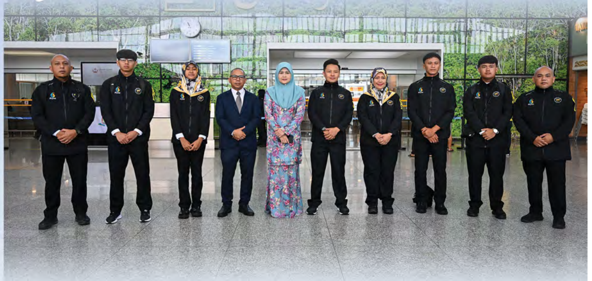
KONTINJEN Negara Brunei Darussalam semasa sesi bergambar ramai sebelum berlepas bagi menyertai Sukan Pantai Asia Ke-6 yang dijadualkan berlangsung dari 22 hingga 30 April 2026 di Sanya, Republik Rakyat China.

Terdahulu, majlis dimulakan dengan bacaan Surah Al-Fatihah