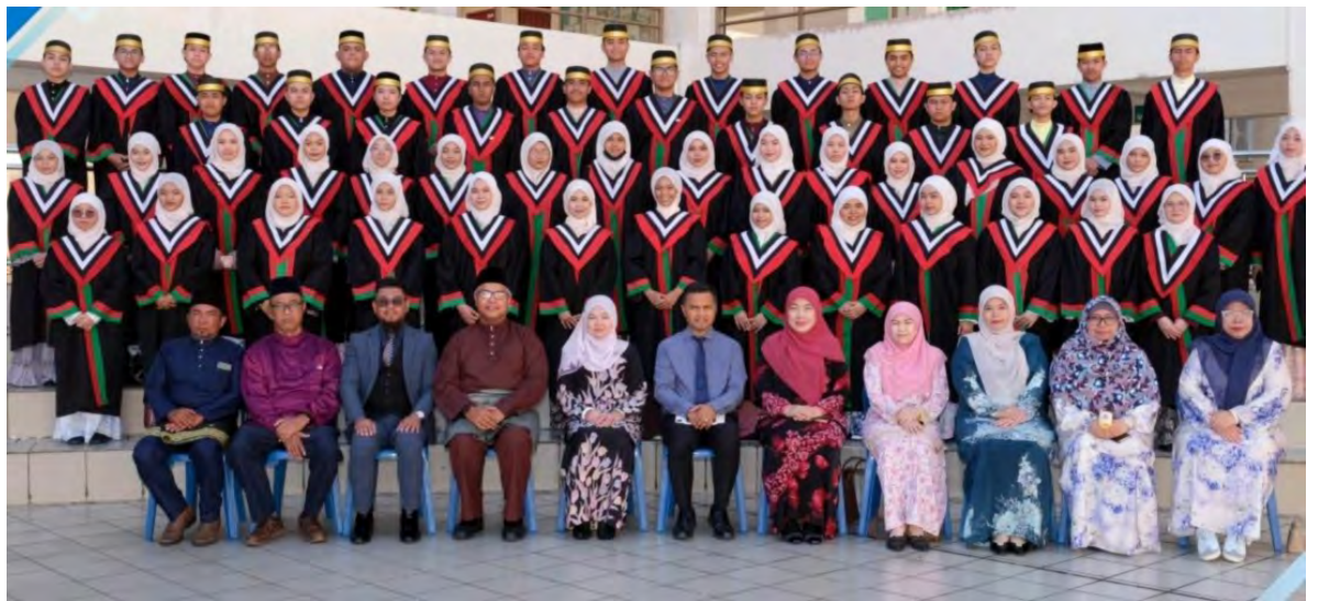
SEKOLAH Menengah Pehin Datu Seri Maharaja (SMPDSM) Mentiri semasa mengadakan Majlis Penganugerahan Pelajar Cemerlang dalam Peperiksaan BCGCE 'O' Level / IGCSE Tahun 2025 di Dewan Jubli Mutiara, sekolah berkenaan (atas dan kiri).

MENTIRI, Sabtu, 18 April. – Sekolah Menengah Pehin Datu Seri Maharaja Mentiri (SMPDSM) telah mengadakan Majlis Penganugerahan Pelajar Cemerlang dalam Peperiksaan BC GCE 'O' Level / IGCSE Tahun 2025 pagi tadi, bertempat di Dewan Jubli Mutiara, sekolah berkenaan.