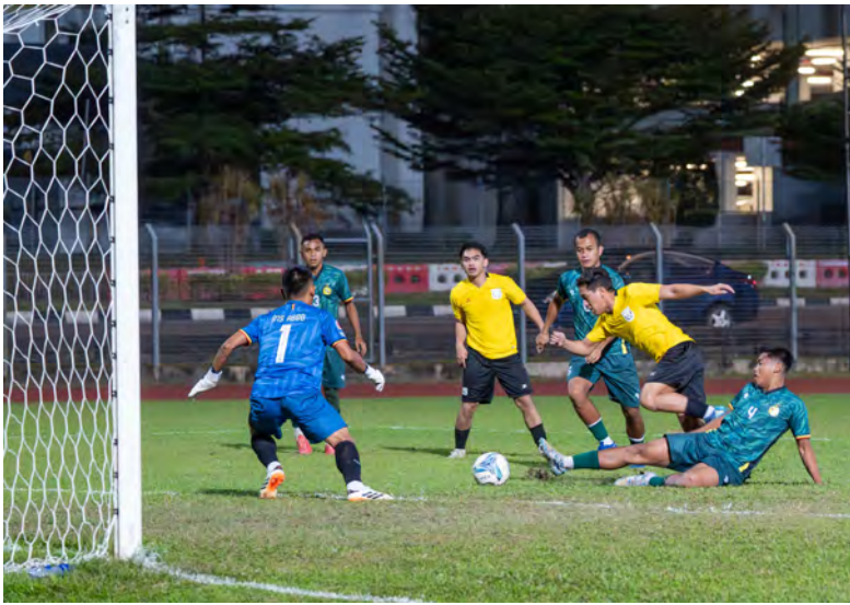
ANTARA aksi perlawanan di antara MS ABDB menentang Wijaya FC pada Liga Super Brunei bagi Musim 2025 / 2026 (atas, kanan dan bawah kanan).

Oleh : Saerah Haji Abdul Ghani