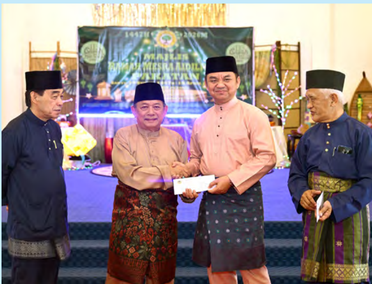
PEMANGKU Pegawai Daerah Tutong hadir selaku tetamu kehormat majlis.