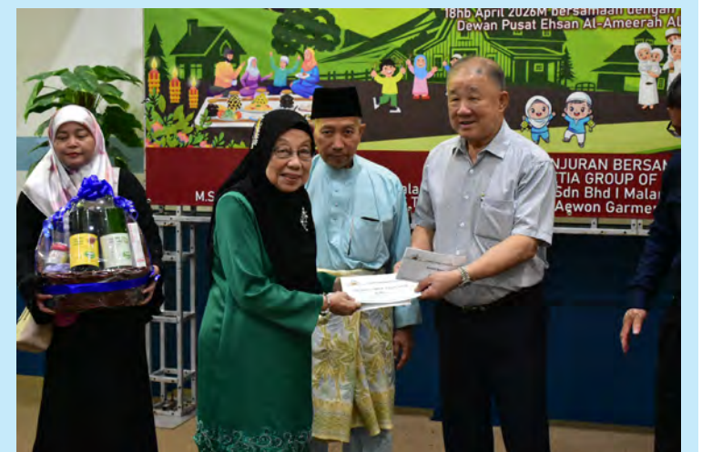
SUASANA Majlis Silaturahmi sempena Sambutan Hari Raya Aidilfitri bersama Pusat Ehsan Al-Ameerah Al-Hajjah Maryam (Pusat Ehsan).

Majlis turut diisikan dengan persembahan tarian daripada para pelajar, disusuli dengan penyampaian duit raya kepada para tetamu istimewa diikuti dengan jamuan makan dalam suasana harmoni bagi mengeratkan lagi silaturahmi.