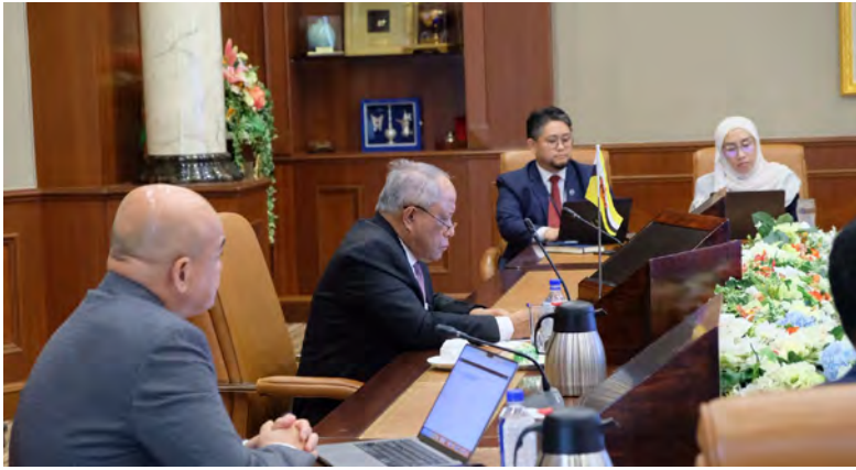
YANG Berhormat Menteri di Jabatan Perdana Menteri (JPM) dan Menteri Pertahanan II selaku Menteri yang Bertanggungjawab bagi Tenaga menghadiri mesyuarat berkenaan secara dalam talian.