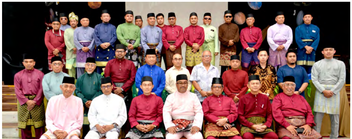
YANG Berhormat Ahli Majlis Mesyuarat Negara (MMN), Pemangku Penghulu Mukim Kianggeh serta Ketua Kampung Subok hadir selaku tetamu kehormat majlis. Turut hadir, Yang Berhormat Ahli MMN, Ketua Kampung Belimbing.

"Bagi pihak Mukim Kota Batu, saya merakamkan rasa syukur ke hadrat Allah Subhanahu Wata'ala kerana juman Aidilfitri dan sesi ramah mesra ini sekali gus mencerminkan semangat perpaduan serta kerjasama erat dalam kalangan penduduk Mukim Kota Batu," jelasnya.