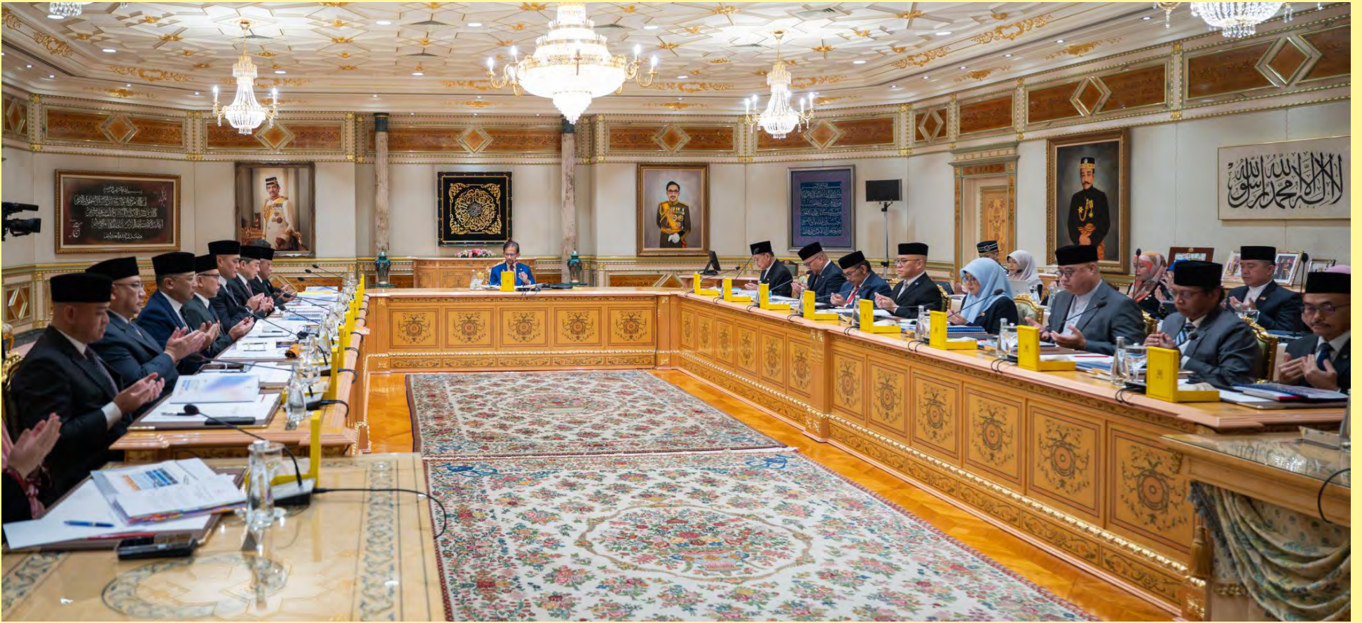
KEBAWAH Duli Yang Maha Mulia Paduka Seri Baginda Sultan Haji Hassanal Bolkiah Mu'izzaddin Waddaulah, Sultan dan Yang Di-Pertuan Negara Brunei Darussalam menadah tangan ketika Surah Al-Fatihah dan Doa Selamat dibacakan oleh Yang Berhormat Menteri Hal Ehwal Ugama.