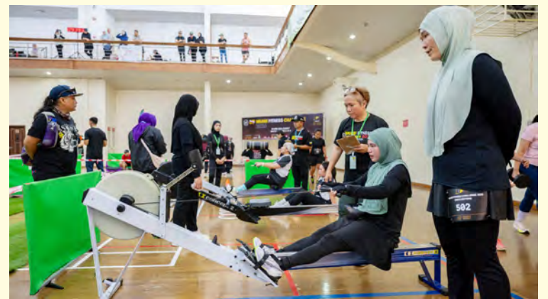
YANG Teramat Mulia Paduka Seri Pengiran Anak Puteri Hajah Hafizah Sururul Bolkiah binti Kebawah Duli Yang Maha Mulia Paduka Seri Baginda Sultan Haji Hassanal Bolkiah Mu'izzaddin Waddaulah berangkat ke Brunei Fitness Challenge 2026 (Mile Edition) (atas dan kiri).

Adapun matlamat diadakan pertandingan ini adalah untuk memberikan kesedaran orang awam dan penduduk Negara Brunei Darussalam untuk lebih peka terhadap isu-isu kesihatan fizikal dan menggalakkan cara hidup sihat dengan melibatkan diri