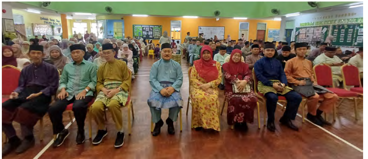
SESI bergambar ramai pada Sambutan Hari Raya Aidilfitri yang diungkuayahkan oleh Persatuan Ibu Bapa dan Guru (PIBG) Sekolah Tunas Jaya Persekutuan Guru-Guru Melayu Brunei (STJ PGGMB), Kuala Belait (KB) (atas). Manakala gambar bawah, antara persembahan pada sambutan berkenaan.