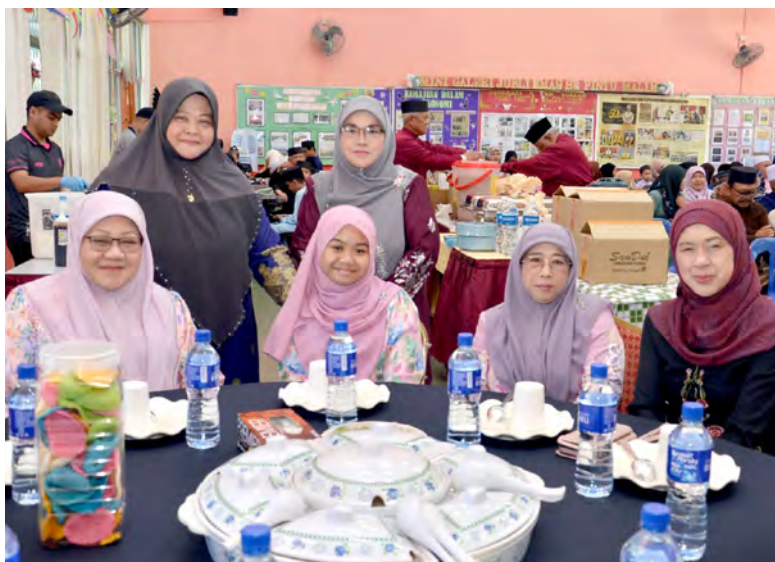
ANTARA yang hadir pada majlis tersebut.