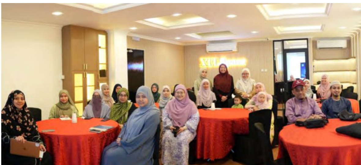
KUMPULAN Syababul Iman Masjid Sultan Sharif Ali Kampung Sengkurong mengadakan Program 'The Real Battle : The Journey Back to Allah' bertempat di XTI Space, Kampung Sengkurong (atas, kanan dan bawah kanan).

SENGKURONG, Sabtu, 18 April. – Kumpulan Syababul Iman Masjid Sultan Sharif Ali Kampung Sengkurong telah mengadakan Program 'The Real Battle : The Journey Back to Allah' bertempat di XTI Space, Kampung Sengkurong, baru-baru ini.