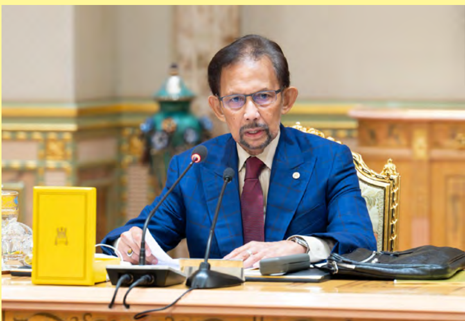
KEBAWAH Duli Yang Maha Mulia Paduka Seri Baginda Sultan Haji Hassanal Bolkiah Mu'izzaddin Waddaulah ibni Al-Marhum Sultan Haji Omar 'Ali Saifuddien Sa'adul Khairi Waddien, Sultan dan Yang Di-Pertuan Negara Brunei Darussalam berkenan mengurniakan titah pada Mesyuarat Sesi Khas Wawasan Brunei 2035 di Istana Nurul Iman.