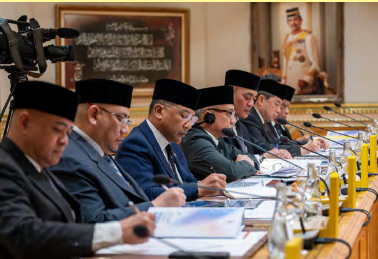
MENTERI-menteri Kabinet dan Timbalan-timbalan Menteri yang hadir pada Mesyuarat Sesi Khas Wawasan Brunei 2035 (atas dan kanan).

keadaan, khususnya dalam menangani cabaran ketidaktentuan geopolitik dan pergolakan di peringkat global.