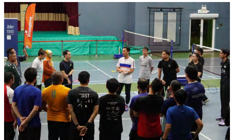
SEKITAR Klinik Badminton bersama atlet badminton antarabangsa dari Republik Indonesia di Pusat Belia (atas, kiri dan bawah).

Maklumat lanjut mengenai BILIF boleh didapati melalui laman sesawang BILIF di www.bilif.com.bn atau akaun Instagram @BILIF.bn.