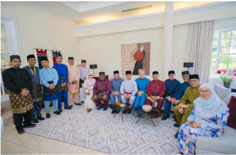
YANG Berhormat Ahli-ahli Majlis Mesyuarat Negara hadir pada Majlis Rumah Terbuka Hari Raya berkenaan (atas). Manakala gambar kanan, antara yang hadir pada majlis tersebut.

BANDAR SERI BEGAWAN , Sabtu, 18 April. – Brunei Shell Petroleum Sdn. Bhd. (BSP) baru-baru ini telah menganjurkan Majlis Rumah Terbuka Hari Raya di House 49 (kediaman rasmi Pengarah Urusan BSP), menghimpunkan pegawai-pegawai kanan kerajaan, pelanggan serta rakan niaga dalam suasana mesra