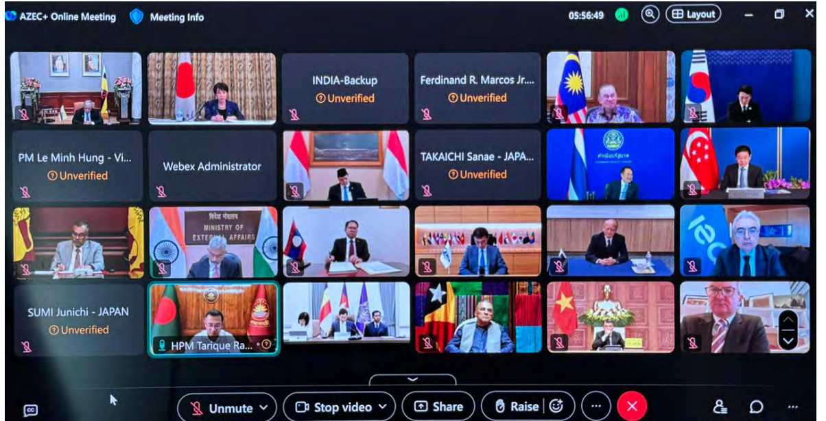
MESYUARAT Sidang Kemuncak Asia Zero Emission Community Plus (AZEC+) secara dalam talian pada Rabu, 15 April 2026.

tambahnya, menyokong pendekatan yang seimbang dan kekal komited untuk mempercepatkan sumber tenaga alternatif termasuk tenaga boleh diperbaharui pada kadar yang seiring mengikut keperluan dalam negeri sambil mengekalkan pelaburan dalam sektor minyak dan gas.