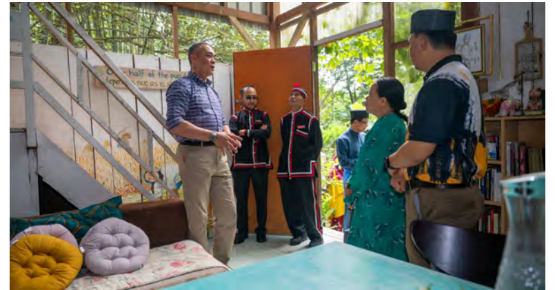
YANG Berhormat Menteri Hal Ehwal Dalam Negeri ketika berinteraksi bersama organisasi-organisasi (atas), manakala gambar bawah, suasana sekitar acara tersebut yang diadakan di Eco Ponies Garden.

Penganjur turut melahirkan rasa bangga melihat kerjasama erat dalam kalangan belia daripada etnik Kedayan, Bisaya, Dusun dan Puak Tutong yang bersama-sama