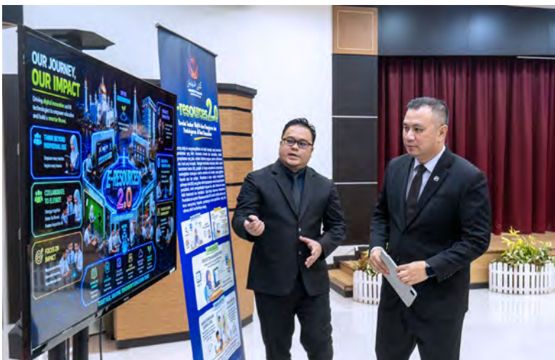
SETIAUSAHA Tetap (Urustadbir Perkhidmatan Awam), Jabatan Perdana Menteri hadir selaku tetamu kehormat di Hari Terbuka Anugerah Inovasi Perdana 2026.

Oleh : Hajah Siti Zuraiyah Awang Haji Sulaiman