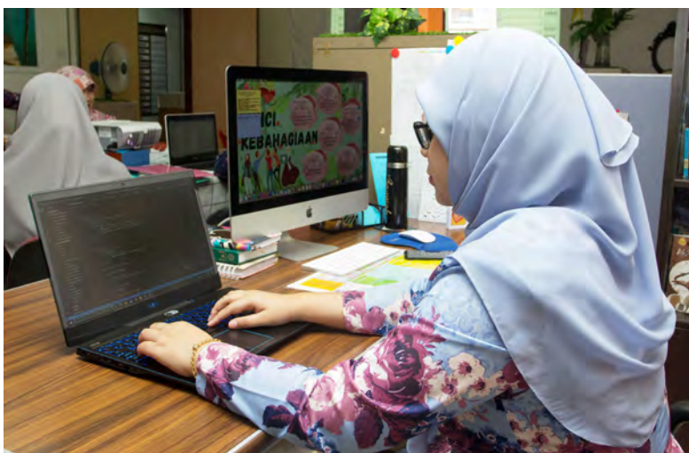
DALAM era digital pada masa ini, dunia pekerjaan dan pembelajaran sentiasa berubah dengan kemunculan teknologi, proses dan alat baharu.

"Dengan adanya digital yang lebih moden ini diharap agar kita menggunakannya lebih berhemah agar tidak mudah terpedaya dari segi kebaikan mahupun keburukan menggunakan AI," ujarnya lagi.