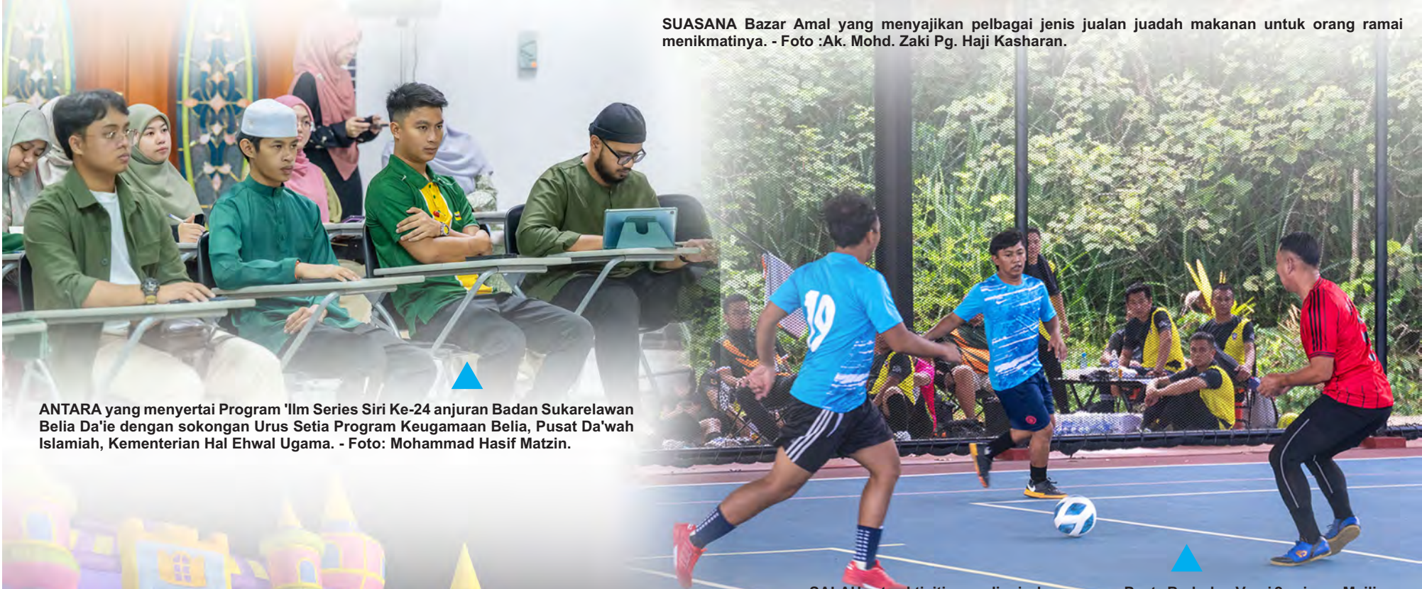
ANTARA yang menyertai Program 'Ilm Series Siri Ke-24 anjuran Badan Sukarelawan Belia Da'ie dengan sokongan Urus Setia Program Keagamaan Belia, Pusat Da'wah Islamiah, Kementerian Hal Ehwal Ugama.