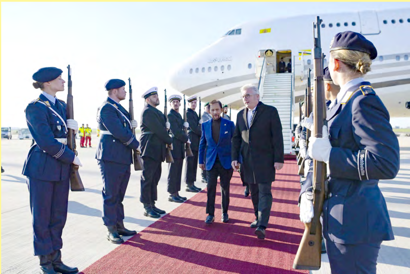
KEBAWAH Duli Yang Maha Mulia Paduka Seri Baginda Sultan Haji Hassanal Bolkiah Mu'izzaddin Waddaulah ibni Al-Marhum Sultan Haji Omar 'Ali Saifuddien Sa'adul Khairi Waddien, Sultan dan Yang Di-Pertuan Negara Brunei Darussalam berangkat tiba di Berlin bagi mengadakan Keberangkatan Rasmi ke Republik Persekutuan Jerman. (Lihat muka 3)