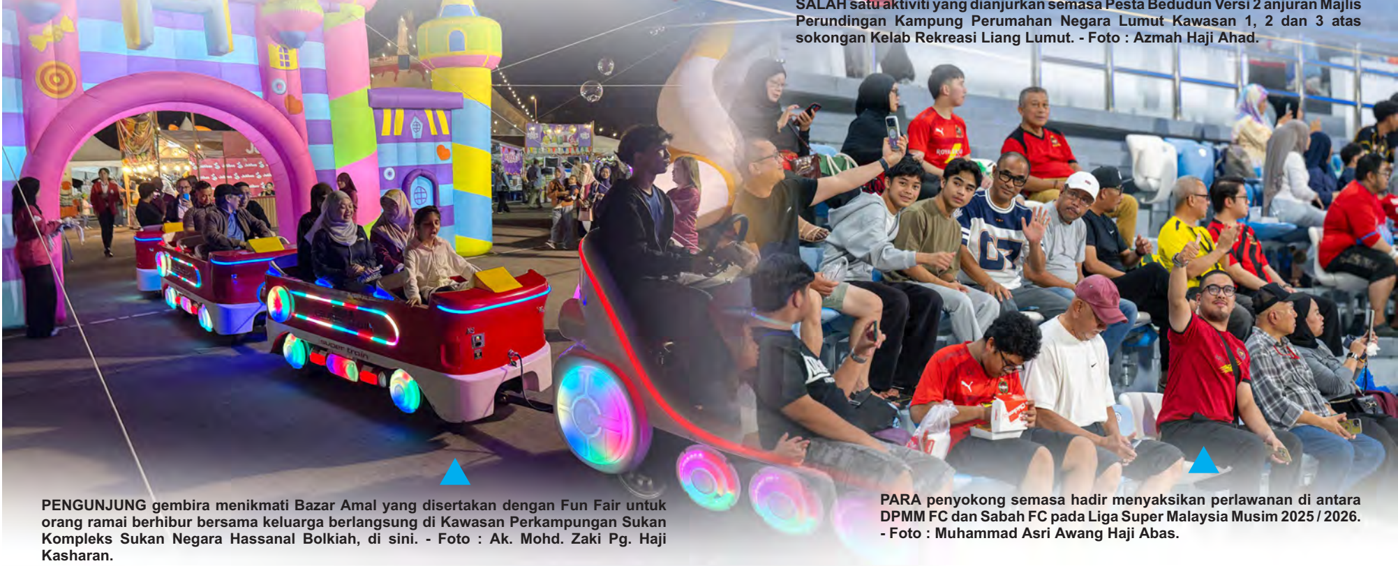
PENGUNJUNG gembira menikmati Bazar Amal yang disertakan dengan Fun Fair untuk orang ramai berhibur bersama keluarga berlangsung di Kawasan Perkampungan Sukan Kompleks Sukan Negara Hassanul Bolkiah, di sini.