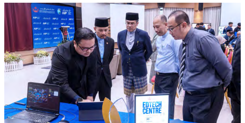
PARA tetamu ketika mengunjungi pameran pada majlis tersebut yang telah mengambil tempat di Dewan Serbaguna, Bangunan Bahirah, Jabatan Audit.

jabatan untuk menyertai AIP melalui projek-projek inovasi yang berkualiti dan berimpak dalam Perkhidmatan Awam di Negara Brunei Darussalam.