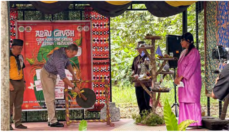
YANG Berhormat Menteri Hal Ehwal Dalam Negeri ketika merasmikan acara Glam Kampung Galore Edisi Ketiga bertemakan 'Aduh Gayoh - Reculture' dihasrat untuk mempromosikan lagi budaya tradisi masyarakat Sang Jati Dusun di negara ini.

Oleh : Hajah Siti Zuraiyah Awang Haji Sulaiman