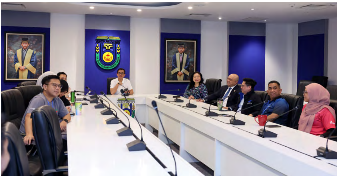
UNIVERSITI Brunei Darussalam dengan kerjasama Space Faculty yang berpangkalan di Republik Singapura, telah mengumumkan kejayaan pelancaran muatan benih pertama Negara Brunei Darussalam ke Stesen Angkasa Antarabangsa, menandakan satu pencapaian bersejarah negara.

TUNGKU LINK , Sabtu, 16 Mei. - Universiti Brunei Darussalam (UBD) dengan kerjasama Space Faculty yang berpangkalan di Republik Singapura, dengan bangganya mengumumkan kejayaan pelancaran muatan benih pertama Negara Brunei Darussalam (NBD) ke Stesen Angkasa Antarabangsa (ISS), sekali gus menandakan satu pencapaian bersejarah negara dalam bidang sains, penyelidikan dan inovasi.