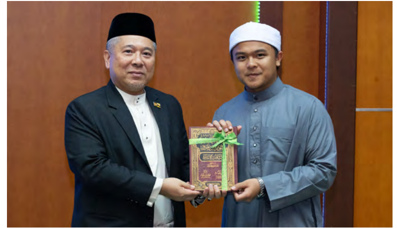
REKTOR Universiti Islam Sultan Sharif Ali selaku Ahli Lembaga Institut Tahfiz Al-Quran Sultan Haji Hassanal Bolkiah hadir selaku tetamu kehormat pada majlis berkenaan.

"Kerana penggunaan AI ini akhirnya memerlukan pertimbangan dan kebijaksanaan individu dalam mengesahkan maklumat yang diperoleh ini adalah sahih atau sebaliknya. Di sinilah pentingnya para pelajar untuk sentiasa berdamping dan merujuk ulul albab atau guru dalam memastikan ketepatan dan kesahihan maklumat yang diperoleh melalui AI atau mana-mana platform teknologi maklumat masa kini," tegas Rektor UNISSA lagi.