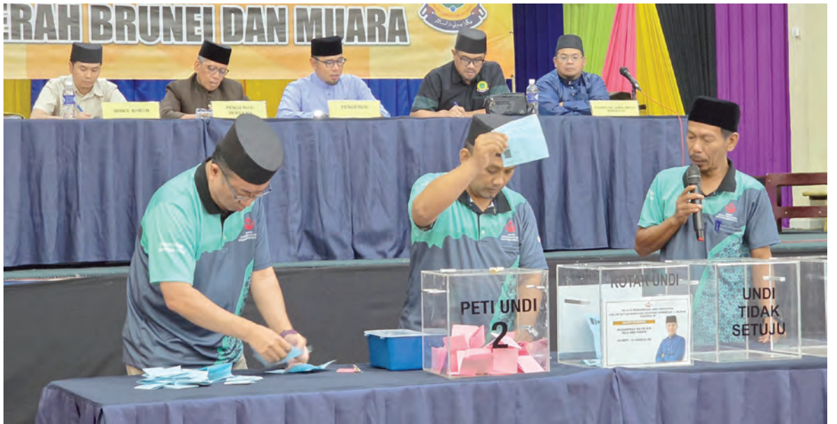
Oleh : Saerah Haji Abdul Ghani

KAMPUNG KIARONG , Ahad, 17 Mei. - Majlis Pengundian dan Pemilihan Calon Ketua Kampung Kiarong Kawasan 1, Mukim Gadong 'B' diadakan pagi tadi bertempat di Dewan Sekolah Rendah Datu Ratna Haji Muhammad Jaafar, Kampung Kiarong dengan menggunakan kaedah kertas undi. Manakala pengundian menggunakan aplikasi mudah alih e-Undi PMKK telah pun bermula pada 12 Mei yang lalu. Hadir selaku tetamu kehormat ialah Pemangku Pegawai Daerah