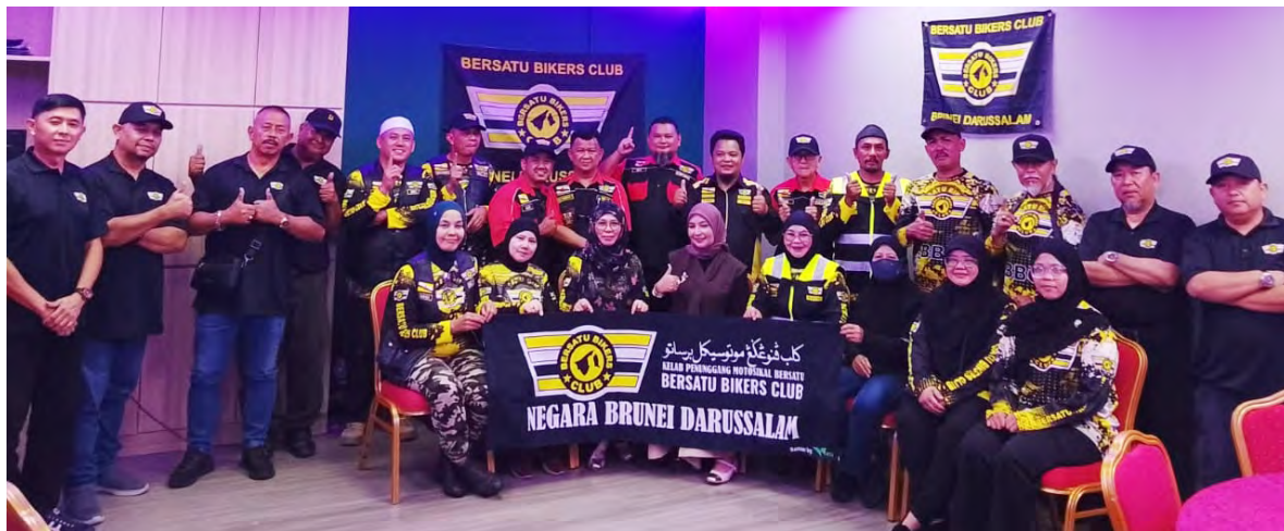
KELAB Penunggang Motosikal Bersatu Negara Brunei Darussalam (BBC) semasa mengadakan Majlis Membaca Doa Selamat bagi ahli kelab yang menyertai acara Borneo Island International Big Bike Festival (BIIBBF) di Kuching, Sarawak (atas dan kiri).

BANDAR SERI BEGAWAN, Sabtu, 16 Mei. - Kelab Penunggang Motosikal Bersatu Negara Brunei Darussalam (BBC) telah mengadakan Majlis Membaca Doa Selamat bagi ahli kelab yang menyertai acara Borneo Island International Big Bike Festival (BIIBBF) di Kuching, Sarawak pada 22 Mei hingga 24 Mei 2026.