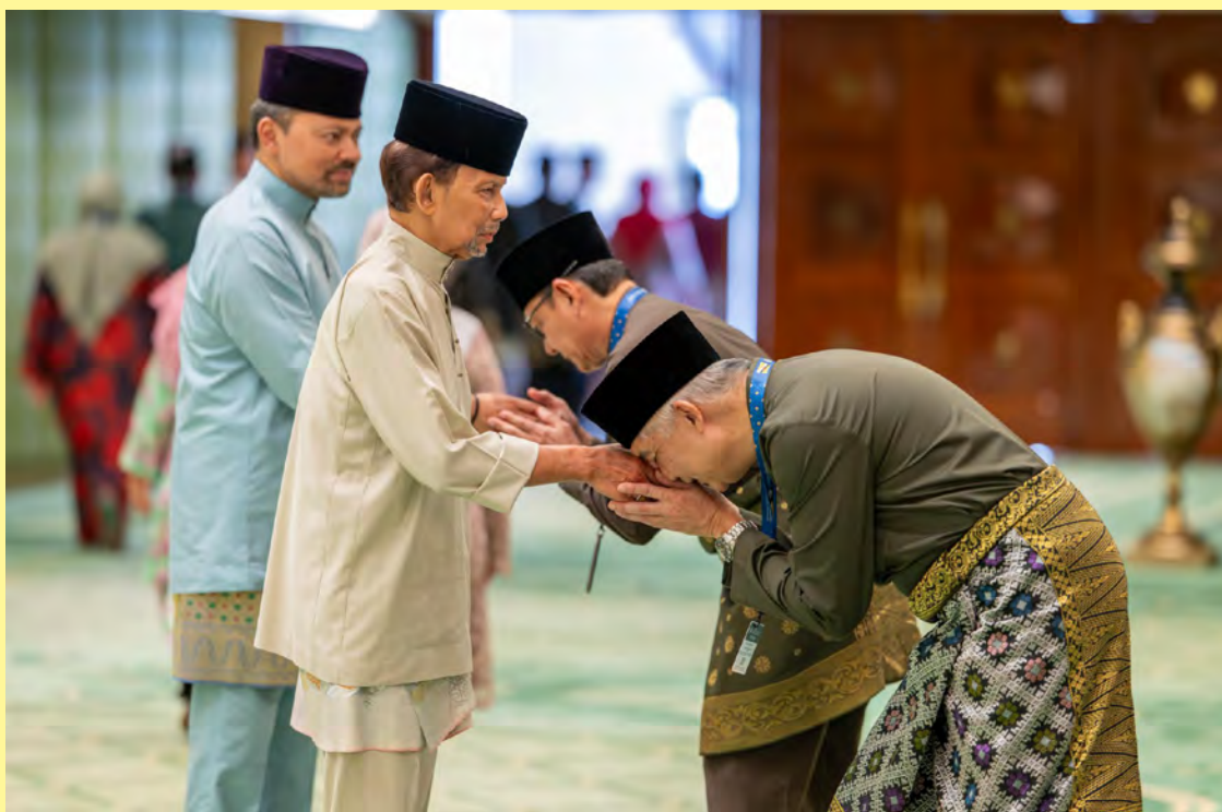
KEBAWAH Duli Yang Maha Mulia Paduka Seri Baginda Sultan Haji Hassanal Bolkiah Mu'izzaddin Waddaulah, Sultan dan Yang Di-Pertuan Negara Brunei Darussalam dan paduka anakanda baginda berkenan menerima junjung ziarah pada majlis berkenaan.