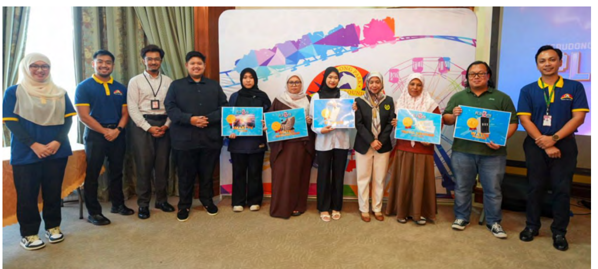
MAJLIS Penyampaian Hadiah untuk Play 2 Win Grand Draw yang diadakan di Jerudong Park (atas dan atas kiri).