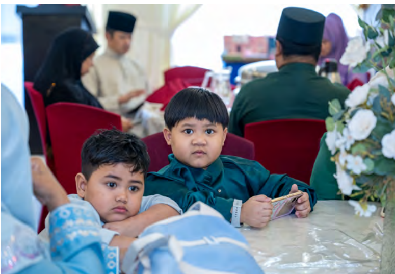
ANTARA yang hadir pada majlis berkenaan (atas dan kanan).

Acara berkenaan dianjurkan oleh Kumpulan Emcee dengan kerjasama SMFZ Event Planner & Management, Kencana Laila Entertainment dan Projek Amal Impian Cahaya Iman.