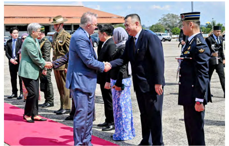
PERDANA Menteri Australia semasa bersalaman sebelum meninggalkan Negara Brunei Darussalam.

Hubungan rapat Negara Brunei Darussalam dan Australia telah lama terjalin sejak bulan Mei 1984, di mana kedua-dua buah negara bekerjasama secara meluas dalam bidang perdagangan dan pelaburan, tenaga, akuakultur dan pertanian serta pertahanan.