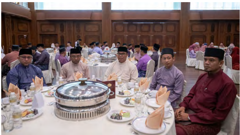
SEBAHAGIAN daripada para hadirin pada majlis tersebut (kiri).

Adalah diharapkan agar penerbitan tafsir ini akan menjadi rujukan penting dalam membantu umat Islam memahami, menghayati serta mengamalkan isi Al-Quran dalam kehidupan seharian, seterusnya memperkukuhkan akidah dan jati diri serta kesejahteraan umat Islam di Negara Brunei Darussalam.