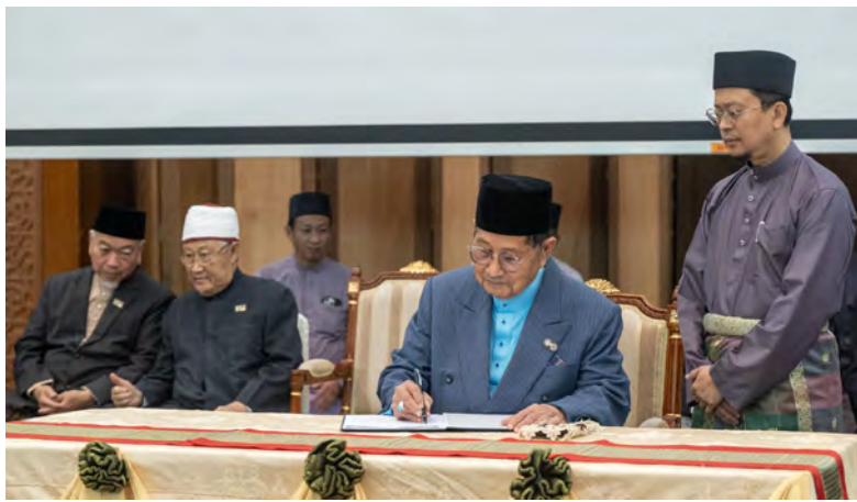
YANG Berhormat Menteri Hal Ehwal Ugama hadir selaku tetamu kehormat pada Majlis Penandatanganan dan Doa Kesyukuran Projek Mushaf Brunei Darussalam dan Tafsirannya bertempat di Dewan Sutra, Hotel Antarabangsa Rizqun, Gadong (atas dan bawah kanan).

Oleh : Haniza Abdul Latif