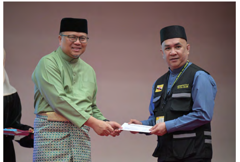
YANG Berhormat Menteri Kesihatan hadir selaku tetamu kehormat pada Majlis Doa Selamat bagi rombongan Bi'thah perubatan haji dan bakal jemaah haji Kementerian Kesihatan bagi Tahun 1447 Hijrah / 2026 Masihi.