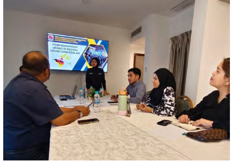
UNIT Siasatan Pemerdagangan Manusia dari Jabatan Siasatan Jenayah, Pasukan Polis Diraja Brunei semasa menganjurkan taklimat jerayawara mengenai jenayah pemerdagangan orang kepada petugas barisan hadapan.

Kerjasama erat daripada kakitangan hotel adalah amat penting dalam memainkan peranan untuk bersama-sama memerangi jenayah pemerdagangan manusia dan membantu PPDB dalam usaha berkenaan.