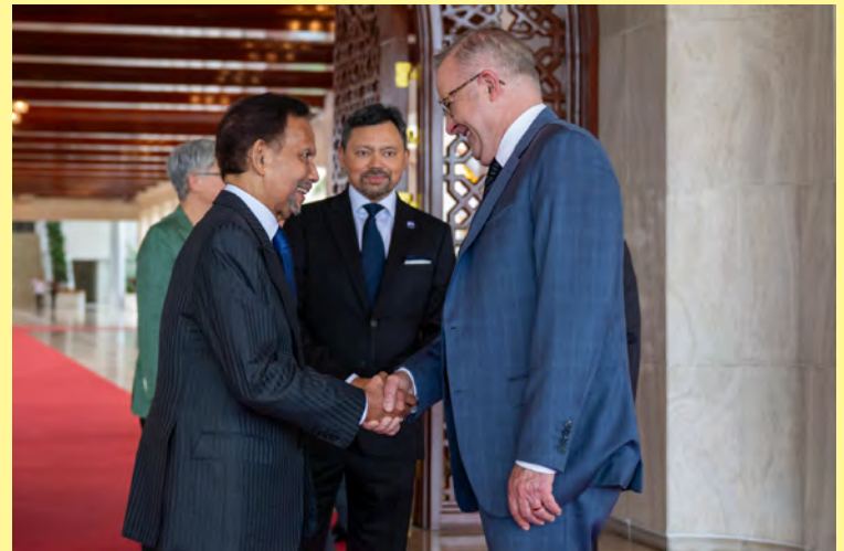
KEBAWAH Duli Yang Maha Mulia Paduka Seri Baginda Sultan Haji Hassanal Bolkiah Mu'izzaddin Waddaulah, Sultan dan Yang Di-Pertuan Negara Brunei Darussalam berkenan bersalaman dengan Perdana Menteri Australia (atas), manakala gambar kiri, Kebawah Duli Yang Maha Mulia dan kerabat diraja berkenan melambai mesra kepada Perdana Menteri Australia setelah selesai menghadiri majlis berkenaan. Sementara gambar bawah, antara yang hadir pada majlis tersebut.

Sebagai Rakan Dialog ASEAN, perkongsian strategik antara Australia dan ASEAN juga menyediakan asas yang kukuh untuk mengembangkan lagi hubungan dua hala tersebut.