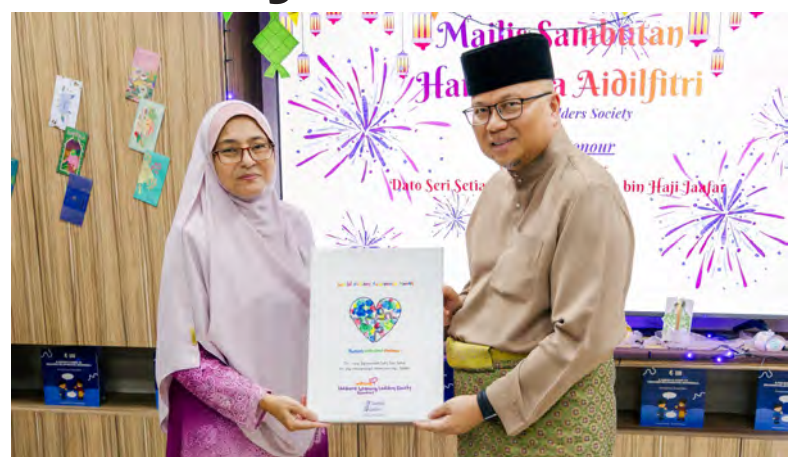
YANG Berhormat Menteri Kesihatan selaku Pengerusi Lembaga Pengarah dan Pengarah Eksekutif JPJC hadir selaku tetamu kehormat pada acara Sambutan Hari Raya yang dianjurkan oleh Learning Ladders Society.

JPJC memaklumkan bahawa inisiatif seperti ini merupakan sebahagian daripada komitmen berterusan mereka dalam menyokong penjagaan kesihatan inklusif dan kesejahteraan