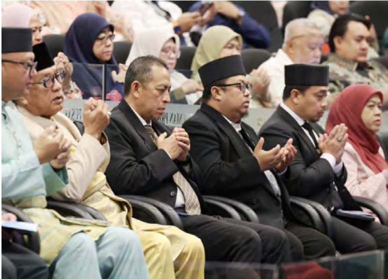
Siaran Akhbar dan Foto : Pusat Sejarah Brunei