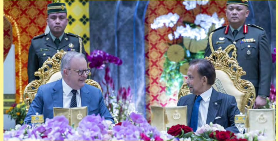
KEBAWAH Duli Yang Maha Mulia Paduka Seri Baginda Sultan Haji Hassanal Bolkiah Mu'izzaddin Waddaulah ibni Al-Marhum Sultan Haji Omar 'Ali Saifuddien Sa'adul Khairi Waddien, Sultan dan Yang Di-Pertuan Negara Brunei Darussalam berkenan berangkat bersama Perdana Menteri Australia, The Honourable Anthony Albanese MP bagi menghadiri Majlis Santap Tengah Hari. Berangkat sama ialah kerabat diraja (atas, kiri dan bawah).

BANDAR SERI BEGAWAN, Rabu, 15 April. – Kebawah Duli Yang Maha Mulia Paduka Seri Baginda Sultan Haji Hassanal Bolkiah Mu'izzaddin Waddaulah ibni Al-Marhum Sultan Haji Omar 'Ali Saifuddien Sa'adul Khairi Waddien, Sultan dan Yang Di-Pertuan Negara Brunei Darussalam berkenan berangkat bersama Perdana Menteri Australia, The Honourable Anthony Albanese MP bagi menghadiri Majlis Santap Tengah Hari yang diadakan bagi meraikan Lawatan Kerja Perdana Menteri Australia ke Negara Brunei Darussalam (NBD) selama dua hari pada 14 hingga 15 April 2026.