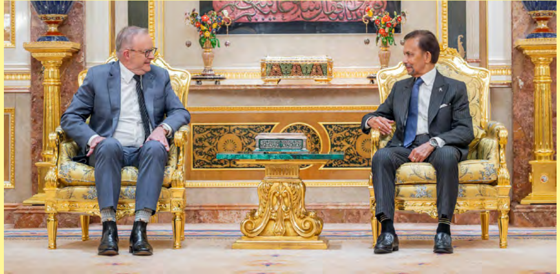
KEBAWAH Duli Yang Maha Mulia Paduka Seri Baginda Sultan Haji Hassanal Bolkiah Mu'izzaddin Waddaulah ibni Al-Marhum Sultan Haji Omar 'Ali Saifuddien Sa'adul Khairi Waddien, Sultan dan Yang Di-Pertuan Negara Brunei Darussalam berkenan menerima mengadap Perdana Menteri Australia, The Honourable Anthony Albanese MP (atas dan kiri).