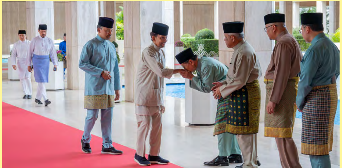
KEBAWAH Duli Yang Maha Mulia Paduka Seri Baginda Sultan Haji Hassanal Bolkiah Mu'izzaddin Waddaulah ibni Al-Marhum Sultan Haji Omar 'Ali Saifuddin Sa'adul Khairi Waddien, Sultan dan Yang Di-Pertuan Negara Brunei Darussalam dan paduka anakanda baginda berkenan berangkat ke Majlis Mengadap dan Junjung Ziarah (atas dan kiri).