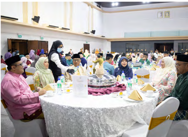
Siaran Akhbar dan Foto : Jabatan Pembangunan Masyarakat