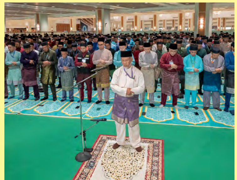
SEBELUM Majlis Mengadap dan Junjung Ziarah, para bakal jemaah haji negara menunaikan Sembahyang Fardu Zuhur Berjemaah dan Sembahyang Sunat Hajat Berjemaah (atas dan bawah kiri), manakala gambar bawah, para bakal jemaah haji semasa membuat pendaftaran.