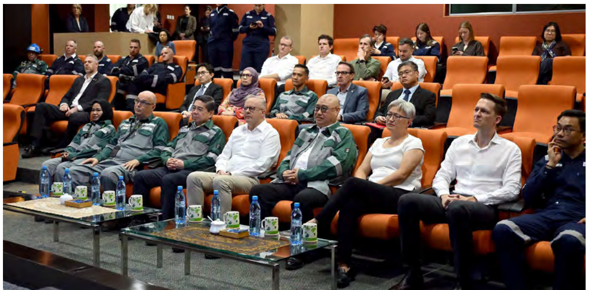
PERDANA Menteri Australia, The Honourable Anthony Albanese MP mengadakan lawatan ke loji BFI yang terletak di Taman Perindustrian Sungai Liang (SPARK) di Daerah Belait (atas dan kiri).

Lawatan berkenaan juga memberi peluang untuk meninjau papaian keselamatan BFI yang