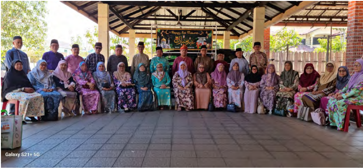
Galaxy S21+ 5G