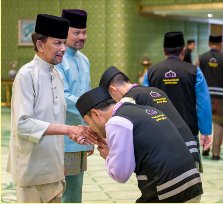
KEBAWAH Duli Yang Maha Mulia Paduka Seri Baginda Sultan dan Yang Di-Pertuan Negara Brunei Darussalam dan paduka anakanda baginda berkenan menerima mengadap dan junjung ziarah daripada bakal jemaah haji lelaki dan bakal jemaah haji perempuan (atas, kanan dan bawah).