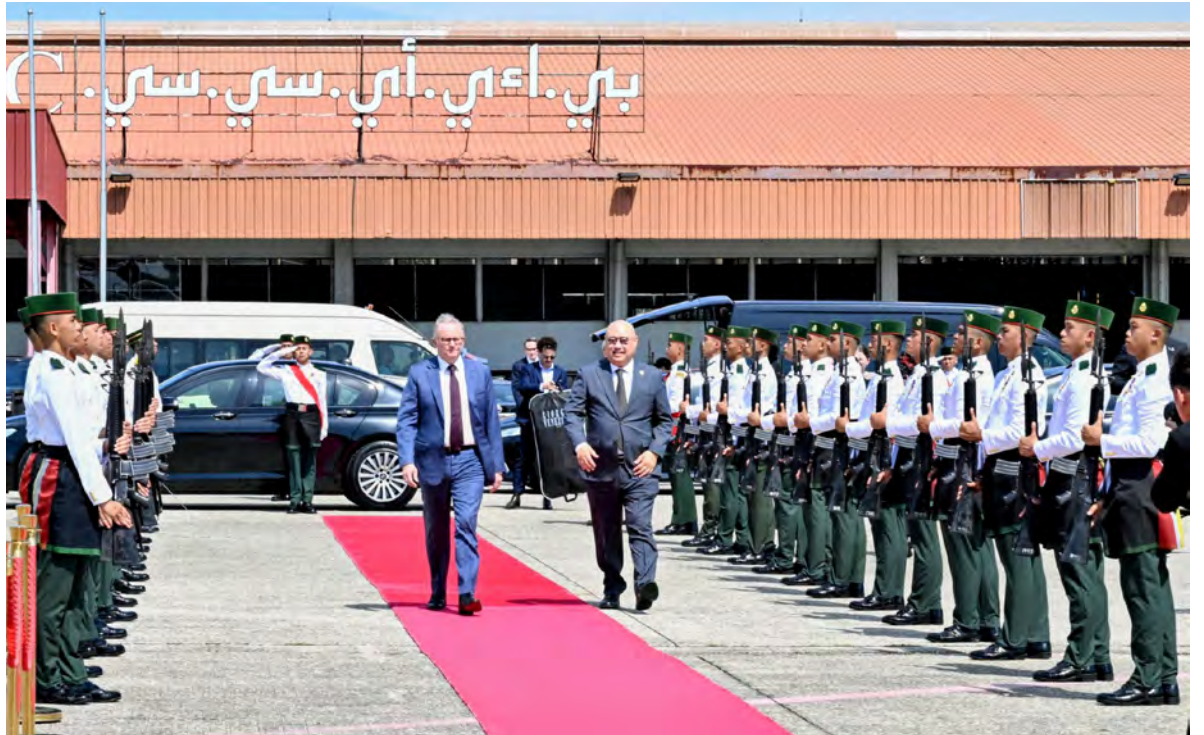
diadakan bagi meraikan Lawatan Kerja The Honourable Perdana Menteri Australia.

Hubungan rapat Negara Brunei Darussalam dan Australia telah lama terjalin sejak bulan Mei 1984, di mana kedua-dua buah negara bekerjasama secara meluas dalam bidang perdagangan dan pelaburan, tenaga, akuakultur dan pertanian serta pertahanan.