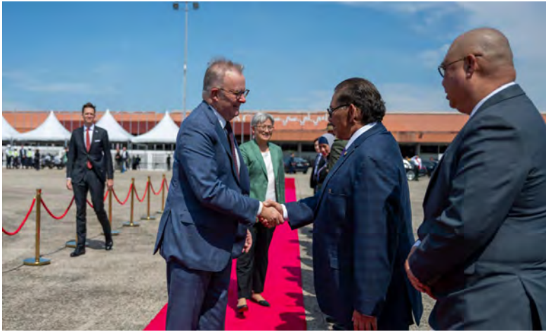
PERDANA Menteri Australia, The Honourable Anthony Albanese MP serta rombongan berlepas meninggalkan negara setelah menamatkan Lawatan Kerja selama dua hari (atas dan kanan).