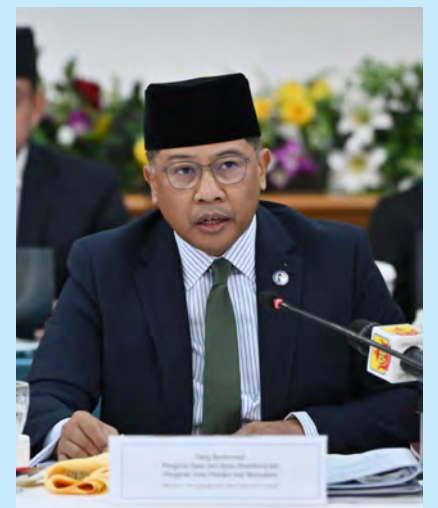
MENTERI Pengangkutan dan Infokomunikasi, Yang Berhormat Pengiran Dato Seri Setia Shamhary bin Pengiran Dato Paduka Haji Mustapha semasa berucap pada Sesi Perjumpaan Muhibah Kementerian Pengangkutan dan Infokomunikasi bersama Yang Berhormat Ahli-ahli Majlis Mesyuarat Negara bagi tahun 2026 di Dewan Amar Pahlawan Kementerian Pengangkutan dan Infokomunikasi Pada 29 Januari 2026

Waspada.bn iaitu sebuah platform semakan fakta bagi kesahihan berita dan maklumat yang diterima melalui media sosial telah dilancarkan. Pusat Anti Scam (Anti