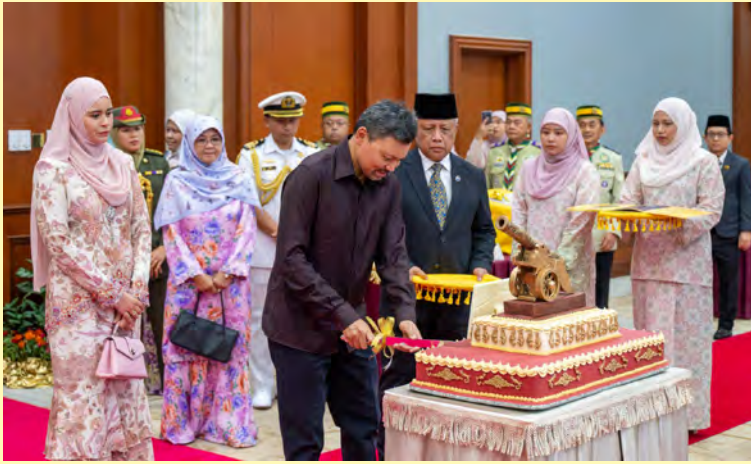
DULI Yang Teramat Mulia Paduka Seri Pengiran Muda Mahkota Pengiran Muda Haji Al-Muhtadee Billah ibni Kebawah Duli Yang Maha Mulia Paduka Seri Baginda Sultan Haji Hassanal Bolkiah Mu'izzaddin Waddaulah, Menteri Kanan di Jabatan Perdana Menteri (JPM) dan Yang Teramat Mulia Paduka Seri Pengiran Anak Isteri Pengiran Anak Sarah binti Pengiran Haji Salleh Ab. Rahaman berkenan berangkat ke Majlis Santap anjuran JPM. Berangkat sama ialah kerabat diraja (atas dan kanan).