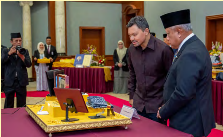
DULI Yang Teramat Mulia Paduka Seri Pengiran Muda Mahkota Pengiran Muda Haji Al-Muhtadee Billah berkenan menerima pesambah (atas). Manakala gambar bawah, Duli Yang Teramat Mulia Paduka Seri Pengiran Muda Mahkota dan Yang Teramat Mulia Paduka Seri Pengiran Anak Isteri Pengiran Anak Sarah serta kerabat diraja dijunjung bergambar ramai.