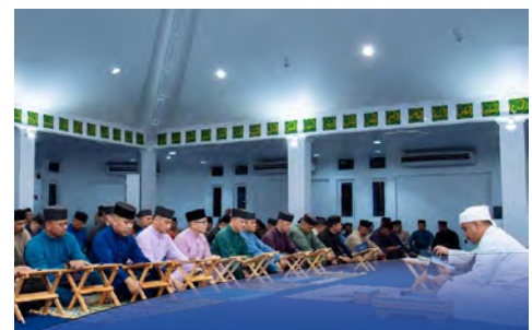
DOA Kesyukuran, Solat Hajat sempena Puja Usia DYTM