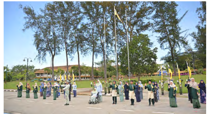
SEMASA upacara lafaz ikrar dijalankan.

Majlis diakhiri dengan bacaan doa memohon keselamatan dan kesejahteraan serta sesi bergambar ramai sebagai tanda kenangan dan simbol perpaduan warga universiti dalam meraikan Ulang Tahun HK NBD yang Ke-42.