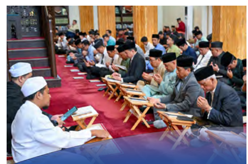
JPM adakan Majlis Doa Kesyukuran