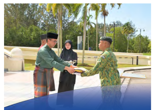
MENYEMARAKKAN semangat perpaduan, kenegaraan sempena Hari Kebangsaan