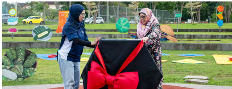
TIMBALAN Setiausaha Tetap (Kebudayaan), Kementerian Kebudayaan, Belia dan Sukan, hadir selaku tetamu kehormat bagi menyempurnakan majlis perasmian berkenaan.

Diharap projek ini akan terus menjadi platform penyatuan komuniti dalam sama-sama menyemarakkan Sambutan Ulang Tahun HK NBD.