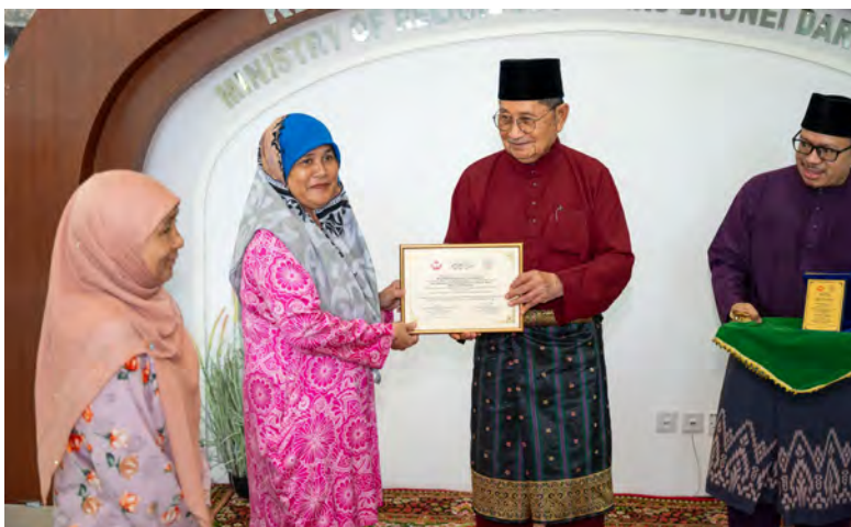
YANG Berhormat Menteri Hal Ehwal Ugama selaku Yang Dipertua MUIB hadir menyempurnakan Majlis Penyerahan Sijil Kesiapan Rumah dan Plak Rumah kepada salah seorang penerima (atas). Sementara gambar kanan, Yang Berhormat Menteri Hal Ehwal Ugama semasa sesi bergambar ramai setelah mengadakan lawatan pada salah sebuah rumah tersebut.

Kempen Kebersihan Pantai Program Penyus seterusnya akan diadakan pada 14 Mac 2026. Orang ramai adalah digalakkan untuk mengikuti @LAUTBrunei di Instagram dan Facebook bagi mendapatkan maklumat terkini serta berpeluang menjadi sukarelawan.