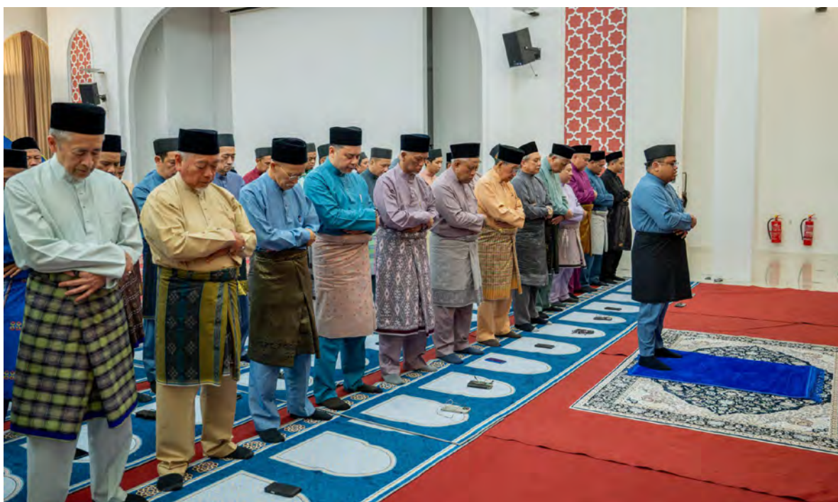
SEKITAR Cerapan Hilal Ramadan 1447H/2026M di salah satu lokasi yang telah ditetapkan (kanan dan bawah).