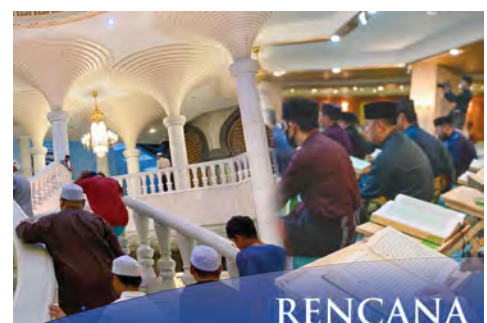
MENJALANI Ramadan dengan kesyukuran