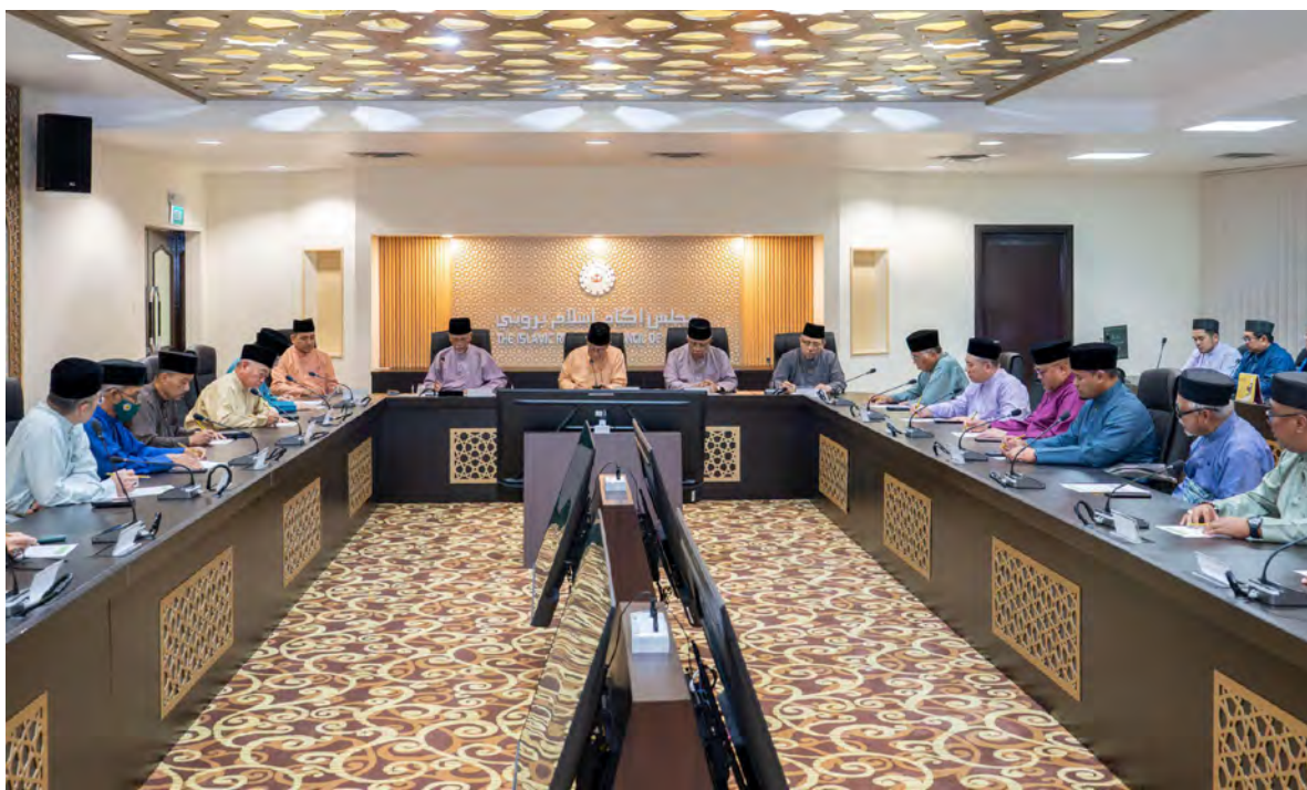
YANG Berhormat Menteri Hal Ehwal Ugama selaku Yang Dipertua Majlis Ugama Islam Brunei (MUIB) hadir di acara keagamaan bagi menunggu hasil merukyah awal bulan Ramadan 1447 Hijrah dan persidangan mengenai hasil merukyah anak bulan Ramadan 1447H. Turut hadir, Yang Berhormat Menteri di JPM dan Menteri Pertahanan II, Yang Berhormat Menteri Pembangunan dan Yang Berhormat Ketua Hakim Syarie (bawah dan atas).