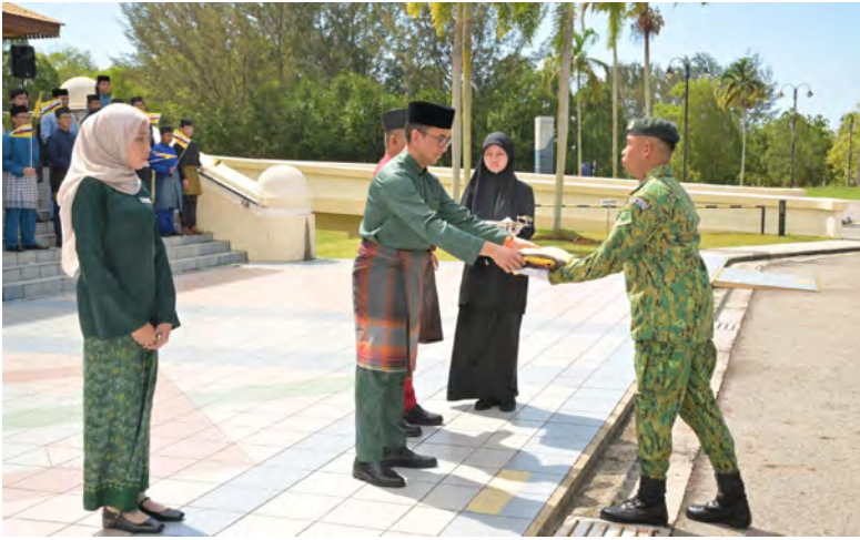
Oleh : Pg. Siti Redzaimi Pg. Haji Ahmad

BANDAR SERI BEGAWAN , Isnin, 16 Februari. - Universiti Brunei Darussalam (UBD) hari ini mengadakan Upacara Menaikkan Bendera sempena Sambutan Ulang Tahun Hari Kebangsaan (HK) Negara Brunei Darussalam (NBD) Negara Brunei Darussalam (NBD) Ke-42, yang berlangsung di hadapan Dewan Canselor, UBD, petang tadi.