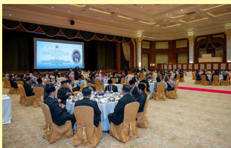
SUASANA pada Majlis Santap yang diadakan di Bangunan JPM (kiri dan kiri sekali).