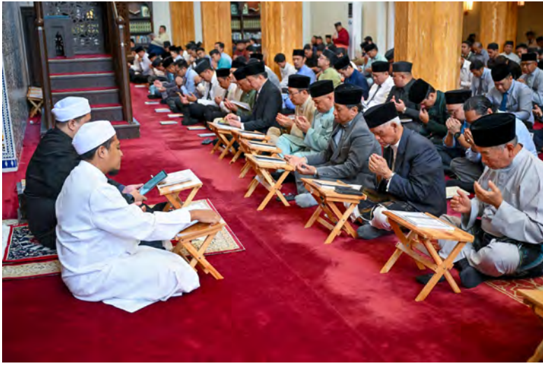
Oleh : Aimi Sani