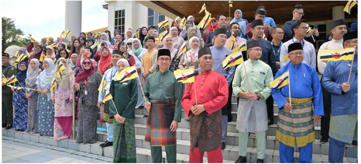
NAIB Canselor Universiti Brunei Darussalam (UBD) hadir selaku tetamu kehormat di Upacara Menaikkan Bendera sempena Sambutan Ulang Tahun Hari Kebangsaan Negara Brunei Darussalam Ke-42, di hadapan Dewan Canselor, UBD (atas dan atas kiri).