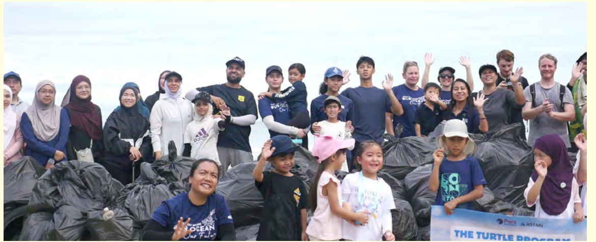
YANG Teramat Mulia Paduka Seri Pengiran Anak Isteri Pengiran Anak Sarah binti Pengiran Haji Salleh Ab. Rahaman berangkat menyertai Kempen Kebersihan Pantai Program Pemuliharaan Penyus LAUT Brunei. Turut berangkat menyertai, anakanda-anakanda Yang Teramat Mulia Paduka Seri Pengiran Anak Isteri Pengiran Anak Sarah, Yang Teramat Mulia Pengiran Anak Muneerah Madhul Bolkihah; Yang Teramat Mulia Pengiran Muda Muhammad Aiman; dan Yang Teramat Mulia Pengiran Anak Faathimah Az-Zahraa' Raihaanul Bolkihah.

LAUT Brunei menggariskan bahawa Program Penyus bukan sekadar melindungi penyus, malah memperkasa masyarakat. Melalui pembersihan komuniti berkala,