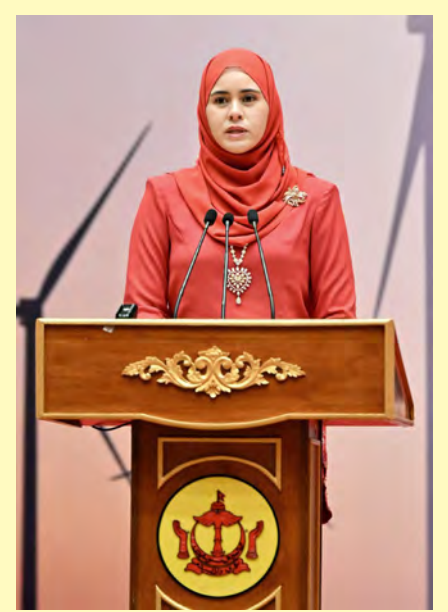
YANG Teramat Mulia Paduka Seri Pengiran Anak Isteri Pengiran Anak Sarah binti Pengiran Haji Salleh Ab. Rahaman berkenan mengurniakan sabda pada Majlis Perasmian Persidangan Isu-isu Global Borneo Sekolah Antarabangsa Brunei (ISB BGIC) Ke-21 Tahun 2026 pada Sabtu, 11 April 2026 di Pusat Persidangan Antarabangsa, Berakas.

Biarlah perbincangan awda dipandu oleh akal dan keprihatinan sebenar terhadap komuniti global kita. Sehubungan itu,