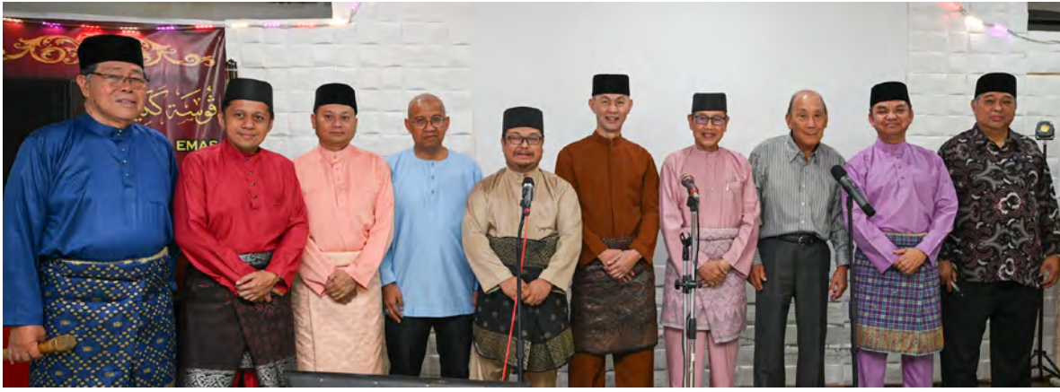
PEMANGKU Pegawai Daerah Tutong hadir selaku tetamu kehormat pada Majlis Warna Warni Berhari Raya 1447 Hijrah/2026 Masihi yang telah berlangsung di Pusat Kegiatan Warga Emas Daerah Tutong (atas dan kanan), manakala gambar bawah kanan, antara hadirin pada majlis berkenaan.

TUTONG , Selasa, 14 April. - Dalam usaha untuk mengukuhkan semangat silaturahmi dalam kalangan warga emas serta masyarakat setempat, Pusat Kegiatan Warga Emas (PKWE) Daerah Tutong pagi tadi menganjurkan Majlis Warna Warni Berhari Raya 1447 Hijrah/2026 Masihi, yang berlangsung di pusat berkenaan, di sini.