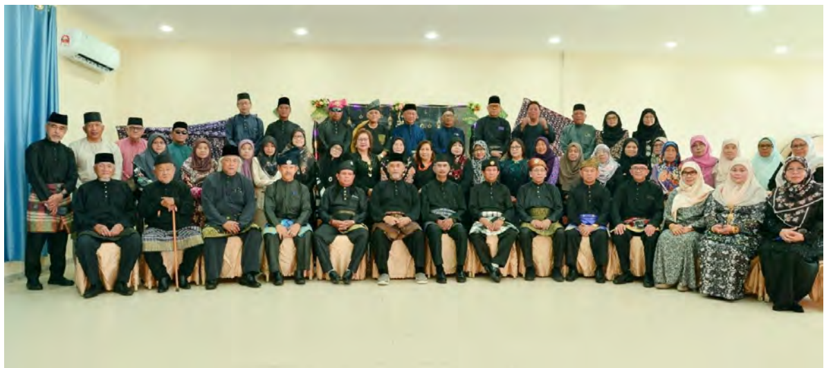
ALUMNI Pengambilan Pertama Aliran Inggeris Sekolah Menengah Sultan Jamalul Alam 1975 baru-baru ini mengadakan Majlis Ramah Mesra Hari Raya Aidilfitri buat kali kelapan.

Majlis juga dimeriahkan lagi dengan sesi pertukaran hadiah dan cenderamata di antara bekas pelajar-pelajar SM SMJA 75'.