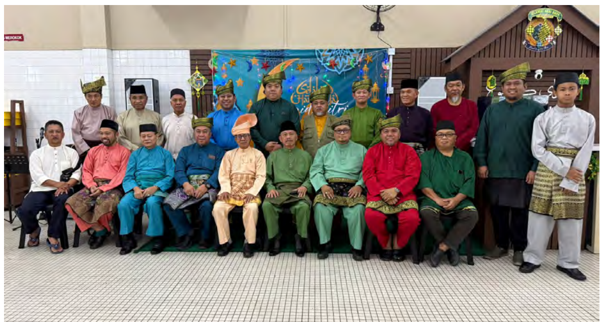
MAJLIS Perundingan Kampung (MPK) Kasat menganjurkan Sambutan Hari Raya Aidilfitri yang berlangsung meriah di Kantin Dewan Muhibbah Kedai Kampung MPK Kasat yang turut dihadiri oleh Yang Berhormat Ahli Majlis Mesyuarat Negara, Penghulu Mukim Lumapas.

Menurut wakil penganjur, penganjuran majlis seumpama ini diharapkan dapat terus menyemarakkan semangat bergotong-royong serta nilai kekeluargaan dalam kalangan masyarakat Kampung Kasat, selaras dengan hasrat untuk membentuk komuniti yang harmoni, bersatu padu dan saling bekerjasama.