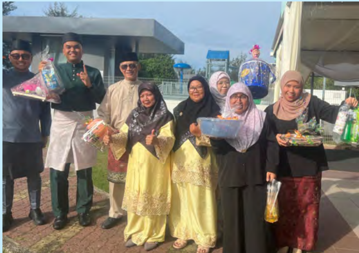
ANTARA yang hadir pada Majlis Ramah Mesra di Restoran Serikandi Liang Lumut Recreational Club.

Siaran Akhbar dan Foto : Pusat Kegiatan Warga Emas Daerah Belait