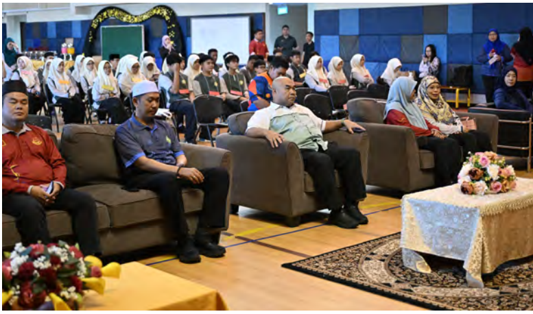
SEKITAR Program Eksplorasi Melayu Islam Beraja 3.0 yang diadakan di Sekolah Menengah Yayasan Sultan Haji Hassanal Bolkiah (atas, kanan dan bawah).

Oleh : Aimi Sani