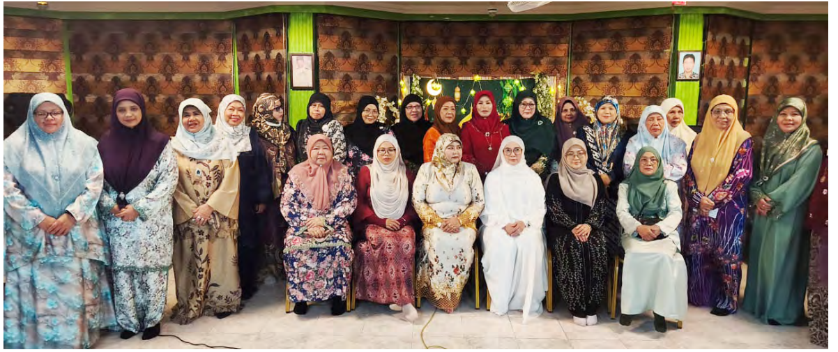
PERSATUAN Gerakan Ibu Tunggal semasa mengendalikan Majlis Ramah Mesra Aidilfitri demi berkongsi detik kebahagiaan Hari Raya bersama para ibu tunggal dan juga anak-anak yatim (atas dan kiri).

Oleh : Wan Mohamad Sahran Wan Ahmadi