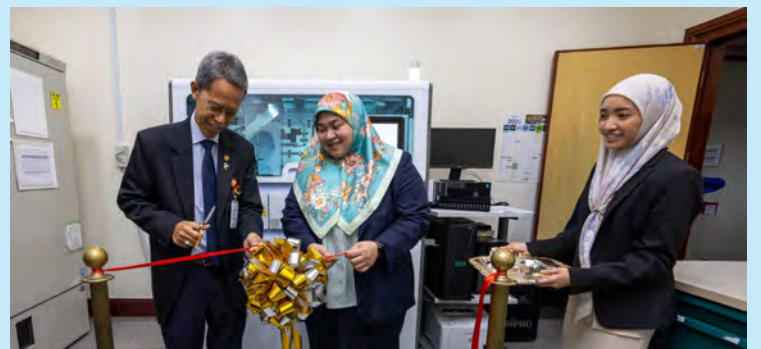
PELANCARAN rasmi Ujian Penguatan Asid Nukleik menandakan satu peristiwa penting dalam memperkukuh keupayaan diagnostik makmal serta meningkatkan standard keselamatan darah di Negara Brunei Darussalam.