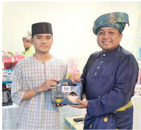
SEKITAR Majlis Sambutan Ramah Mesra Silaturahmi Aidilfitri Majlis Perundingan Mukim Mentiri Tahun 1447 Hijrah / 2026 Masihi (atas dan bawah).

namun tetap dimeriahkan oleh umat Islam di negara ini dengan mengadakan Majlis Rumah Terbuka.