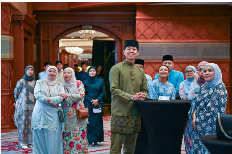
YANG Berhormat Menteri di Jabatan Perdana Menteri dan Menteri Pertahanan II, selaku menteri yang bertanggungjawab ke atas SHENA hadir pada majlis berkenaan (kanan), sementara gambar atas, sebahagian daripada para hadirin pada majlis tersebut.

Oleh : Khartini Hamir