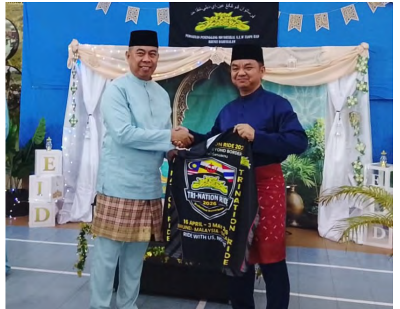
PEMANGKU Pegawai Daerah Tutong menyampaikan baju rasmi NNLR Tri-Nation Ride 2026 kepada para peserta (atas), manakala gambar atas kiri, antara yang hadir pada majlis berkenaan.

Seterusnya, majlis dimeriahkan lagi dengan sesi ramah mesra dan persembahan daripada Ahli-ahli NNLR dan kemudian diteruskan dengan penyampaian baju rasmi NNLR Tri-Nation Ride 2026 kepada para peserta yang disempurnakan oleh tetamu