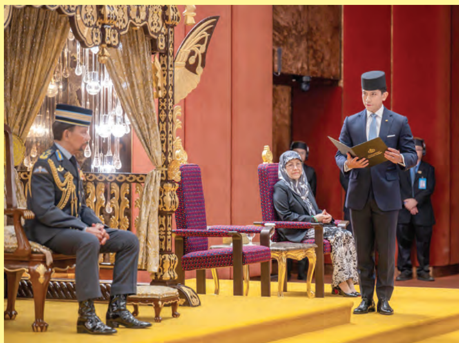
KEBAWAH Duli Yang Maha Mulia Paduka Seri Baginda Sultan Haji Hassanal Bolkiah Mu'izzaddin Waddaulah, Sultan dan Yang Di-Pertuan Negara Brunei Darussalam ketika mendengarkan paduka-paduka anakanda baginda, Duli Yang Teramat Mulia Paduka Seri Pengiran Muda 'Abdul Malik, Menteri di JPM dan Duli Yang Teramat Mulia Paduka Seri Pengiran Muda 'Abdul Mateen, Menteri Hal Ehwal Luar Negeri mengangkat sumpah (kiri dan kanan).