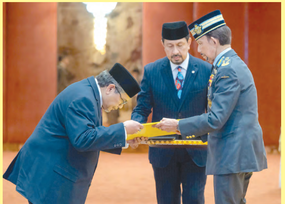
KEBAWAH DYMM berkenan mengurniakan Surat Lantikan kepada Menteri Kewangan II, Yang Berhormat Dato Seri Setia Dr. Awang Haji Mohd. Amin Liew bin Abdullah dan Menteri Hal Ehwal Luar Negeri II, Yang Berhormat Dato Seri Setia Awang Haji Erywan bin Pehin Datu Pekerma Jaya Haji Mohd. Yusof (kiri dan kanan).