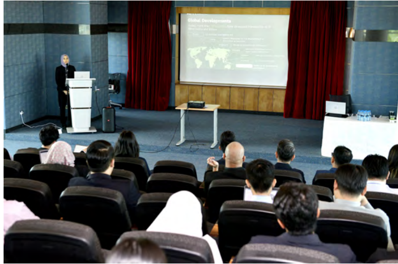
PERSIDANGAN Dialog Setengah Hari bertajuk 'Turning Data into Decision' di bawah projek induk yang lebih luas, iaitu 'Beyond the Screen : Strengthening and Safeguarding Brunei's Digital Future'.

baru-baru ini mengadakan Persidangan Dialog Setengah Hari bertajuk 'Turning Data into Decision' di bawah projek induk yang lebih luas, iaitu 'Beyond the