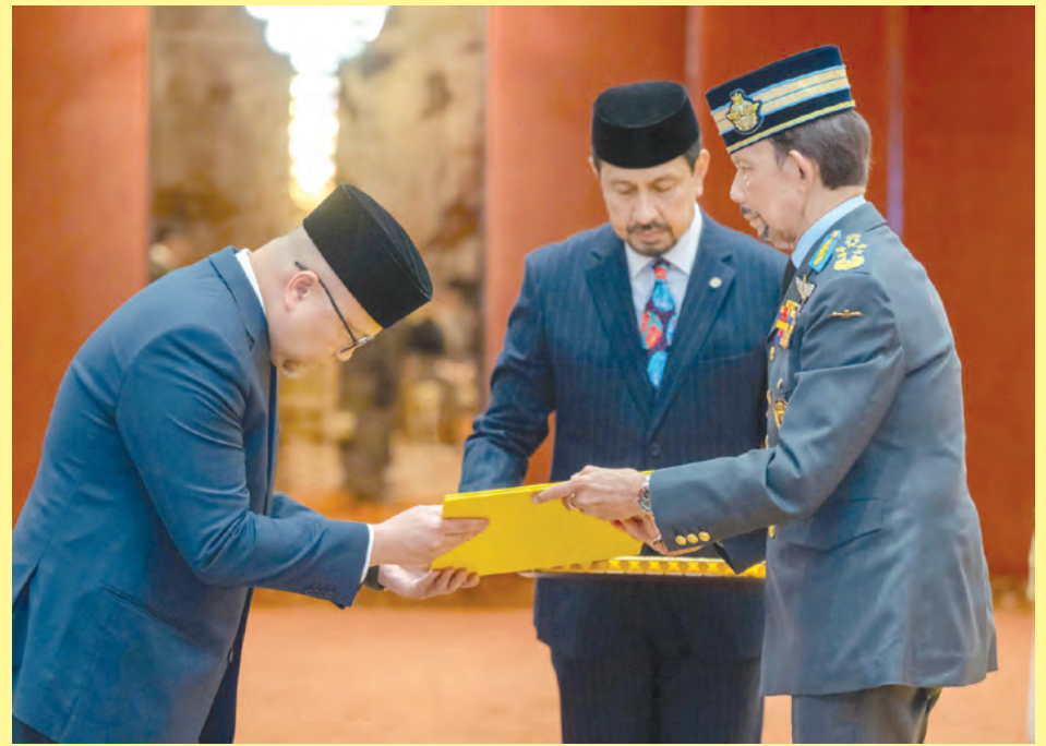
KEBAWAH DYMM berkenan mengurniakan Surat Lantikan kepada Menteri Hal Ehwal Ugama, Yang Berhormat Pengiran Dato Seri Paduka Haji Mohammad Tashim bin Pengiran Haji Hassan dan Menteri Kesihatan, Yang Berhormat Dato Seri Setia Dr. Awang Haji Mohammad Isham bin Haji Jaafar (kiri dan kanan).