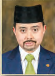
Duli Yang Teramat Mulia Paduka Seri Pengiran Muda 'Abdul Malik ibni Kebawah Duli Yang Maha Mulia Paduka Seri Baginda Sultan Haji Hassanal Bolkiah Mu'izzaddin Waddaulah, MENTERI DI JABATAN PERDANA MENTERI