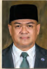
Yang Berhormat Dato Seri Paduka Awang Haji Mohamad Azmi bin Haji Mohd. Hanifah, MENTERI DI JABATAN PERDANA MENTERI (TENAGA, HULUAN DAN HILIRAN)