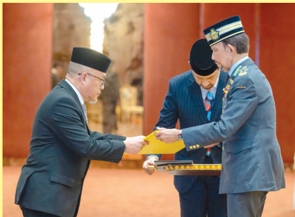
KEBAWAH Duli Yang Maha Mulia berkenan mengurniakan Surat Lantikan kepada Menteri Penyelaras bagi Keselamatan Negara dan Menteri di JPM dan Menteri Pertahanan II, Yang Berhormat Pehin Datu Lailaraja Mejar Jeneral (B) Dato Paduka Seri Awang Haji Halbi bin Haji Mohd. Yussof dan Menteri Penyelaras bagi Dasar-Dasar Ekonomi dan Menteri Ekonomi, Perdagangan dan Industri, Yang Berhormat Dato Seri Setia Dr. Awang Haji Abdul Manaf bin Haji Metussin (kiri dan kanan).