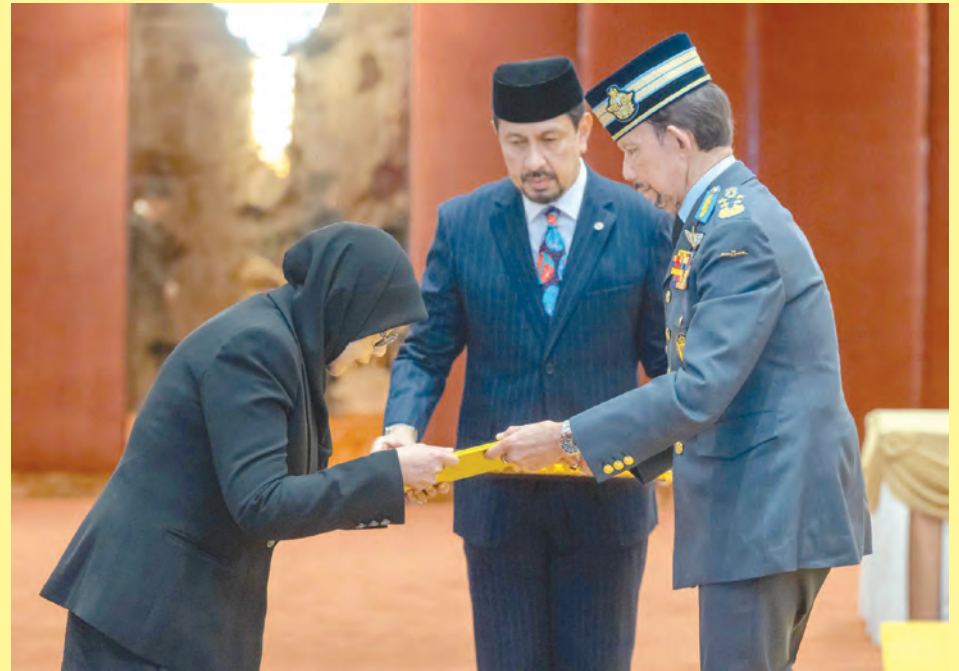
KEBAWAH DYMM berkenan mengurniakan Surat Lantikan kepada Menteri Pembangunan, Yang Berhormat Dato Seri Setia Awang Haji Muhammad Juanda bin Haji Abdul Rashid dan Menteri Pendidikan, Yang Berhormat Datin Seri Setia Dr. Hajah Romaizah binti Haji Md. Salleh (kiri dan kanan).