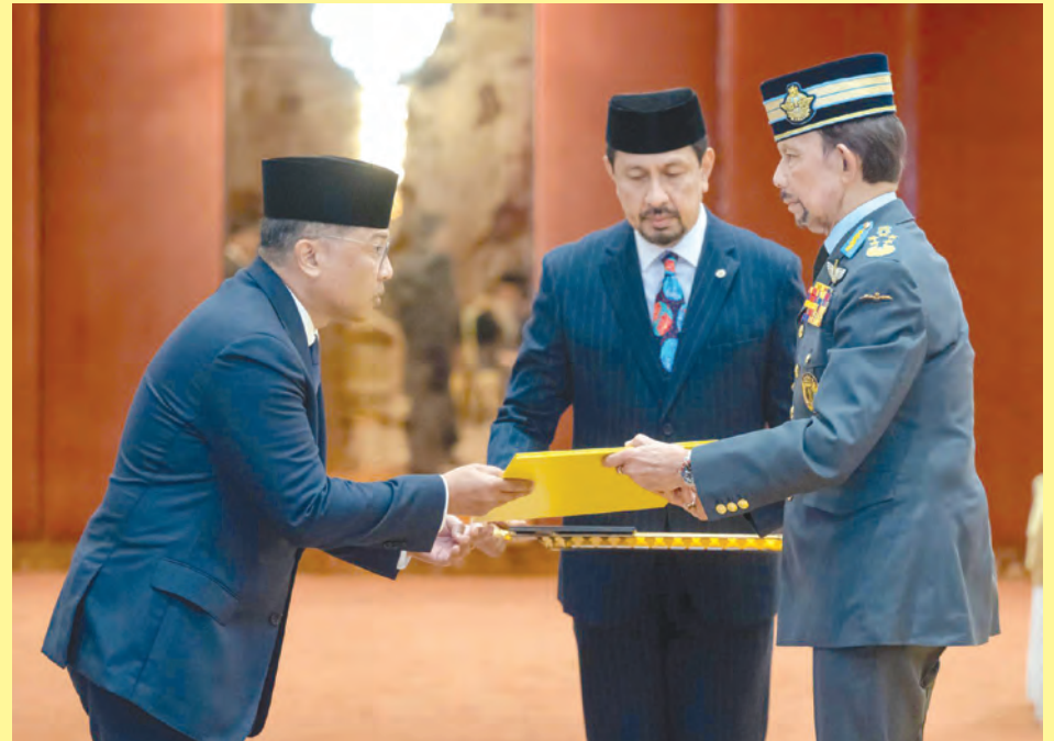
KEBAWAH DYMM berkenan mengurniakan Surat Lantikan kepada Menteri Pengangkutan dan Infokomunikasi, Yang Berhormat Dato Seri Paduka Awang Mohammed Riza bin Dato Paduka Haji Mohammed Yunos dan Menteri Kebudayaan, Belia dan Sukan, Yang Berhormat Pengiran Dato Seri Setia Shamhary bin Pengiran Dato Paduka Haji Mustapha (kiri dan kanan).