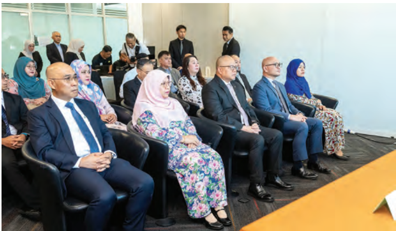
YANG Berhormat Menteri Kesihatan hadir selaku tetamu kehormat menyaksikan Majlis Menandatangani Perjanjian berkenaan berlangsung di Bangunan Mutiara Exchange, Lebuh raya Tungku (atas, atas kanan dan bawah kanan).

BANDAR SERI BEGAWAN , Selasa, 9 Jun. - Kementerian Kesihatan dan DST Managed Services Sdn. Bhd. (DMS) hari ini mengadakan Majlis Menandatangani Perjanjian bagi penyediaan tenaga kerja Unit Kesihatan, Keselamatan dan Alam Sekitar (Health, Safety and Environment-HSE).