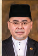
Yang Berhormat Pengiran Dato Seri Paduka Haji Mohammad Tashim bin Pengiran Haji Hassan, MENTERI HAL EHWAL UGAMA