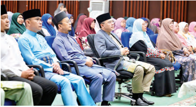
YANG Berhormat Menteri Hal Ehwal Ugama hadir selaku tetamu kehormat majlis.