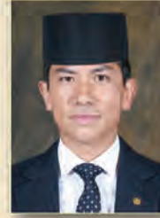
Duli Yang Teramat Mulia Paduka Seri Pengiran Muda 'Abdul Mateen ibni Kebawah Duli Yang Maha Mulia Paduka Seri Baginda Sultan Haji Hassanal Bolkiah Mu'izzaddin Waddaulah, MENTERI HAL EHWAL LUAR NEGERI