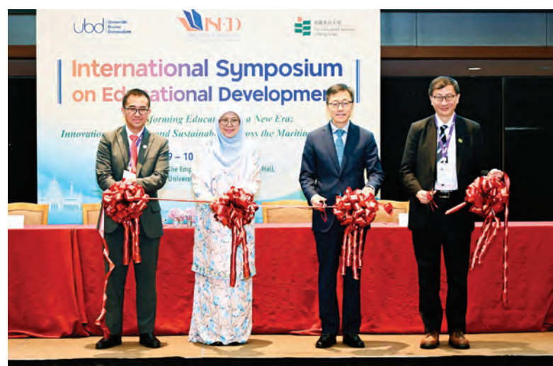
YANG Berhormat Menteri Pendidikan hadir selaku tetamu kehormat majlis dan seterusnya merasmikan Simposium Antarabangsa Pembangunan Pendidikan (International Symposium on Educational Development – ISED 2026).

Simposium berkenaan turut menyaksikan pemeteraian Memorandum Persefahaman (MoU) yang melibatkan UBD, EdUHK, Philippine Normal University, National University of