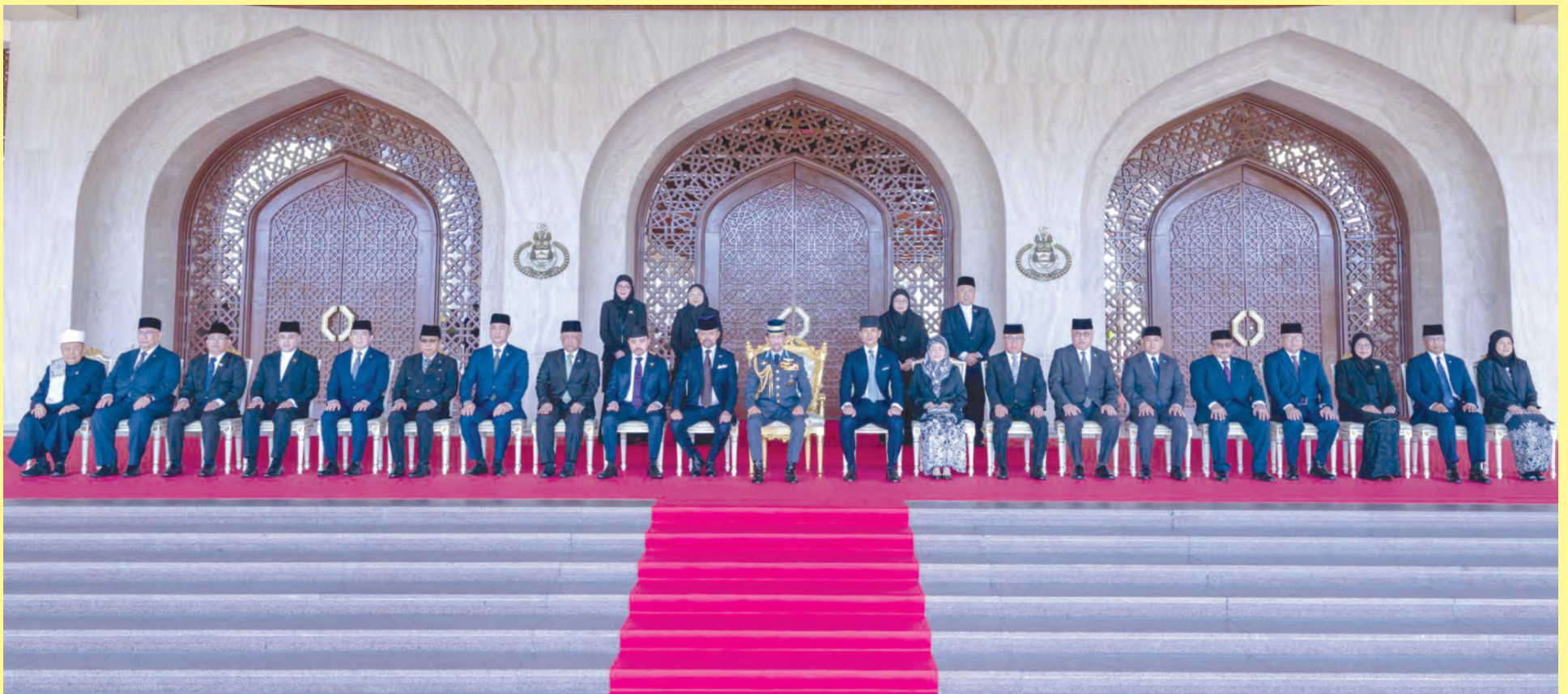
KEBAWAH DYMM dijunjung bagi sesi bergambar ramai bersama barisan Menteri-menteri Kabinet dan Timbalan-timbalan Menteri.