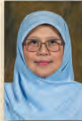
Yang Berhormat Datin Seri Setia Dr. Hajah Romalzah binti Haji Md. Salleh, MENTERI PENDIDIKAN