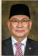
Yang Berhormat Dato Seri Paduka Awang Mohammed Riza bin Dato Paduka Haji Mohammed Yunus, MENTERI PENGANGKUTAN DAN INFOKOMUNIKASI