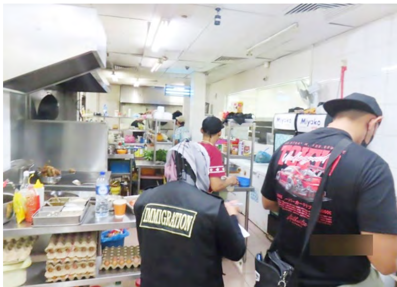
BAHAGIAN Penguatkuasa Undang-Undang, Bandar Seri Begawan semasa Operasi Kakas 60 / 2026 yang menyasarkan kantin jualan di Mukim Gadong 'B' (atas dan bawah).

BANDAR SERI BEGAWAN, (JIPK) ingin menyampaikan peringatan kepada orang ramai dan Pendaftaran Kebangsaan terutama kepada para majikan