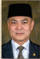
Yang Berhormat Dato Seri Setia Awang Haji Ahmad bin Haji Abdul Rahman, MENTERI PENYELARAS BAGI DASAR-DASAR SOSIAL DAN TENAGA MANUSIA; DAN MENTERI HAL EHWAL DALAM NEGERI