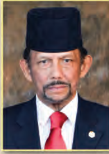
Kebawah Duli Yang Maha Mulia Paduka Seri Baginda Sultan Haji Hassanal Bolkiah Mu'izzaddin Waddaulah ibni Al-Marhum Sultan Haji Omar 'Ali Saifuddin Sa'adul Khairi Waddien, Sultan dan Yang Di-Pertuan Negara Brunei Darussalam, PERDANA MENTERI; MENTERI PERTAHANAN; DAN MENTERI KEWANGAN