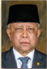
Yang Berhormat Pehin Datu Lallaraja Mejar Jeneral (B) Dato Paduka Seri Awang Haji Halbi bin Haji Mohd. Yusof, MENTERI PENYELARAS BAGI KESELAMATAN NEGARA; MENTERI DI JABATAN PERDANA MENTERI; DAN MENTERI PERTAHANAN II