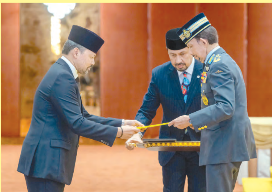
KEBAWAH Duli Yang Maha Mulia Paduka Seri Baginda Sultan Haji Hassanal Bolkiah Mu'izzaddin Waddaulah ibni Al-Marhum Sultan Haji Omar 'Ali Saifuddin Sa'adul Khairi Waddien, Sultan dan Yang Di-Pertuan Negara Brunei Darussalam berkenan mengurniakan Surat Lantikan kepada Duli Yang Teramat Mulia Paduka Seri Pengiran Muda Mahkota Pengiran Muda Haji Al-Muhtadee Billah, Menteri Kanan di Jabatan Perdana Menteri pada Majlis Mengangkat Sumpah Kabinet Baharu Negara Brunei Darussalam.