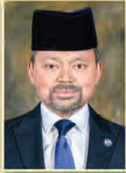
Duli Yang Teramat Mulia Paduka Seri Pengiran Muda Mahkota Pengiran Muda Haji Al-Muhtadee Billah ibni Kebawah Duli Yang Maha Mulia Paduka Seri Baginda Sultan Haji Hassanal Bolkiah Mu'izzaddin Waddaulah, MENTERI KANAN DI JABATAN PERDANA MENTERI