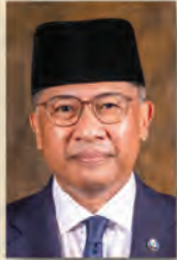
Yang Berhormat Pengiran Dato Seri Setia Shamhary bin Pengiran Dato Paduka Haji Mustapha, MENTERI KEBUDAYAAN, BELIA DAN SUKAN