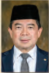
Yang Berhormat Dato Seri Setia Dr. Awang Haji Mohd. Amin Liew bin Abdullah, MENTERI KEWANGAN II