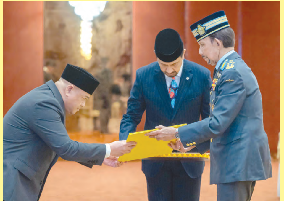
KEBAWAH DYMM berkenan mengurniakan Surat Lantikan kepada Menteri di JPM (Sekuriti dan Undang-Undang) dan Pengarah Jabatan Keselamatan Dalam Negeri, Yang Berhormat Dato Seri Paduka Awang Haji Sufian bin Haji Sabtu dan Menteri di JPM (Tenaga, Huluan dan Hiliran), Yang Berhormat Dato Seri Paduka Awang Haji Mohamad Azmi bin Haji Mohd. Hanifah (kiri dan kanan).