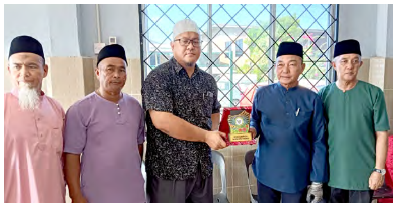
ROMBONGAN Ahli Majlis Perundingan Kampung (MPK) dan Biro Wanita Kawasan 2, Rancangan Perumahan Negara (RPN) Kampung Mentiri yang diketuai oleh Pemangku Ketua Kampung Kawasan 2, RPN Kampung Mentiri semasa lawatan sambil belajar ke Kampung Punang, Lawas, Sarawak.