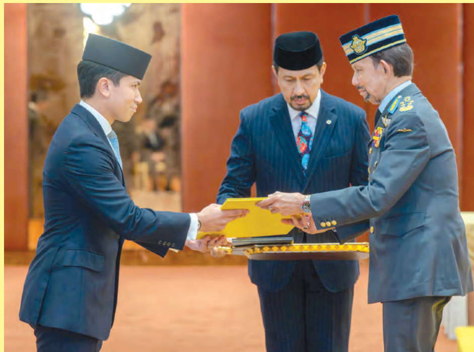
KEBAWAH Duli Yang Maha Mulia Paduka Seri Baginda Sultan dan Yang Di-Pertuan Negara Brunei Darussalam berkenan mengurniakan Surat Lantikan kepada paduka-paduka anakanda baginda, Duli Yang Teramat Mulia Paduka Seri Pengiran Muda 'Abdul Malik dan Duli Yang Teramat Mulia Paduka Seri Pengiran Muda 'Abdul Mateen (kiri dan kanan).