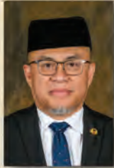
Yang Berhormat Dato Seri Setia Dr. Awang Haji Abdul Manaf bin Haji Metussin, MENTERI PENYELARAS BAGI DASAR-DASAR EKONOMI; DAN MENTERI EKONOMI, PERDAGANGAN DAN INDUSTRI