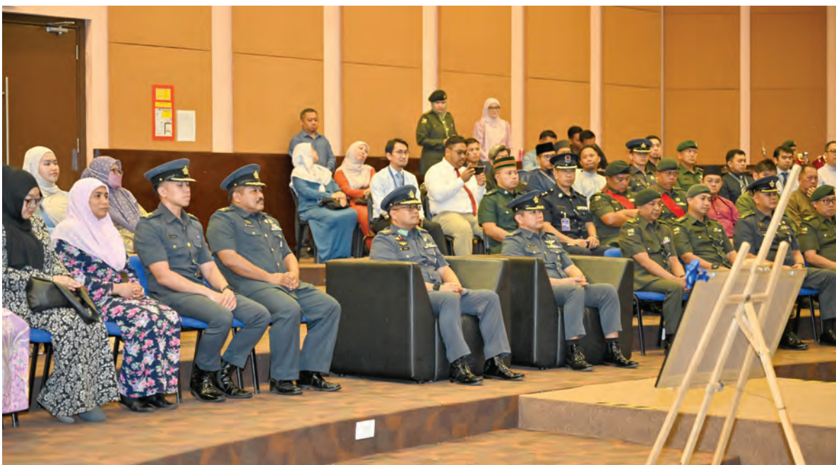
MAJLIS Penyerahan Poster sempena Sambutan Hari Ulang Tahun Angkatan Bersenjata Diraja Brunei (ABDB) Ke-65 berlangsung di Dewan Wira Seni, Bangunan Pancaragam ABDB (atas dan atas kanan).

BERAKAS GARISON , Rabu, 6 Mei. - Majlis Penyerahan Poster sempena Sambutan Hari Ulang Tahun (HUT) Angkatan Bersenjata Diraja Brunei (ABDB) Ke-65 telah berlangsung di Dewan Wira Seni, Bangunan Pancaragam ABDB, di sini.