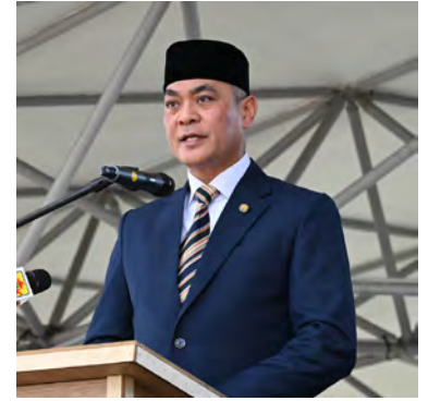
YANG Berhormat Menteri Hal Ehwal Dalam Negeri semasa berucap.

Di samping itu, kata Yang Berhormat lagi, projek ini turut melibatkan pelaksanaan sistem