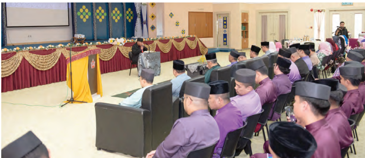
TIMBALAN Setiausaha Tetap (Dasar dan Keagamaan), Kementerian Hal Ehwal Ugama hadir selaku tetamu khas pada Majlis Penutup Bengkel Zainul Quran (atas dan atas kanan).

SERUSOP, Rabu, 6 Mei. - Bengkel Zainul Quran Bersama Qari Antarabangsa sempena Musabaqah Membaca Al-Quran Bahagian Dewasa Peringkat Akhir Kebangsaan Tahun 1447 Hijrah / 2026 Masihi yang diadakan selama enam hari bermula Khamis, 30 April 2026 telah melabuhkan tirainya baru-baru ini dengan Majlis Penutup Bengkel Zainul Quran yang diadakan bertempat di Dewan Serbaguna, Sekolah Ugama Pengiran Anak Puteri Muta-Wakkilah Hayatul Bolkihah,