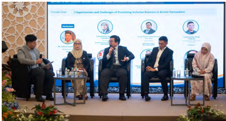
ACARA Mapping the Way Forward : Inclusive Business in Brunei Darussalam Landscape Study - Kick-Off Event baru-baru ini menekankan komitmen berterusan BIBD untuk memupuk ekosistem PMKS yang inklusif dan berdaya tahan di Negara Brunei Darussalam.