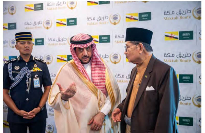
YANG Berhormat Menteri Hal Ehwal Ugama hadir di Lapangan Terbang Antarabangsa Brunei bagi mengucapkan selamat belayar kepada bakal-bakal jemaah haji (kiri dan atas).

BAKAL jemaah haji bertolak meninggalkan negara ini menggunakan pesawat Penerbangan Diraja Brunei BI4207 dan dijangka tiba di Madinah Al-Munawwarah pada pukul 5.15 petang waktu Madinah (kiri dan kanan).