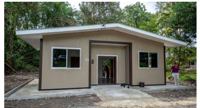
KEJAYAAN menyiapkan rumah tersebut membuktikan keberkesanan usaha kerjasama antara pelbagai pihak berkepentingan yang bekerjasama ke arah matlamat bersama untuk membantu masyarakat memerlukan.

Menurutnya, beliau yang tinggal bersama dua anak dan cucu begitu terharu menerima bantuan daripada pihak BIBD walaupun beliau tidak terfikir selama ini akan mempunyai sebuah rumah di atas tanah sendiri dengan bantuan pihak BIBD.