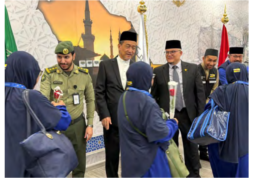
TUAN Yang Terutama Duta Besar Istimewa dan Mutlak Negara Brunei Darussalam (NBD) ke Arab Saudi di Riyadh hadir bagi menyambut ketibaan rombongan bakal jemaah haji NBD bagi penerbangan ketiga berkenaan. Turut hadir, Pemangku Konsul Agung NBD di Jeddah (atas dan kiri).