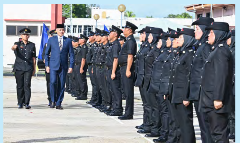
PEMERIKSAAN perbarisan oleh Yang Berhormat Menteri Hal Ehwal Dalam Negeri.

berterusan JBP dalam memperluaskan kesedaran, memperkukuh kesiapsiagaan masyarakat serta membudayakan tindakan awal dalam menghadapi sebarang insiden kecemasan," tambahnya lagi.