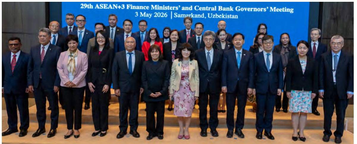
PEMANGKU Setiausaha Tetap (Fiskal I), Kementerian Kewangan dan Ekonomi, hadir pada 29th AFMGM+3 Meeting di Samarkand, Uzbekistan baru-baru ini.

Dalam kenyataannya, NBD mengiktiraf sokongan berterusan ADB terhadap keutamaan ASEAN dalam tenaga, pasaran modal dan infrastruktur mampan, serta menyeru