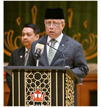
YANG Berhormat Menteri di Jabatan Perdana Menteri (JPM) dan Menteri Pertahanan II semasa berucap.

Tambah Yang Berhormat, semua berkenaan menuntut sebuah PA yang cekap, responsif,