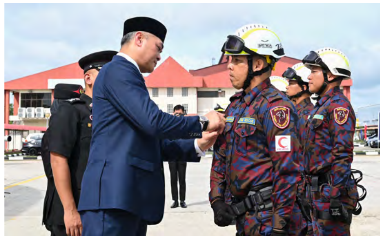
YANG Berhormat Menteri Hal Ehwal Dalam Negeri hadir selaku tetamu kehormat pada Majlis Sambutan Hari Ulang Tahun Jabatan Bomba dan Penyelamat Kali Ke-66 Tahun 2026 (atas), manakala gambar bawah kiri, antara yang menyertai pertandingan.

Kedua-dua pasukan tersebut telah berjaya mara ke peringkat akhir selepas melepasi pusingan saringan yang diadakan pada 25 April lalu melibatkan penyertaan sebanyak enam buah pasukan dari kampung-kampung yang telah