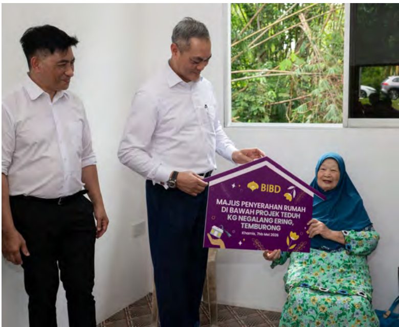
YANG Berhormat Menteri Hal Ehwal Dalam Negeri selaku Pengerusi BIBD menyerahkan rumah tersebut kepada penerima.

TEMBURONG , Khamis, 7 Mei. - Bank Islam Brunei Darussalam (BIBD) petang tadi menyerahkan dua buah rumah baharu yang dibina di bawah inisiatif Projek Teduh, sekali gus menegaskan komitmen berterusan bank dalam memperkukuh kesejahteraan masyarakat serta menyokong keluarga yang memerlukan melalui usaha peningkatan sosial yang mampan.