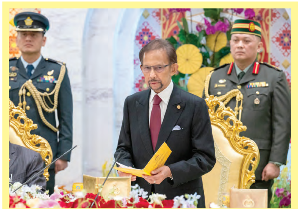
KEBAWAH Duli Yang Maha Mulia Paduka Seri Baginda Sultan Haji Hassanal Bolkiah Mu'izzaddin Waddaulah ibni Al-Marhum Sultan Haji Omar 'Ali Saifuddien Sa'adul Khairi Waddien, Sultan dan Yang Di-Pertuan Negara Brunei Darussalam berkenan mengurniakan titah pada Majlis Persantapan Rasmi sempena Lawatan Rasmi Perdana Menteri Republik Demokratik Timor-Leste ke Negara Brunei Darussalam pada Isnin, 4 Mei 2026 di Istana Nurul Iman.

Memandang ke hadapan, NBD kekal komited untuk bekerjasama rapat dengan