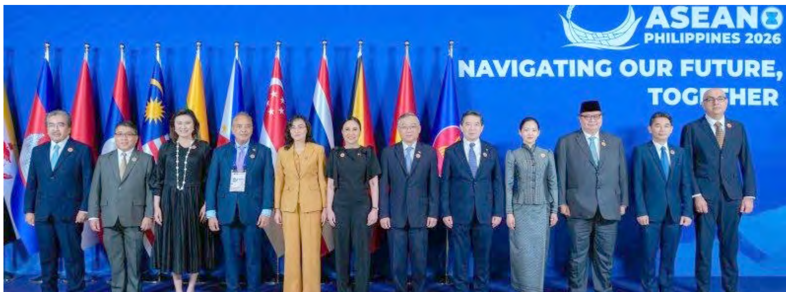
YANG Berhormat Menteri di Jabatan Perdana Menteri dan Menteri Kewangan dan Ekonomi II menghadiri Mesyuarat Majlis Komuniti Ekonomi ASEAN Ke-27.