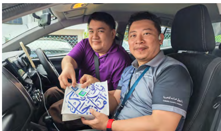
■ Siaran Akhbar dan Foto : Tabung Amanah Pekerja