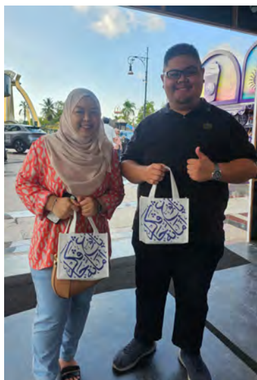
TABUNG Amanah Pekerja (TAP) meneruskan usaha jangkauan melalui inisiatif SE:TAPak, yang bertujuan membantu individu bekerja sendiri untuk memahami dengan lebih jelas mengenai Skim Persaraan Kebangsaan (kiri, kanan dan bawah kanan).

festival makanan, yang merupakan sebahagian daripada golongan individu bekerja sendiri dan usahawan mikro yang semakin berkembang.