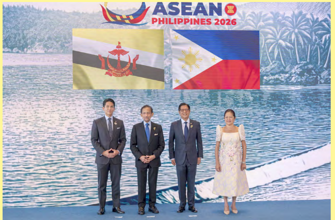
Republik Filipina, Tuan Yang Terutama Ferdinand R. Marcos

Keberangkatan tiba Kebawah Duli Yang Maha Mulia Paduka Seri Baginda Sultan dan Yang Di-Pertuan Negara Brunei Darussalam dialu-alukan oleh Presiden