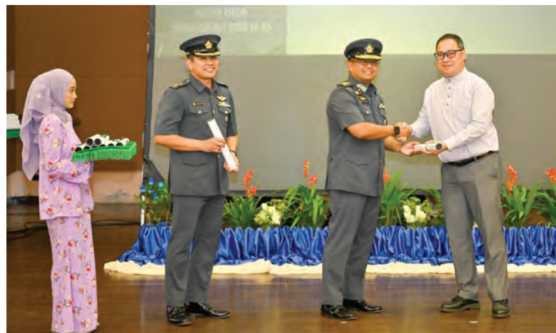
Oleh : Aimi Sani

Mengusung tema 'Bersama Bersatu Mencapai Cita Negara', penyerahan poster berkenaan bertujuan untuk memperluaskan penerangan kepada orang ramai mengenai sambutan berkenaan, khususnya bagi memaklumkan mengenai acara kemuncak yang akan berlangsung pada 31 Mei 2026 di Pangkalan Tentera Udara Rimba.