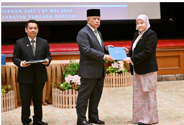
YANG Berhormat Menteri di JPM dan Menteri Pertahanan II hadir selaku tetamu kehormat pada Majlis Penyampaian Sijil yang berlangsung di Dewan Bankuet, JPM.

"Jawatan yang merupakan satu amanah besar yang perlu dipikul dengan penuh rasa tanggungjawab ini menuntut kita untuk sentiasa meletakkan kepentingan negara dan kesejahteraan rakyat sebagai keutamaan dalam setiap tindakan dan keputusan yang kita ambil," ujar Yang Berhormat lagi.