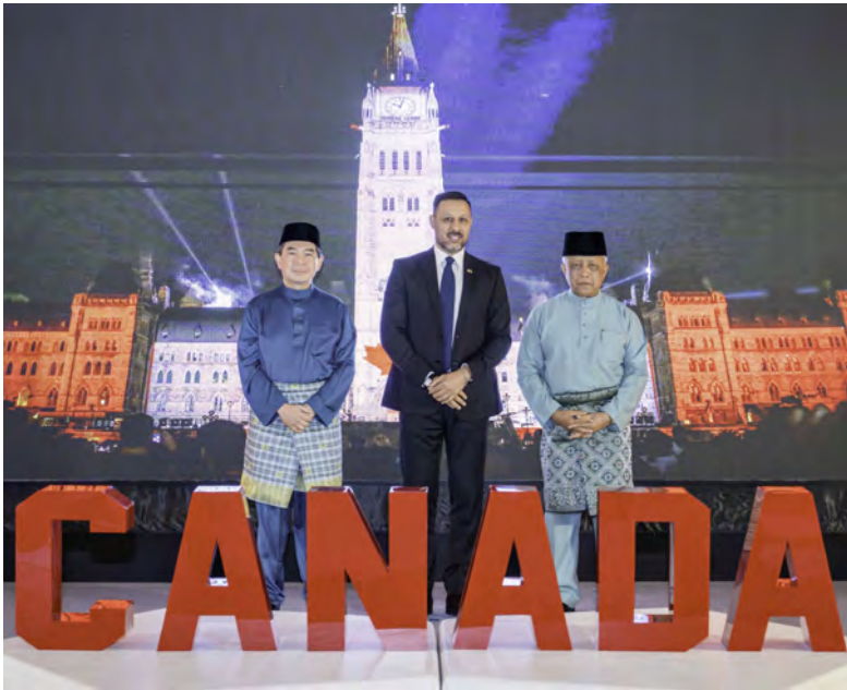
Oleh : Pg. Siti Redzaimi Pg. Haji Ahmad