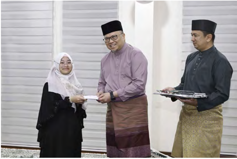
YANG Berhormat Menteri Kesihatan hadir selaku tetamu kehormat pada Majlis Bertadarus Al-Quran dan penyampaian derma kepada anak-anak yatim sempena Bulan Ramadan (kanan dan atas).

Oleh : Rohani Haji Abdul Hamid