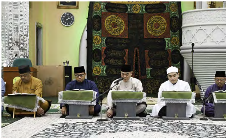
YANG Berhormat Menteri Hal Ehwal Dalam Negeri hadir selaku tetamu kehormat pada Majlis Tadarus Al-Quran bulan Ramadan rombongan Kementerian Hal Ehwal Dalam Negeri dan jabatan-jabatan di bawahnya berserta Majlis Perundingan Mukim dan Kampung Tahun 1447 Hijrah / 2026 Masihi.

Oleh : Saerah Haji Abdul Ghani