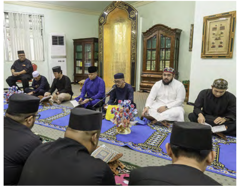
SEBAHAGIAN yang hadir pada Majlis Khatam Al-Quran, bertempat di Surau Al-Mutma'inah, di premis organisasi berkenaan (atas dan kiri).

Majlis berkenaan diharap dapat memupuk pembacaan Al-Quran dalam kalangan warga kerja