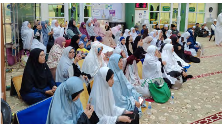
ANTARA jemaah perempuan yang hadir.

Penganjuran majlis seperti ini diharap dapat terus mengimarahkan masjid sebagai pusat ibadah, ilmu dan penyatuan masyarakat Islam di Negara Brunei Darussalam.