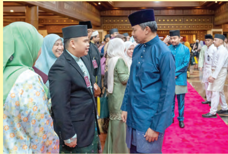
DULI Yang Teramat Mulia Paduka Seri Pengiran Muda Mahkota berkenan beramah mesra dengan para peserta musabaqah dan keluarga (kiri dan kanan).