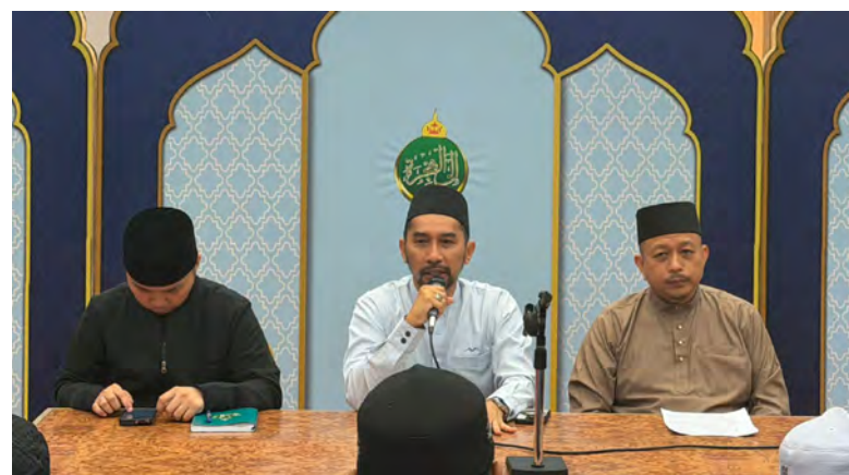
KEMENTERIAN Hal Ehwal Ugama melalui Jabatan Urusan Haji meneruskan sesi perjumpaan bersama syarikat-syarikat pengendali Pakej Umrah yang menggunakan Visa Pelancong Arab Saudi yang dibenarkan (atas dan kiri).

Inisiatif yang dilaksanakan berkenaan diharapkan dapat memberikan hasil yang positif, khususnya dalam memastikan kemaslahatan dan kebajikan jemaah umrah masa hadapan sentiasa terpelihara, seterusnya memudahkan menunaikan ibadat umrah dengan lancar, teratur dan sempurna.