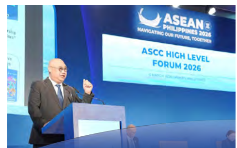
MESYUARAT ASCC tegaskan komitmen ASEAN inklusif berdaya tahan