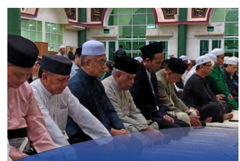
QIAMULLAIL, Tazkirah Khas imarahkan Ramadan