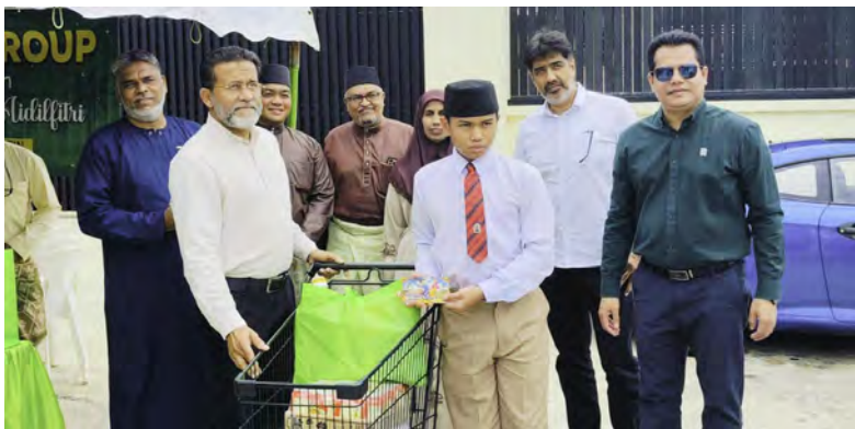
MAJLIS Penyampaian Derma yang dianjurkan oleh Majlis Perundingan Mukim Serasa dengan kerjasama Poomaan Group of Companies selaku penyumbang.

KAPOK, Khamis, 5 Mac. - Golongan kurang berkemampuan dan anak-anak yatim yang menetap di Mukim Serasa pagi tadi menerima sumbangan berupa keperluan harian seperti beras, minyak masak dan barangan makanan kering dalam satu Majlis Penyampaian Derma yang dianjurkan oleh Majlis Perundingan Mukim (MPM) Serasa dengan kerjasama Poomaan Group of Companies selaku penyumbang.