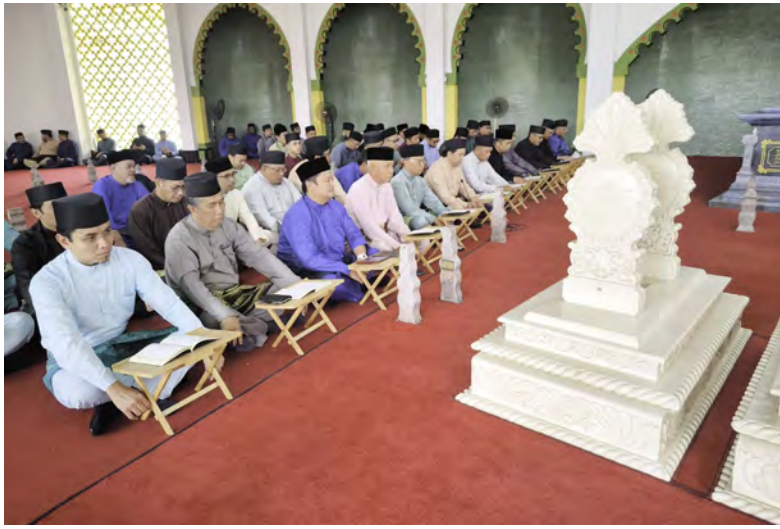
BRUNEI Shell Petroleum Company Sdn. Bhd., Brunei LNG Sdn. Bhd., Brunei Shell Marketing, Brunei Gas Carriers Sdn. Bhd., Brunei Methanol Company Sdn. Bhd. dan Brunei Fertilizer Industries Sdn. Bhd. mengadakan Majlis Bertahlil di Kubah Makam Diraja baru-baru ini.

BANDAR SERI BEGAWAN, Khamis, 5 Mac. - Brunei Shell Petroleum Company Sdn. Bhd. (BSP), Brunei LNG Sdn. Bhd. (BLNG), Brunei Shell Marketing (BSM), Brunei Gas Carriers Sdn. Bhd. (BGC), Brunei Methanol Company Sdn. Bhd. (BMC) dan Brunei Fertilizer Industries Sdn. Bhd. (BFI), hari ini, telah mengadakan Majlis Bertahlil di Kubah Makam Diraja, di sini.