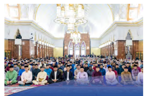
MEMBUDAYAKAN interaksi dengan Al-Quran dalam kehidupan seharian