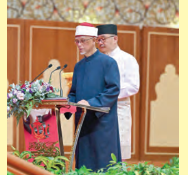
BACAAN doa dipimpin oleh Yang Berhormat Ketua Hakim Syarie (atas) manakala gambar kiri, kiri sekali, bawah kiri dan bawah, sekitar majlis tersebut dan para jemputan yang hadir.