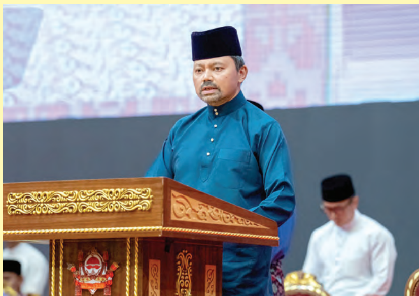
DULI Yang Teramat Mulia Paduka Seri Pengiran Muda Mahkota Pengiran Muda Haji Al-Muhtadee Billah ibni Kebawah Duli Yang Maha Mulia Paduka Seri Baginda Sultan Haji Hassanal Bolkiah Mu'izzaddin Waddaulah, Menteri Kanan di Jabatan Perdana Menteri berkenan mengurniakan sabda pada Majlis Sambutan Nuzul Al-Quran Peringkat Negara Tahun 1447 Hijrah di Dewan Plenary, Pusat Persidangan Antarabangsa, Berakas.