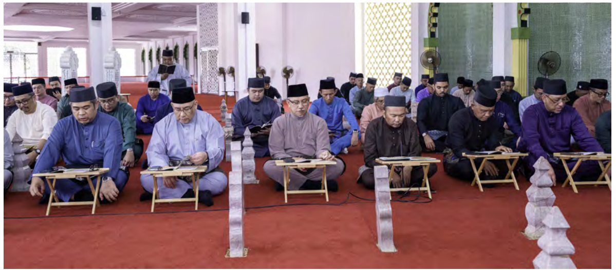
YANG Berhormat Menteri Pembangunan selaku Pengerusi Syarikat Penerbangan Diraja Brunei (Royal Brunei Airlines - RB) hadir mengetuai rombongan RB di Majlis Membaca Surah Yaa Siin dan Bertahlil bersempena Bulan Ramadan 1447 Hijrah / 2026 Masihi di Kubah Makam Diraja.

Atur cara dimulakan dengan bacaan Surah Al-Fatihah, diikuti dengan bacaan Surah Yaa Siin dan