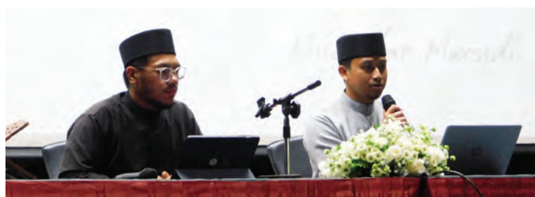
PROGRAM Siri Tadabbur Al-Quran Kali Ke-9 bagi minggu kedua bertempat di Dewan Persidangan, PDI.