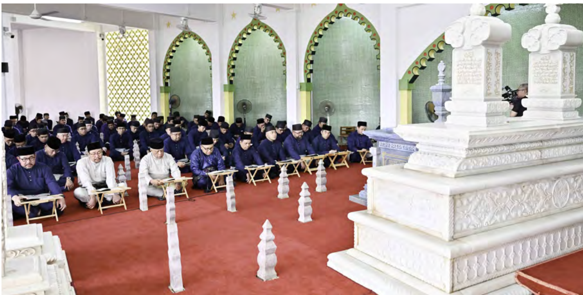
YANG Berhormat Menteri di Jabatan Perdana Menteri dan Menteri Pertahanan II selaku Pengerusi Lembaga Pengarah Perbadanan TAIB hadir pada Majlis Membaca Surah Yaa Siin dan Tahليل di Kubah Makam Diraja, Jalan Tutong.