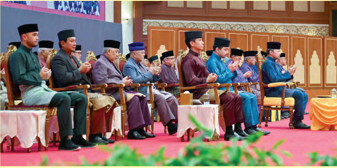
DULI Yang Teramat Mulia Paduka Seri Pengiran Muda Mahkota Pengiran Muda Haji Al-Muhtadee Billah dan paduka-paduka adinda menadah tangan ketika doa dibacakan.