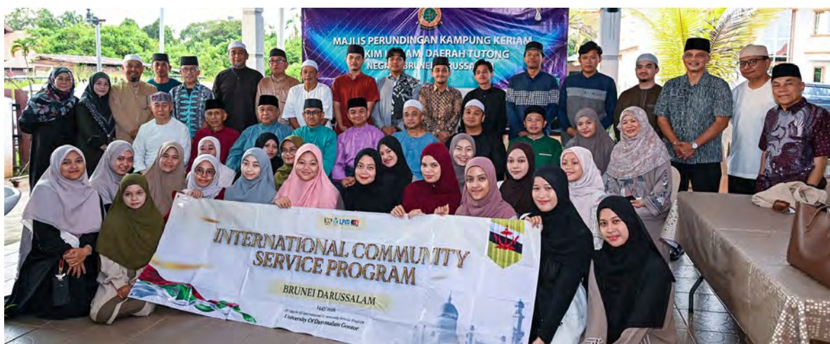
TURUT hadir memeriahkan majlis berkenaan, Pemangku Pegawai Daerah Tutong.

Oleh : Pg. Vivy Malessa Pg. Ibrahim