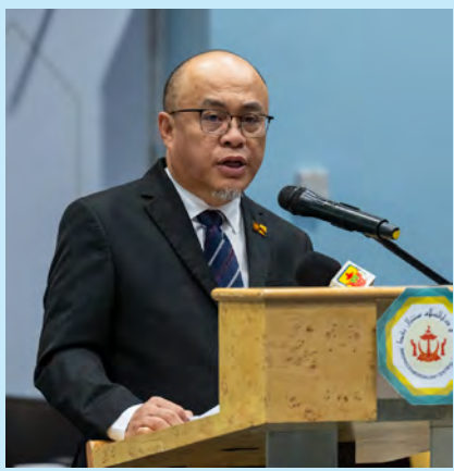
MENTERI Sumber-Sumber Utama dan Pelancongan, Yang Berhormat Dato Seri Setia Dr. Awang Haji Abdul Manaf bin Haji Metussin berucap pada Economic and Investment Outlook 2026 anjuran BDCB pada Isnin, 2 Februari 2026 yang berlangsung di Dewan Teater, Kementerian Kewangan dan Ekonomi.