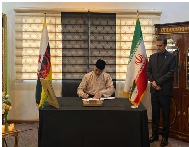
YANG Berhormat Menteri Hal Ehwal Dalam Negeri menandatangani buku ucapan takziah berkenaan bagi pihak Kerajaan Negara Brunei Darussalam.

Tuan Yang Terutama turut merakamkan penghargaan kepada Kerajaan NBD kerana mengutuk serangan terhadap Republik Islam Iran serta atas solidariti yang ditunjukkannya dalam tempoh yang sukar berkenaan.