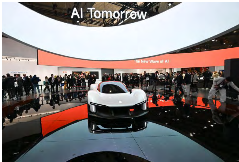
ORANG ramai melihat sebuah kenderaan yang dipamerkan di Petak Xiaomi semasa The 2026 Mobile World Congress (MWC) 2026 di Barcelona, Sepanyol pada 2 Mac 2026.

BARCELONA, SEPANYOL, 6 Mac. - Kongres Dunia Mudah Alih (MWC) 2026 berakhir pada hari Khamis di Barcelona, Sepanyol, yang mengetengahkan bagaimana lonjakan Kecerdasan Buatan (AI) mendorong komunikasi mudah alih melangkaui sambungan asas ke arah ekosistem digital yang lebih luas yang mengintegrasikan pengkomputeran awan, platform data dan aplikasi industri.