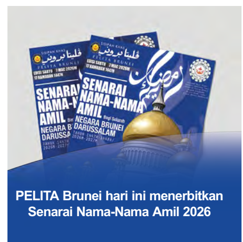
PELITA Brunei hari ini menerbitkan Senarai Nama-Nama Amil 2026