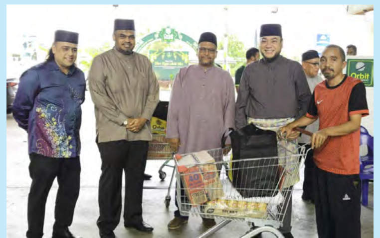
ORBIT Supermarket Sdn. Bhd. terus menzahirkan komitmen Tanggungjawab Sosial Korporat (CSR) dengan menyampaikan sumbangan kepada golongan kurang berkemampuan yang menetap di Kampung Salambigar, Kampung Sungai Hanching dan Kampung Lambak.

SALAMBIGAR, Khamis, 5 Mac. - Dalam usaha berterusan memedulikan kebajikan dan kesejahteraan penduduk setempat, Orbit Supermarket Sdn. Bhd. terus menzahirkan komitmen Tanggungjawab Sosial Korporat (CSR) dengan menyampaikan sumbangan kepada golongan kurang berkemampuan yang menetap di Kampung Salambigar, Kampung Sungai Hanching dan Kampung Lambak.