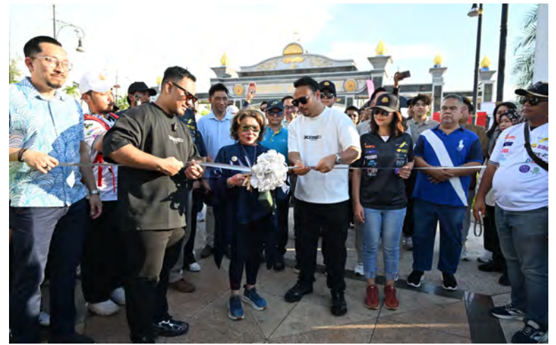
YANG Teramat Mulia Paduka Seri Pengiran Anak Puteri Hajah Amal Rakhiah binti Al-Marhum Sultan Haji Omar 'Ali Saifuddien Sa'adul Khairi Waddien berkecuali berangkat merasmikan Siuk Havoc Food Festival Brunei 2.0

Festival berkenaan dijangka terus menarik kunjungan ramai sehingga hari terakhir penganjurannya pada Selasa, 5 Mei 2026.