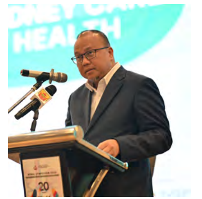
YANG Berhormat Menteri Kesihatan semasa berucap.

Seiring dengan itu, usaha sedang dilaksanakan untuk menubuhkan sebuah yayasan buah pinggang kebangsaan bagi terus menyokong perkhidmatan penjagaan renal di negara ini sebagai satu langkah penting ke