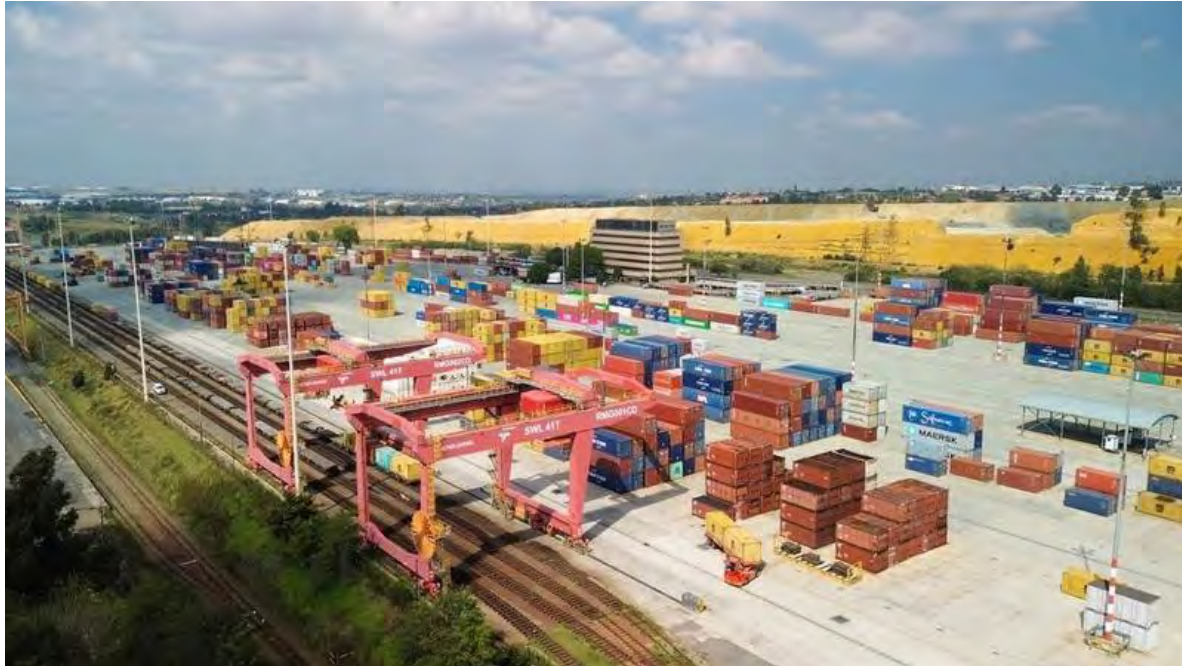
Kontena di sebuah hab perindustrian di Johannesburg, Afrika Selatan.

bagi Forum on China-Africa Cooperation dan mencerminkan hubungan Sino-African yang semakin mendalam, menawarkan pengeksport pintu masuk ke salah satu pasaran pengguna paling dinamik di dunia.