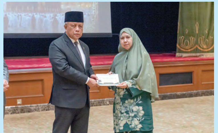
YANG Berhormat Menteri di JPM dan Menteri Pertahanan II semasa menyerahkan sumbangan kepada para penerima.

Oleh : Marlinawaty Hussin