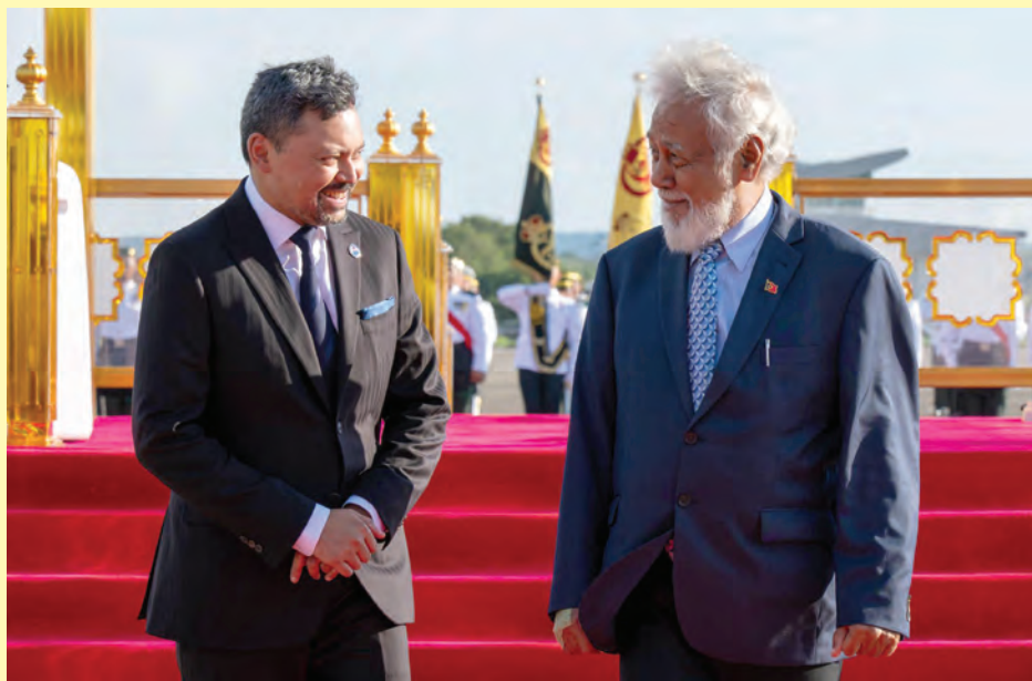
DULI Yang Teramat Mulia Paduka Seri Pengiran Muda Mahkota Pengiran Muda Haji Al-Muhtadee Billah ibni Kebawah Duli Yang Maha Mulia Paduka Seri Baginda Sultan Haji Hassanal Bolkiah Mu'izzaddin Waddaulah, Menteri Kanan di Jabatan Perdana Menteri selaku Wakil Peribadi Kebawah Duli Yang Maha Mulia Paduka Seri Baginda Sultan dan Yang Di-Pertuan Negara Brunei Darussalam, berkenan mengalu-alukan ketibaan Perdana Menteri Republik Demokratik Timor-Leste, Tuan Yang Terutama Kay Rala Xanana Gusmão di Lapangan Terbang Antarabangsa Brunei.