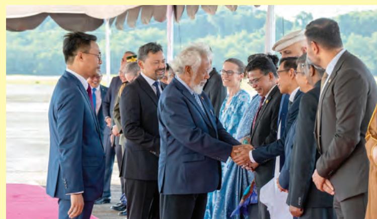
DULI Yang Teramat Mulia Paduka Seri Pengiran Muda Mahkota Pengiran Muda Haji Al-Muhtadee Billah ketika disembahkan kepada rombongan rasmi Republik Demokratik Timor-Leste (atas kiri). Sementara gambar atas, Tuan Yang Terutama Perdana Menteri Republik Demokratik Timor-Leste ketika diperkenalkan kepada rombongan NBD. Manakala gambar kiri, TYT semasa memeriksa Barisan Kawalan Kehormatan yang terdiri daripada anggota Angkatan Bersenjata Diraja Brunei.