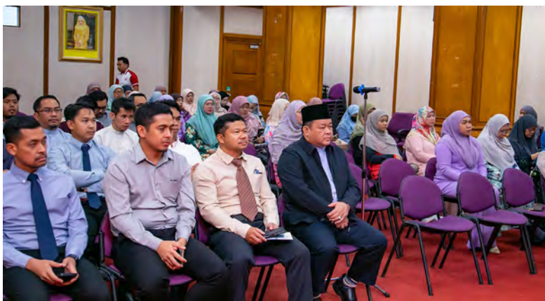
HADIR sama pada jerayawara berkenaan ialah Pemangku Pengarah Hal Ehwal Masjid.