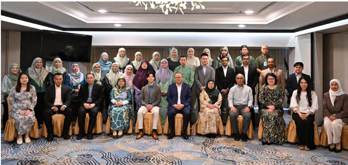
YANG Berhormat Menteri Kesihatan hadir selaku tetamu kehormat Simposium Renal 2026 sempena program Hari Buah Pinggang Sedunia dan seterusnya bergambar ramai.

BERAKAS , Ahad, 3 Mei. - Kementerian Kesihatan melalui Jabatan Perkhidmatan Renal menganjurkan Simposium Renal 2026 sempena program Hari Buah Pinggang Sedunia yang berlangsung di Hotel Mulia, Kampung Anggerek Desa, di sini.