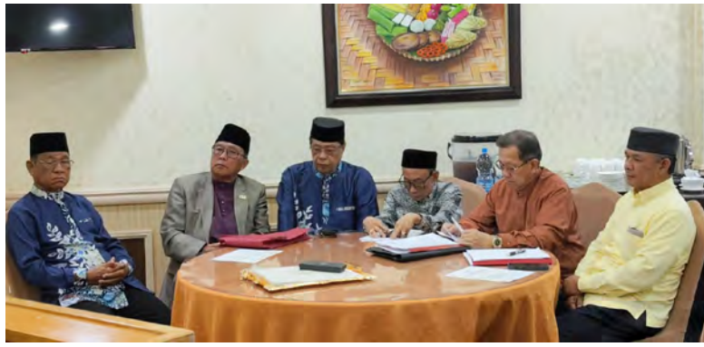
YANG Di-Pertua Pertubuhan WARGAMAS ketika menyampaikan ucapan (atas). Sementara gambar kanan dan bawah, antara ahli-ahli WARGAMAS yang hadir di majlis berkenaan.