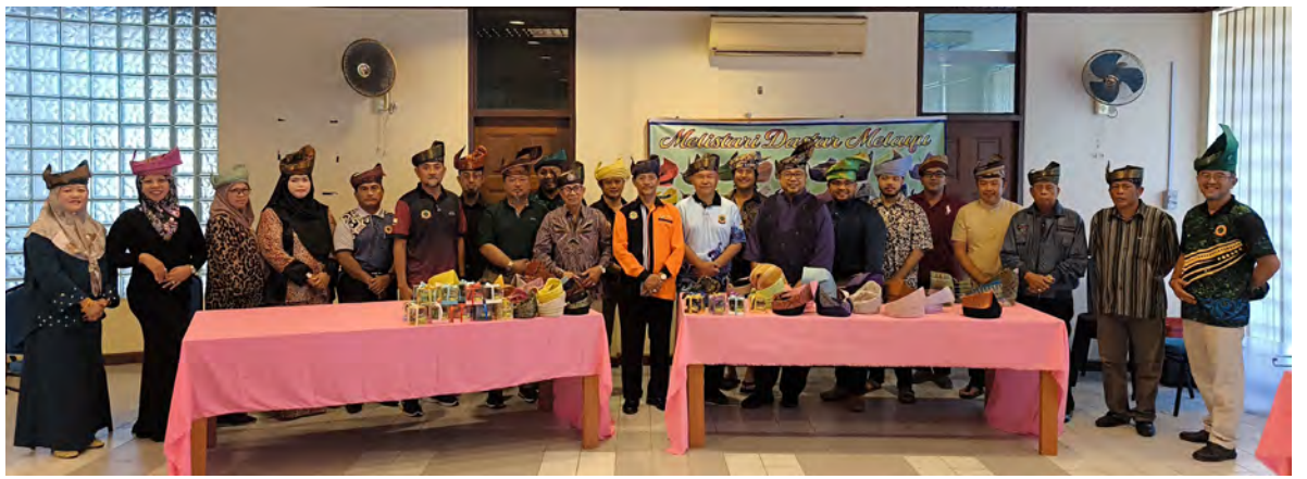
SEKITAR Bengkel Menambat Dastar dan Menapih Sinjang Pengantin yang berlangsung di Pusat Kemasyarakatan Kampung Mentiri (atas dan kiri).

Tambahnya, bengkel seumpama berkenaan juga bermanfaat selain dari segi mempertahankan warisan kita, ia juga berguna dalam menjana pendapatan ekonomi kerana dengan kemahiran berkenaan sekaligus berkecimpung dalam memberikan khidmat 'andaman'