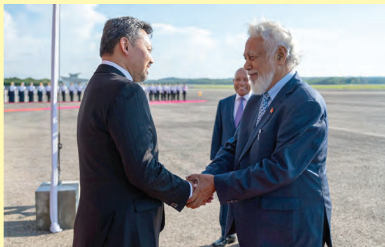
DULI Yang Teramat Mulia Paduka Seri Pengiran Muda Mahkota Pengiran Muda Haji Al-Muhtadee Billah ibni Kebawah Duli Yang Maha Mulia Paduka Seri Baginda Sultan Haji Hassanal Bolkiah Mu'izzaddin Waddaulah, Menteri Kanan di Jabatan Perdana Menteri selaku Wakil Peribadi Kebawah Duli Yang Maha Mulia Paduka Seri Baginda Sultan dan Yang Di-Pertuan Negara Brunei Darussalam berkenan berangkat mengalu-alukan ketibaan Perdana Menteri Republik Demokratik Timor-Leste, Tuan Yang Terutama Kay Rala Xanana Gusmão (atas). Manakala gambar kanan, Majlis Sambutan Rasmi dimulakan dengan Lagu Kebangsaan kedua-dua buah negara.