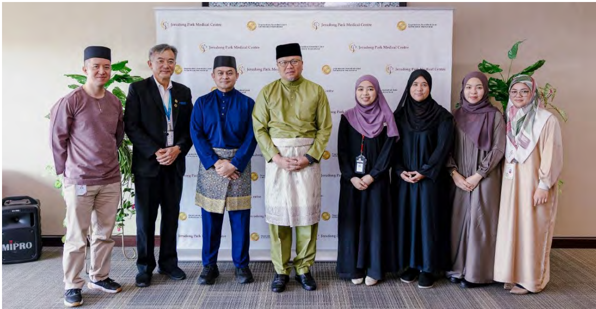
JERUDONG, Sabtu, 2 Mei. - Pusat Perubatan Jerudong Park (JPMC) melalui Bahagian Sumber Manusia dan kerjasama Jawatankuasa Sahabat Ibadah Hospital (IFH) hari ini mengadakan Majlis Doa