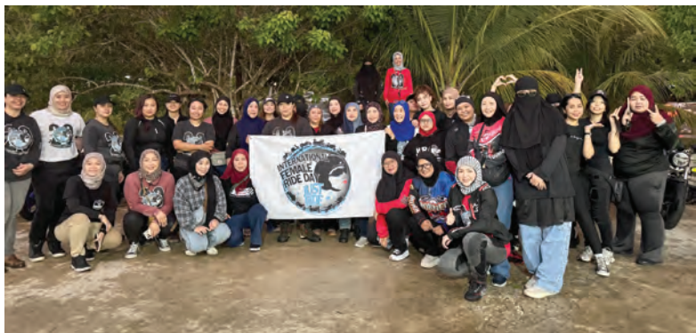
ACARA berkenaan telah disertai lebih 30 penunggang motosikal wanita dari seluruh negara daripada pelbagai latar belakang dan peringkat umur (atas dan bawah kanan).

■ Berita dan Foto : Pg. Siti Redzaimi Pg. Haji Ahmad