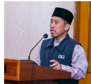
SESI penerangan mengenai Tabung Dana bagi Pembinaan Masjid NBD telah disampaikan oleh Pemangku Penolong Pengarah Hal Ehwal Masjid.

Program tersebut disasarkan khusus kepada para pegawai dan kakitangan kerajaan yang mula berkhidmat sejak tahun 2020 hingga kini, dengan hasrat untuk memperjelaskan matlamat serta objektif penubuhan tabung berkenaan secara menyeluruh dan berkesan.