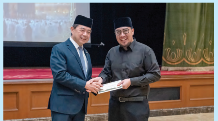
YANG Berhormat Menteri di JPM dan Menteri Kewangan dan Ekonomi II ketika menyempurnakan penyampaian sumbangan kepada bakal-bakal jemaah haji.

Turut hadir, Timbalan-timbalan Menteri, Setiausaha-setiausaha Tetap, Timbalan-timbalan Setiausaha Tetap di JPM serta pegawai-pegawai kanan JPM dan jabatan-jabatan di bawahnya.