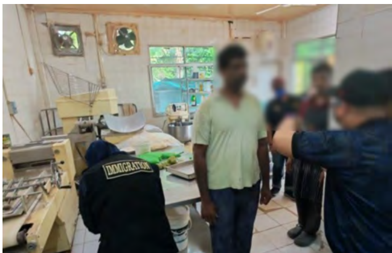
OPERASI Kakas 2026 telah dijalankan di Mukim Berakas 'A', Mukim Sengkurong, dan Mukim Gadong 'A' baru-baru ini, di mana pihak berkuasa telah mendapati beberapa kesalahan di bawah Peraturan Imigresen (atas dan bawah).