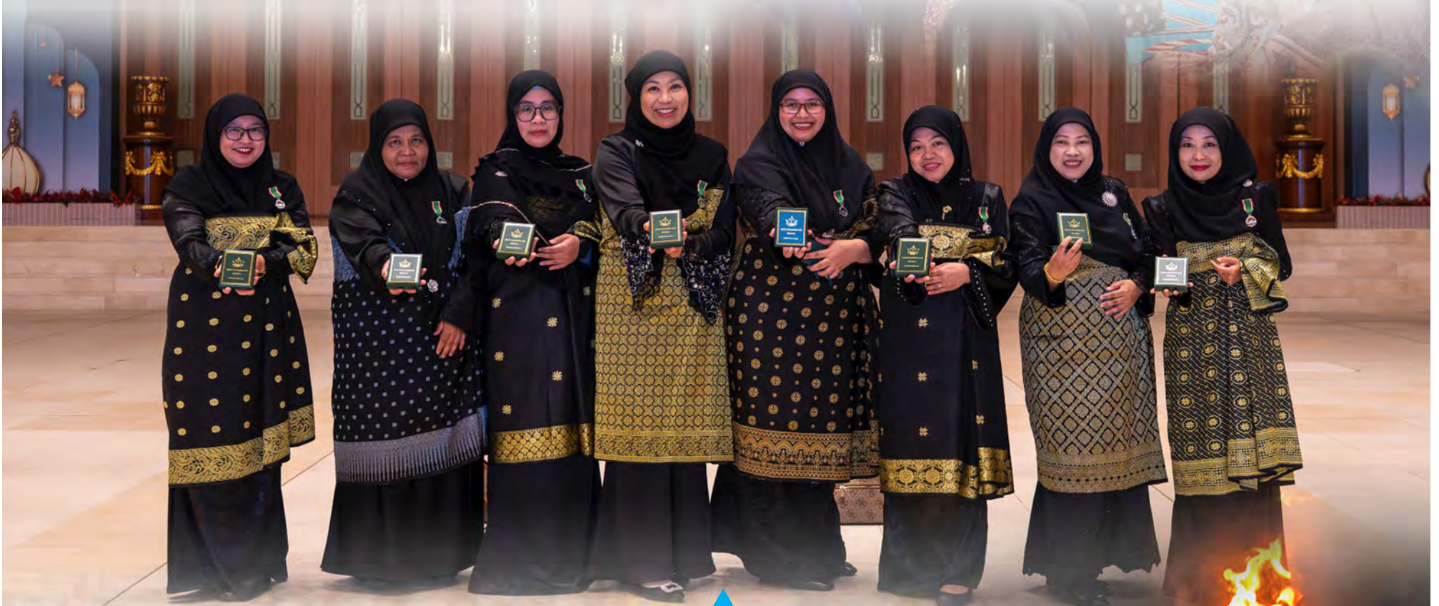
SAAT-saat gembira dan satu kenangan dalam kehidupan bagi penerima-penerima Pingat-pingat Kehormatan Negara Brunei Darussalam.