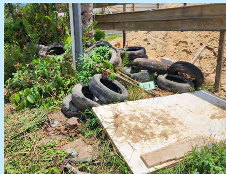
SEBUAH syarikat telah didapati melakukan kesalahan di tempat projek Kampung Panchor Dulit, Tutong dan telah dikenakan denda kompaun sebanyak BND2,000.

■ Siaran Akhbar dan Foto : Jabatan Daerah Tutong