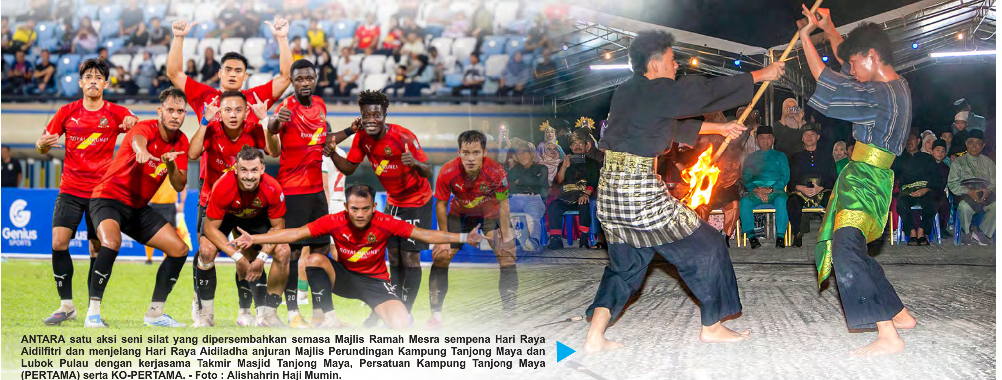
ANTARA satu aksi seni silat yang dipersembahkan semasa Majlis Ramah Mesra sempena Hari Raya Aidilfitri dan menjelang Hari Raya Aidiladha anjuran Majlis Perundingan Kampung Tanjong Maya dan Lubok Pulau dengan kerjasama Takmir Masjid Tanjong Maya, Persatuan Kampung Tanjong Maya (PERTAMA) serta KO-PERTAMA. - Foto : Alishahrin Haji Mumin.