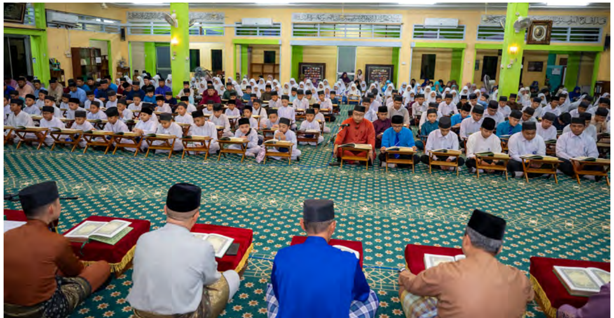
YANG Berhormat Menteri Sumber-Sumber Utama dan Pelancongan hadir selaku tetamu kehormat pada majlis berkenaan yang diadakan di Masjid Utama Mohammad Salleh, Pekan Bangar (kiri). Manakala gambar atas, antara yang hadir peserta yang hadir pada majlis tersebut.

TEMBURONG , Khamis, 2 April. - Sempena Sambutan Perayaan Ulang Tahun Hari Keputeraan Kebawah Duli Yang Maha Mulia Paduka Seri Baginda Sultan Haji Hassanalk Bolkiah Mu'izzaddin Waddaulah ibni Al-Marhum Sultan Haji Omar 'Ali Saifuddien Sa'adul Khairi Waddien, Sultan dan Yang Di-Pertuan Negara Brunei Darussalam Ke-80 bagi Tahun 2026, Majlis Pelancaran Memulakan Bacaan Ayat-ayat Suci Al-Quran bagi Majlis Khatam Al-Quran 80 Kali Khatam Ahli-ahli Majlis Perundingan Mukim dan Kampung (MPMK), Penuntut-penuntut Sekolah dan Institusi-institusi Pengajian Tinggi Seluruh Negara diadakan hari ini secara serentak di keempat-empat buah