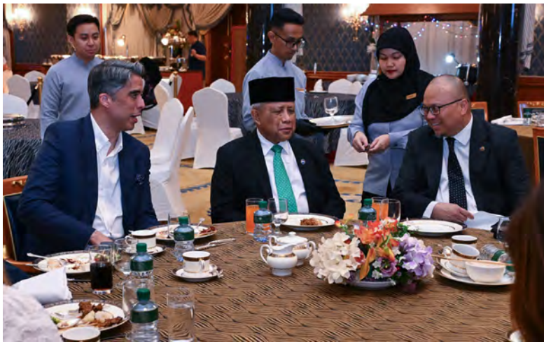
YANG Berhormat Menteri di Jabatan Perdana Menteri (JPM) dan Menteri Pertahanan II dan Yang Berhormat Menteri Kesihatan hadir pada Majlis Rumah Terbuka sempena Sambutan Hari Raya Aidilfitri di Royal Berkshire Hall, Royal Brunei Polo and Riding Club, Jerudong (atas). Manakala gambar bawah dan kanan, antara yang pada majlis tersebut.