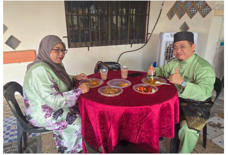
Oleh : Pg. Vivy Malessa Pg. Ibrahim

Cabaran seterusnya adalah, rumah persendirian sering menghadapi kekangan dalam