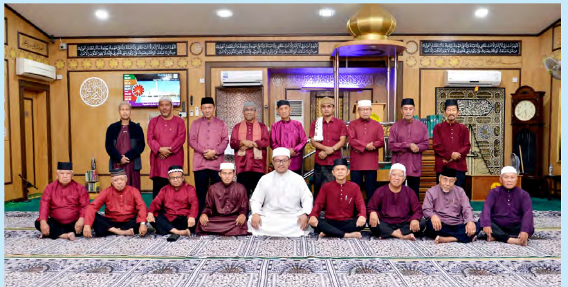
PENGHULU Mukim Kota Batu, dan Ketua Kampung Sungai Besar, Kampung Serdang dan Kampung Sungai Belukut hadir menyertai Majlis Khatam Al-Quran bagi ahli tadarus Subuh Masjid Kampung Sungai Besar dan seterusnya bergambar ramai.