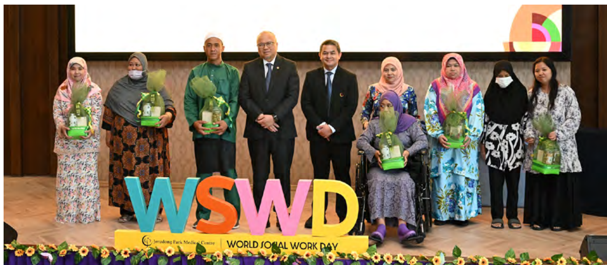
YANG Berhormat Menteri Kesihatan dalam kapasiti sebagai Pengerusi Lembaga Pengarah dan Pengarah Eksekutif JPMC hadir selaku tetamu kehormat majlis pada Hari Kerja Sosial Sedunia anjuran JPMC.

Oleh : Khartini Hamir