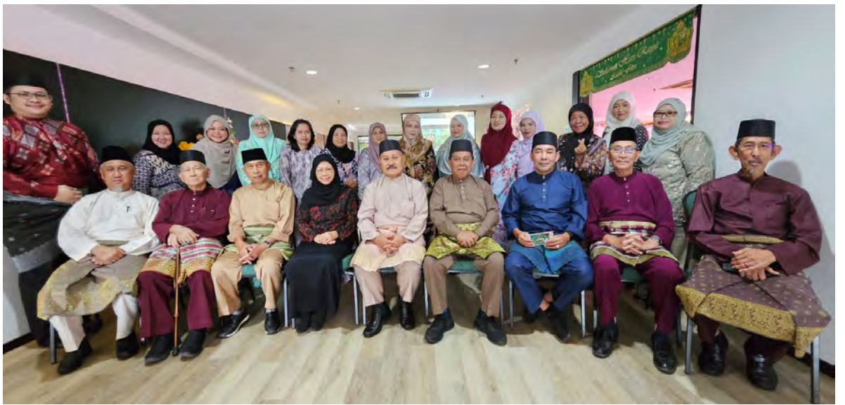
SUASANA pada Sambutan Hari Raya bagi tahun 2026 anjuran Persekutuan Guru-Guru Melayu Brunei (PGGMB) (atas, kiri dan bawah kiri).

Melayu Brunei (PGGMB) juga tidak ketinggalan dalam mengadakan Sambutan Hari Raya bagi tahun 2026. Sambutan berkenaan bertujuan bagi menjalin dan mengeratkan silaturahmi dan meningkatkan budaya kerja yang cemerlang dalam kalangan para pegawai dan kakitangan di Ibu Pejabat PGGMB sebagai barisan hadapan persekutuan berkenaan.