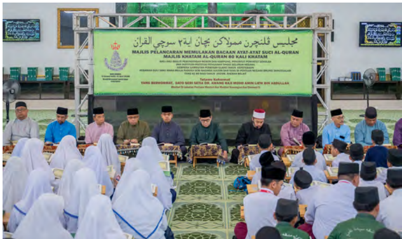
YANG Berhormat Menteri di Jabatan Perdana Menteri dan Menteri Kewangan dan Ekonomi II hadir selaku tetamu kehormat pada majlis tersebut.

BELAIT , Khamis, 2 April. - Majlis Pelancaran Memulakan Bacaan Ayat-ayat Suci Al-Quran bagi Majlis Khatam Al-Quran 80 Kali Khatam Ahli-ahli Majlis Perundingan Mukim dan Kampung, Penuntut-penuntut Sekolah dan Institusi-institusi Pengajian Tinggi Seluruh Negara Sempena Sambutan Perayaan Ulang Tahun Keputeraan Kebawah Duli Yang Maha Mulia Paduka Seri Baginda Sultan Haji Hassanal Bolkiah Mu'izzaddin Waddaulah ibni Al-Marhum Sultan Haji Omar 'Ali Saifuddien Sa'adul Khairi Waddien, Sultan dan Yang