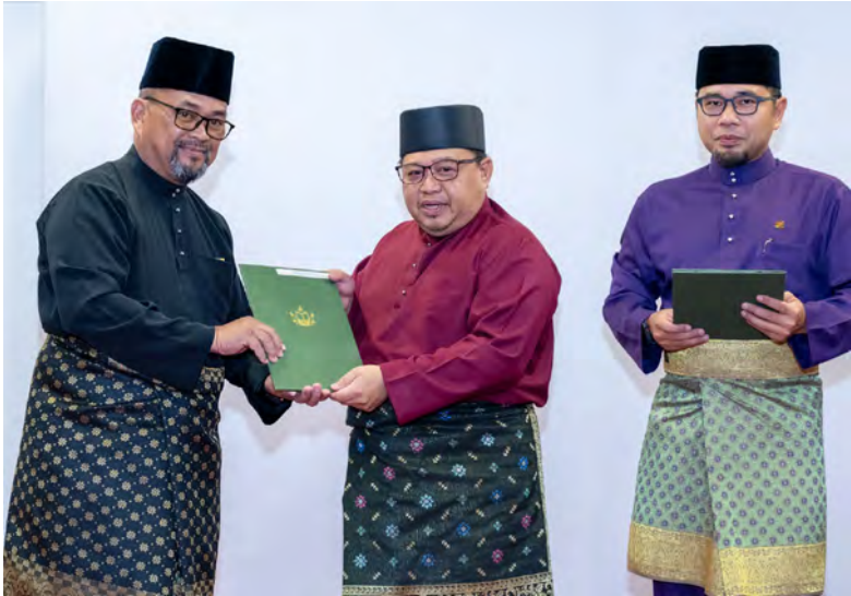
SETIAUSAHA Tetap (Perbandaran dan Daerah), Kementerian Hal Ehwal Dalam Negeri semasa menyampaikan sijil lantikan kepada salah seorang penerima (atas). Manakala gambar atas kanan, bacaan ikrar dari penghulu-penghulu mukim dan ketua-ketua kampung yang diraikan.

BERAKAS , Rabu, 1 April. - Peranan penghulu - penghulu mukim dan ketua-ketua kampung pada hari ini telah berubah dengan jelas iaitu selari dengan perubahan Skim Perkhidmatan Penghulu Mukim dan Ketua Kampung yang telah dikuatkuasakan.