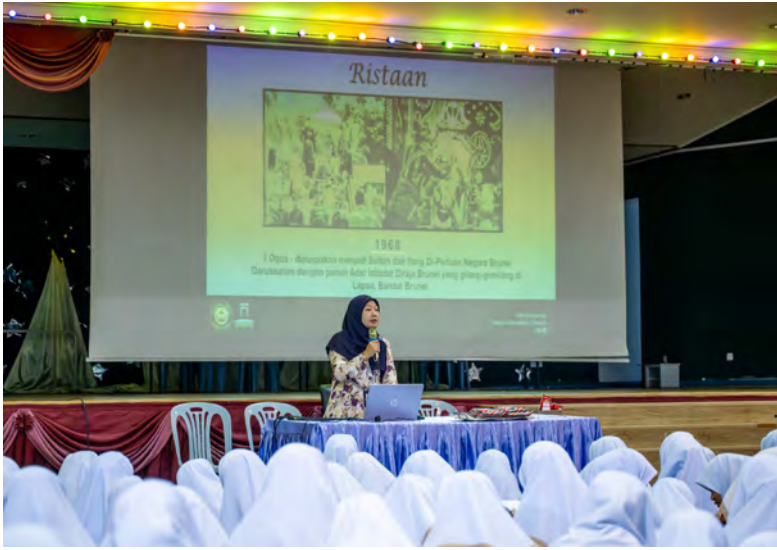
PROGRAM Taklimat Kenegaraan berkenaan anjuran Jabatan Penerangan yang diadakan di dewan Sekolah Menengah Sultan Sharif Ali (atas dan bawah kanan). Manakala gambar atas kanan, para penuntut semasa menyertai Kuiz Kenegaraan.

Oleh : Hajah Siti Zuraiyah Haji Awang Sulaiman