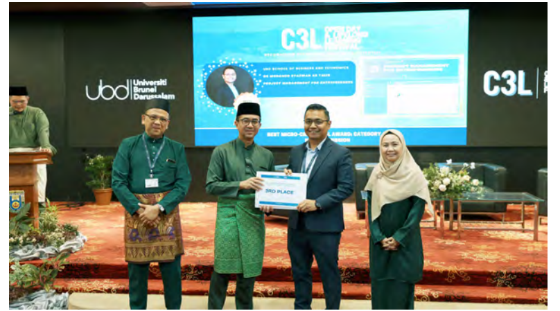
NAIB Canselor UBD hadir selaku tetamu kehormat majlis serta menyempurnakan penyampaian Best-Micro Credential Awards untuk kategori baharu dan sedia ada (atas dan bawah kiri).

"Sejak 2024, melalui inisiatif yang diketuai oleh C3L dan Pusat Inovasi dalam Pengajaran dan Pembelajaran (InTELECT), lebih daripada 200 ahli akademik dari UBD dan institusi pengajian tinggi lain di seluruh NBD telah menyertai latihan khusus mengenai reka bentuk, penyampaian