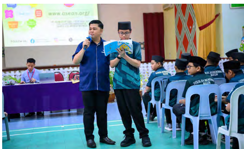
Oleh : Pg. Siti Redzaimi Pg. Haji Ahmad

Ini penting dalam melahirkan generasi pewaris yang berperanan aktif dalam memacu hala tuju negara pada masa hadapan.