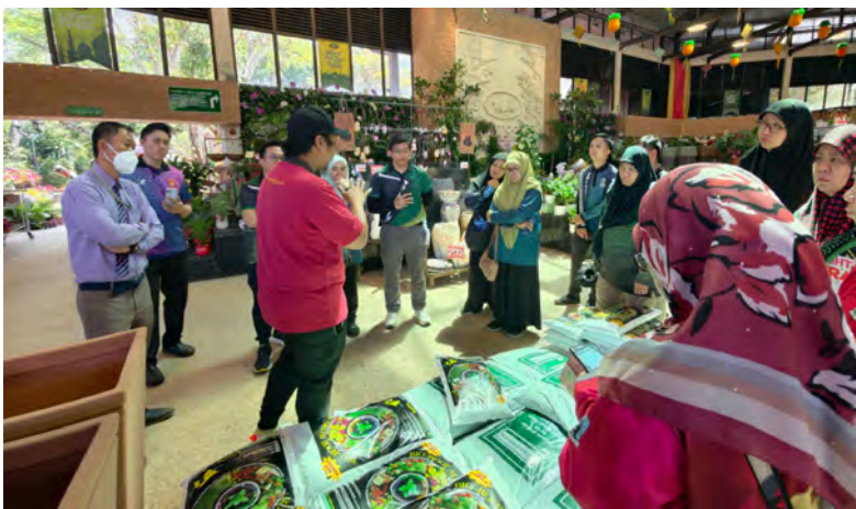
SEKITAR Lawatan Kerja dan Pendidikan ke Rimba Garden Central (atas dan kanan).

Berita dan Foto : Ihsan Abdul Aziz Pandin