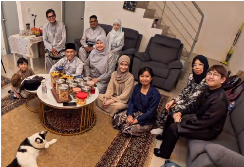
Oleh : Pg. Syi'aruddin Pg. Dauddin

BANDAR SERI BEGAWAN , Rabu, 1 April. - Bagi kita di Negara Brunei Darussalam (NBD), Hari Raya Aidilfitri bukan sahaja tentang baju raya baharu atau kuih-muih raya, lebih daripada itu, ia adalah saat untuk kita kembali kepada fitrah.