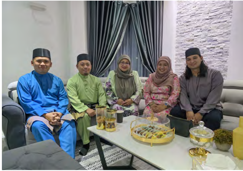
MENGANJURKAN rumah terbuka sempena Hari Raya Aidilfitri memerlukan persiapan awal dan rapi. Dengan perancangan yang bijak dan kerjasama semua pihak, rumah terbuka dapat dilaksanakan dengan jayanya serta meninggalkan kenangan manis kepada tuan rumah dan para tetamu yang datang.

"Keinginan untuk memberikan yang terbaik kepada para tamu yang datang kadangkala menyebabkan kepada pembelian yang di luar kemampuan diri