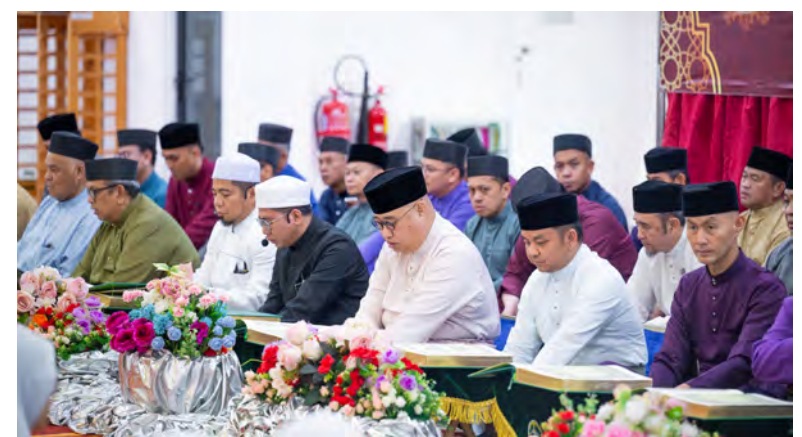
YANG Berhormat Menteri Kebudayaan, Belia dan Sukan hadir selaku tetamu kehormat majlis bagi Daerah Tutong (atas). Sementara gambar bawah kiri, sebahagian yang hadir pada majlis tersebut yang diadakan di Masjid Hassanalk Bolkiah, Pekan Tutong.

Oleh : Pg. Vivv Malessa Pg. Ibrahim