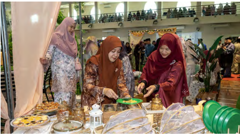
PEMANGKU Timbalan Rektor (Hal Ehwal Akademik), Universiti Islam Sultan Sharif Ali hadir selaku tetamu khas pada Program Hayya Ilal 'Arabiyyah di SUAMPRIPAHS (atas dan atas kanan).

Oleh : Pg. Syi'aruddin Pg. Daudin