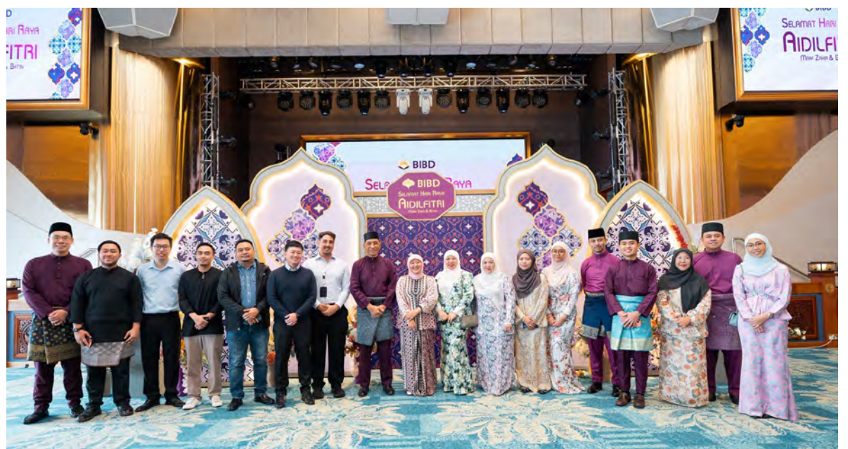
SUASANA pada Acara Gema Syawal anjuran Bank Islam Brunei Darussalam Berhad yang berlangsung di V-Plaza Hotel, Daerah Belait (atas kiri dan atas kanan).

BELAIT , Jumaat, 3 April. - Bank Islam Brunei Darussalam Berhad (BIBD) baru-baru ini menganjurkan sambutan Hari Raya tahunannya di Daerah Belait, sekali gus mengesahkan komitmen bank untuk memupuk dan mengekalkan hubungan yang kukuh dengan pihak berkepentingan yang dihargai di seluruh Negara Brunei Darussalam (NBD).