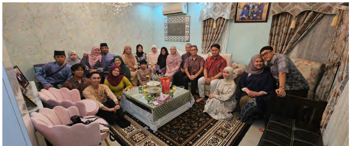
AIDILFITRI memberi ruang untuk meminta maaf dan memberi maaf, selain membuka pintu hubungan yang sempit renggang, apatah lagi dalam masyarakat kita yang menjunjung tinggi adat.

Aidilfitri memberi ruang untuk membersihkannya, dengan meminta maaf dan memberi maaf berkenaan, boleh mendatangkan