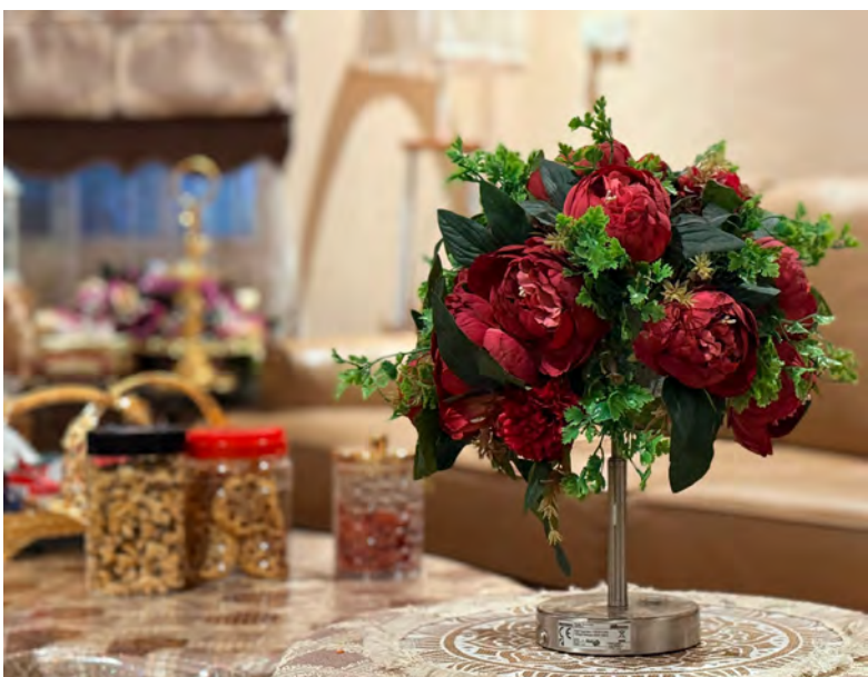
SUSUNAN bunga yang disimpan di atas meja ruang tamu atau sudut tertentu, mampu menjadi titik tumpu yang menarik perhatian para tetamu.

TUTONG , Rabu, 1 April. - Hiasan tanaman dan bunga merupakan salah satu unsur utama dalam menyerikan ruang tamu dan halaman rumah. Kehadiran unsur