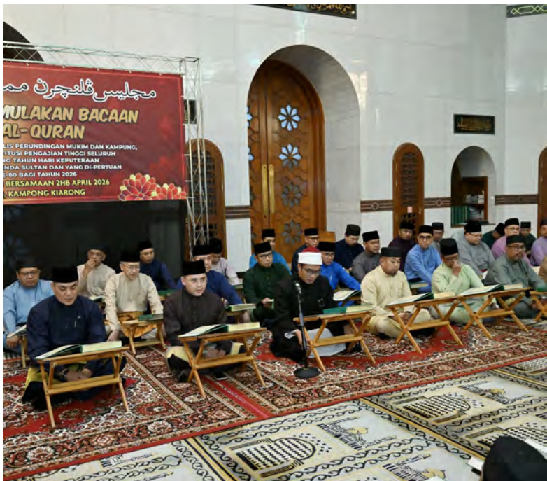
SEKITAR Majlis Khatam Al-Quran 80 Kali Khatam Ahli-ahli Majlis Perundingan Mukim dan Kampung, Penuntut-penuntut Sekolah dan Institusi-institusi Pengajian Tinggi Seluruh Negara yang berlangsung di Jame' 'Asr Hassanil Bolkiah, Kampung Kiarong, Bandar Seri Begawan (atas dan kanan).

Juga hadir, Setiausaha Setiausaha Tetap, Timbalan-timbalan Setiausaha Tetap, ketua-ketua jabatan, pegawai-pegawai daerah dan Ahli-ahli Jawatankuasa Kebangsaan Sambutan Perayaan Ulang Tahun Hari Keputeraan Kebawah Duli Yang Maha Mulia Yang Ke-80 Bagi Tahun 2026, penghulu-penghulu mukim, ketua-ketua kampung, pemangku-pemangku penghulu mukim, pemangku-pemangku ketua-ketua kampung, Ahli-ahli Majlis Perundingan Mukim dan Kampung serta pegawai - pegawai dan kakitangan jabatan - jabatan daerah, pegawai-pegawai hal ehwal masjid, ahli-ahli Takmir Masjid dan anak-anak buah kampung.