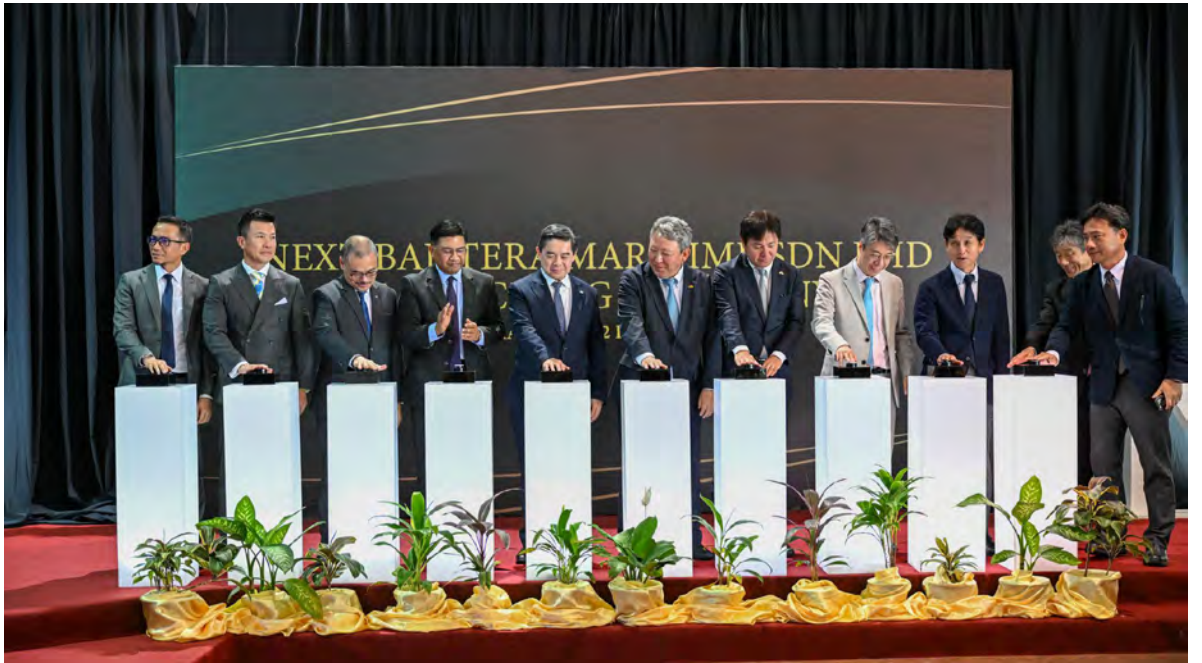
YANG Berhormat Menteri di Jabatan Perdana Menteri dan Menteri Kewangan dan Ekonomi II semasa hadir pada Majlis Pelancaran NEXT Bahtera Maritime Sendirian Berhad, bertempat di Pusat Pelabuhan Muara, Muara Port Company (MPC) dan seterusnya menyampaikan ucapan (atas dan atas kiri).

"Sesebuah visi bernilai apabila dilaksanakan dengan berkesan. Oleh itu, saya berasa amat berbesar hati apabila dimaklumkan bahawa NEXT Bahtera Maritime telah membuktikan keupayaannya dengan kejayaan menghantar sebanyak 833 kargo sejak