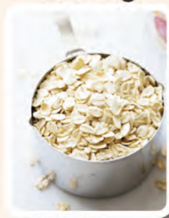
1/2 cawan Amping