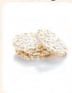
3 keping Kraker Beras