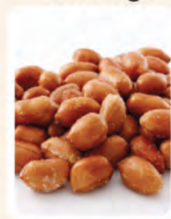
Segenggam Kacang Tanah (Salted)