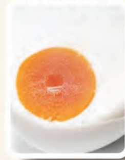
Sebiji Telur Masin