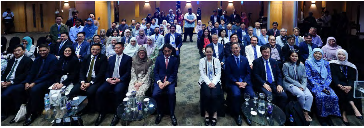
SETIAUSAHA Tetap Kementerian Kewangan dan Ekonomi bergambar ramai semasa forum tersebut.