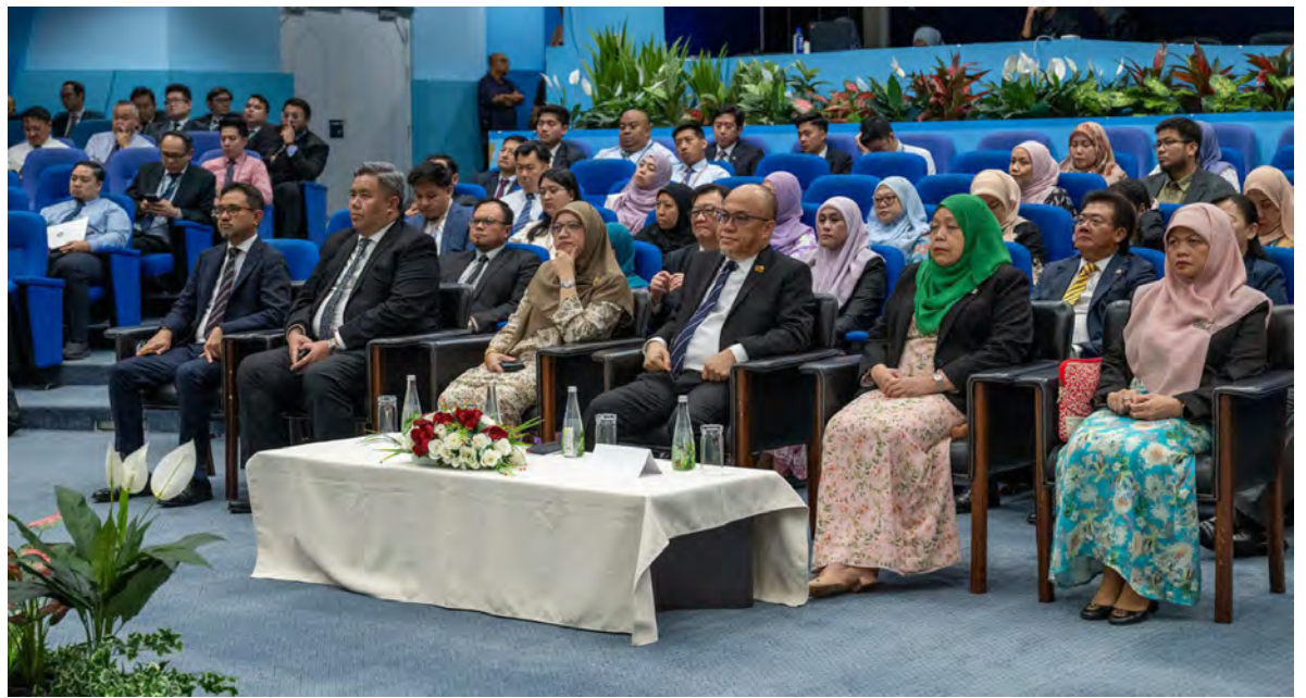
YANG Berhormat Menteri Sumber-Sumber Utama dan Pelancongan juga selaku Pengerusi Lembaga Pengarah Brunei Darussalam Central Bank (BDCB) hadir selaku tetamu kehormat dan berucap pada Economic and Investments Outlook 2026 yang berlangsung di Dewan Teater, Kementerian Kewangan dan Ekonomi (atas dan atas kiri).

"Oleh itu, penerapan teknologi baharu secara bertanggungjawab dan tadbir urus yang baik kekal kritikal. Sehubungan dengan itu, BDCB terus menggalakkan amalan yang mantap melalui penglibatan kawal selia, dialog industri dan pembangunan keupayaan