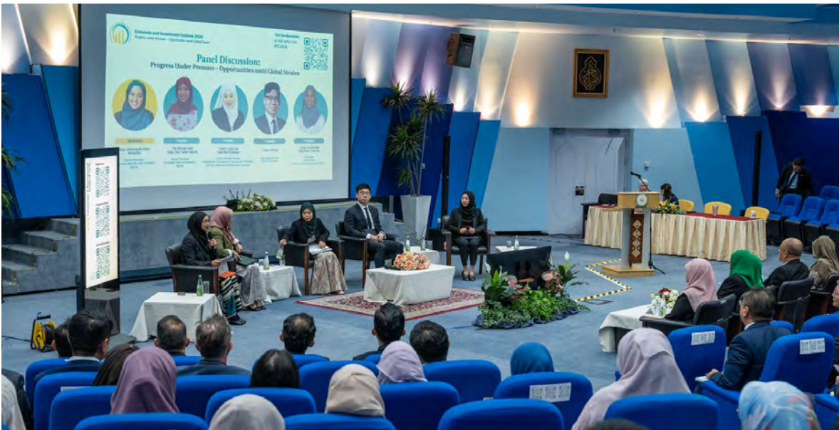
YANG Berhormat Menteri Sumber-Sumber Utama dan Pelancongan juga selaku Pengerusi Lembaga Pengarah Brunei Darussalam Central Bank (BDCB) hadir selaku tetamu kehormat pada majlis berkenaan (atas), manakala gambar atas kanan, sebahagian yang hadir pada Economic and Investment Outlook 2026.

BERAKAS, Isnin, 2 Februari. - Kira-kira 150 peserta daripada pelbagai organisasi, termasuk jabatan dan bahagian di bawah Kementerian Kewangan dan Ekonomi (MOFE), agensi-agensi kerajaan, institusi-institusi kewangan, serta institusi-institusi pengajian tinggi tempatan menghadiri Economic and Investment Outlook 2026 anjuran Brunei Darussalam Central Bank (BDCB).