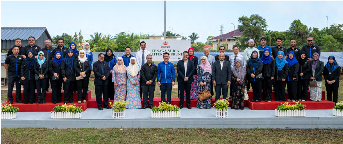
SETIAUSAHA Tetap (Pengajian Tinggi), Kementerian Pendidikan selaku Ahli Lembaga Pengelola Politeknik Brunei ketika bergambar ramai semasa Majlis Pelancaran Tenaga Surya dan Model Teras Baharu Green and Digital Literacy for Sustainability dan seterusnya meninjau lebih dekat kemudahan-kemudahan tersebut (atas dan kanan).

BELAIT , Selasa, 3 Februari. - Politeknik Brunei (PB) telah mengadakan Majlis Pelancaran Tenaga Surya dan Modul Teras Baharu Green and Digital Literacy for Sustainability, pagi tadi di Kampus Lumut, Politeknik Brunei, di sini.