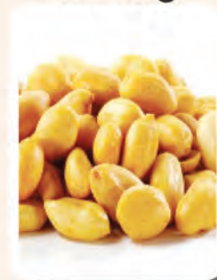
Segenggam Kacang Tanah (Unsalted)