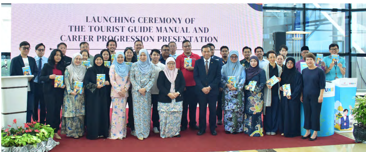
SETIAUSAHA Tetap Kementerian Sumber-Sumber Utama dan Pelancongan ketika bergambar ramai bersama para peserta.

BANDAR SERI BEGAWAN, Isnin, 2 Februari. - Kementerian Sumber-Sumber Utama dan Pelancongan (KSSUP) melalui Jabatan Kemajuan Pelancongan (JKP) hari ini melancarkan Manual Panduan Pelancong dan Majlis Penyampaian Perkembangan Kerjaya di Mutiara Hall, Mutiara Exchange, di sini.