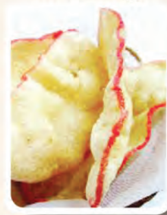
1 bungkus kecil Keropok Udang Tempatan