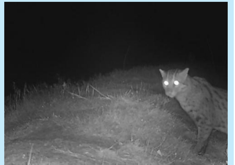
FOTO yang diambil menggunakan perangkap kamera pada pertengahan tahun 2025 ini menunjukkan seekor Fishing Cat di hutan yang banjir di wilayah Pursat, Kemboja.

Penemuan sedemikian merupakan bukti penting bukan sahaja untuk menonjolkan kembalinya spesies biodiversiti dalam kawasan perlindungan di Kemboja tetapi juga untuk mengesahkan keberkesanan dasar negara Kemboja untuk memulihara, mengurus dan membangunkan alam sekitar dan sumber asli, kata Menteri Alam Sekitar Eang Sophalleth. - ©XINHUA.