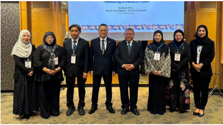
PROGRAM Pertukaran Pengetahuan Kehakiman tersebut menghimpunkan para hakim dari Negara-negara Anggota ASEAN yang mempunyai pengalaman semasa atau terdahulu dalam mengendalikan kes-kes pemerdagangan orang (atas dan bawah kanan).

BANDAR SERI BEGAWAN, Selasa, 3 Februari. - The ASEAN Multilateral Judicial Knowledge Exchange on Victim-Sensitive Adjudication of Trafficking in Persons Cases (Pertukaran Pengetahuan Kehakiman Multilateral ASEAN mengenai Pengadilan Sensitif terhadap Mangsa dalam bagi Kes Pemerdagangan Orang) telah dibuka secara rasmi pagi tadi, bertempat di Mutiara Ballroom, Hotel Radisson, di ibu negara.