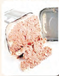
3 sudu makan Corned Beef