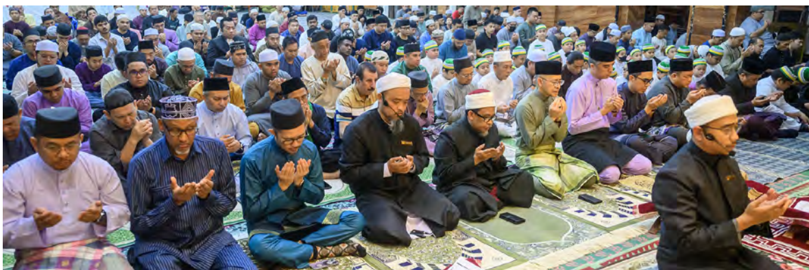
SETIAUSAHA Tetap, Kementerian Hal Ehwal Ugama ketika hadir dalam sama-sama mengimarahkan lagi Malam Nisfu Syaaban yang diadakan di Masjid Omar 'Ali Saifuddin.

Oleh : Muhamad Khairul Hisyam Haji Jaya