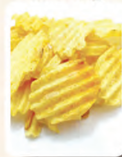
1 bungkus kecil Keropok Ubi Kentang