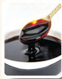
1 sudu makan Kicap