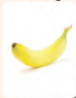
Sebiji ukuran sederhana Pisang

Bagi mengekalkan kesihatan yang baik, adalah disyorkan untuk mengambil kurang dari satu sudu teh garam (5 gram garam atau 2000 miligram sodium) sehari