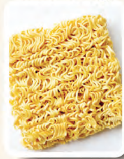
1 bungkus Mee Segera