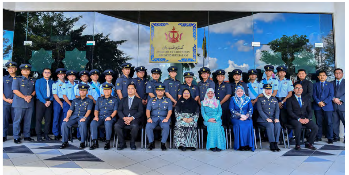
SETIAUSAHA Tetap (Pendidikan Teras), Kementerian Pendidikan hadir selaku tetamu kehormat dan seterusnya bergambar ramai bersama 20 peserta yang menamatkan Program Latihan Khas Instructor Development Training bagi Tentera Udara Diraja Brunei (kiri dan atas).

Majlis pada petang tadi turut diisikan dengan tayangan video yang memaparkan perjalanan program serta refleksi para peserta terhadap kemahiran dan pengetahuan transformasi yang diperoleh sepanjang latihan.