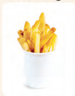
1 cawan Kentang Goreng