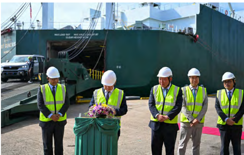
MAJLIS Pelancaran yang berlangsung di Pusat Pelabuhan Muara, Muara Port Company (MPC) berkenaan dirasmikan oleh Yang Berhormat Menteri di Jabatan Perdana Menteri dan Menteri Kewangan dan Ekonomi II. Hadir sama, Yang Berhormat Menteri Pengangkutan dan Infokomunikasi (atas), manakala gambar bawah kanan, antara yang hadir pada majlis berkenaan.

MUARA , Isnin, 2 Februari. - Hari ini menyaksikan satu pencapaian penting dalam pembangunan industri logistik di Negara Brunei Darussalam (NBD) apabila NEXT Bahtera Maritime Sendirian Berhad (NBM), iaitu sebuah syarikat usaha sama baharu di NBD di antara Bahagian Pelabuhan di Kementerian Kewangan dan Ekonomi melalui Dana Modal Pembangunan Strategik dan Network Cross Trade Line Limited (NEXT), mengumumkan pelancaran perkhidmatan baharu ke NBD yang menghubungkan Pelabuhan Muara dengan