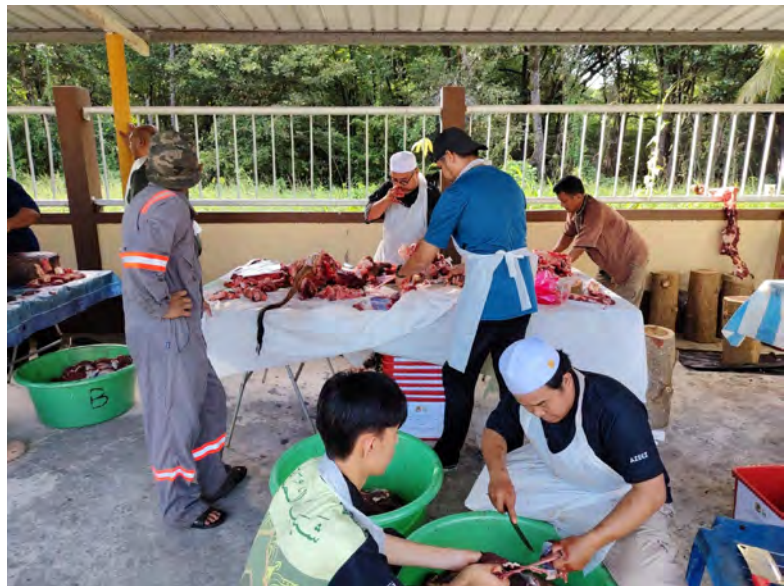
SEBAHAGIAN yang hadir pada Majlis Ibadah Korban Kampung Sungai Besar.