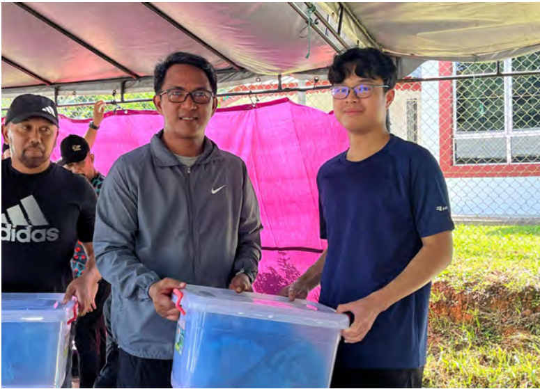
YANG Berhormat Ahli Majlis Mesyuarat Negara, Ketua Kampung Putat menyempurnakan penyerahan agihan daging korban kepada para penerima (atas). Manakala gambar kanan, antara yang hadir pada majlis tersebut.

KAMPUNG PUTAT , Isnin, 1 Jun. - Ahli Jawatankuasa Kerja Takmir (AJKT) Masjid Kampung Putat dengan sokongan Majlis Perundingan Kampung (MPK) Kampung Putat telah menganjurkan Majlis Ibadah