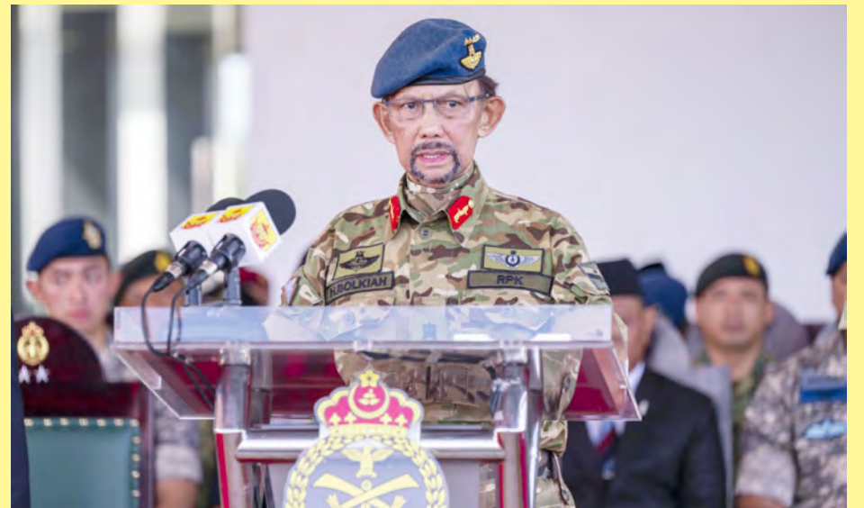
KEBAWAH Duli Yang Maha Mulia Paduka Seri Baginda Sultan Haji Hassanal Bolkiah Mu'izzaddin Waddaulah ibni Al-Marhum Sultan Haji Omar 'Ali Saifuddien Sa'adul Khairi Waddien, Sultan dan Yang Di-Pertuan Negara Brunei Darussalam berkenan mengurniakan titah pada Sambutan Hari Ulang Tahun Angkatan Bersenjata Diraja Brunei Ke-65 pada Ahad, 31 Mei 2026, bertempat di Padang Kawad, Pangkalan Tentera Udara Rimba, Tentera Udara Diraja Brunei.

Selaras dengan pendekatan pertahanan yang komprehensif dari sudut Diplomasi Pertahanan pada tahun ini yang amat signifikan dengan Sambutan Jubli Emas ialah hubungan pertahanan di antara ABDB dengan Angkatan Bersenjata Republik Singapura. Dalam hal ini, beta sukacita mengambil maklum beberapa aktiviti dua hala telah dan akan dilaksanakan secara bersepadu oleh ABDB bersama Angkatan Bersenjata Republik Singapura sebagai acara kemuncak. Pada masa yang sama