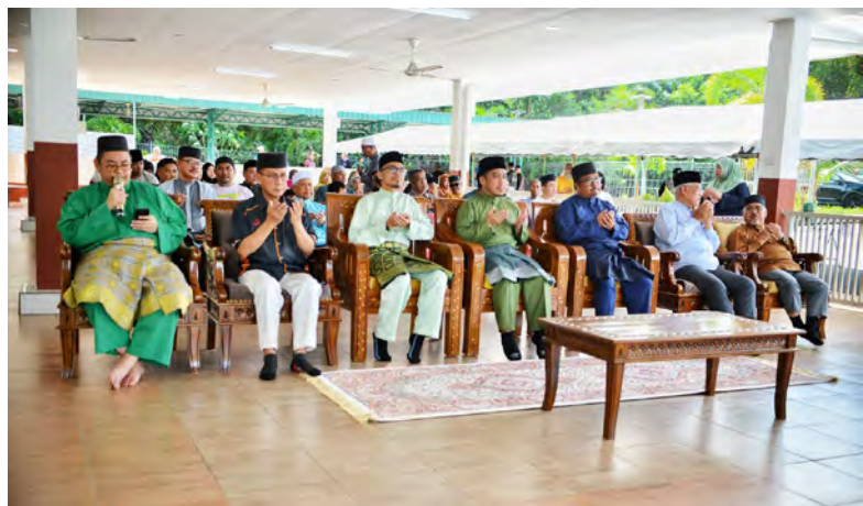
SEKITAR Majlis Pengagihan Daging Ibadah Korban sempena Hari Raya Aidiladha bagi Tahun 1447 Hijrah yang berlangsung di kawasan Masjid Pengiran Muda 'Abdul Malik (kiri dan gambar-gambar bawah kiri).

TUNGKU KATOK, Isnin, 1 Jun. - Majlis Perundingan Kampung (MPK) Tungku Katok bersama Masjid Pengiran Muda 'Abdul Malik, Kampung Tungku, baru-baru ini telah mengadakan Majlis Pengagihan Daging Ibadah Korban sempena Hari Raya Aidiladha bagi Tahun 1447 Hijrah, yang berlangsung di kawasan masjid berkenaan.