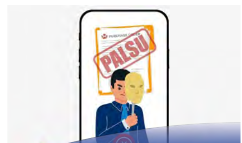
SEMAK kesahihan maklumat sebelum dikongsi