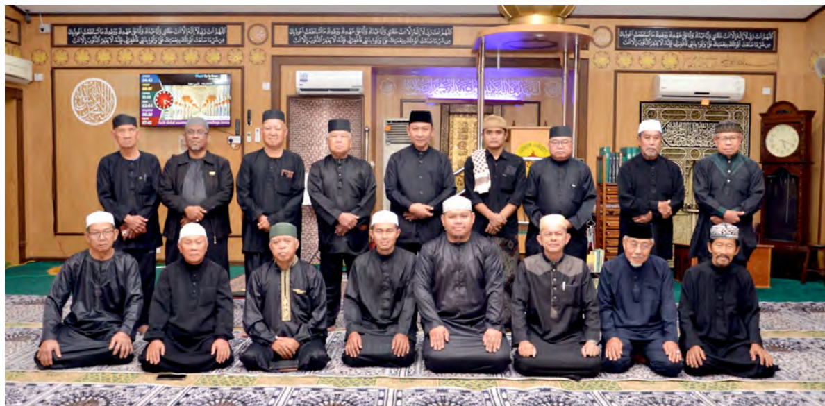
KAMPUNG SUNGAI BESAR, Isnin, 1 Jun. - Penghayatan dan pembacaan Al-Quran perlu diterjemahkan dalam kehidupan

harian sebagai panduan yang mampu membentuk peribadi dan amalan yang lebih baik. Penasihat I Ahli Jawatankuasa