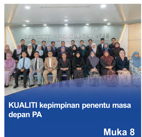
KUALITI kepimpinan penentu masa depan PA