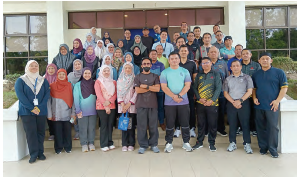
SESI bergambar ramai pada Program Lakastah Bersedia yang diadakan selama dua hari bermula pada 25 Mei 2026 hingga 26 Mei 2026.

Program berkenaan turut menekankan kepentingan menetapkan matlamat pendapatan persaraan serta mengambil tindakan awal bagi mengekalkan gaya hidup yang selesa semasa bersara nanti.