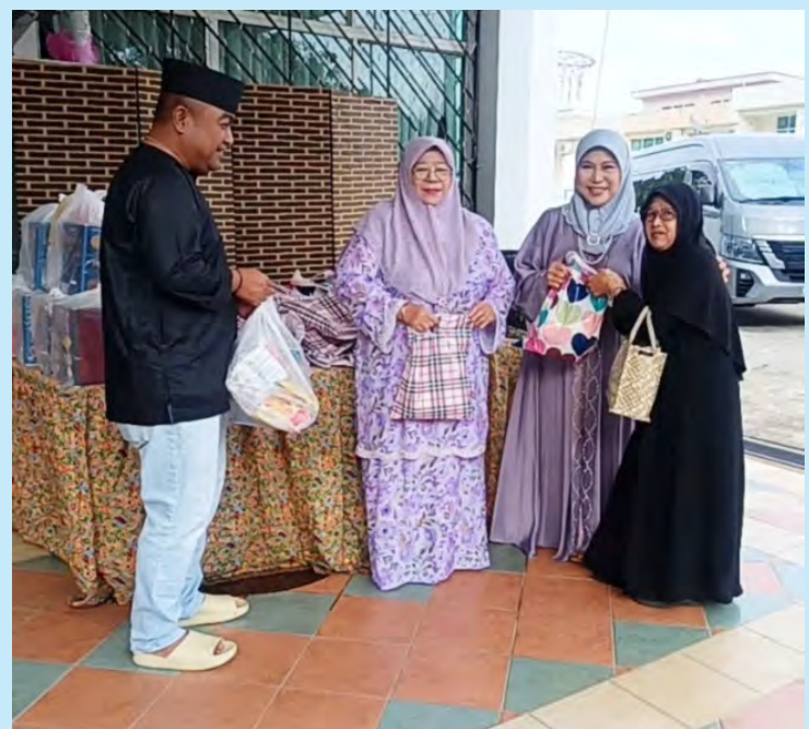
PROGRAM berkenaan menjadi salah satu inisiatif kebajikan bagi membantu golongan yang memerlukan selain menghayati nilai pengorbanan, keprihatinan serta amalan berkongsi rezeki yang menjadi tuntutan agama Islam.

Melalui sumbangan yang dihulurkan, para penganjur berharap ia dapat membantu meringankan beban penerima dalam menyambut Aidiladha, di samping mengeratkan hubungan silaturahim dan memupuk semangat kemasyarakatan dalam kalangan masyarakat.