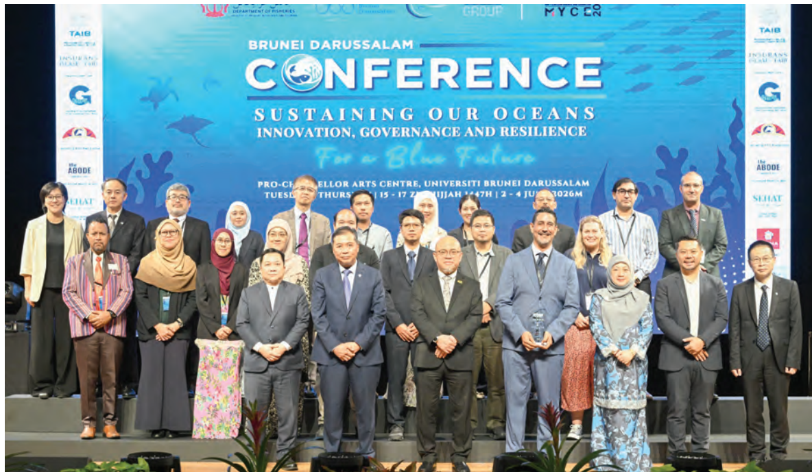
Oleh: Khartini Hamir