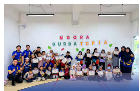
PROGRAM interaktif kenalkan konsep ibadah korban