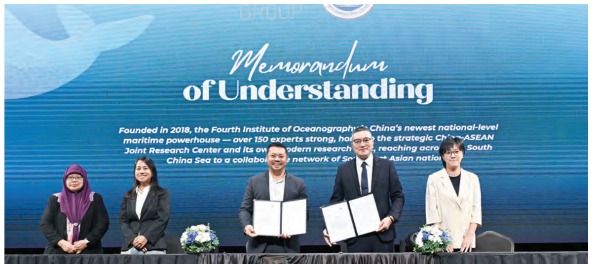
SETIAUSAHA Tetap, Kementerian Sumber-Sumber Utama dan Pelancongan semasa hadir dan berucap pada Ocean Week Brunei 2026 di Pusat Kesenian Pro-Canselor, Universiti Brunei Darussalam (atas dan kiri).

Program berkenaan menghimpunkan pelbagai pihak termasuk agensi kerajaan, pemain industri, para penyelidik, institusi pendidikan, golongan belia, kumpulan pemuliharaan, sektor perniagaan, rakan antarabangsa, serta orang ramai bagi meneroka potensi lautan negara dalam menyokong kelestarian,