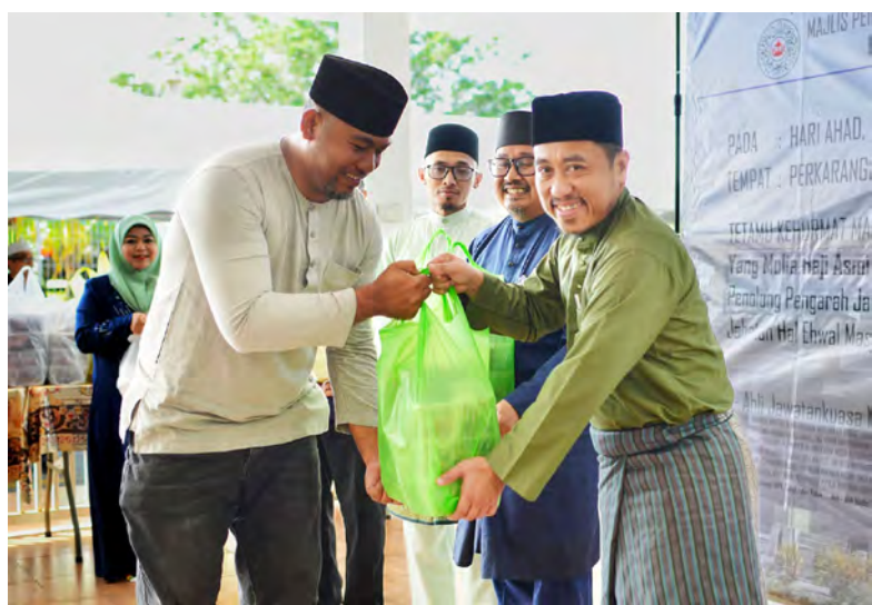
Oleh : Siti Rokiah Abdullah

Melalui pengagihan daging korban ini, diharapkan ia dapat meringankan beban penerima di samping menyemarakkan lagi penghayatan terhadap nilai-nilai pengorbanan, keprihatinan dan perkongsian rezeki yang menjadi inti pati sambutan Hari Raya Aidiladha.