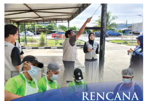
KESEDARAN sivik platform kesejahteraan awam