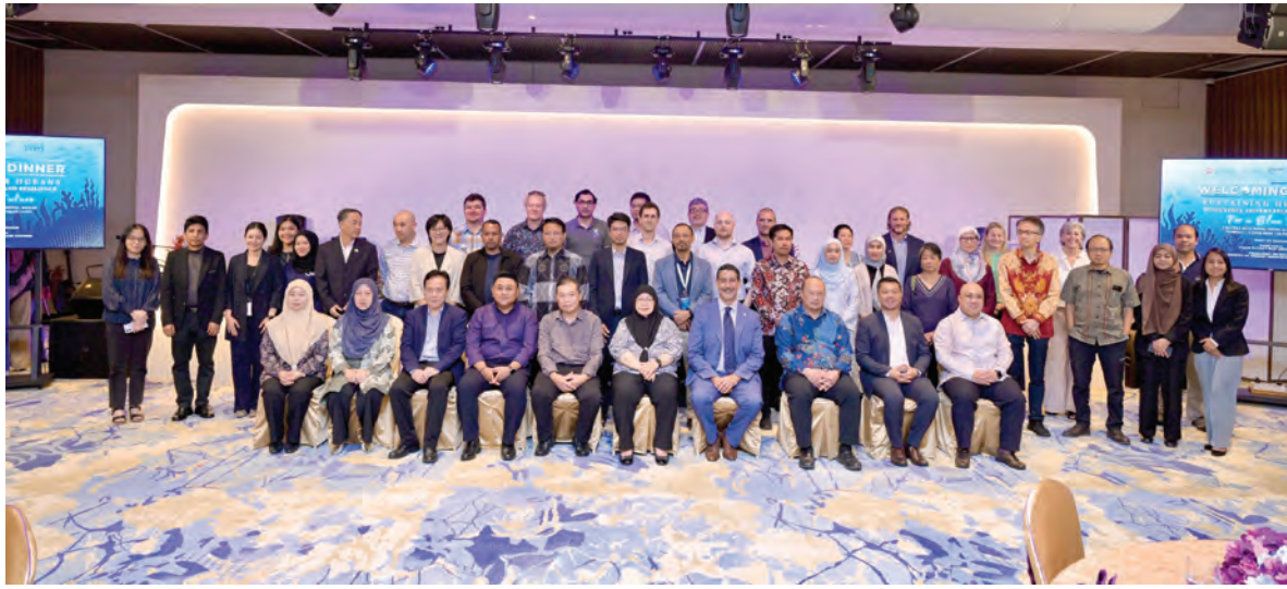
SETIAUSAHA Tetap, Kementerian Sumber-Sumber Utama dan Pelancongan hadir selaku tetamu kehormat Majlis Makan Malam Rasmi dan seterusnya bergambar ramai.