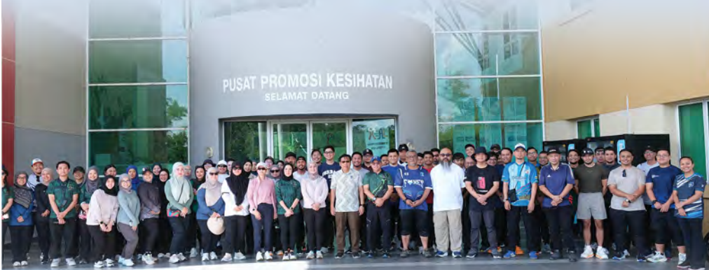
YANG Mulia Timbalan Menteri (Sekuriti dan Undang-Undang) di Jabatan Perdana Menteri selaku Pengerusi Lembaga Pengarah SHENA semasa sesi bergambar ramai.

Melalui inisiatif seumpama berkenaan, SHENA kekal komited dalam menyokong usaha-usaha kebangsaan bagi memperkukuh amalan keselamatan dan kesihatan pekerja, seterusnya menyumbang ke arah persekitaran kerja yang lebih selamat, sihat dan berdaya tahan di Negara Brunei Darussalam.