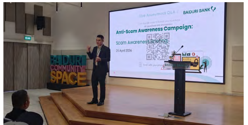
ANTARA yang menyampaikan pembentangnya pada taklimat tersebut.

Orang ramai boleh melaporkan sebarang aktiviti mencurigakan melalui talian kecemasan 993.