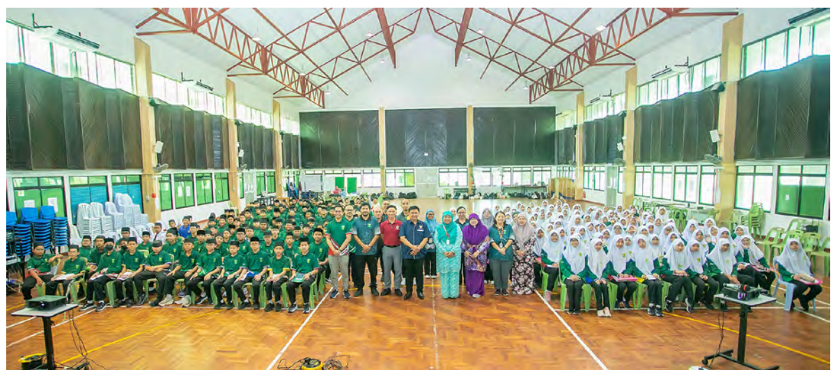
SERAMAI 218 pelajar Tahun 7 dan Tahun 8 Sekolah Menengah Sayyidina Ali menghadiri Jerayawara Kenali ASEAN yang diadakan di Dewan Serbaguna sekolah berkenaan (atas). Sementara gambar kiri, penyampaian hadiah disempurnakan oleh Timbalan Pengetua Pentadbiran sekolah berkenaan.

BELAIT , Khamis, 30 April. – Jabatan Penerangan, Jabatan Perdana Menteri, melalui Meja Hal Ehwal Antarabangsa, Unit Perhubungan Korporat, Bahagian Media dan Komunikasi Korporat selaku Sekretariat bagi Jawatankuasa Kecil Penerangan (SCI) ASEAN-COCI meneruskan lagi Jerayawara Kenali ASEAN untuk membarigakan serta memberikan pendedahan meluas mengenai maklumat asas