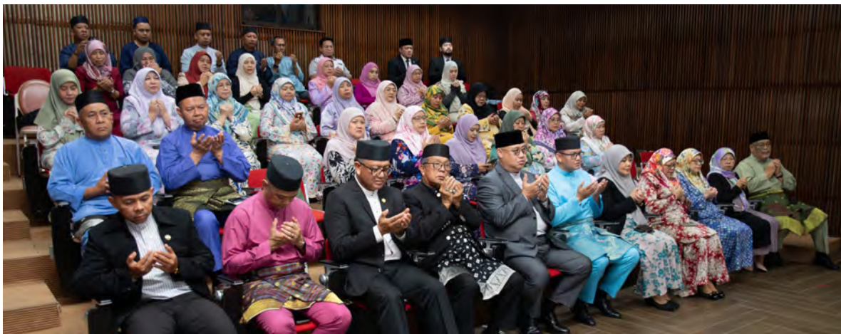
YANG Berhormat Menteri Kebudayaan, Belia dan Sukan hadir dan seterusnya menyempurnakan penyampaian sumbangan kepada bakal jemaah haji (atas dan kanan). Manakala gambar bawah kanan, acara dimulakan dengan bacaan Surah Al-Fatihah.