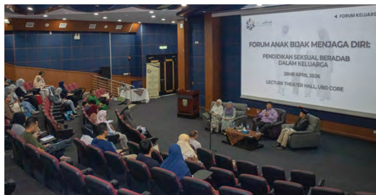
SEKITAR forum kekeluargaan berkenaan yang berlangsung di Lecture Theatre Hall, The Core, Universiti Brunei Darussalam.

Siaran Akhbar dan Foto : Persatuan Afiah