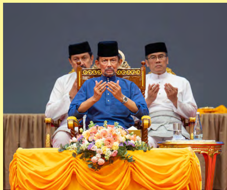
KEBAWAH Duli Yang Maha Mulia Paduka Seri Baginda Sultan dan Yang Di-Pertuan Negara Brunei Darussalam menadah tangan ketika Doa Selamat dibacakan (atas).