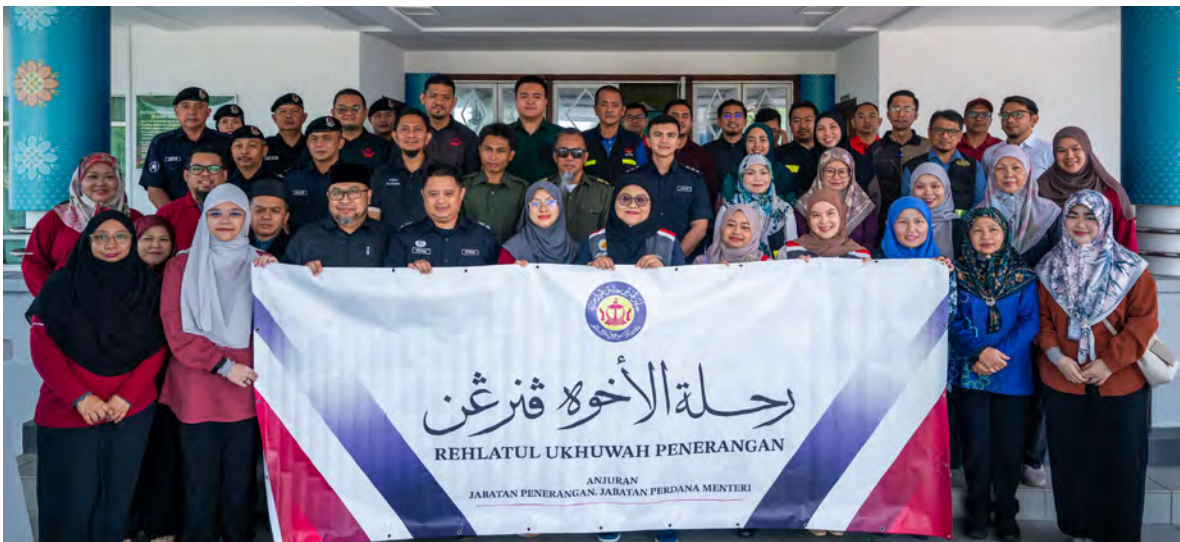
Oleh : Wan Mohamad Sahran Wan Ahmadi