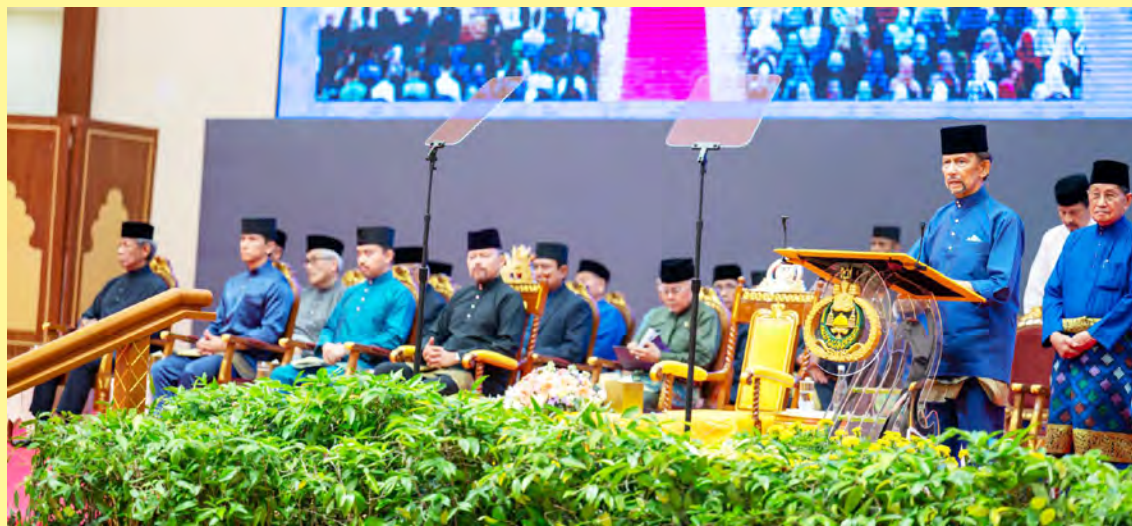
KEBAWAH Duli Yang Maha Mulia Paduka Seri Baginda Sultan Haji Hassanal Bolkiah Mu'izzaddin Waddaulah ibni Al-Marhum Sultan Haji Omar 'Ali Saifuddin Sa'adul Khairi Waddien, Sultan dan Yang Di-Pertuan Negara Brunei Darussalam berkenan mengurniakan titah pada Musabaqah Membaca Al-Quran Bahagian Dewasa Peringkat Akhir Kebangsaan bagi Tahun 1447 Hijrah / 2026 Masihi yang berlangsung di Dewan Plenary, Pusat Persidangan Antarabangsa, Berakas.

"Melalui skim ini, kanak-kanak akan diberi latihan dan bimbingan