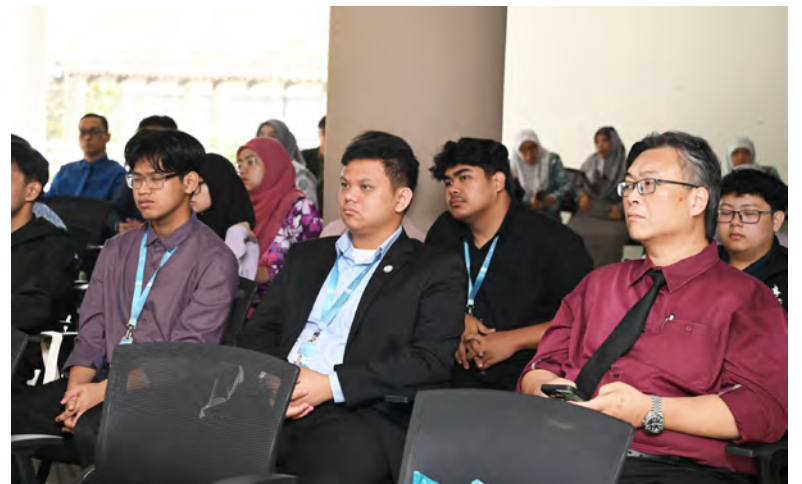
ANTARA yang hadir mendengarkan pembentangan tersebut.

Produk-produk ini merupakan alat carian khas untuk para penyelidik yang menggunakan Koleksi Bruneiana di perpustakaan.