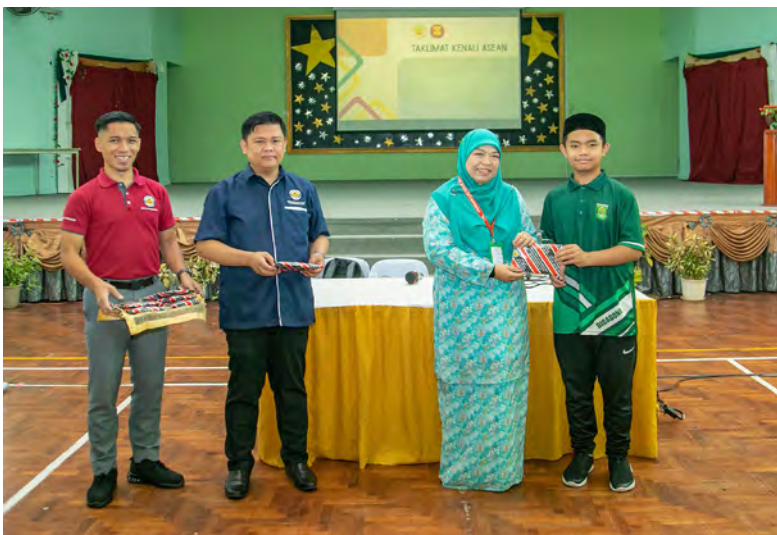
Siaran Akhbar : Jabatan Penerangan