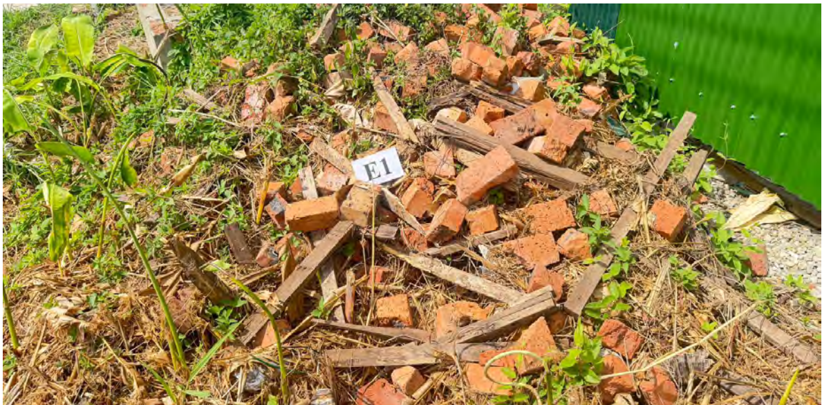
SEBUAH syarikat didapati melonggokkan sisa bahan binaan di kawasan tanah lapang di kawasan Kampung Masin, syarikat tersebut dikenakan kompaun sebanyak BND1,000.

Pihak jabatan juga ingin memohon kerjasama orang ramai untuk menyalurkan sebarang maklumat mengenai pembuangan sampah yang menyalahi undang-undang dengan menyertakan alamat lokasi berserta gambar-gambar melalui pesanan WhatsApp +673 8321581.