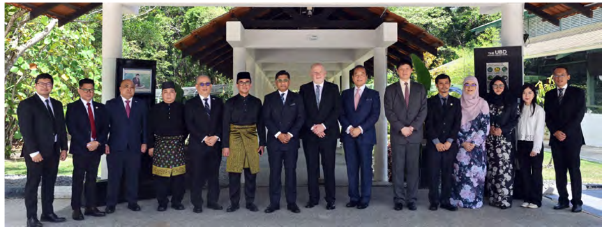
YANG Berhormat Menteri Pengangkutan dan Infokomunikasi hadir selaku tetamu kehormat pada Majlis Penandatanganan Memorandum Persefahaman (MoU) yang diadakan di UBD berkenaan (atas dan kiri).

Oleh : Nooratini Haji Abas