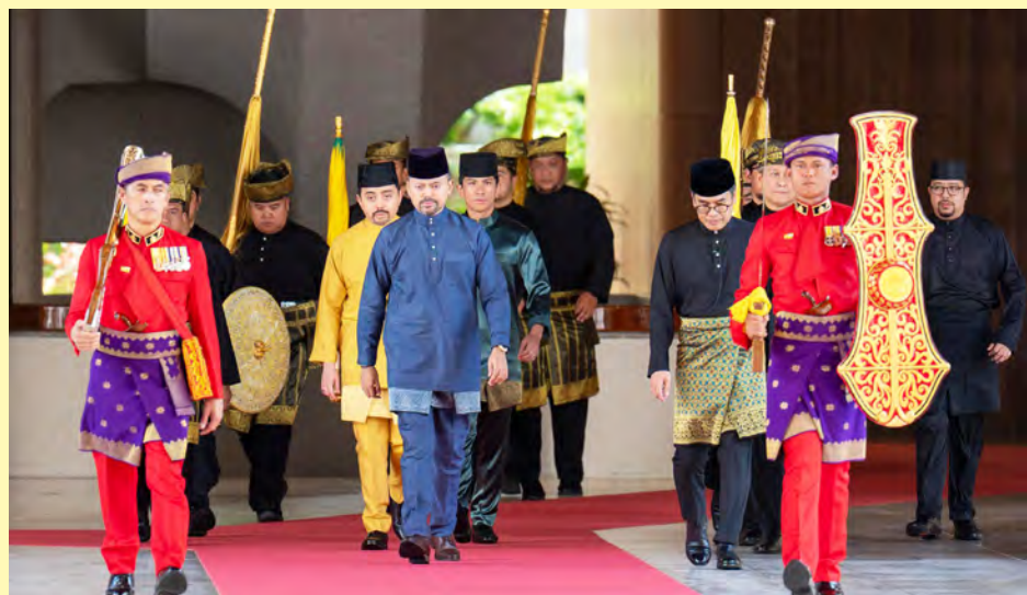
DULI Yang Teramat Mulia Paduka Seri Pengiran Muda Mahkota Pengiran Muda Haji Al-Muhtadee Billah ibni Kebawah Duli Yang Maha Mulia Paduka Seri Baginda Sultan Haji Hassanal Bolkiah Mu'izzaddin Waddaulah, Menteri Kanan di Jabatan Perdana Menteri selaku wakil peribadi Kebawah Duli Yang Maha Mulia Paduka Seri Baginda Sultan Haji Hassanal Bolkiah Mu'izzaddin Waddaulah ibni Al-Marhum Sultan Haji Omar 'Ali Saifuddien Sa'adul Khairi Waddien, Sultan dan Yang Di-Pertuan Negara Brunei Darussalam berkenan berangkat mengurniakan Pingat-pingat Kehormatan Negara. Berangkat sama, paduka-paduka adinda Duli Yang Teramat Mulia Paduka Seri Pengiran Muda Mahkota Pengiran Muda Haji Al-Muhtadee Billah (atas dan kanan).