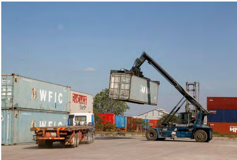
SEBUAH trak kren mengangkat sebuah kontena di Pelabuhan Kering Hong Leng Huor di pinggir bandar barat Phnom Penh, Kemboja.

PHNOM PENH, 1 Mei. - Pertumbuhan ekonomi Kemboja diunjurkan perlahan kepada 4.3 peratus pada 2026 daripada 5.3 peratus pada tahun sebelumnya,