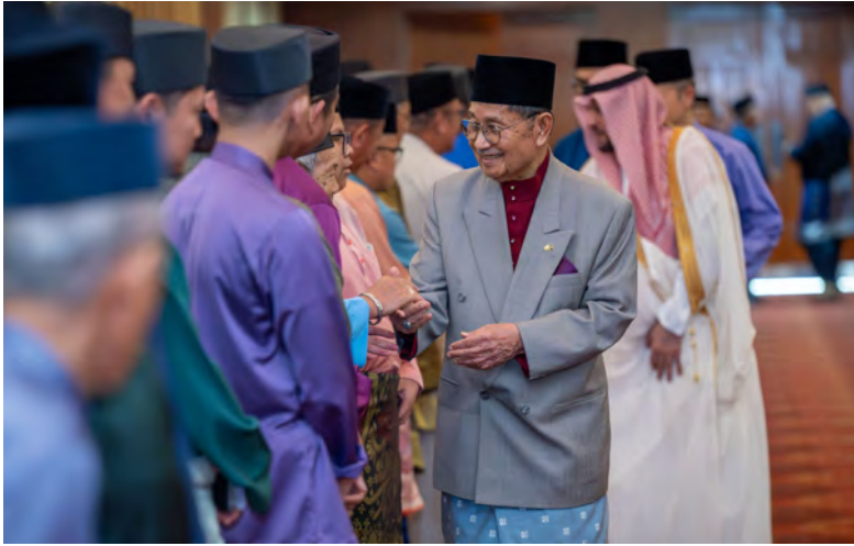
YANG Berhormat Menteri Hal Ehwal Ugama hadir selaku tetamu kehormat pada Majlis Doa Selamat dan Ramah Mesra Bersama Bakal-bakal Jemaah Haji Tahun 1447H / 2026M.

Oleh : Pg. Syi'aruddin Pg. Dauddin