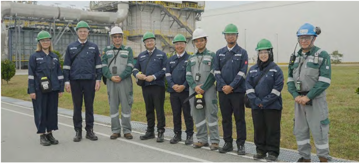
MENTERI Pendidikan dan Kerjasama Nordic Finland, His Excellency Anders Adlercreutz semasa mengadakan lawatan ke kilang BFI di Taman Perindustrian Sungai Liang, Daerah Belait.

BELAIT, Rabu, 29 April. - Brunei Fertilizer Industries Sendirian Berhad (BFI) mengalu-alukan kedatangan Menteri Pendidikan dan Kerjasama Nordic Finland, His Excellency Anders Adlercreutz, semasa lawatan ke kilang BFI di Taman Perindustrian Sungai Liang, Daerah Belait baru-baru ini.