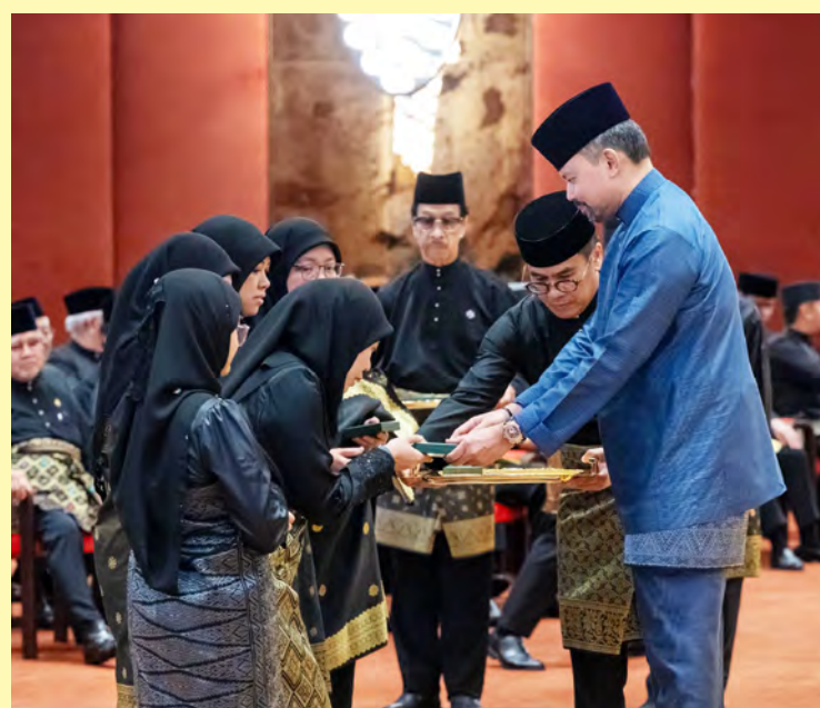
DULI Yang Teramat Mulia Paduka Seri Pengiran Muda Mahkota berkenan mengurniakan pingat kepada para penerima (atas sekali kiri, atas kiri dan atas kanan). Manakala gambar bawah kiri, Doa Selamat dibacakan oleh Yang Berhormat Ketua Hakim Syarie.