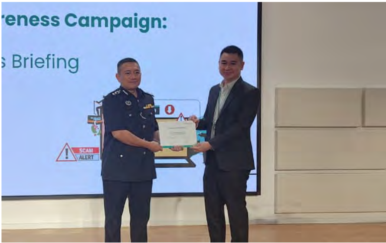
SUASANA pada taklimat berkenaan yang diadakan di Ibu Pejabat Baiduri Bank, One Riverside, Gadong (atas dan kanan).