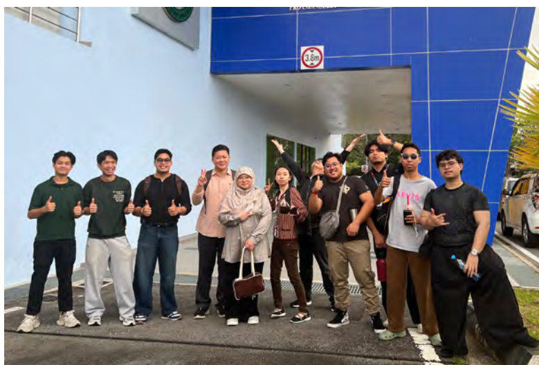
Siaran Akhbar dan Foto : Universiti Brunei Darussalam

BANDAR SERI BEGAWAN, Khamis, 30 April. - Universiti Brunei Darussalam (UBD) menyediakan platform untuk pelajar baharu, dalam pembuatan filem untuk meneroka hala tuju kreatif baharu, kerana penceritaan terus berkembang seiring dengan teknologi seperti Kecerdasan Buatan (AI).