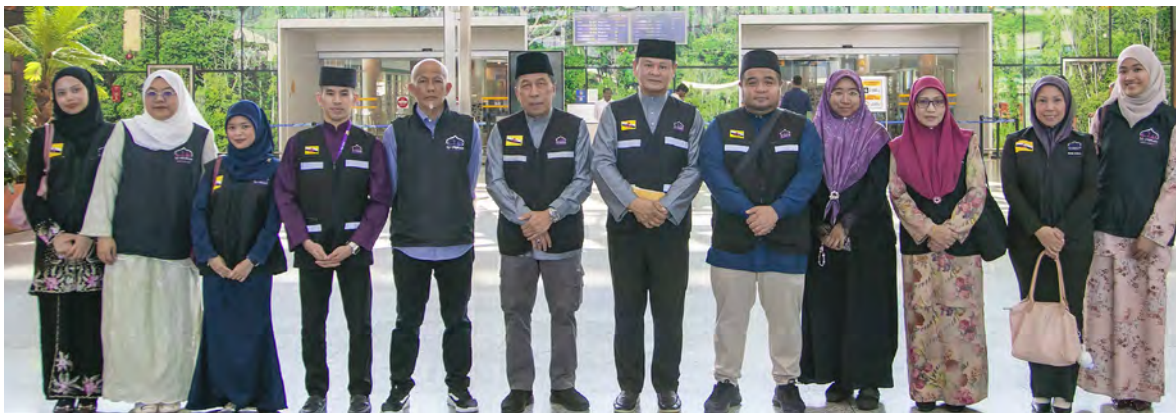
SESI bergambar ramai bagi mengucapkan selamat berlepas kepada dua petugas haji dari Syarikat Al-Hijrah.

Setibanya di Madinah, para jemaah akan ditempatkan di Nozol Royal Inn yang terletak berhampiran Masjid Nabawi.