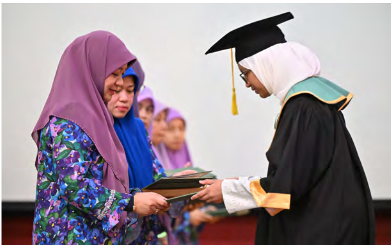
MAJLIS Haflut Takharruj Kali Ke-9 bagi meraikan seramai 292 orang pelajar yang berjaya dalam Peperiksaan Sijil Pelajaran Ugama Brunei (SPUB) serta Brunei Cambridge GCE 'O' Level bagi Tahun 2025 (atas dan bawah).

YANG Berhormat Mufti Kerajaan dan isteri hadir selaku tetamu kehormat pada majlis tersebut.