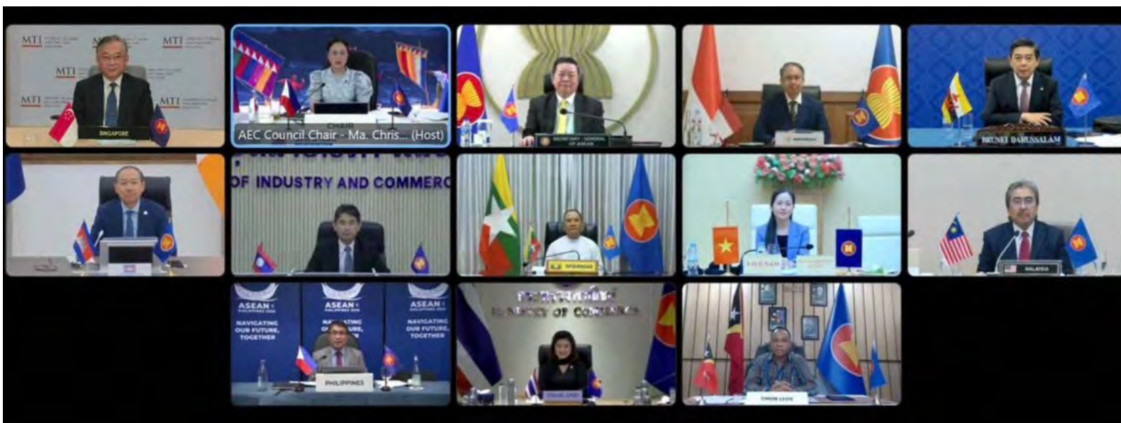
YANG Berhormat Menteri di Jabatan Perdana Menteri (JPM) dan Menteri Kewangan dan Ekonomi II menghadiri Mesyuarat Khas Majlis Komuniti Ekonomi ASEAN (AECC), yang diadakan melalui sidang video.

pendek tetapi juga untuk meneroka strategi jangka panjang.