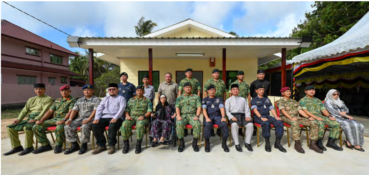
PEMERINTAH Angkatan Bersenjata Diraja Brunei (ABDB) hadir selaku tetamu kehormat pada Majlis Penyerahan Projek Titian Amal sempena Sambutan Hari Ulang Tahun ABDB Ke-64.