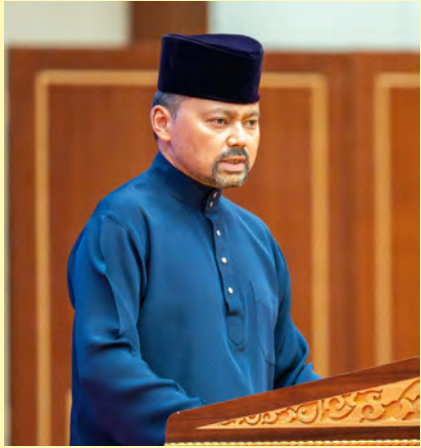
DULI Yang Teramat Mulia Paduka Seri Pengiran Muda Mahkota Pengiran Muda Haji Al-Muhtadee Billah ibni Kebawah Duli Yang Maha Mulia Paduka Seri Baginda Sultan Haji Hassanal Bolkiah Mu'izzaddin Waddaulah, Menteri Kanan di Jabatan Perdana Menteri berkenan mengurniakan sabda bersempena Majlis Perasmian Musabaqah Membaca Al-Quran Bahagian Dewasa Peringkat Akhir Kebangsaan Tahun 1447 / 2026 (malam pertama) di Dewan Plenary, Pusat Persidangan Antarabangsa, Berakas pada Isnin, 27 April 2026.

Assalamualaikum Warahmatullahi Wabarakatuh, Bismillahir Rahmanir Rahim, Alhamdulillah Rabbil 'Alameen Wabihiee Nasta'eenu 'Alaa Umuuriddunya Waddeen, Wassalaamu 'Ala Asyrafil Mursaleen, Sayyidina Muhammadin, Wa'alaa Aalihee Wasahbiee Ajma'een, Waba'du.