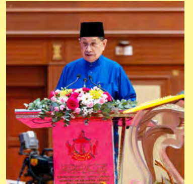
YANG Berhormat Menteri Hal Ehwal Ugama semasa sembah alu-aluannya.

"Sesuai dengan janji dan peringatan Allah Subhanahu Wata'ala dalam firman-Nya di akhir Surah Al-Kahfi, ayat 110: Terjemahannya: Katakanlah 'Sesungguhnya aku hanyalah seorang manusia seperti kamu, diwahyukan kepadaku bahawa Tuhan kamu ialah Tuhan yang Maha Esa maka sesiapa yang mengharapkan pertemuan dengan Tuhannya, hendaklah dia mengerjakan amalan soleh dan janganlah dia mempersekutukan Tuhannya dengan sesiapa pun dalam beribadat kepada-Nya,' " sembah Yang Berhormat.