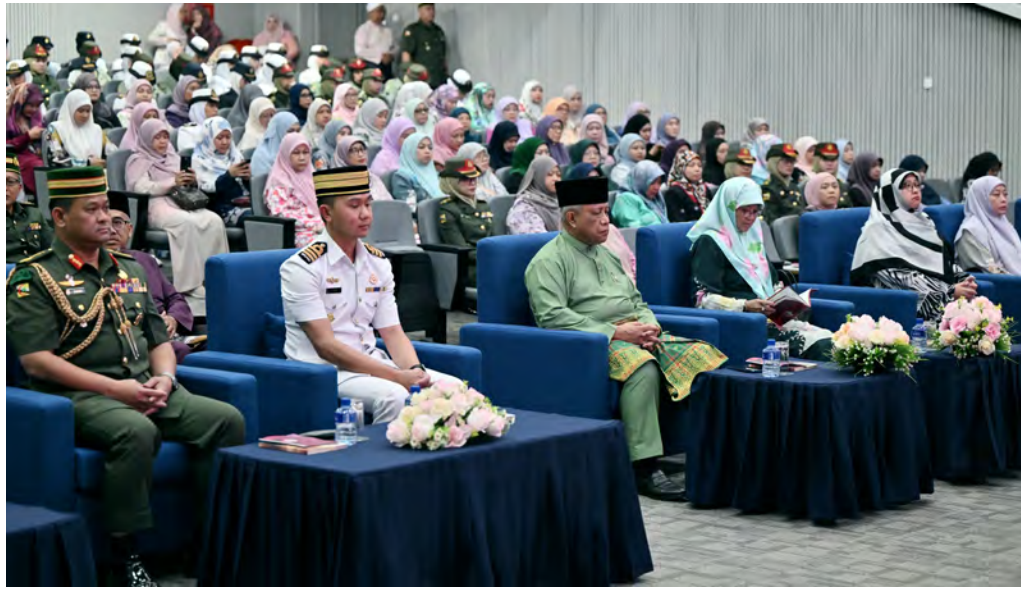
YANG Berhormat Menteri di Jabatan Perdana Menteri dan Menteri Pertahanan II hadir dan seterusnya menyempurnakan penyampaian sumbangan kepada bakal jemaah haji lelaki (kiri dan kanan).