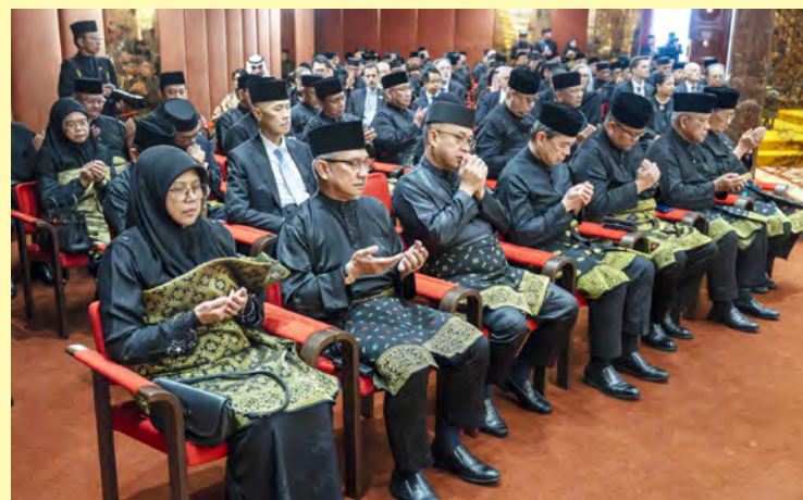
ANTARA yang hadir pada majlis berkenaan.