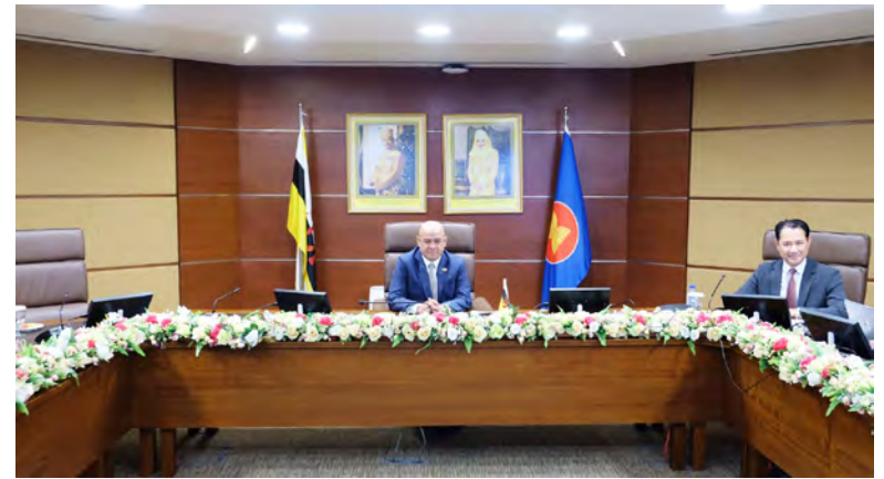
YANG Mulia Timbalan Menteri (Tenaga) di Jabatan Perdana Menteri mewakili Negara Brunei Darussalam pada Mesyuarat Khas Menteri-menteri Tenaga ASEAN (AMEM) yang telah diadakan secara maya pada 27 April 2026 (atas dan kiri).