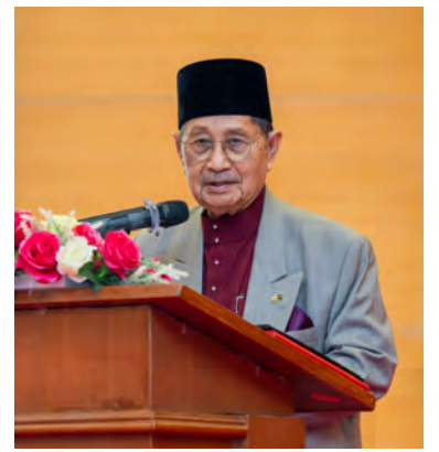
YANG Berhormat Menteri Hal Ehwal Ugama menyampaikan ucapan.

Pada tahun ini, seramai 1,000 bakal jemaah haji negara akan