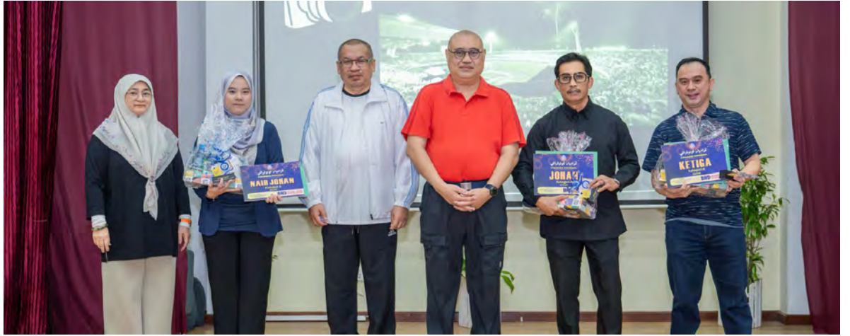
YANG Berhormat Menteri Kebudayaan, Belia dan Sukan hadir selaku tetamu kehormat pada Majlis Penyampaian Hadiah bagi para pemenang peraduan tersebut diadakan di Dewan Jawatan Dalam, Pusat Sejarah Brunei.

Peraduan Fotografi ini diadakan antara lain bertujuan untuk mendukung visi dan misi DBP; menggalakkan masyarakat mengembangkan minat dalam bidang fotografi dan penulisan; memperkasa potensi dan kemahiran masyarakat dalam bidang fotografi dan penulisan; serta melahirkan dan mengangkat karya seni fotografi serta penulisan