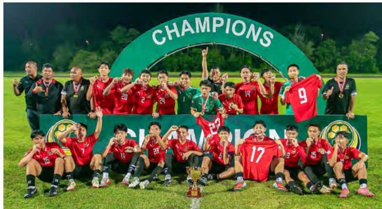
DPMM FC dinobatkan sebagai juara Liga Belia Brunei Musim 2025/2026 bagi Kategori Bawah 18 Tahun (Brunei Youth League – BYL U18).

Bawah 18 Tahun (Brunei Youth League – BYL U18) yang melabuhkan tirainya malam tadi di Jerudong Park Mini Stadium