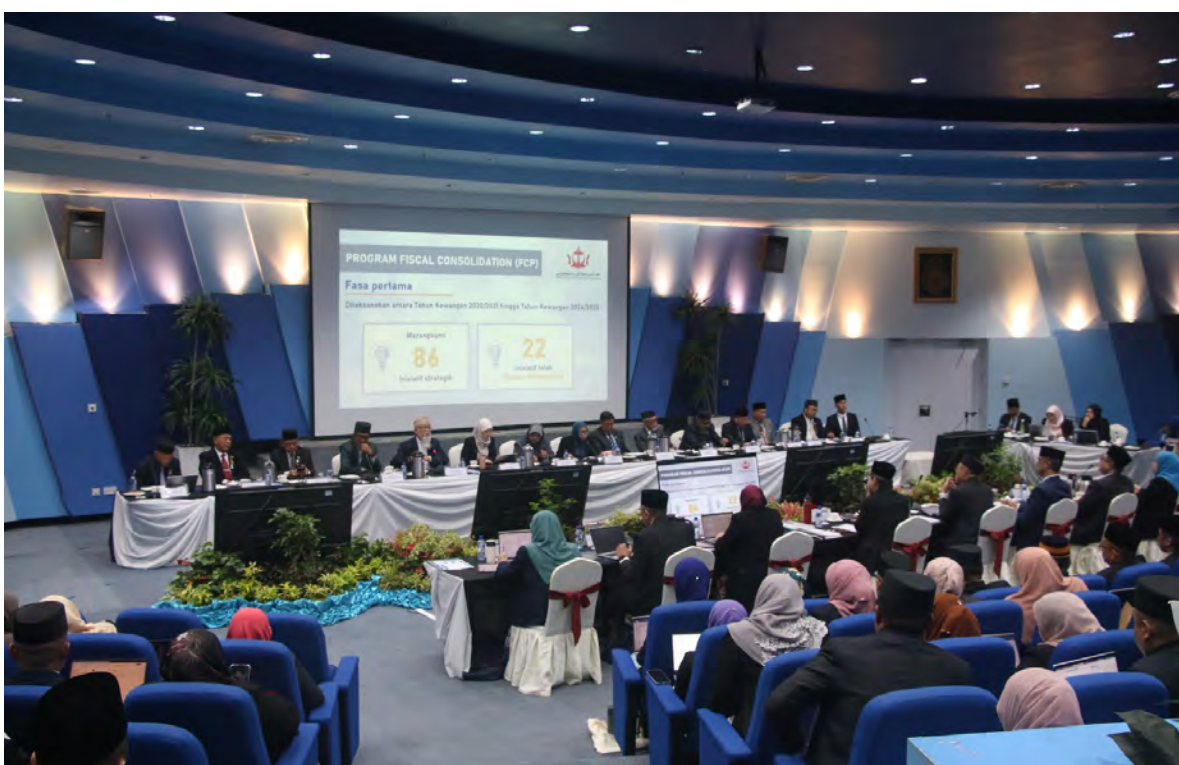
YANG Berhormat Menteri di Jabatan Perdana Menteri (JPM) dan Menteri Kewangan dan Ekonomi II hadir pada Sesi Muzakarah bersama dengan Yang Berhormat Ahli-ahli Majlis Mesyuarat Negara (MMN) bertempat di Dewan Teater, Bangunan Kementerian Kewangan dan Ekonomi, Commonwealth Drive, Jalan Kebangsaan (atas kiri dan atas).

Dalam pada masa yang sama, Yang Berhormat turut menekankan kepentingan perpaduan dan kerjasama semua pihak termasuk sektor kerajaan, sektor swasta dan masyarakat melalui pendekatan Whole of Government dan Whole of Nation untuk sama-sama berganding bahu ke arah mencapai ekonomi yang dinamik dan mampan.