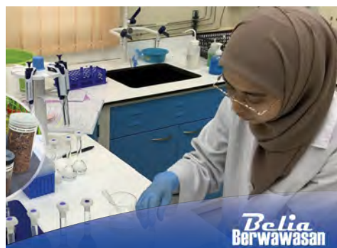
PENGLIBATAN belia penting sebagai generasi penerus pertanian di NBD