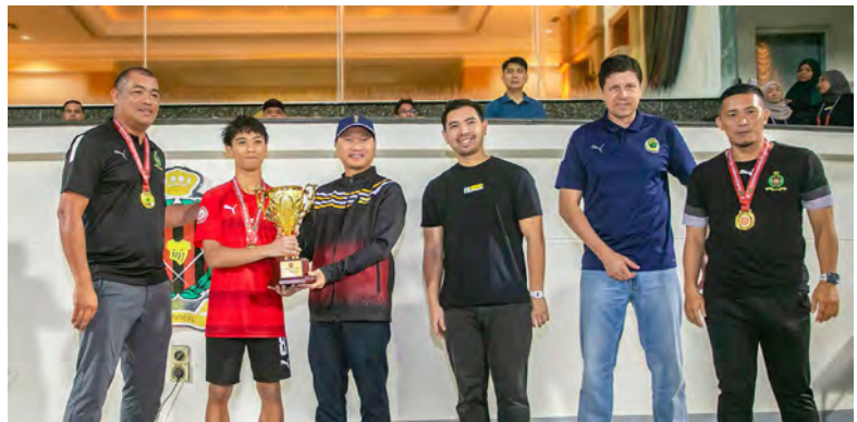
PENYAMPAIAN hadiah kepada para pemenang disempurnakan oleh Setiausaha Tetap (Kebudayaan), Kementerian Kebudayaan, Belia dan Sukan selaku tetamu kehormat majlis.

perlawanan terakhir berkenaan, DPMM FC U18 muncul juara keseluruhan kejohanan berdasarkan prestasi cemerlang sepanjang musim.