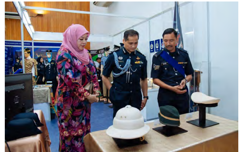
PESURUHJAYA Polis, Pasukan Polis Diraja Brunei ketika menyaksikan pameran bersempena Sambutan Hari Polis Ke-105 Tahun (atas), manakala gambar bawah, antara yang dipamerkan semasa sambutan tersebut.