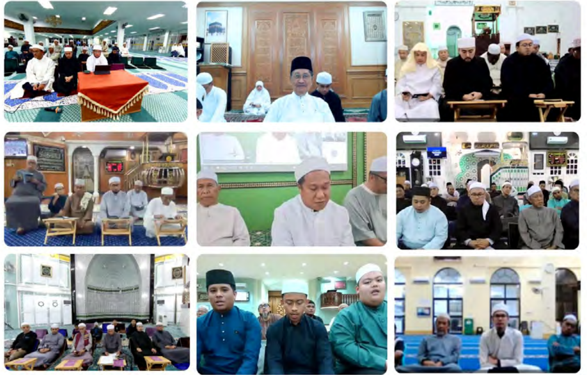
TURUT hadir bagi sama-sama menyemarakkan lagi Malam Munajat ialah Yang Berhormat Menteri Hal Ehwal Ugama.

berserta seluruh rakyat dan penduduknya sentiasa terpelihara daripada sebarang musibah dan penyakit berjangkit.