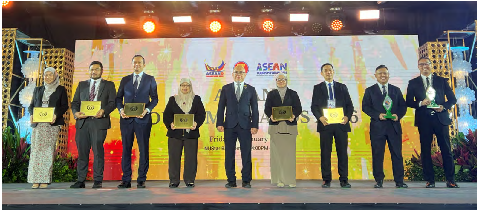
YANG Berhormat Menteri Sumber-Sumber Utama dan Pelancongan menyampaikan anugerah kepada penerima anugerah untuk Negara Brunei Darussalam.

Beberapa lokasi di NBD turut diberi penghormatan di bawah ASEAN MICE Venue Awards iaitu Dewan An-Naura, Kompleks Yayasan Sultan Haji Hassanal Bolkiah; Mutiara Ballroom, Radisson Hotel Brunei Darussalam; dan Indera Samudra Grand Hall di The Empire Brunei telah menerima ASEAN MICE