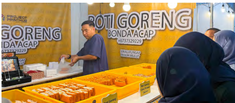
PENGUSAHA Roti Goreng Bonda Acap semasa melayan pelanggannya (atas), manakala gambar bawah, produk terbaharu Heritage Bakwa, iaitu Chilli Lime Bakwa.