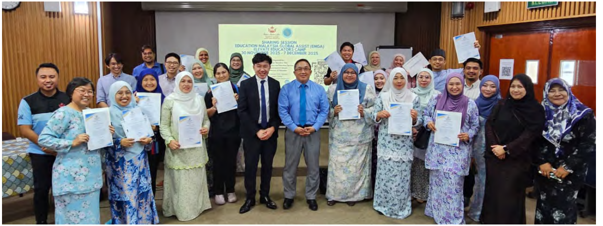
PIHAK Unit Pendidikan Kerjaya di bawah Jabatan Sekolah-Sekolah (JSS) menganjurkan Sesi Kongsi Sama mengenai On Education Malaysia Global Assist (EMGA) Elevate Educators Camp.

Institusi-institusi tersebut termasuk INTI International University & Colleges, Sunway University, Le Cordon Bleu Malaysia, Asia Pacific University, Universiti Tenaga Nasional, Tunku Abdul Rahman University of Management and Technology, Taylor's University, Monash University Malaysia, HELP University dan Heriot-Watt University Malaysia.