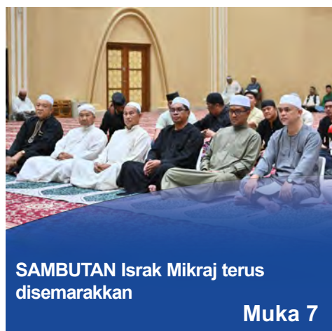
SAMBUTAN Israk Mikraj terus disemarakan