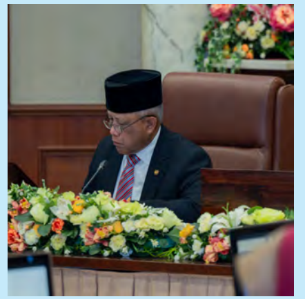
MENTERI di Jabatan Perdana Menteri dan Menteri Pertahanan II, Yang Berhormat Pehin Datu Lailaraja Mejar Jeneral (B) Dato Paduka Seri Haji Halbi bin Haji Mohd. Yussof semasa berucap pada Sesi Muzakarah Jabatan Perdana Menteri dan Jabatan-jabatan di bawahnya bersama Ahli-ahli Majlis Mesyuarat Negara pada Selasa, 13 Januari 2026 yang berlangsung di Bilik Mesyuarat, West Wing, Aras 1 Jabatan Perdana Menteri.

Walaupun kadar jenayah di negara ini masih dinilai terkawal, Jawatankuasa Keselamatan Negara bersama agensi-agensi keselamatan dan penguatkuasaan di negara ini, tidak akan kendur-kendur dalam usaha untuk memberantas kegiatan jenayah dan salah