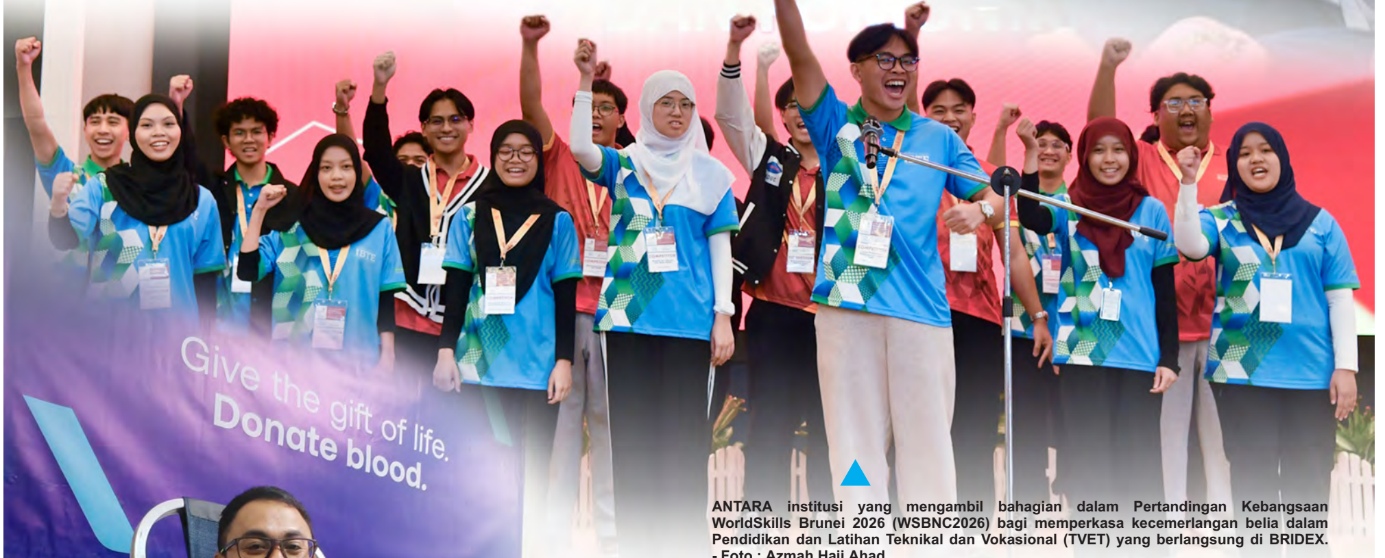
ANTARA institusi yang mengambil bahagian dalam Pertandingan Kebangsaan WorldSkills Brunei 2026 (WSBNC2026) bagi memperkasa kecemerlangan belia dalam Pendidikan dan Latihan Teknikal dan Vokasional (TVET) yang berlangsung di BRIDEX.