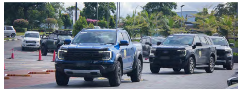
KONVOI Kembara Kenderaan berkenaan telah merentasi destinasi utama termasuk Sibul, Kuching dan Bintulu, dengan sebahagian besar perjalanan mengikuti Lebuh raya Pan Borneo yang ikonik.

Kongsi Syaz lagi, daripada riu tawar-menawar di hujung sempadan Pasar Serikin, ke permata batu kapur Gua Pari-Pari yang memukau dengan keindahan alam hingga ke Tasik Biru, permata Sarawak yang menyimpan nilai sejarah dan menawarkan pengalaman pelancongan yang menyatukan budaya, alam dan legenda.