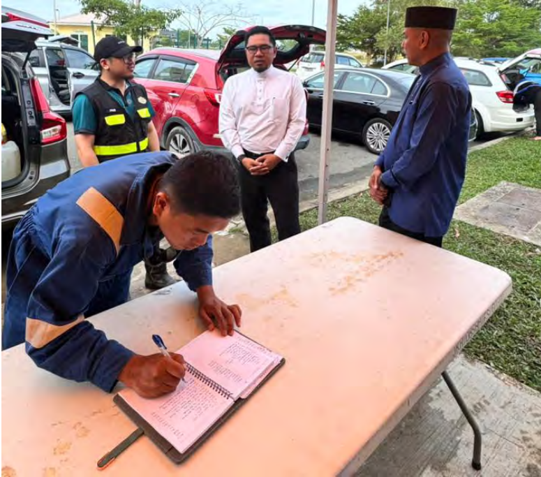
Oleh : Siti Rokiah Abdullah

BANDAR SERI BEGAWAN , Ahad, 1 Februari. - Kerjasama erat dan sinergi padu antara Jabatan Kerja Raya (JKR), Kementerian Pembangunan serta para Penghulu Mukim telah meringankan kekusaran penduduk susulan gangguan bekalan air yang berlaku akibat kerosakan paip air utama kesan tanah runtuh di Kampung Batang Mitus.