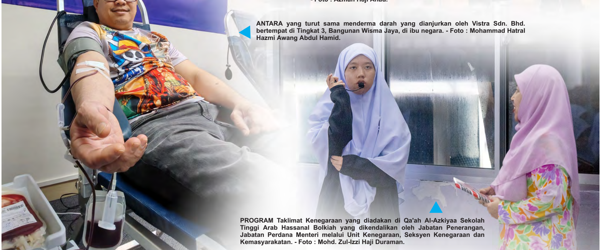
ANTARA yang turut sama menderma darah yang dianjurkan oleh Vistra Sdn. Bhd. bertempat di Tingkat 3, Bangunan Wisma Jaya, di ibu negara.