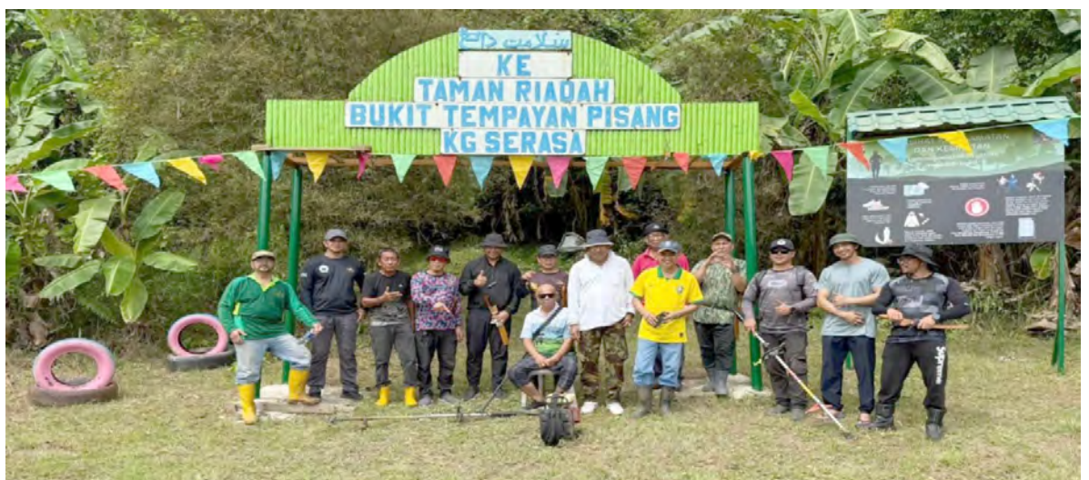
MAJLIS Perundingan Kampung Serasa mengadakan Kempen Gotong-Royong membersihkan kawasan Taman Riadah Bukit Tempayan Pisang.

dan akan diteruskan pada masa akan datang demi kesejahteraan komuniti yang berminat untuk mendaki bukit sebagai aktiviti riadah dan inisiatif membersihkan dan menyiangi kawasan