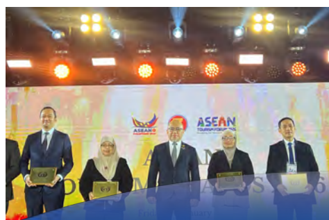
NBD terima pengiktirafan pada Anugerah Piawai Pelancongan ASEAN