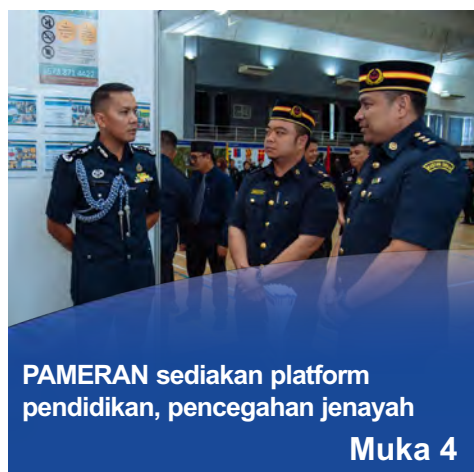
PAMERAN sediakan platform pendidikan, pencegahan jenayah