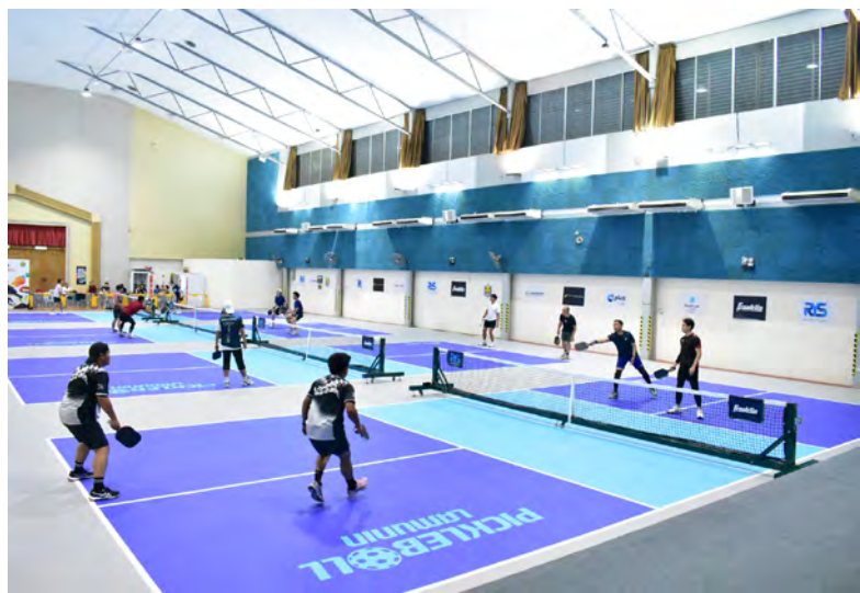
PEMANGKU Pegawai Daerah Tutong semasa menyaksikan perlawanan berkenaan (kanan), manakala gambar kiri, antara aksi perlawanan

Dewan Sekolah Chung Hwa Kiudang, Tutong.