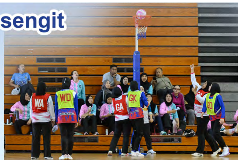
ANTARA pasukan yang bertanding pada Kejohanan Bola Jaring Antara Kementerian - kementerian sempena Hari Perkhidmatan Awam Kali Ke-32 Tahun 2025.

Kejohanan tersebut berlangsung di Dewan Serbaguna, Kompleks Sukan Negara Hassanal Bolkiah dan akan disambung lagi pada 8 Februari 2026 bagi Majlis Penyampaian Hadiah.