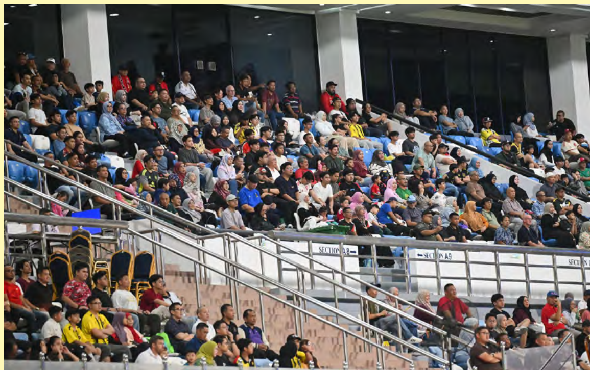
ORANG ramai yang hadir bagi menyaksikan perlawanan tersebut (atas), manakala gambar kanan, antara aksi yang menarik semasa perlawanan tersebut.