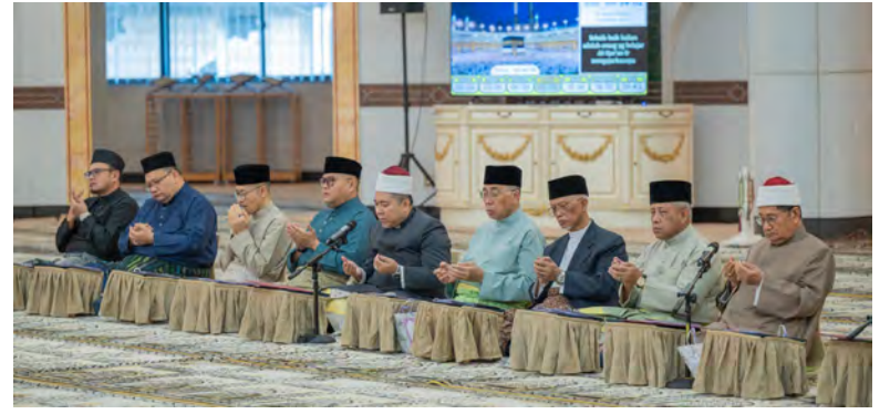
YANG Berhormat Menteri Hal Ehwal Ugama yang juga selaku Yang Dipertua Majlis Ugama Islam Brunei (MUIB) hadir selaku tetamu kehormat pada Majlis Doa Kesyukuran yang berlangsung di Jame' 'Asr Hassaniil Bolkiah, Kampung Kiarong.

Majlis diakhiri dengan bacaan Selawat Tafrijiyyah sebanyak tiga kali beramai-ramai dipimpin oleh