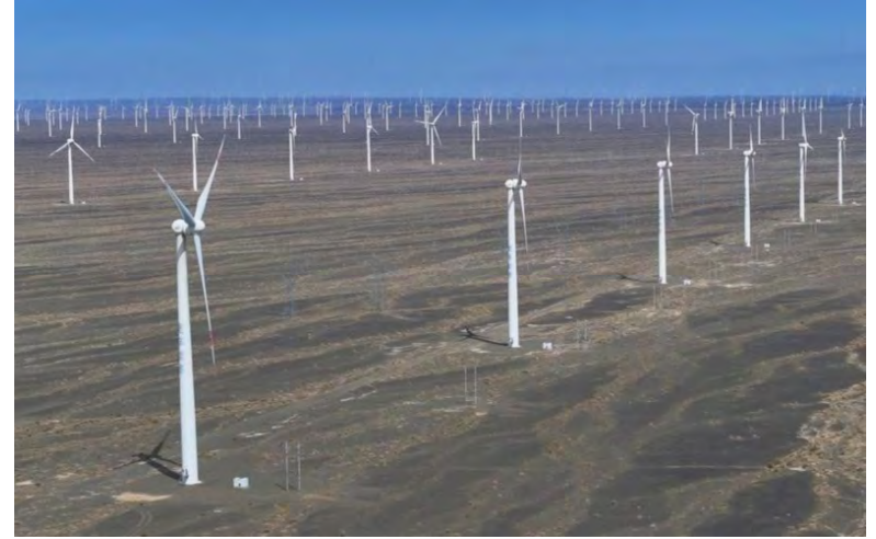
FOTO dron udara yang diambil pada 27 April 2025 menunjukkan pemandangan ladang kuasa angin Santanghu di Bandar Hami di wilayah Autonomi Xinjiang Uygur, barat laut Republik Rakyat China.

Kisah sektor kuasa angin Republik Rakyat China atau pemacu peralihan hijau yang lebih