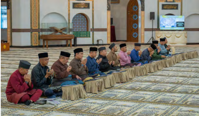
ANTARA yang hadir pada Majlis Doa Kesyukuran berkenaan.

Selain itu juga bagi memohon ke hadrat Allah Subhanahu Wata'ala untuk menjadikan MUIB, NBD terus istiqamah dalam menabur bakti dan kebaikan, memartabatkan syiar Islam, menjulang tinggi kepimpinan raja, serta berkhidmat kepada agama dan masyarakat seluruhnya serta segala usaha, sumbangan dan khidmat MUIB ini, diterima Allah Subhanahu Wata'ala sebagai amal soleh dan dikurniakan ganjaran yang mulia di sisi Allah Subhanahu Wata'ala.