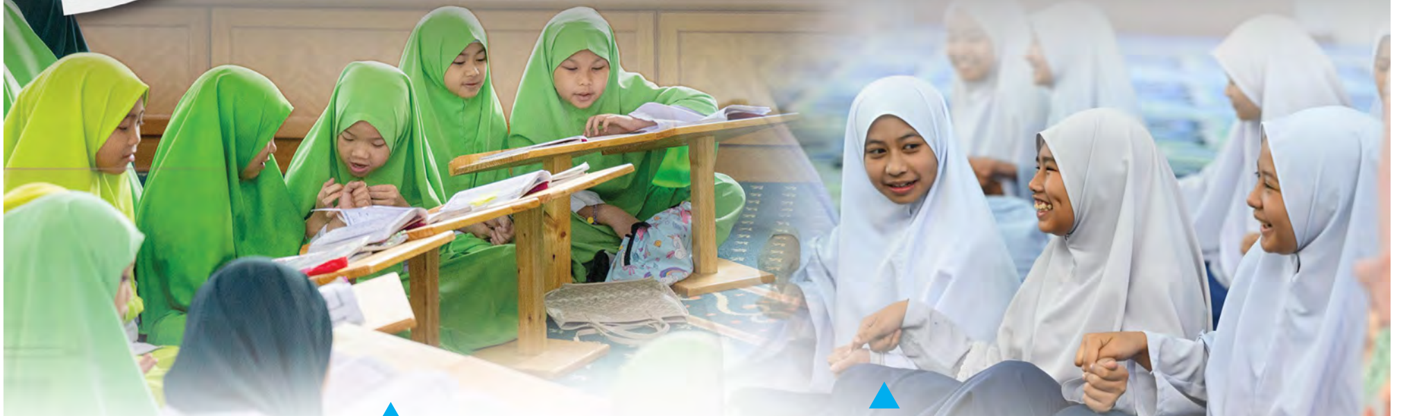
SEBAHAGIAN murid yang mengikuti Kelas Al-Quran dan Muqqadam yang berlangsung di Masjid Raja Isteri Pengiran Anak Hajah Saleha.