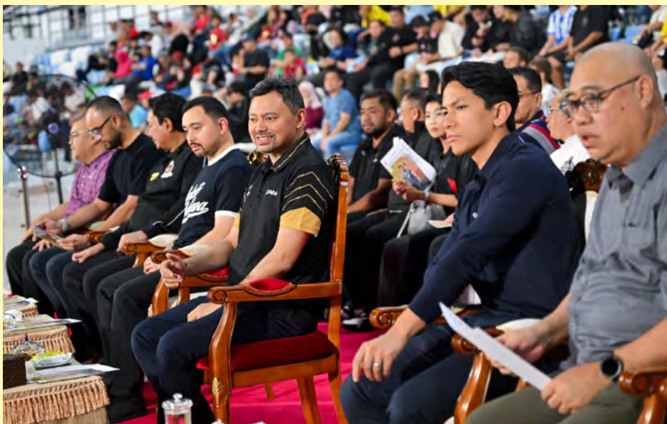
DULI Yang Teramat Mulia Paduka Seri Pengiran Muda Mahkota Pengiran Muda Haji Al-Muhtadee Billah ibni Kebawah Duli Yang Maha Mulia Paduka Seri Baginda Sultan Haji Hassanal Bolkiah Mu'izzaddin Waddaulah, Menteri Kanan di Jabatan Perdana Menteri berkenan berangkat menyaksikan perlawanan. Turut berangkat, paduka-paduka adinda Duli Yang Teramat Mulia Paduka Seri Pengiran Muda Mahkota Pengiran Muda Haji Al-Muhtadee Billah, Duli Yang Teramat Mulia Paduka Seri Pengiran Muda 'Abdul Malik dan Duli Yang Teramat Mulia Paduka Seri Pengiran Muda 'Abdul Mateen.