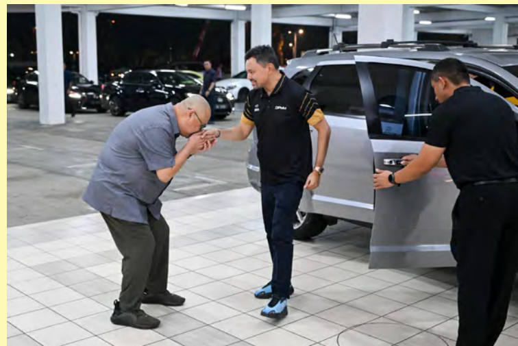
KEBERANGKATAN tiba Duli Yang Teramat Mulia Paduka Seri Pengiran Muda Mahkota Pengiran Muda Haji Al-Muhtadee Billah ibni Kebawah Duli Yang Maha Mulia Paduka Seri Baginda Sultan Haji Hassanal Bolkiah Mu'izzaddin Waddaulah, Menteri Kanan di Jabatan Perdana Menteri dijunjung oleh Yang Berhormat Menteri Kebudayaan, Belia dan Sukan.

Pada perlawanan seterusnya, DPMM FC akan menentang Kuala Lumpur City FC pada 22 Februari 2026, pukul 10.00 malam. Sementara itu, DPMM FC berada di kedudukan ke-7 dengan kutipan 18 mata, manakala Melaka FC kekal di kedudukan ke-12 dengan kutipan 10 mata.