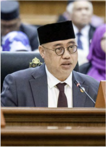
YANG Berhormat Menteri Kebudayaan, Belia dan Sukan.

BANDAR SERI BEGAWAN, Sabtu, 15 Mac. - Rancangan Kemajuan Negara (RKN) ke-12 telah meluluskan peruntukan sebanyak BND31.75 juta bagi menjadikan Bangunan Bekas Radio Televisyen Brunei dan Perpustakaan Dewan Bahasa dan Pustaka di Bandar Seri Begawan menjadi Hab Industri Kreatif dan Budaya (CCI), termasuk pembangunan Akademi Seni Budaya Brunei. Sejak sesi mesyuarat yang lepas, Kementerian Kebudayaan, Belia dan Sukan (KKBS) telah menjalankan pelbagai usaha bagi merealisasikan akademi ini, termasuk penyediaan buku kurikulum Akademik Seni Budaya Brunei sebagai rujukan utama dalam melestari seni budaya Brunei.