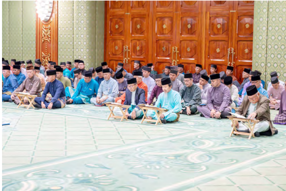
MAJLIS Khatam Al-Quran dilangsungkan di hadapan Yang Amat Mulia Pengiran Sanggamara Diraja Mejar Jeneral (B) Pengiran Haji Ibnu Basit bin Pengiran Datu Penghulu Pengiran Haji Apong.