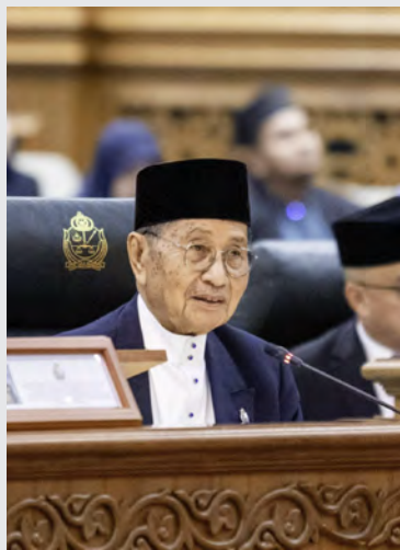
YANG Berhormat Menteri Hal Ehwal Ugama.