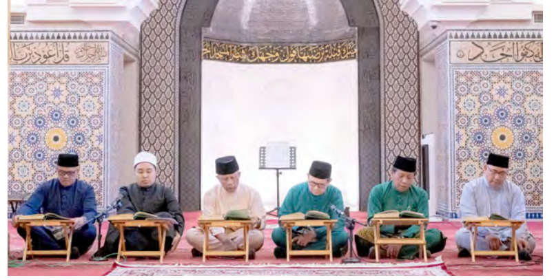
YANG Berhormat Menteri di Jabatan Perdana Menteri (JPM) dan Menteri Pertahanan II dan Yang Berhormat Menteri di JPM dan Menteri Kewangan dan Ekonomi II hadir selaku tetamu khas pada Majlis Penutup Tadarus (atas dan kiri).