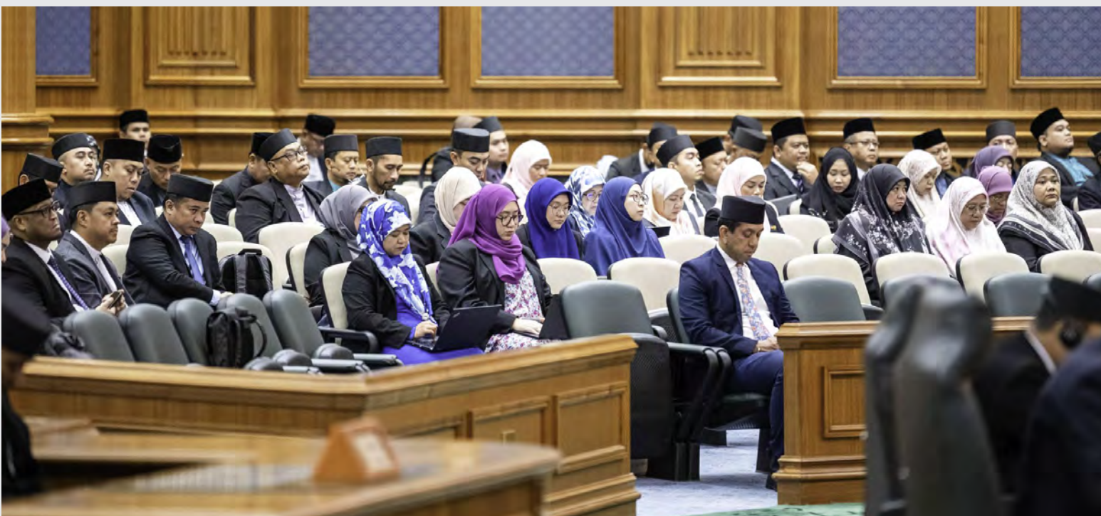
ANTARA yang hadir mendengarkan persidangan.

Jelas Yang Berhormat Menteri lagi, dalam langkah seterusnya, kerajaan juga berusaha untuk mendapatkan pengiktirafan UNESCO bagi tapak-tapak warisan negara. Sehingga kini, Masjid Omar 'Ali Saifuddin (MOAS) telah dimasukkan dalam Senarai Tentatif ICESCO sebagai persiapan awal sebelum pencalonan ke UNESCO. Dengan pengiktirafan ini, Negara Brunei Darussalam akan mendapat manfaat daripada segi peningkatan daya tarikan pelancongan warisan, pemuliharaan lebih sistematik, serta peluang untuk bekerjasama dengan pakar warisan antarabangsa dalam memastikan tapak bersejarah terus terpelihara.