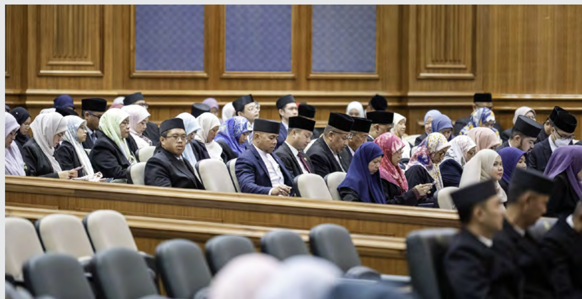
SEBAHAGIAN yang hadir mendengarkan persidangan.

Walau bagaimanapun, insyaaAllah, dasar-dasar bantuan dan syarat-syarat penilaian bantuan bencana akan direview mengikut kesesuaiannya dan penelitian ini akan diusahakan dengan konsultasi bersama pihak-pihak yang berkepentingan khususnya pihak Kementerian Hal Ehwal Dalam Negeri seperti Jabatan Daerah, dan Jabatan Bomba dan Penyelamat, bagi memastikan intervensi-intervensi bantuan bagi mangsa bencana alam seperti banjir dapat dilaksanakan dengan berkesan," tambah Yang Berhormat.