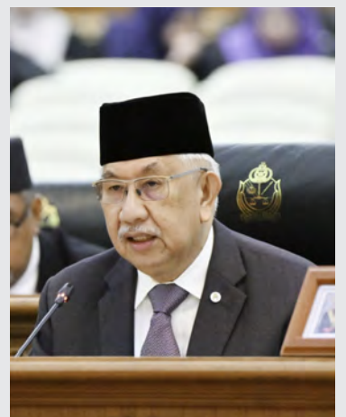
Menteri Hal Ehwal Ugama.

"Ada tempat-tempat seperti Temburong yang disebutkan namun tidak mendapat sambutan akan tetapi pemikiran untuk mendapatkan tanah perkuburan baharu, kawasan - kawasan baharu sangat penting namun bukan suatu yang baharu. Yang baharunya tadi ialah dicadangkan di kawasan-kawasan di mana ramai penduduk - penduduk yang antaranya ialah kawasan-kawasan RPN. Ini adalah suatu cadangan yang baik yang difikirkan. Dan contohnya pun sudah ada, antaranya ialah Tanah Perkuburan Baru Terunjing. Oleh kerana kawasan itu, kawasan yang sudah in da dapat menampung yang lama, maka kawasan baharu telah dibuka," ujar Yang Berhormat