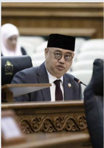
YANG Berhormat Menteri Kebudayaan, Belia dan Sukan.