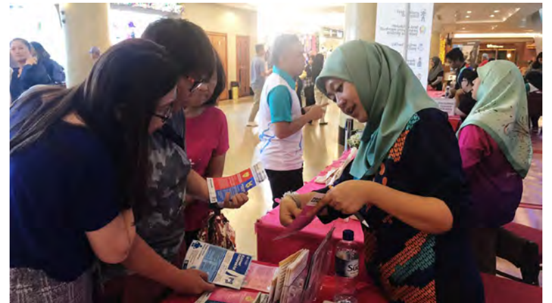
BULAN Kesedaran Kanser Kolorektal disambut setiap bulan Mac di seluruh dunia dengan tujuan untuk meningkatkan kesedaran orang ramai mengenai kanser kolorektal termasuk faktor risikonya serta kepentingan menjalani ujian saringan.

Awda juga boleh mengunjungi laman sesawang rasmi Kementerian Kesihatan di www.moh.gov.bn dan mengakses Program Pemeriksaan Kesihatan Kebangsaan untuk maklumat lanjut mengenai saringan. Bagi pertanyaan lanjut, orang ramai juga boleh mengem-mel di health.screening@moh.gov.bn .