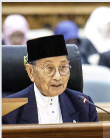
YANG Berhormat Menteri Hal Ehwal Ugama.

konteks ini, kesediaan peruntukan yang mencukupi adalah penting bagi memastikan pematuhan halal di setiap peringkat pengeluaran makanan bukan hanya dalam produk akhir.