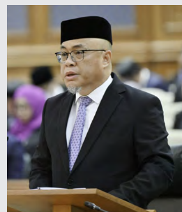
YANG Berhormat Menteri Sumber-Sumber Utama dan Pelancongan.

"Ketiga, meningkatkan kesuburan tanah melalui pertanian regeneratif di samping memastikan pemeliharaan alam sekitar yang mampan dengan penggunaan baja kompos," jelas Yang Berhormat.