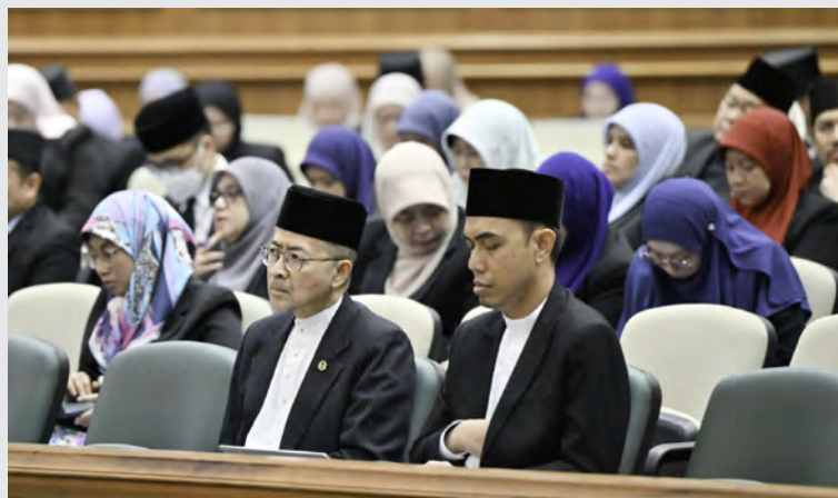
SEKITAR persidangan berkenaan.

"Ketiga, program pertukaran pelajar dengan negara-negara seperti Republik Singapura, Jepun dan lain-lain; dan keempat, lawatan suai kenal dari institut pendidikan seperti dari Jepun yang bertujuan untuk menarik lebih ramai lagi penuntut Jepun ke negara ini," ujar Yang Berhormat lagi.