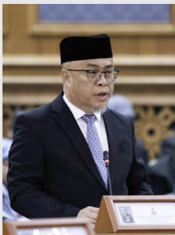
YANG Berhormat Menteri Sumber-Sumber Utama dan Pelancongan.