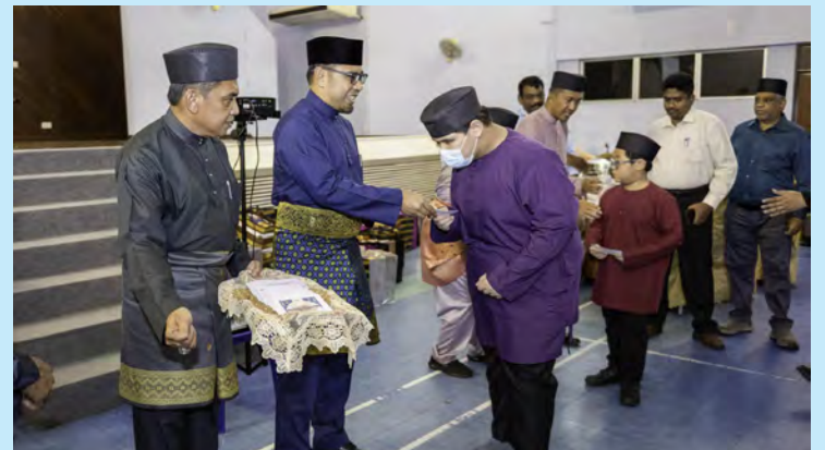
PEMANGKU Pegawai Daerah Brunei dan Muara semasa hadir selaku tetamu kehormat majlis. Turut hadir, Yang Berhormat Ahli Majlis Mesyuarat Negara selaku tetamu khas.

Oleh : Pg. Siti Redzaimi Pg. Haji Ahmad