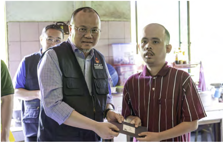
YANG Berhormat Menteri Kesihatan mengetuai rombongan Kementerian Kesihatan melawat pesakit-pesakit di Daerah Brunei dan Muara (atas dan bawah kanan).

BANDAR SERI BEGAWAN, Ahad, 16 Mac. - Kementerian Kesihatan mengadakan lawatan ke rumah-rumah pesakit yang kurang berkemampuan bagi menyampaikan sumbangan derma, barang-barang keperluan asas dan peralatan perubatan kepada pesakit serta keluarga yang telah dikenal pasti dan berdaftar di Bahagian Kebajikan Perubatan di kawasan Daerah Brunei dan Muara (DBM), Daerah Tutong, Daerah Temburong dan Daerah Belait, hari ini.