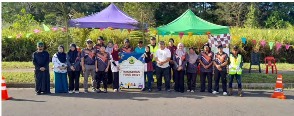
SESI bergambar ramai pada Program Food Drive Ramadan 2025.

Diharapkan program sebegini dapat diteruskan lagi di masa hadapan dengan lebih banyak penyertaan daripada masyarakat.