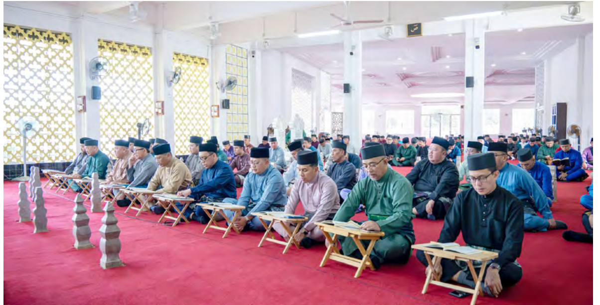
YANG Berhormat Menteri Pengangkutan dan Infokomunikasi hadir selaku ketua rombongan pada Majlis Membaca Surah Yaa Siin dan Bertahlil yang diadakan di Kubah Makam Diraja, Jalan Tutong (atas). Manakala gambar atas kiri, antara yang hadir pada majlis berkenaan.

BANDAR SERI BEGAWAN, Sabtu, 8 Mac. - Kementerian Pengangkutan dan Infokomunikasi (MTIC) dan jabatan-jabatan serta agensi-agensinya telah mengadakan Majlis Membaca Surah Yaa Siin dan Bertahlil bagi Al-Marhum Sultan Haji Omar 'Ali Saifuddin Sa'adul Khairi Waddien ibni Al-Marhum Sultan Muhammad Jamalul Alam, Al-Marhumah Duli Raja Isteri Pengiran Anak Damit binti Al-Marhum Pengiran Bendahara Pengiran Anak Abdul Rahman dan Al-Marhum Duli Yang Teramat Mulia Paduka Seri Pengiran Muda Haji 'Abdul 'Azim ibni Kebawah Duli Yang Maha Mulia Paduka Seri Baginda Sultan Haji Hassanal Bolkiah Mu'izzaddin Waddaulah bertempat di Kubah Makam Diraja, Jalan Tutong. Hadir bagi mengetahui