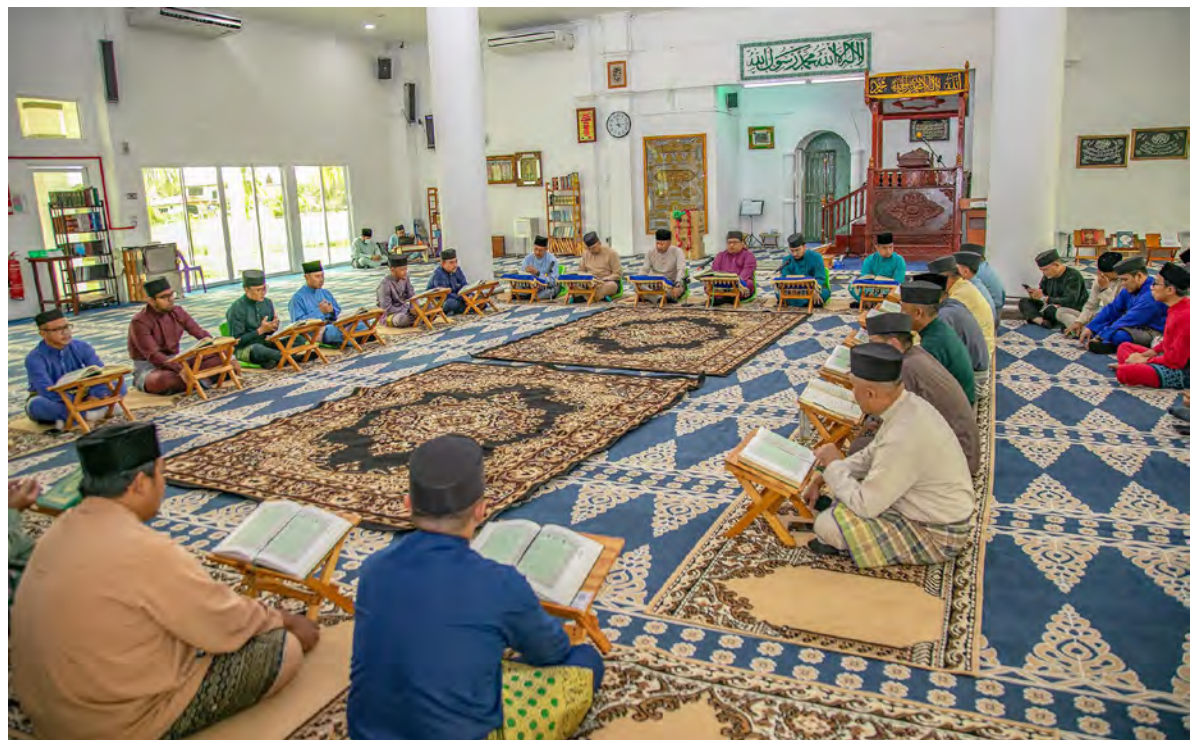
SEKITAR Majlis Tadarus Al-Quran bulan Ramadan di Masjid Skim Tanah Kurnia Rakyat Jati Lorong 3 Seria.

Jabatan di bawahnya berserta Majlis Perundangan Mukim dan Kampung Tahun 1446H/2025M di daerah ini diadakan petang tadi bertempat di Masjid Skim Tanah