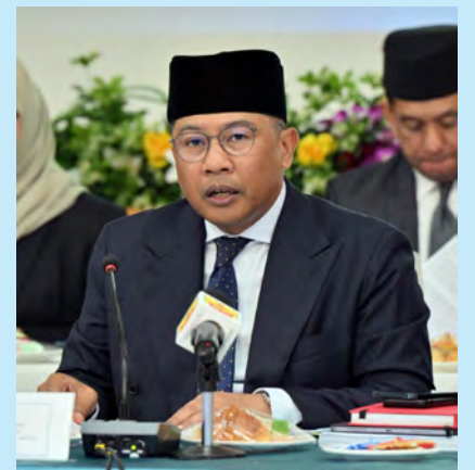
MENTERI Pengangkutan dan Infokomunikasi, Yang Berhormat Pengiran Dato Seri Setia Shamhary bin Pengiran Dato Paduka Haji Mustapha berucap pada Sesi Perjumpaan Muhibah Kementerian Pengangkutan dan Infokomunikasi Bersama Ahli-ahli Yang Berhormat Majlis Mesyuarat Negara bagi Tahun 2025, pada Khamis, 13 Februari 2025 di Dewan Amar Pahlawan, Kementerian Pengangkutan dan Infokomunikasi.

Pada masa yang sama, bagi memastikan usaha-usaha mempertingkatkan dan memperbaiki sistem pengangkutan awam di NBD ada dilaksanakan secara menyeluruh termasuk operasi semasa, keselamatan dan keselesaan orang ramai. Kementerian ini bersama JPD telah melaksanakan pemeriksaan ke atas kenderaan bas-bas awam diikuti dengan perjumpaan bersama semua pemandu. Perjumpaan bersama pengusaha-pengusaha bas awam telah diadakan pada 8 Ogos 2024 yang mana