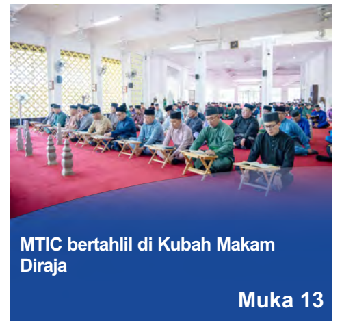
MTIC bertahlil di Kubah Makam Diraja