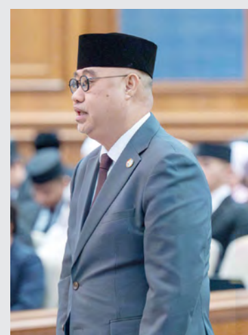
YANG Berhormat Menteri Kebudayaan, Belia dan Sukan.

Secara keseluruhannya, tambahnya lagi, usaha-usaha yang dilaksanakan oleh kementerian ini sebenarnya bukan saja bertujuan untuk memastikan warisan budaya Brunei terus berkembang tetapi juga bertujuan untuk