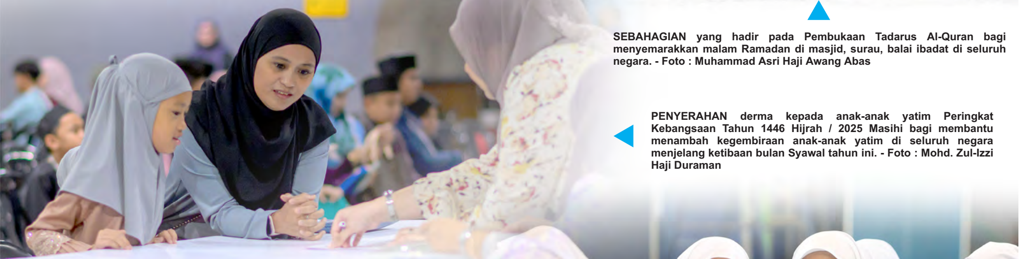
▲ SEBAHAGIAN yang hadir pada Pembukaan Tadarus Al-Quran bagi menyemarakkan malam Ramadan di masjid, surau, balai ibadat di seluruh negara.