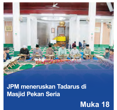
JPM meneruskan Tadarus di Masjid Pekan Seria