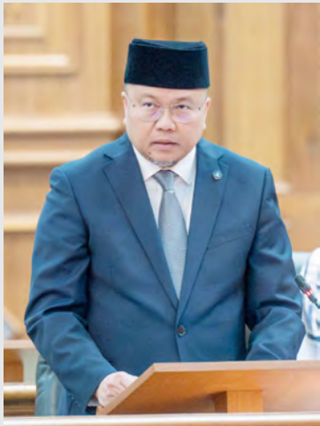
YANG Berhormat Menteri Kesihatan.

BANDAR SERI BEGAWAN , Sabtu, 8 Mac. - Kementerian Kesihatan telah memilih tema Sistem Penjagaan Kesihatan Yang Mampan (Sustainable Health Care System) pada Tahun Kewangan 2025 / 2026.