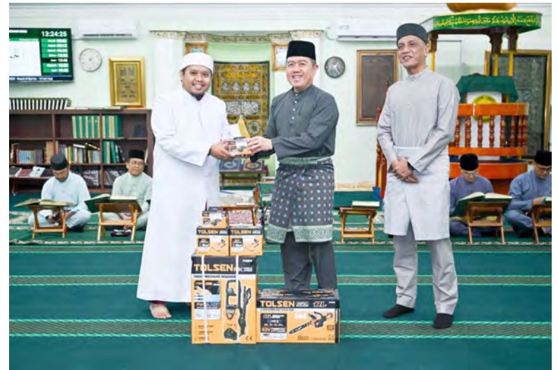
SETIAUSAHA Tetap (Pengajian Tinggi), Kementerian Pendidikan hadir selaku tetamu kehormat majlis dan seterusnya menyerahkan sumbangan wakaf kepada penerima.

Turut hadir di majlis tersebut ialah Naib-naib Canselor, Timbalan Setiausaha Tetap (Pendidikan Teras), ketua-ketua jabatan, pegawai-pegawai kanan, pegawai dan kakitangan Kementerian Pendidikan, serta penduduk kampung sekitarnya.