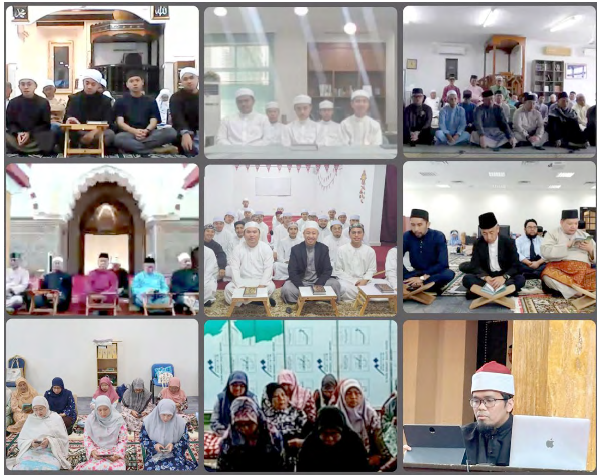
MUNAJAT Ramadan anjuran Kementerian Hal Ehwal Ugama (KHEU) Kali Ke-176 dengan kerjasama Rabitah Antarabangsa Alumni Al-Azhar Brunei Darussalam bersempena Sambutan Hari Al-Azhar Al-Syarif Sedunia 1446 Hijrah dan diadakan secara dalam talian.

Munajat Ramadan anjuran KHEU mengajak orang ramai untuk bersama-sama mempertingkatkan amalan ibadah pada bulan Ramadan ini dan meminta keampunan daripada Allah Subhanahu Wata'ala dengan beristighfar, membaca ayat-ayat