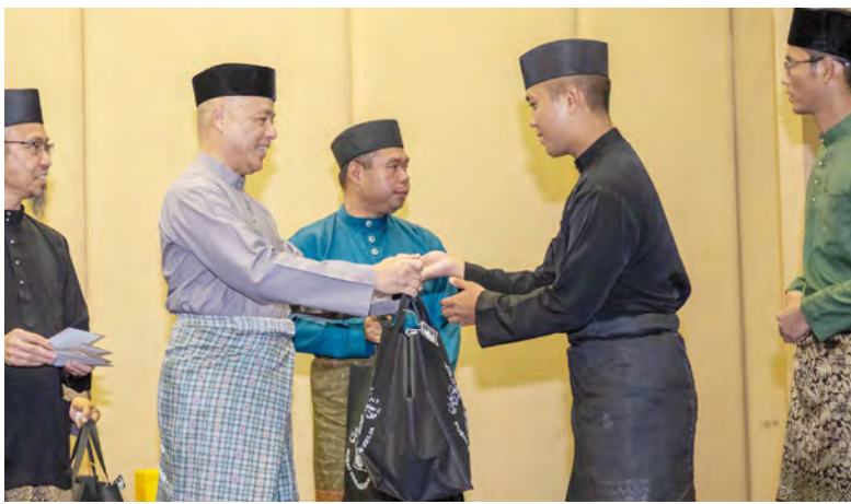
SETIAUSAHA Tetap (Kebudayaan) Kementerian Kebudayaan, Belia dan Sukan hadir selaku tetamu kehormat dan seterusnya menyerahkan sumbangan dan sedekah kepada anak-anak yatim pada majlis berkenaan.

Oleh : Nurhamiza Haji Roslan