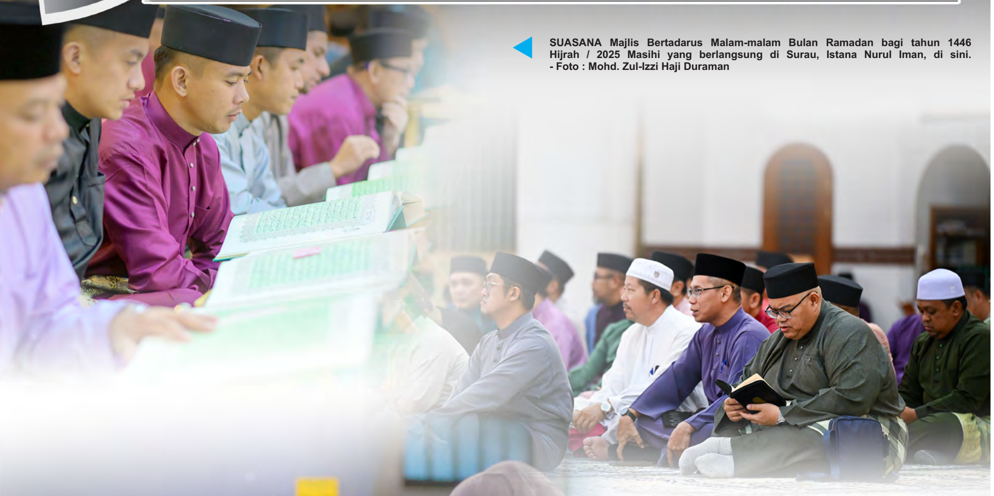
◀ SUASANA Majlis Bertadarus Malam-malam Bulan Ramadan bagi tahun 1446 Hijrah / 2025 Masihi yang berlangsung di Surau, Istana Nurul Iman, di sini.