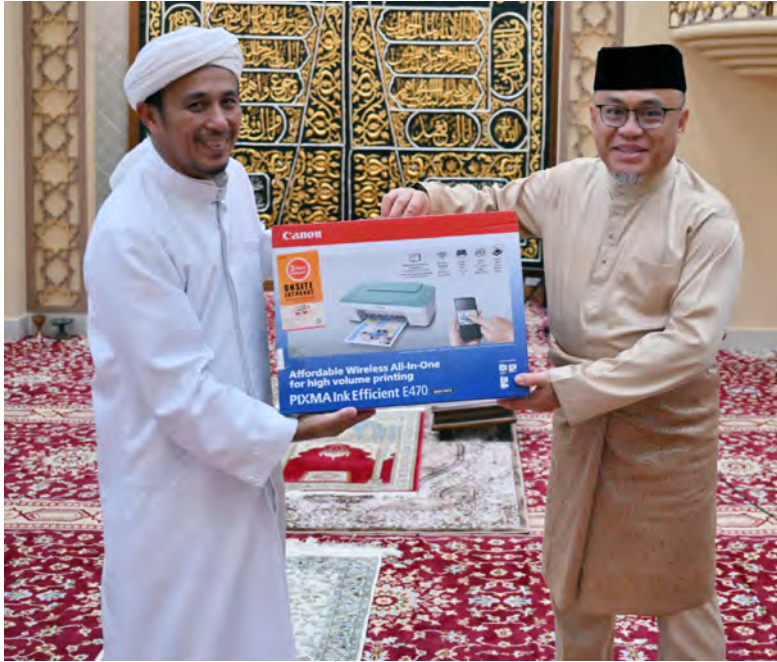
YANG Berhormat Menteri Sumber-Sumber Utama dan Pelancongan hadir selaku tetamu kehormat majlis dan seterusnya menyerahkan sumbangan wakaf kepada Imam Masjid berkenaan (kanan dan atas).

Berita : Pg. Siti Redzaimi Pg. Haji Ahmad