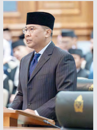
YANG Berhormat Menteri Pengangkutan dan Infokomunikasi.

"Bagi perkara ini, Jabatan Pengangkutan Darat juga sedang membuat penelitian untuk melarutkan pensyarahan Kursus Defensive Driving kepada para pemandu bas awam dan juga bas