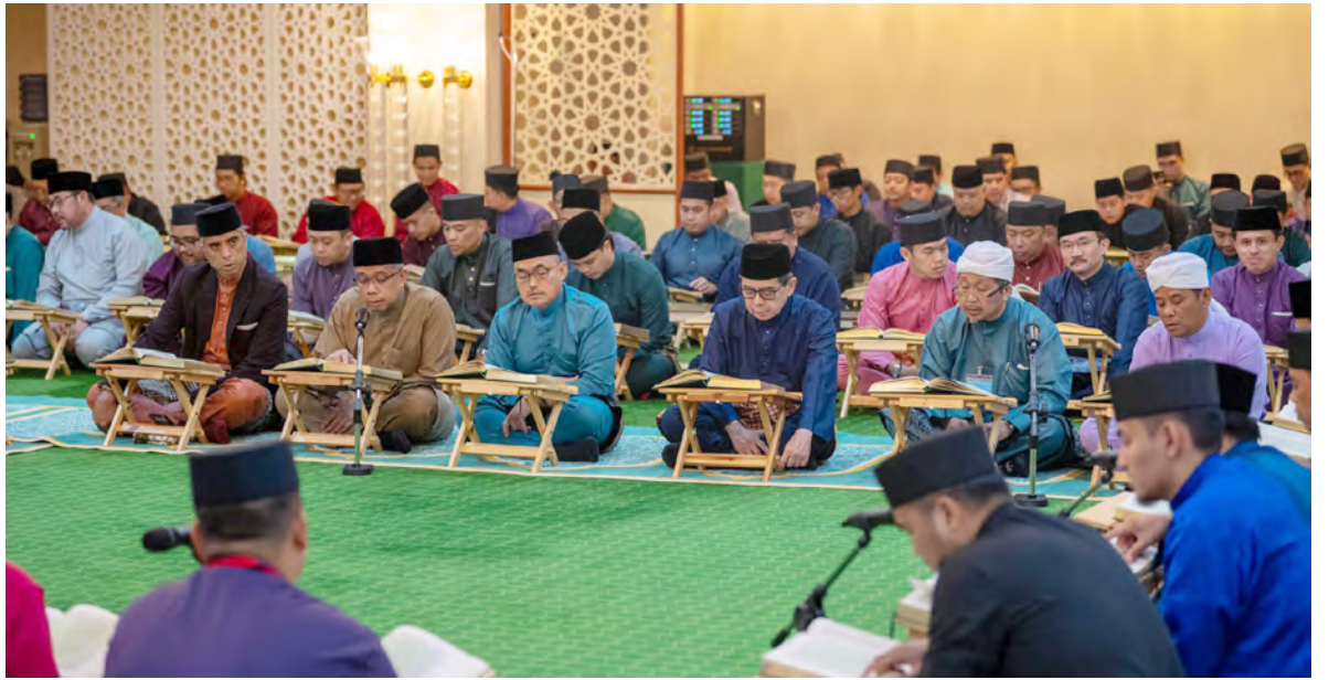
YANG Berhormat Menteri di Jabatan Perdana Menteri (JPM) dan Menteri Kewangan dan Ekonomi II semasa hadir pada Majlis Bertadarus Malam-malam Bulan Ramadan bagi Tahun 1446 Hijrah / 2025 Masihi (atas). Manakala gambar atas kiri dan bawah kiri, suasana pada majlis tersebut yang diadakan di Surau, Istana Nurul Iman.