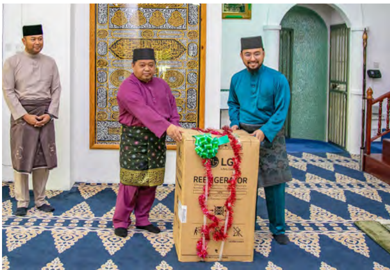
SETIAUSAHA Tetap (Perbandaran dan Daerah), Kementerian Hal Ehwal Dalam Negeri hadir selaku tetamu kehormat majlis semasa menyampaikan sumbangan wakaf dan seterusnya menyampaikan derma kepada salah seorang penerima (atas dan bawah).