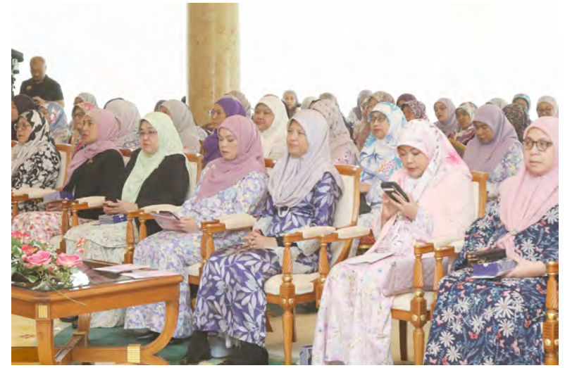
YANG Berhormat Peguam Negara hadir selaku tetamu kehormat pada Majlis Kesyukuruan (Khas Wanita) yang berlangsung di Kompleks Sukan Jerudong.

sahaja menjadi wadah untuk memperingati pencapaian wanita tetapi juga sebagai platform bagi memperkukuh kesedaran dan sokongan terhadap usaha pemerikasaan wanita dalam pelbagai aspek kehidupan.