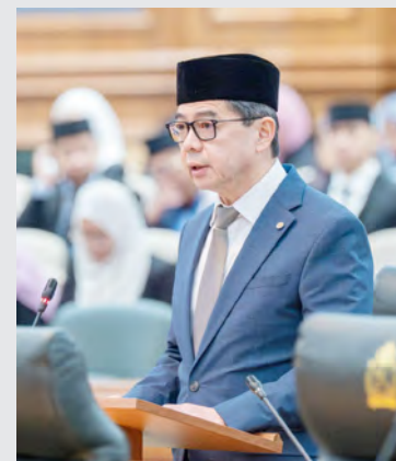
YANG Berhormat Menteri di Jabatan Perdana Menteri dan Menteri Kewangan dan Ekonomi II.

Di samping itu, Yang Berhormat seterusnya menjelaskan, beberapa usaha juga telah diungkayahkan di bawah Manpower Industry Steering Committee yang telah mengenal pasti 60 jenis critical occupations yang diperlukan dan dapat disisakan oleh anak tempatan. Daripada penganalisaan terhadap critical occupations berkenaan, ia akan dapat membuka sebanyak lebih 5,000 peluang pekerjaan di sektor