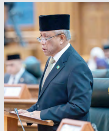
YANG Berhormat Menteri di Jabatan Perdana Menteri dan Menteri Pertahanan II.

keharmonian bernegara, agensi-agensi media rasmi kerajaan melalui Jabatan Radio Televisyen Brunei dan Jabatan Penerangan akan terus berperanan sebagai saluran utama maklumat kerajaan secara tepat dan berkesan melalui pelbagai platform media. Kerjasama erat antara media kerajaan adalah sangat penting dalam membina kefahaman rakyat terhadap dasar dan inisiatif kerajaan. Di samping itu, pendekatan akar umbi akan sentiasa diperkukuh sebagai jambatan perhubungan dua hala antara kerajaan dan rakyat dalam memastikan setiap maklum balas dapat ditangani sewajarnya," tambah Yang Berhormat lagi.