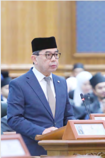
YANG Berhormat Menteri di Jabatan Perdana Menteri dan Menteri Kewangan dan Ekonomi II.

Oleh : Muhammad Khairulanwar Ali Rahman