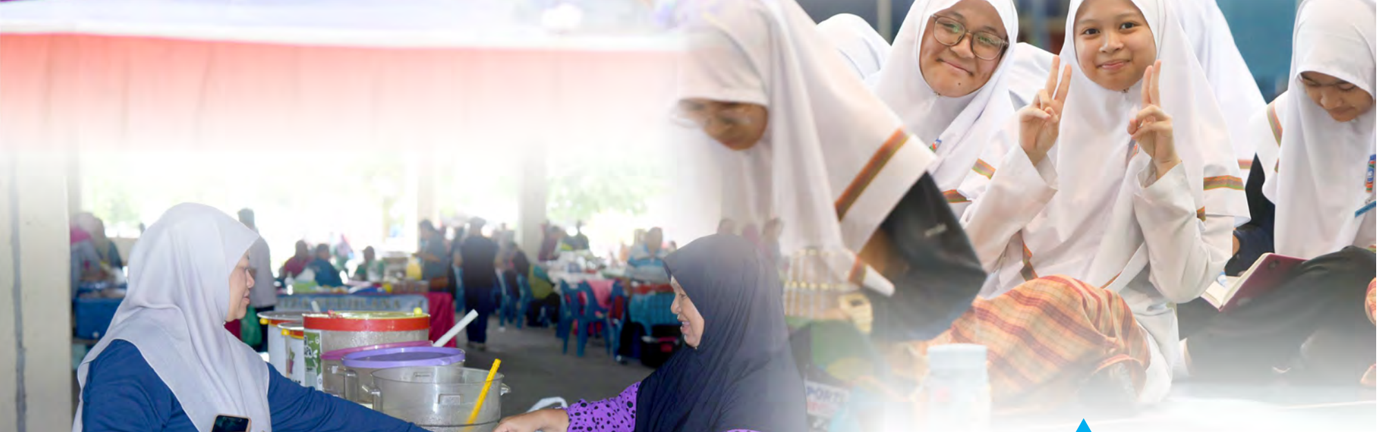
◀ PENYERAHAN derma kepada anak-anak yatim Peringkat Kebangsaan Tahun 1446 Hijrah / 2025 Masihi bagi membantu menambah kegembiraan anak-anak yatim di seluruh negara menjelang ketibaan bulan Syawal tahun ini.