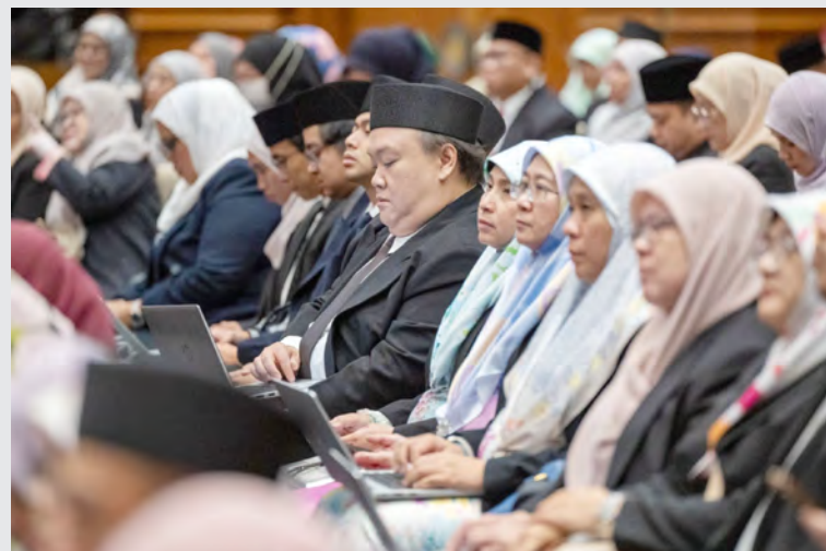
ANTARA yang hadir mendengarkan persidangan hari ketujuh Mesyuarat Pertama dari Musim Permesyuaratan Ke-21, MMN.

Yang Berhormat seterusnya menjelaskan, setakat ini, dua program iaitu Basic Local Host Tourist Guide dan Language Course for Tourist Guide telah diungkuhkan bersama dengan sokongan Kementerian Sumber-Sumber Utama dan Pelancongan dan Pusat Pembelajaran Sepanjang Hayat (L3C), Kementerian Pendidikan.