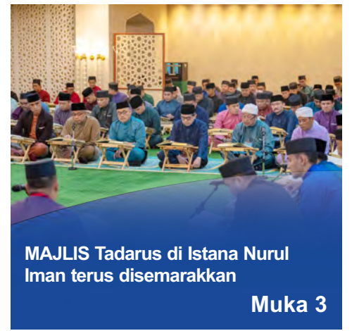
MAJLIS Tadarus di Istana Nurul Iman terus disemarakkan