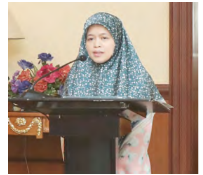
TAKZIRAH disampaikan oleh Pegawai Ugama dari Pusat Da'wah Islamiah.