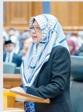
YANG Berhormat Menteri Pendidikan.

"InsyaaAllah, Kementerian Pendidikan akan terus berusaha untuk meningkatkan kesejahteraan dan kebajikan tenaga pengajar bagi memastikan mereka dapat melaksanakan tugas dan tanggungjawab dengan lebih berkesan," ujar Yang Berhormat lagi.