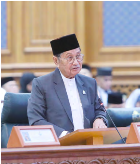
YANG Berhormat Menteri Hal Ehwal Ugama semasa menyampaikan ulasannya pada Mesyuarat Pertama dari Musim Permesyuaratan Ke-21 Majlis Mesyuarat Negara (MMN) bagi Tahun 1446 Hijrah / 2025 Masihi - Foto : Dk. Nur Hafilah Pg. Osman.

Oleh : Wan Mohamad Sahran Wan Ahmadi Foto : Mohammad Hasif Matzin, Dk. Nur Hafilah Pg. Osman