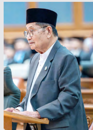
YANG Berhormat Menteri Hal Ehwal Ugama.

Mereka adalah bilangan asnaf yang telah diluluskan dalam tahun 2024 yang lalu. Mereka menerima agihan zakat untuk selama satu tahun atau dua tahun dan menerima wang agihan masing-masing melalui akaun