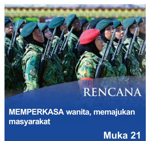
MEMPERKASAKAN wanita, memajukan masyarakat