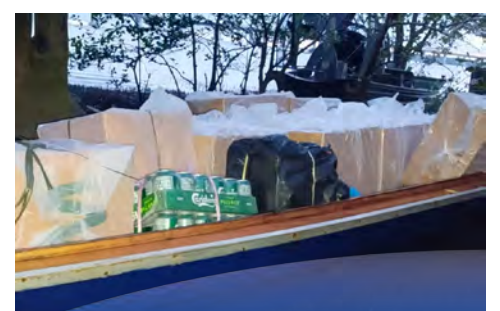
OPERASI Sepadu temui barang tegahan