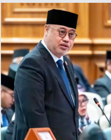
YANG Berhormat Menteri Kebudayaan, Belia dan Sukan.

Oleh : Pg. Vivv Malessa Pg. Ibrahim