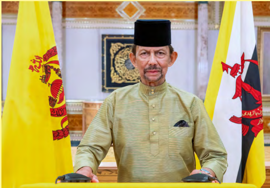
KEBAWAH Duli Yang Maha Mulia Paduka Seri Baginda Sultan Haji Hassanal Bolkiah Mu'izzaddin Waddaulah ibni Al-Marhum Sultan Haji Omar 'Ali Saifuddin Sa'adul Khairi Waddien, Sultan dan Yang Di-Pertuan Negara Brunei Darussalam berkenan mengurniakan Titah Perutusan sempena Menyambut Awal Bulan Ramadan bagi Tahun 1446 Hijrah / 2025 Masih di Istana Nurul Iman.

Assalamu'alaikum Warahmatullahi Wabarakatuh Bismillahir Rahmanir Rahim Alhamdulillah Rabbil 'Alameen, Wabihiee Nasta'eenu 'Alaa Umuuriddunya Wadden, Wassalaatu' Wassalaamu 'Ala Asyarafil Mursaleen, Sayyidina