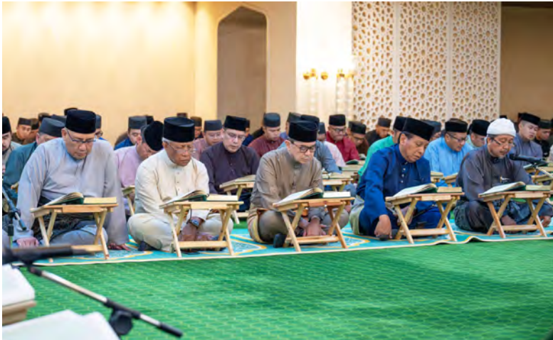
YANG Berhormat Menteri di Jabatan Perdana Menteri (JPM) dan Menteri Pertahanan II dan Yang Berhormat Menteri di JPM dan Menteri Kewangan dan Ekonomi II hadir pada Majlis Tadarus pada malam ketiga sempena menyambut Ramadan Al-Mubarak (kir). Manakala gambar bawah, antara yang hadir pada majlis yang diadakan di Istana Nurul Iman.

Oleh : Wan Mohamad Sahran Wan Ahmadi