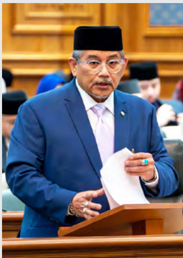
YANG Berhormat Menteri Hal Ehwal Luar Negeri II.

BANDAR SERI BEGAWAN, Selasa, 4 Mac. - Negara Brunei Darussalam (NBD) dan Malaysia sedang giat melaksanakan kerja-kerja penandaan dan pengukuran sempadan darat kedua-dua buah negara di mana kerjasama ini telah berjalan dengan lancar sejak penubuhan Jawatankuasa Teknikal Penandaan dan Pengukuran Sempadan Darat pada tahun 2012.