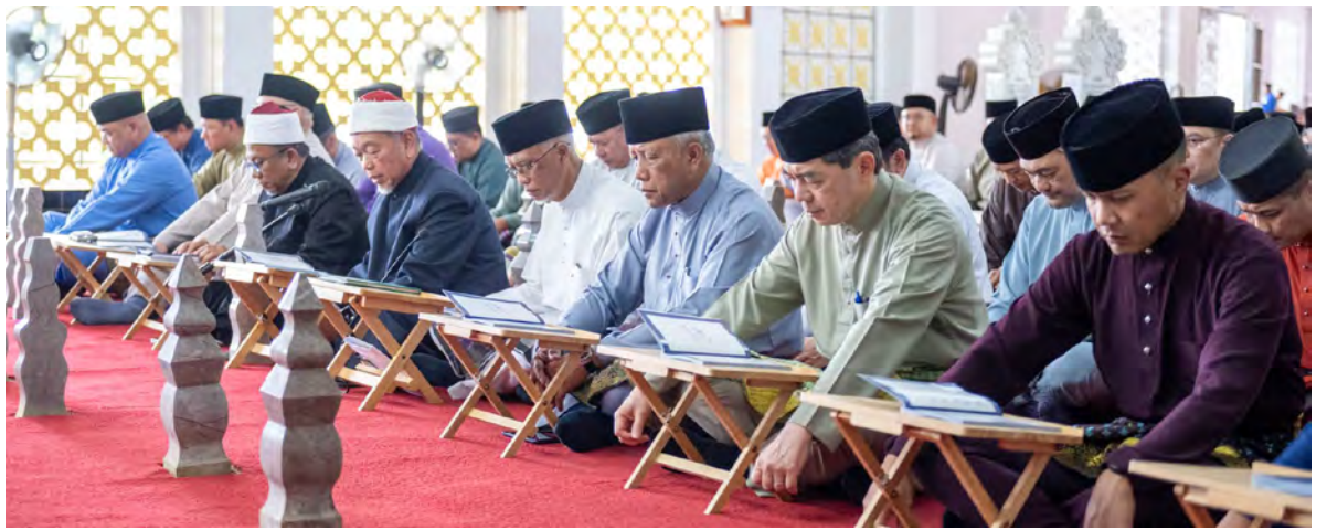
YANG Berhormat Menteri di Jabatan Perdana Menteri (JPM) dan Menteri Pertahanan II dan Yang Berhormat Menteri di JPM dan Menteri Kewangan dan Ekonomi II hadir bagi mengetuai rombongan JPM dan jabatan-jabatan di bawahnya pada Majlis Bertahlil dan Membaca Surah Yaa Siin (atas), manakala gambar kiri, antara yang hadir pada majlis berkenaan.

Oleh : Pg. Syi'aruddin Pg. Dauddin