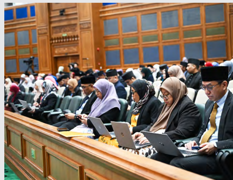
ANTARA yang hadir mendengarkan persidangan berkenaan.

"Ini boleh dilakukan dengan memfokuskan kajian pada satu jenama produk makanan tertentu dari peringkat pengilang, pengedar hingga ke penjual," ujar Yang Berhormat lagi.