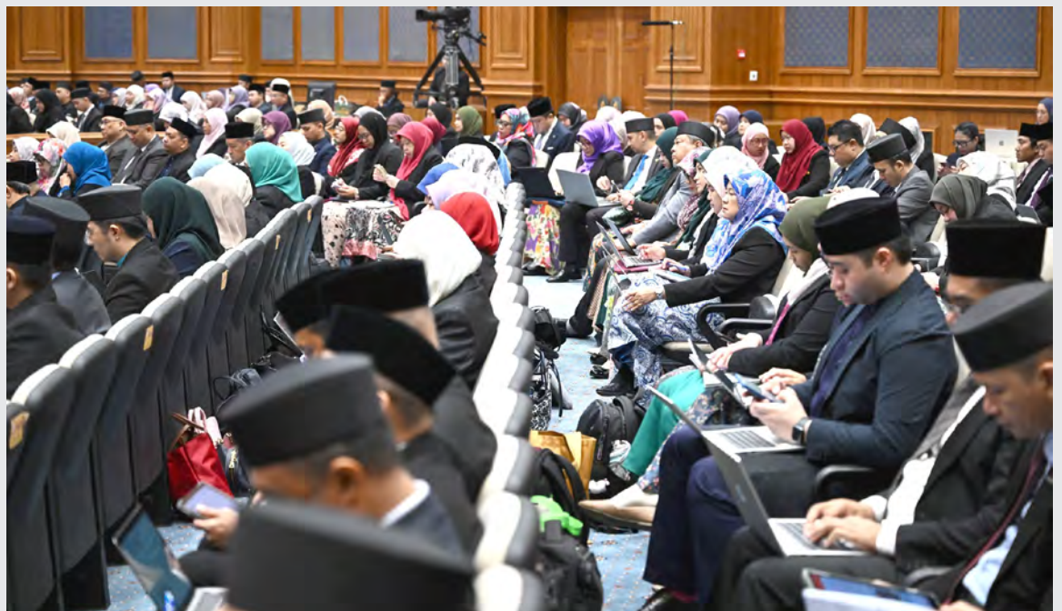
SEKITAR Persidangan MMN tersebut.

Di samping itu, Yang Berhormat menerangkan bahawa pihak CSB juga sedang giat berbincang bersama International Telecommunication Unit (ITU) untuk mengadakan bengkel dengan melibatkan agensi-agensi yang berkenaan dan bertujuan untuk mengubahsuaikan dan menggubal rangka kerja khusus bagi perlindungan kanak-kanak yang komprehensif dan lebih actionable .