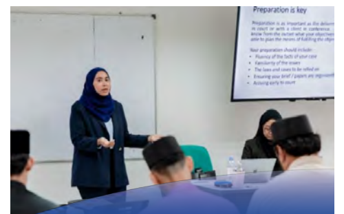
BERI pendedahan praktikal peranan, etika pengamal undang-undang