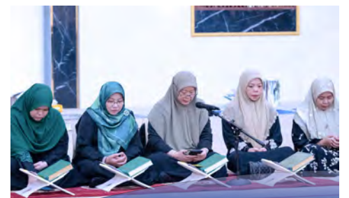
MASJID Az-Zakireen Meragang anjur Majlis Bertadarus