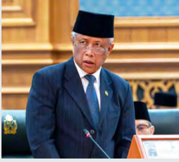
YANG Berhormat Menteri di Jabatan Perdana Menteri (JPM) dan Menteri Pertahanan II.