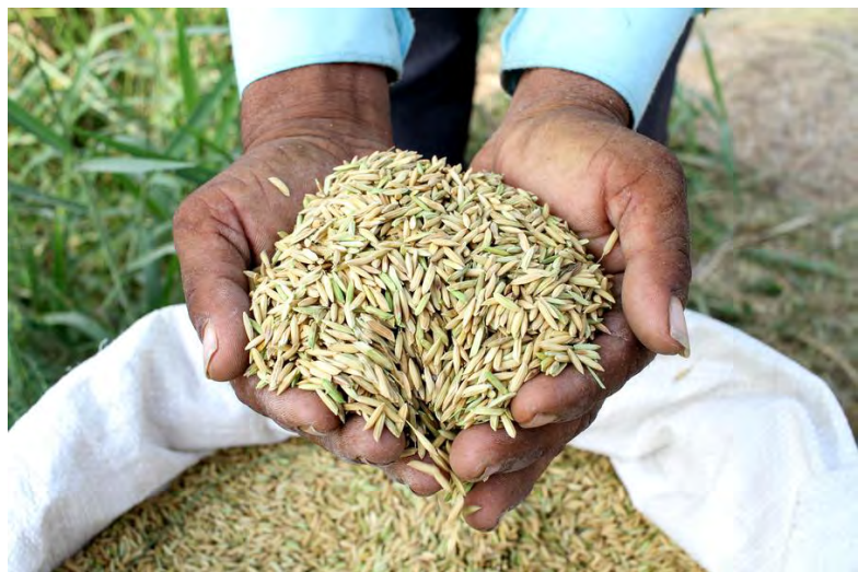
SEORANG petani memegang biji padi selepas menuai di sawah di Kampung Krueng Seupeng di Kabupaten Aceh Utara, Provinsi Aceh, Indonesia.

JAKARTA, 4 Mac. - Kerajaan Indonesia berkata bahawa negara itu memerlukan sekurang-kurangnya 4 juta tan beras untuk menyokong program makanan berkhasiat percuma, yang bertujuan memberi manfaat kepada 82.9 juta orang pada Isnin.