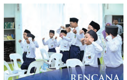
KEKAL produktif ketika berpuasa