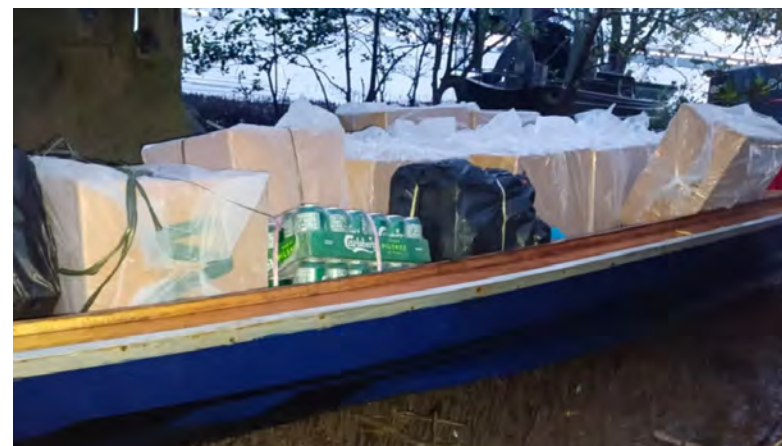
PASUKAN rondaan ABDB mengesan dua perahu yang dipercayai membawa muatan barang tegahan di kawasan perairan Sungai Bunga (atas), manakala gambar bawah kiri, hasil siasatan lanjut mengesahkan bahawa perahu tersebut membawa barangan tegahan iaitu 860 karton rokok pelbagai jenama dan minuman keras pelbagai jenis sebanyak 97 tin dan 21 botol.

Pasukan keselamatan akan terus mempertingkatkan operasi penguatkuasaan bagi memastikan perairan negara bebas daripada sebarang kegiatan jenayah. PPDB juga menyeru kepada orang ramai agar melaporkan sebarang aktiviti mencurigakan atau menyalahi undang-undang, khususnya di kawasan perairan, demi memastikan keamanan dan keselamatan Negara Brunei Darussalam.