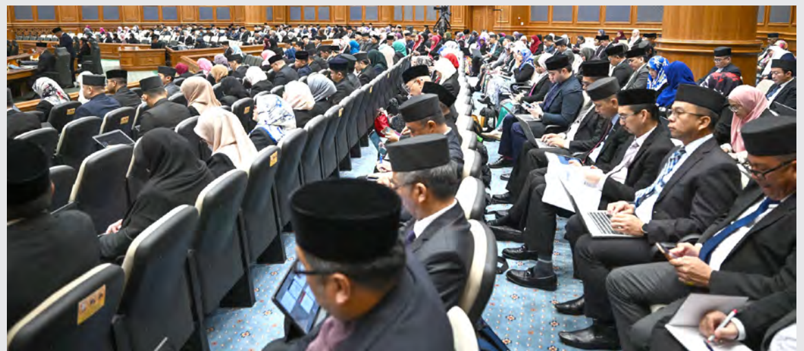
ANTARA yang hadir pada persidangan tersebut.

"Jadi secara kesimpulannya, kementerian ini kekal komited dalam memperkasa infrastruktur sukan negara bagi menyokong pembangunan atlet serta meningkatkan keupayaan Negara Brunei Darussalam dalam penganjuran acara sukan bertaraf antarabangsa. Kementerian ini juga memastikan pembangunan sukan akar umbi dan program sukan rekreasi akan terus diperkasa yang antara lain melalui Program Pembangunan Atlet Muda," jelas Yang Berhormat.