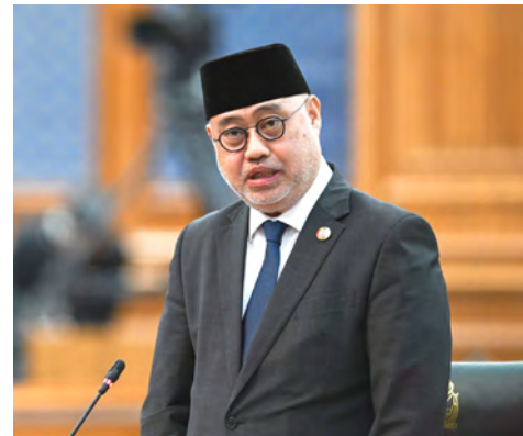
YANG Berhormat Menteri Kebudayaan, Belia dan Sukan semasa menjawab persoalan pada Mesyuarat Pertama dari Musim Permesyuaratan Ke-21 MMN bagi Tahun 1446 Hijrah / 2025 Masihi.