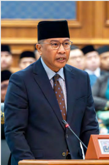
YANG Berhormat Menteri Pengangkutan dan Infokomunikasi.

BANDAR SERI BEGAWAN, Selasa, 4 Mac. – Tindakan utama telah diusahakan berterusan bagi menyekat laman sesawang berunsur penipuan dan nombor telefon yang digunakan untuk panggilan dan Sistem Pesanan Ringkas (SMS) penipuan.