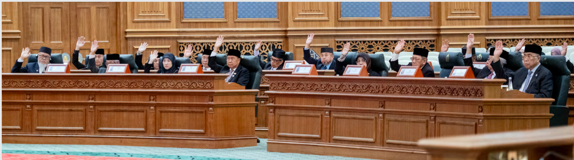
SEKITAR Mesyuarat Pertama dari Musim Permesyuaratan Ke-21 MMN bagi Tahun 2025.

Berhormat sekalian mahupun pihak kerajaan dan swasta serta penduduk NBD di dalam sama-sama menandai dan bersama-sama melaksanakan tanggungjawab masing-masing ke arah mencapai Wawasan Brunei 2035," ujar Yang Berhormat lagi.