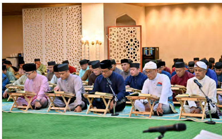
PEMERINTAH Angkatan Bersenjata Diraja Brunei dan Pemangku Pesuruhjaya Polis, Pasukan Polis Diraja Brunei hadir sama pada Majlis Tadarus Malam-malam Bulan Ramadan di Istana Nurul Iman.

Oleh : Haniza Abdul Latif