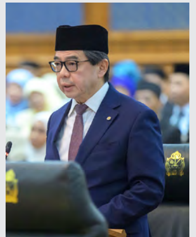
YANG Berhormat Menteri di Jabatan Perdana Menteri dan Menteri Kewangan dan Ekonomi II.

bawah pelan ini adalah untuk mengembangkan dan mengubah suai pelabuhan di mana, insyaaAllah, kedua-dua terminal kontena dan konvensional dirancang untuk diperbaiki dan diperluaskan.