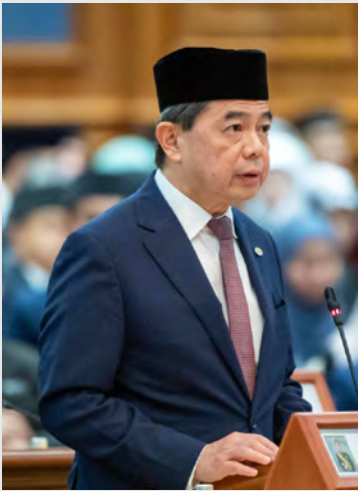
YANG Berhormat Menteri di Jabatan Perdana Menteri dan Menteri Kewangan dan Ekonomi II.