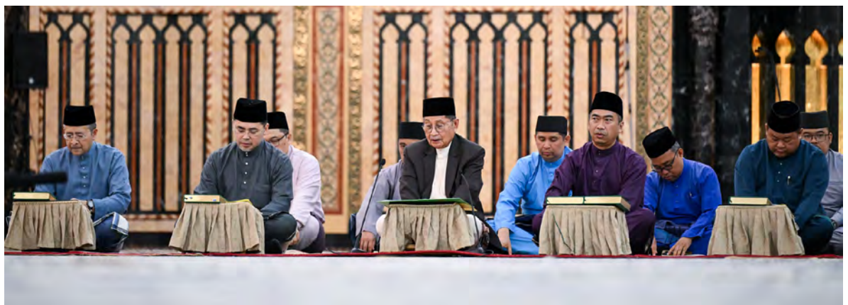
YANG Berhormat Menteri Hal Ehwal Ugama hadir selaku tetamu kehormat pada Majlis Pembukaan Tadarus Al-Quran Bagi Masjid, Surau, Balai Ibadat Seluruh Negara diadakan di Jame' 'Asr Hassanil Bolkiah, Kampung Kiarong (atas), manakala gambar bawah kanan, majlis diserikan dengan Tadabbur Al-Quran yang disampaikan oleh Pegawai Perkembangan Ugama, Pusat Da'wah Islamiah, Haji Awang Muhammad Najib bin Haji Awang.

Majlis Pembukaan Tadarus Al-Quran Bagi Masjid, Surau, Balai Ibadat Seluruh Negara dikendalikan oleh KHEU melalui Jabatan Hal Ehwal Masjid dengan kerjasama Ahli Jawatankuasa Takmir Jame' 'Asr Hassanil Bolkiah,