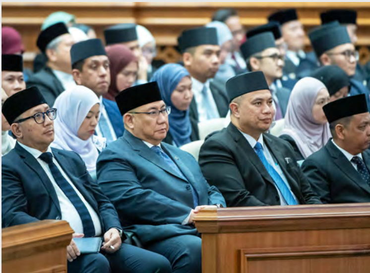
ANTARA yang hadir pada persidangan tersebut.

Di samping peruntukan-peruntukan yang telah dikongsikan tambah Yang Berhormat, kerajaan juga menyediakan peruntukan sejumlah BND27.5 juta di bawah Projek Fokus khusus untuk membiayai program atau projek yang menjurus kepada mendukung fokus belanjawan Negara Tahun Kewangan 2025/2026.