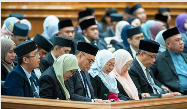
SEBAHAGIAN yang hadir pada persidangan tersebut.

"Setakat ini, seramai 794 perantis sedang menjalankan program ini di Kementerian dan jabatan kerajaan," ujar Yang Berhormat lagi.