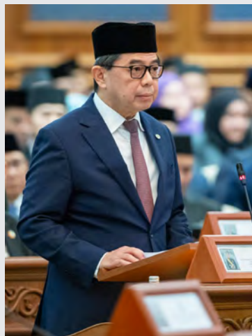
YANG Berhormat Menteri di Jabatan Perdana Menteri dan Menteri Kewangan dan Ekonomi II.

BANDAR SERI BEGAWAN, Sabtu, 1 Mac. - Kerajaan juga akan meneruskan usaha untuk memupuk hubungan yang lebih kukuh dengan rakan kongsi antarabangsa bagi meningkatkan akses kepada pasaran baharu, peluang pelaburan dan teknologi terkini bagi membantu sektor-sektor industri tempatan.