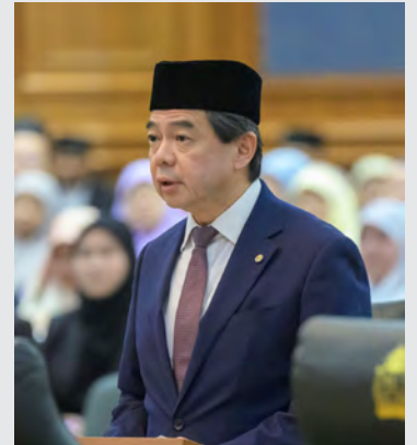
YANG Berhormat Menteri di Jabatan Perdana Menteri dan Menteri Kewangan dan Ekonomi II.

Ke arah usaha dalam menyediakan tenaga kerja tempatan yang berdaya maju agar sejajar dengan keperluan bidang pekerjaan dan industri