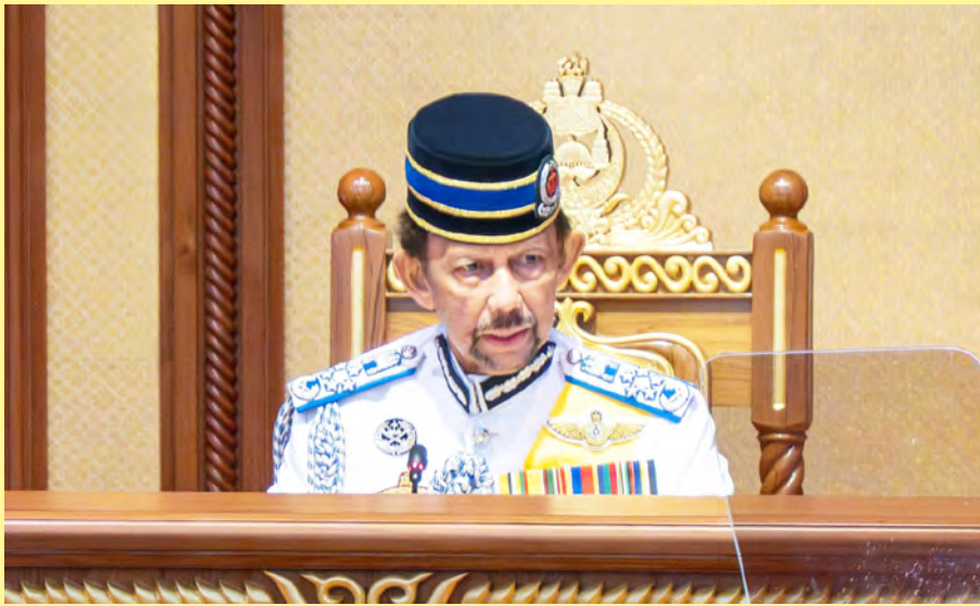
KEBAWAH Duli Yang Maha Mulia Paduka Seri Baginda Sultan Haji Hassanal Bolkiah Mu'izzaddin Waddaulah ibni Al-Marhum Sultan Haji Omar 'Ali Saifuddien Sa'adul Khairi Waddien, Sultan dan Yang Di-Pertuan Negara Brunei Darussalam berkenan mengurniakan titah semasa Istiadat Pembukaan Rasmi Mesyuarat Pertama dari Musim Permesyuaratan Ke-21 Majlis Mesyuarat Negara bagi Tahun 1446 Hijrah / 2025 Masihi yang berlangsung di Bangunan Dewan Majlis pada Rabu, 26 Februari 2025.

Assalamu'alaikum Warahmatullahi Wabarakatuh Bismillahir Rahmanir Rahim Alhamdulillah Rabbil 'Alameen, Wabihiee Nasta'eenu 'Alaa Umuuriddunya Wadden, Wassalaatu Wassalaamu 'Ala Asyrafil Mursaleen, Sayyidina Muhammaddin, Wa'ala Aalihee Wasahbihee Ajma'een, Waba'du