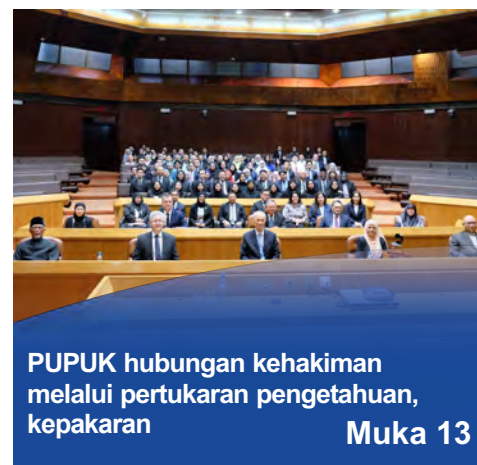
PUPUK hubungan kehakiman melalui pertukaran pengetahuan, kepakaran