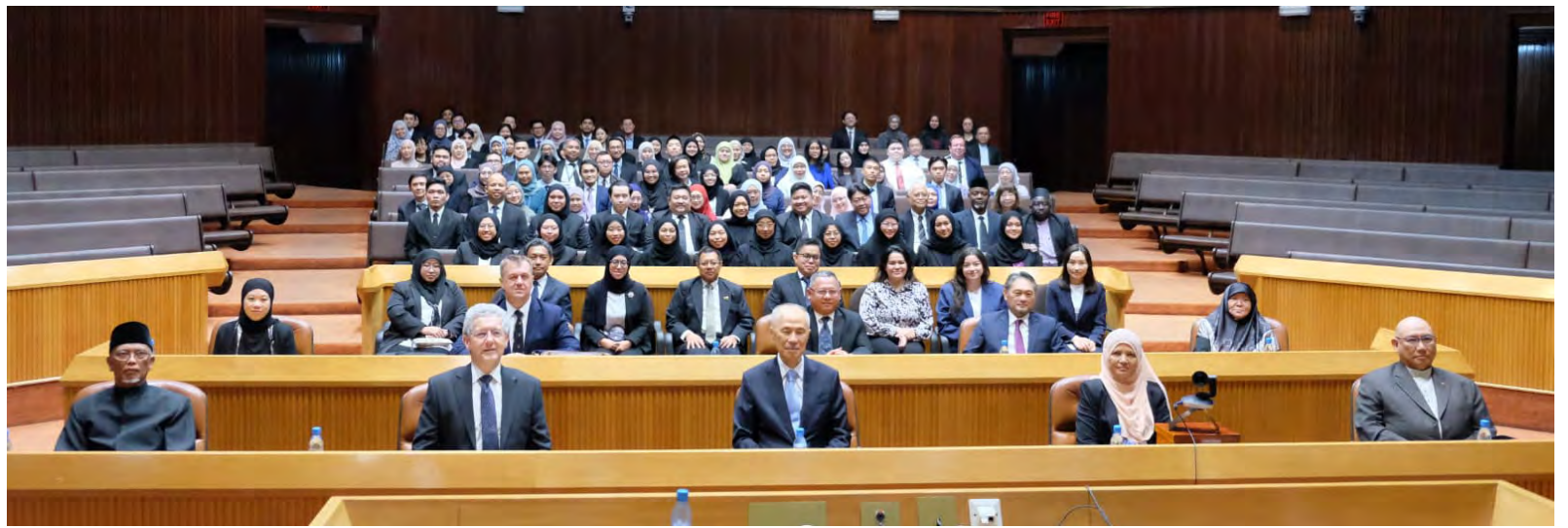
TIMBALAN Presiden Mahkamah Besar United Kingdom, The Right Honourable Lord Patrick Stewart Hodge hadir bagi menyampaikan Kuliah Ucaptama. Turut hadir, Yang Berhormat Peguam Negara, Yang Amat Arif / Yang Berhormat Ketua Hakim Syarie dan Yang Mulia Timbalan Menteri (Urustadbir Perkhidmatan Awam) Jabatan Perdana Menteri.

Pada perjumpaan tersebut, Ketua Hakim Mahkamah Besar