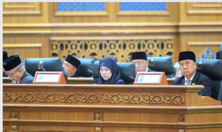
ANTARA Yang Berhormat Ahli Majlis Mesyuarat Negara (MMN) hadir pada Mesyuarat Pertama dari Musim Permesyuaratan Ke-21 MMN bagi Tahun 1446 Hijrah / 2025 Masihi.

"Para pencari kerja akan dapat berpeluang untuk memahami lebih lanjut mengenai program-program yang ditawarkan oleh PPB, berinteraksi secara langsung dengan agensi-agensinya yang ikut serta, meningkatkan pengetahuan mengenai persediaan menghadiri ujian, temu duga dan sebagainya bagi meningkatkan kebolehpasaran para pencari kerja," ujar Yang Berhormat.