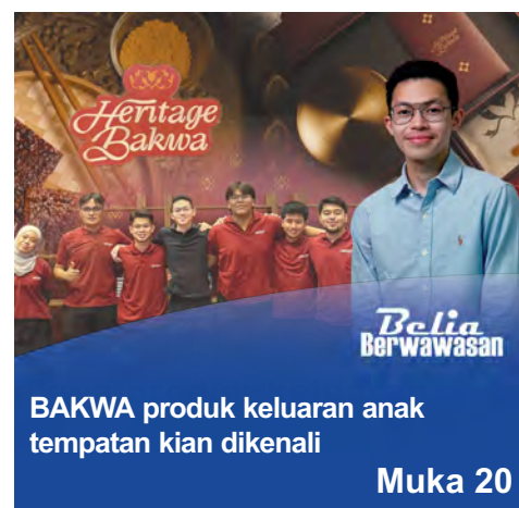
BAKWA produk keluaran anak tempatan kian dikenali