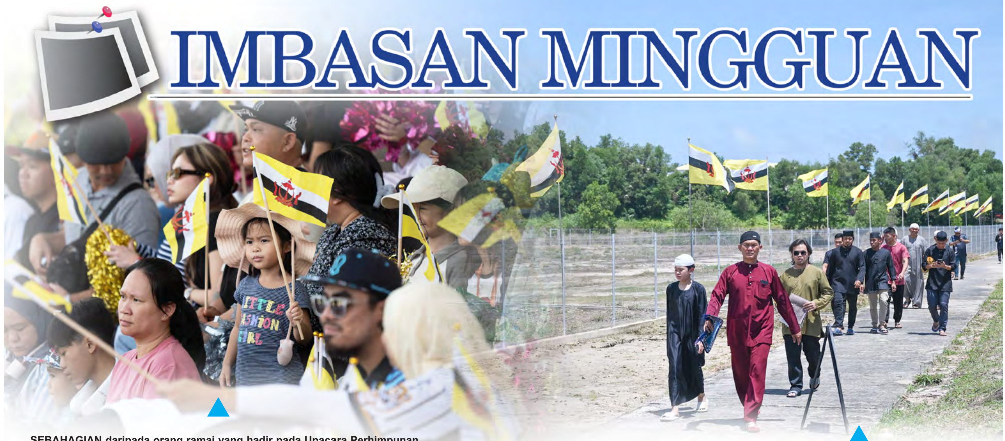
SEBAHAGIAN daripada orang ramai yang hadir pada Upacara Perhimpunan Agung Hari Kebangsaan Ke-41.