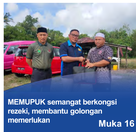
MEMUPUK semangat berkongsi rezeki, membantu golongan memerlukan