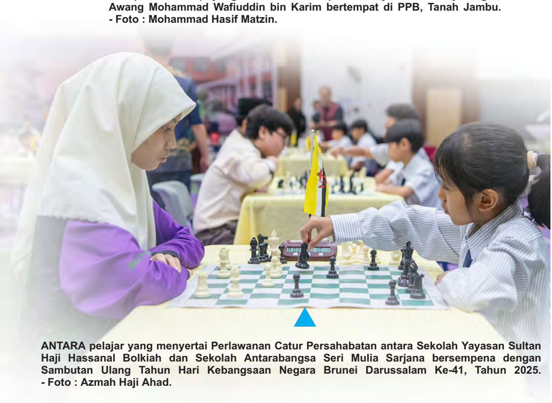
ANTARA pelajar yang menyertai Perlawanan Catur Persahabatan antara Sekolah Yayasan Sultan Haji Hassanal Bolkiah dan Sekolah Antarabangsa Seri Mulia Sarjana bersempena dengan Sambutan Ulang Tahun Hari Kebangsaan Negara Brunei Darussalam Ke-41, Tahun 2025.