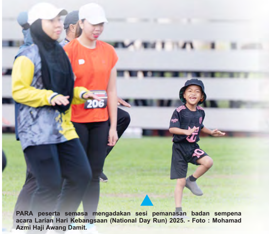
PARA peserta semasa mengadakan sesi pemanasan badan sempena acara Larian Hari Kebangsaan (National Day Run) 2025.