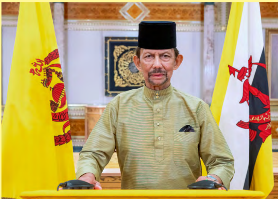
KEBAWAH Duli Yang Maha Mulia Paduka Seri Baginda Sultan Haji Hassanal Bolkiah Mu'izzaddin Waddaulah ibni Al-Marhum Sultan Haji Omar 'Ali Saifuddien Sa'adul Khairi Waddien, Sultan dan Yang Di-Pertuan Negara Brunei Darussalam berkenan mengurniakan Titah Perutusan sempena Menyambut Awal Bulan Ramadan bagi Tahun 1446 Hijrah / 2025 Masihi.