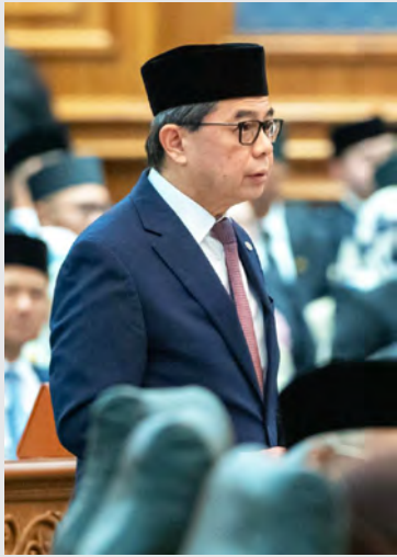
YANG Berhormat Menteri di Jabatan Perdana Menteri dan Menteri Kewangan dan Ekonomi II.

BANDAR SERI BEGAWAN, Sabtu, 1 Mac. - Sektor pertanian, perikanan dan penternakan terus menjadi tonggak penting dalam usaha kita membangunkan ekonomi yang mampan dan berdaya tahan.