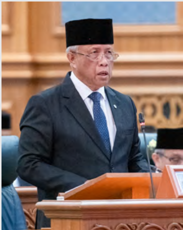
YANG Berhormat Menteri di Jabatan Perdana Menteri dan Menteri Pertahanan II (atas), manakala gambar bawah kanan, sebahagian yang hadir pada persidangan tersebut.