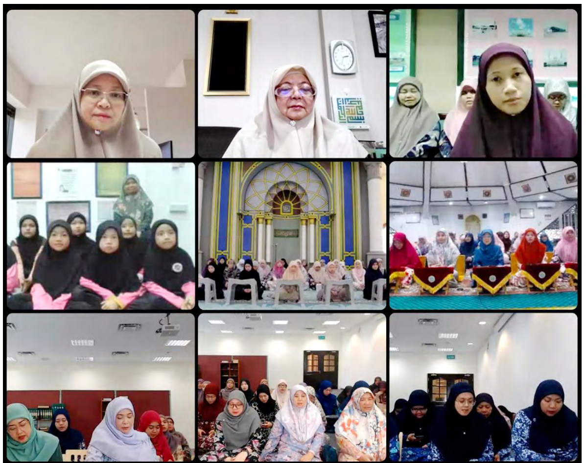
ANTARA yang hadir pada Munajat Khas Wanita bagi Program Semarak Hari Kebangsaan Negara Brunei Darussalam Ke-41, Tahun 2025.

Sekian, Wabillahi Taufik Walhidayah, Wassalamualaikum Warahmatullahi Wabarakatuh.