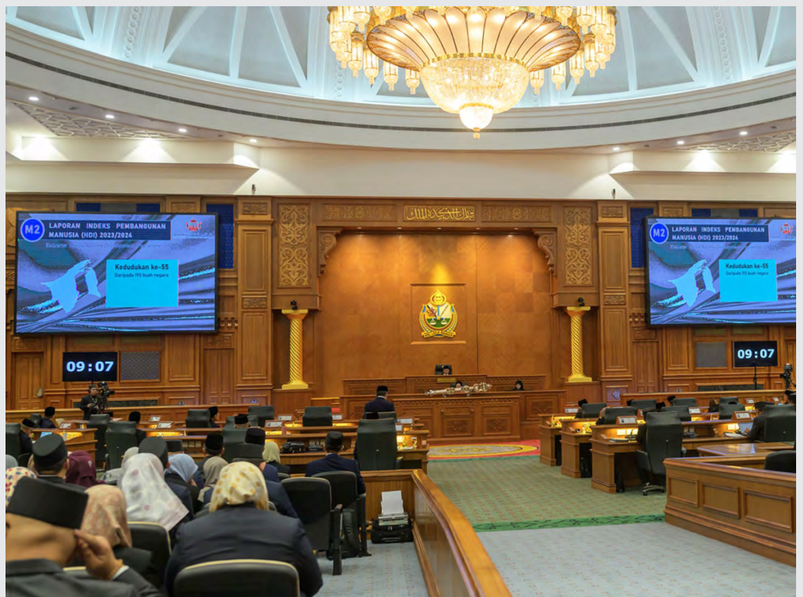
SUASANA hari ketiga Mesyuarat Pertama dari Musim Permesyuaratan Ke-21 Majlis Mesyuarat Negara.

banyak pelaburan untuk meningkatkan aktiviti ekonomi yang bernilai tinggi, seperti aktiviti-aktiviti Petroleum Intermediate Derivatives," ujar Yang Berhormat lagi.