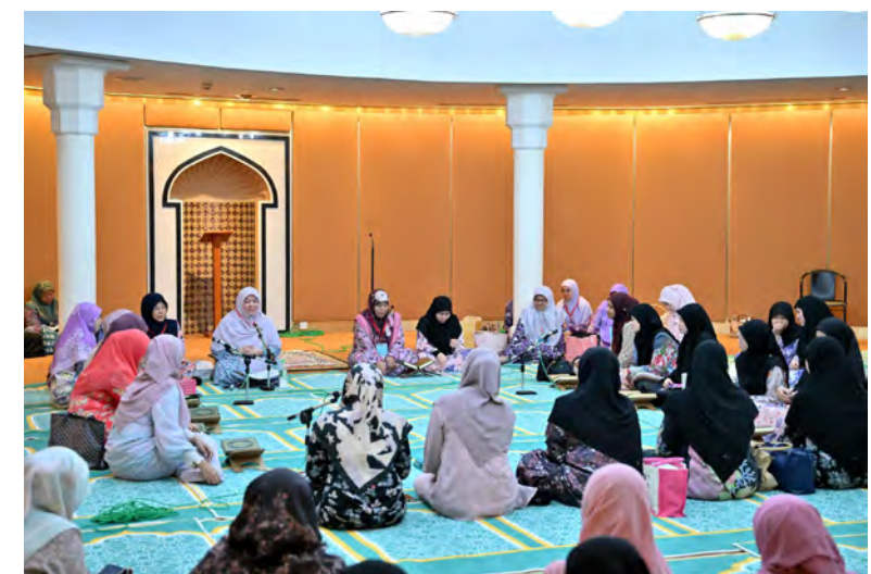
ANTARA yang hadir pada Majlis Tadarus berkenaan.