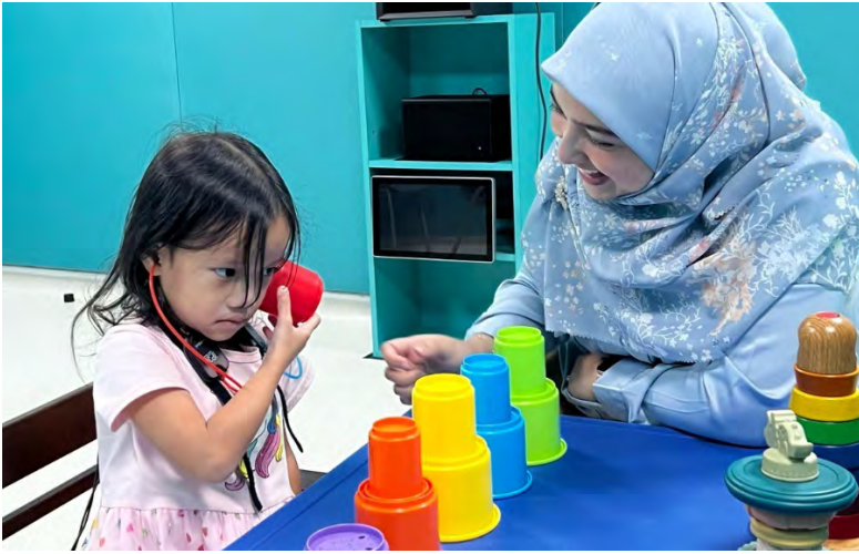
HARI Pendengaran Sedunia disambut setiap tahun pada 3 Mac untuk meningkatkan kesedaran orang ramai mengenai pentingnya penjagaan telinga dan pendengaran.