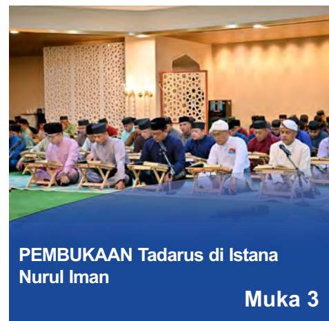
PEMBUKAAN Tadarus di Istana Nurul Iman