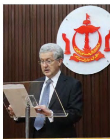
TIMBALAN Presiden Mahkamah Besar United Kingdom, The Right Honourable Lord Patrick Stewart Hodge menyampaikan kuliah.

Pengaturan ini mengecualikan JCPC daripada mempunyai bidang kuasa untuk mendengar perkara jenayah dan perlembagaan dan adalah selaras dengan status bebas NBD, sambil mengekalkan hubungannya dengan Mahkamah