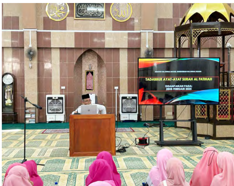
TADABBUR Surah Al-Fatihah bagi Kelas Al-Quran dan Muqaddam yang berlangsung di Masjid Sultan Sharif Ali, Sengkurong.

Semoga program seumpama berkenaan akan dapat membentuk kanak-kanak khususnya penuntut Kelas Al-Quran dan Muqaddam menjadi seorang yang dapat