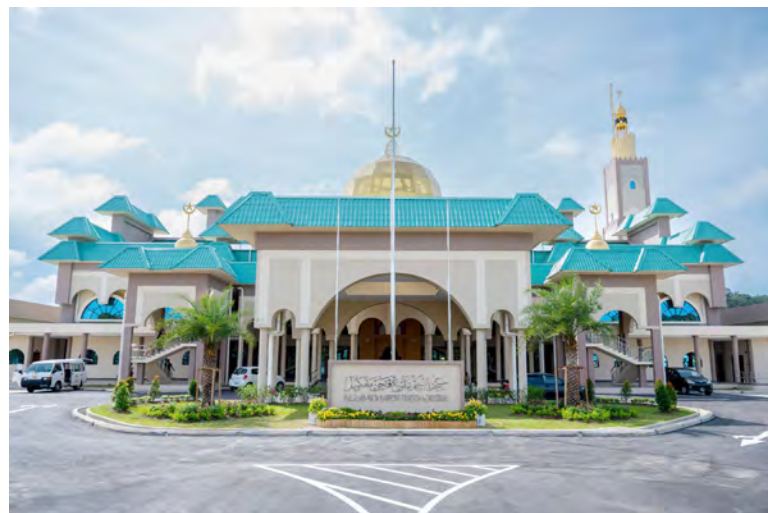
MASJID An-Na'im, Kampung Panchor Mengkubau.

Majlis Kebawah Duli Yang Maha Mulia Paduka Seri Baginda Sultan dan Yang Di-Pertuan Negara Brunei Darussalam melalui kerajaan baginda atas pengurniaan masjid bagi RPN Kampung Panchor Mengkubau, Mukim Mentiri berkenaan.