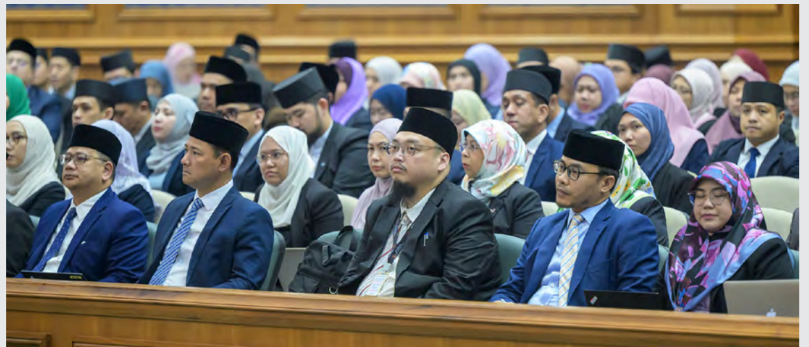
SEBAHAGIAN yang hadir mendengarkan persidangan berkenaan.

Government bagi memastikan projek-projek RKN akan berjalan dengan lancar dan sempurna mengikut garis masa yang telah ditetapkan ke arah mencapai kemajuan dan kepelbagaian ekonomi dengan penyediaan prasarana dan infrastruktur serta kemudahan-kemudahan asas demi menyokong pertumbuhan industri-industri dan sektor ekonomi baharu disamping untuk memperkasa sumber tenaga manusia dan bagi menjaga kesejahteraan dan kebajikan negara.