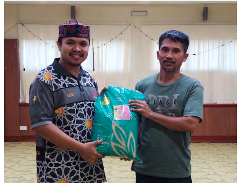
PROGRAM Infak Mahabbah Ramadan sempena Semarak Hari Kebangsaan Kali Ke-41 anjuran Pejabat Hal Ehwal Ugama Daerah Tutong (atas dan kiri).

TUTONG , Sabtu, 1 Mac. - Program Infak Mahabbah Ramadan sempena Semarak Hari Kebangsaan Kali Ke-41 anjuran Pejabat Hal Ehwal Ugama Daerah Tutong bertujuan untuk memupuk semangat berkongsi rezeki dan membantu golongan yang memerlukan.