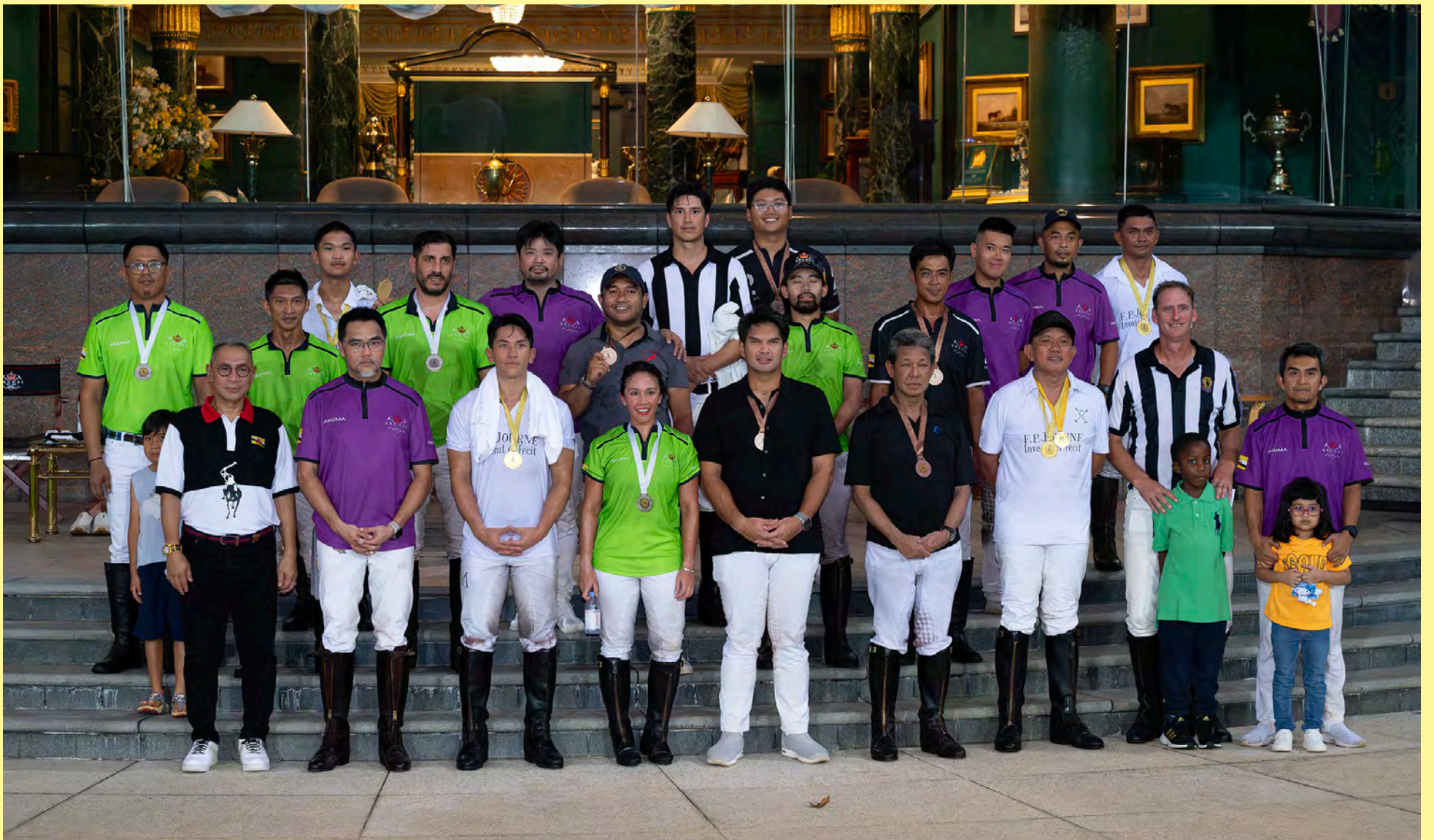
DULI Yang Teramat Mulia Paduka Seri Pengiran Muda 'Abdul Mateen, Duli Yang Teramat Mulia Paduka Seri Pengiran Digadong Sahibul Mal Pengiran Muda Haji Jefri Bolkiah, Yang Teramat Mulia Paduka Seri Pengiran Anak Puteri 'Azemah Ni'matul Bolkiah dan Yang Amat Mulia Pengiran Muda Bahar dijunjung bagi sesi bergambar ramai.