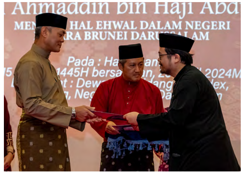
YANG Berhormat Menteri Hal Ehwal Dalam Negeri semasa hadir selaku tetamu kehormat dan seterusnya menyempurnakan penyampaian Sijil-sijil Taraf Kerakyatan kepada para penerima (kiri dan atas). Manakala gambar bawah kiri, para penerima yang hadir pada Majlis Penyampaian Sijil Taraf Kerakyatan Kali Ke-40, bertempat di Dewan Bankuet, Dewan Persidangan BRIDEX, Jerudong.

"Di sinilah juga peranan penghulu mukim dan ketua kampung sebagai mata, telinga dan lidah kerajaan untuk menjaga serta mengawasi kepentingan, kesejahteraan,