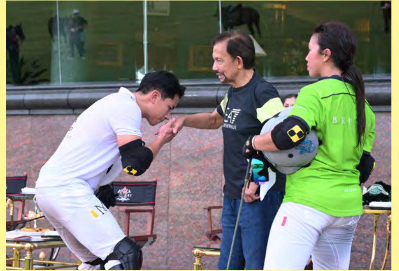
KEBAWAH Duli Yang Maha Mulia Paduka Seri Baginda Sultan Haji Hassanal Bolkiah Mu'izzaddin Waddaulah ibni Al-Marhum Sultan Haji Omar 'Ali Saifuddin Sa'adul Khairi Waddien, Sultan dan Yang Di-Pertuan Negara Brunei Darussalam berkenan berangkat bagi menyaksikan Kejohanan Polo Bulanan bagi Royal Brunei Polo and Riding Club (RBPRC). Berangkat pada perlawanan tersebut ialah paduka-paduka anakanda dan adinda baginda (atas dan kiri).

Pengiran Anak Puteri 'Azemah Ni'matul Bolkiah binti Kebawah Duli Yang Maha Mulia Paduka Seri Baginda Sultan Haji Hassanal Bolkiah Mu'izzaddin Waddaulah dengan kiraan 5.5 berbalas tiga dalam empat chukker .