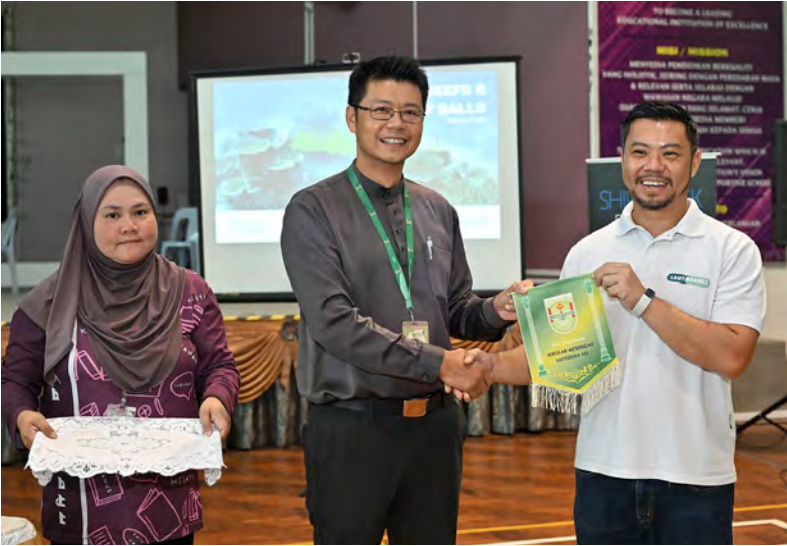
PENGETUA Sekolah Menengah Sayyidina Ali (SMSA) semasa hadir pada majlis berkenaan (kiri), manakala gambar kanan, para pelajar semasa menyaksikan pameran.