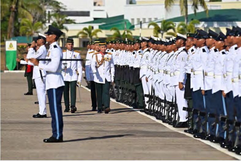
PEMERINTAH Tentera Darat Diraja Brunei hadir selaku tetamu kehormat pada majlis berkenaan dan seterusnya dijemput untuk memeriksa perbarisan (atas). Sementara gambar bawah kanan, antara yang hadir pada majlis tersebut.