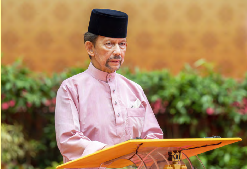
KEBAWAH Duli Yang Maha Mulia Paduka Seri Baginda Sultan Haji Hassanal Bolkiah Mu'izzaddin Waddaulah ibni Al-Marhum Sultan Haji Omar 'Ali Saifuddien Sa'adul Khairi Waddien, Sultan dan Yang Di-Pertuan Negara Brunei Darussalam berkenan mengurniakan titah pada Majlis Sambutan Hari Raya Aidilfitri anjuran Yayasan Sultan Haji Hassanal Bolkiah pada Isnin, 12 Syawal, 1445 Hijrah / 22 April, 2024 Masihi yang diadakan di Dewan Plenary, Pusat Persidangan Antarabangsa, Berakas.

dan kesengsaraan, seperti umat Islam di bumi Palestin. Sebagai orang Islam yang beriman, kita patut memberi perhatian kepada sabda Rasulullah Sallallahu Alaihi Wasallam riwayat Al-Bukhari maksudnya, bahawa tidak sempurna iman seseorang kecuali dia mengasihi saudaranya sebagaimana dia mengasihi dirinya sendiri.