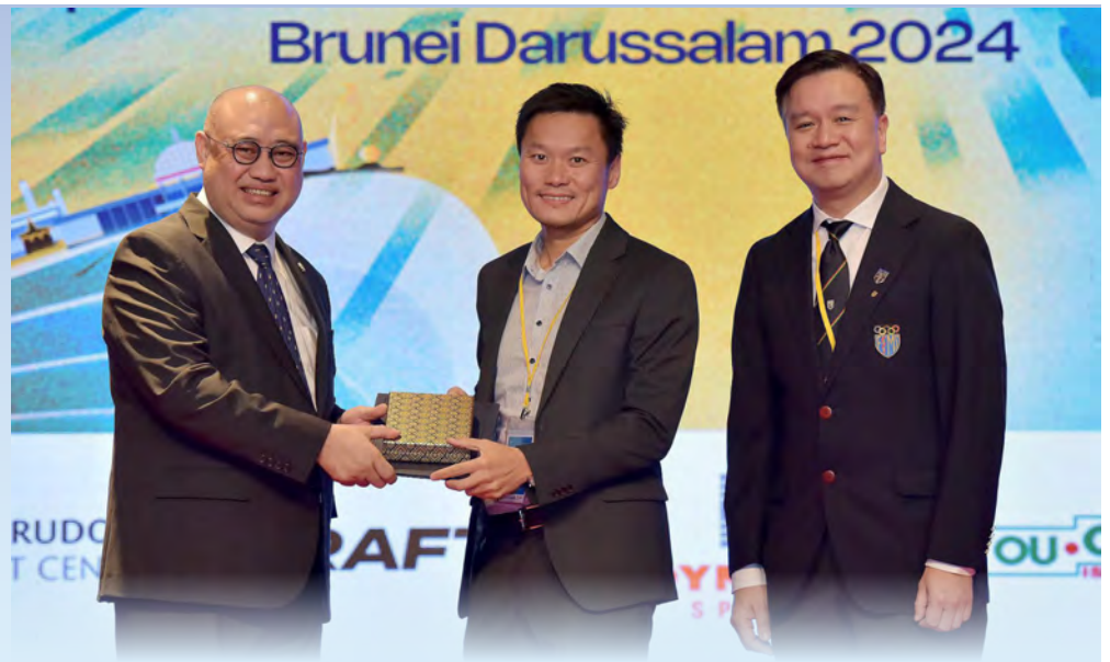
YANG Berhormat Menteri Kebudayaan, Belia dan Sukan semasa hadir pada Majlis Penutup Persidangan Sains Sukan dan Perubatan Brunei Darussalam 2024 di Songket Ballroom, The Rizqun International Hotel.

Selamat dan sesi bergambar ramai bersama tetamu kehormat.