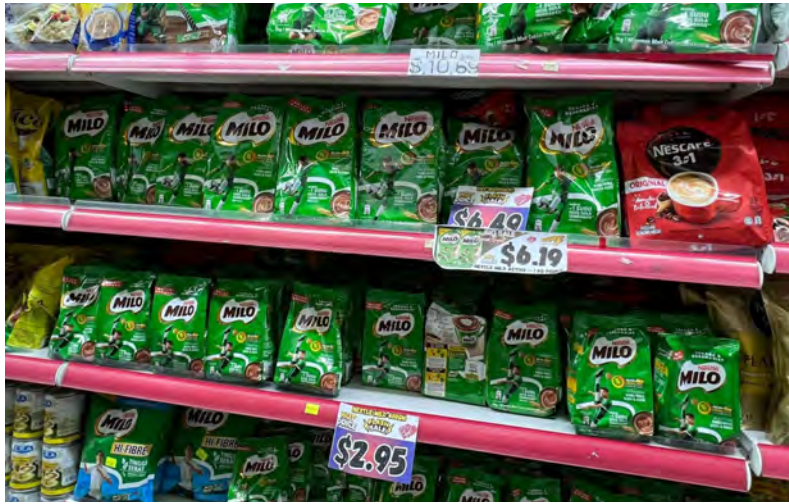
JABATAN Perancangan Ekonomi dan Statistik di Kementerian Kewangan dan Ekonomi mengeluarkan empat notis amaran kepada empat buah premis perniagaan kerana ketidakpatuhan terhadap Peraturan-peraturan Acara Harga Jualan Murah pada hujung Februari dan dalam bulan Mac 2024 (atas dan kanan).

Ini termasuk mempamerkan tanda harga, diskaun serta terma dan syarat dengan benar, jelas dan betul bagi membantu pengguna untuk membuat pilihan pembelian yang bermaklumat. Amalan perniagaan yang beretika dan wajar adalah penting bagi membantu meningkatkan keyakinan pengguna dan membina persekitaran