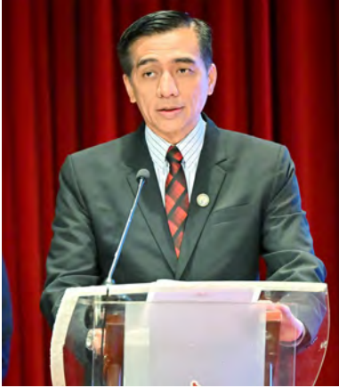
SETIAUSAHA Tetap (Kesukanan) Kementerian Kebudayaan, Belia dan Sukan (KKBS) selaku Penasihat Jawatankuasa Kerja Persidangan Sains Sukan dan Perubatan 2024 semasa berucap.

GADONG , Rabu, 24 April. – Dalam bidang sains sukan dan perubatan sukan yang sentiasa berkembang pesat pada masa kini, Majlis Olimpik Antarabangsa (IOC) melalui Jawatankuasa Perubatan dan Sains, mempromosikan pertukaran pengetahuan mengenai kemajuan dalam disiplin tersebut, bagi memastikan prestasi tahap tertinggi atlet dicapai.