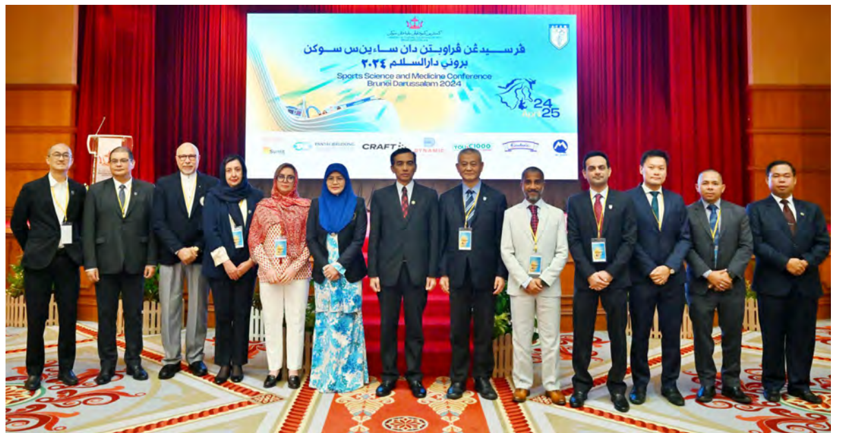
SETIAUSAHA Tetap (Kesukanan) KKBS semasa bergambar ramai pada persidangan berkenaan.