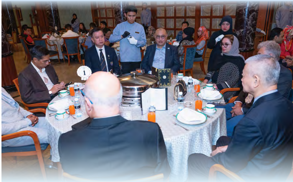
YANG Berhormat Menteri Kebudayaan, Belia dan Sukan hadir selaku tetamu kehormat pada Majlis Makan Malam (Welcoming Dinner) diadakan di Tarindak D'Polo, Royal Brunei Polo and Riding Club, Jerudong.