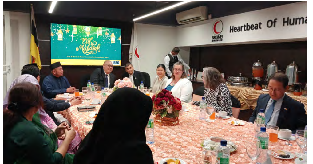
YANG Berhormat Menteri Kesihatan dan Yang Berhormat Menteri Kebudayaan, Belia dan Sukan hadir pada Sambutan Hari Raya Aidilfitri 1445 Hijrah di Knowledge Hub, Tingkat 1, Kompleks Annajat, Beribi anjuran Persatuan Bulan Sabit Merah Negara Brunei Darussalam (kiri dan kanan).

BANDAR SERI BEGAWAN, Jumaat, 26 April. - Persatuan Bulan Sabit Merah (PBSM) Negara Brunei Darussalam (NBD) telah menganjurkan Sambutan Hari Raya Aidilfitri 1445 Hijrah di Knowledge Hub, Tingkat 1, Kompleks Annajat, Beribi, baru-baru ini.