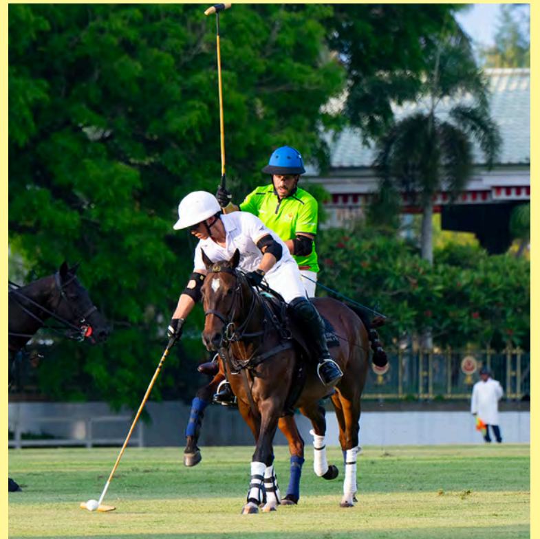
PASUKAN White yang diketuai oleh Duli Yang Teramat Mulia Paduka Seri Pengiran Muda 'Abdul Mateen ibni Kebawah Duli Yang Maha Mulia Paduka Seri Baginda Sultan Haji Hassanal Bolkiah Mu'izzaddin Waddaulah berjaya menewaskan Pasukan Green yang diketuai oleh Yang Teramat Mulia Paduka Seri Pengiran Anak Puteri 'Azemah Ni'matul Bolkiah binti Kebawah Duli Yang Maha Mulia Paduka Seri Baginda Sultan Haji Hassanal Bolkiah Mu'izzaddin Waddaulah (atas kiri, atas kanan, bawah kiri dan bawah kanan).