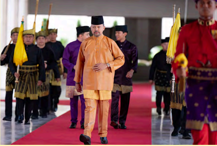
DULI Yang Teramat Mulia Paduka Seri Pengiran Muda Mahkota Pengiran Muda Haji Al-Muhtadee Billah ibni Kebawah Duli Yang Maha Mulia Paduka Seri Baginda Sultan Haji Hassanal Bolkiah Mu'izzaddin Waddaulah, Menteri Kanan di Jabatan Perdana Menteri selaku wakil peribadi Kebawah Duli Yang Maha Mulia Paduka Seri Baginda Sultan dan Yang Di-Pertuan Negara Brunei Darussalam berangkat mengurniakan Pingat-pingat Kehormatan Negara Brunei Darussalam. Berangkat sama ialah paduka-paduka adinda Duli Yang Teramat Mulia Paduka Seri Pengiran Muda Mahkota, Duli Yang Teramat Mulia Paduka Seri Pengiran Muda 'Abdul Malik dan Duli Yang Teramat Mulia Paduka Seri Pengiran Muda 'Abdul Mateen (atas dan kanan).