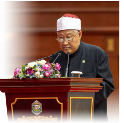
YANG Berhormat Mufti Kerajaan membentangkan Kertas Perdana pada Majlis Perasmian Konferensi Antarabangsa Islam Borneo Ke-15 (KAIB XV) pada 5 Jun 2024.

Diriwayatkan lagi, pada suatu hari Nabi shallallahu 'alaihi wa sallam telah ternampak seekor