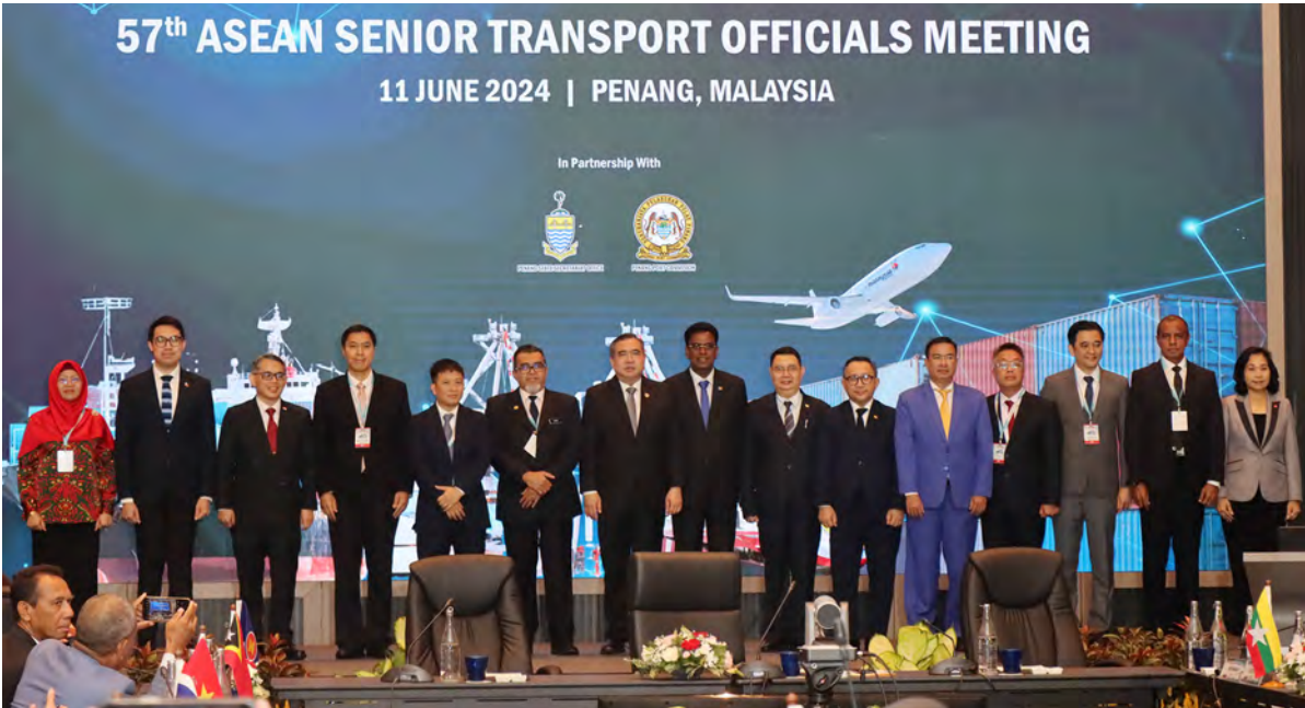
Siaran Akhbar dan Foto : Kementerian Pengangkutan dan Infokomunikasi