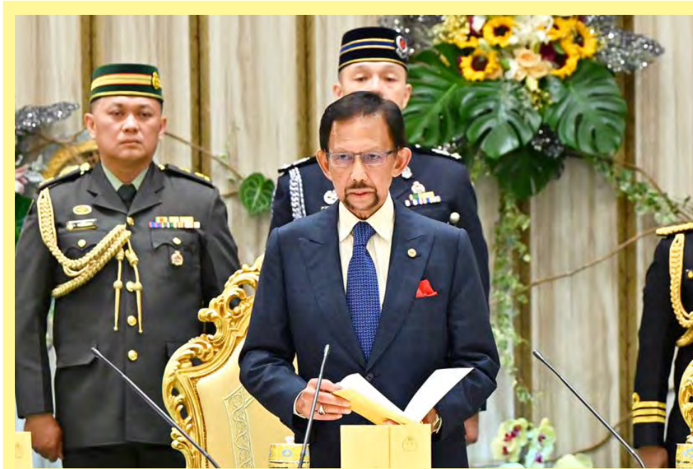
KEBAWAH Duli Yang Maha Mulia Paduka Seri Baginda Sultan Haji Hassanal Bolkiah Mu'izzaddin Waddaulah ibni Al-Marhum Sultan Haji Omar 'Ali Saifuddien Sa'adul Khairi Waddien, Sultan dan Yang Di-Pertuan Negara Brunei Darussalam berkenan mengurniakan titah pada Majlis Persantapan Rasmi bagi meraikan Perdana Menteri Republik Singapura, Tuan Yang Terutama Lawrence Wong dan isteri, Madam Loo Tze Lui berserta rombongan dalam rangka Lawatan Rasmi ke Negara Brunei Darussalam pada Selasa, 11 Jun 2024 yang berlangsung di Baiturrahmah, Istana Nurul Iman.