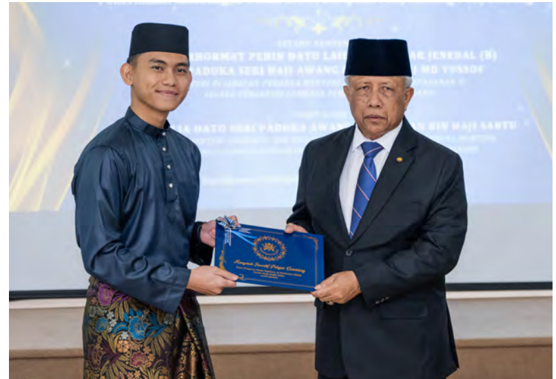
Oleh : Wan Mohamad Sahran Wan Ahmadi

YANG Berhormat Menteri di Jabatan Perdana Menteri (JPM) dan Menteri Pertahanan II yang juga selaku Pengerusi Lembaga Pemegang Amanah Dana Pengiran Muda Mahkota Al-Muhtadee Billah Untuk Anak-anak Yatim hadir selaku tetamu kehormat dan seterusnya menyampaikan anugerah tersebut (kiri dan kanan).