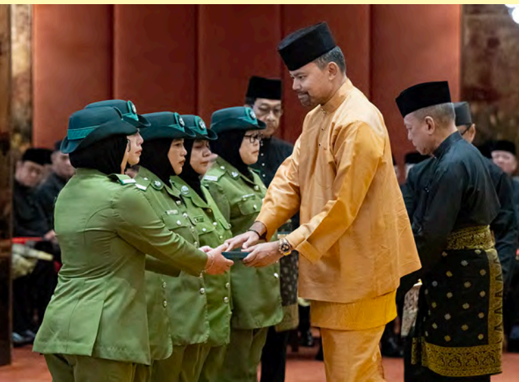
DULI Yang Teramat Mulia Paduka Seri Pengiran Muda Mahkota berangkat mengurniakan Pingat-pingat Kehormatan Negara Brunei Darussalam kepada para penerima (atas sekali, atas dan atas kanan). Manakala gambar bawah, Doa Selamat dibacakan oleh Yang Berhormat Pehin Orang Kaya Paduka Seri Utama Dato Paduka Seri Setia Haji Awang Salim bin Haji Besar. Sementara gambar kanan, antara yang hadir pada majlis berkenaan.