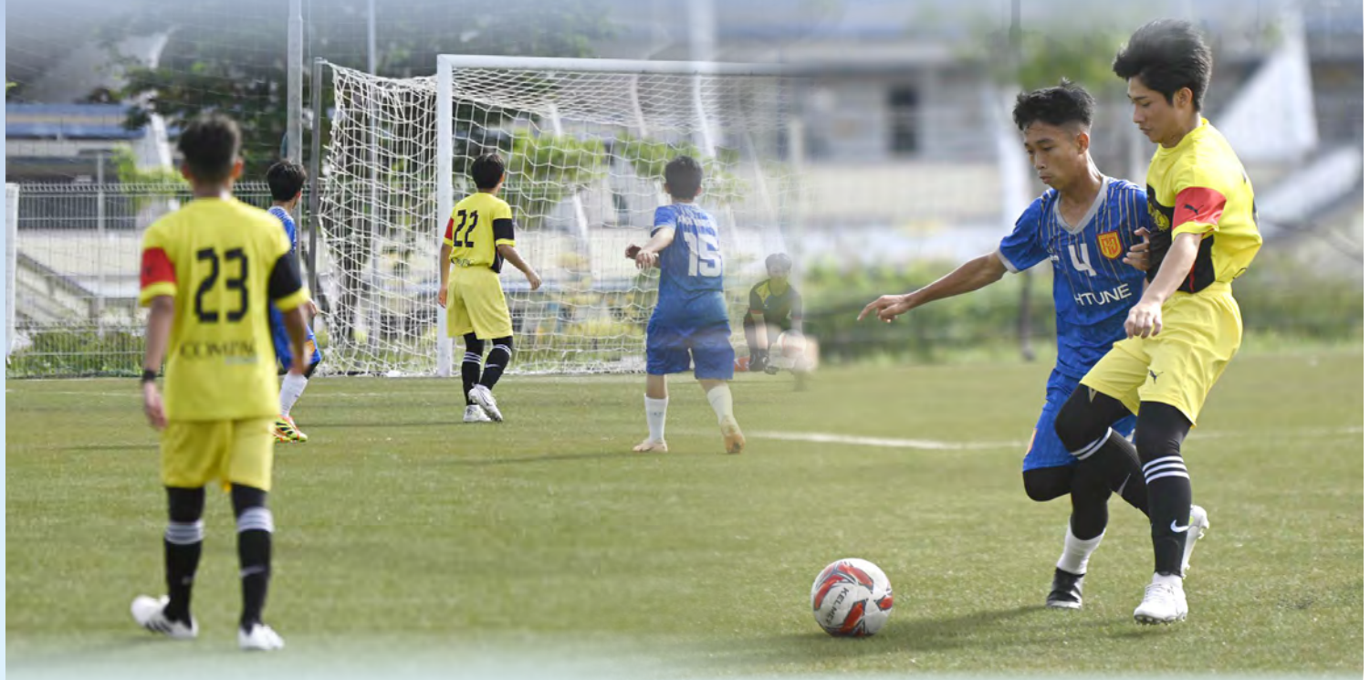
AKSI perlawanan di antara Arabic School U16 menentang AKSE Bersatu U16 pada Cabaran Liga Bola Sepak Remaja HiTune Sports School 2024 yang berlangsung di Padang 'A', Persatuan Bola Sepak Brunei Darussalam.