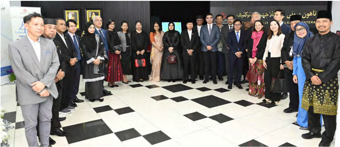
SETIAUSAHA Tetap (Kebudayaan), Kementerian Kebudayaan, Belia dan Sukan hadir selaku tetamu kehormat majlis dan seterusnya merasmikan Pameran 40 Tahun Brunei : Penjelajahan Interaktif (atas dan kanan). Manakala gambar bawah kiri, antara yang hadir menyaksikan pameran ialah Yang Berhormat Ahli-ahli Majlis Mesyuarat Negara.

BERAKAS , Khamis, 13 Jun. - Arkib Negara Brunei Darussalam (ANBD) telah mengadakan Majlis Pelancaran Pameran 40 Tahun Brunei : Penjelajahan Interaktif sempena Hari Arkib Antarabangsa (HAA) yang berlangsung di Bangunan Arkib berkenaan, Jalan Dewan Majlis, di sini.