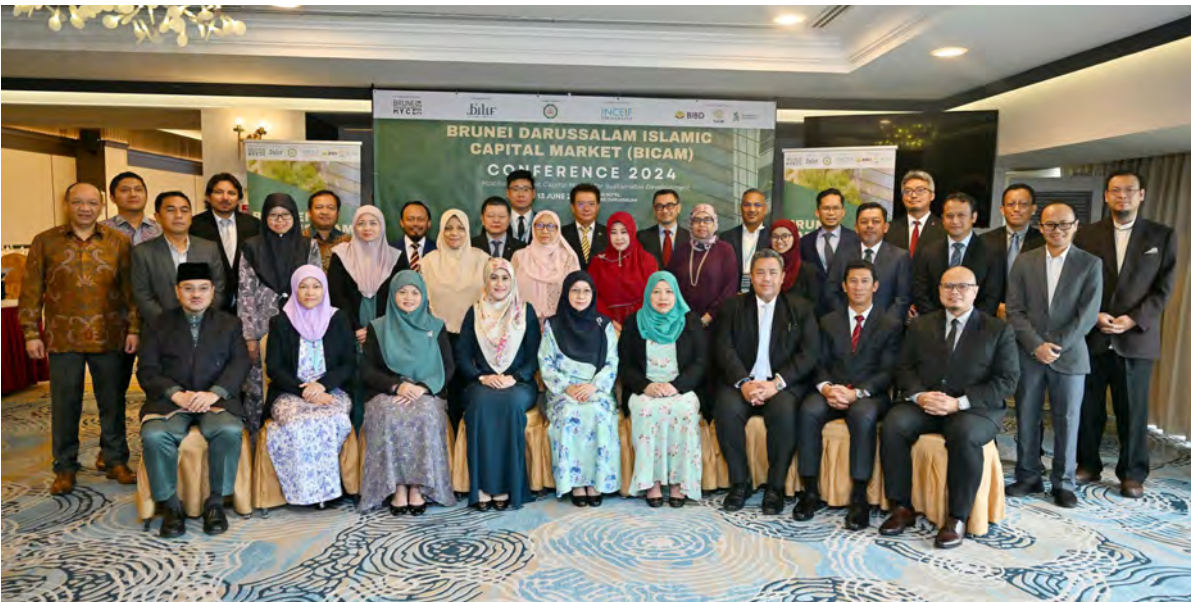
BRUNEI Institute of Leadership & Islamic Finance (BILIF) dengan kerjasama INCEIF University, Malaysia serta dengan sokongan Brunei Darussalam Central Bank (BDCB) menganjurkan Brunei Darussalam Islamic Capital Market (BICAM) Conference 2024.

BERAKAS , Rabu, 12 Jun. - Brunei Institute of Leadership & Islamic Finance (BILIF) dengan kerjasama INCEIF University, Malaysia serta dengan sokongan Brunei Darussalam Central Bank (BDCB) telah menganjurkan Brunei Darussalam Islamic Capital Market (BICAM) Conference 2024 sebagai salah satu pengisian bagi Persidangan dan Pameran Pertengahan Tahun Brunei 2024 (Brunei MYCE 2024).