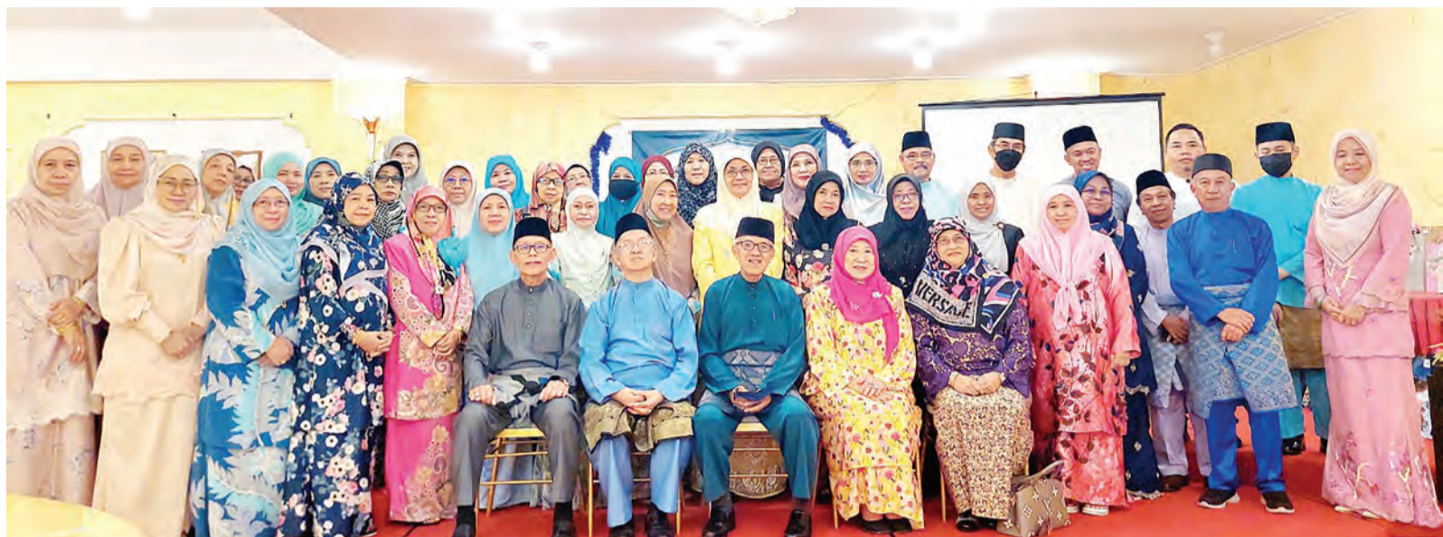
MANTAN pegawai dan kakitangan Perpustakaan, Dewan Bahasa dan Pustaka berkumpul kembali bagi meraikan Majlis Sambutan Hari Raya Aidilfitri yang dinamakan 'Keluarga Perpustakaan Berhari Raya'.

Katanya, pertemuan yang amat bermakna itu merupakan bukti kesefahaman dan rasa perpaduan yang erat memandangkan