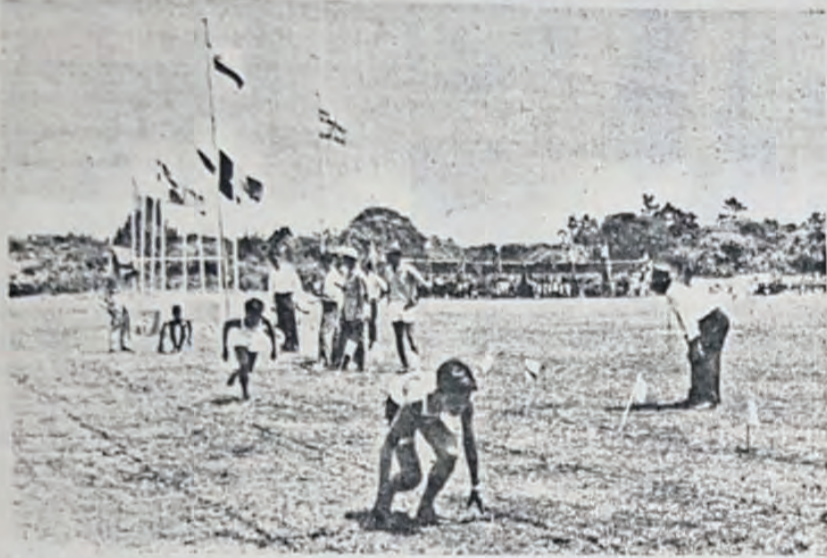
Murid2 sekolah2 di-sepanjang Jalan Muara telah mengadakan pertandingan sokan di-padang Sekolah Melayu Sultan Umar Ali Saifuddin, Muara. Gambar di-atas ia-lah sa-bahagian dari achara2 perlawanan yang di-pertandingkan untuk memilih wakil2 ka-peraduan bagi seluroh Daerah Brunei/Muara.

aduan yang terakhir ini telah di-langsungkan sejak 1 Mei hingga 19 Mei yang lalu.