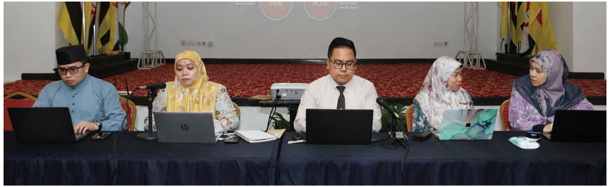
TAKLIMAT Pembarigaan Anugerah Hari Belia Kebangsaan (HBK) 2023 bersempena Sambutan HBK Ke-18, Tahun 2023 bertempat di Dewan Teater, Jabatan Daerah Brunei dan Muara.

kan dan memajukan agensi, organisasi atau persatuan atau pergerakan belia dan satu kelebihan jika projek tersebut membukakan peluang-peluang pekerjaan kepada masyarakat khusus dalam kalangan belia serta menyumbang kepada pembangunan belia dan ekonomi negara iaitu Projek Cemerlang Untuk Belia Bidang Sosial Ekonomi (PCUBSE) dan Projek Cemerlang Untuk Belia Bidang Gaya Hidup Sihat (PCUBGHS).