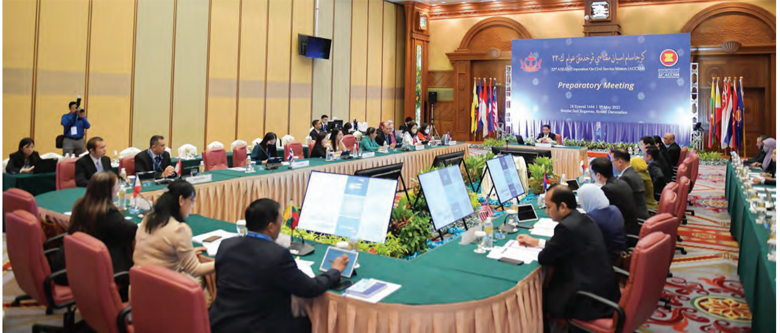
MESYUARAT Persediaan ASEAN Cooperation on Civil Service Matters (ACCSM) yang berlangsung di The Rizqun International Hotel dan gambar bawah, perwakilan dari Negara-negara Anggota ASEAN semasa bergambar ramai.

ACCSM telah ditubuhkan pada tahun 1981 dan merupakan salah satu badan sektoral (sectoral body) di bawah ASEAN Socio-Cultural Community (ASCC), yang merupakan salah satu daripada