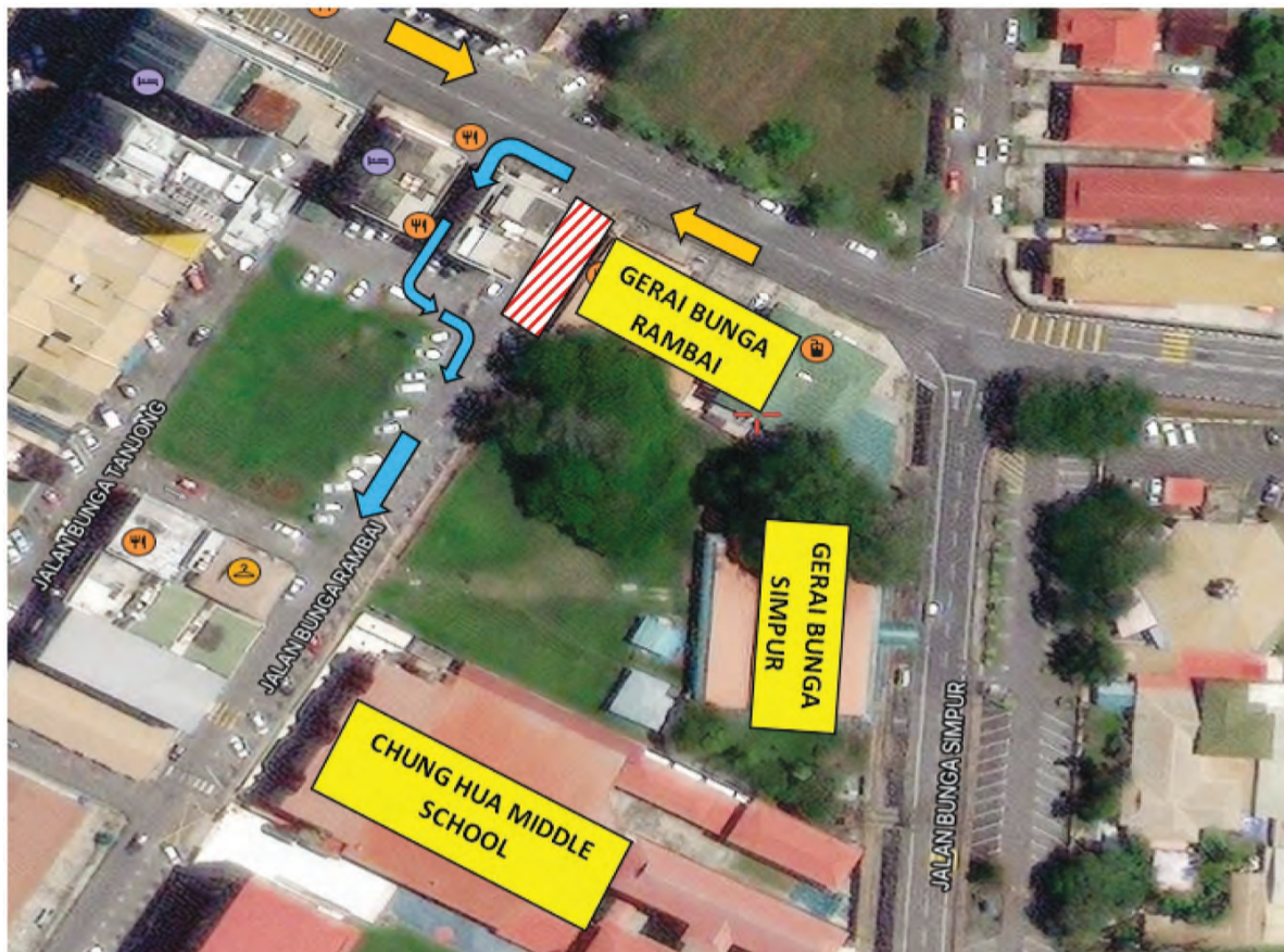
SEBAHAGIAN jalan di Jalan Bunga Rambai, Kuala Belait ditutup sementara adalah disebabkan oleh kerja-kerja pembaikan paip pembedung di jalan berkenaan.