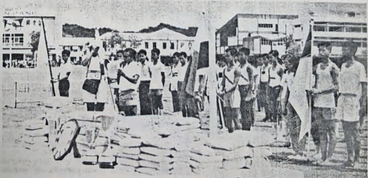
Wakil2 dari bahagian2 sekolah di-Daerah Brunei/Muara tatakala sa-belum memulakan pertandingan sokan untuk memilih kejohanan bagi mewakili daerah Brunei/Muara ka-perlawanan seluroh negeri.

Dari bilangan orang2 Haji itu sa-ramai 21 orang ia-lah perempuan.