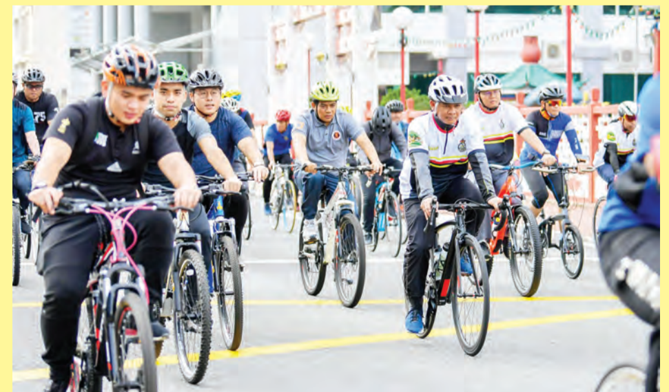
YANG Berhormat Menteri Kesihatan, Yang Berhormat Menteri Pembangunan dan Yang Berhormat Menteri Kebudayaan, Belia dan Sukan antara yang ikut serta pada kayuhan sejauh 12km bagi sama-sama menjayakan Acara Riadah Berbasikal 57Km sempena HUT ABDB Ke-57 (kiri dan kanan).