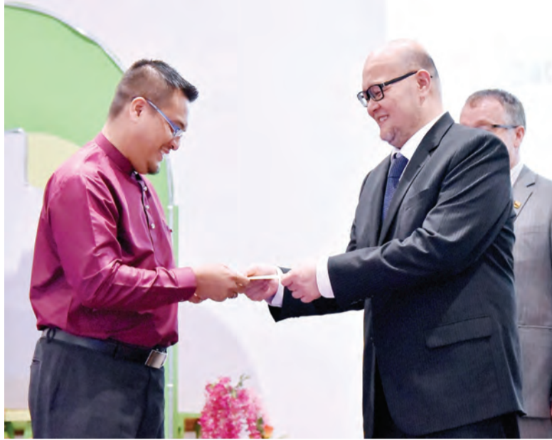
Oleh : Wan Mohamad Sahran Wan Ahmadi