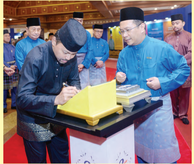
DULI Yang Teramat Mulia Paduka Seri Pengiran Muda Mahkota Pengiran Muda Haji Al-Muhtadee Billah ibni Kebawah Duli Yang Maha Mulia Paduka Seri Baginda Sultan Haji Hassanal Bolkiah Mu'izzaddin Waddaulah, Menteri Kanan di Jabatan Perdana Menteri berkenan berangkat melancarkan produk-produk terbaharu Insurans Islam TAIB Holdings Sendirian Berhad dan Darussalam Holdings Sendirian Berhad (kiri). Manakala gambar kanan, Duli Yang Teramat Mulia ketika berkenan menandatangani plak.

BANDAR SERI BEGAWAN, Sabtu, 24 November. - Duli Yang Teramat Mulia Paduka Seri Pengiran Muda Mahkota Pengiran Muda Haji Al-Muhtadee Billah ibni Kebawah Duli Yang Maha Mulia Paduka Seri Baginda Sultan Haji Hassanal Bolkiah Mu'izzaddin Waddaulah, Menteri Kanan di Jabatan Perdana Menteri berkenan berangkat melancarkan produk-produk terbaharu Insurans Islam TAIB Holdings Sendirian Berhad (IITHSB), iaitu produk Pelan Takaful Khairat dan IIT Apps manakala Darussalam Holdings Sendirian Berhad (DHSB) melancarkan dua aplikasi mudah alih, iaitu iManasik Haji & Umrah dan iBrunei.