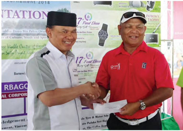
MENTERI Kebudayaan, Belia dan Sukan, Yang Berhormat Mejar Jeneral (B) Dato Paduka Seri Awang Haji Aminuddin Ihsan bin Pehin Orang Kaya Saiful Mulok Dato Seri Paduka Haji Abidin semasa menyaksikan penyerahan sumbangan yang diterima oleh Pemegang Amanah Kanan Al-Ameerah Al-Hajjah Maryam, Dato Paduka Mohd. Alimin bin Haji Abdul Wahab (kiri). Manakala gambar kanan, Yang Berhormat Menteri Kebudayaan, Belia dan Sukan menyampaikan hadiah kepada antara pemenang Pertandingan Golf Amal Kali Ke-17 Pusat Ehsan Al-Ameerah Al-Hajjah Maryam.