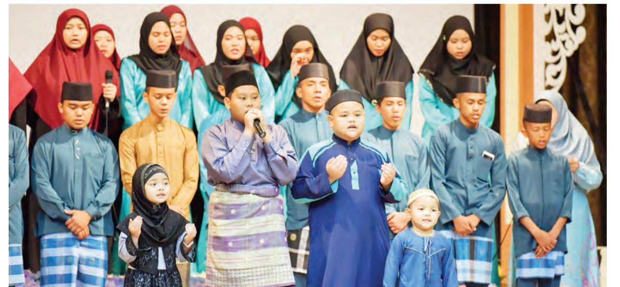
MENTERI Kebudayaan, Belia dan Sukan, Yang Berhormat Mejar Jeneral (B) Dato Paduka Seri Haji Aminuddin Ihsan bin Pehin Orang Kaya Saiful Mulok Dato Seri Paduka Haji Abidin menyampaikan sumbangan derma kepada golongan-golongan tertentu yang terdiri daripada saudara-saudara baharu, Orang Kelainan Upaya (OKU), anak-anak yatim dan golongan kurang berkemampuan (kiri). Manakala gambar kanan, persembahan nyanyian nasyid daripada anak-anak yatim.