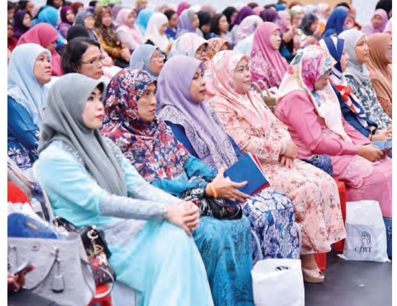
MENTERI Pendidikan, Yang Berhormat Dato Seri Setia Awang Haji Hamzah bin Haji Sulaiman (kanan) menyampaikan surat lantikan kepada pemimpin sekolah pada Majlis Penyampaian Surat Lantikan di Dewan Serbaguna Sekolah Tinggi Perempuan Raja Isteri (STPRI) (kiri), sementara gambar kanan, antara yang hadir pada majlis berkenaan.