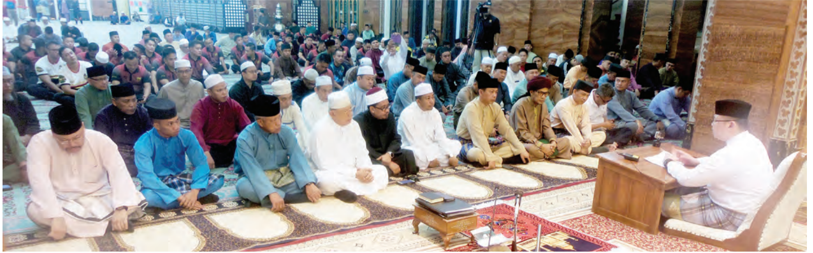
MENTERI Pertahanan II, Yang Berhormat Pehin Datu Lailaraja Mejar Jeneral (B) Dato Paduka Seri Haji Awang Halbi; Menteri di Jabatan Perdana Menteri, Yang Berhormat Dato Seri Setia Awang Haji Abdul Mokti; Menteri Perhubungan, Yang Berhormat Dato Seri Setia Awang Abdul Mutalib dan Menteri Kebudayaan, Belia dan Sukan, Yang Berhormat Mejar Jeneral (B) Dato Paduka Seri Haji Aminuddin Ihsan semasa hadir mendengarkan Tazkirah Subuh tersebut.

Tazkirah 'Tanggungjawab Mempertahankan Keamanan Negara' itu juga menerangkan, Rasulullah Sallallahu Alaihi Wasalam telah menggambarkan ciri-ciri terbaik tentera melalui hadis Baginda "Sungguh Konstantinopol akan ditaklukkan dan sebaik-baik pemimpin adalah pemimpin tentera (yang menaklukkannya) itu dan