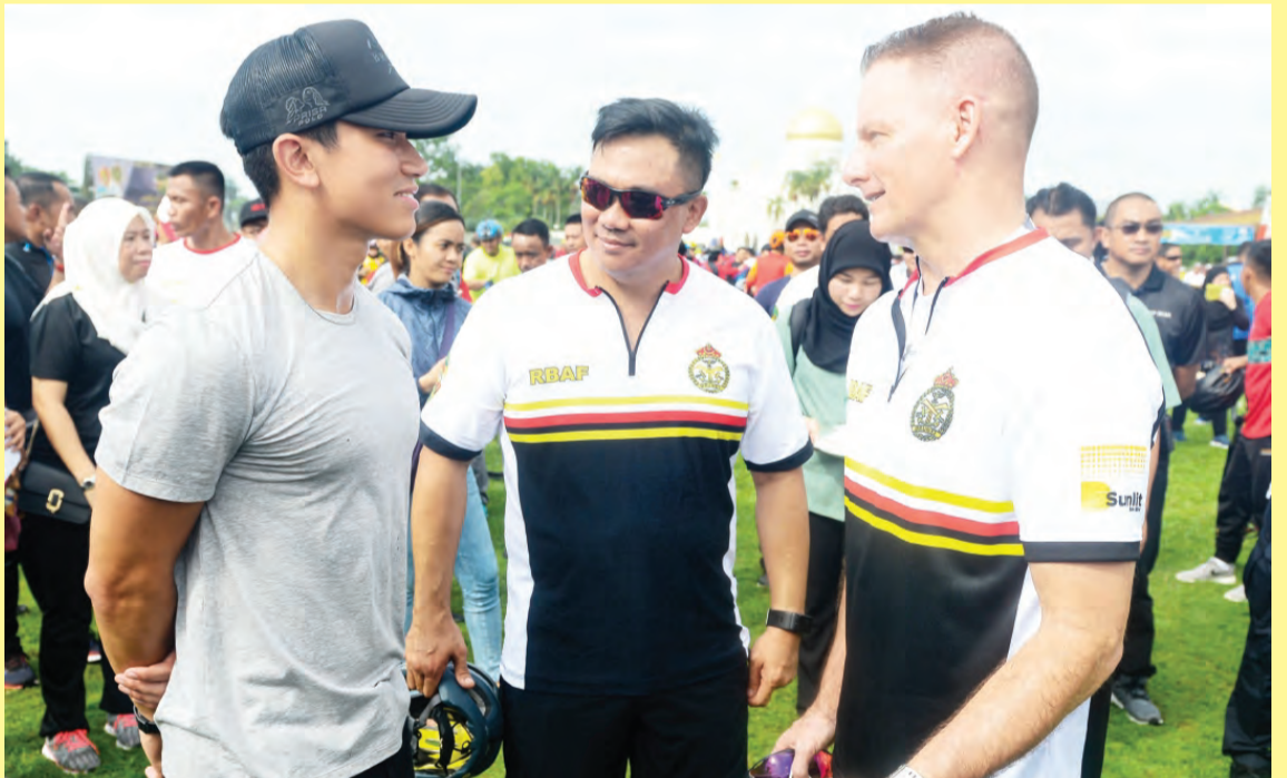
DULI Yang Teramat Mulia Paduka Seri Pengiran Muda Mahkota Jeneral Pengiran Muda Haji Al-Muhtadee Billah, Menteri Kanan di Jabatan Perdana Menteri dan Jeneral ABDB berkenan menerima junjung ziarah sejeurus berangkat tiba di Taman Haji Sir Muda Omar 'Ali Saifuddien (kiri), sementara gambar kanan, Duli Yang Teramat Mulia Paduka Seri 920 Kapten (Udara) Pengiran Muda 'Abdul Mateen ketika berkenan beramah mesra bersama salah seorang peserta yang ikut serta pada Acara Riadah Berbasikal 57Km sempena HUT ABDB Ke-57.