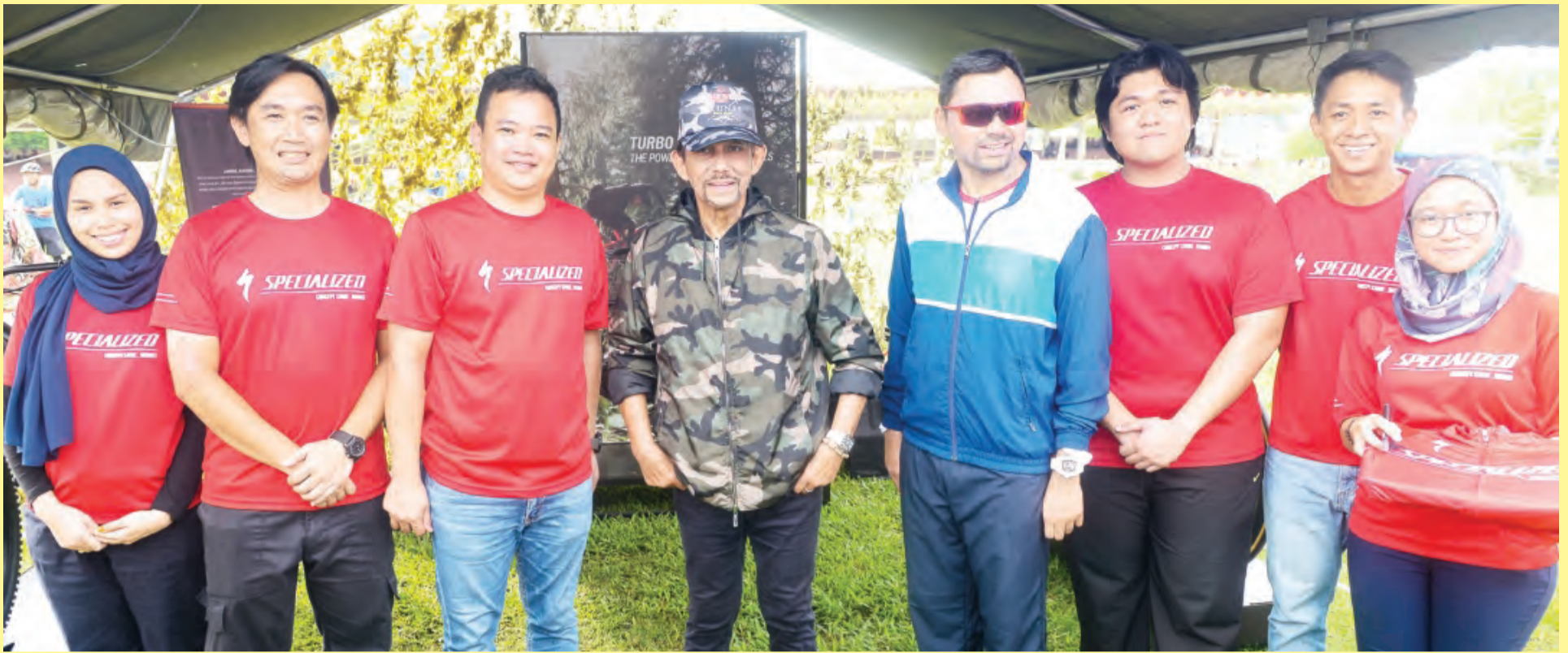
KEBAWAH Duli Yang Maha Mulia Paduka Seri Baginda Sultan Haji Hassanal Bolkiah Mu'izzaddin Waddaulah ibni Al-Marhum Sultan Haji Omar 'Ali Saifuddien Sa'adul Khairi Waddien, Sultan dan Yang Di-Pertuan Negara Brunei Darussalam, Menteri Pertahanan dan Pemerintah Tertinggi ABDB ketika berkenan bergambar ramai ketika melawat salah sebuah khemah pameran.