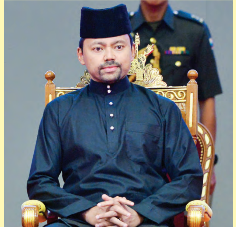
DULI Yang Teramat Mulia Paduka Seri Pengiran Muda Mahkota Pengiran Muda Haji Al-Muhtadee Billah ibni Kebawah Duli Yang Maha Mulia Paduka Seri Baginda Sultan Haji Hassanal Bolkiah Mu'izzaddin Waddaulah, Menteri Kanan di Jabatan Perdana Menteri berkenan berangkat pada Majlis Sambutan Jubli Perak Penubuhan Insurans Islam Tabung Amanah Islam Brunei (TAIB) Holdings Sendirian Berhad (IITHSB) dan Darussalam Holdings Sendirian Berhad (DHSB) diadakan di Dewan Plenari, Pusat Persidangan Antarabangsa, Berakas. Berangkat sama paduka adinda Duli Yang Teramat Mulia, Duli Yang Teramat Mulia Paduka Seri Pengiran Muda 'Abdul Malik.

BANDAR SERI BEGAWAN, Sabtu, 24 November. - Sambutan rasmi bagi memperingati Jubli Perak Penubuhan Insurans Islam Tabung Amanah Islam Brunei (TAIB) Holdings Sendirian Berhad (IITHSB) dan Darussalam Holdings Sendirian Berhad (DHSB) diadakan di Dewan Plenari, Pusat Persidangan Antarabangsa,