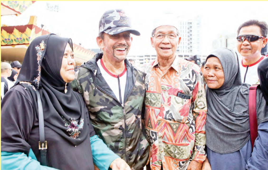
KEBAWAH Duli Yang Maha Mulia Paduka Seri Baginda Sultan Haji Hassanal Bolkiah Mu'izzaddin Waddaulah, Sultan dan Yang Di-Pertuan Negara Brunei Darussalam berkenan bergambar bersama para pengunjung pada acara Riadah Berbasikal tersebut (kiri), sementara gambar kanan, paduka anakanda baginda, Duli Yang Teramat Mulia Paduka Seri Pengiran Muda 'Abdul Malik berkenan mendengarkan sembah penerangan ketika berkenan menyaksikan jerayawara dari ABDB.