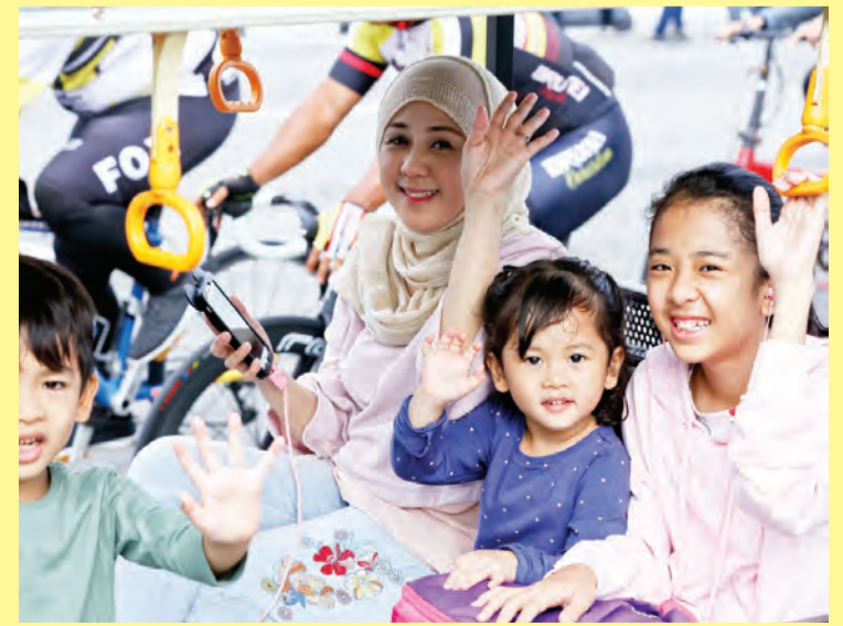
PARA peserta sama-sama mengongsikan kegembiraan dan keceriaan bersama ahli keluarga dan sahabat handai masing-masing semasa acara Riadah Berbasikal diadakan (kiri dan kanan).