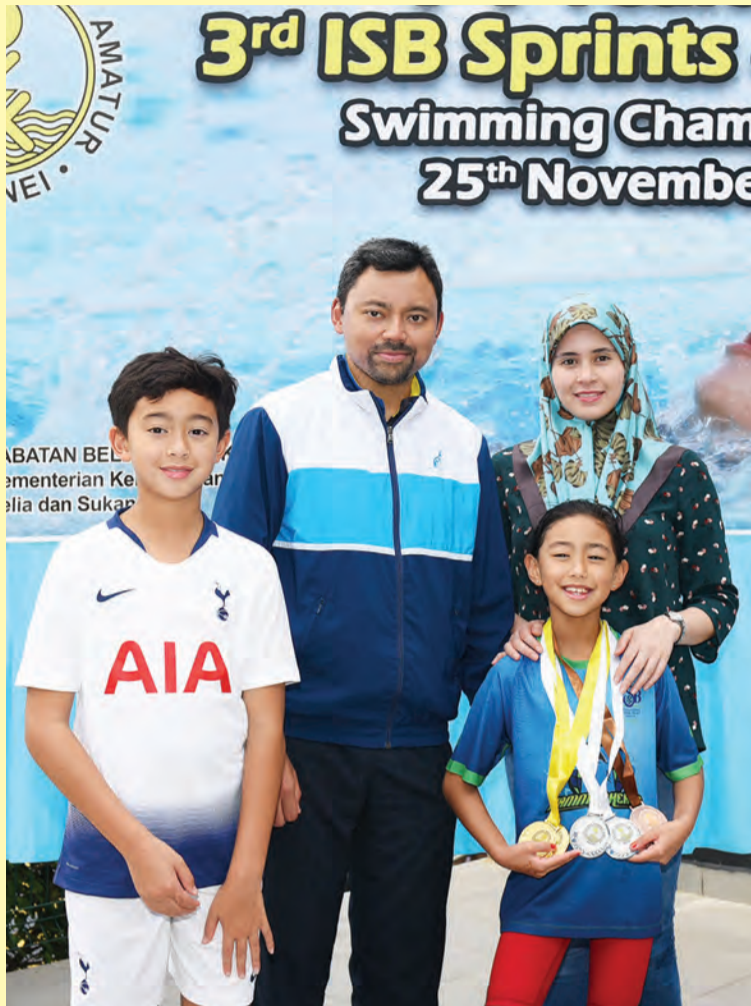
DULI Yang Teramat Mulia Paduka Seri Pengiran Muda Mahkota Pengiran Muda Haji Al-Muhtadee Billah ibni Kebawah Duli Yang Maha Mulia Paduka Seri Baginda Sultan Haji Hassanal Bolkiah Mu'izzaddin Waddaulah, Menteri Kanan di Jabatan Perdana Menteri dan Yang Teramat Mulia Paduka Seri Pengiran Anak Isteri Pengiran Anak Sarah binti Pengiran Haji Salleh Ab. Rahaman berkenan berangkat menyaksikan Kejohanan Renang ISB Sprints and Masters Kali Ke-3. Berangkat sama ialah anakanda-anakanda Duli Yang Teramat Mulia, Yang Teramat Mulia Pengiran Muda 'Abdul Muntaqim dan Yang Teramat Mulia Pengiran Anak Muneerah Madhul Bolkiah.

BANDAR SERI BEGAWAN, Ahad, 25 November. - Duli Yang Teramat Mulia Paduka Seri Pengiran Muda Mahkota Pengiran Muda Haji Al-Muhtadee Billah ibni Kebawah Duli Yang Maha Mulia Paduka Seri Baginda Sultan Haji Hassanal Bolkiah Mu'izzaddin Waddaulah, Menteri Kanan di Jabatan Perdana Menteri dan Yang Teramat Mulia Paduka Seri Pengiran Anak Isteri Pengiran Anak Sarah binti Pengiran Haji Salleh Ab. Rahaman berkenan berangkat menyaksikan Kejohanan Renang Sekolah Antarabangsa Brunei (ISB) Sprints and Masters Kali Ke-3 yang berlangsung di Kompleks Kolam Renang, ISB, di sini.