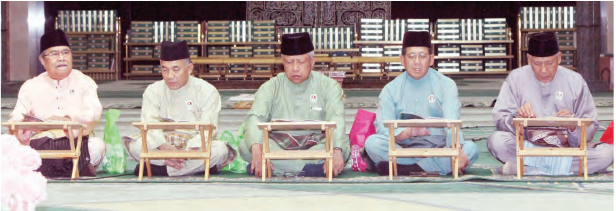
MENTERI Sumber-Sumber Utama dan Pelancongan, Yang Berhormat Dato Seri Setia Awang Haji Ali bin Haji Apong (dua, kiri) dan Menteri Pertahanan II, Yang Berhormat Pehin Datu Lailaraja Mejar Jeneral (B) Dato Paduka Seri Haji Awang Halbi bin Haji Mohd. Yussof (tengah) yang merupakan Penasihat-penasihat Bersama AJK Penyelenggara Majlis Khatam Al-Quran Pusat Tingkatan Enam (PTE) Klasik, Jalan Muara semasa hadir pada Majlis Khatam Al-Quran sempena Maulud Nabi Muhammad Sallallahu Alaihi Wasallam 1440 Hijrah / 2018 Masihi.