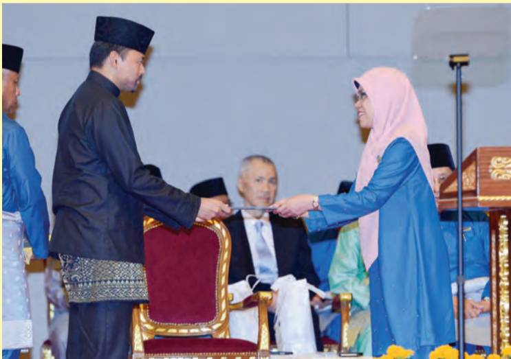
DYTM Paduka Seri Pengiran Muda Mahkota berkenan menyempurnakan penyampaian sijil penghargaan kepada pegawai dan kakitangan yang berkhidmat 25 tahun.