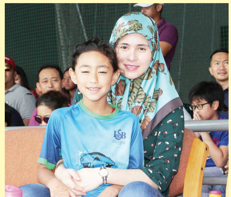
YANG Teramat Mulia Paduka Seri Pengiran Anak Isteri Pengiran Anak Sarah binti Pengiran Haji Salleh Ab. Rahaman dan Yang Teramat Mulia Pengiran Anak Muneerah Madhul Bolkiah ketika berangkat pada Kejohanan Renang Peringkat Umur 7 - 9 Tahun.

Sebanyak 13 buah kelab renang dari dalam dan luar negara menyertai kejohanan tersebut,