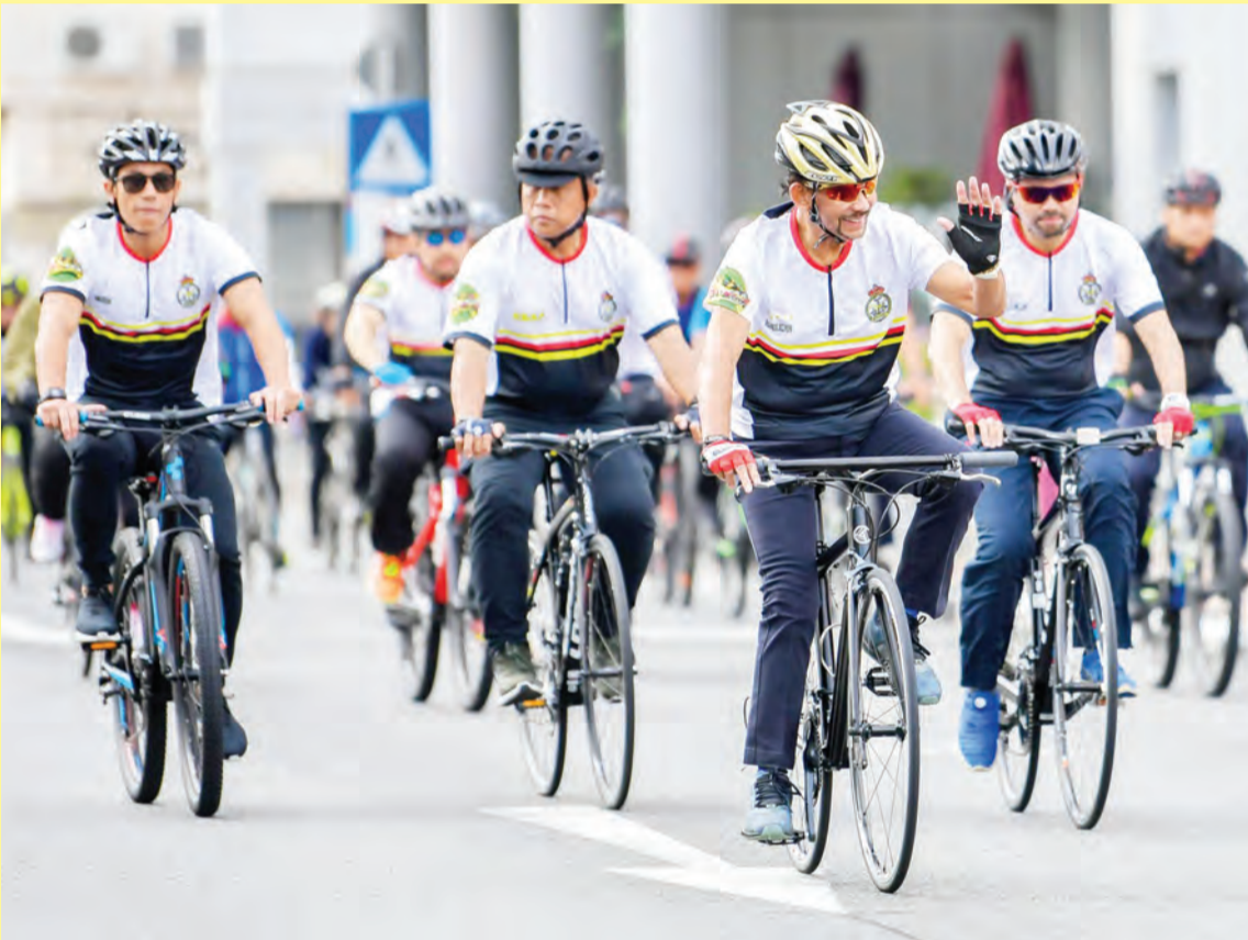
KEBAWAH Duli Yang Maha Mulia Paduka Seri Baginda Sultan Haji Hassanal Bolkiah Mu'izzaddin Waddaulah, Sultan dan Yang Di-Pertuan Negara Brunei Darussalam ketika berkenan berangkat menyertai kayuhan 12Km pada Acara Riadah Berbasikal 57Km sempena HUT ABDB Ke-57.