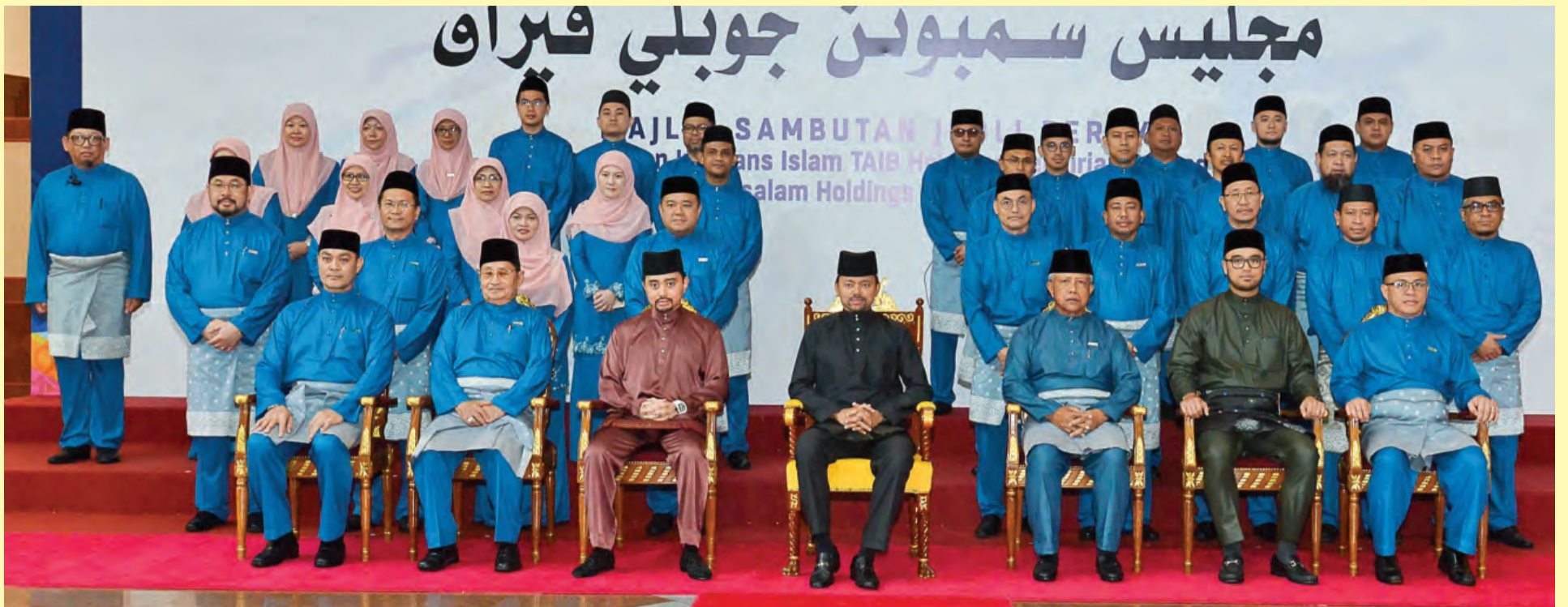
DULI Yang Teramat Mulia Paduka Seri Pengiran Muda Mahkota Pengiran Muda Haji Al-Muhtadee Billah, Menteri Kanan di Jabatan Perdana Menteri dijunjung berangkat bagi sesi bergambar ramai bersama Ahli-ahli Lembaga Pengarah serta pengarah-pengarah dan ketua-ketua jabatan kedua-dua syarikat tersebut.