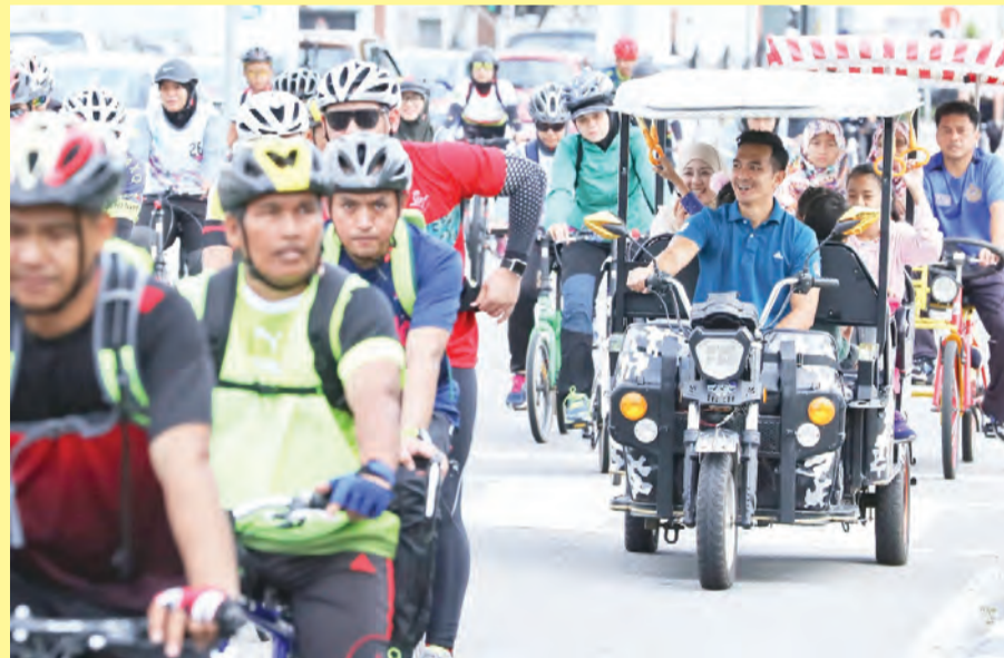
SUASANA kegembiraan yang dikongsi bersama keluarga pada Acara Riadah Berbasikal 57Km sempena HUT ABDB Ke-57 tersebut.