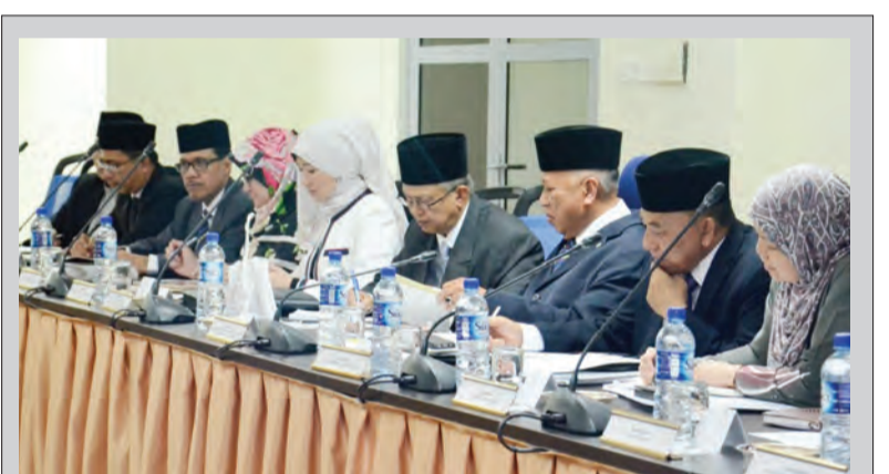
YANG Berhormat Ahli-ahli Majlis Mesyuarat Negara pada Sesi Muzakarah bersama Pasukan Polis Diraja Brunei (PPDB).

Majlis Ilmu 2018 merupakan salah satu acara utama perayaan Sambutan Ulang Tahun Hari Keputeraan Kebawah DYMM Paduka Seri Baginda Sultan dan Yang Di-Pertuan Negara Brunei Darussalam yang akan diungayahkan oleh Kementerian Sumber-Sumber Utama dan Pelancongan (KSSUP); Kementerian Kewangan dan Ekonomi, dan Kementerian Tenaga (Tenaga dan Tenaga Manusia) dan Perindustrian.