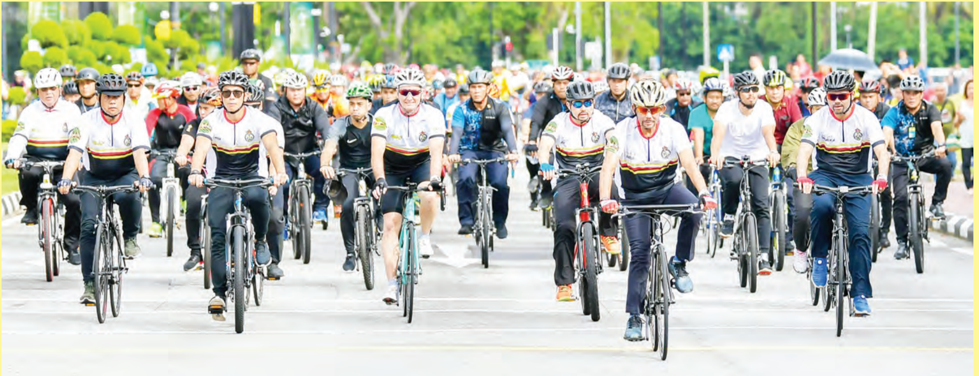
KEBAWAH Duli Yang Maha Mulia Paduka Seri Baginda Sultan Haji Hassanal Bolkiah Mu'izzaddin Waddaulah ibni Al-Marhum Sultan Haji Omar 'Ali Saifuddien Sa'adul Khairi Waddien, Sultan dan Yang Di-Pertuan Negara Brunei Darussalam, Menteri Pertahanan dan Pemerintah Tertinggi ABDB bersama paduka-paduka anakanda baginda, Duli Yang Teramat Mulia Paduka Seri Pengiran Muda Mahkota Jeneral Pengiran Muda Haji Al-Muhtadee Billah, Menteri Kanan di Jabatan Perdana Menteri dan Jeneral ABDB; Duli Yang Teramat Mulia Paduka Seri Pengiran Muda 'Abdul Malik dan Duli Yang Teramat Mulia Paduka Seri 920 Kapten (Udara) Pengiran Muda 'Abdul Mateen ketika berangkat menyertai rakyat dalam aktiviti Riadah Berbasikal.