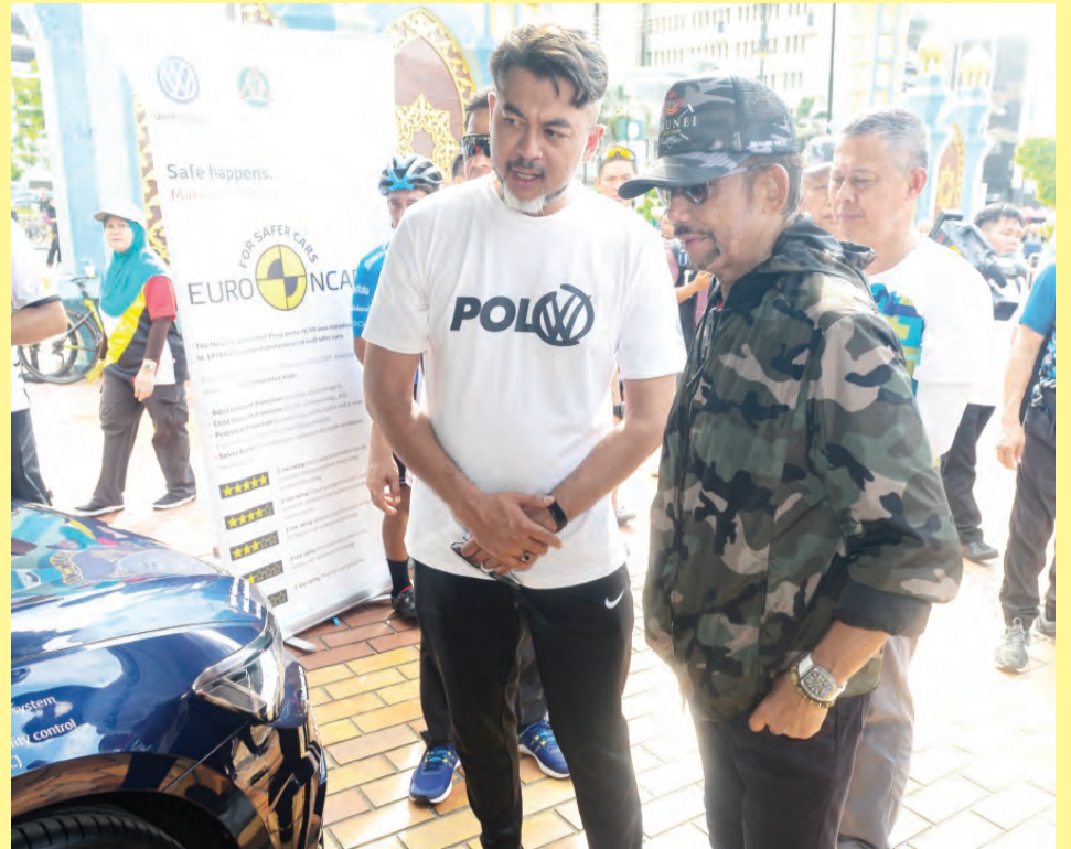
KEBAWAH Duli Yang Maha Mulia Paduka Seri Baginda Sultan Haji Hassanal Bolkiah Mu'izzaddin Waddaulah ibni Al-Marhum Sultan Haji Omar 'Ali Saifuddien Sa'adul Khairi Waddien, Sultan dan Yang Di-Pertuan Negara Brunei Darussalam, Menteri Pertahanan dan Pemerintah Tertinggi Angkatan Bersenjata Diraja Brunei (ABDB) berkenan menyaksikan dan mendengarkan sembah penerangan daripada syarikat-syarikat yang menyertai pameran pada Acara Riadah Berbasikal 57 Kilometer (Km) sempena Hari Ulang Tahun ABDB (HUT ABDB) Ke-57 tersebut (kiri dan kanan).