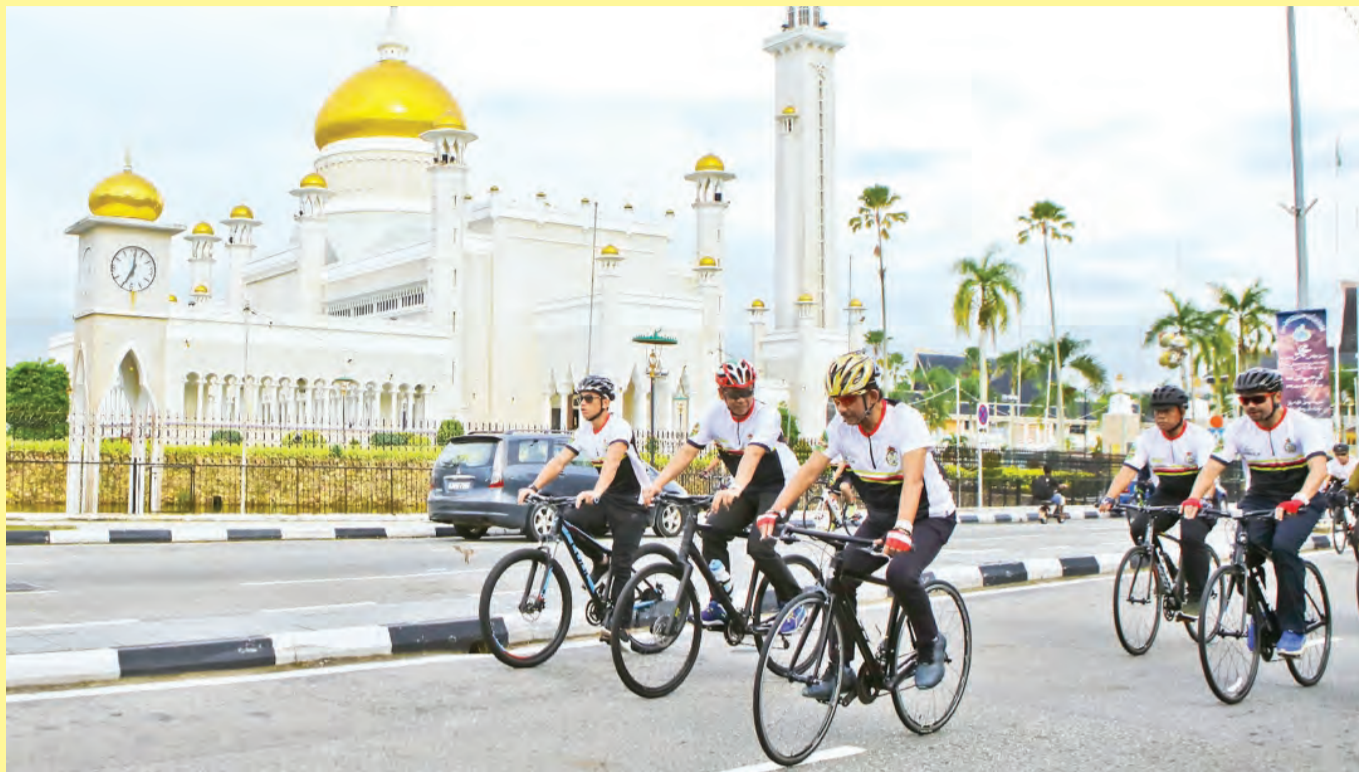
KEBAWAH Duli Yang Maha Mulia Paduka Seri Baginda Sultan Haji Hassanal Bolkiah Mu'izzaddin Waddaulah ibni Al-Marhum Sultan Haji Omar 'Ali Saifuddien Sa'adul Khairi Waddien, Sultan dan Yang Di-Pertuan Negara Brunei Darussalam, Menteri Pertahanan dan Pemerintah Tertinggi Angkatan Bersenjata Diraja Brunei (ABDB) bersama paduka-paduka anakanda baginda, Duli Yang Teramat Mulia Paduka Seri Pengiran Muda Mahkota Jeneral Pengiran Muda Haji Al-Muhtadee Billah, Menteri Kanan di Jabatan Perdana Menteri dan Jeneral ABDB dan Duli Yang Teramat Mulia Paduka Seri 920 Kapten (Udara) Pengiran Muda 'Abdul Mateen berangkat menyertai kayuhan sejauh 12 kilometer bagi menjayakan Acara Riadah Berbasikal 57 Kilometer sempena Hari Ulang Tahun ABDB (HUT ABDB) Ke-57 ketika melintasi Masjid Omar 'Ali Saifuddien di ibu negara.