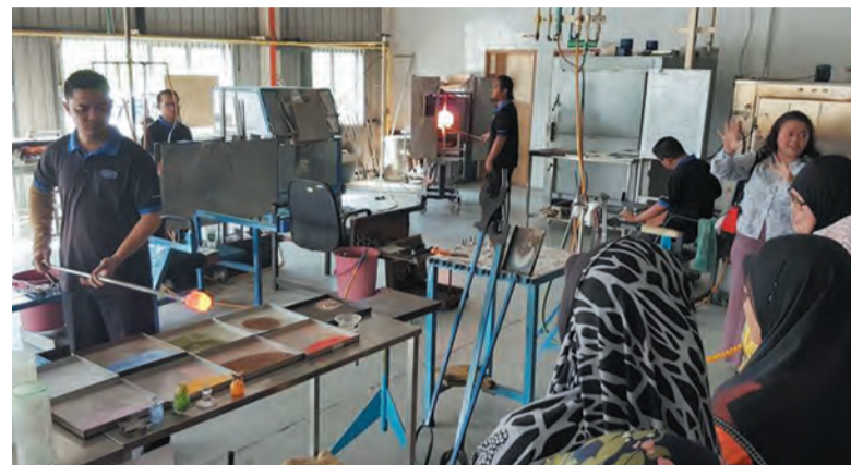
LAWATAN ke kilang kristal untuk menyaksikan proses penghasilan produk kristal yang dibuat oleh staf tempatan sambil mendengar penerangan daripada pengurus syarikat.

Dayang Afsah selaku ketua rombongan menyampaikan sijil penghargaan dan cenderamata kepada Pengurus Syarikat Mahkota Crystal Sdn. Bhd.