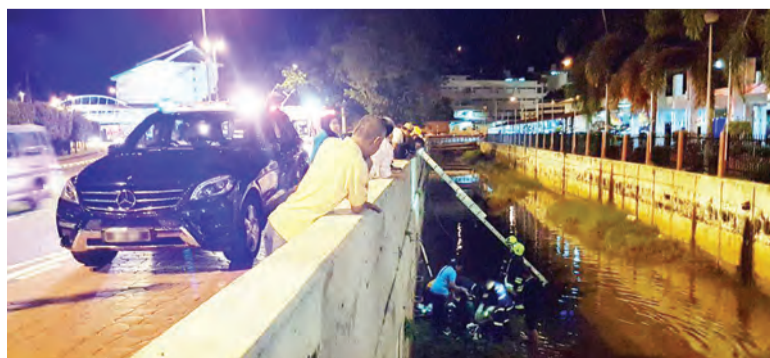
ANGGOTA bomba berusaha menyelamatkan tiga mangsa pejalan kaki yang terjatuh ke dalam longkang setelah dilanggar oleh seorang pemandu.

Dalam pada itu, pihak JBP menyarankan kepada para pemandu atau pengguna jalan raya agar sentiasa menumpukan perhatian di jalan raya dan kawasan sekeliling semasa memandu di mana saja awda berada juga hendaklah sentiasa berhati-hati dan mematuhi peraturan lalu lintas serta papan tanda terutama sekali had kelajuan di kawasan atau jalan, di mana adanya pejalan kaki.