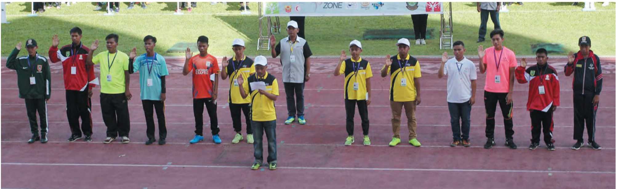
BACAAN ikrar daripada para peserta yang mengikuti kejohanan tersebut.

Perlawanan-perlawanan akan berlangsung bermula 16 November sehingga 18 November bertempat di Stadium Negara Hassanal Bolkiah yang diadakan pada sebelah pagi dan petang.