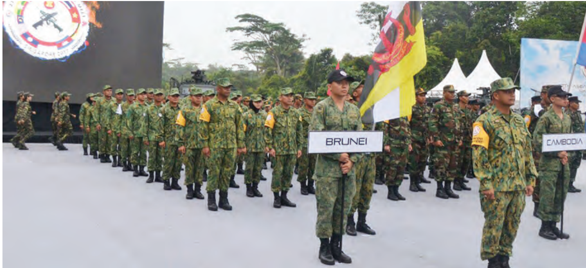
SERAMAI 550 anggota akan bersaing dalam lima acara, iaitu Carbine, Machine Gun, acara Pistol Kumpulan Lelaki, Pistol Kumpulan Wanita serta Rifle.