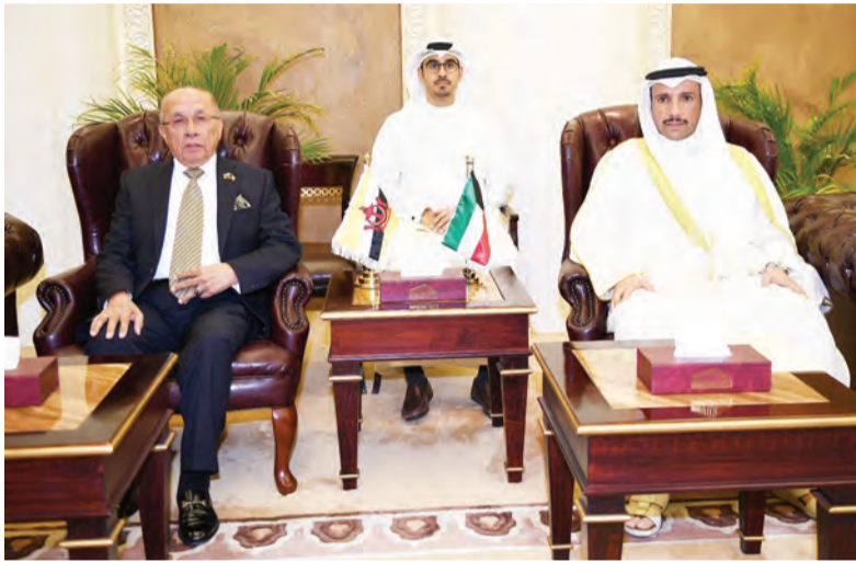
YANG Di-Pertua MMN mengadakan kunjungan muhibah kepada Speaker of the Kuwait National Assembly, Tuan Yang Terutama Marzouq Al-Ghanim.