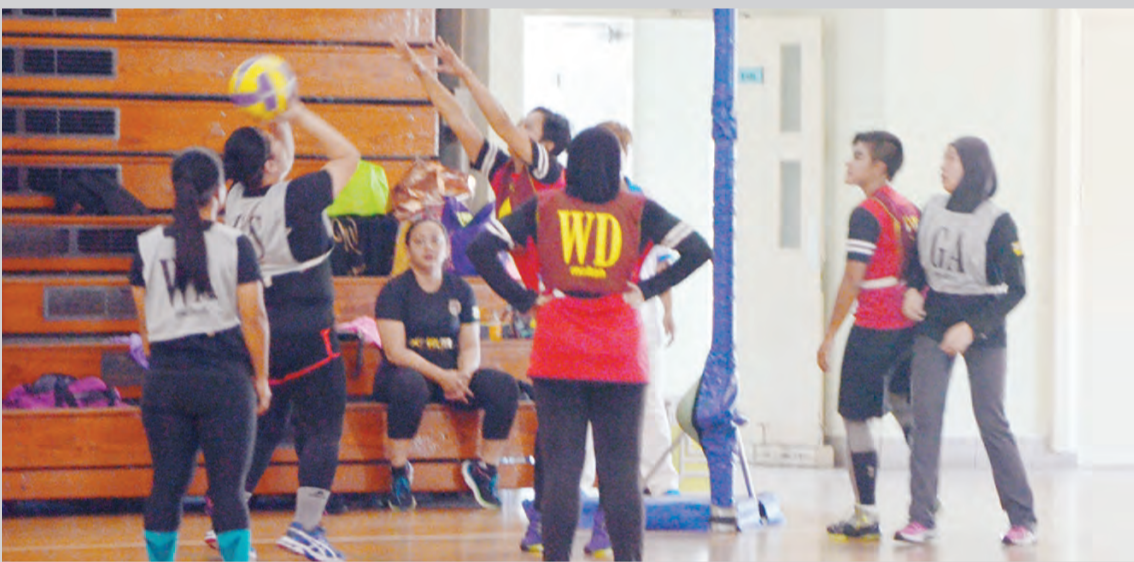
ANTARA aksi perlawanan di antara pasukan Red Butterfly (bib coklat) menentang pasukan Muara Vella (bib kelabu).

Berita dan Foto : Dk. Vivv Malessa Pg. Ibrahim