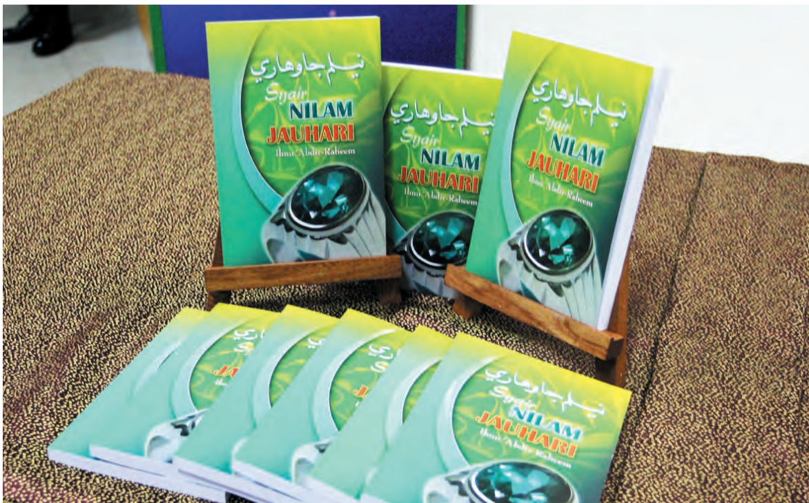
BUKU hasil karya salah seorang ahli PSBNS Chapter Brunei.

Tarikh pelantikan pegawai-pegawai berkenaan berkuat kuasa mulai 17 Oktober lalu.