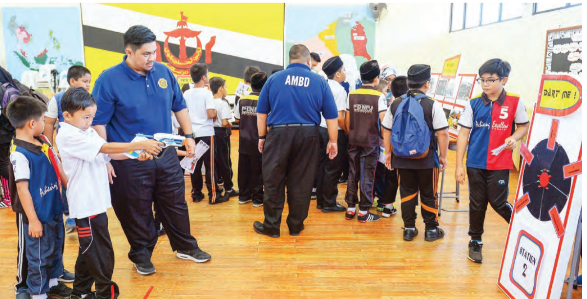
ANTARA murid dari Darjah Pra hingga Tahun 6 SRPDNPJS mengikuti permainan-permainan dan aktiviti-aktiviti interaktif yang bertemakan pengenalan mata wang dan pengurusan kewangan.