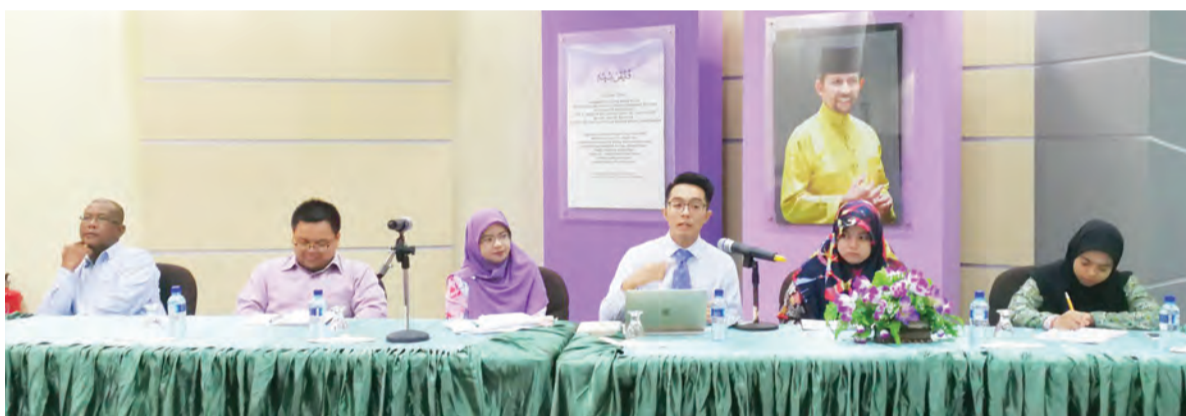
TAKLIMAT disampaikan oleh salah seorang pegawai dari Bahagian Kawalan Makanan Halal, Jabatan Hal Ehwal Syariah, Kementerian Hal Ehwal Ugama.

Sementara itu, penalti kesalahan menurut Bab 49A Perintah