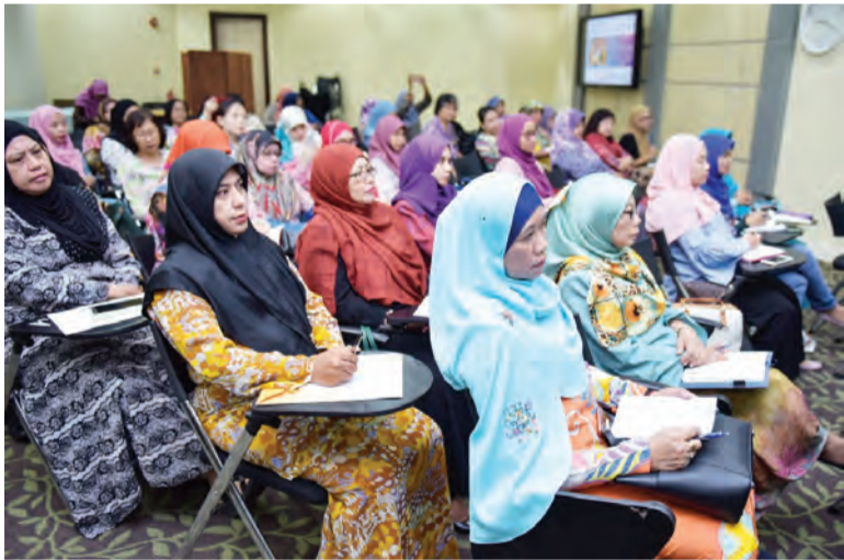
ANTARA yang hadir mendengarkan Taklimat Perintah Sijil Halal dan Label Halal (Pindaan) 2017.

Oleh : Dk. Vivy Malessa Pg. Ibrahim