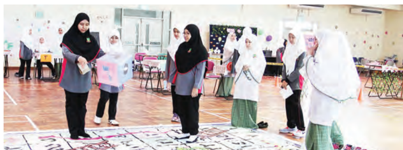
ANTARA aktiviti yang dijalankan.