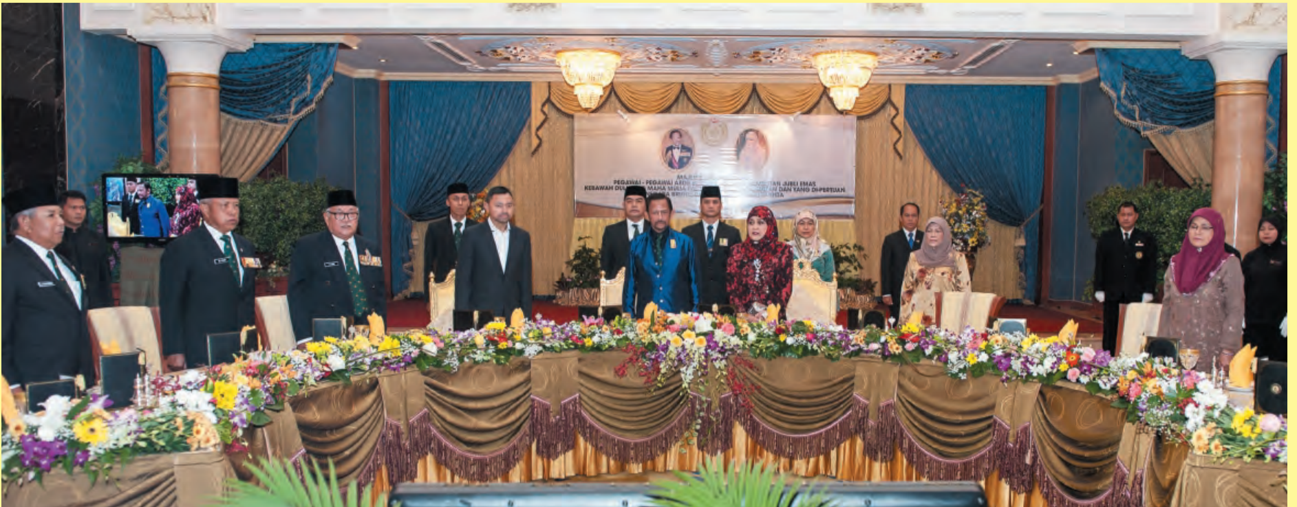
KEBAWAH Duli Yang Maha Mulia Paduka Seri Baginda Sultan Haji Hassanal Bolkiah Mu'izzaddin Waddaulah, Sultan dan Yang Di-Pertuan Negara Brunei Darussalam, Menteri Pertahanan dan Pemerintah Tertinggi ABDB dan Kebawah Duli Yang Maha Mulia Paduka Seri Baginda Raja Isteri Pengiran Anak Hajah Saleha berkenan berangkat ke Majlis Santap Malam yang disembahkan oleh Pegawai-Pegawai ABDB Bersara sempena Sambutan Jubli Emas Kebawah DYMM Paduka Seri Baginda Sultan dan Yang Di-Pertuan Negara Brunei Darussalam Menaiki Takhta. Berangkat sama ialah Duli Yang Teramat Mulia Paduka Seri Pengiran Muda Mahkota Jeneral Pengiran Muda Haji Al-Muhtadee Billah, Menteri Kanan di JPM dan Jeneral ABDB.