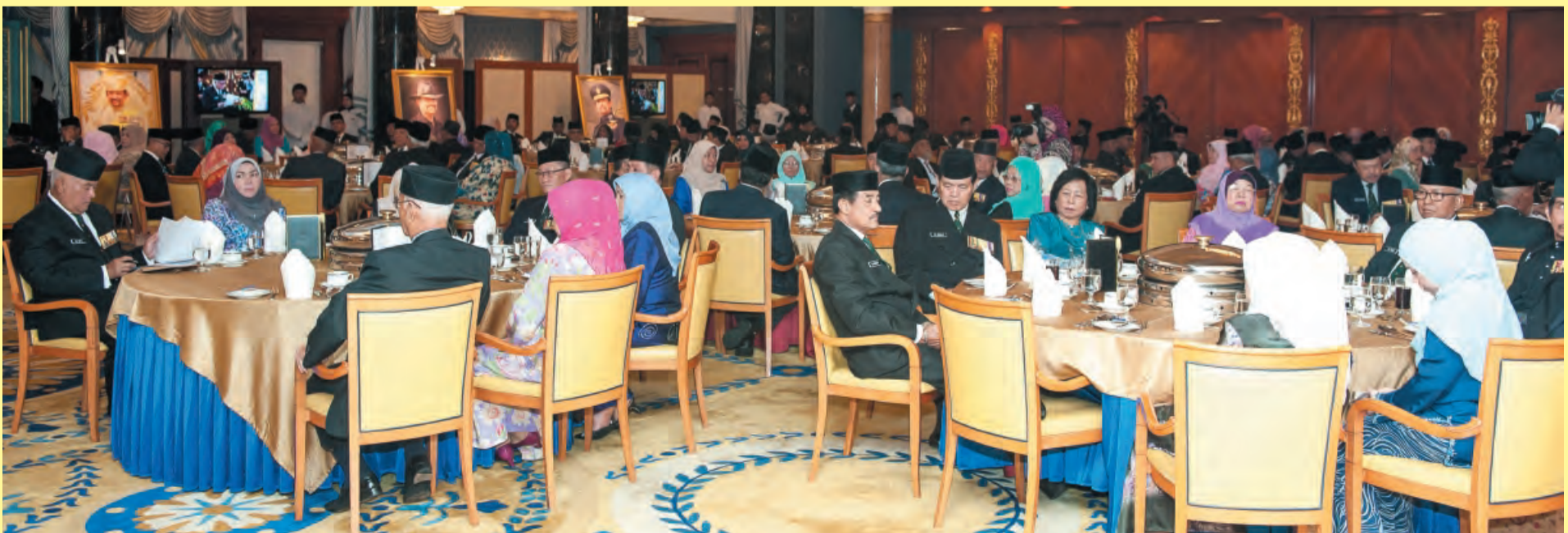
SEBAHAGIAN pegawai bersara ABDB yang hadir pada Majlis Santap Malam tersebut.