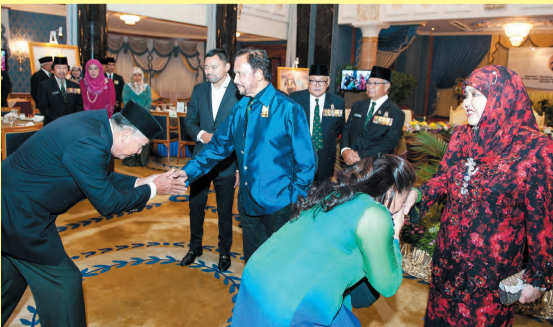
KEBAWAH DYMM Paduka Seri Baginda Sultan dan Yang Di-Pertuan Negara Brunei Darussalam dan Kebawah DYMM Paduka Seri Baginda Raja Isteri berkenan menyaksikan potret pegawai-pegawai ABDB yang bersara (atas sekali), sementara gambar atas, Kebawah DYMM, Kebawah DYMM Paduka Seri Baginda Raja Isteri dan DYTMM Paduka Seri Pengiran Muda Mahkota berkenan menerima junjung ziarah daripada para pegawai ABDB yang bersara bersama isteri. Manakala gambar kanan, antara yang hadir pada Majlis Santap Malam tersebut.