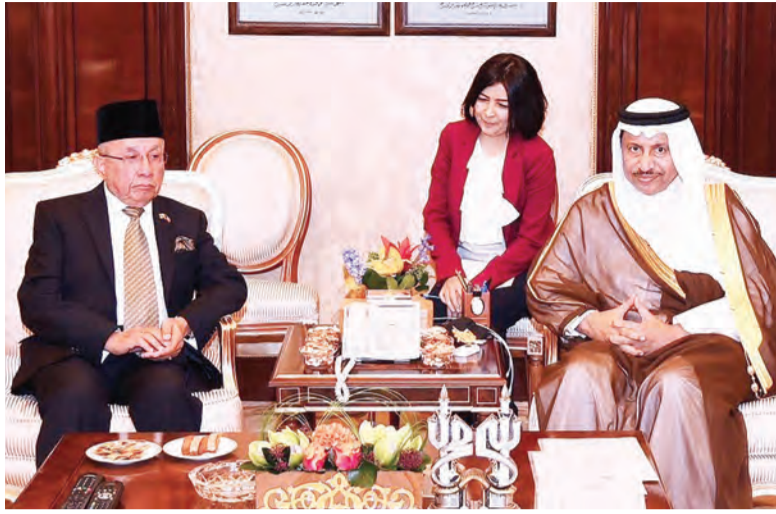
YANG Di-Pertua MMN, Yang Berhormat Pehin Orang Kaya Seri Lela Dato Seri Setia Awang Haji Abdul Rahman ketika mengadakan kunjungan hormat kepada His Highness Sheikh Jaber Al-Mubarak Al-Hamad Al-Sabah, Perdana Menteri Kuwait.