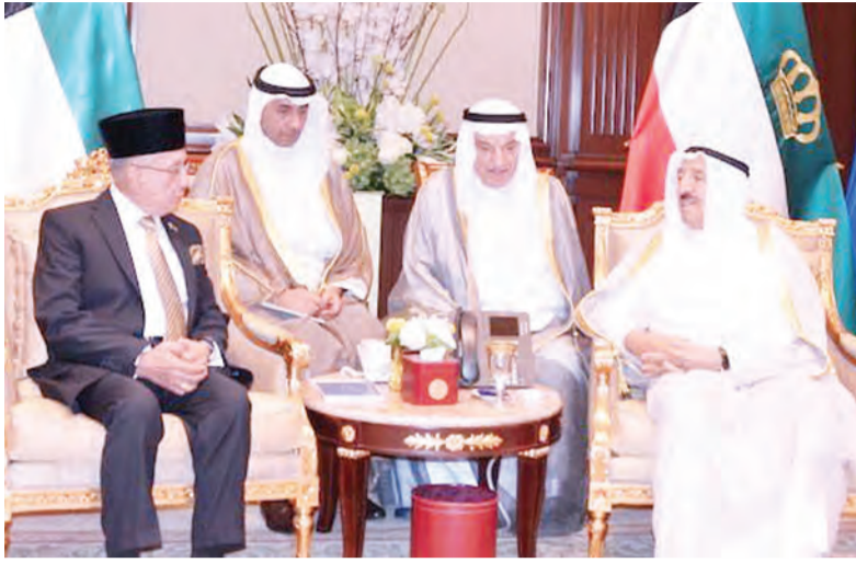
YANG Di-Pertua Majlis Mesyuarat Negara (MMN), Yang Berhormat Pehin Orang Kaya Seri Lela Dato Seri Setia Awang Haji Abdul Rahman bin Dato Setia Haji Mohamed Taib ketika mengadap His Highness Sheikh Sabah Al-Ahmad Al-Jaber Al-Sabah, Amir of Kuwait.