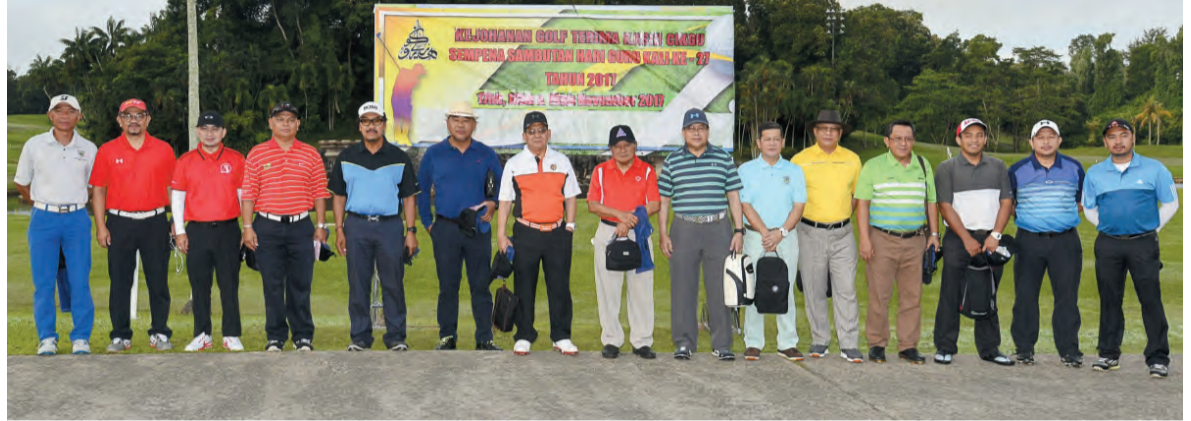
MENTERI Pendidikan, Yang Berhormat Pehin Orang Kaya Indera Pahlawan Dato Seri Setia Awang Haji Suyoi bin Haji Osman menyertai Kejohanan Golf Terima Kasih Cikgu sempena Sambutan Hari Guru Ke-27 Tahun 2017 (kiri). Sementara gambar atas, Yang Berhormat bergambar ramai bersama para peserta yang mengikuti kejohanan berkenaan.