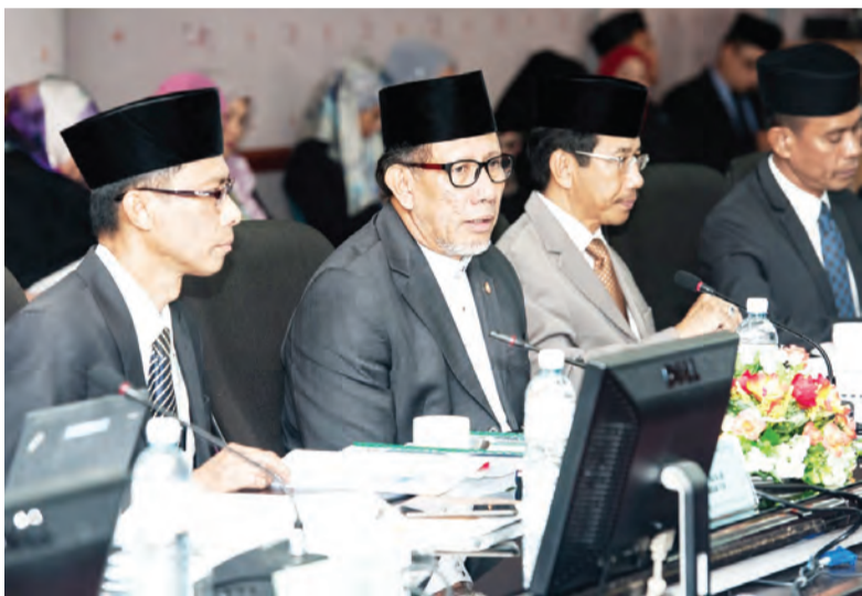
MENTERI Perhubungan, Yang Berhormat Dato Seri Setia Awang Haji Mustappa bin Haji Sirat semasa menyampaikan ucapan alu-aluan pada Sesi Muzakarah bagi Kementerian Perhubungan bersama-sama Yang Berhormat Ahli-ahli Majlis Mesyuarat Negara (MMN).