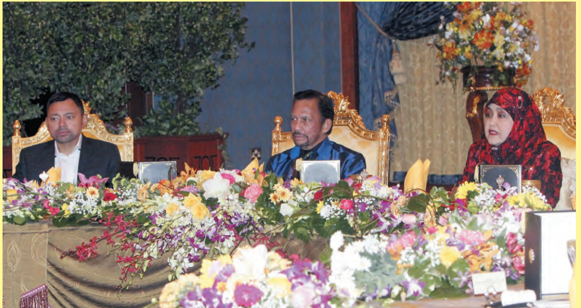
KEBAWAH Duli Yang Maha Mulia Paduka Seri Baginda Sultan Haji Hassanal Bolkiah Mu'izzaddin Waddaulah, Sultan dan Yang Di-Pertuan Negara Brunei Darussalam, Menteri Pertahanan dan Pemerintah Tertinggi ABDB dan Kebawah Duli Yang Maha Mulia Paduka Seri Baginda Raja Isteri Pengiran Anak Hajah Saleha bersama paduka anakanda baginda, Duli Yang Teramat Mulia Paduka Seri Pengiran Muda Mahkota Jeneral Pengiran Muda Haji Al-Muhtadee Billah, Menteri Kanan di Jabatan Perdana Menteri (JPM) dan Jeneral ABDB ketika berkenan berangkat ke Majlis Santap Malam yang disempahkan oleh Pegawai-Pegawai ABDB Bersara sempena Sambutan Jubli Emas Kebawah Duli Yang Maha Mulia Paduka Seri Baginda Sultan dan Yang Di-Pertuan Negara Brunei Darussalam Menaiki Takhta (atas). Sementara gambar kiri, Kebawah Duli Yang Maha Mulia ketika berkenan berangkat ke Majlis Santap Malam tersebut.