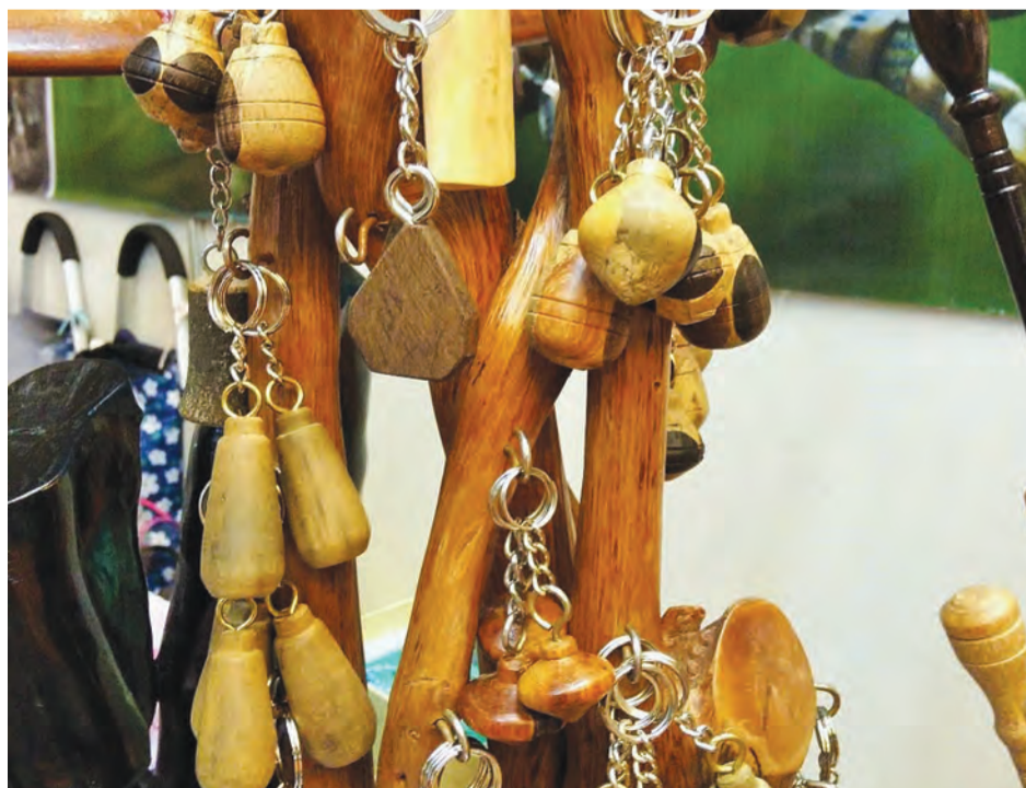
KRAF tangan berupa keychain rekaan beliau dari pelbagai jenis kayu yang mempunyai khasiatnya tersendiri.