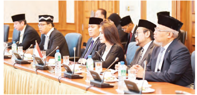
ROMBONGAN Dewan Perwakilan Rakyat, Republik Indonesia diketuai oleh Ahli Parlimennya, Yang Berhormat Rieke Diah Pitaloka (tiga, kanan).