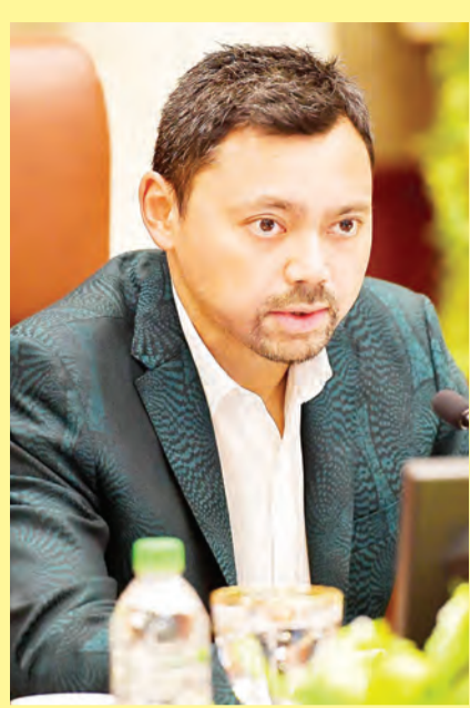
SABDA Duli Yang Teramat Mulia Paduka Seri Pengiran Muda Mahkota Pengiran Muda Haji Al-Muhtadee Billah ibni Kebawah Duli Yang Maha Mulia Paduka Seri Baginda Sultan Haji Hassanal Bolkiah Mu'izzaddin Waddaulah, Timbalan Sultan, Penaung Majlis Kebangsaan Celik Kewangan pada Mesyuarat Pertama Majlis Kebangsaan Celik Kewangan 2017, pada Selasa, 25 Safar 1439 Hijrah bersamaan 14 November 2017 Masihi, di Bilik Mesyuarat Aras 1, Hala Barat Jabatan Perdana Menteri, Jalan Menteri Besar, Bandar Seri Begawan.

Ini adalah selaras dengan titah paduka ayahanda bersempena Tahun Baharu 2012, yang mana menekankan amalan berjimat cermat sebagai kunci kepada kestabilan dan kemakmuran, sama ada di peringkat kerajaan, isi rumah, mahupun individu, dan sebagai asas kepada survival ekonomi negara. Sebaliknya, berbelanja besar