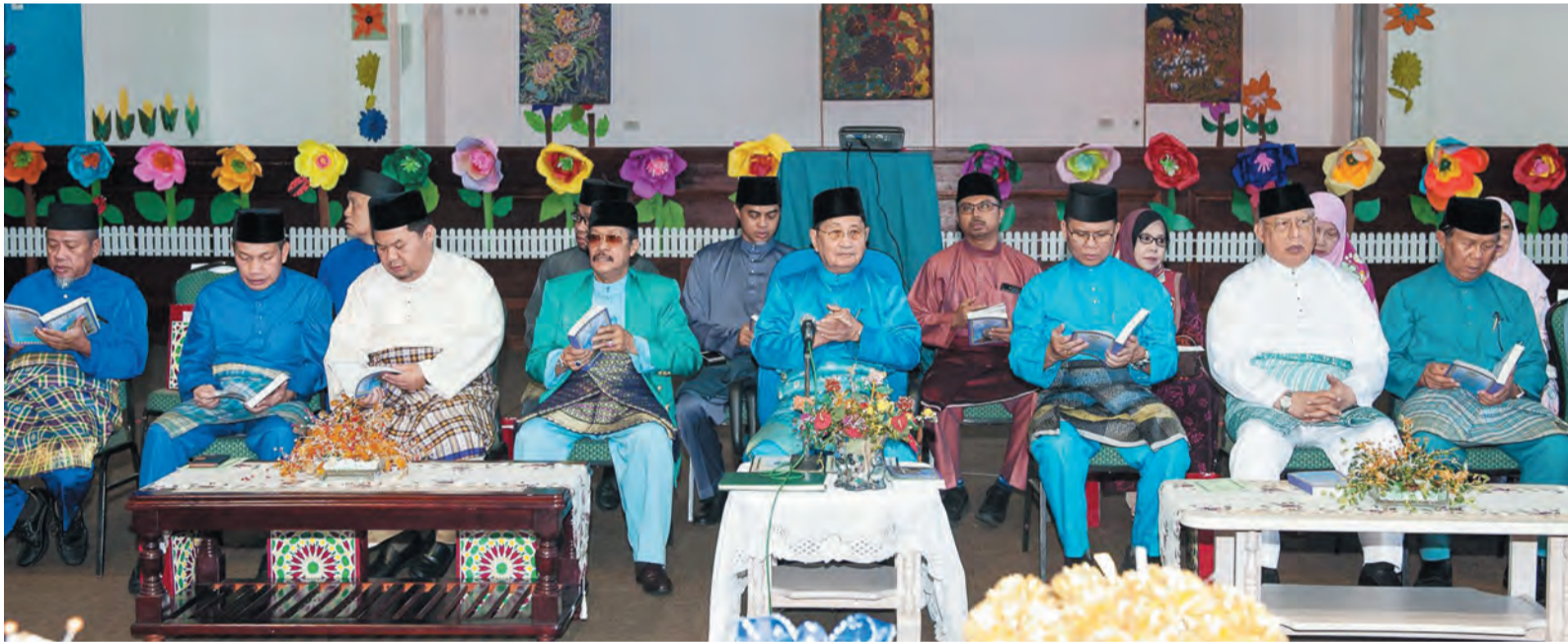
MENTERI Hal Ehwal Ugama, Yang Berhormat Pehin Udana Khatib Dato Paduka Seri Setia Ustaz Haji Awang Badaruddin bin Pengarah Dato Paduka Haji Othman (empat, kanan) hadir selaku tetamu kehormat pada Majlis Khatam Al-Quran.