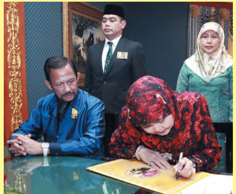
KEBAWAH Duli Yang Maha Mulia Paduka Seri Baginda Raja Isteri berkenan menandatangani Lembaran Tanda Kenangan.

Kebawah DYMM Paduka Seri Baginda Raja Isteri seterusnya berkenan menandatangani Lembaran Tanda Kenangan.