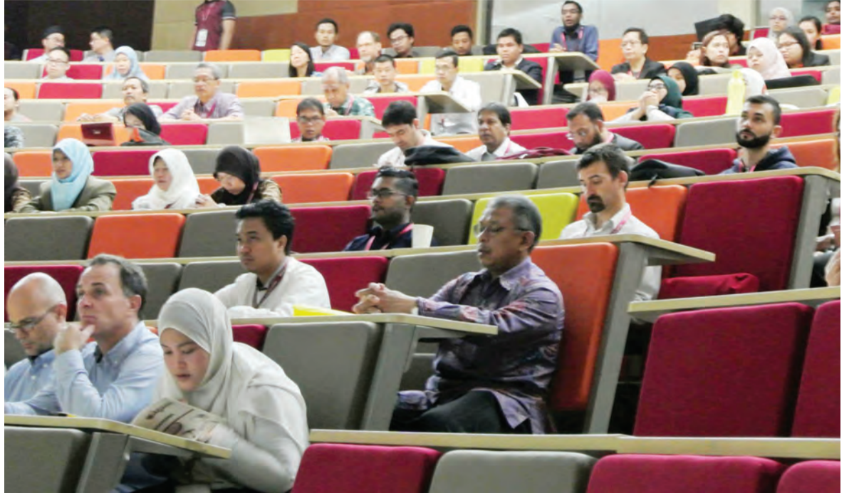
PARA peserta kongres terdiri daripada ahli-ahli akademik dan penyelidik dari institusi-institusi dan syarikat-syarikat dari lebih 30 buah negara termasuk rantau Asia, Eropah dan Afrika.

Oleh : Hajah Siti Zuraiyah Haji Awang Sulaiman