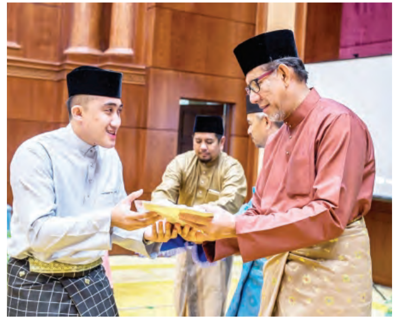
MENTERI Perhubungan, Yang Berhormat Dato Seri Setia Awang Haji Mustappa bin Haji Sirat (kanan) menyampaikan cenderamata kepada seorang peserta qari yang bertanding pada Musabaqah Membaca Al-Quran Bahagian Dewasa Peringkat Separuh Akhir Kebangsaan tersebut.

Majlis diunggayahkan dengan kerjasama Bahagian Kemajuan Syiar Islam dan Jabatan Hal Ehwal Masjid, KHEU.