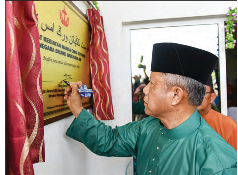
MENTERI Kebudayaan, Belia dan Sukan, Yang Berhormat Pehin Datu Lailaraja Mejar Jeneral (B) Dato Paduka Seri Haji Awang Halbi bin Haji Mohd. Yussof menandatangani plak perasmian Pusat Kegiatan Warga Emas (PKWE) Tutong.

YANG Berhormat Menteri Kebudayaan, Belia dan Sukan bersama jemputan yang lain menyaksikan pameran produk sejour selepas perasmian PKWE Tutong.