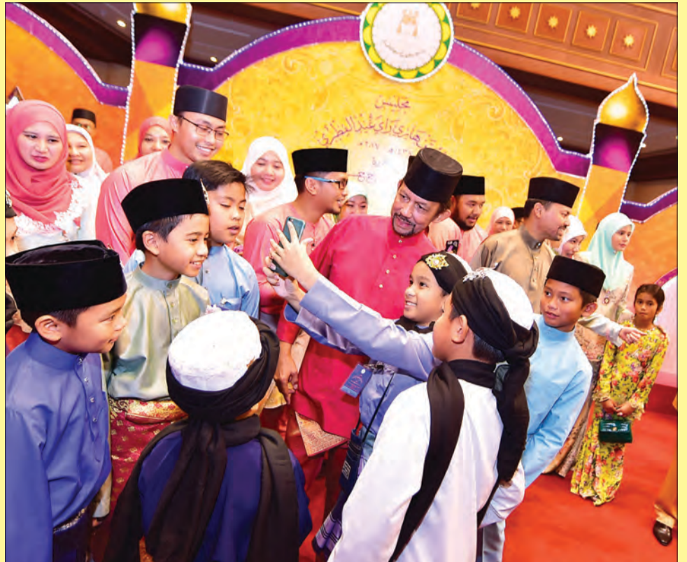
KEBAWAH Duli Yang Maha Mulia Paduka Seri Baginda Sultan Haji Hassanal Bolkiah Mu'izzaddin Waddaulah ibni Al-Marhum Sultan Haji Omar 'Ali Saifuddien Sa'adul Khairi Waddien, Sultan dan Yang Di-Pertuan Negara Brunei Darussalam dan Kebawah Duli Yang Maha Mulia Paduka Seri Baginda Raja Isteri Pengiran Anak Hajah Saleha binti Al-Marhum Pengiran Pemancha Pengiran Anak Haji Mohamed Alam serta paduka-paduka anakanda baginda berkenan berangkat pada Majlis Sambutan Hari Raya Aidilfitri anjuran YSHHB bagi Tahun 1438H / 2017M di Dewan Plenari, Pusat Persidangan Antarabangsa, Berakas (Kiri). Manakala gambar kanan, Kebawah Duli Yang Maha Mulia dan paduka-paduka anakanda berkenan beramah mesra bersama peserta persembahan Hari Raya YSHHB.