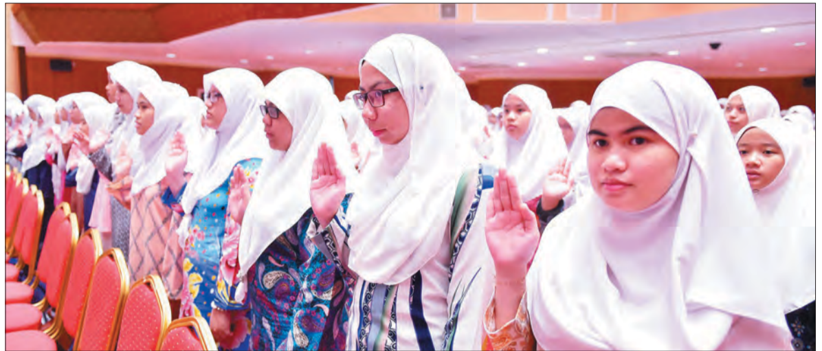
LAFAZ ikrar daripada pelajar pengambilan ketujuh Politeknik Brunei bagi Sesi Akademik 2017 / 2018.