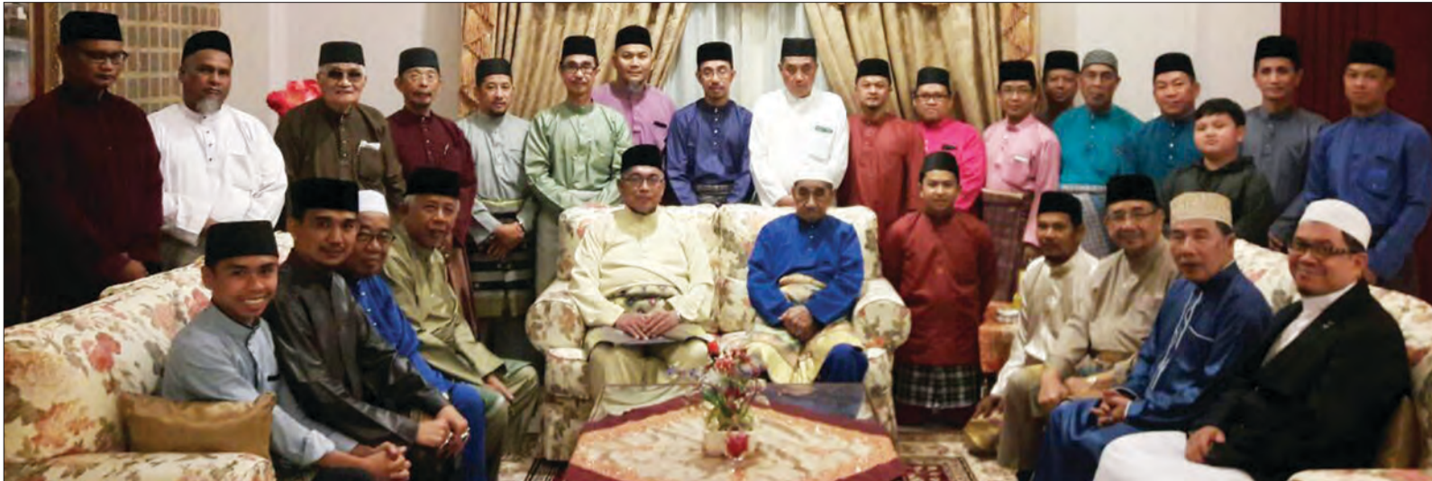
KUNJUNGAN Hari Raya dari Ahli Jawatankuasa Takmir Masjid Kampung Sungai Buloh.