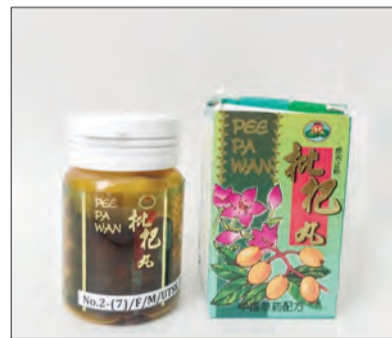
PEE Pa Wan Pill.