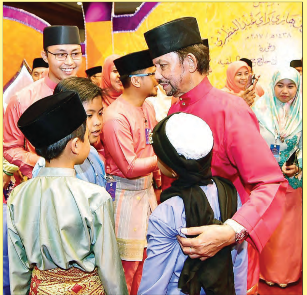
KEBAWAH Duli Yang Maha Mulia Paduka Seri Baginda Sultan dan Yang Di-Pertuan Negara Brunei Darussalam berkenan beramah mesra bersama para pelajar YSHHB.

Dengan adanya sambutan ini akan memberi peluang kepada para peserta untuk beramah mesra dengan raja yang dikasihi di samping memberi inspirasi dan perangsang kepada para peserta agar terus melaksanakan peranan mereka dalam mengharumkan lagi nama bangsa dan negara.