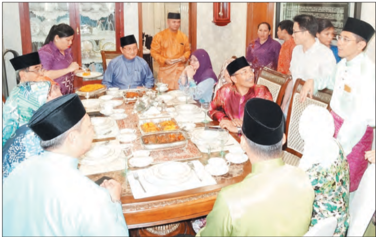
KUNJUNGAN tersebut merupakan kunjungan balas sempena Hari Raya Aidilfitri yang juga merupakan tradisi kedua pemimpin di dalam memeriahkan lagi Sambutan Hari Raya Aidilfitri serta menjalinkan lagi hubungan yang sedia ada (kiri). Sementara gambar kanan, Menteri Hal Ehwal Ugama dan Datin ketika menghadiri jemputan Hari Raya Menteri Perhubungan dan Penerangan, Tuan Yang Terutama Dr. Yaacob bin Ibrahim di Marina Hotel Singapura.

Kunjungan tersebut merupakan kunjungan balas sempena Hari Raya Aidilfitri yang juga merupakan tradisi kedua pemimpin di dalam memeriahkan lagi Sambutan Hari Raya Aidilfitri serta menjalinkan lagi hubungan yang sedia ada, di samping mendekatkan dan mengakrabkan lagi ukhuwah persaudaraan di antara dua buah negara, iaitu Negara Brunei Darussalam dan Republik Singapura, yang mana tradisi kunjung-mengunjungi tanpa mengira apa jua agama, bangsa dan negara.