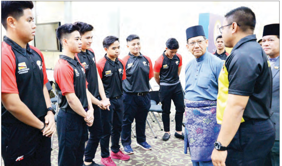
MENTERI Pendidikan, Yang Berhormat Pehin Orang Kaya Indera Pahlawan Dato Seri Setia Awang Haji Suyoi bin Haji Osman semasa mengadakan sesi perjumpaan bersama Kontinjen Majlis Sukan Sekolah-Sekolah Brunei Darussalam (MSSBD) bertempat di Dewan Utama Bangunan Baharu Kementerian Pendidikan.

Semasa sesi perjumpaan berkenaan, Yang Berhormat Menteri Pendidikan turut memberi kata-kata nasihat kepada para atlet yang akan bertanding supaya sentiasa membuat persediaan yang cukup untuk perlawanan nanti, di samping menjaga keterampilan dan budaya Negara Brunei Darussalam serta saling hormat-menghormati dan bersikap baik sepanjang berlangsungnya