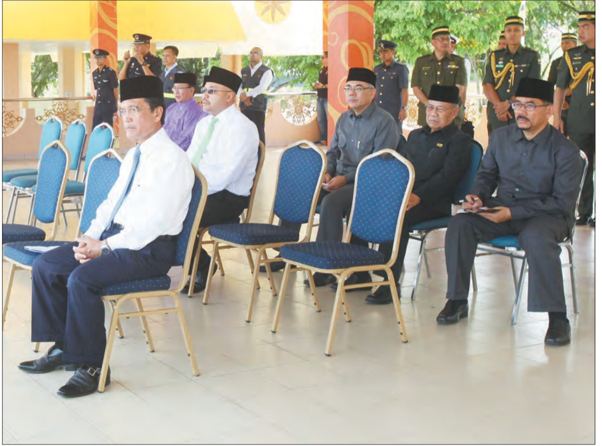
MENTERI Hal Ehwal Dalam Negeri, Yang Berhormat Pehin Orang Kaya Seri Kerna Dato Seri Setia (Dr.) Haji Awang Abu Bakar bin Haji Apong yang juga selaku Pengerusi Jawatankuasa Kebangsaan Sambutan Perayaan Ulang Tahun Hari Keputeraan Kebawah Duli Yang Maha Mulia Ke-71 Tahun semasa hadir menyaksikan latihan penuh 'Full Dress' yang diadakan di Kawasan Padang Kompleks Dewan Kemasyarakatan Daerah Tutong.

Hadir sama, Yang Berhormat Ahli-Ahli Majlis Mesyuarat Negara, Setiausaha Tetap Kementerian Hal Ehwal Dalam Negeri (KHEDN), Timbalan Setiausaha Tetap KHEDN, pegawai-pegawai kanan kerajaan serta Ahli-Ahli Jawatankuasa Tertinggi sempena Sambutan Ulang Tahun Hari Keputeraan Kebawah DYMM Paduka Seri Baginda Sultan dan Yang Di-Pertuan Negara Brunei Darussalam Ke-71 Tahun bagi daerah ini tahun 2017.