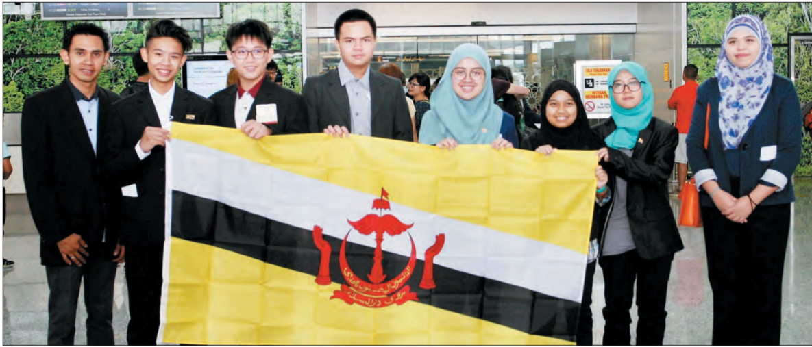
SEROMBONGAN lapan orang terdiri daripada dua Pegawai Pelajaran selaku Guru Pengawas dan enam pelajar telah berlepas ke Hanoi Viet Nam bagi mewakili negara menyertai The 6th ASEAN Plus Three Junior Science Odyssey (APTJSO).

Oleh : Dk. Siti Redzaimi Pg. Haji Ahmad