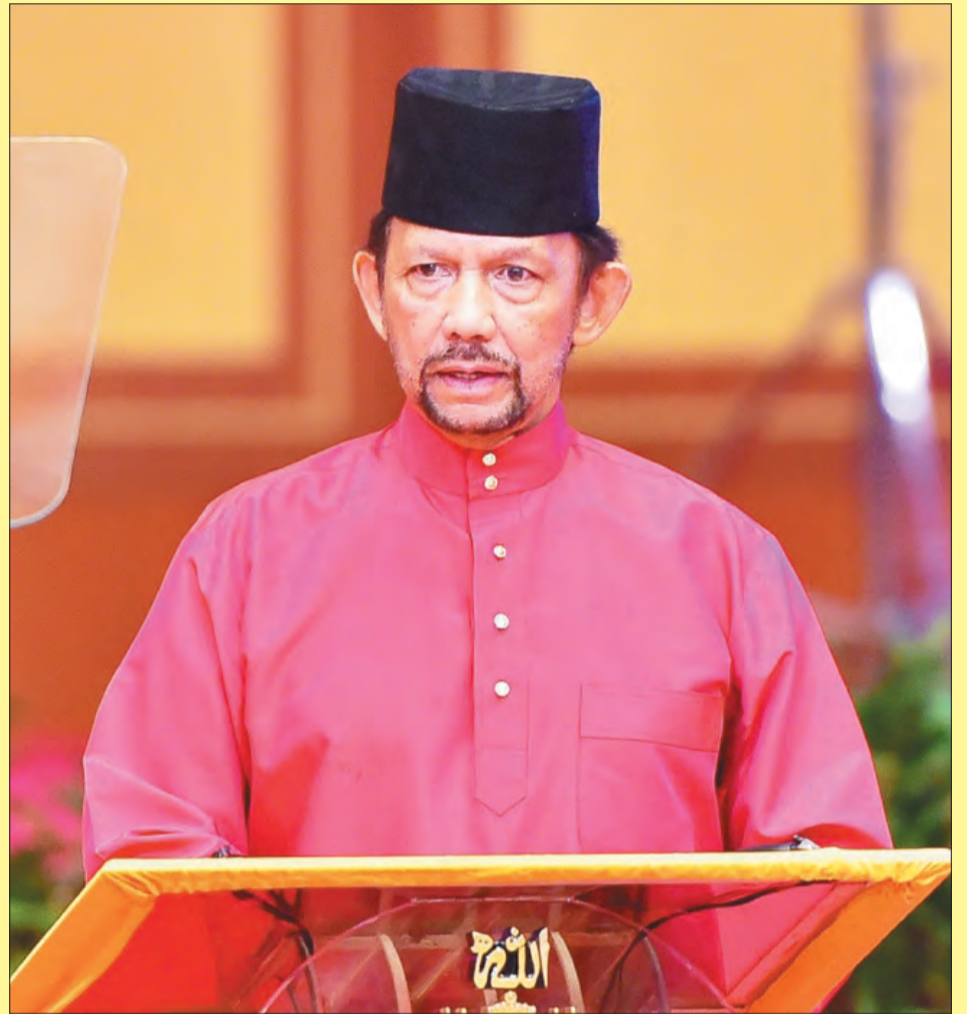
KEBAWAH Duli Yang Maha Mulia Paduka Seri Baginda Sultan Haji Hassanal Bolkiah Mu'izzaddin Waddaulah ibni Al-Marhum Sultan Haji Omar 'Ali Saifuddien Sa'adul Khairi Waddien, Sultan dan Yang Di-Pertuan Negara Brunei Darussalam berkenan mengurniakan titah pada Majlis Sambutan Hari Raya Aidilfitri Tahun 1438 Hijrah / 2017 Masihi anjuran Yayasan Sultan Haji Hassanal Bolkiah di Dewan Plenari, Pusat Persidangan Antarabangsa, Berakas. (Lihat muka 3, 4, 5 dan 6).