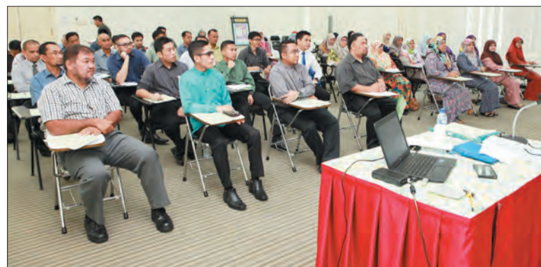
PARA peserta yang mengikuti Kursus Pengukuhan Islam Tashawwuf anjuran Pusat Da'wah Islamiah.

Dalam pada itu, Pelita Brunei menemu bual Pegawai Perkembangan Ugama, PDI, Awang Haji Fansuri Sharimi @ Mansur bin Awang Mohamad Ali yang antara lain menjelaskan bahawa kursus tersebut merupakan rancangan tahunan Unit Kursus, Bahagian Penyebaran Dakwah yang bertujuan bagi memperkukuhkan lagi pengetahuan dari segi kerohanian untuk menjadikan Islam sebagai cara hidup yang sempurna.