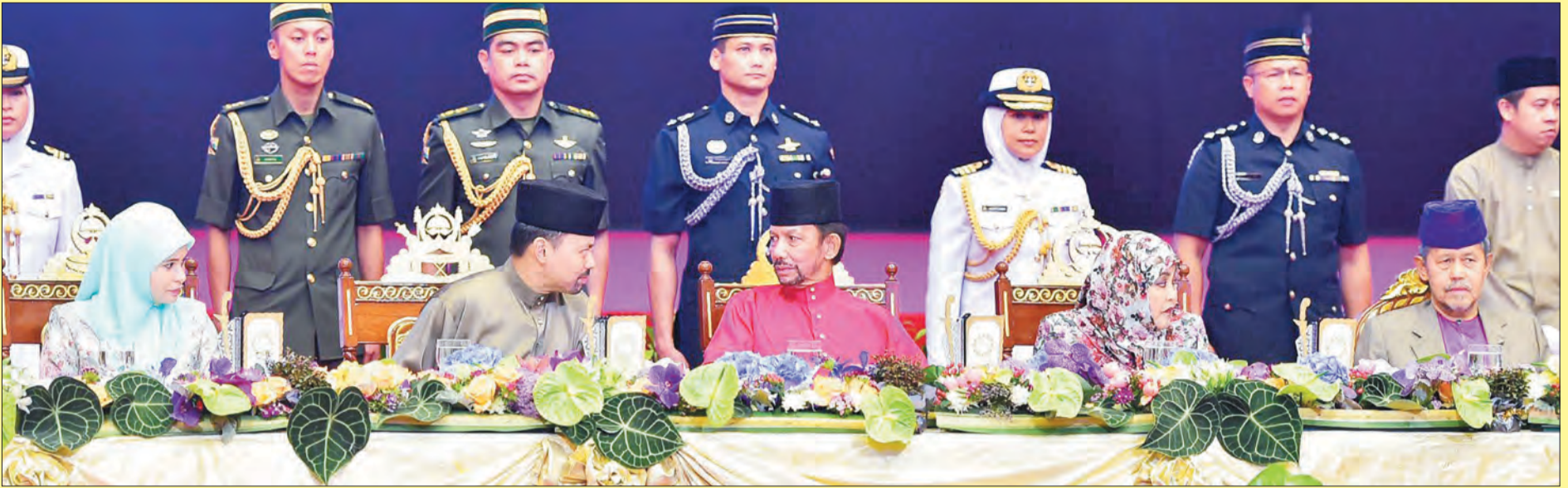
KEBAWAH Duli Yang Maha Mulia Paduka Seri Baginda Sultan Haji Hassanal Bolkiah Mu'izzaddin Waddaulah ibni Al-Marhum Sultan Haji Omar 'Ali Saifuddien Sa'adul Khairi Waddien, Sultan dan Yang Di-Pertuan Negara Brunei Darussalam dan Kebawah Duli Yang Maha Mulia Paduka Seri Baginda Raja Isteri Pengiran Anak Hajah Saleha binti Al-Marhum Pengiran Pemancha Pengiran Anak Haji Mohamed Alam bersama paduka-paduka anakanda dan adinda baginda berkenan berangkat pada Majlis Sambutan Hari Raya Aidilfitri anjuran Yayasan Sultan Haji Hassanal Bolkiah bagi Tahun 1438 Hijrah / 2017 Masihi.