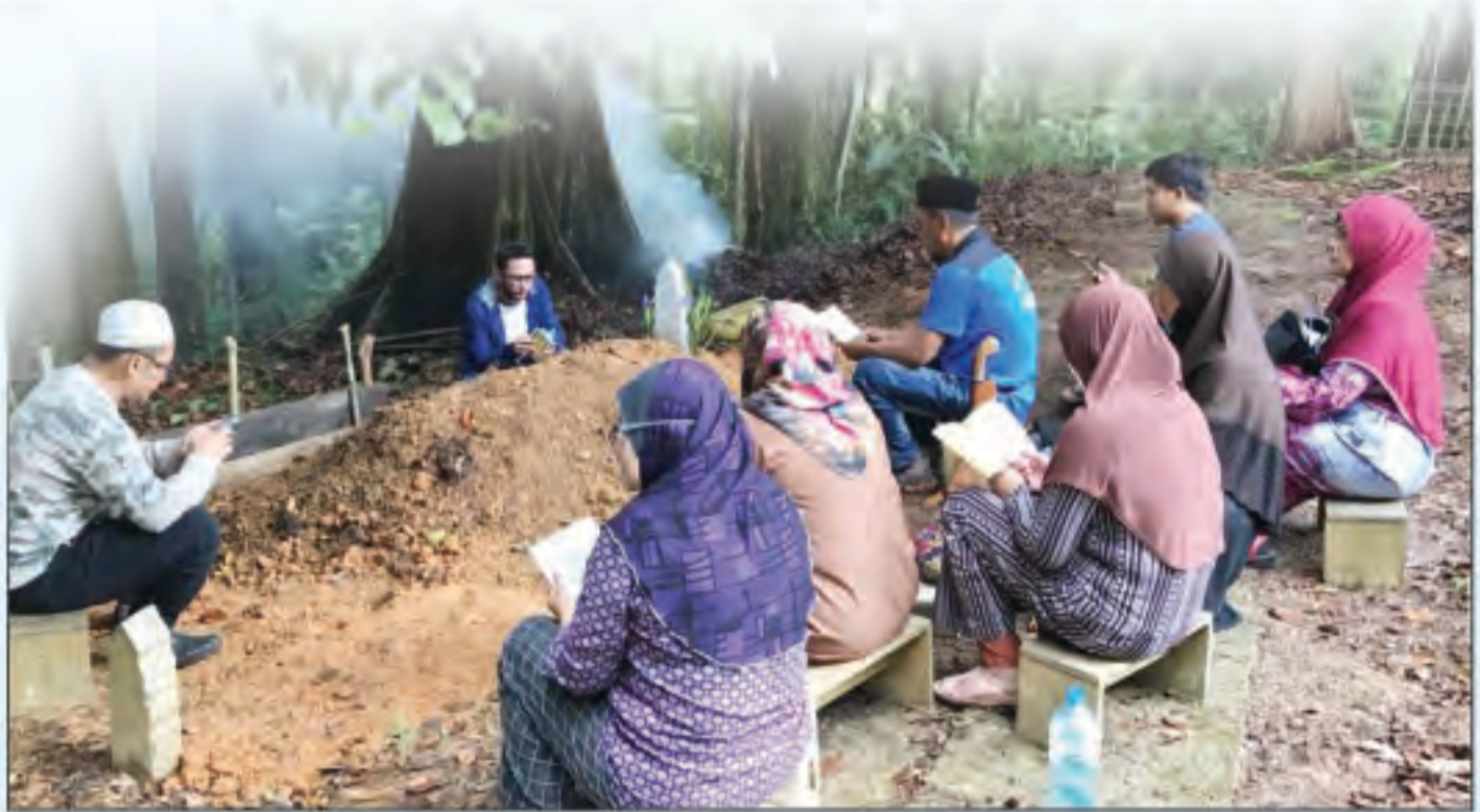
KEHILANGAN orang tersayang memang mendatangkan kesyahduan di Aidilfitri.

P EMERGIANNYA tanpa dirancang, kehilangannya tidak terdugakan, setelah ketiadaannya, memang begitu terasa kehilangannya. Aidilfitri merupakan bulan kemenangan bagi setiap umat Islam setelah berjaya melawan semua dugaan di sepanjang bulan Ramadan. Bulan untuk bersuka ria. Namun ada segelintir umat Islam