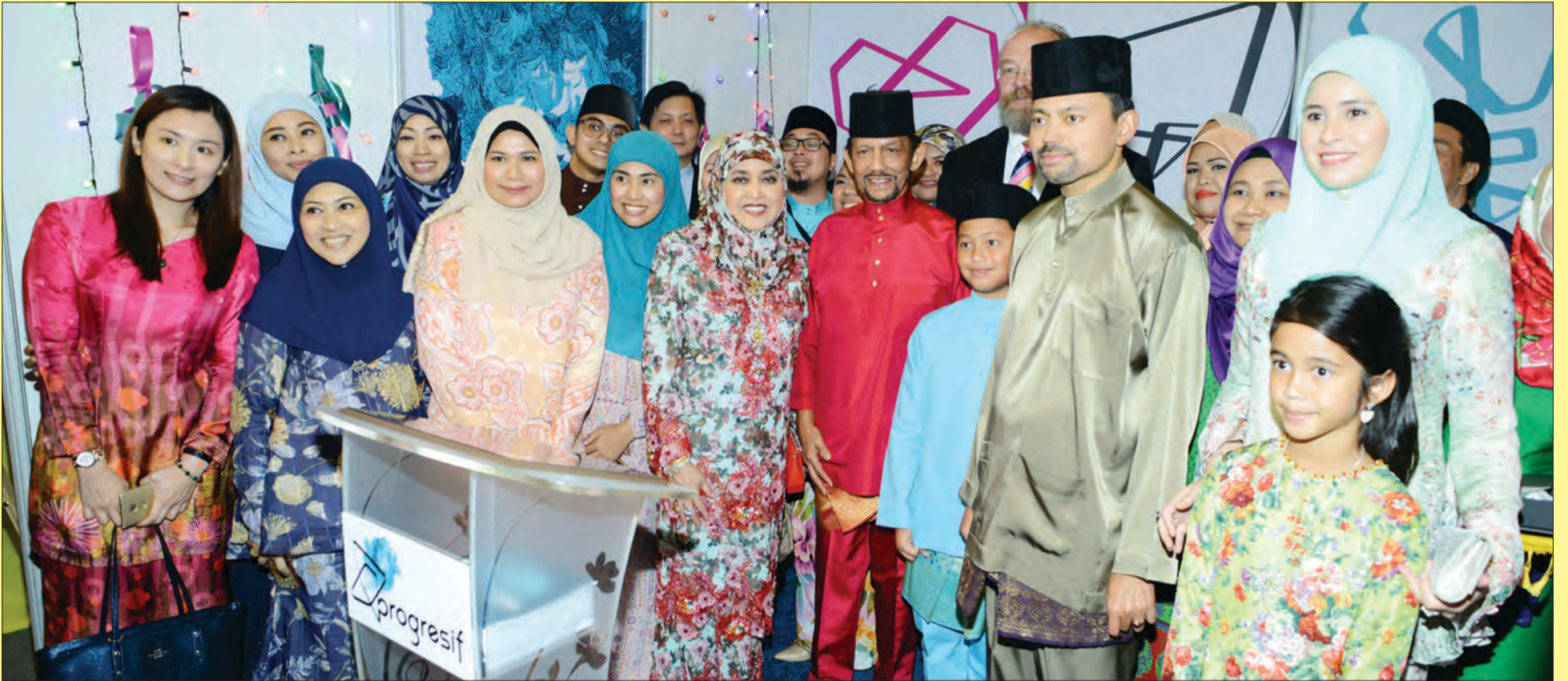
KEBAWAH Duli Yang Maha Mulia Paduka Seri Baginda Sultan Haji Hassanal Bolkiah Mu'izzaddin Waddaulah, Sultan dan Yang Di-Pertuan Negara Brunei Darussalam dan Kebawah Duli Yang Maha Mulia Paduka Seri Baginda Raja Isteri Pengiran Anak Hajah Saleha bersama paduka-paduka anakanda baginda ketika berkenan bergambar ramai pada Majlis Sambutan Hari Raya Aidilfitri Tahun 1438H / 2017M anjuran YSHHB.

BANDAR SERI BEGAWAN, Isnin, 10 Julai. - Dengan menentengahkan mereka yang berjaya atau the achievers semasa Sambutan Hari Raya Aidilfitri Tahun 1438 Hijrah / 2017 Masihi anjuran Yayasan Sultan Haji Hassanal Bolkiah (YSHHB), setentunya dapat memberikan semangat dan motivasi kepada mereka untuk terus meningkatkan usaha bagi meraih kejayaan dan kecemerlangan pada masa hadapan.