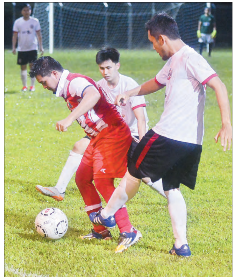
ANTARA aksi perlawanan di antara DSP United (jersi putih) menentang Tunas FC (jersi merah) di Padang bola Kompleks Sukan Sungai Kebun (atas dan kanan).

menghadiahkan gol keempat bagi pasukannya. Sebelum wisel penamat dibunyikan, Tunas FC akhirnya sempat membolos