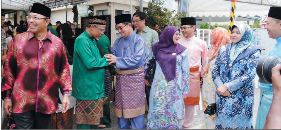
MENTERI Hal Ehwal Ugama, Yang Berhormat Pehin Udana Khatib Dato Paduka Seri Setia Ustaz Haji Awang Badaruddin bin Pengarah Dato Paduka Haji Othman dan Datin berkesempatan berkunjung berhari raya di kediaman Menteri Persekutaran dan Sumber Air, Republik Singapura, Tuan Yang Terutama Masagos Zulkifli bin Masagos Mohammad.

REPUBLIK SINGAPURA, Isnin, 10 Julai. - Menteri Hal Ehwal Ugama, Yang Berhormat Pehin Udana Khatib Dato Paduka Seri Setia Ustaz Haji Awang Badaruddin bin Pengarah Dato Paduka Haji Othman dan Datin menghadiri jemputan Hari Raya Menteri Perhubungan dan Penerangan, Tuan Yang Terutama