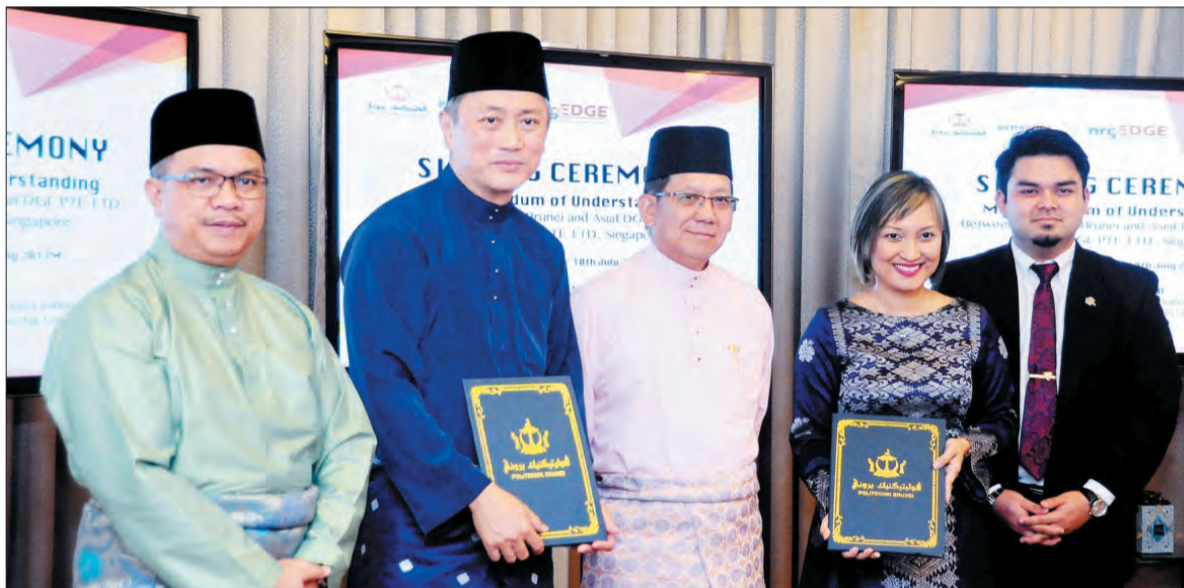
YANG Berhormat Menteri Pendidikan hadir selaku tetamu kehormat semasa penandatanganan MoU yang bertujuan untuk menubuhkan kerjasama formal untuk peluang latihan dan akses pada platform AsiaEdge dan NrgEDGE bagi kebaikan bersama dalam latihan para pelajar (kiri).