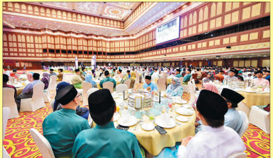
SUASANA Majlis Sambutan Hari Raya Aidilfitri anjuran YSHHB bagi Tahun 1438H / 2017M.