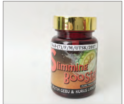
SLIMMING Booster Capsule 350mg.

produk berkenaan adalah dilarang untuk diimport dan dijual di Negara Brunei Darussalam.