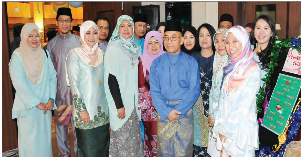
MENTERI Sumber-Sumber Utama dan Pelancongan, Yang Berhormat Dato Seri Setia Awang Haji Ali bin Haji Apong bergambar ramai bersama pegawai dan kakitangan Kementerian Sumber-Sumber Utama dan Pelancongan dan jabatan-jabatan di bawahnya pada Majlis Sambutan Ramah Mesra Hari Raya Aidilfitri (kiri). Sementara gambar kanan Yang Berhormat sama-sama menikmati juadah hari raya sempena dengan sambutan tersebut.