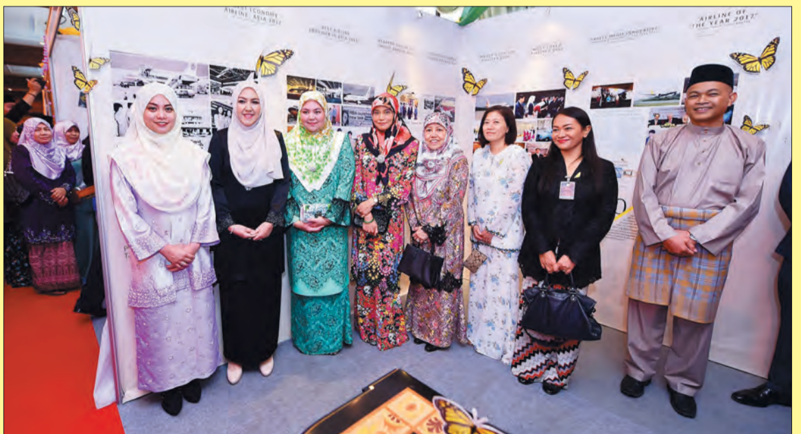
YANG Teramat Mulia Paduka Seri Pengiran Anak Puteri Hajah Rashidah Sa'adatul Bolkiah, Yang Teramat Mulia Paduka Seri Pengiran Anak Puteri Hajah Majeedah Nuurul Bolkiah dan Yang Teramat Mulia Paduka Seri Pengiran Anak Puteri Hajah Masna ketika berkenan mengadakan lawatan ke salah satu pameran.