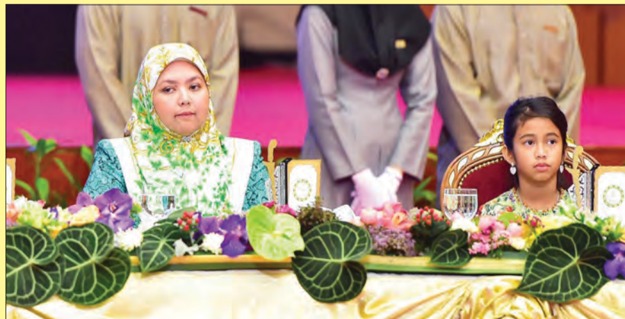
JUGA berangkat ialah Yang Teramat Mulia Paduka Seri Pengiran Anak Puteri Hajah Rashidah Sa'adatul Bolkiah ibni Kebawah Duli Yang Maha Mulia Paduka Seri Baginda Sultan Haji Hassanal Bolkiah Mu'izzaddin Waddaulah dan Yang Teramat Mulia Paduka Seri Pengiran Anak Puteri Ameerah Wardatul Bolkiah ibni Kebawah Duli Yang Maha Mulia Paduka Seri Baginda Sultan Haji Hassanal Bolkiah Mu'izzaddin Waddaulah.