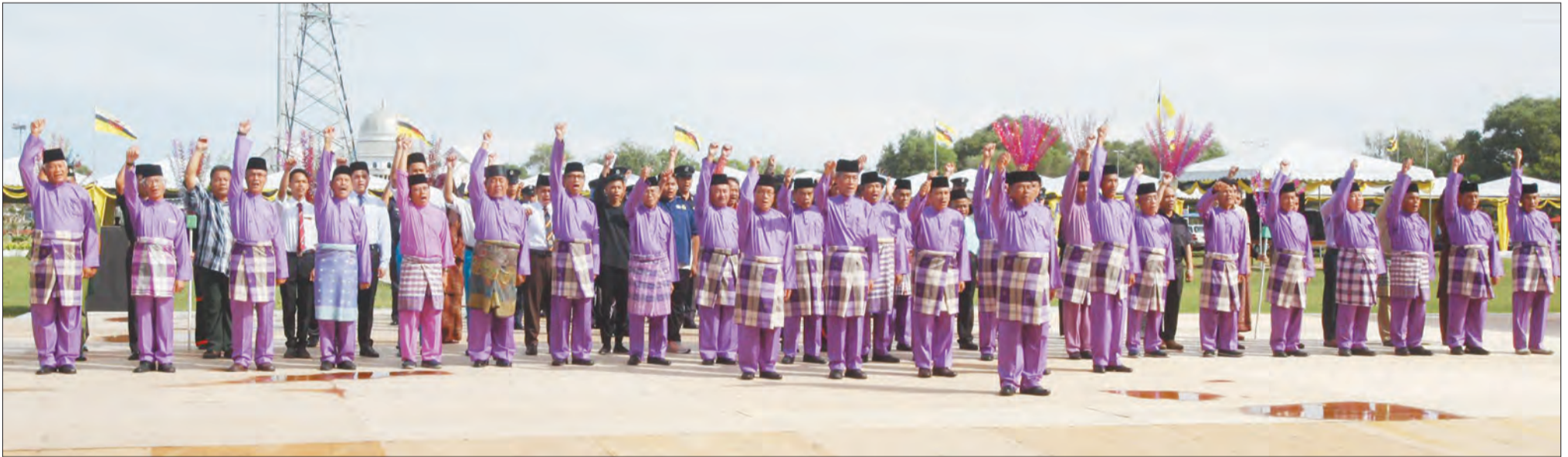
SUASANA latihan penuh Majlis Ramah Mesra dan Junjung Ziarah Bersama Rakyat dan Penduduk Daerah Tutong.