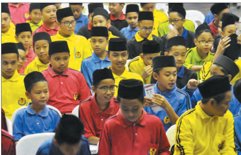
SEBAHAGIAN daripada 140 penuntut yang hadir pada Taklimat Kenegaraan 'Menghayati Bendera dan Lagu Kebangsaan Negara Brunei Darussalam' bertempat di Dewan Maktab Anthony Abell.

dan Lagu Kebangsaan Negara Brunei Darussalam' bertempat di Dewan Maktab Anthony Abell. Taklimat disampaikan oleh