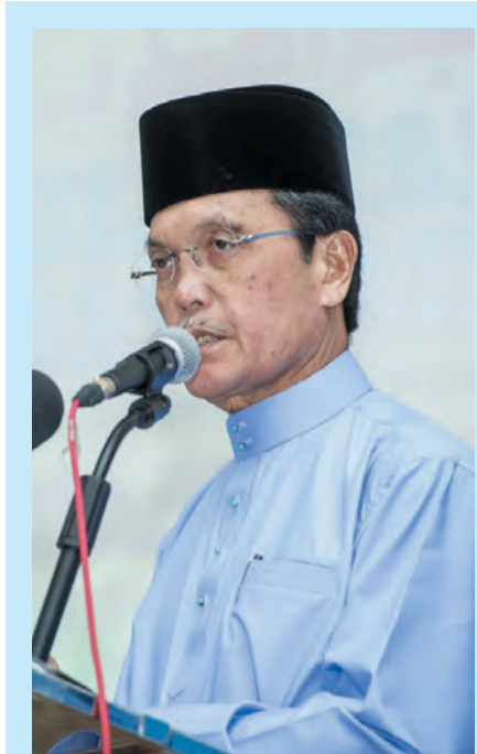
MENTERI Hal Ehwal Dalam Negeri, Yang Berhormat Pehin Orang Kaya Seri Kerna Dato Seri Setia (Dr.) Haji Awang Abu Bakar bin Haji Apung semasa berucap pada Majlis Sambutan Hari Raya Aidilfitri Kementerian Hal Ehwal Dalam Negeri dan Jabatan-Jabatan Di Bawahnya 1438 Hijrah / 2017 Masihi pada 12 Syawal 1438H bersamaan 7 Julai 2017M di Dewan Serbaguna, Ibu Pejabat Bomba dan Penyelamat, Negara Brunei Darussalam.

mengerjakan Solat Tarawih, bertadurus Al-Quran dan majlis ilmu. Adalah mustahak untuk kita, khususnya yang bertanggungjawab kepada akar umbi untuk bersama-sama memupuk dan memelihara kehidupan bersatu padu dan bekerja sebagai satu pasukan.