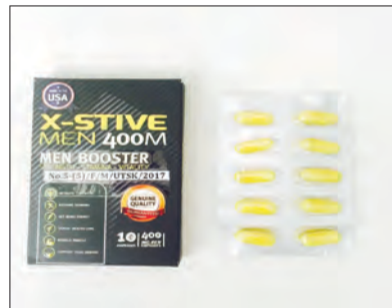
X-STIVE Men 400M 400mg Capsule.

Kementerian Kesihatan tidak pernah mengeluarkan kebenaran ke atas pengimportan bagi penjualan produk-produk tersebut. Berikutan dapatan ini, produk-