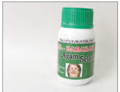
AL-BARAKAH Ayam Selasih Pil.