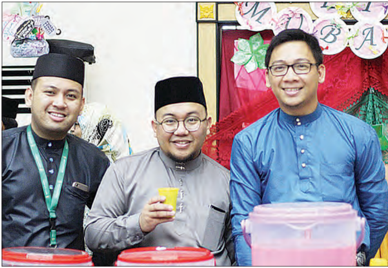
ANTARA mahasiswa UNISSA yang hadir pada Sambutan Hari Raya Aidilfitri dengan konsep 'Open Booth' (Gerai Terbuka) yang disediakan oleh Fakulti-Fakulti dan Pusat-Pusat di UNISSA (kiri dan kanan).