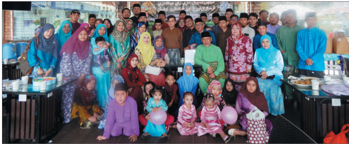
MAJLIS Sambutan Hari Raya Bersama Persatuan OKP Kebangsaan Brunei Darussalam.

Berita dan Foto : Ihsan Faridah Haji Ibrahim