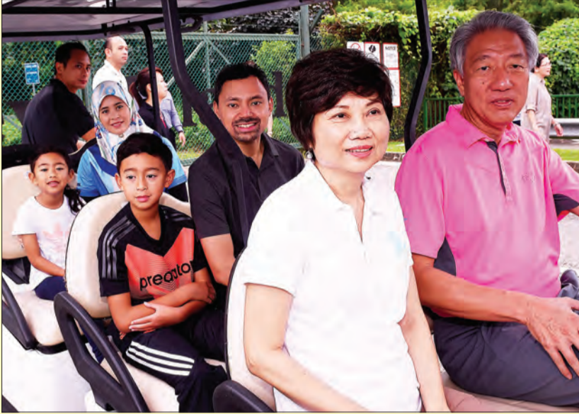
DULI Yang Teramat Mulia Paduka Seri Pengiran Muda Mahkota Pengiran Muda Haji Al-Muhtadee Billah ibni Kebawah Duli Yang Maha Mulia Paduka Seri Baginda Sultan Haji Hassanal Bolkiah Mu'izzaddin Waddaulah, Menteri Kanan di Jabatan Perdana Menteri dan Yang Teramat Mulia Paduka Seri Pengiran Anak Isteri Pengiran Anak Sarah binti Pengiran Haji Salleh Ab. Rahaman dan paduka-paduka anakanda Duli Yang Teramat Mulia berkenan berangkat bagi Outdoor Walk / Buggy Ride bersama Timbalan Perdana Menteri dan Menteri Koordinasi bagi Keselamatan Nasional Republik Singapura, Tuan Yang Terutama Teo Chee Hean dan isteri, Puan Chew Poh Yim (atas, kanan, bawah dan bawah kanan).