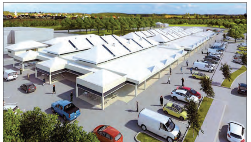
LAKARAN bangunan kekal baharu Pasar Malam Gadong yang dijangka siap penghujung bulan Disember depan bagi menempatkan para peniaga berdaftar yang beroperasi di Pasar Malam Gadong yang ada sekarang.

untuk berhati-hati dan bersabar dalam sama-sama mendukung agar projek dapat disiapkan mengikut yang dirancang.