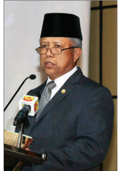
MENTERI Kebudayaan, Belia dan Sukan, Yang Berhormat Pehin Datu Lailaraja Mejar Jeneral (B) Dato Paduka Seri Haji Awang Halbi bin Haji Mohd. Yusoff semasa berucap merasmikan PSB VI.

Kerjasama erat DBP dan ASTERAWANI jelas Yang Berhormat,