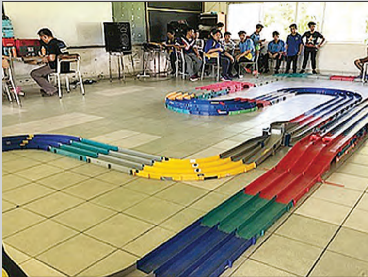
MINI Car Race, antara aktiviti yang diadakan sepanjang Festival Keluarga Bertaja dan Hari Terbuka Sekolah Menengah Raja Isteri Pengiran Anak Saleha, Tutong.