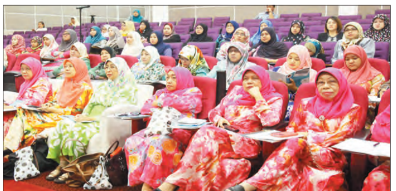
PARA peserta yang terdiri dari pelbagai agensi kerajaan dan bukan kerajaan menghadiri Perkongsian Pengalaman Dari Zero Menjadi Hero, anjuran Majlis Perniagaan Wanita Brunei Darussalam (MPWBD) dengan kerjasama Jabatan Penerangan, Jabatan Perdana Menteri.

Pada masa yang sama, merekomendasi mereka bagi kaum wanita untuk membentuk kehidupan yang lebih baik dan energise masyarakat sekeliling selain menjadi role model kepada pengusaha yang baharu.