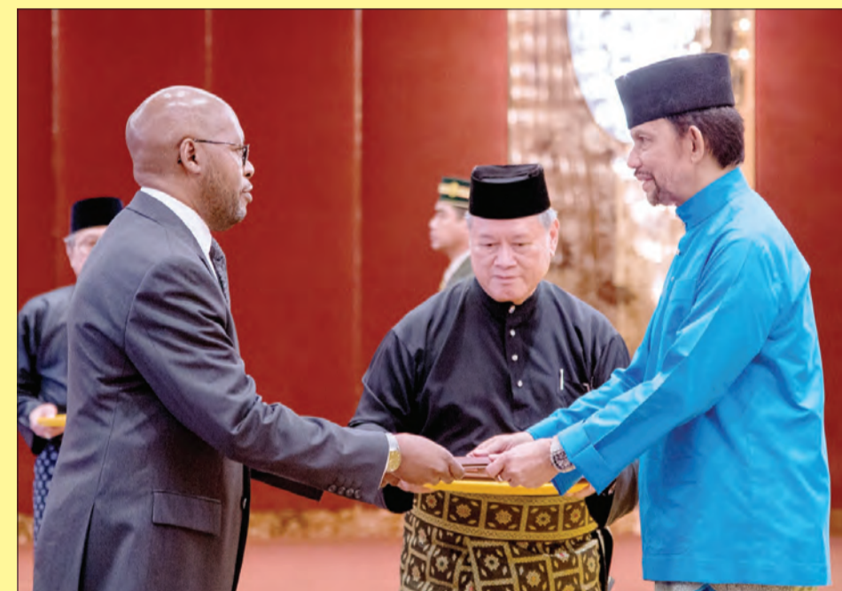
BAGINDA berkenan menerima Surat Tauliah Pelantikan daripada Pesuruhjaya Tinggi Republik Zambia, Tuan Yang Terutama Walubita Imakando.