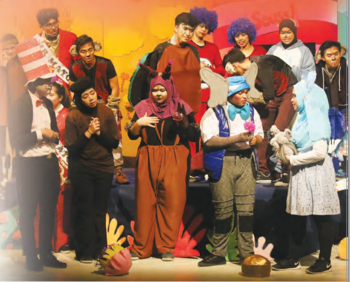
ANTARA suasana pementasan drama Seuss (atas, kiri, bawah kiri dan bawah kanan).

Menyentuh mengenai Seeds Brunei, inspirasi untuk menubuhkan persatuan drama bagi para pelajar ini bermula dari penglibatan guru-guru dalam aktiviti-aktiviti drama yang diadakan oleh Persatuan Drama Amatur Brunei (Brunei Amateur Dramatic Society - BADS). Melalui persatuan ini para ahli berpeluang berkongsi pengalaman dan pengetahuan dalam bidang pementasan drama dengan orang ramai ke arah membantu mereka untuk beraksi di pentas dengan lebih baik serta