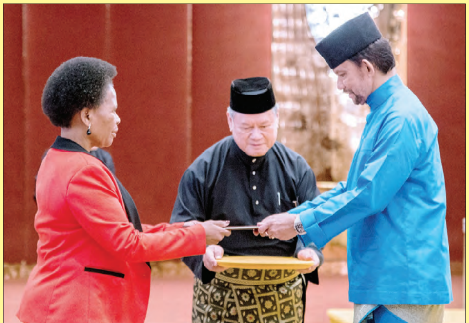
BAGINDA berkenan menerima Surat Tauliah Pelantikan daripada Pesuruhjaya Tinggi Republik Afrika Selatan, Puan Yang Terutama Samkelisiwe Isabel Mhlanga.