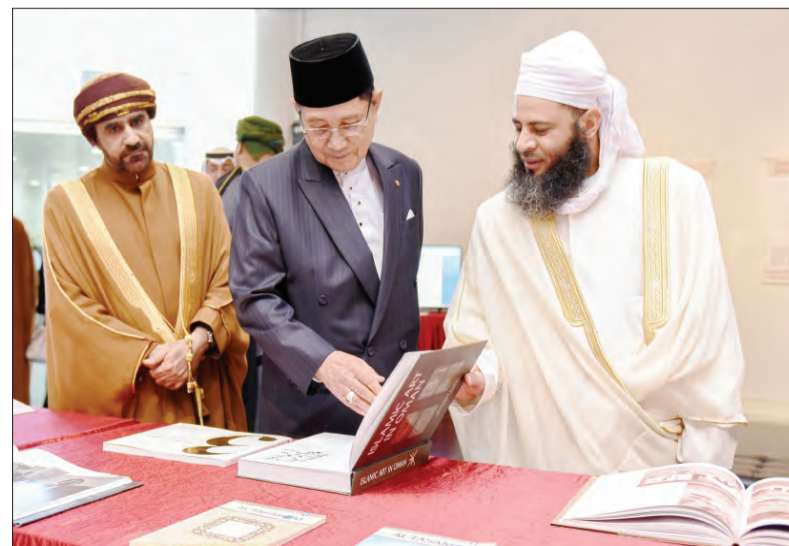
MENTERI Hal Ehwal Ugama menyaksikan Pameran Tolerance, Understanding, Coexistence : Oman's Message of Islam di Negara Brunei Darussalam.

Pameran Tolerance, Understanding, Coexistence : Oman's Message of Islam di Negara Brunei Darussalam dibukakan kepada orang ramai bermula 30 November hingga 1 Disember 2016 bermula jam 10.00 pagi hingga 5.00 petang di Auditorium Pusat Seni (Art Centre) Sekolah Antarabangsa Jerudong.