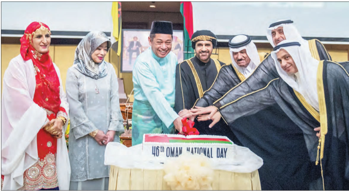
MENTERI Tenaga dan Perindustrian di Jabatan Perdana Menteri, Yang Berhormat Pehin Datu Singamanteri Kolonel (B) Dato Seri Setia (Dr.) Awang Haji Mohammad Yasmin bin Haji Umar dan isteri, bersama-sama dengan Duta Besar Istimewa dan Mutlak Kesultanan Oman ke Negara Brunei Darussalam, Tuan Yang Terutama Sheikh Ahmed bin Hashil bin Rashid Al-Maskari dan isteri semasa memotong kek pada Majlis Resepsi Sempena Hari Kebangsaan Kesultanan Oman ke 46 tahun bertempat di Indera Samudra Grand Hall, The Empire Hotel & Country Club, Jerudong.