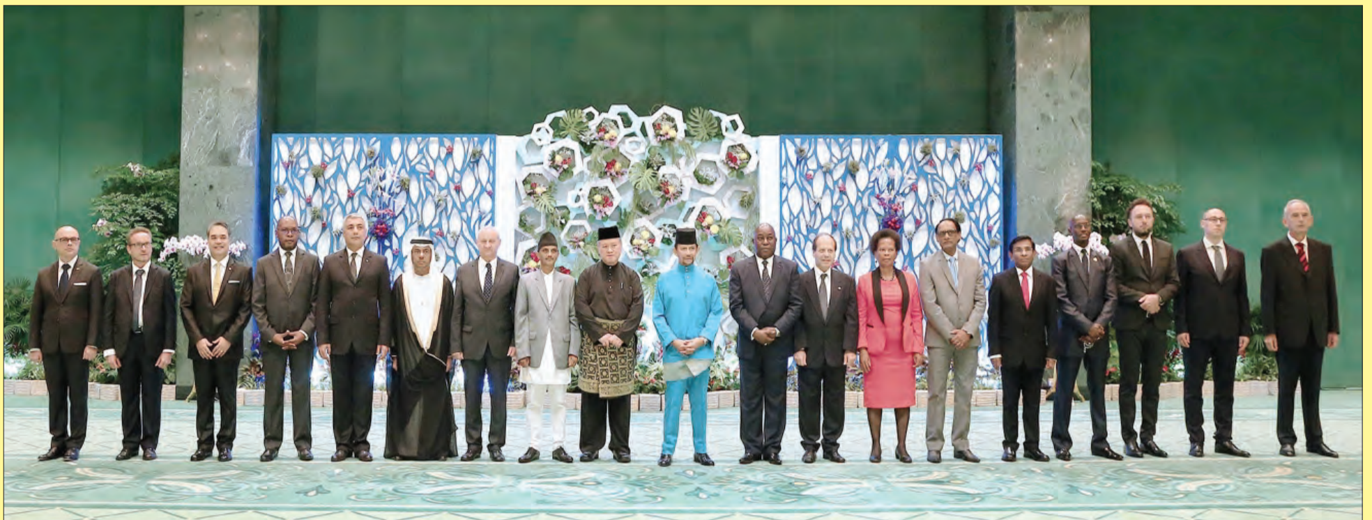
KEBAWAH Duli Yang Maha Mulia Paduka Seri Baginda Sultan Haji Hassanal Bolkiah Mu'izzaddin Waddaulah ibni Al-Marhum Sultan Haji Omar 'Ali Saifuddien Sa'adul Khairi Waddien, Sultan dan Yang Di-Pertuan Negara Brunei Darussalam berkenan bergambar ramai bersama 17 Ketua Perwakilan luar negeri yang tidak menetap ke Negara Brunei Darussalam sejourus menerima Surat-surat Tauliah Pelantikan. Majlis berlangsung di Istana Nurul Iman. (Lihat muka 3,12 dan 13).