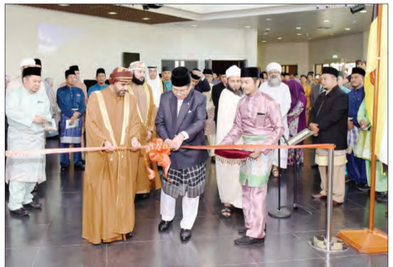
MENTERI Hal Ehwal Ugama, Yang Berhormat Pehin Udana Khatib Dato Paduka Seri Setia Ustaz Haji Awang Badaruddin bin Pengarah Dato Paduka Haji Othman (depan, tengah) semasa merasmikan Pameran Tolerance, Understanding, Coexistence : Oman's Message of Islam di Negara Brunei Darussalam yang berlangsung di Auditorium Pusat Seni (Art Centre) Sekolah Antarabangsa Jerudong.