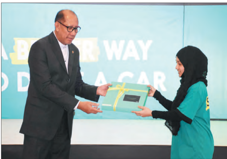
MENTERI Perhubungan, Yang Berhormat Dato Seri Setia Awang Haji Mustappa seterusnya menyampaikan cenderahati kepada salah seorang daripada wakil sepuluh pelanggan pertama.

Turut hadir di majlis perasmian tersebut ialah Pengerusi Lembaga Pelesenan Bermotor, Pegawai-pegawai Kanan Kerajaan, Ketua Pegawai Eksekutif Syarikat Multinational, Duta Asing dan Peniaga Motor.