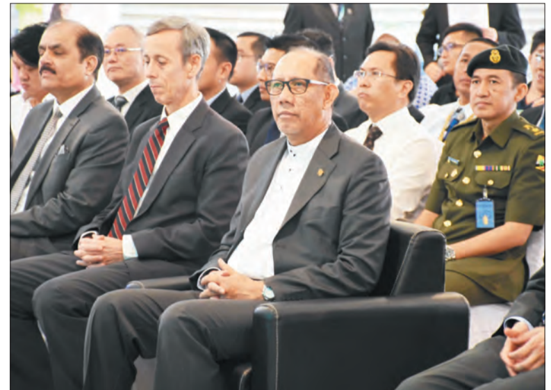
MENTERI Perhubungan, ang Berhormat Dato Seri Setia Awang Haji Mustappa bin Haji Sirat (kanan) hadir selaku tetamu kehormat dan seterusnya merasmikan majlis tersebut.