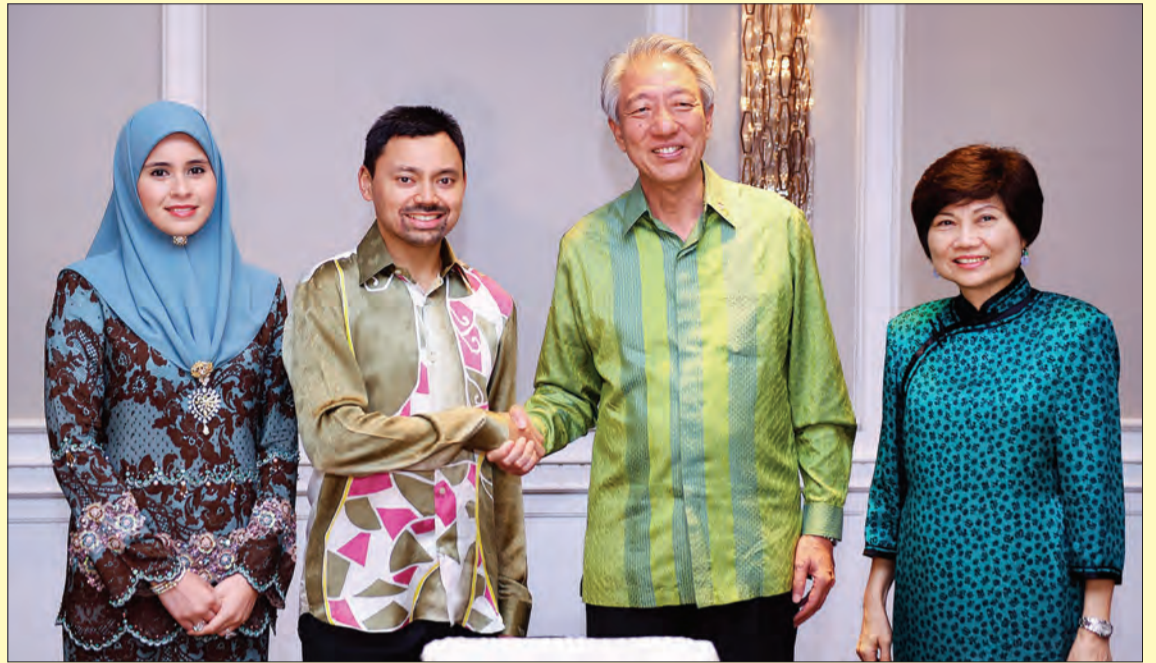
Siaran Akhbar : Jabatan Perdana Menteri Foto : Masri Osman dari Republik Singapura