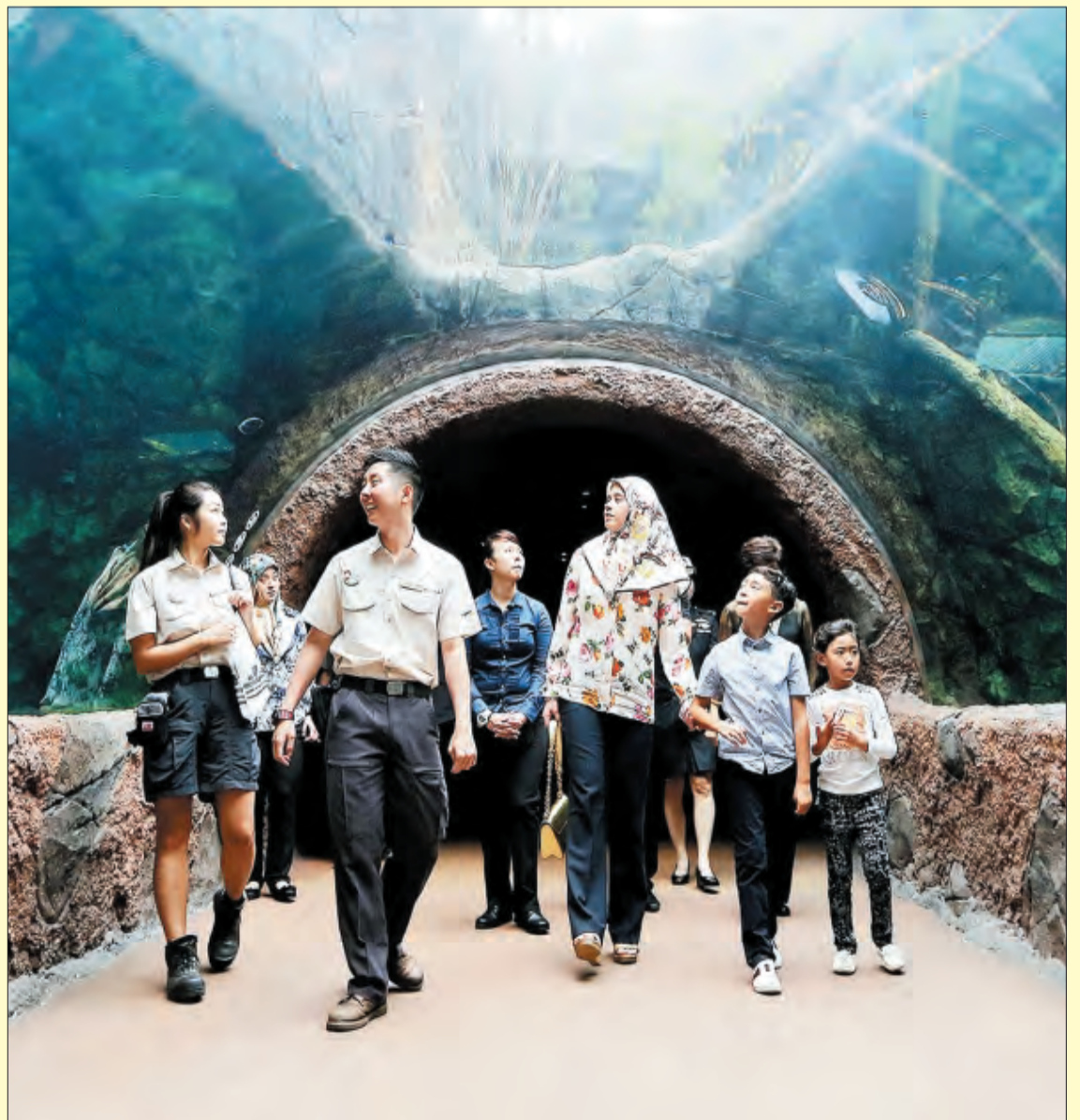
YTM Paduka Seri Pengiran Anak Isteri Pengiran Anak Sarah bersama paduka-paduka anakanda, iaitu Yang Teramat Mulia Pengiran Muda 'Abdul Muntaqim dan Yang Teramat Mulia Pengiran Anak Muneerah Madhul Bolkiah tertarik dengan keindahan taman River Safari (atas dan kiri).