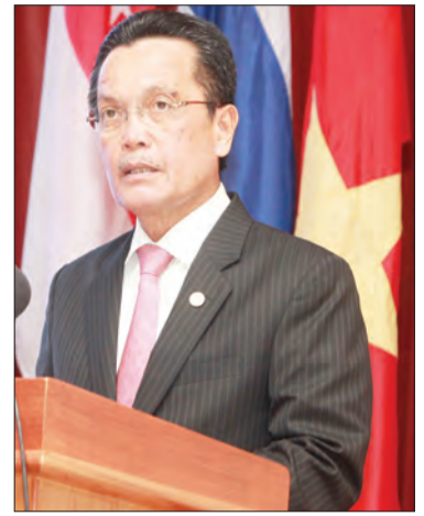
MENTERI Hal Ehwal Dalam Negeri, Yang Berhormat Pehin Orang Kaya Seri Kerna Dato Seri Setia (Dr.) Haji Awang Abu Bakar bin Haji Apong semasa berucap pada majlis tersebut.

akan memberi manfaat kepada ASEAN dan negara-negara anggota dan yang penting ialah ARDEX akan meningkatkan kerjasama serantau dan kerjasama dalam operasi bantuan bencana kecemasan serta memupuk persefahaman masing-masing.