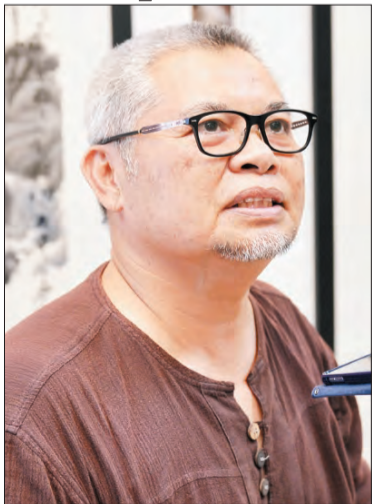
TEMU BUAL bersama artis seni lukis Brunei, Dato Paduka Haji Awang Shofry bin Haji Abdul Ghafor.

BANDAR SERI BEGAWAN , Isnin, 28 November. - Seni boleh menjadi jambatan penghubung bagi mengeratkan lagi hubungan persahabatan dan meningkatkan kefahaman di antara masyarakat yang mempunyai bahasa atau budaya yang berbeza.