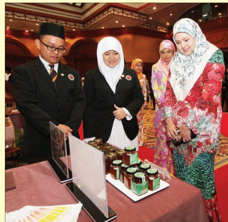
YTM Paduka Seri Pengiran Anak Puteri Hajah Rashidah Sa'adatull Bolkiah dan YTM Paduka Seri Pengiran Anak Puteri Hajah Majeedah Nuurul Bolkiah berkenan menyaksikan projek juara PRYNOSA 18 dari Sekolah Menengah Tanjong Maya, Tutong yang bertajuk 'A Study of Stingless Bees in Meliponiculture Area of Brunei Darussalam and the Physicochemical Composition of their Natural Honey'.