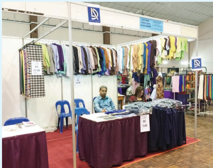
SYARIKAT kedai jahit yang terlibat dalam Projek 'Satu Baju Satu Senyuman'.

Beramal untuk orang ramai bagi membantu meringankan beban mereka yang memerlukan juga adalah satu amalan yang mulia dan berkebaikan. Ke arah ini satu Bazar Amal 'Satu Baju Satu Senyuman' anjuran Battle Pro Event dengan kerjasama Pejabat Daerah Brunei dan Muara (DBM) diadakan bermula dari 4 hingga