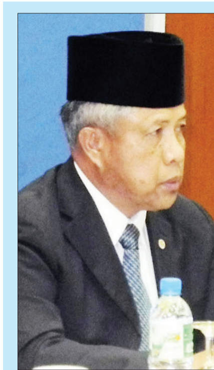
MENTERI Kebudayaan, Belia dan Sukan, Yang Berhormat Pehin Datu Lailaraja Mejar Jeneral (B) Dato Paduka Seri Haji Awang Halbi bin Haji Mohd. Yusoff berucap semasa mesyuarat Jawatankuasa Tertinggi Sambutan Hari Keluarga Kebangsaan 2016 pada hari Isnin, 26 Jamadilakhir 1437 Hijrah bersamaan 4 April 2016 Masihi di Dewan Digadong, Bangunan Kementerian Kebudayaan, Belia dan Sukan.

Di kesempatan ini, peramba / kaola / saya ingin mengucapkan penghargaan dan terima kasih kepada Ahli-Ahli Yang Berhormat yang telah berjaya menggerakkan Sambutan Hari Keluarga di peringkat akar umbi dengan melibatkan institusi perundangan mukim di zon-zon tertentu masing-masing dan kampung, sokongan daripada Jabatan-Jabatan Daerah, Kementerian Hal Ehwal Dalam Negeri dan Kementerian Hal Ehwal Ugama serta semua