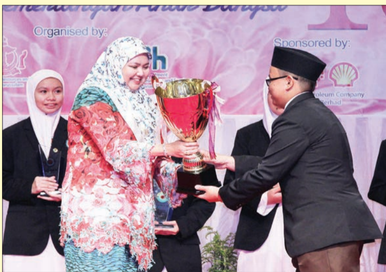
YANG Teramat Mulia Paduka Seri Pengiran Anak Puteri Hajah Rashidah Sa'adatull Bolkiah berkenan mengurniakan hadiah kepada pemenang PRYNOSA 18 bagi Tahun 2016 yang diraih oleh Sekolah Menengah Tanjong Maya, Tutong.