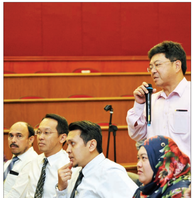
PENGURUS Kanan, pengetua-pengetua dan pegawai-pegawai Universiti Brunei Darussalam (UBD) hadir dan menyertai sesi soal jawab di Sesi Ceramah dan Perkongsian Mengenai WSHO yang berlangsung di Bilik Senat, Dewan Canselor, UBD.

Acara kemuncak ceramah ialah sesi soal jawab dengan Inspektor