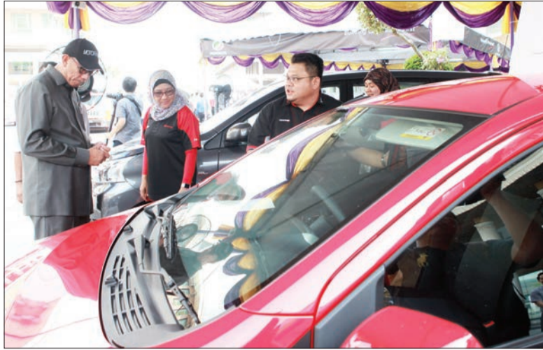
MENTERI Perhubungan, Yang Berhormat Dato Paduka Awang Haji Mustappa bin Haji Sirat (kiri) semasa melawat salah satu petak pameran dari Syarikat NBT Brunei.

BANDAR SERI BEGAWAN, Permotoran BN 2016 (Motoring BN Khamis, 7 April. - Pameran Auto Auto Show 2016) akan menyaksikan