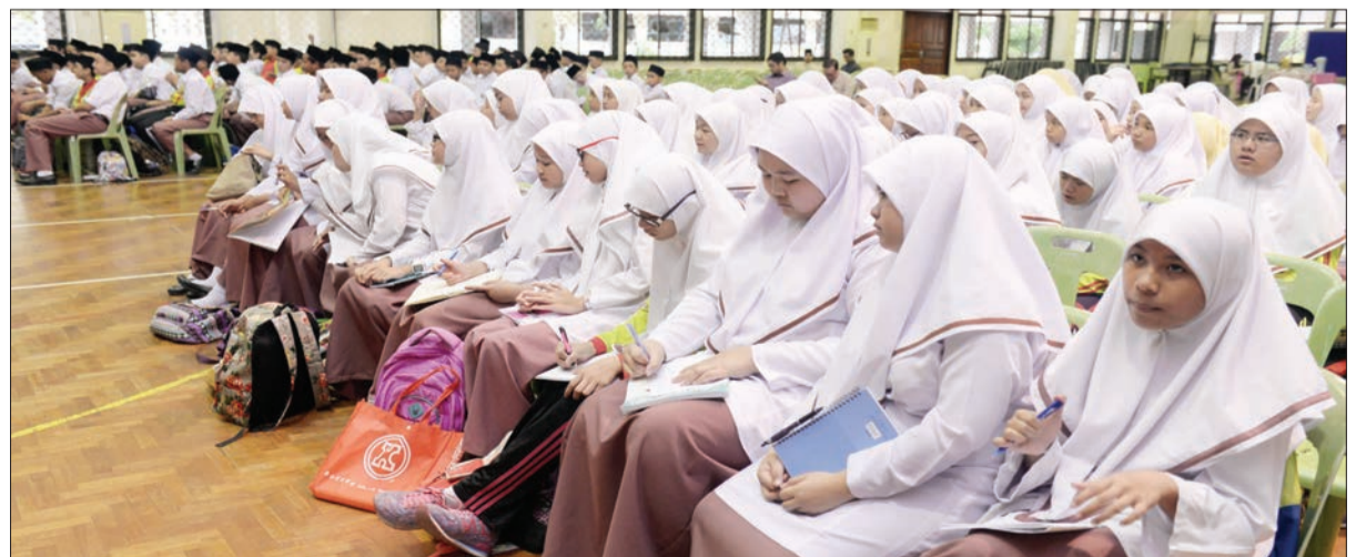
PENUNTUT-PENUNTUT Sekolah Menengah Sayyidina Hassan, Kilanas tekun mendengarkan taklimat kenegaraan kelolaan Jabatan Penerangan sebagai satu acara dalam Program SINAR.

Sesi taklimat diselitkan dengan tayangan video klip mengenai bendera negara dan sesi Kuiz Kenegaraan.