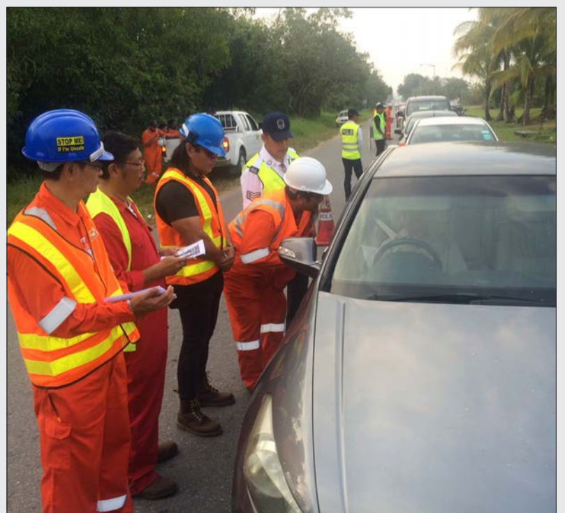
KEMPEN Keselamatan Jalan Raya yang dijalankan di kawasan G22 Jalan Pangsa Seria.

Seramai 10 anggota Balai Polis Seria dan lima anggota polis dari Jabatan Siasatan dan Kawalan Lalu Lintas Batu 3 Belait telah terlibat dalam Kempen Keselamatan Jalan Raya tersebut.