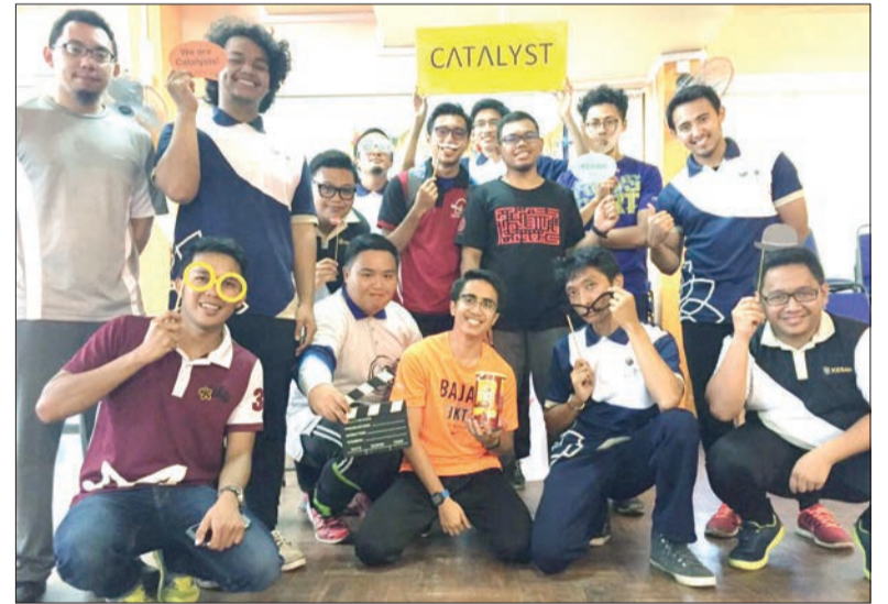
ANTARA pemangkin lelaki bersama Ahli-ahli Jawatankuasa KESAN bergambar kenangan pada Sambutan Hari Pemangkin (Catalyst Day) di Dewan Auditorium, Maktab Sultan Omar 'Ali Saifuddin.

Ditubuhkan pada tahun 2006, KESAN, sebuah pertubuhan bukan kerajaan (NGO), mempunyai seramai 500 sukarelawan. Persatuan tersebut komited untuk menyokong negara mencapai 'Wawasan Brunei 2035' dan menjadikannya sebuah Negara Zikir serta melengkapkan para belia dengan integriti dan kemahiran kepimpinan.