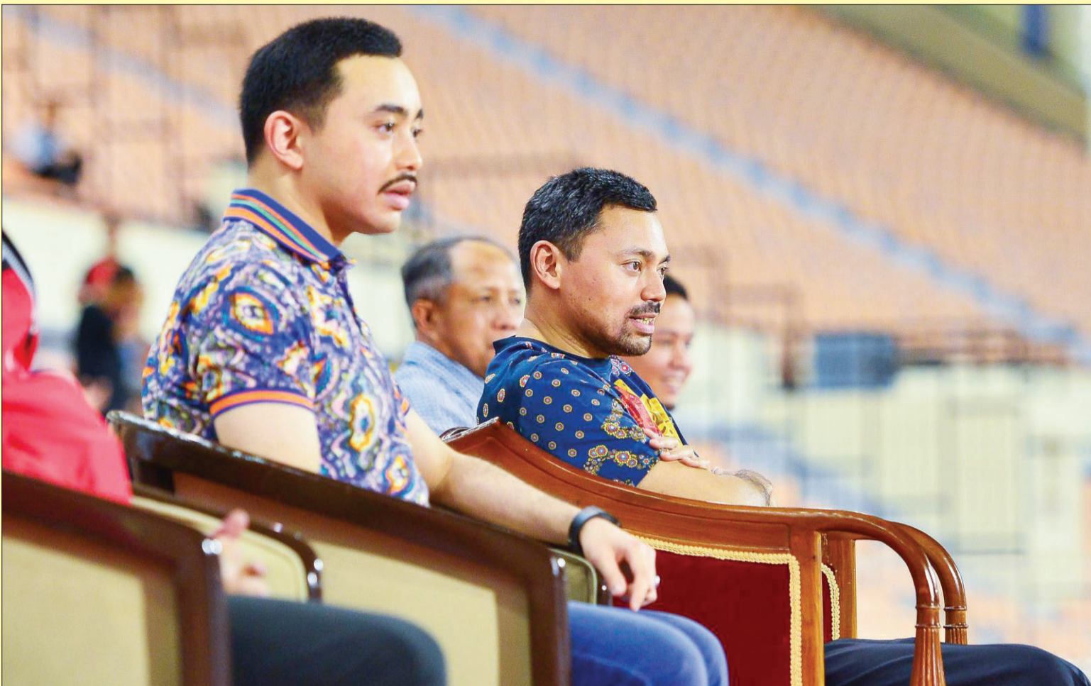
DULI Yang Teramat Mulia Paduka Seri Pengiran Muda Mahkota Pengiran Muda Haji Al-Muhtadee Billah ibni Kebawah Duli Yang Maha Mulia Paduka Seri Baginda Sultan Haji Hassanal Bolkiah Mu'izzaddin Waddaulah, Menteri Kanan di Jabatan Perdana Menteri berkenan berangkat menyaksikan perlawanan Liga Singapura di antara pasukan Brunei DPMM FC dan Garena Young Lions. Juga berangkat ialah Yang Teramat Mulia Paduka Seri Duli Pengiran Muda 'Abdul Malik ibni Kebawah Duli Yang Maha Mulia Paduka Seri Baginda Sultan Haji Hassanal Bolkiah Mu'izzaddin Waddaulah.