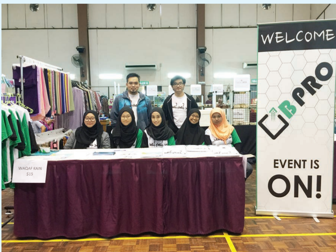
PARA sukarelawan Battle Pro Event.

"Kesemua produk yang dijual adalah hasil tangan saya sendiri. Produk yang paling laris setakat ini ialah perencah masakan yang mempunyai pelbagai perasa seperti bilis dan udang. Tepung cucur menjadi kegemaran ramai juga kerana kelainan rasanya dan harganya yang berpatutan," ujarnya.