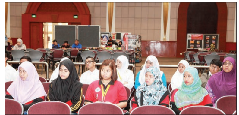
SEBAHAGIAN penuntut yang mengikuti Community Outreach Programe (COP) & Challenge di Dewan Canselor Universiti Brunei Darussalam (UBD).

Program yang julung kali dianjurkan oleh mahasiswa tahun tiga UBD SBE itu dikendalikan dengan kerjasama Pusat Inovasi e-Kerajaan, UBD (e-Government Innovation Centre - eG.InC, UBD) bersama pelajar-pelajar Universiti Teknologi Brunei, Brunei Geek Meet dan Syarikat Amanah Haji Abdullah (SAHA).