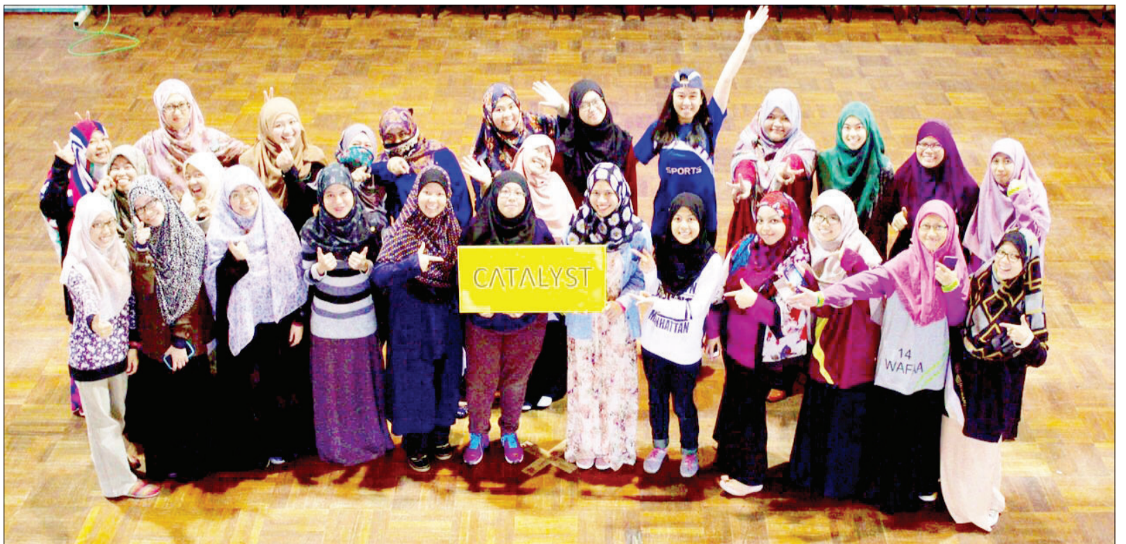
AHLI-AHLI Sukarelawan KESAN bergambar ramai bersama ahli-ahli jawatankuasa persatuan berkenaan (kanan).