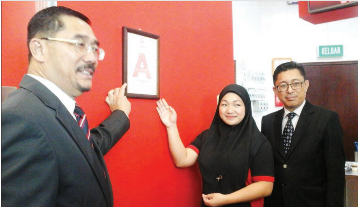
TIMBALAN Setiausaha Tetap Kementerian Hal Ehwal Dalam Negeri (Khedn), Awang Haji Muhammad Sunadi bin Haji Buntar (kiri) menggantung sijil penggredan kepada salah sebuah kedai makan di Kuala Belait.

KUALA BELAIT , Selasa, 5 April. - Panel Pemeriksaan Penilaian 'Grading' Kedai Makan dan Restoran di bawah kawalan Jabatan Bandaran Kuala Belait dan Seria telah dapat melaksanakan penggredan kedai makan dan restoran di bangunan-bangunan komersial termasuk Bangunan Sentral Shopping Centre, Jalan Seri Maharaja yang baharu pada tahun ini.