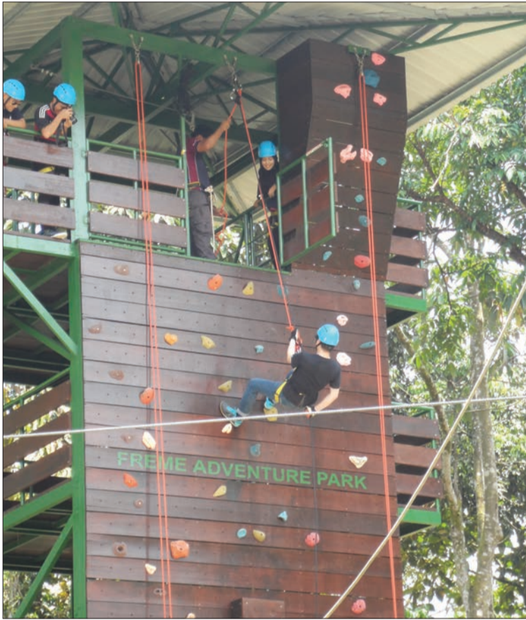
ANTARA aktiviti tahan lasak yang terdapat di Freme Adventure Park iaitu Menara Pendakian Gibbon.

Untuk mengetahui lebih lanjut mengenai, mereka yang berminat bolehlah melayari Facebook 'Freme Travel Services' atau melalui surat khabar tempatan.