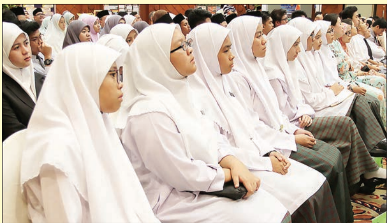
ANTARA pelajar yang hadir pada majlis tersebut (kiri).