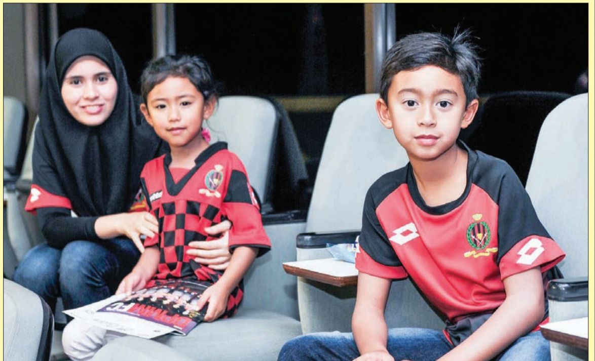
JUGA berangkat, Yang Teramat Mulia Paduka Seri Pengiran Anak Isteri Pengiran Anak Sarah binti Pengiran Haji Salleh Ab. Rahaman, Yang Teramat Mulia Pengiran Muda 'Abdul Muntaqim dan Yang Teramat Mulia Pengiran Anak Muneerah Madhul Bolkiah.

Kemenangan tersebut meletakkan pasukan Brunei DPMM FC tempat keempat dengan mengutip 11 mata, 3 mata di belakang pendahulu liga, Albirex Niigata FC yang mengutip 14 mata setakat ini.