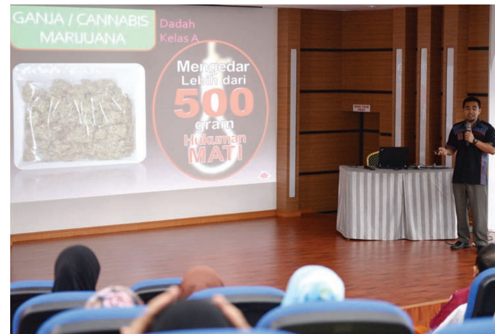
TAKLIMAT mengenai kesedaran bahaya dadah sering dilaksanakan oleh BKN sama ada pada peringkat jabatan kerajaan, swasta mahupun masyarakat kampung.

mencapai gred yang lebih rendah, mempunyai kemerosotan dalam kadar kehadiran sekolah dan terpaksa bekerja lebih jam. Manakala pada peringkat awal dewasa, mereka ini kurang cenderung untuk berkahwin, mempunyai anak-anak dan lebih cenderung untuk mengalami pengangguran.