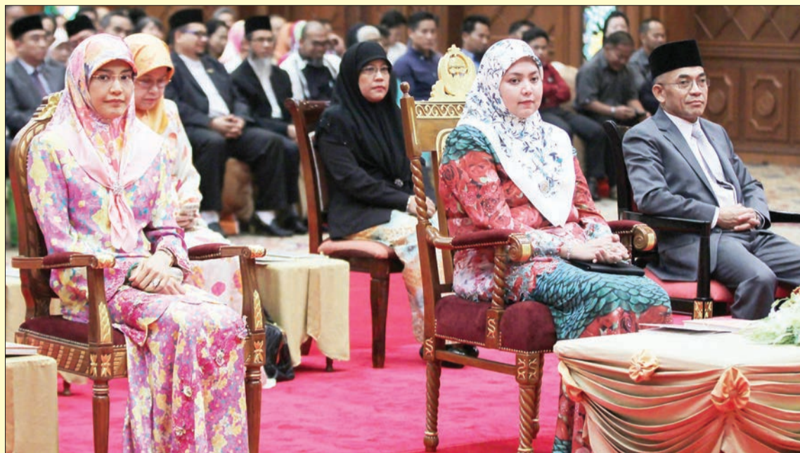
YANG Teramat Mulia Paduka Seri Pengiran Anak Puteri Hajah Rashidah Sa'adatull Bolkiah binti Kebawah Duli Yang Maha Mulia Paduka Seri Baginda Sultan Haji Hassanal Bolkiah Mu'izzaddin Waddaulah berkenan berangkat ke Majlis Penganugerahan Princess Rashidah Young Nature Scientist Award (PRYNOSA) 18 bagi Tahun 2016. Berangkat sama ialah Yang Teramat Mulia Paduka Seri Pengiran Anak Puteri Hajah Majeedah Nuurul Bolkiah binti Kebawah Duli Yang Maha Mulia Paduka Seri Baginda Sultan Haji Hassanal Bolkiah Mu'izzaddin Waddaulah.