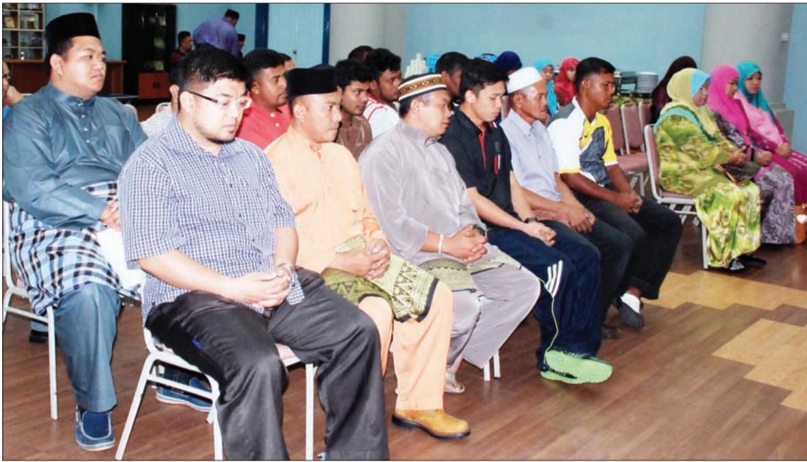
PARA penerima bantuan MUIB yang terlibat dalam kebakaran di Daerah Brunei dan Muara.

Turut hadir di majlis penyerahan tersebut ialah pegawai-pegawai MUIB.