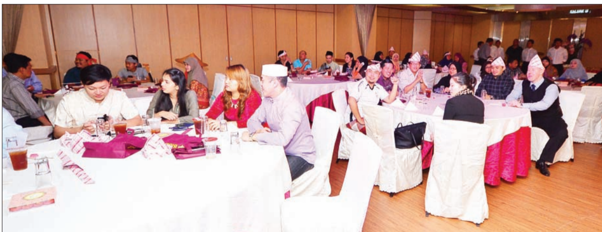
ANTARA perwakilan dari media-media tempatan yang hadir pada Malam Penghargaan Media anjuran Bank Islam Brunei Darussalam (BIBD).

Selain itu kedua-dua pihak juga bertukar cenderahati sebagai menandakan pertukaran lawatan itu dapat meningkatkan hubungan dua hala bagi menegakkan aspirasi seperti yang terkandung dalam Memorandum Persefahaman bagi kerjasama di antara kedua-dua tentera laut.