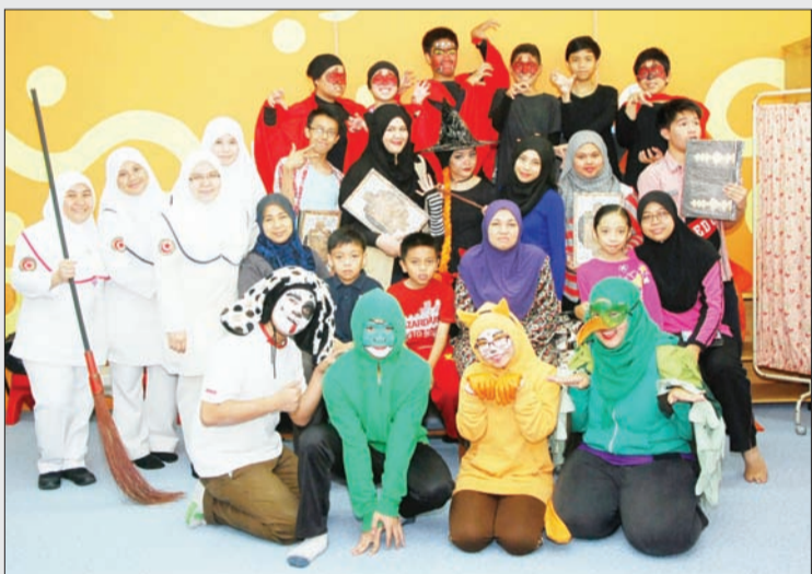
PARA jururawat Wad 2 Bahagian Pesakit Kanak-Kanak Hospital Raja Isteri Pengiran Anak Saleha tidak melepaskan peluang untuk bergambar bersama para pelajar Sekolah Menengah Yayasan Sultan Haji Hassanal Bolkihah selepas mengadakan Persembahan Bacaan Dramatik.

Oleh : Nooratini Haji Abas