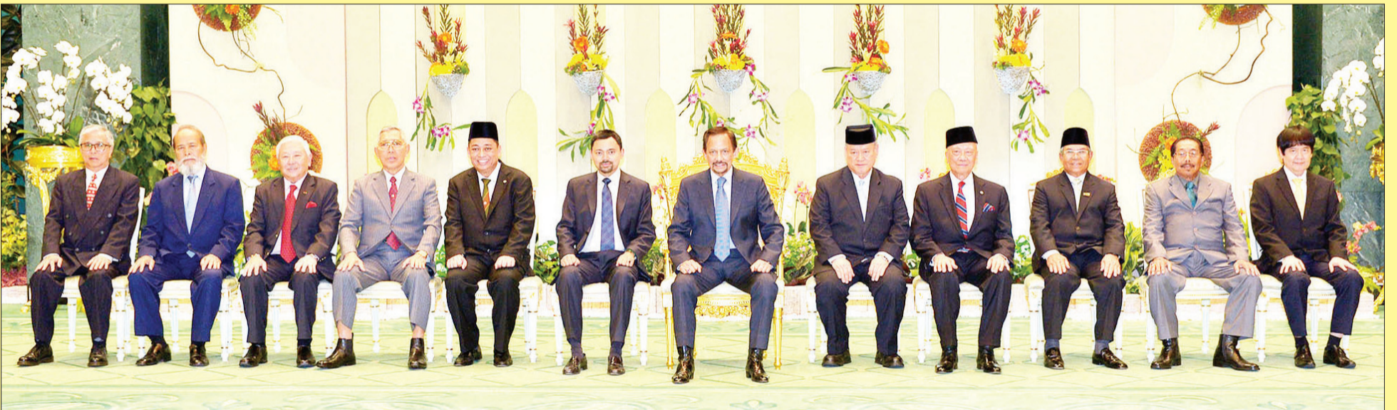
KEBAWAH Duli Yang Maha Mulia Paduka Seri Baginda Sultan Haji Hassanal Bolkiah Mu'izzaddin Waddaulah, Sultan dan Yang Di-Pertuan Negara Brunei Darussalam, Menteri Pertahanan dan Pemerintah Tertinggi ABDB dan Duli Yang Teramat Mulia Paduka Seri Pengiran Muda Mahkota Jeneral Pengiran Muda Haji Al-Muhtadee, Menteri Kanan di JPM dan Jeneral ABDB bergambar ramai bersama Penaung Pengasas Pinnacle Club of ASEAN.