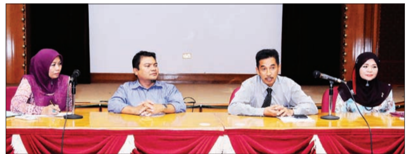
PARA pegawai Jabatan Alam Sekitar Taman dan Rekreasi (JASTRe), Kementerian Pembangunan semasa mengendalikan sidang media mengenai penganjuran aktiviti penjualan secara 'Car Boot Sale' untuk orang ramai di Pantai Serasa.

Oleh : Dk. Vivy Malessa Pg. Ibrahim