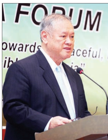
MENTERI Hal Ehwal Luar Negeri dan Perdagangan II (Kedua) ketika berucap pada Perasmian Forum Asia Timur Ke-12.

JERUDONG , Rabu, 26 November. - Forum Asia Timur telah ditubuhkan sejak 12 tahun yang lalu dan Negara Brunei Darussalam buat julung kalinya menjadi tuan rumah bagi forum berkenaan.