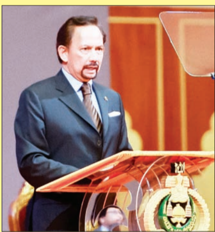
KEBAWAH Duli Yang Maha Mulia Paduka Seri Baginda Sultan Haji Hassanal Bolkiah Mu'izzaddin Waddaulah ibni Al-Marhum Sultan Haji Omar 'Ali Saifuddien Sa'adul Khairi Waddien, Sultan dan Yang Di-Pertuan Negara Brunei Darussalam ketika mengurniakan titah pada Sambutan Hari Perkhidmatan Awam Kali Ke-21.