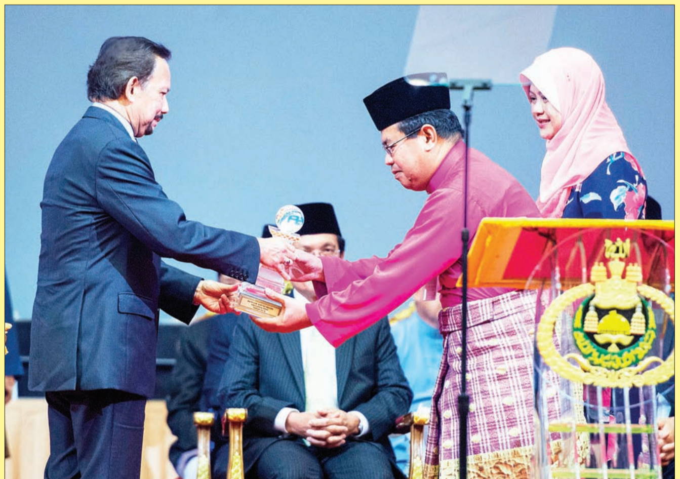
KEBAWAH Duli Yang Maha Mulia Paduka Seri Baginda Sultan Haji Hassanal Bolkiah Mu'izzaddin Waddaulah ibni Al-Marhum Sultan Haji Omar 'Ali Saifuddien Sa'adul Khairi Waddien, Sultan dan Yang Di-Pertuan Negara Brunei Darussalam berkenan mengurniakan Anugerah Emas ACPA 2014 bagi Kategori Kertas Projek bertajuk 'Survey Spatial Data Infrastructure' kepada Kumpulan Geoportal Ukur dari Jabatan Ukur, Kementerian Pembangunan. (Lagi berita dan gambar-gambar dimuatkan ke muka 12 dan 13).