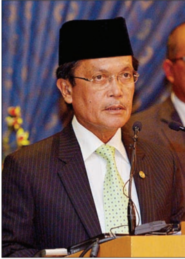
YANG Berhormat Pehin Orang Kaya Seri Kerna Dato Seri Setia (Dr.) Haji Awang Abu Bakar bin Haji Apong ketika berucap pada Majlis Pembukaan Rasmi Persidangan Antarabangsa Pemedulia Pendidikan Awal Kanak-kanak di Royal Berkshire Hall, Jerudong Park and Country Club.