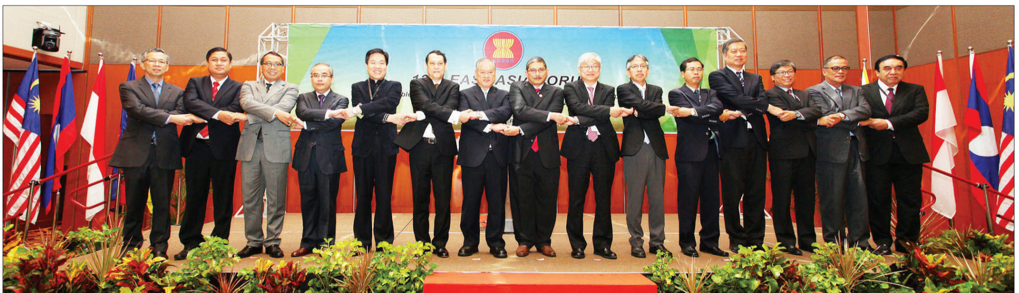
MENTERI Hal Ehwal Luar Negeri dan Perdagangan II (Kedua), Yang Berhormat Pehin Orang Kaya Pekerma Dewa Dato Seri Setia Lim Jock Seng bersama rakan-rakan yang menghadiri Forum Asia Timur semasa sesi bergambar ramai.