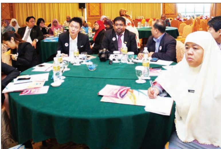
SEBAHAGIAN daripada peserta Program Pembangunan Kepimpinan Ke-6 antara Brunei Darussalam, Malaysia dan Singapura ketika menjalani program.

Oleh : Dk. Siti Redzaimi Pg. Haji Ahmad