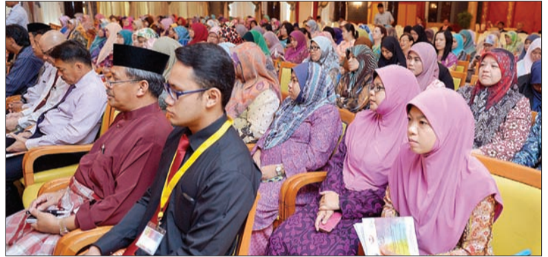
SEBAHAGIAN daripada peserta yang menghadiri Majlis Pembukaan Rasmi Persidangan Antarabangsa Pemedulia Pendidikan Awal Kanak-Kanak.

Persidangan ini merupakan satu platform bagi para pendidik, penyelidik, guru-guru dan ahli profesional yang lain untuk membincangkan serta mengongkakan isu-isu dan cabaran-cabaran yang dihadapi dalam mencapai matlamat-matlamat penting dan matlamat masa depan dalam pemedulia pendidikan awal kanak-kanak.