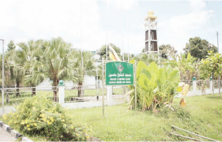
PEMANDANGAN Masjid Kampung Masin.

Bila diajukan sejarah asal usul kampung ini melalui cerita lisan, pada zaman dahulu ditemui sebuah telaga yang terletak di atas bukit di Simpang 616, Jalan Kecil Masin. Air daripada telaga tersebut, rasanya masin. Di situ juga kawasan orang zaman dahulu menanam padi. Jika difikirkan kembali adalah mustahil telaga tersebut berasa masin kerana ia terletak di atas bukit. Oleh sebab