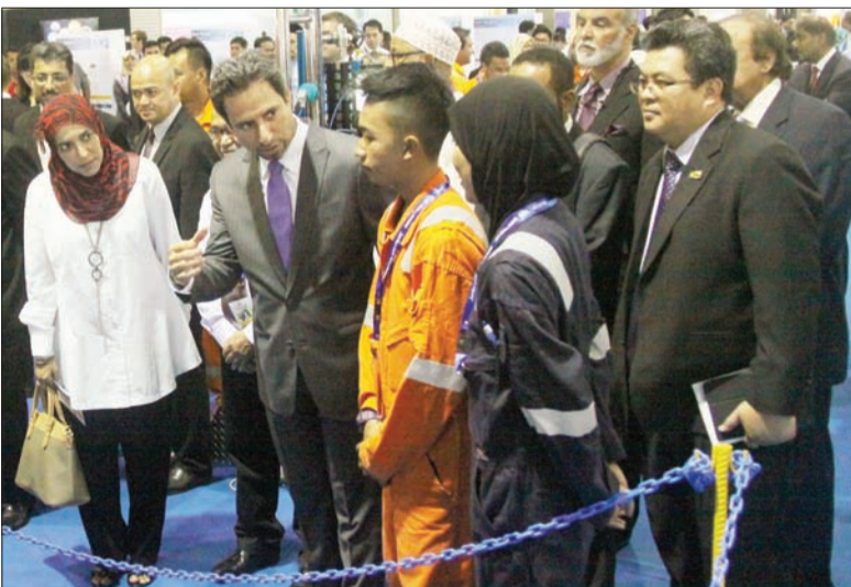
ORANG ramai ketika menerima penerangan dari salah sebuah negara yang menyertai Pesta Kerjaya Sektor Minyak dan Gas dianjurkan oleh Jabatan Tenaga, Jabatan Perdana Menteri (JPM) dengan kerjasama agensi-agensi kerajaan dan syarikat-syarikat utama.

JERUDONG, Rabu, 26 November. - Kira-kira 2,000 pekerjaan ditawarkan pada Pesta Kerjaya Sektor Minyak dan Gas yang dianjurkan oleh Jabatan Tenaga, Jabatan Perdana Menteri (JPM) dengan kerjasama agensi-agensi kerajaan yang berkenaan, syarikat-syarikat utama operasi dan perkhidmatan minyak dan gas serta The Brunei Times.