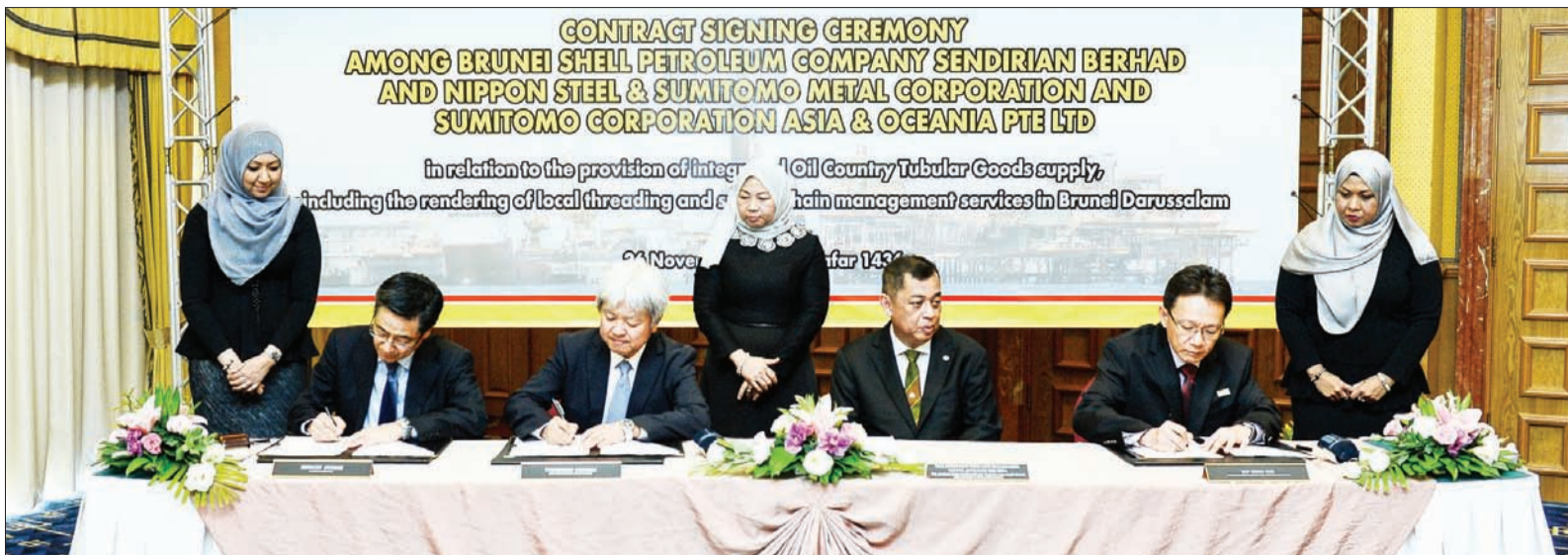
MENTERI Tenaga di Jabatan Perdana Menteri (JPM), Yang Berhormat Pehin Datu Singamanteri Kolonel (B) Dato Seri Setia (Dr.) Awang Haji Mohammad Yasmin bin Haji Umar menyaksikan Majlis Penandatanganan Kontrak Perjanjian di antara Syarikat Brunei Shell Petroleum Sendirian Berhad dan Nippon Steel & Sumitomo Metal Corporation dan Sumitomo Corporation Asia & Oceanic Pte Ltd.