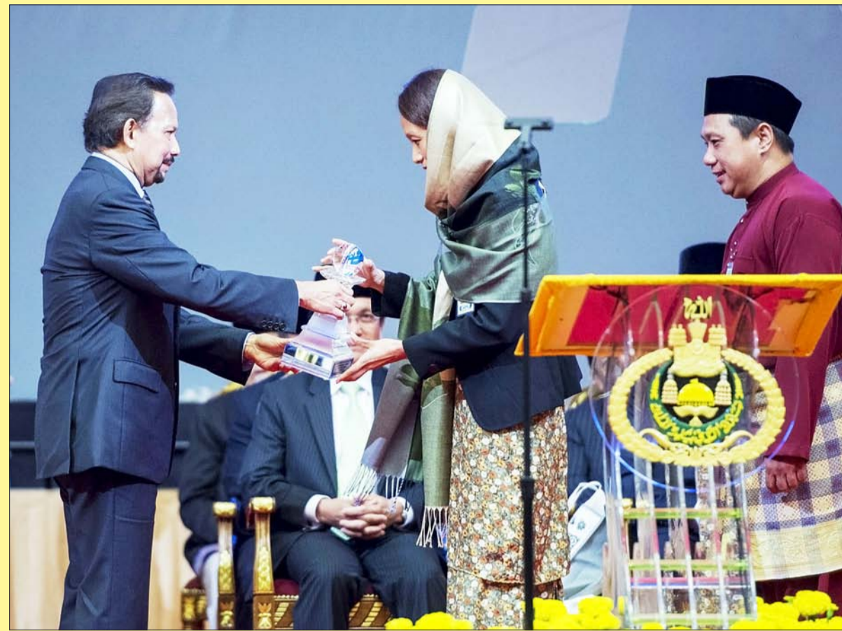
KEBAWAH Duli Yang Maha Mulia Paduka Seri Baginda Sultan Haji Hassanal Bolkhiah Mu'izzaddin Waddaulah ibni Al-Marhum Sultan Haji Omar 'Ali Saifuddien Sa'adul Khairi Waddien, Sultan dan Yang Di-Pertuan Negara Brunei Darussalam berkenan mengurniakan Anugerah Perak kepada Kumpulan Sinar Cahaya dari Jabatan Psikiatri Hospital Raja Isteri Pengiran Anak Saleha, Kementerian Kesihatan (atas), sementara gambar bawah, baginda berkenan mengurniakan Anugerah Gangsa kepada Kumpulan iCuaca dari Jabatan Kajiucua Brunei Darussalam.

BANDAR SERI BEGAWAN, Khamis, 27 Novem. - Kebawah Duli Yang Maha Mulia Paduka Seri Baginda Sultan Haji Hassanal Bolkhiah Mu'izzaddin Waddaulah ibni Al-Marhum Sultan Haji Omar 'Ali Saifuddien Sa'adul Khairi Waddien, Sultan dan Yang Di-Pertuan Negara Brunei Darussalam berkenan mengurniakan Anugerah Perak kepada Kumpulan Sinar Cahaya dari Jabatan Psikiatri Hospital Raja Isteri Pengiran Anak Saleha, Kementerian Kesihatan (atas), sementara gambar bawah, baginda berkenan mengurniakan Anugerah Gangsa kepada Kumpulan iCuaca dari Jabatan Kajiucua Brunei Darussalam.