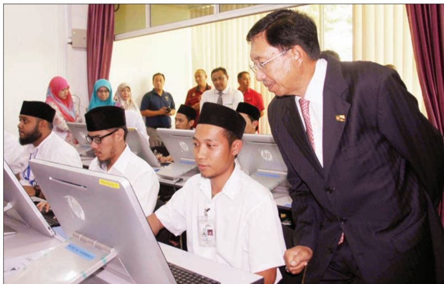
MENTERI Kebudayaan, Belia dan Sukan ketika menyaksikan belia-belia yang mengikuti Kursus Computer Aided Drafting and Design (AutoCAD) di Pusat Pembangunan Belia Cawangan Daerah Belait. (kiri)

Dengan bertapaknya pusat tersebut diharapkan dapat membantu negara dalam melahirkan lebih ramai golongan belia yang berkemahiran dalam pelbagai bidang di negara ini di masa hadapan.