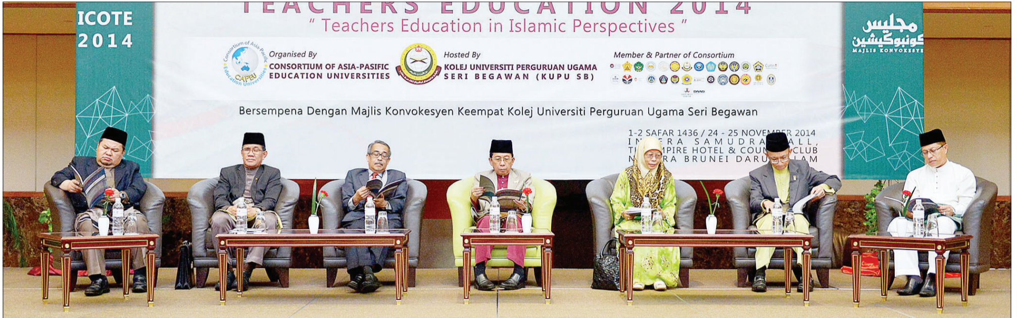
MENTERI Hal Ehwal Ugama, Yang Berhormat Pengiran Dato Seri Setia Dr. Haji Mohammad bin Pengiran Haji Abdul Rahman (tengah) semasa hadir di Persidangan Antarabangsa Pendidikan Guru 2014 (ICOTE 2014) yang berlangsung di The Empire Hotel and Country Club.