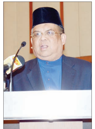
TIMBALAN Menteri Hal Ehwal Ugama, Yang Mulia Pengiran Dato Paduka Haji Bahrom bin Pengiran Haji Bahar ketika berucap pada Majlis Penutupan Rasmi Persidangan Antarabangsa Pendidikan Guru 2014 (ICOTE).

Terdahulu menyentuh tentang persidangan tersebut, beliau berpendapat ianya merupakan pertemuan para peserta dari pelbagai institusi pendidikan yang menjadi ahli CAPEU untuk bertukar-tukar pandangan dan maklumat tentang pendidikan khususnya pendidikan guru yang tentunya banyak bahan dan topik yang telah disentuh dan dibincangkan.