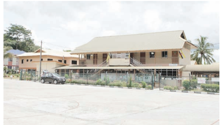
SEBUAH sekolah rendah turut disediakan di kampung ini.

Program-program yang diungkayahkan di kampung ini termasuklah mengadakan jualan gerai bulan Ramadhan, sumbangan derma anak yatim, membersihkan kawasan tanah perkuburan, Makan Doa Arwah Setahun, Majlis Ibadah Korban, sambutan Hari Raya