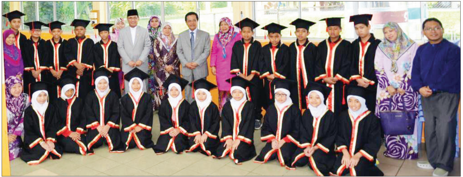
MENTERI Pendidikan, Yang Berhormat Pehin Orang Kaya Seri Kerna Dato Seri Setia (Dr.) Haji Awang Abu Bakar bin Haji Apong bergambar ramai bersama pelajar-pelajar yang menduduki Penilaian Sekolah Rendah (PSR) 2014 di Sekolah Rendah Orang Kaya Besar Imas (OKBI) Subok, Brunei IIB.

Menurut Yang Berhormat, dari 4,643 calon, seramai 948 calon peperiksaan PSR 2014 adalah dari 15 buah sekolah-sekolah pemangkin. Sekolah-sekolah pemangkin ini dipilih berdasarkan prestasi pencapaian lulus PSR yang di bawah 75 peratus selama dua tahun kebelakangan. Dari jumlah