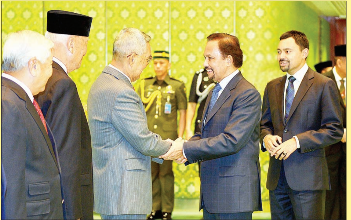
KEBAWAH Duli Yang Maha Mulia Paduka Seri Baginda Sultan Haji Hassanal Bolkiah Mu'izzaddin Waddaulah ibni Al-Marhum Sultan Haji Omar 'Ali Saifuddien Sa'adul Khairi Waddien, Sultan dan Yang Di-Pertuan Negara Brunei Darussalam, Menteri Pertahanan dan Pemerintah Tertinggi Angkatan Bersenjata Diraja Brunei (ABDB) bersalaman dengan Penaung Pengasas Pinnacle Club of ASEAN. Berangkat sama, Duli Yang Teramat Mulia Paduka Seri Pengiran Muda Mahkota Jeneral Pengiran Muda Haji Al-Muhtadee Billah ibni Kebawah Duli Yang Maha Mulia Paduka Seri Baginda Sultan Haji Hassanal Bolkiah Mu'izzaddin Waddaulah, Menteri Kanan di Jabatan Perdana Menteri (JPM) dan Jeneral ABDB.

Majlis tersebut berlangsung di Istana Nurul Iman.