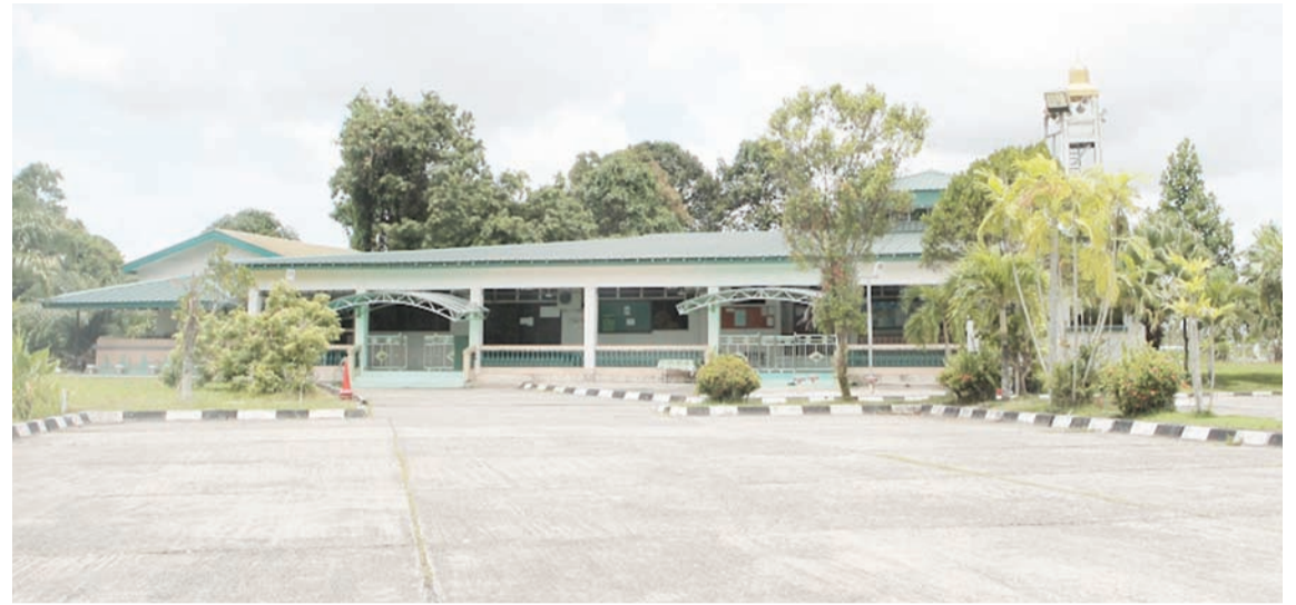
MASJID Kampung Masin untuk kegunaan penduduk kampung.

keunikan inilah, nama kampung ini dikenali sebagai Kampung Masin. Pada masa ini, tapak telaga tersebut telah tertimbus disebabkan pembinaan Sekolah Menengah Masin.