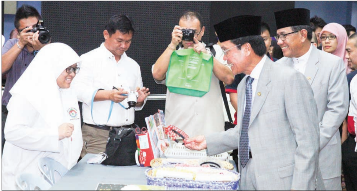
MENTERI Pendidikan, Yang Berhormat Pehin Orang Kaya Seri Kerna Dato Seri Setia (Dr.) Haji Awang Abu Bakar bin Haji Apong meneliti produk yang dijual oleh para pelajar yang menyertai Ekspo Pembangunan Keusahawanan Pelajar (SEDEX) 2014 Kali Ketiga.

BANDAR SERI BEGAWAN , Selasa, 25 November. - Ekspo Pembangunan Keusahawanan Pelajar (SEDEX) 2014 Kali Ketiga diadakan di keempat-empat daerah bermula 25 November hingga 27 November 2014.