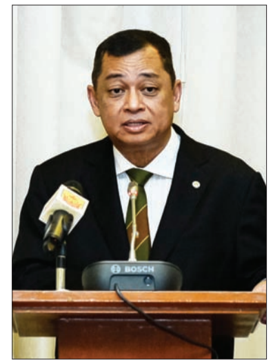
MENTERI Tenaga di JPM, Yang Berhormat Pehin Datu Singamanteri Kolonel (B) Dato Seri Setia (Dr.) Awang Haji Mohammad Yasmin semasa berucap pada majlis tersebut.

Selain itu, tenaga kerja sama ada pihak pengurusan atau kakitangan menurutnya, perlu menanamkan nilai-nilai etika yang tinggi dalam