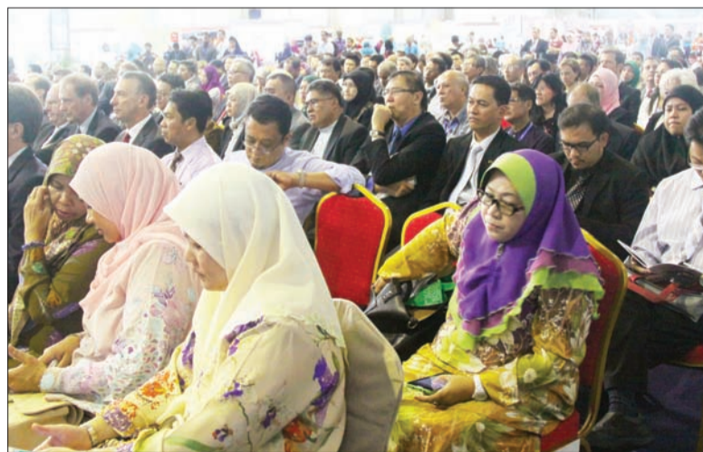
PARA jemputan dari pelbagai peringkat masyarakat menghadiri perasmian Pesta Kerjaya Sektor Minyak dan Gas yang menawarkan 2,000 peluang pekerjaan.

Pesta Kerjaya kali ini, Jabatan Tenaga telah menetapkan sasaran pengambilan seramai 3,000 anak tempatan bagi tahun 2015 dalam Sektor Minyak dan Gas, di mana sasaran ini serupa dengan sasaran 2014, walaupun sukar namun ia boleh dicapai dengan adanya kerjasama rapat dalam sama-sama memastikan kesinambungan kemakmuran Negara Brunei Darussalam.