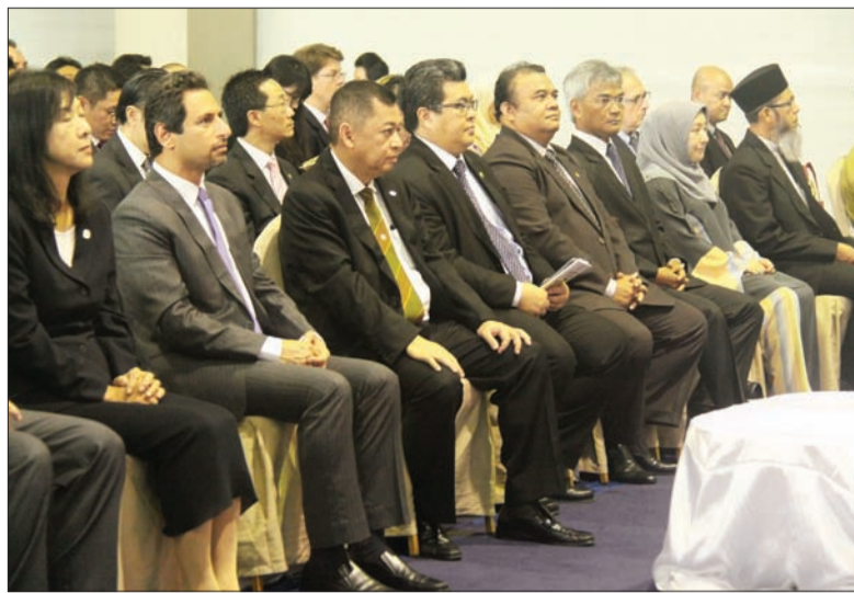
MENTERI Tenaga di Jabatan Perdana Menteri semasa hadir pada Majlis Perasmian Pesta Kerjaya Sektor Minyak dan Gas.

Oleh : Hajah Siti Zuraihah Haji Awang Sulaiman