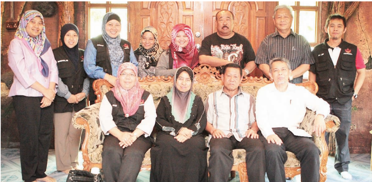
PROGRAM Sua Muka (Personal Contact) Jabatan Penerangan, Jabatan Perdana Menteri bagi meningkatkan hubungan dua hala antara pihak kerajaan dan rakyat selain membarigakan maklumat, program serta perkembangan dan kemajuan mukim dan kampung serta menyampaikan maklumat serta isu-isu semasa dan dasar kerajaan.

Program Sua Muka Jabatan Penerangan, Jabatan Perdana Menteri adalah bagi meningkatkan hubungan dua hala antara pihak kerajaan dan rakyat serta kerajaan selain membarigakan maklumat dan program serta perkembangan dan kemajuan mukim dan kampung melalui akhbar rasmi kerajaan PELITA BRUNEI dan menyampaikan maklumat serta isu-isu semasa dan dasar kerajaan.