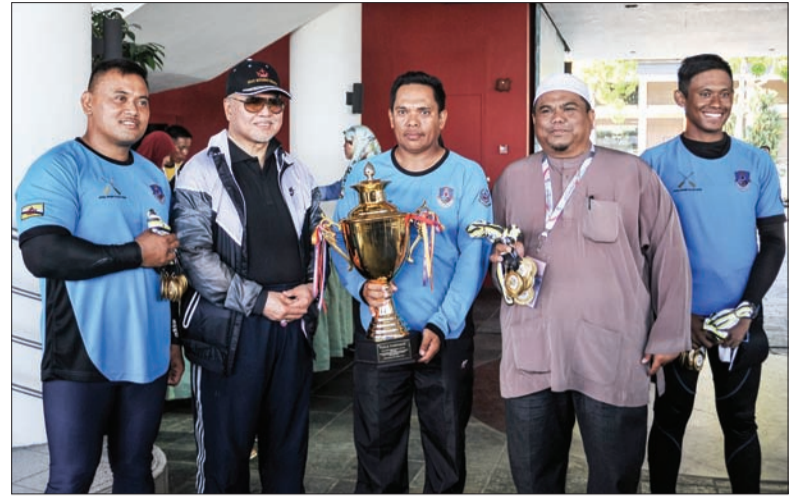
YANG Di-Pertua Adat Istiadat Negara, Yang Amat Mulia Pengiran Lela Cheteria Sahibun Najabah Pengiran Anak Haji Abdul Aziz bin Pengiran Jaya Negara Pengiran Haji Abu Bakar bergambar bersama pemenang pada kategori masing-masing (atas), manakala gambar bawah suasana perlawanan lumba perahu di Sungai Brunei.

Menurut penganjur, tujuan acara ini diadakan adalah bagi mengenang masa