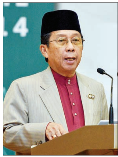
MENTERI Hal Ehwal Ugama, Yang Berhormat Pengiran Dato Seri Setia Dr. Haji Mohammad bin Pengiran Haji Abdul Rahman ketika berucap pada Majlis Perasmian Persidangan Antarabangsa Pendidikan Guru 2014 (ICOTE 2014) di Empire Hotel and Country Club.

Tambah Yang Berhormat lagi, mengakhiri ucapannya dengan teknik-teknik dan metodologi tradisional dan moden perlu bergabung atau digabungkan dalam pendidikan Islam demi untuk mencapai hasil yang maksima dalam pendidikan tersebut.