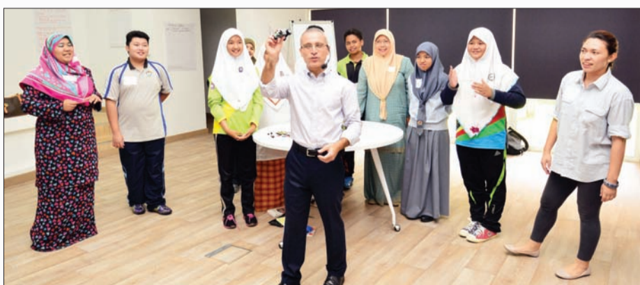
PARA peserta bengkel semasa mengikuti aktiviti yang diadakan pada Bengkel Keusahawanan Bersama Profesor Pengamal Keusahawanan.

Aktiviti-aktiviti yang diadakan diharap akan dapat memberikan mereka perspektif baru dalam pengajaran dan pembelajaran yang akan dapat membantu menarik minat para penuntut terhadap pembelajaran mereka.