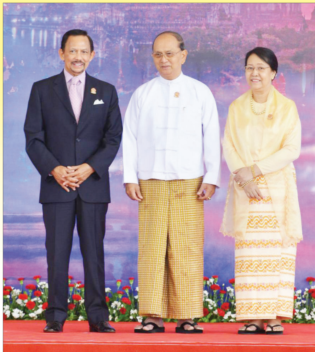
KEBAWAH Duli Yang Maha Mulia Paduka Seri Baginda Sultan Haji Hassanal Bolkiah Mu'izzaddin Waddaulah ibni Al-Marhum Sultan Haji Omar 'Ali Saifuddin Sa'adul Khairi Waddien, Sultan dan Yang Di-Pertuan Negara Brunei Darussalam berkenan bergambar kenangan bersama Presiden Republik Kesatuan Myanmar, Tuan Yang Terutama U Thein Sein dan isteri, Puan Daw Khin Khin Win sejurus tiba di Jade Hall, Pusat Persidangan Antarabangsa Myanmar (Myanmar International Convention Centre - MICC) di Nay Pyi Taw.

Semasa sesi tersebut, pemimpin-pemimpin ASEAN antara lain membincangkan mengenai Deklarasi Nay Pyi Taw 'Menuju Ke Hadapan Dalam Perpaduan Masyarakat Yang Aman dan Makmur' (Moving Forward in Unity to a Peaceful and Prosperous Community), di samping bertukar-tukar pendapat mengenai perkembangan pelaksanaan Komuniti ASEAN menjelang tahun 2015; memperkukuhkan institusi-institusi ASEAN dan juga mengenai hala tuju strategik bagi Komuniti ASEAN selepas 2015.