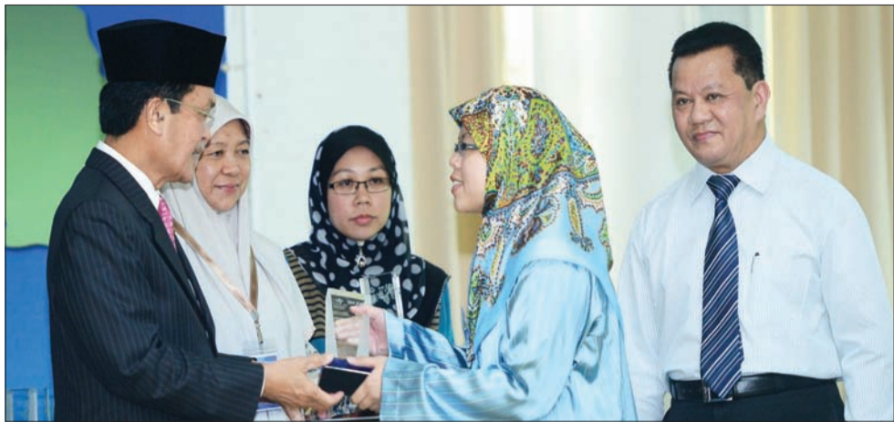
MENTERI Pendidikan, Yang Berhormat Pehin Orang Kaya Seri Kerna Dato Seri Setia (Dr.) Haji Awang Abu Bakar bin Haji Apong semasa menyampaikan anugerah kepada salah seorang pelajar cemerlang bagi Peperiksaan GCE 'O', 'AS' dan 'A' Level Oktober / November 2013.

GADONG, Sabtu, 3 Mei. - Seramai 77 pelajar dari sekolah kerajaan dan sekolah swasta menerima anugerah pada Majlis Anugerah Pencapaian Cemerlang Cambridge bagi Peperiksaan GCE 'O', 'AS' and 'A' Level Oktober / November 2013, bertempat di Dewan Sejahtera, Sumbangsih Bahagia Hall, di sini.