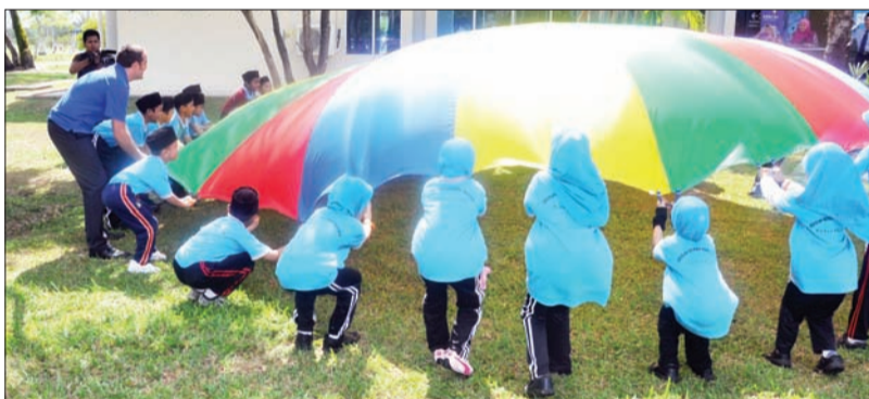
PELAJAR dari Sekolah Rendah Ahmad Tajuddin, Kuala Belait telah mencuba uji kaji sains yang dimudah cara dari Scitech Australia dari Australia.