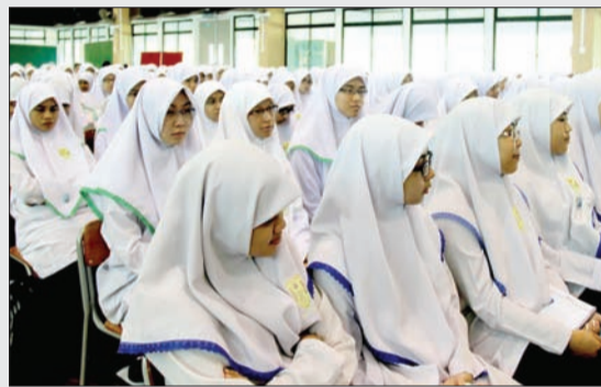
Pelajar-pelajar Tingkatan Enam Bawah dan Enam Atas (Pra Universiti) Sekolah Menengah Saiyyidina Ali (SMSA) telah menghadiri taklimat tersebut.