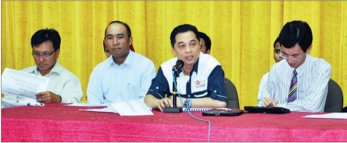
SESI Dialog Jabatan Perkhidmatan Awam (JPA) Dengan Penjawat Awam yang berkhidmat di cawangan-cawangan agensi kerajaan di Daerah Temburong.

Berita dan Foto : Hezlinawati Haji Abdul Karim