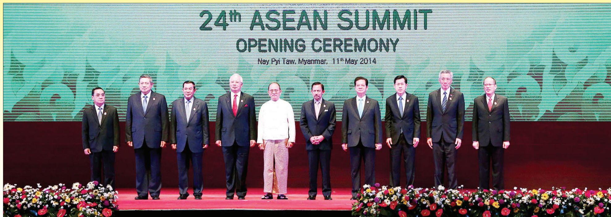
KEBAWAH Duli Yang Maha Mulia Paduka Seri Baginda Sultan Haji Hassanal Bolkiah Mu'izzaddin Waddaulah ibni Al-Marhum Sultan Haji Omar 'Ali Saifuddin Sa'adul Khairi Waddien, Sultan dan Yang Di-Pertuan Negara Brunei Darussalam bergambar ramai bersama para pemimpin ASEAN yang lain pada Majlis Pembukaan Rasmi Sidang Kemuncak ASEAN Ke-24 yang berlangsung di Jade Hall, MICC di Nay Pyi Taw.