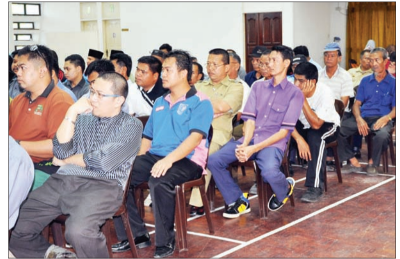
ANTARA warga Perkhidmatan Awam di Daerah Temburong yang hadir semasa Sesi Dialog Jabatan Perkhidmatan Awam (JPA) Dengan Penjawat Awam di Dewan Belalong, Kompleks Dewan Kemasyarakatan Pekan Bangar.

Melalui sesi seumpama ini diharap akan dapat memberi khidmat nasihat atau 'way forward' ke atas isu dan cabaran yang dihadapi.