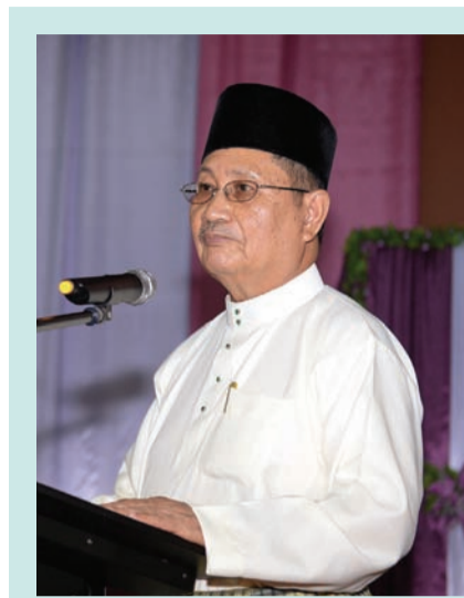
MENTERI Hal Ehwal Dalam Negeri, Yang Berhormat Pehin Udana Khatib Dato Paduka Seri Setia Ustaz Haji Awang Badaruddin bin Pengarah Dato Paduka Haji Othman semasa berucap pada Majlis Doa Kesyukuran Kejayaan MPK Kampung Kapok Menerima Anugerah Perak Di Pertandingan Anugerah Kampung Cemerlang 2014, pada hari Jumaat, 25 Jamadilakhir 1435H bersamaan 25 April 2014M, bertempat di Dewan Sekolah Rendah Kapok, Mukim Serasa.

Keselamatan awam jenis ini pendedat-pendedat haram, antaranya ialah kesalahan melindungi atau pendedat-pendedat yang sudah limpas tempoh kebenaran tinggal;