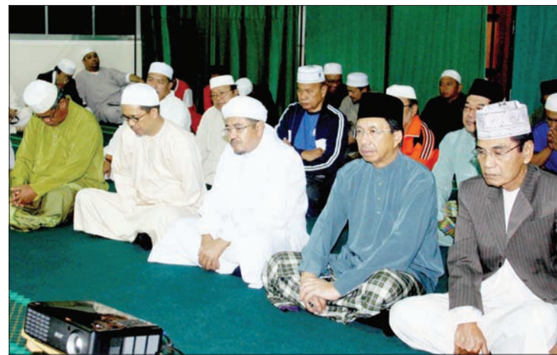
MENTERI Kebudayaan, Belia dan Sukan, Yang Berhormat Pehin Orang Kaya Pekerma Laila Diraja Dato Seri Setia Awang Haji Hazair bin Haji Abdullah ketika menghadiri Kuliah Subuh sempena Sambutan Hari Keluarga Kebangsaan 2014.

"Perancangan keluarga dapat meningkatkan keupayaan ekonomi kedua suami isteri agar perbelanjaan keluarga terancang. Masa yang berkualiti untuk anak-anak juga dapat dirancang dengan bijaksana apabila keluarga terancang manakala sokongan komuniti iaitu kelengkapan pendidikan, kesihatan, perumahan dan