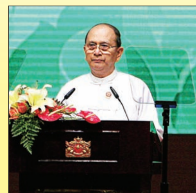
PRESIDEN Republik Kesatuan Myanmar, Tuan Yang Terutama U Thein Sein menyempurnakan Pembukaan Rasmi Sidang Kemuncak ASEAN Ke-24.

Sebelum mengakhiri ucapannya, TYT mengusulkan agar melakukan tindakan yang perlu untuk mengurangkan kesan perubahan iklim di mana perubahan iklim itu merupakan masalah dunia yang secara langsung juga merupakan masalah ASEAN.