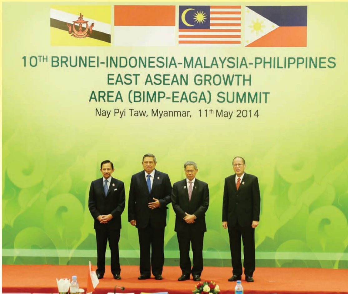
KEBAWAH Duli Yang Maha Mulia berkenan bergambar ramai bersama para pemimpin BIMP-EAGA iaitu Presiden Republik Indonesia, Tuan Yang Terutama Dr. Haji Susilo Bambang Yudhoyono; Presiden Republik Filipina, Tuan Yang Terutama Benigno S. Aquino III dan wakil pemimpin Malaysia, Menteri Perdagangan Antarabangsa dan Industri Malaysia, Yang Berhormat Dato' Seri Mustapa Mohamed.