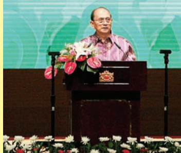
PRESIDEN Republik Kesatuan Myanmar, Tuan Yang Terutama U Thein Sein ketika berucap meraikan para pemimpin ASEAN.