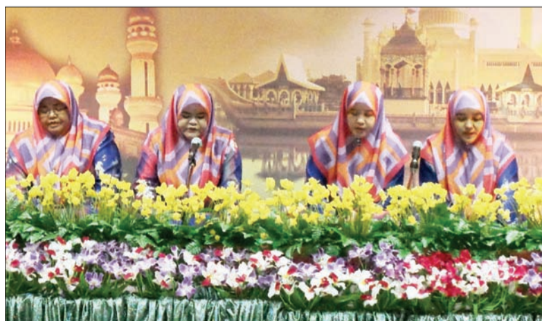
KUMPULAN Tausyeh perempuan dari Pasukan Temburong yang menyertai Pertandingan Akhir Tausyeh bagi Dewasa dan Belia Masjid Senegara 1435 Hijriah/2014 Masihi.

BANDAR SERI BEGAWAN , Sabtu, 26 April. - Sebanyak 32 buah kumpulan Tausyeh menyertai Pertandingan Akhir Tausyeh bagi Dewasa dan Belia Masjid Senegara