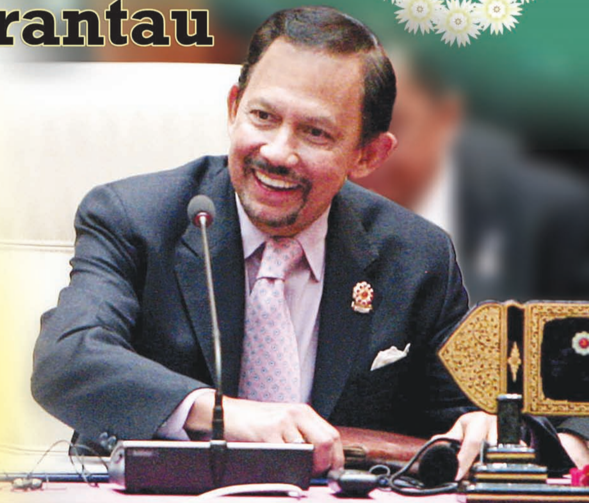
KEBAWAH Duli Yang Maha Mulia Paduka Seri Baginda Sultan Haji Hassanal Bolkiah Mu'izzaddin Waddaulah ibni Al-Marhum Sultan Haji Omar 'Ali Saifuddin Sa'adul Khairi Waddien, Sultan dan Yang Di-Pertuan Negara Brunei Darussalam berkenan berangkat di Sesi Plenari Sidang Kemuncak ASEAN Ke-24 yang berlangsung di Ruby Hall, MICC, di Nay Pyi Taw. (Lagi berita dan gambar-gambar dimuatkan ke muka 3, 4, 5, 12, 13 dan 24).