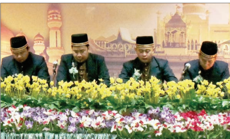
KUMPULAN Tausyeh lelaki dari Pasukan Belait yang menyertai Pertandingan Akhir Tausyeh bagi Dewasa dan Belia Masjid Senegara 1435 Hijriah/2014 Masihi.

Dari jumlah tersebut, sebanyak 16 buah kumpulan tausyeh lelaki dan perempuan bertanding bagi Kategori Dewasa iaitu Ahli Jawatankuasa