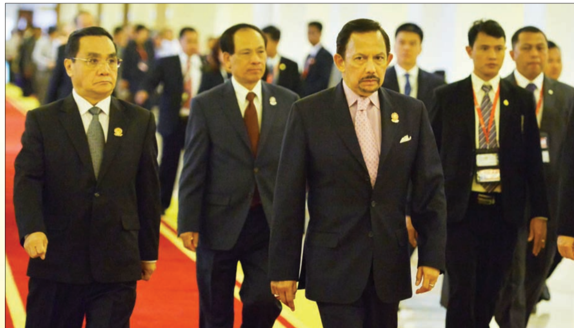
KEBAWAH Duli Yang Maha Mulia Paduka Seri Baginda Sultan Haji Hassanal Bolkiah Mu'izzaddin Waddaulah, Sultan dan Yang Di-Pertuan Negara Brunei Darussalam berkenan berangkat menyertai pemimpin-pemimpin ASEAN lain dalam Sesi Retreat (atas), sementara gambar bawah kiri, baginda berangkat ke Sesi Plenari, manakala gambar bawah kanan, suasana Sesi Plenari Sidang Kemuncak ASEAN Ke-24 yang dipengerusikan oleh Presiden Republik Kesatuan Myanmar, Tuan Yang Terutama U Thein Sein.