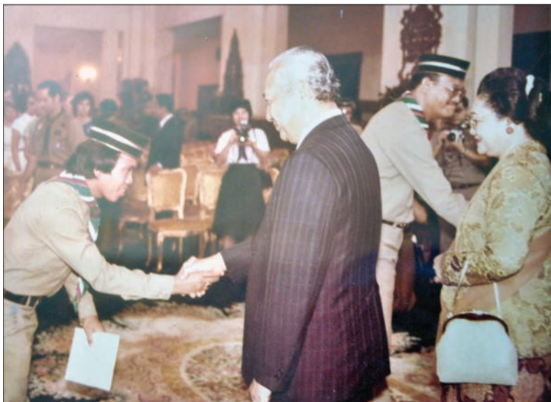
KENANGAN manis ketika menyertai Persekutuan Pengakap Negara Brunei Darussalam ialah berpeluang untuk bersemuka dengan tokoh dunia, Presiden Republik Indonesia, Presiden Soeharto.