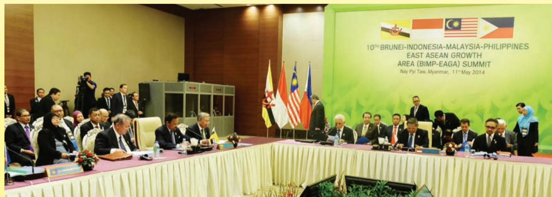
SUASANA Sidang Kemuncak BIMP-EAGA yang dipengerusikan oleh Presiden Republik Indonesia, Tuan Yang Terutama Dr. Haji Susilo Bambang Yudhoyono.