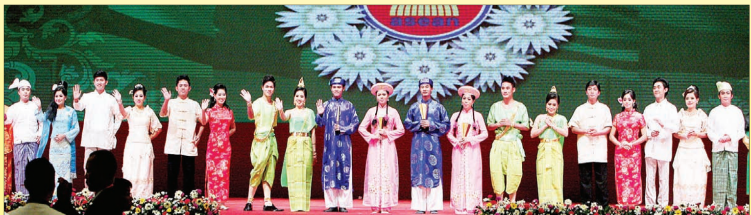
MAJLIS Santap Malam bagi meraikan para pemimpin ASEAN diserikan dengan pelbagai persembahan kebudayaan daripada masyarakat Myanmar.