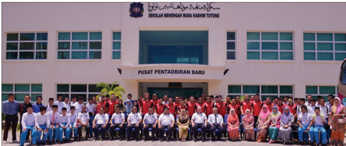
PASUKAN Bolasepak DPMM FC mengabadikan gambar ramai setelah membuat lawatan ke SMMH, Tutong.