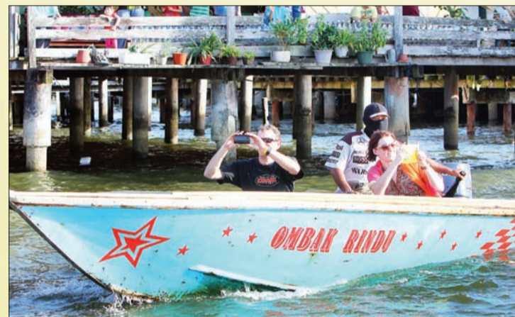
PELANCONG tidak melepaskan peluang merakamkan suasana regata.

KEJOHANAN yang bakal memeriahkan lagi suasana Bandar Seri Begawan setentunya adalah peluang untuk mengenalkan Negara Brunei Darussalam ke mata dunia yang seterusnya akan memajukan lagi industri pelancongan di Negara Brunei Darussalam dengan berkonsepkan 'Kenali Negara Kitani' (KNK).