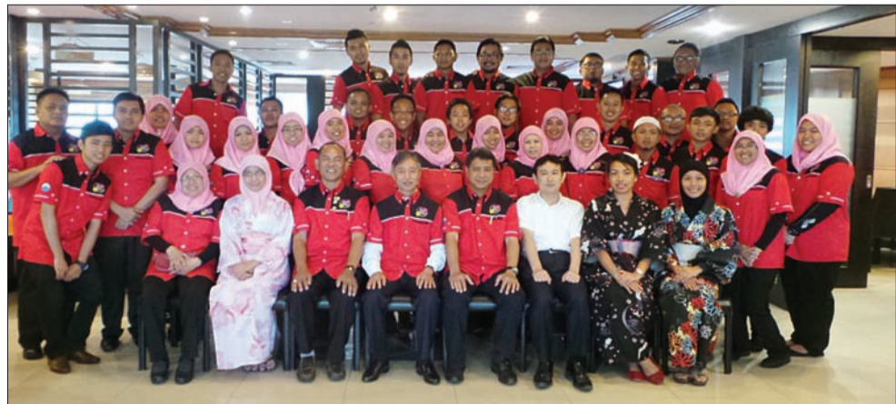
KONTINJEN Persahabatan Brunei-Jepun bergambar ramai sebagai tanda kenang-kenangan atas persahabatan yang telah lama terjalin.

Duit-duit syiling kenang-kenangan tersebut dijual kepada orang ramai bermula hari ini di Jabatan Operasi Monetari, AMBD, Bangunan BCMB, Commonwealth Drive, Bandar Seri Begawan BB3910, Negara Brunei Darussalam.