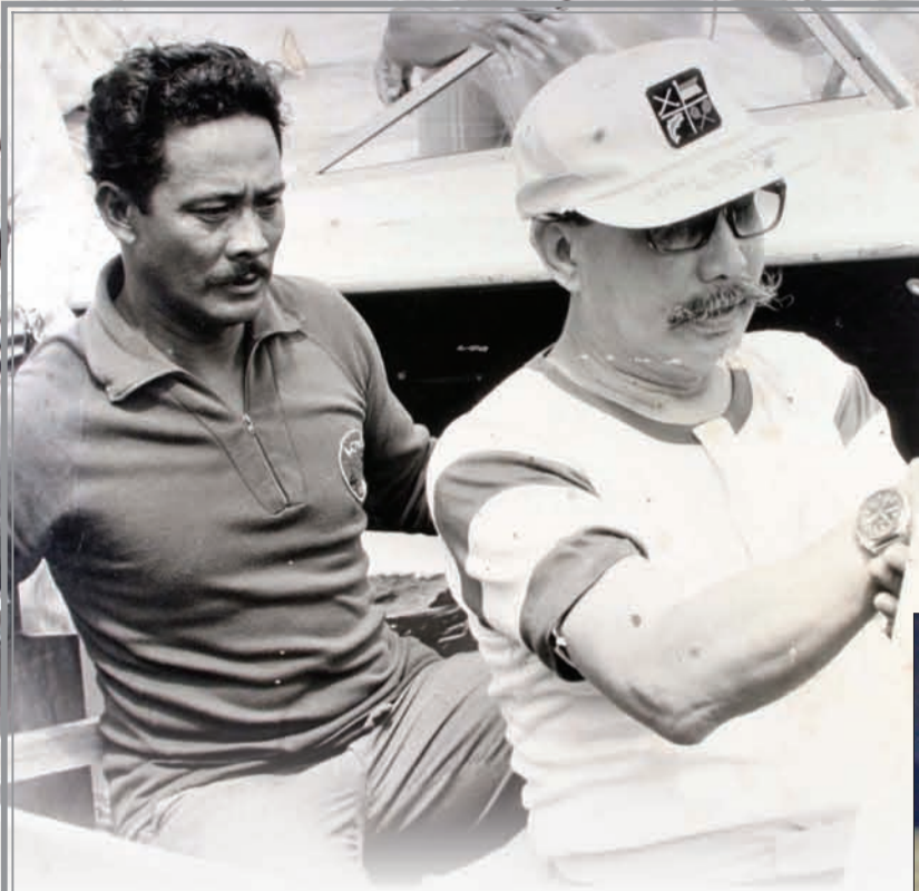
DALAM KENANGAN ... Al-Marhum Sultan Haji Omar 'Ali Saifuddin Sa'adul Khairi Waddien adalah seorang penggemar dalam pesta lumba perahu.