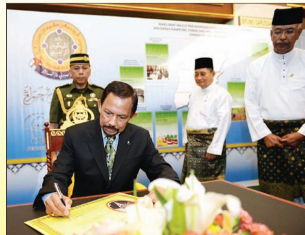
KEBAWAH DYMM ketika berkenan menandatangani Lembaran Kenangan keberangkatan pada Pameran Khas AKC Ke-3.

menyadari bahawa penyertaan sebanyak 104 buah MPK itu baru merupakan 60.8 peratus daripada jumlah bilangan Majlis-Majlis Perundingan Kampung (MMPK) seluruh negeri sebanyak 171 majlis.