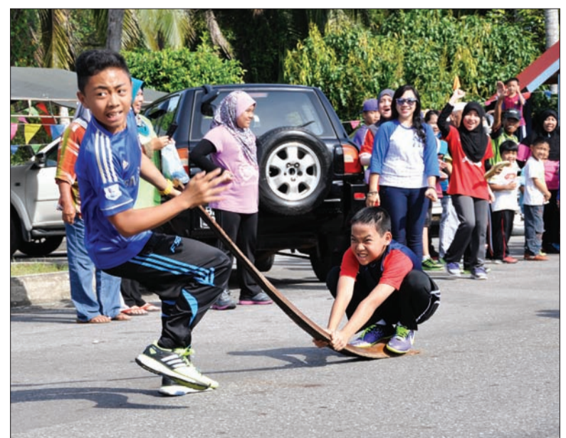
ANTARA aktiviti sukan yang disertai oleh penduduk kampung.

Selain untuk memeriahkan Sambutan Ulang Tahun Hari Kebangsaan Ke-30 Tahun Hari Keluarga itu juga memberi ruang untuk menengahkan kegiatan-kegiatan masyarakat kampung sejak dahulu kala bagi pengetahuan sekali gus dialami oleh generasi muda kampung tersebut.