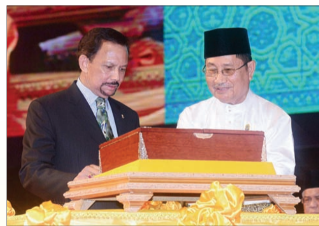
KEBAWAH Duli Yang Maha Mulia ketika berkenan menerima pesambah yang disembahkan oleh Yang Berhormat Menteri Hal Ehwal Dalam Negeri.

Yang Berhormat menambah, bagaimanapun Kementerian Hal Ehwal Dalam Negeri (KHEDN),