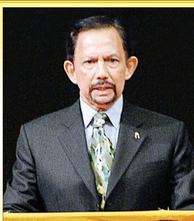
TITAH Kebawah Duli Yang Maha Mulia Paduka Seri Baginda Sultan Haji Hassanah Bolkiah Mu'izzaddin Waddaulah ibni Al-Marhum Sultan Haji Omar 'Ali Saifuddin Sa'adul Khairi Waddien, Sultan dan Yang Di-Pertuan Negara Brunei Darussalam sempena Majlis Anugerah Kampung Cemerlang (AKC) Peringkat Kebangsaan Kali Ke-3.

Di samping pihak keselamatan mesti bersungguh-sungguh menanganinya, di pihak orang ramai juga tidak boleh mengambil