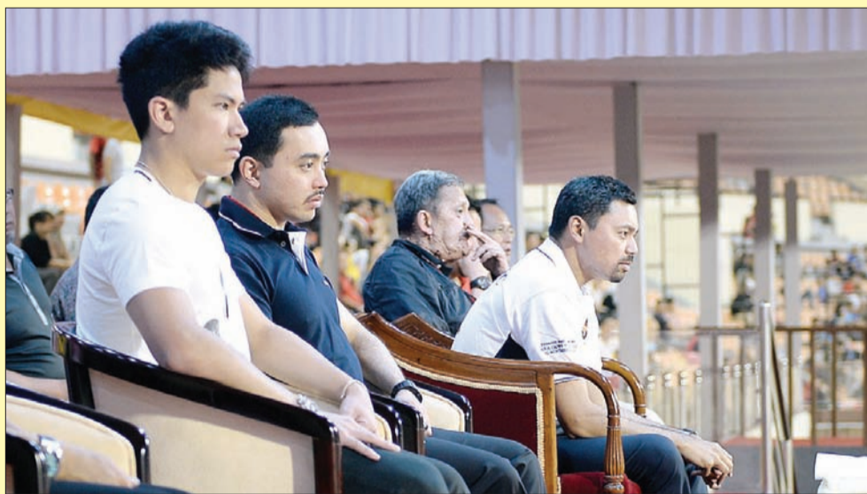
BERANGKAT menyaksikan perlawanan tersebut ialah Duli Yang Teramat Mulia Paduka Seri Pengiran Muda Mahkota Pengiran Muda Haji Al-Muhtadee Billah ibni Kebawah Duli Yang Maha Mulia Paduka Seri Baginda Sultan Haji Hassanal Bolkiah Mu'izzaddin Waddaulah, Menteri Kanan di Jabatan Perdana Menteri. Juga berangkat menyaksikan ialah Duli Yang Teramat Mulia Paduka Seri Pengiran Bendahara Seri Maharaja Permaisura Pengiran Muda Haji Sufri Bolkiah, Yang Teramat Mulia Paduka Seri Duli Pengiran Muda 'Abdul Mateen berserta kerabat diraja yang lain.

Juga berangkat menyaksikan ialah Duli Yang Teramat Mulia Paduka Seri Pengiran Bendahara Seri Maharaja Permaisura Pengiran Muda Haji Sufri Bolkiah, Yang Teramat Mulia Paduka Seri Duli