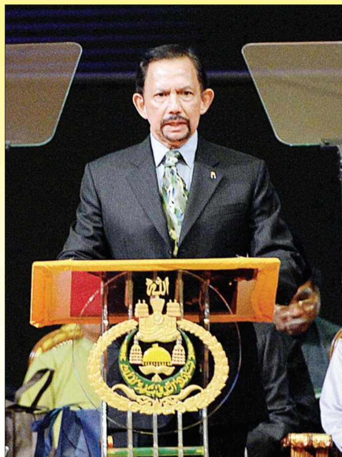
KEBAWAH Duli Yang Maha Mulia Paduka Seri Baginda Sultan Haji Hassanalkhalid Mu'izzaddin Waddaulah ibni Al-Marhum Sultan Haji Omar 'Ali Saifuddin Sa'adul Khairi Waddien, Sultan dan Yang Di-Pertuan Negara Brunei Darussalam ketika berkenan mengurniakan titah pada Majlis Anugerah Kampung Cemerlang (AKC) Peringkat Kebangsaan Ke-3.

Meskipun terdapat Majlis-Majlis Perundingan Kampung (MMPK) yang telah menunjukkan pencapaian yang meningkat daripada AKC Peringkat Kebangsaan Ke-2, tetapi usaha-usaha yang lebih keras masih