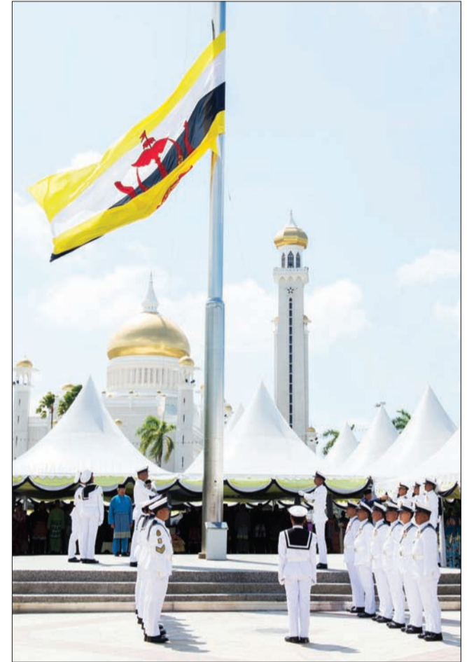
ANGGOTA Tentera Laut Diraja Brunei (TLDB) semasa menurunkan bendera besar Negara Brunei Darussalam.

Mesyuarat Negara, Timbalan Setiausaha Tetap, ketua-ketua jabatan, para pegawai kanan dan jemputan khas.