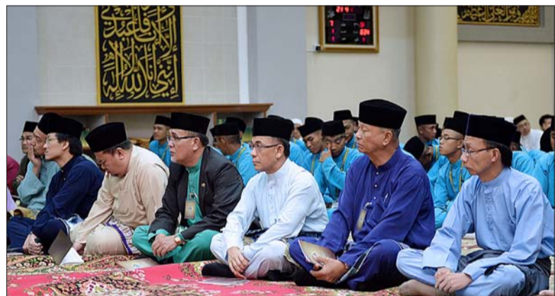
TIMBALAN Menteri di Jabatan Perdana Menteri (JPM), Yang Mulia Dato Paduka Awang Haji Ali bin Haji Apong hadir pada Majlis Pertandingan Membaca Al-Qur'an Bahagian Dewasa Peringkat Suku Akhir Kebangsaan.