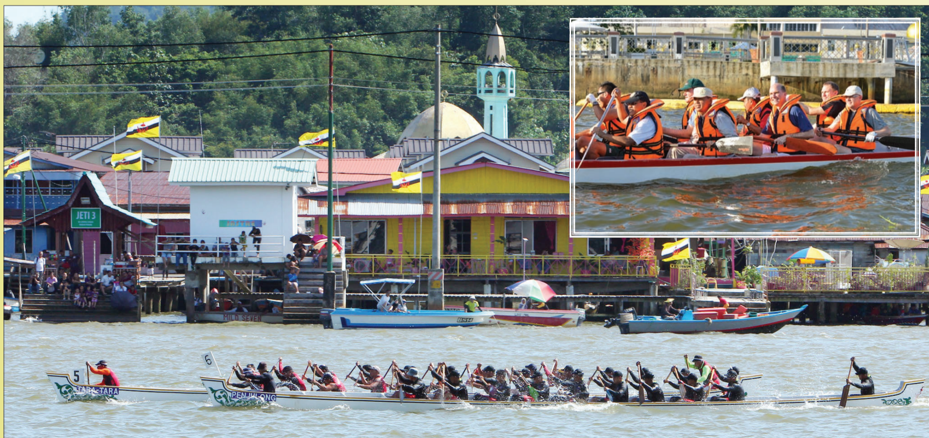
REGATA menyerikan suasana Bandar Seri Begawan, sementara gambar kecil, penyertaan antarabangsa dalam regata menjadikan sukan ini amat berprestij.