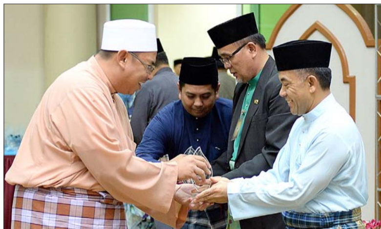
TIMBALAN Menteri di JPM, Yang Mulia Dato Paduka Awang Haji Ali menyampaikan hadiah kepada qari dan qariah (atas dan bawah).