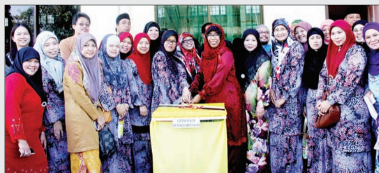
ACARA memotong kek Hari Kebangsaan Negara Brunei Darussalam Ke-30 pada Majlis Sambutan Hari Kebangsaan Negara Brunei Darussalam di Sekolah Rendah Muhammad Alam (SRMA), Seria (atas), sementara gambar bawah, SEMANGAT KEMERDEKAAN ... Murid-murid SRMA, Seria menyanyikan lagu patriotik sambil mengibarkan bendera kecil Negara Brunei Darussalam.

Kebangsaan Negara Brunei Darussalam Ke-30 dengan acara kemuncak memotong kek dan membaca Surah Yaa Siin serta Doa