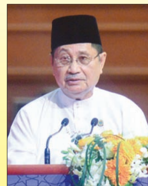
MENTERI Hal Ehwal Dalam Negeri, Yang Berhormat Pehin Udana Khatib Dato Paduka Seri Setia Ustaz Haji Awang Badaruddin bin Pengarah Dato Paduka Haji Othman semasa menyampaikan sembah alu-aluan pada Majlis AKC Peringkat Kebangsaan Ke-3.

Yang Berhormat menyebarkan, skim tersebut