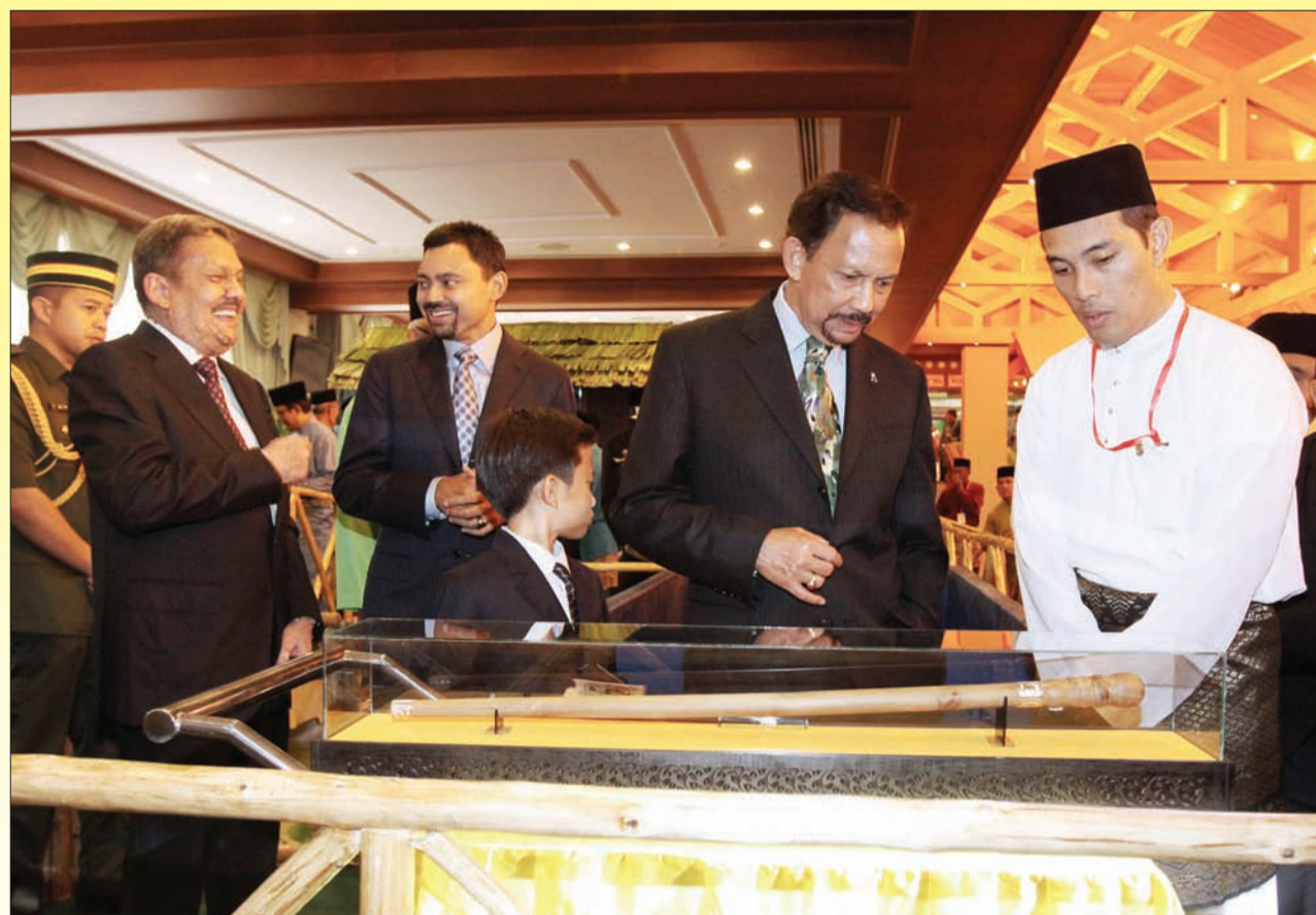
KEBAWAH Duli Yang Maha Mulia Paduka Seri Baginda Sultan Haji Hassanah Bolkhiah Mu'izzuddin Waddaulah, Sultan dan Yang Di-Pertuan Negara Brunei Darussalam ketika berkenan menyaksikan menyaksikan Pameran Khas AKC Ke-3. Juga berangkat ialah Duli Yang Teramat Mulia Paduka Seri Pengiran Muda Mahkota Pengiran Muda Haji Al-Muhtadee Billah, Menteri Kanan di JPM; DYTM Paduka Seri Pengiran Bendahara Seri Maharaja Permaisura Pengiran Muda Haji Sufri Bolkhiah dan YTM Paduka Seri Duli Pengiran Muda 'Abdul Wakeel.