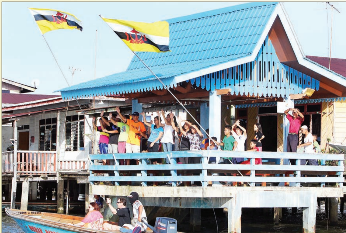
SEBAHAGIAN dari penduduk Kampung Ayer tidak melepaskan peluang menyaksikan acara regata.

Para peserta setentunya telah pun bersiap sedia dengan segala latihan bagi bertarung dalam kejohanan yang bakal berlangsung esok. Marilah kita sama-sama meramaikan Bandar Seri Begawan bagi menyaksikan perwira-perwira negara berkayuh meraih kemenangan.