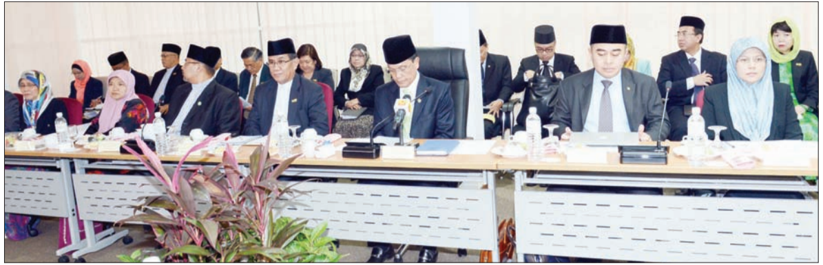
MENTERI Pendidikan, Yang Berhormat Pehin Orang Kaya Seri Kerna Dato Seri Setia (Dr.) Haji Awang Abu Bakar bin Haji Apong dan pegawai-pegawai kanan kementeriannya ketika mengadakan muzakarah bersama Ahli-ahli Majlis Mesyuarat Negara (MMN) yang berlangsung di Pusat Tingkatan Enam Sengkuring.

Ia bermatlamatkan hasrat mutlak untuk menyediakan generasi muda yang berkemahiran dan berpendidikan tinggi yang mampu meraih peluang