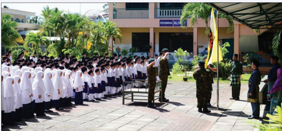
UPACARA Menaikkan Bendera Negara oleh Pasukan Kadet Tentera dari Sekolah Menengah Sayyidina Hussain, Jerudong.

Sambutan itu diadakan sebagai salah satu aktiviti tahunan sekolah tersebut, di samping untuk memupuk semangat patriotisme dalam kalangan para murid-murid sekolah itu agar lebih semangat dan mencintai negara sesuai dengan tema sambutan tahun ini iaitu 'Generasi Berwawasan'.