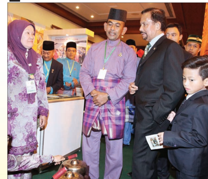
KEBAWAH DYMM disembahkan penerangan ketika berkenan menyaksikan Pameran Khas AKC Ke-3 (atas), sementara gambar atas kiri, baginda berkenan menyaksikan produk penghasilan Majlis Perundingan Kampung (MPK) bersempena Pameran Khas AKC Ke-3.

itu terdiri daripada 10 dari Daerah Brunei dan Muara, lima dari Daerah Belait, empat dari Daerah Tutong dan empat lagi Daerah Temburong.