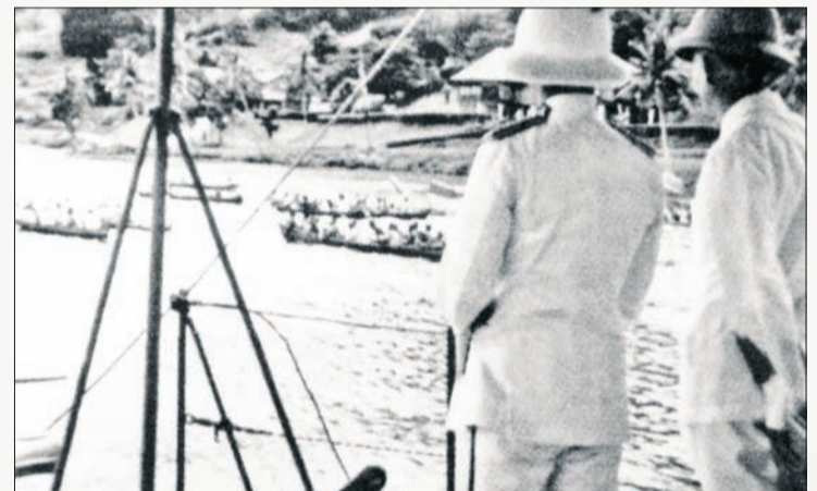
SUASANA dahulu penuh keceriaan dalam acara Lumba Perahu di Perairan Sungai Brunei.

mencatatkan ristaan apabila Kebawah Duli Yang Maha Mulia Paduka Seri Baginda Sultan Haji Hassanul Bolkiah Mu'izzaddin Waddaulah ibni Al-Marhum Sultan Haji Omar 'Ali Saifuddin Sa'adul Khairi Waddien, Sultan dan Yang Di-Pertuan Negara Brunei Darussalam telah bercemar duli ke acara RBD 2012 bagi mengembalikan semula nostalgia dan kegemilangan lumba perahu dan yang penting sekali dapat mengukuhkan lagi hubungan raja dengan rakyat yang sekian lama akrab. Keberangkatan Kebawah Duli Yang Maha Mulia bersama anakanda-anakanda dan adinda baginda, Yang Teramat Mulia Paduka Seri Pengiran Muda