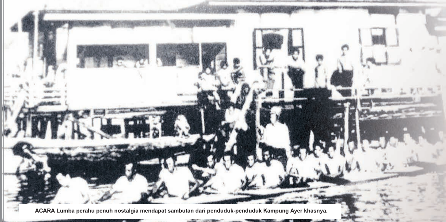
ACARA Lumba perahu penuh nostalgia mendapat sambutan dari penduduk-penduduk Kampung Ayer khasnya.

Sama-samalah kita sentiasa memelihara dan memperkembangkan BSB sebagai sebuah bandar yang menjadi lambang keunggulan Negara Brunei Darussalam yang berprinsipkan Melayu Islam Beraja yang sentiasa indah, bersih dan menawan. Marilah kita sanma-sama memeriahkan RBD 2014.