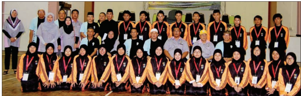
PARA peserta Program Belia Cinta Tanah Air (PBCTA) Kali Ke IX Tahun 2014 Fasa IV - Berkhidmat Untuk Masyarakat meneruskan misi di Daerah Belait telah disambut dalam Majlis Selamat Datang.

Program itu juga kata beliau, untuk membangunkan kecergasan jasmani dan kematapan rohani para belia supaya menjadi tabah serta mempunyai fikiran yang luas dan terbuka, di samping