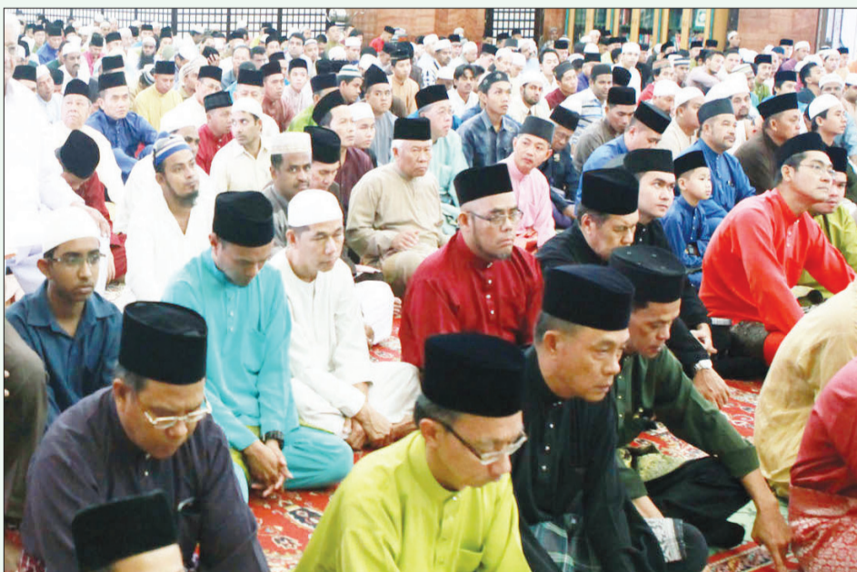
PARA jemaah yang hadir bagi menunaikan Sembahyang Sunat Aidilfitri di Masjid Omar 'Ali Saifuddin.

SESUNGGUHNYA orang-orang yang membazir (membelanjakan harta pada jalan yang salah) itu adalah saudara-saudara syaitan dan syaitan itu adalah sangat kufur kepada tuhanNya.