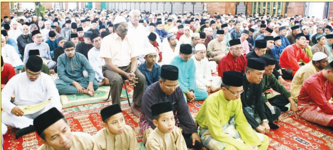
RIBUAN umat Islam hadir bagi menunaikan Sembahyang Sunat Hari Raya Aidilfitri di Masjid Omar 'Ali Saifuddien di ibu negara.

Di Daerah Tutong, Sembahyang Sunat Hari Raya Aidilfitri tertumpu di Masjid Hassanal Bolkiah Pekan Tutong, di Daerah Belait tertumpu di Masjid Muhammad Jamalul Alam, Kuala Belait, sementara di Daerah Temburong pula di Masjid Utama Mohammad Salleh, manakala di Pekan Muara diadakan di Masjid Setia Ali, Pekan Muara.