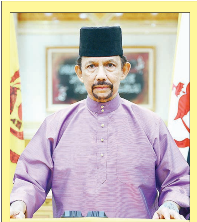
TITAH Perutusan Kebawah Duli Yang Maha Mulia Paduka Seri Baginda Sultan Haji Hassanal Bolkiah Mu'izzaddin Waddaulah ibni Al-Marhum Sultan Haji Omar 'Ali Saifuddin Sa'adul Khairi Waddien, Sultan dan Yang Di-Pertuan Negara Brunei Darussalam Sempena Hari Raya Aidilfitri Tahun 1435 Hijriah / 2014 Masihi.

Ini dapat dikesan daripada keadaan-keadaan yang ada, di mana di seluruh pelusuk dunia ini, telah sedia