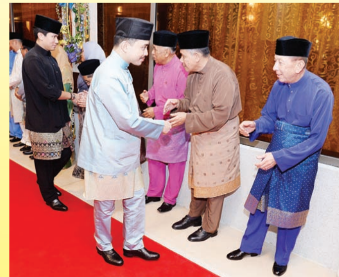
YANG Teramat Mulia Paduka Seri Duli Pengiran Muda 'Abdul Malik dan Yang Teramat Mulia Paduka Seri Duli Pengiran Muda 'Abdul Mateen berkenan menerima junjung ziarah mantan Pesuruhjaya Polis dan Pemerintah ABDB.