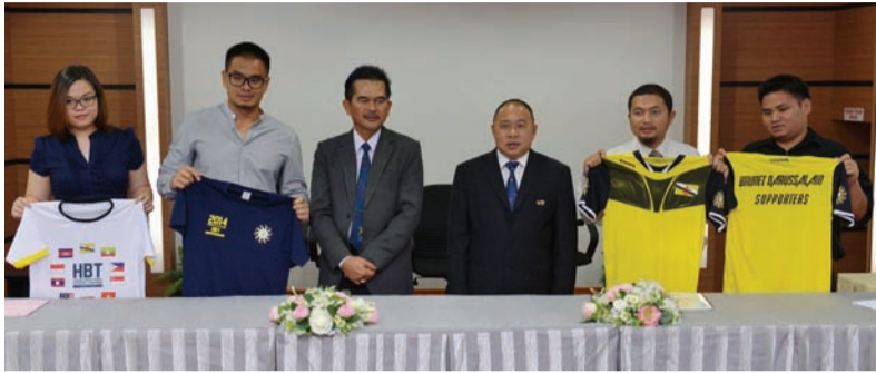
ANTARA barangan ( merchandise ) yang akan dikeluarkan dan dijual sempena Kejohanan Bola Sepak Piala Hassanal Bolkiah (HBT) bagi Belia ASEAN 2014.

Oleh : Dk. Vivv Malessa Pg. Ibrahim