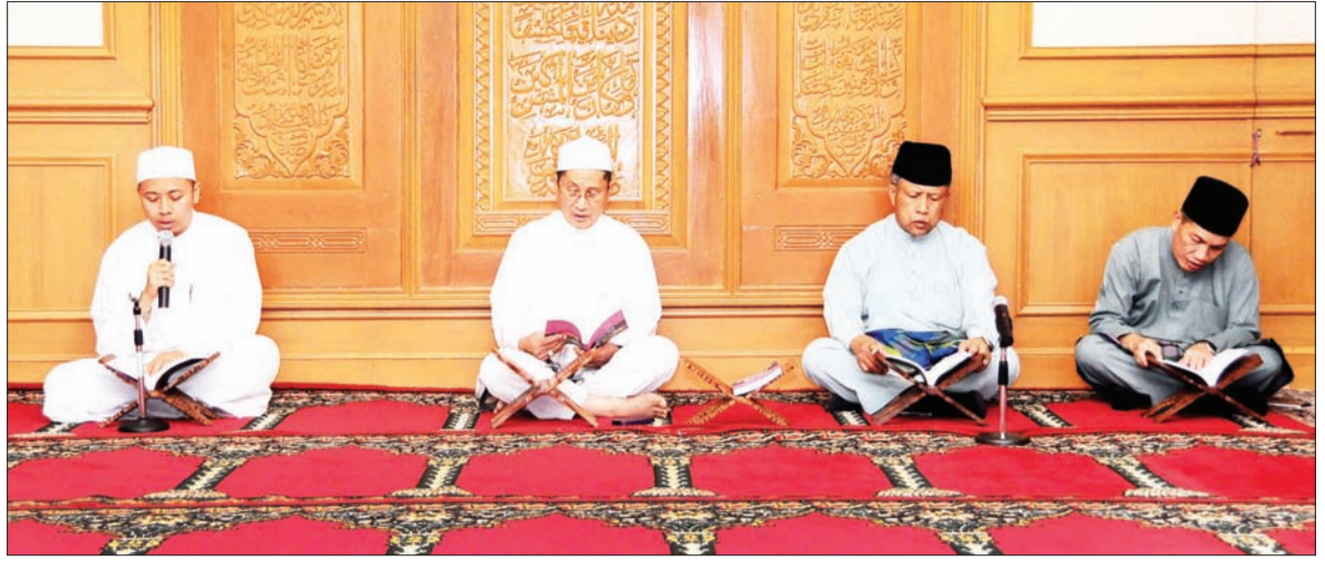
MENTERI Hal Ehwal Dalam Negeri, Yang Berhormat Pehin Udana Khatib Dato Paduka Seri Setia Ustaz Haji Awang Badaruddin bin Pengarah Dato Paduka Haji Othman semasa hadir di Majlis Khatam Al-Qur'an KHEDN di kediamannya di Kampung Sungai Besar.

Majlis turut dihadiri oleh Ahli-ahli Takmir Masjid Kampung Sungai Besar.