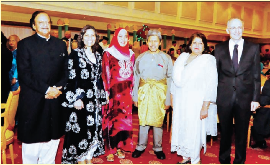
DULI Yang Teramat Mulia Paduka Seri Pengiran Perdana Wazir Sahibul Himmah Wal-Waqar Pengiran Muda Mohamed Bolkiah ibni Al-Marhum Sultan Haji Omar 'Ali Saifuddin Sa'adul Khairi Waddien dan Yang Teramat Mulia Pengiran Anak Isteri Pengiran Anak Hajah Zariah binti Al-Marhum Pengiran Pemancha Pengiran Anak Haji Mohamed Alam berkenan mengadakan Rumah Terbuka sempena Hari Raya Aidilfitri yang bermula pada hari ini di Balai Penghadapan Bukit Kayangan.