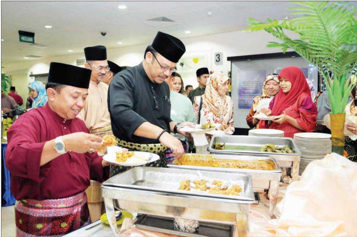
MAJLIS Rumah Terbuka lazimnya menghadirkan pelbagai juadah yang menyelerakan maka sebaiknya tuan rumah memastikan juadah sentiasa dalam keadaan yang baik agar tidak menjejaskan kesihatan tetamu (atas dan bawah).