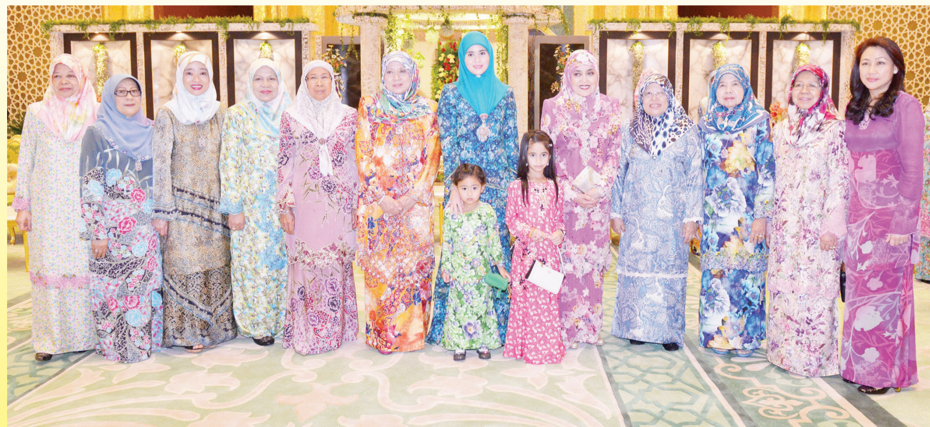
KEBAWAH Duli Yang Maha Mulia Paduka Seri Baginda Raja Isteri Pengiran Anak Hajah Saleha binti Al-Marhum Pengiran Pemancha Pengiran Anak Haji Mohamed Alam berkenan bergambar ramai bersama isteri para pembesar negara sempena Sambutan Hari Raya Aidilfitri. Juga kelihatan ialah Yang Teramat Mulia Paduka Seri Pengiran Anak Isteri Pengiran Anak Sarah dan Yang Teramat Mulia Paduka Seri Pengiran Anak Puteri Ameerah Wardatul Bolkiah dan cucunda Kebawah DYMM.