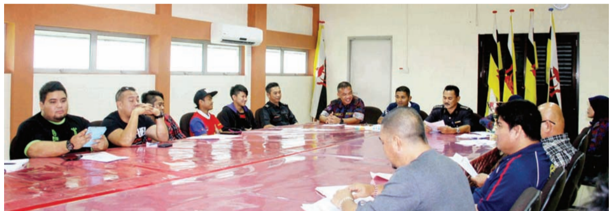
MAJLIS Taklimat dan Cabut Undi Perlawanan Tarik Kalat Tradisi Bagi Pengurus-pengurus Pasukan di Kompleks Sukan, Mumong.

Acara temasya Sukan Komanwel Ke-20, 2014 di Glasgow, Scotland sedang berlangsung selama 12 hari sehingga 3 Ogos 2014 ini.