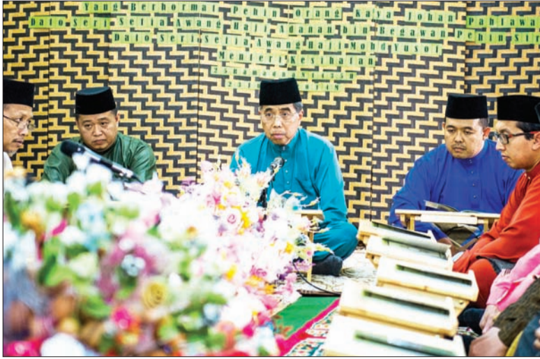
MENTERI Kesihatan, Yang Berhormat Pehin Orang Kaya Johan Pahlawan Dato Seri Setia Awang Haji Adanan bin Begawan Pehin Siraja Khatib Dato Seri Setia Awang Haji Mohd. Yusof hadir pada Majlis Khatam Al-Qur'an bagi lima penghuni iaitu tiga peserta lelaki dan dua peserta perempuan Rumah Sinar Sejahtera dan Rumah Cahaya Sejahtera.