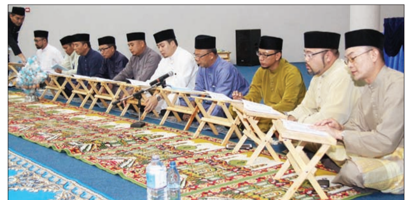
SEBAHAGIAN daripada pensyarah dan pegawai ITB ketika membaca surah-surah khatam.

Majlis bertujuan bagi mengeratkan silaturahim dalam kalangan warga pejabat, di samping menyemarakkan lagi bulan Ramadan yang penuh keberkatan ini dan sebagai salah satu aktiviti tahunan pejabat.