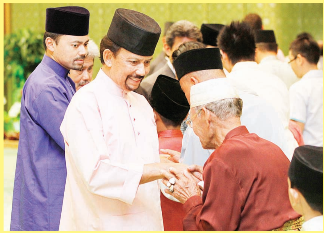
KEBAWAH Duli Yang Maha Mulia Paduka Seri Baginda Sultan Haji Hassanal Bolkiah Mu'izzaddin Waddaulah ibni Al-Marhum Sultan Haji Omar 'Ali Saifuddien Sa'adul Khairi Waddien, Sultan dan Yang Di-Pertuan Negara Brunei Darussalam ketika berkenan menerima junjung ziarah para pengunjung lelaki pada Majlis Sambutan Hari Raya Aidilfitri pada tahun 1434 Hijriah.