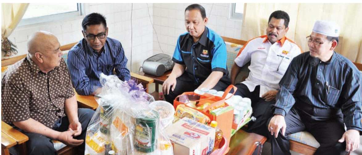
ROMBONGAN RTB diketuai oleh Ketua Rancangan Radio, Pengiran Ahmad bin Pengiran Haji Mahmud menyerahkan sumbangan kepada salah seorang penerima melalui projek Jalinan Kasihanjuran Perkhidmatan Radio Brunei.

TEMBURONG, Rabu, 23 Julai. - Kebajikan golongan yang kurang bernasib baik dan memerlukan bantuan terus diambil perhatian oleh berbagai-bagai pihak di negara ini apatah lagi pada bulan Ramadan yang penuh berkah ini.