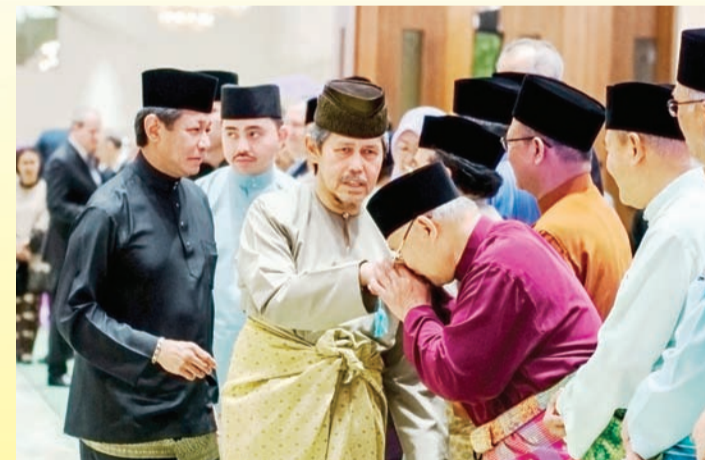
Duli Yang Teramat Mulia Paduka Seri Pengiran Perdana Wazir Sahibul Himmah Wal-Waqar Pengiran Muda Mohamed Bolkiah; Duli Yang Teramat Mulia Paduka Seri Pengiran Digadong Sahibul Mal Pengiran Muda Haji Jefri Bolkiah dan Yang Teramat Mulia Paduka Seri Duli Pengiran Muda 'Abdul Malik berkenan menerima junjung ziarah para pembesar negara (kiri).

YANG Teramat Mulia Paduka Seri Pengiran Anak Puteri Hajah Rashidah Sa'adatull Bolkiah; YTM Paduka Seri Pengiran Anak Puteri Hajah Majeedah Nuurul Bolkiah; YTM Paduka Seri Pengiran Anak Puteri Hajah Hafizah Sururul Bolkiah; YTM Paduka Seri Pengiran Anak Puteri 'Azemah Ni'matul Bolkiah; YTM Paduka Seri Pengiran Anak Puteri Fadzilah Lubabul Bolkiah; YTM Paduka Seri Pengiran Anak Puteri Hajah Masna dan YTM Paduka Seri Pengiran Anak Puteri Hajah Amal Umi Kalthum Al-Islam berangkat ke majlis tersebut (kanan).