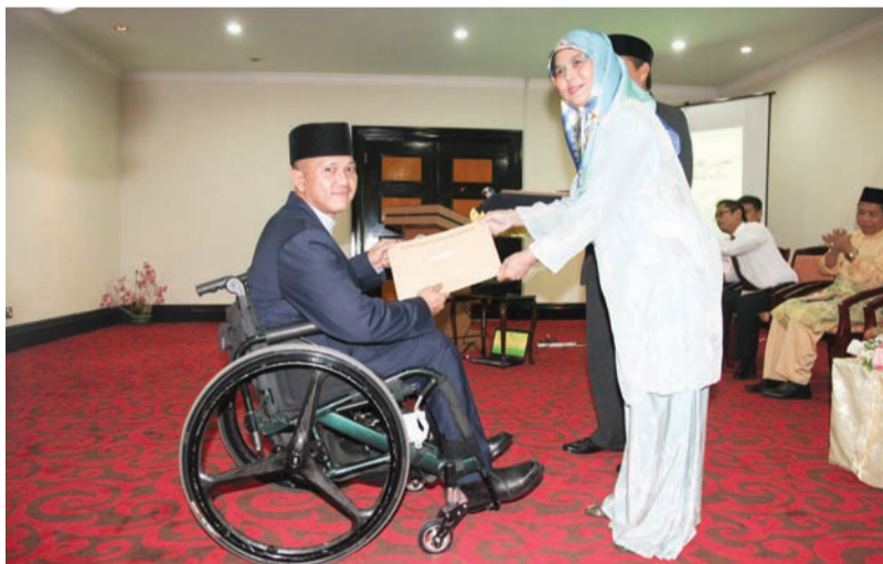
Oleh : Dk. Siti Redzaimi Pg. Haji Ahmad

BANDAR SERI BEGAWAN, Rabu, 23 Julai. - Jabatan Belia dan Sukan, Kementerian Kebudayaan, Belia dan Sukan (KKBS) telah memberikan ganjaran kemenangan Skim Penggalak Kecemerlangan Sukan (SPKS) kepada 23 atlet, sembilan jurulatih, enam penolong jurulatih dan enam buah Persatuan Sukan Kebangsaan.