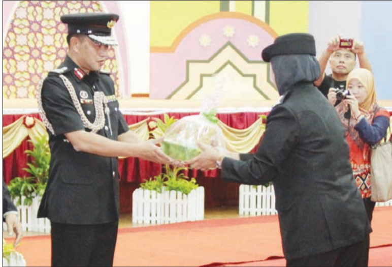
PENGARAH Bomba dan Penyelamat, Awang Yahya bin Haji Abd Rahman menyempurnakan penyampaian minuman kepada wakil dari balai-balai bomba.

Jika terjadi sebarang kecemasan yang memerlukan bantuan JBP, orang ramai boleh menghubungi Hotline di talian kecemasan 995.