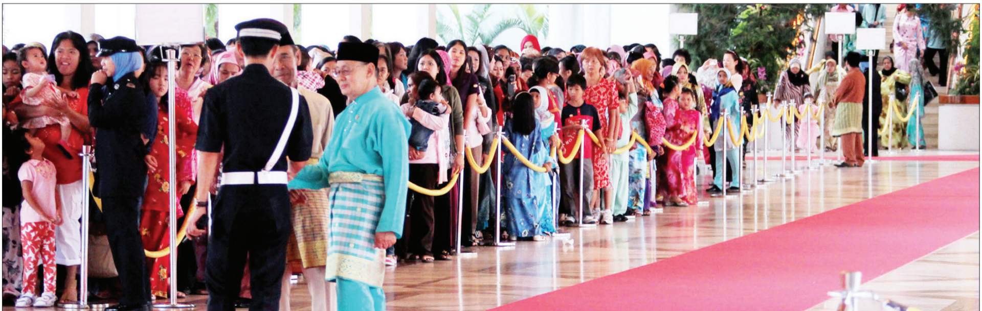
ORANG ramai tidak melepaskan peluang berkunjung ke Istana Nurul Iman bagi mengadap dan menjunjung ziarah ke hadapan majlis baginda serta kerabat diraja.