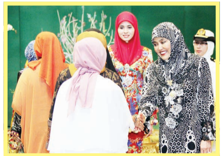
KEBAWAH Duli Yang Maha Mulia Paduka Seri Baginda Raja Isteri Pengiran Anak Hajah Saleha binti Al-Marhum Pengiran Pemancha Pengiran Anak Haji Mohamed Alam ketika berkenan menerima junjung ziarah dari para pengunjung wanita sempena Sambutan Hari Raya Aidilfitri pada tahun 1434 Hijriah.

Ini adalah satu pengajaran yang baik jikalau kita lihat di dunia luar yang sentiasa berlaku ketidakadilan, tindas-menindas, tetapi Alhamdulillah, dengan adanya ajaran Islam dan ada yang sistem MIB, memperlihatkan bahawa kehidupan kita ini bertambah kukuh dan bersatu padu.