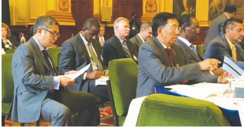
MENTERI Kebudayaan, Belia dan Sukan, Yang Berhormat Pehin Orang Kaya Pekerma Laila Diraja Dato Seri Setia Awang Haji Hazair bin Haji Abdullah semasa menghadiri Mesyuarat Menteri Sukan Komanwel ke-7 (7CSMM) yang diadakan di Glasgow, Scotland, United Kingdom

GLASGOW, SCOTTLAND, Isnin 21 Julai. - Menteri Kebudayaan, Belia dan Sukan (KKBS), Yang Berhormat Pehin Orang Kaya Pekerma Laila Diraja Dato Seri Setia Awang Haji Hazair bin Haji Abdullah mengumumkan sukan untuk Pembangunan dan