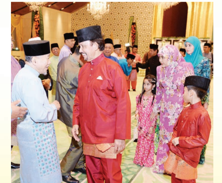
KEBAWAH DYMM dan Duli Yang Teramat Mulia Paduka Seri Pengiran Muda Mahkota Pengiran Muda Haji Al-Muhtadee Billah berkenan berbual mesra dan menerima junjung ziarah para pembesar negara (atas dan atas kiri).