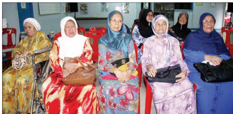
ANTARA ibu-ibu tunggal di Daerah Belait yang menerima sumbangan derma dari BISTARI.

Dengan sumbangan bantuan dan sokongan tersebut insyaaAllah IQRA akan mencapai sasarannya untuk kesejahteraan insan dan bersatu padu ke arah kebajikan dan takwa.