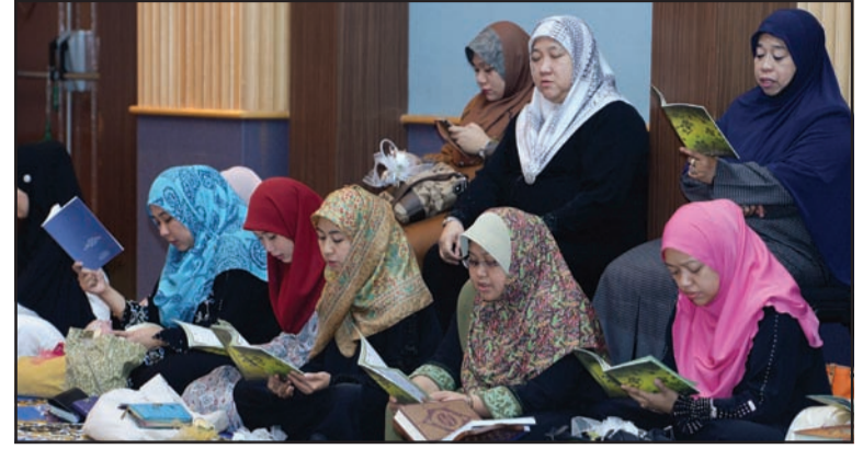
ANTARA pegawai dan kakitangan setiap jabatan, bahagian dan pusat di bawah Kementerian Perindustrian dan Sumber-Sumber Utama (KPSSU) yang hadir dalam majlis tersebut.

Kaedah pembacaan dibuat secara bergilir-gilir terdiri daripada pegawai dan kakitangan setiap jabatan/bahagian / pusat di bawah KPSSU yang diadakan di Surau KPSSU.