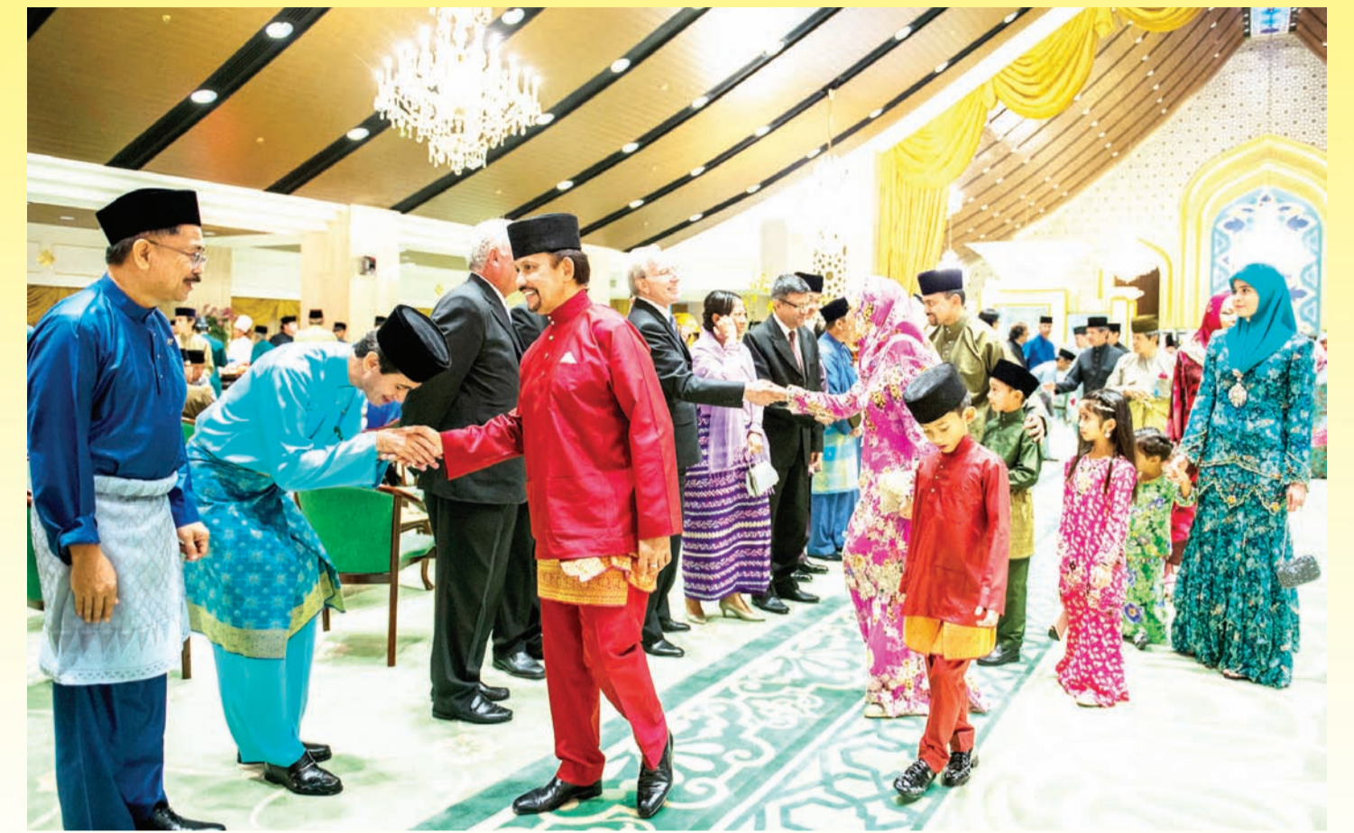
KEBAWAH Duli Yang Maha Mulia dan Kebawah Duli Yang Maha Mulia Paduka Seri Baginda Raja Isteri Pengiran Anak Hajah Saleha bersama putera dan puteri baginda berkenan menerima junjung ziarah para pembesar negara dan diplomat asing ke negara ini (atas), sementara gambar bawah kiri, baginda berkenan berbual bersama Timbalan-Timbalan Menteri Kabinet.