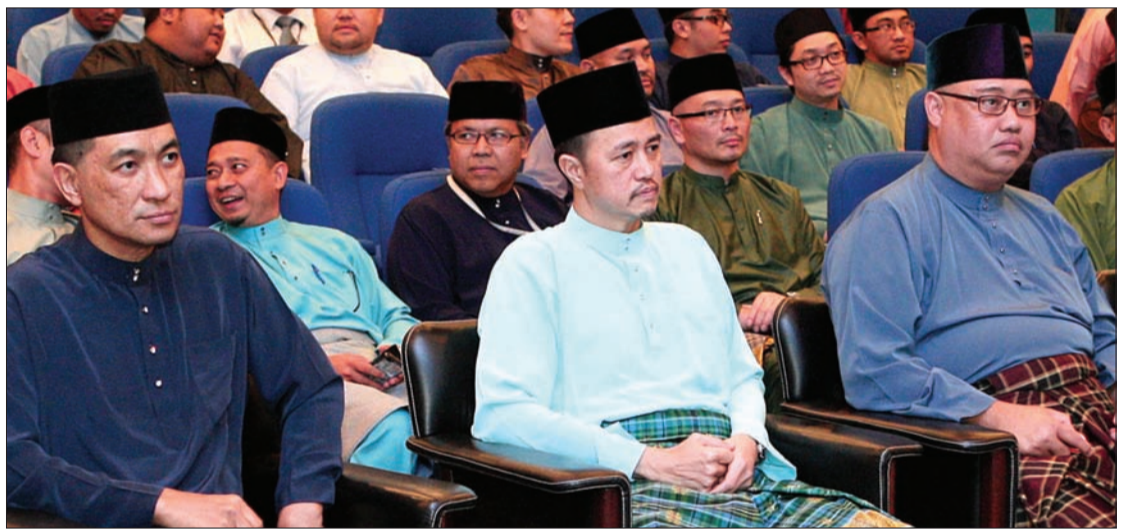
TIMBALAN Menteri Kewangan, Yang Mulia Dato Paduka Awang Haji Bahrin bin Abdullah (tengah) semasa hadir selaku tetamu kehormat pada Majlis Sambutan Nuzul Al-Qur'an di Dewan Teater, Commonwealth Drive.

BANDAR SERI BEGAWAN , Sabtu, 26 Julai. - Kementerian Kewangan dan jabatan-jabatan di bawahnya melalui Agensi Pelaburan Brunei mengadakan Majlis Sambutan Nuzul Al-Qur'an di Dewan Teater, Commonwealth Drive, di sini.