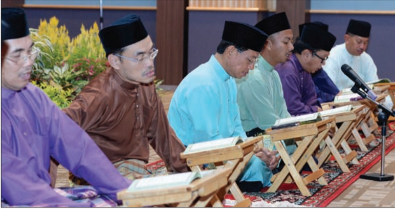
MENTERI Perindustrian dan Sumber-Sumber Utama, Yang Berhormat Pehin Orang Kaya Seri Utama Dato Seri Setia Awang Haji Yahya bin Begawan Mudim Dato Paduka Haji Bakar hadir selaku tetamu kehormat pada Majlis Khatam Al-Qur'an bagi pegawai dan kakitangan setiap jabatan, bahagian dan pusat di bawah KPSSU.

BANDAR SERI BEGAWAN , Khamis, 24 Julai. - Kementerian Perindustrian dan Sumber-Sumber Utama (KPSSU) menganjurkan Majlis Khatam Al-Qur'an, bertempat di Dewan Setia Pahlawan, KPSSU, di sini.