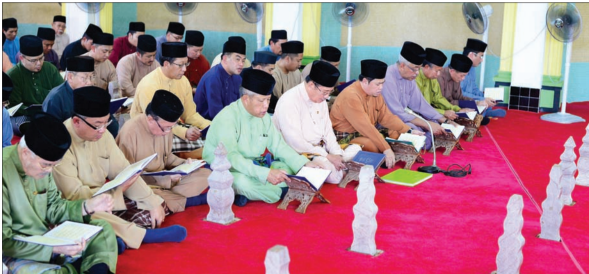
ROMBONGAN Kementerian Hal Ehwal Dalam Negeri diketuai oleh Menteri Hal Ehwal Dalam Negeri, Yang Berhormat Pehin Udana Khatib Dato Paduka Seri Setia Ustaz Haji Awang Badaruddin bin Pengarah Dato Paduka Haji Othman dan disertai Timbalan Menteri Hal Ehwal Dalam Negeri, Yang Dimuliakan Pehin Datu Lailaraja Mejar Jeneral (B) Dato Paduka Seri Haji Awang Halbi bin Haji Mohd. Yussof.