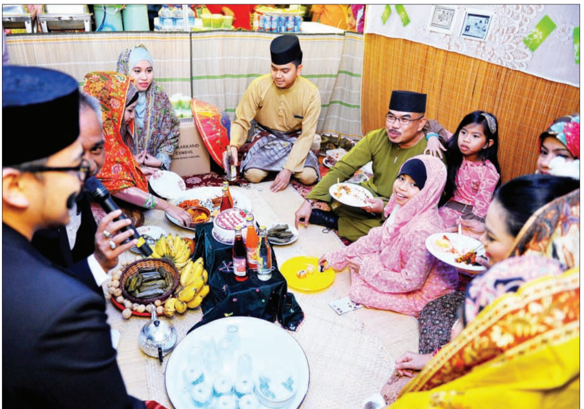
KONSEP Rumah Terbuka juga lazim digunakan pada sambutan Hari Raya yang diadakan di jabatan-jabatan kerajaan atau syarikat-syarikat swasta.

RUMAH Terbuka dapat mewujudkan satu penyatuan atau kekukuhan hidup berkeluarga, bermasyarakat dan bernegara. Ini kerana terdapat di dalamnya konsep kunjung-mengunjungi, ziarah-menziarahi dan bermaaf-maafan yang memang digalakkan dalam Islam dan sesuai dengan falsafah negara Melayu Islam Beraja.