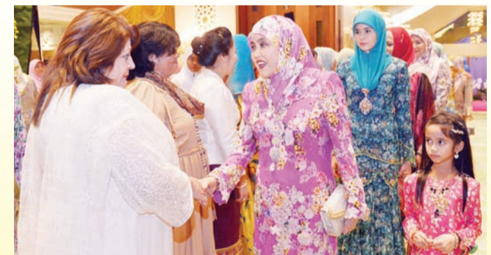
KEBAWAH Duli Yang Maha Mulia Paduka Seri Baginda Raja Isteri berkenan menerima junjung ziarah isteri diplomat asing.