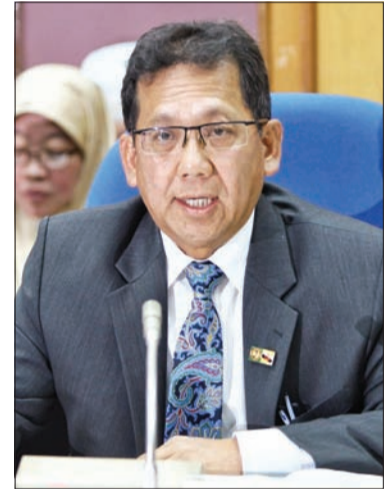
MENTERI Pembangunan, Yang Berhormat Pehin Orang Kaya Indera Pahlawan Dato Seri Setia Awang Haji Suyoi bin Haji Osman semasa hadir bagi mempengerusikan Sesi Muzakarah Bersama Ahli-Ahli Majlis Mesyuarat Negara (MMN).

Sesi Muzakarah yang juga dihadiri oleh pegawai-pegawai kanan, pegawai-pegawai serta kakitangan Kementerian Pembangunan harap akan dapat dijadikan sebagai salah satu lagi wadah atau landasan bagi membincangkan perkara-perkara bagi melibatkan kepentingan rakyat, selain perbincangan semasa Sesi Persidangan MMN.