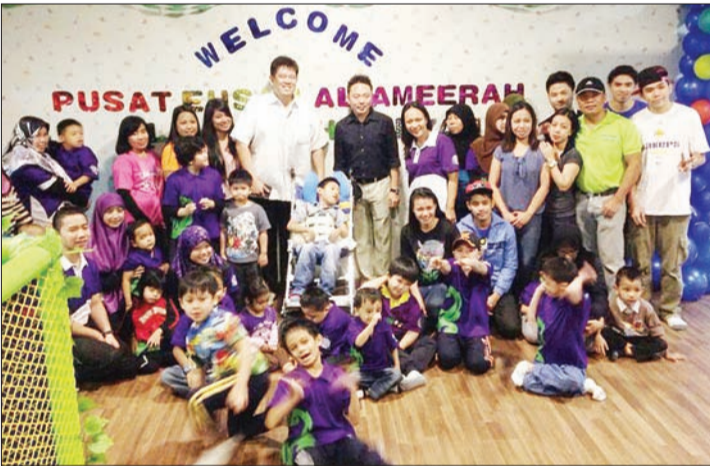
PELAJAR-PELAJAR khas Pusat Ehsan Al Ameerah Al Hajjah Maryam dalam sesi bergambar ramai di tempat permainan, Westpark Kiddieland, Gadong.

Oleh : Saerah Haji Abdul Ghani