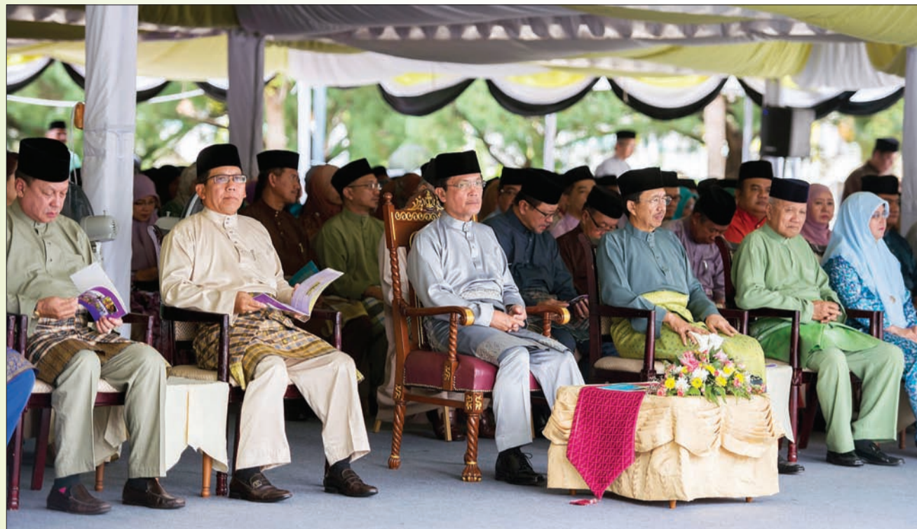
MENTERI Pendidikan, Yang Berhormat Pehin Orang Kaya Seri Kerna Dato Seri Setia (Dr.) Haji Awang Abu Bakar bin Haji Apong semasa hadir selaku tetamu kehormat pada Upacara Menaikkan Bendera Besar Sambutan Ulang Tahun Hari Kebangsaan Negara Brunei Darussalam Ke-30 Tahun berlangsung di kawasan lapang Kompleks Yayasan Sultan Haji Hassanal Bolkiah (YSHHB) di ibu negara.

Upacara Menaikkan Bendera Besar tersebut sekali gus menandakan bermulanya pengibaran bendera di rumah-rumah kediaman, bangunan-bangunan kerajaan dan swasta di seluruh negara sempena Sambutan Ulang Tahun Hari Kebangsaan Ke-30.