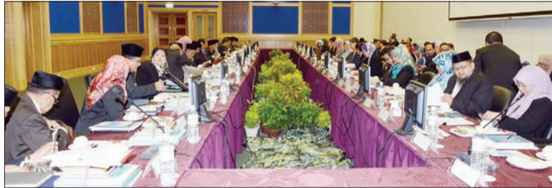
SESI Muzakarah Kementerian Kesihatan Dengan Ahli-Ahli MMN yang berlangsung di Dewan Al 'Afiah, Kementerian Kesihatan.

Sementara itu, Yang Berhormat juga menjelaskan mengenai langkah untuk menangani cabaran peningkatan penyakit-penyakit tidak berjangkit