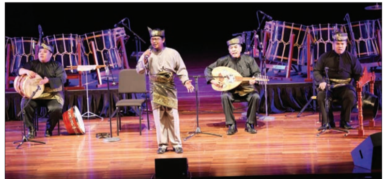
PERSEMBAHAN kebudayaan oleh Kumpulan Senandung Budaya turut menyerikan Konsert Tradisional Jepun.