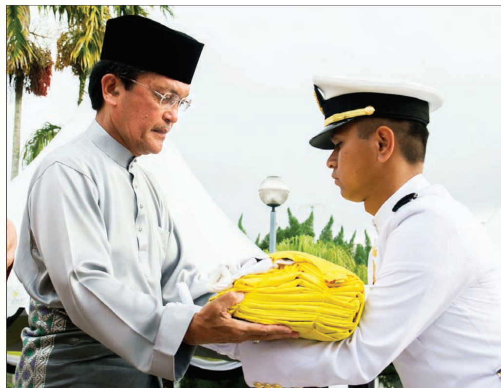
YANG Berhormat Menteri Pendidikan menyerahkan Bendera Negara Brunei Darussalam kepada anggota Tentera Laut Diraja Brunei (TLDB) untuk dinaikkan.