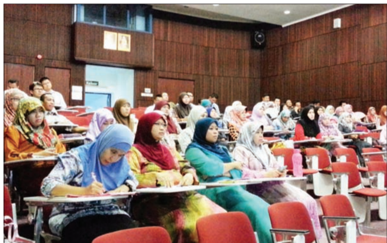
PEGAWAI-PEGAWAI dan kakitangan kerajaan kebawah Duli Yang Maha Mulia Paduka Seri Baginda Sultan dan yang Di-Pertuan Negara Brunei Darussalam ketika mendengarkan ceramah mengenai perancangan kewangan di Institut Perkhidmatan Awam.

BANDAR SERI BEGAWAN, Khamis, 6 Februari. - Bank Islam Brunei Darussalam (BIBD), melalui