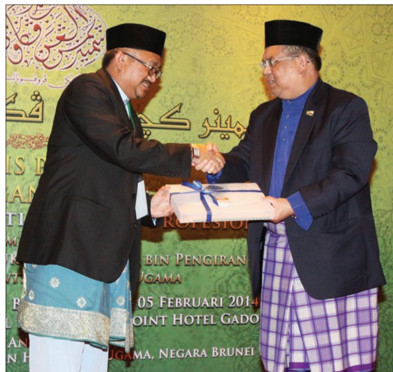
PENYERAHAN Resolusi diadakan pada Majlis Penutup Seminar Kecemerlangan Pegawai-Pegawai Masjid.

"Bagi mengelakkan kes kecurian di masjid-masjid boleh ditangani dengan meningkatkan kewaspadaan pegawai-pegawai masjid dan pemedulian jemaah masjid melalui tindakan-tindakan yang munasabah seperti