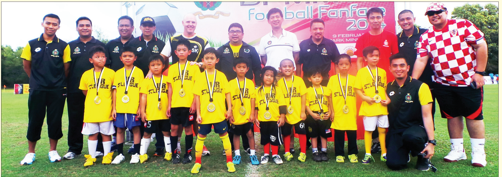
YANG Teramat Mulia Pengiran Muda 'Abdul Muntaqim berkenan bergambar ramai.