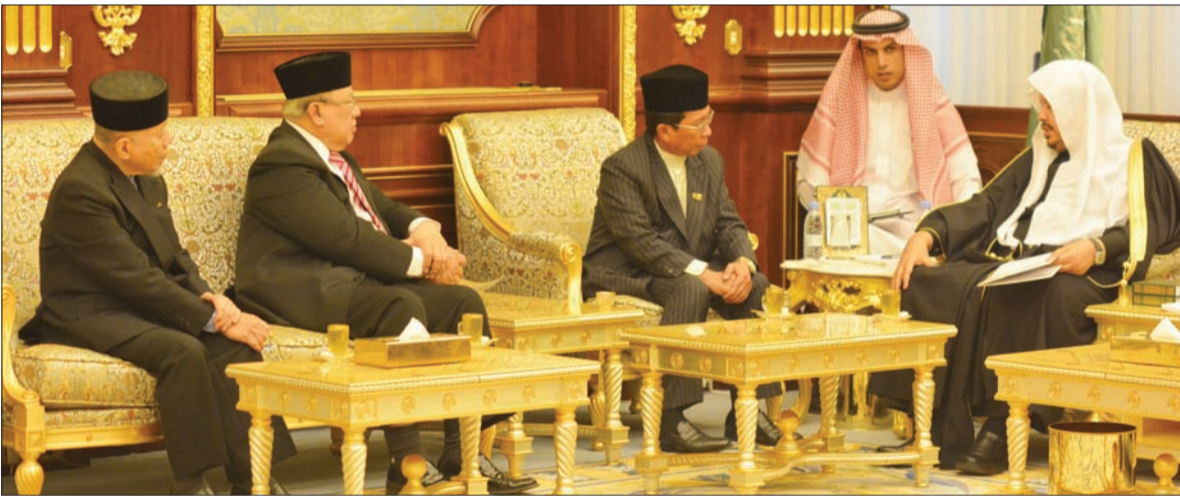
MENTERI Hal Ehwal Ugama, Yang Berhormat Dato Seri Setia Dr. Haji Mohammad bin Pengiran Haji Abdul Rahman semasa mengadakan perjumpaan dua hala bersama Pengerusi Majlis Ash-Shoura, Tuan Yang Terutama Dr. Sheikh Abdullah bin Muhammad Ibrahim Al-Sheikh di Bangunan Majlis Ash-Shoura, Riyadh, Kerajaan Arab Saudi.

RIYADH, KERAJAAN ARAB SAUDI, Ahad, 9 Februari. - Rombongan Negara Brunei Darussalam yang diketuai oleh Menteri Hal Ehwal Ugama, Yang Berhormat Pengiran Dato Seri Setia Dr. Haji Mohammad bin Pengiran Haji Abdul Rahman memulakan lawatan kerja di Riyadh, Kerajaan Arab Saudi dengan mengadakan perjumpaan dua hala bersama Pengerusi Majlis Ash-Shoura, Tuan Yang Terutama Dr. Sheikh Abdullah bin Muhammad Ibrahim Al-Sheikh di Bangunan Majlis Ash-Shoura, di sini.