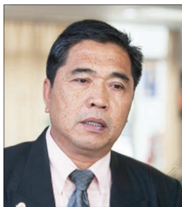
Oleh : Khartini Hamir

BANDAR SERI BEGAWAN, Khamis, 6 Februari. - Rasuah boleh berlaku dalam kalangan golongan atau kedudukan dalam pelbagai lapisan masyarakat, dan perbuatan tersebut boleh mengheret individu atau masyarakat, bangsa dan negara kepada bencana keruntuhan yang disebabkan oleh sifat tamak, kerakusan dan kepentingan diri sendiri.