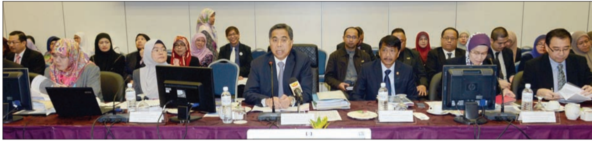
MENTERI Kesihatan, Yang Berhormat Pehin Orang Kaya Johan Pahlawan Dato Seri Setia Awang Haji Adanan bin Begawan Pehin Siraja Khatib Dato Seri Setia Awang Haji Mohd. Yusof semasa mempengerusikan Sesi Muzakarah Dengan Ahli-Ahli Majlis Mesyuarat Negara (MMN), berlangsung di Dewan Al 'Afiah, Kementerian Kesihatan.