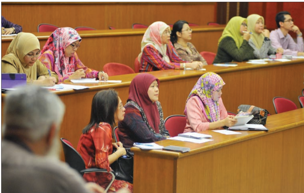
SEBAHAGIAN daripada pendidik dan ahli akademik yang hadir pada Majlis Sesi Ceramah Bulanan yang diadakan di Senate Room, Chancellor Hall, Universiti Brunei Darussalam.

TUNGKU, Rabu, 5 Februari. - Insititut Pendidikan Sultan Hassanah Bolkiah (SHBIE) Fakulti Sosial dan Kebajikan, melancarkan siri syarahan bulanan yang pertama yang bertemakan