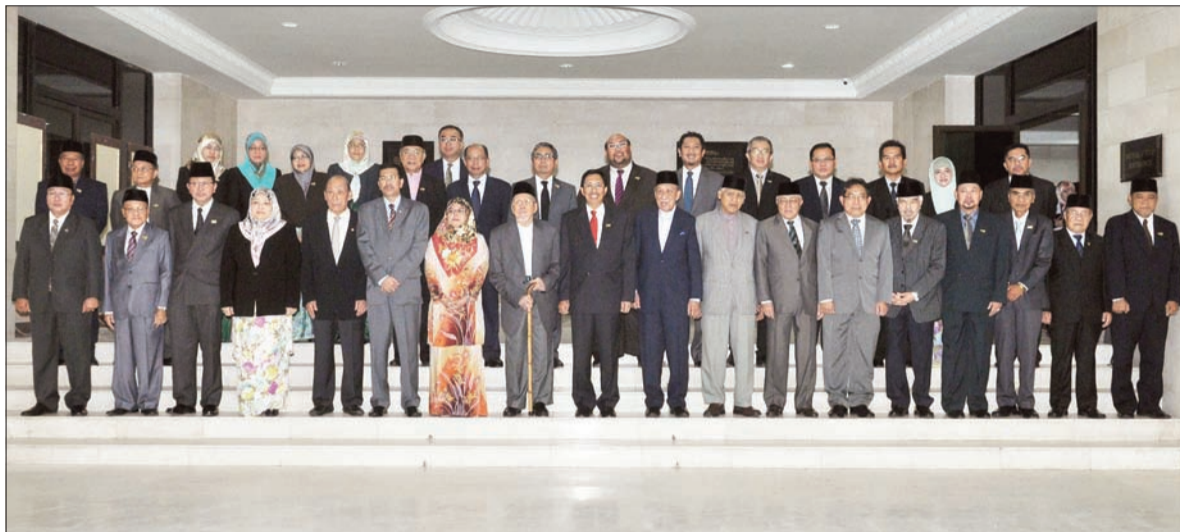
MENTERI Kebudayaan, Belia dan Sukan menyertai sesi bergambar ramai bersama Ahli-ahli MMN sempena sesi Muzakarah yang berlangsung di Dewan Persidangan, Stadium Negara Hassanal Bolkiah.