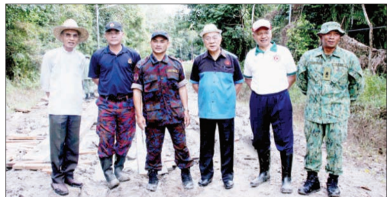
AHLI-AHLI Majlis Mesyuarat Negara bagi Daerah Belait hadir menyaksikan kerja-kerja fasa pertama pemulihan jalan di Jalan Singap.

Walaupun bagaimanapun kini beberapa kawasan banjir di Pendalaman Belait kini sudah menurun dan beberapa tempat telah dilaporkan kering dan boleh dilalui oleh kenderaan kecil.