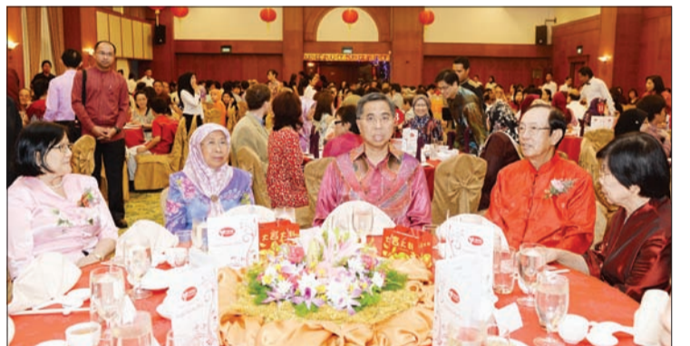
MENTERI Kesihatan, Yang Berhormat Pehin Orang Kaya Johan Pahlawan Dato Seri Setia Awang Haji Adanan bin Begawan Pehin Siraja Khatib Dato Seri Setia Awang Haji Mohd. Yusof semasa hadir selaku tetamu kehormat pada Majlis Sambutan Tahun Baru Cina Kementerian Kesihatan.

Persembahan Kaligrafi Cina, Pukulan Gendang dan Wu Shu serta cabutan bertuah khusus untuk para jemputan turut menyerikan majlis.