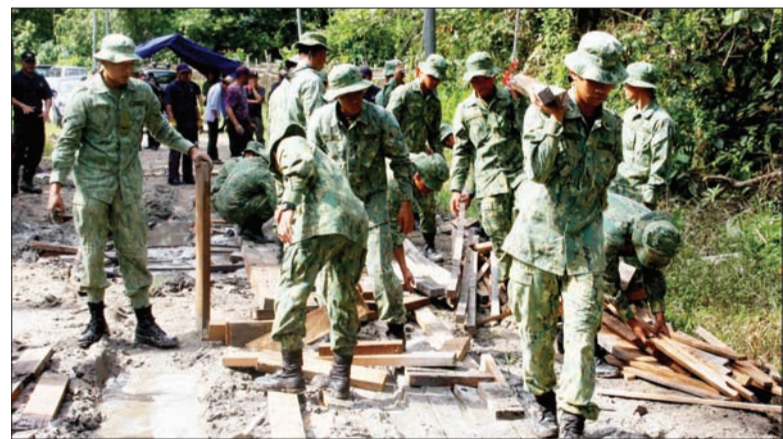
ANGGOTA Angkatan Bersenjata Diraja Brunei bergotong royong melaksanakan kerja-kerja fasa pertama pemulihan jalan di Jalan Singap.