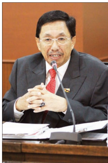
Oleh : Rohani Haji Abdul Hamid

teras yang berkaitan dengan tanggungjawab Kementerian Kebudayaan, Belia dan Sukan (KKBS), satu sesi Muzakarah Bersama Ahli-Ahli Majlis Mesyuarat Negara (MMN) diadakan di Dewan Persidangan, Stadium Negara Hassanal Bolkiah, Berakas, di sini.