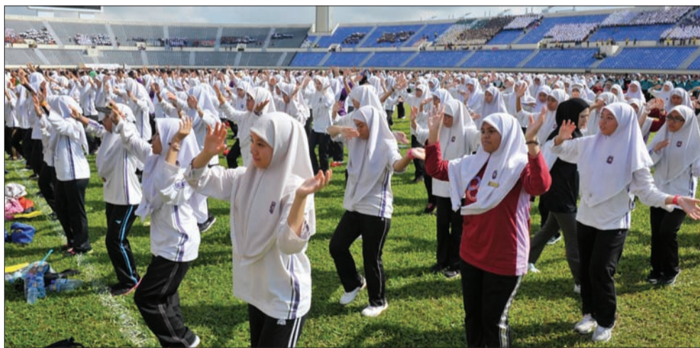
LATIHAN bagi Sambutan Hari Kebangsaan Negara Brunei Darussalam Ke-30 giat diadakan di Stadium Negara Hassanal Bolkiah dengan penyertaan dari penuntut sekolah-sekolah seluruh negara.

"Saya merasa bangga kerana dapat menyertai persembahan padang bagi memeriahkan lagi suasana Sambutan Hari Kebangsaan nanti dan ini adalah merupakan sumbangan ikhlas daripada saya sebagai rakyat Kebawah Duli Yang Maha Mulia Paduka Seri Baginda Sultan dan Yang