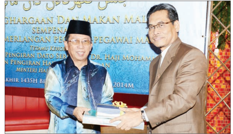
MENTERI Hal Ehwal Ugama, Yang Berhormat Pengiran Dato Seri Setia Dr. Haji Mohammad bin Pe menyampaikan sijil dan cenderahati kepada pembentang kertas kerja seminar (atas dan bawah).

YANG Berhormat Menteri Hal Ehwal Ugama menyampaikan sijil dan cenderahati kepada seorang pembentang kertas kerja seminar (kanan).