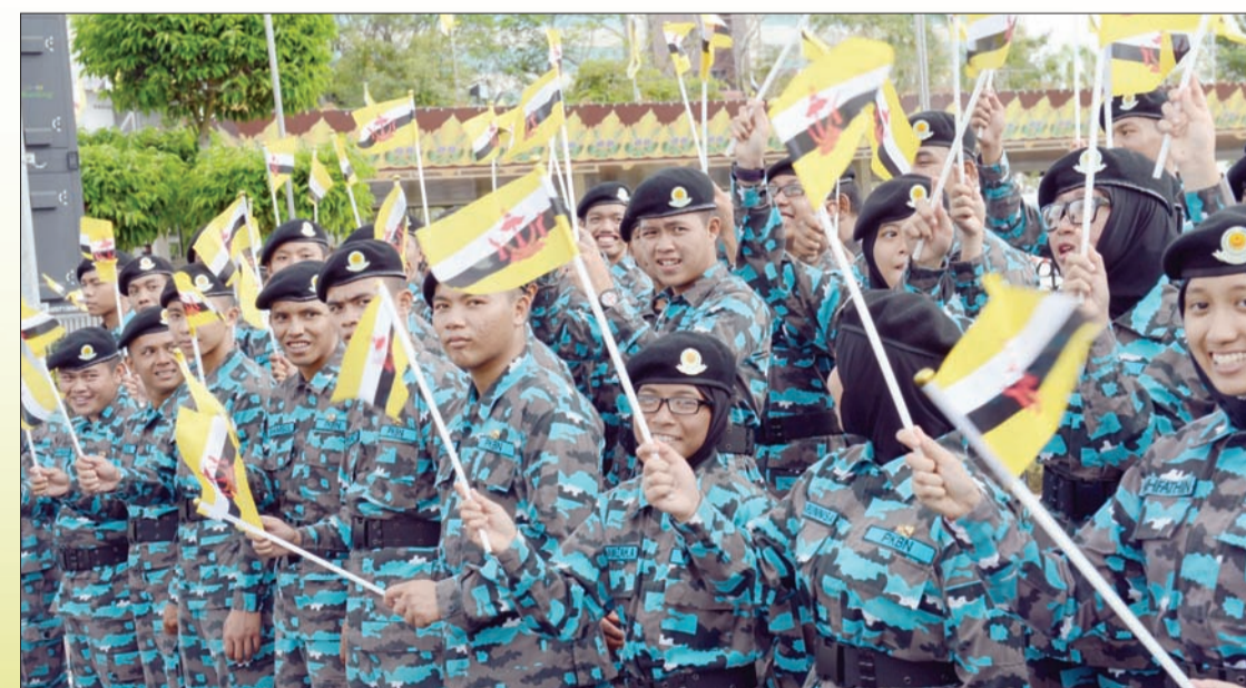
SEBAHAGIAN ahli beruniform Program Khidmat Bakti Negara (PKBN) dan pelajar-pelajar sekolah yang mengikuti dan memeriahkan Upacara Menaikkan Bendera Sempena Sambutan Ulang Tahun Hari Kebangsaan Negara Brunei Darussalam Ke-30 di kawasan lapang Kompleks YSHHB di ibu negara.