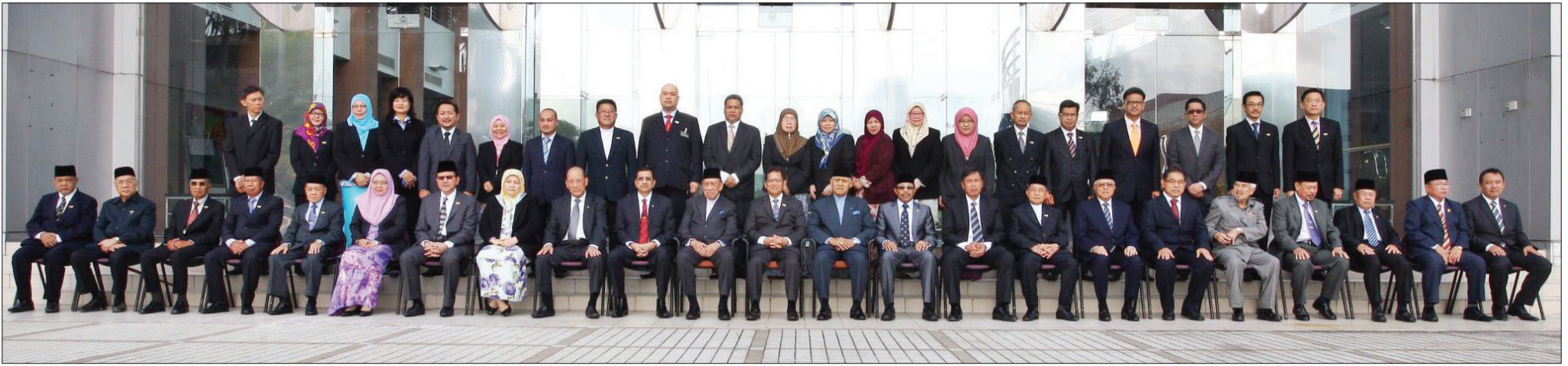
SESI bergambar ramai Yang Berhormat Menteri Pembangunan bersama Ahli-ahli MMN.

Oleh : Aimi Sani