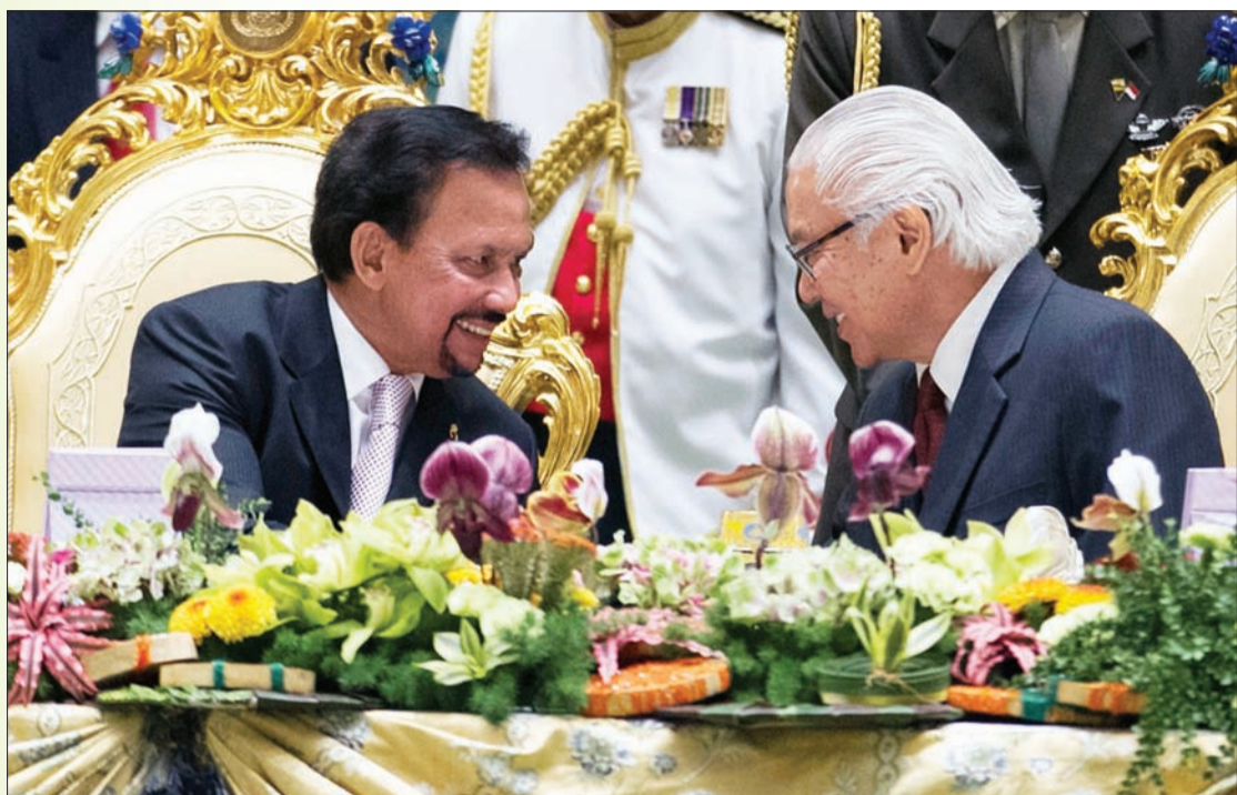
KEBAWAH Duli Yang Maha Mulia Paduka Seri Baginda Sultan Haji Hassanal Bolkiah Mu'izzaddin Waddaulah ibni Al-Marhum Sultan Haji Omar 'Ali Saifuddin Sa'adul Khairi Waddien, Sultan dan Yang Di-Pertuan Negara Brunei Darussalam ketika berkenan berbual mesra dengan Presiden Republik Singapura, Tuan Yang Terutama Dato Laila Utama Tony Tan Keng Yam pada Majlis Persantapan Negara Sempena Lawatan Rasmi Presiden Republik Singapura ke negara ini pada Mei 2013.

H UBUNGAN tradisi yang akrab antara Negara Brunei Darussalam dan Republik Singapura dalam pelbagai bidang yang mempunyai kepentingan bersama sentiasa dipelihara dan dipertingkatkan dari semasa ke semasa. Setiap ruang dan peluang dimanfaatkan oleh pelbagai peringkat termasuk sektor kerajaan, swasta dan rakyat kedua-dua buah negara.