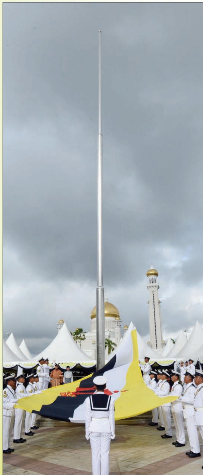
BENDERA besar Negara Brunei Darussalam di ibu negara dinaikkan oleh pasukan anggota TLDB (kiri), sementara gambar kanan, sebahagian ahli-ahli Persatuan Pengakap yang menyertai Upacara Menaikkan Bendera tersebut.