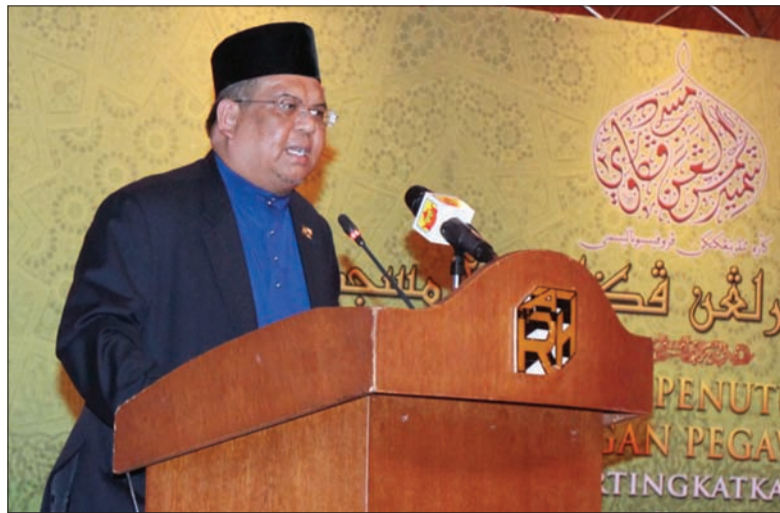
TIMBALAN Menteri Hal Ehwal Ugama, Yang Mulia Pengiran Dato Paduka Haji Bahrom bin Pengiran Haji Bahar berucapa pada Majlis Penutup Seminar Kecemerlangan Pegawai-Pegawai Masjid.

BANDAR SERI BEGAWAN, Rabu, 5 Februari. - Masjid memainkan peranan penting di dalam perkembangan kehidupan umat Islam. Untuk menjadikan masjid itu sebagai pusat pembangunan ummah yang unggul, ianya perlulah dimakmurkan dan diisikan dengan berbagai-bagai program yang boleh menjadi daya penarik kepada para jemaah dan orang ramai untuk sentiasa berkunjung ke masjid.