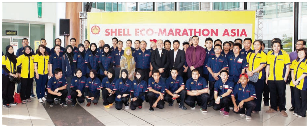
PASUKAN dari Negara Brunei Darussalam yang akan mengambil bahagian di acara Shell Eco-Marathon (SEM) 2014 dalam sesi bergambar ramai sejour sebelum bertolak ke Manila.

BANDAR SERI BEGAWAN, Selasa, 4 Februari. - Seramai 35 wakil Negara Brunei Darussalam yang dibahagikan