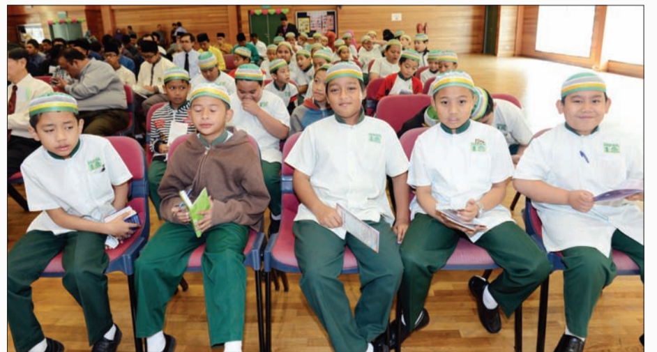
PARA pelajar juga turut mendengar Taklimat Mengenai Perintah Kanun Hukuman Jenayah Syari'ah.