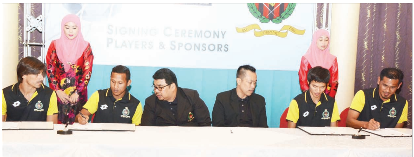
PENGURUS Kelab dan Pengurus Pasukan Kelab Bolasepak DPMM semasa menandatangani kontrak perjanjian pemain bagi Kelab Bolasepak DPMM musim 2014.

Perlawanan pertama pembuka tirai bagi Kelab Bolasepak DPMM akan bermula pada 22 Februari di gelanggang luar dengan melayani pasukan Albirex Niigata dan pada 28 Februari bermain di gelanggang sendiri untuk berhadapan dengan pasukan Warriors FC.