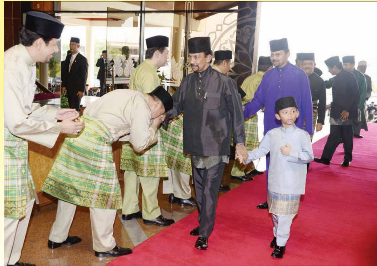
BANDAR SERI BEGAWAN, Selasa, 27 Ogos. – Sambutan Hari Raya Aidilfitri anjuran Yayasan Sultan Haji Hassanal Bolkiah (YSHHB) mencerminkan jalinan kemersaan dan keakraban raja yang dikasihi bersama rakyat.

Sehubungan itu, Kebawah Duli Yang Maha Mulia Paduka Seri Baginda Sultan Haji Hassanal Bolkiah Mu'izzaddin Waddaulah ibni Al-Marhum Sultan Haji Omar 'Ali Saifuddien Sa'adul Khairi Waddien, Sultan dan Yang Di-Pertuan Negara Brunei Darussalam berkenan berangkat ke Majlis Sambutan Hari Raya Aidilfitri 1434 Hijriah/2013 Masihi anjuran Yayasan Sultan Haji Hassanal Bolkiah (YSHHB) di Pusat Persidangan Antarabangsa (ICC), Berakas, di sini.