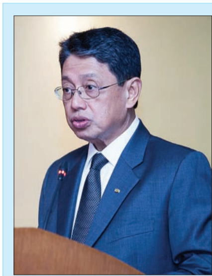
MENTERI Perindustrian dan Sumber-Sumber Utama, Yang Berhormat Pehin Orang Kaya Seri Utama Dato Seri Setia Awang Haji Yahya bin Begawan Mudim Dato Paduka Haji Bakar, dalam Majlis Seminar On Measurements In Daily Life pada hari Isnin 18 Syawal 1431 bersamaan dengan 26 Ogos 2013, di Goldstone Ballroom, Centrepoint Hotel.

keselamatan masyarakat dan perlindungan pengguna tidak terjejas.