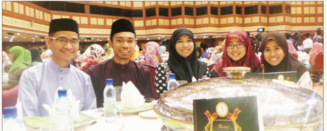
PENUNTUT- penuntut dari Institute Teknologi Brunei.