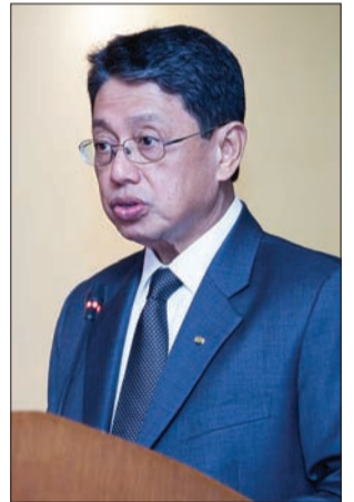
MENTERI Perindustrian dan Sumber-Sumber Utama, Yang Berhormat Pehin Orang Kaya Seri Utama Dato Seri Setia Awang Haji Yahya bin Begawan Mudim Dato Paduka Haji Bakar semasa menyampaikan ucapan pada Seminar Mengenai Sukatan Dalam Kehidupan Harian (Seminar On Measurements In Daily Life)

Peningkatan pembangunan makmal ini, kata Yang Berhormat, akan dapat mendukung dasar kerajaan dalam memastikan aktiviti-aktiviti perniagaan dan eksport bagi industri-industri serta pengusaha-pengusaha tempatan melalui Standard Sukatan Kebangsaan yang mempunyai pengiktirafan di peringkat antarabangsa.