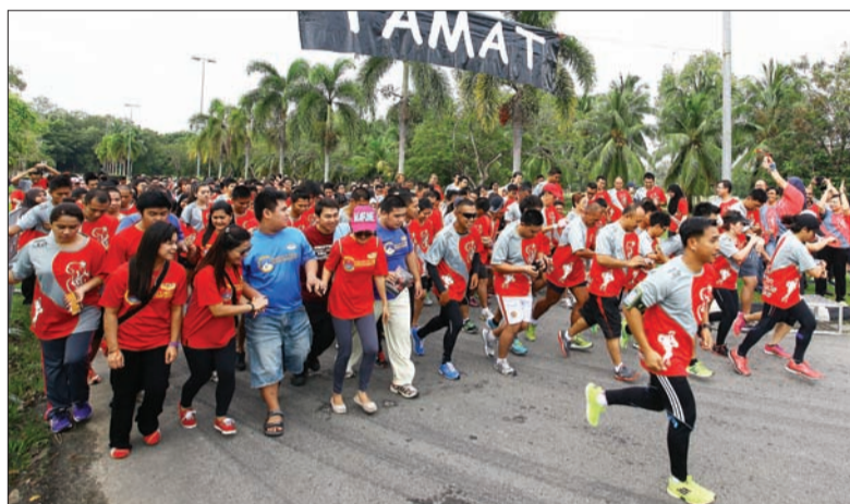
SEJAUH empat kilometer bagi acara larian bebas Perniagaan Ekonomik dan Polisi Pengajian kali ini yang bermula dan berakhir di Stadium Negara Hassanal Bolkihah.

Oleh : Abdullah Asgar