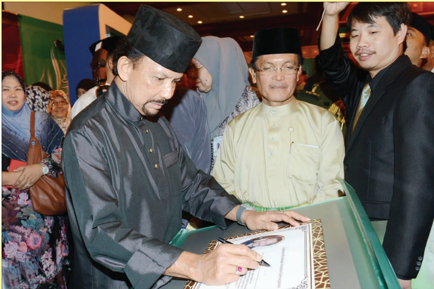
KEBAWAH Duli Yang Maha Mulia Paduka Seri Baginda Sultan Haji Hassanal Bolkiah Mu'izzaddin Waddaulah ibni Al-Marhum Sultan Haji Omar 'Ali Saifuddien Sa'adul Khairi Waddien, Sultan dan Yang Di-Pertuan Negara Brunei Darussalam berkenan menandatangani lembaran kenangan sempena keberangkatan dan Pameran ICT di Sambutan Hari Raya Aidilfitri Tahun 1434H anjuran Yayasan Sultan Haji Hassanal Bolkiah di Pusat Persidangan Antarabangsa, Berakas. (Lagi berita dan gambar-gambar dimuatkan ke muka 12, 13 dan 24).