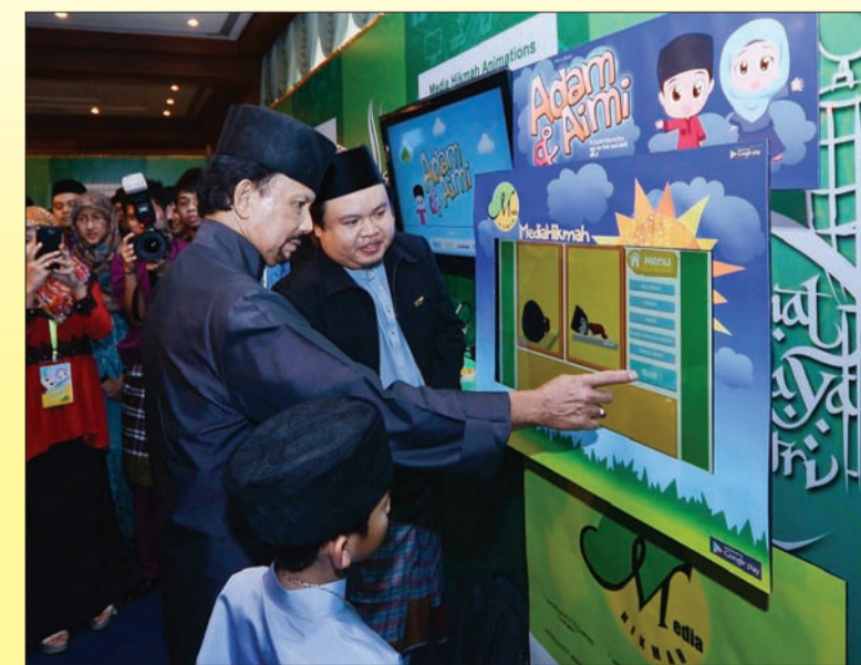
BAGINDA tertarik dengan pameran salah sebuah syarikat ICT yang mempamerkan produknya sempena sambutan Hari Raya Yayasan SHHB.

Pada majlis tahun ini, seramai 1,200 peserta terdiri daripada para pengusaha, persatuan, pelajar dan individu yang bergiat dalam sektor ICT diketengahkan oleh YSHHB.