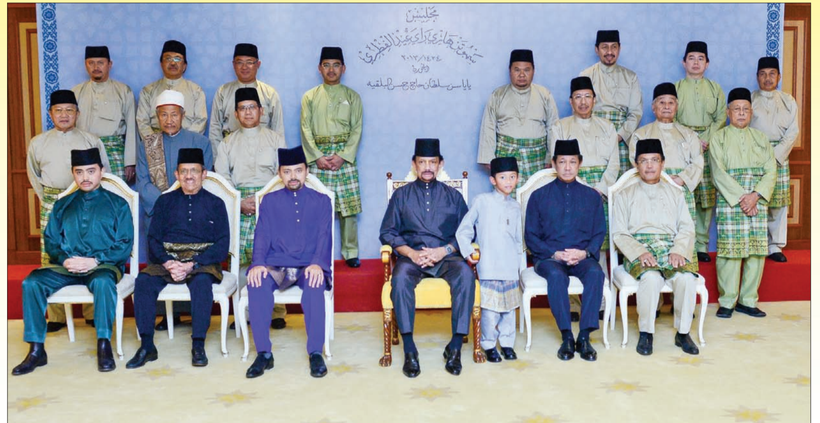
syuarat Negara, Setiausaha-Setiausaha Tetap, Timbalan-Timbalan Setiausaha Tetap serta pegawai-pegawai kerajaan dan swasta yang selama ini terlibat dalam menajayakan projek dan aktiviti YSHHB.

Juga berangkat dan hadir pada dalam majlis tersebut ialah Pengiran-Pengiran Cheteria, Menteri-Menteri Kabinet, Timbalan-Timbalan Menteri, Ahli-Ahli Majlis Me-