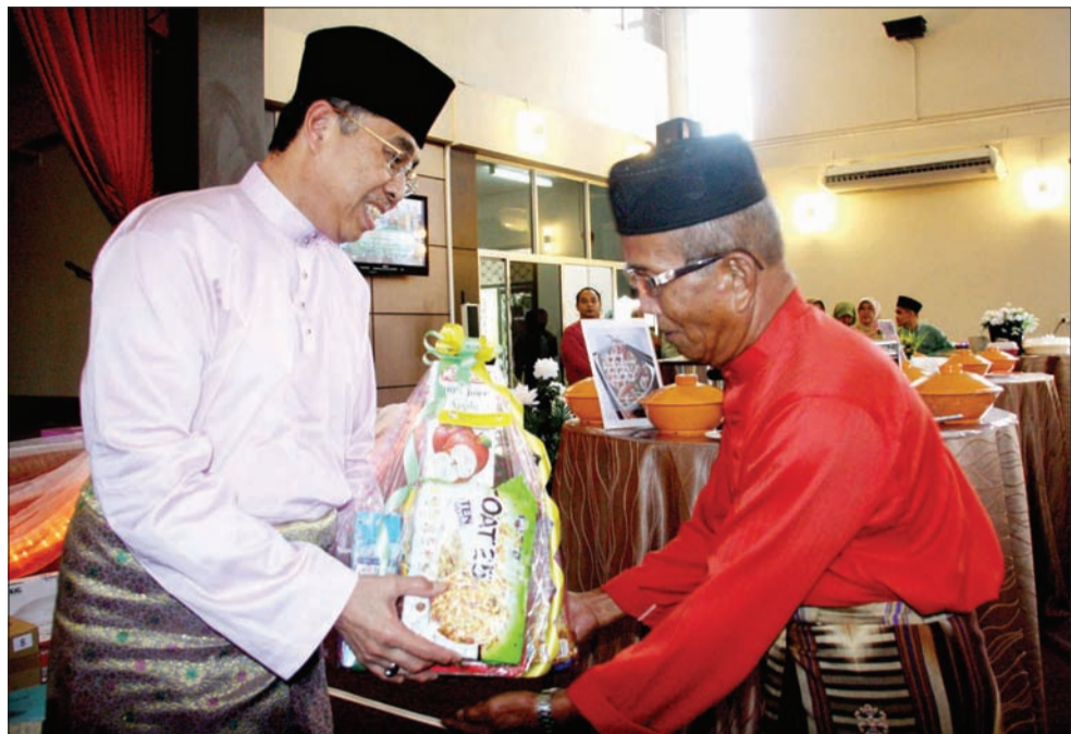
MENTERI Kesihatan, Yang Berhormat Pehin Orang Kaya Johan Pahlawan Dato Seri Setia Awang Haji Adanan bin Begawan Pehin Siraja Khatib Dato Seri Setia Awang Haji Mohd. Yusof menyampaikan hamper kepada warga emas (mantan pegawai dan kakitangan Hospital Suri Seri Begawan (HSSB), Kuala Belait).