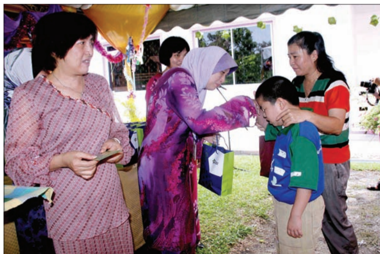
KANAK-KANAK berkeperluan khas gembira menerima cenderahati Hari Raya sumbangan DST.