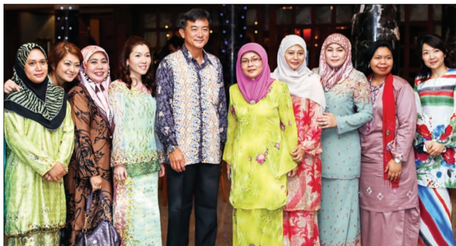
SEBAHAGIAN daripada pegawai dan kakitangan yang menghadiri Majlis Sambutan Hari Raya Aidilfitri 2013 berkenaan.

Pusat berkenaan menyasarkan untuk menjadi sebuah pusat cemerlang di rantau ini dengan mengekalkan reputasi dan piawaian yang tinggi dalam memberikan perkhidmatan kepada para pelanggannya.