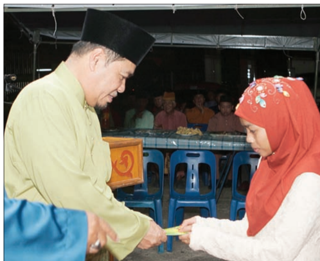
TETAMU kehormat menyempurnakan sumbangan derma kepada penduduk kampung.

Oleh : Khartini Hamir