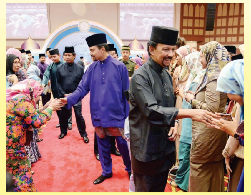
BAGINDA berkenan menerima junjung ziarah dan beramah mesra dengan peserta yang terdiri para peserta dari beberapa buah 'Syarikat Telekomunikasi, syarikat-syarikat ICT, sekolah/maktab serta beberapa buah syarikat/persatuan ICT yang berkaitan. (bawah)