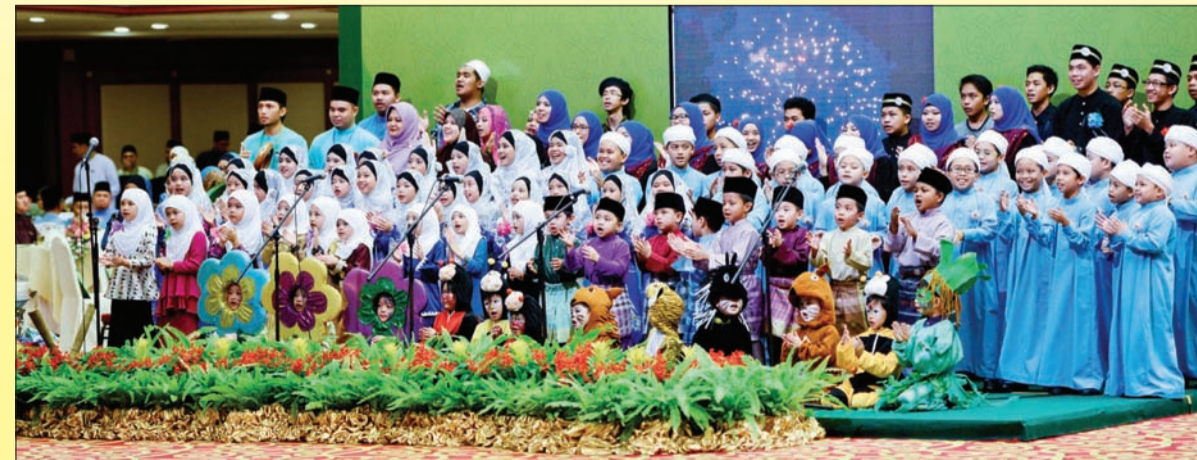
PERSEMBAHAN menarik dan mengagumkan dari sebahagian pelajar-pelajar Sekolah Yayasan Sultan Haji Hassanal Bolkiah (gabungan Taman Asuhan Kanak-Kanak, Sekolah Rendah dan Sekolah Menengah) di Sambutan Hari Raya Yayasan SHHB.