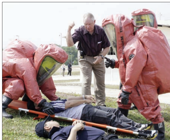
PARA anggota pasukan keselamatan dan agensi-agensi berkaitan semasa mengikuti Latihan Chemical, Biological, Radiological, Nuclear and Explosive (CBRNe).