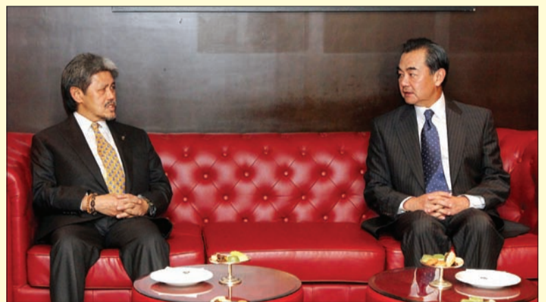
BEIJING, REPUBLIK RAKYAT CHINA, Selasa, 27 Ogos. - Duli Yang Teramat Mulia Paduka Seri Pengiran Perdana Wazir Sahibul Himmah Wal-Waqar Pengiran Muda Mohamed Bolkiah ibni Al-Marhum Sultan Haji Omar 'Ali Saifuddin Sa'adul Khairi Waddien, Menteri Hal Ehwal Luar Negeri dan Perdagangan dan Menteri Hal Ehwal Luar Negeri Republik Rakyat China, Tuan Yang Terutama Wang Yi malam ini mengadakan perjumpaan di sebuah hotel terkemuka di Beijing bagi membincangkan pelbagai isu dua hala dan hubungan ASEAN-China.