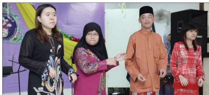
PELAJAR-PELAJAR Pusat Ehsan dan MPP SMSH semasa membuat persembahan hiburan nyanyian dan tarian Hari Raya.

Pusat Ehsan Al-Ameerah Al-Hajjah Maryam adalah sebuah badan amal kebajikan bukan kerajaan dan tidak berasaskan keuntungan, menyediakan pembelajaran khas yang bermutu, latihan, pemedulian dan perkhidmatan pemulihan anggota kepada insan-insan istimewa di Negara Brunei Darussalam.