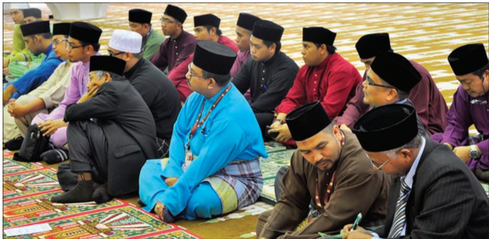
SEBAHAGIAN mahasiswa Kolej Universiti Perguruan Ugama Seri Begawan (KUPU SB) hadir dalam Majlis Solat Sunat Hajat.

BANDAR SERI BEGAWAN , Khamis, 25 April. - Kolej Universiti Perguruan Ugama Seri Begawan (KUPU SB) mengadakan Majlis Solat Sunat Hajat bagi mahasiswa yang menghadapi peperiksaan akhir Semester II yang dijadualkan berjalan selama dua minggu, bermula 6 Mei 2013 hingga 19 Mei 2013.