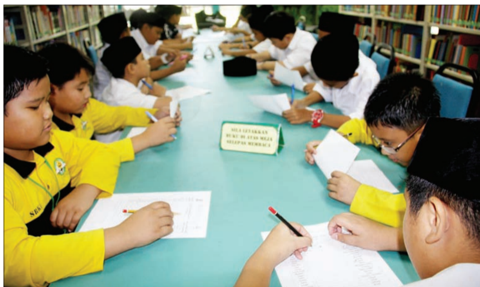
MURID-MURID Sekolah Rendah Kuala Belait mengikuti aktiviti bermain ejaan berupa memadankan perkataan seerti Bahasa Melayu Baku dengan Bahasa Melayu Brunei.