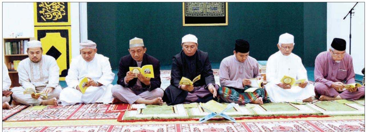
LAWATAN diselenggarakan dengan membaca Ratib Al-Attas, membaca Surah Yaa Siin dan beberapa acara keagamaan.

dimulakan dengan Sembahyang Fardu Maghrib Berjemaah, membaca Ratib Al-Attas dan bacaan Al-Qur'an dengan tafsirnya sebelum diteruskan dengan Sembahyang Fardu Isyak diikuti dengan persembahan Rawi oleh Kumpulan Muslimah Masjid Pengiran Muda Abdul Wakeel.