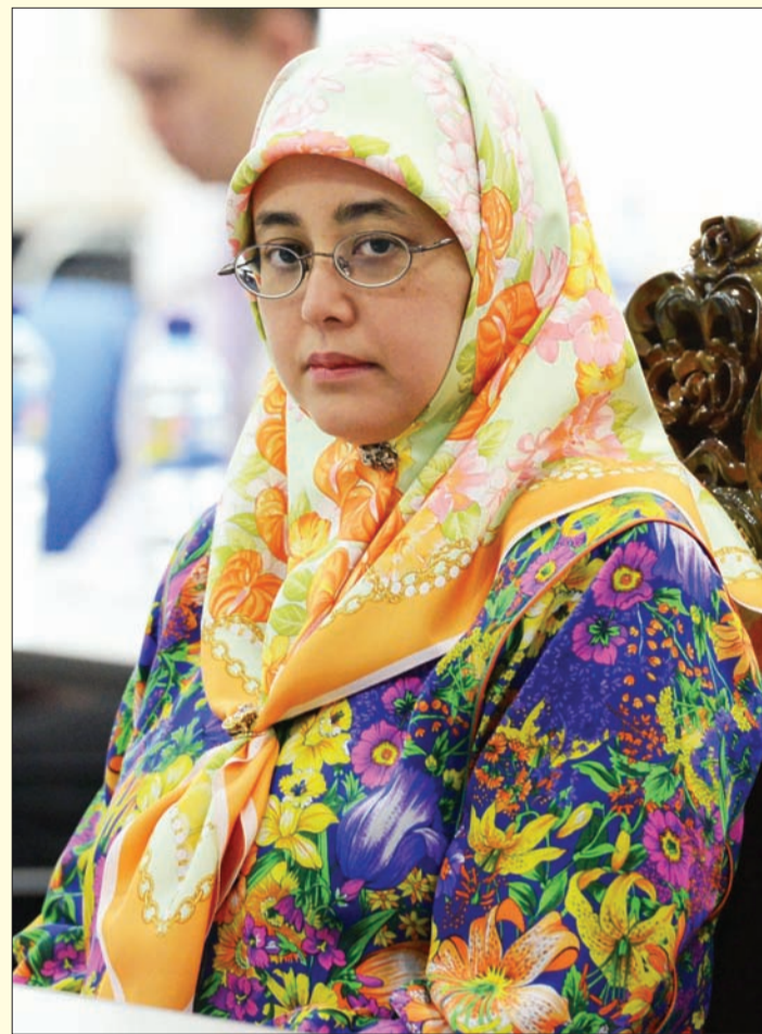
YANG Teramat Mulia Paduka Seri Pengiran Anak Puteri Hajah Muta-Wakkilah Hayatul Bolkiah binti Kebawah Duli Yang Maha Mulia Paduka Seri Baginda Sultan Haji Hassanal Bolkiah Mu'izzaddin Waddaulah berkenan berangkat pada Sambutan Hari Harta Intelekt Sedunia (World IP Day) bertempat di Dewan Jubli Emas, Tingkat 2, Bangunan Undang-Undang dan Mahkamah-Mahkamah, Pejabat Peguam Negara.

Peserta bengkel didedahkan mengenai perjanjian antarabangsa yang ber-