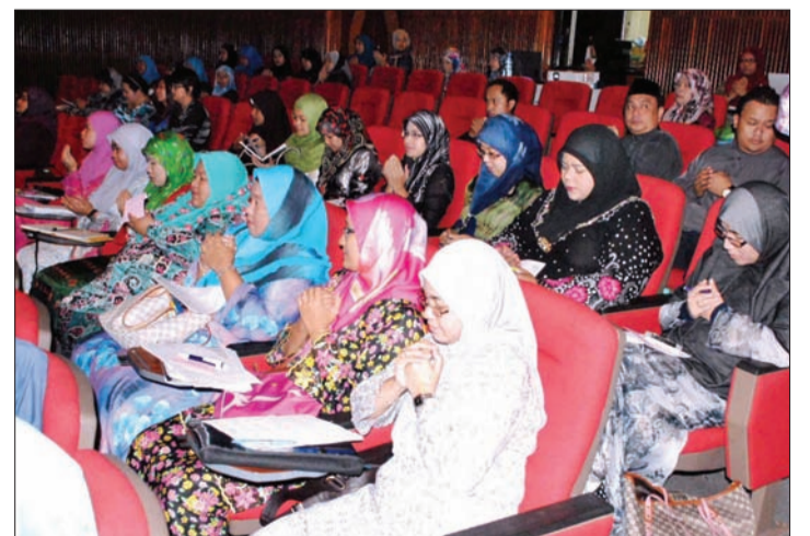
GURU-GURU besar dan penolong guru besar serta guru-guru Bahagian Literasi dan Numerasi menghadiri Majlis Penyelidikan Data Literasi dan Numerasi Panaga.

Beliau berkata, Sekolah Rendah Panaga merupakan penggerak utama yang menggunakan kaedah tersebut dan pada majlis tersebut, guru-guru sekolah berkenaan berkongsi sama dengan guru-guru dari sekolah lain bagaimana cara membuat kaedah berkenaan.