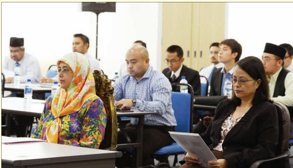
YANG Teramat Mulia berkenan berangkat pada Sambutan Hari Harta Intelekt Sedunia (World IP Day).

Oleh : Khartini Hamir, Siti Zaleha Haji Jalil