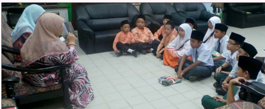
ANTARA para murid yang menyertai aktiviti-aktiviti yang disediakan oleh Perpustakaan Dewan Bahasa dan Pustaka Temburong bersempena Sambutan Hari Buku Sedunia 2013.

Di samping itu, dengan adanya sambutan seumpamanya diharap akan dapat memasyarakatkan budaya membaca dan membudayakan mesra perpustakaan serta merealisasikan pembelajaran sepanjang hayat ke arah melahirkan masyarakat Brunei yang berilmu, bermaklumat dan berpengetahuan.