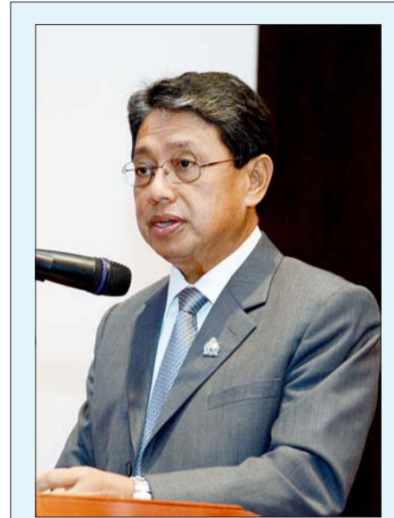
MENTERI Perindustrian dan Sumber-Sumber Utama, Yang Berhormat Pehin Orang Kaya Seri Utama Dato Seri Setia Awang Haji Yahya bin Begawan Mudim Dato Paduka Haji Bakar semasa berucap dalam Majlis Pembukaan Kursus Pengenalan ISO 9001:2008 bagi Kementerian Perindustrian dan Sumber-Sumber Utama (KPSSU) pada hari Selasa, 14 Jamadilawal 1434 bersamaan 26 Mac 2013, bertempat di Dewan Setia Pahlawan, KPSSU.

“MENYENTUH kepada inisiatif untuk mengungkayahkan pelaksanaan ISO 9001:2008, saya melihat perkara ini sangat mustahak. Ianya akan dapat mewujudkan persekitaran dan budaya kerja yang kondusif, berkualiti tinggi serta memberikan motivasi kepada pegawai dan kakitangan untuk sentiasa menghasilkan perkhidmatan yang cemerlang, cekap dan teratur.”