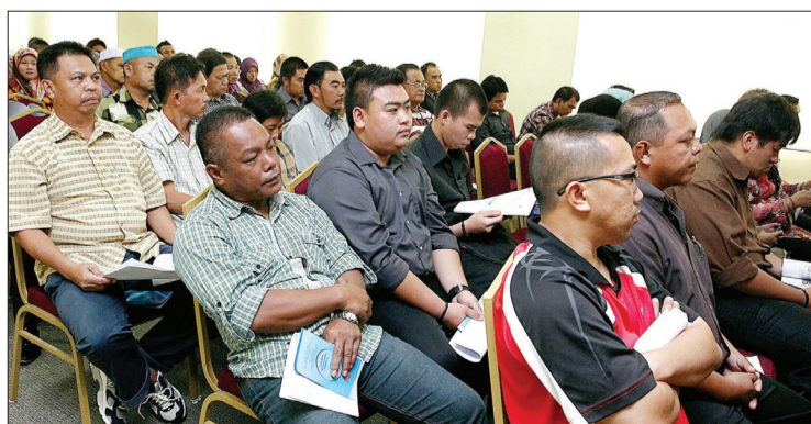
SEBAGIAN pencari kerja tempatan yang berdaftar di APTK, Kementerian Hal Ehwal Dalam Negeri mendengarkan taklimat.

Dengan adanya skim sedemikian akan turut membantu dalam mengurangkan jumlah pencari kerja tempatan berkelulusan rendah dan tiada kemahiran serta dapat mengurangkan jumlah pengangguran di negara ini selain mengurangkan ketergantungan majikan kepada pekerja asing dan sebaliknya memberikan peluang pekerjaan kepada anak-anak tempatan.