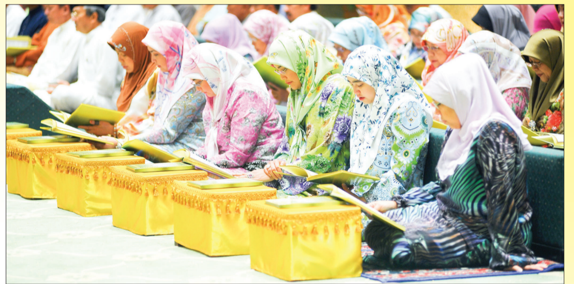
GAMBAR-GAMBAR merakamkan suasana dalam Majlis Khatam Al-Qur'an 66 Kali Khatam Ahli-ahli MPMK Seluruh Negara Sempena Sambutan Perayaan Ulang Tahun Hari Keputeraan Kebawah DYMM Ke-66 di Dewan Persantapan Diraja, Istana Nurul Iman.