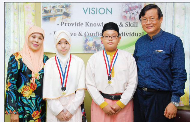
KEDUA-DUA pelajar yang memenangi pertandingan tersebut.

BANDAR SERI BEGAWAN, Selasa, 31 Julai. - Tiga pelajar Tahun 6 daripada Sekolah Yayasan Haji Hassanah Bolkiah (YSHHB) berjaya mengharumkan nama sekolah berkenaan dengan memenangi Pertandingan Sains dan Matematik Olimpiad Peringkat Kebangsaan 2012.