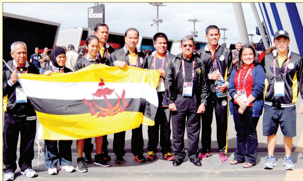
DULI Yang Teramat Mulia Paduka Seri Pengiran Bendahara Seri Maharaja Permaisua Pengiran Muda Haji Sufri Bolkiah ibni Al-Marhum Sultan Haji Omar 'Ali Saifuddien Sa'adul Khairi Waddien, Presiden Majlis Olimpik Kebangsaan Negara Brunei Darussalam (BDNOC) berkenan bergambar bersama atlet negara yang menyertai Sukan Olimpik London Ke-XXX.