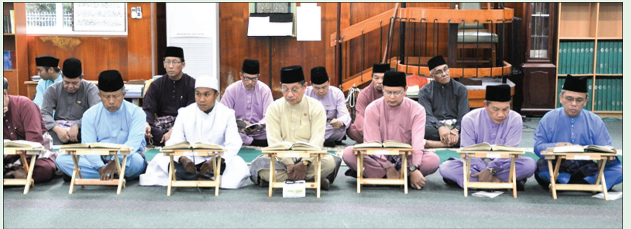
MENTERI Hal Ehwal Dalam Negeri, Yang Berhormat Pehin Udana Khatib Dato Paduka Seri Setia Ustaz Haji Awang Badaruddin bin Pengarah Dato Paduka Haji Awang Othman semasa hadir dalam Majlis Tadarus dan Ceramah Tafsir Tadarus Al-Qur'an Bulan Ramadan.