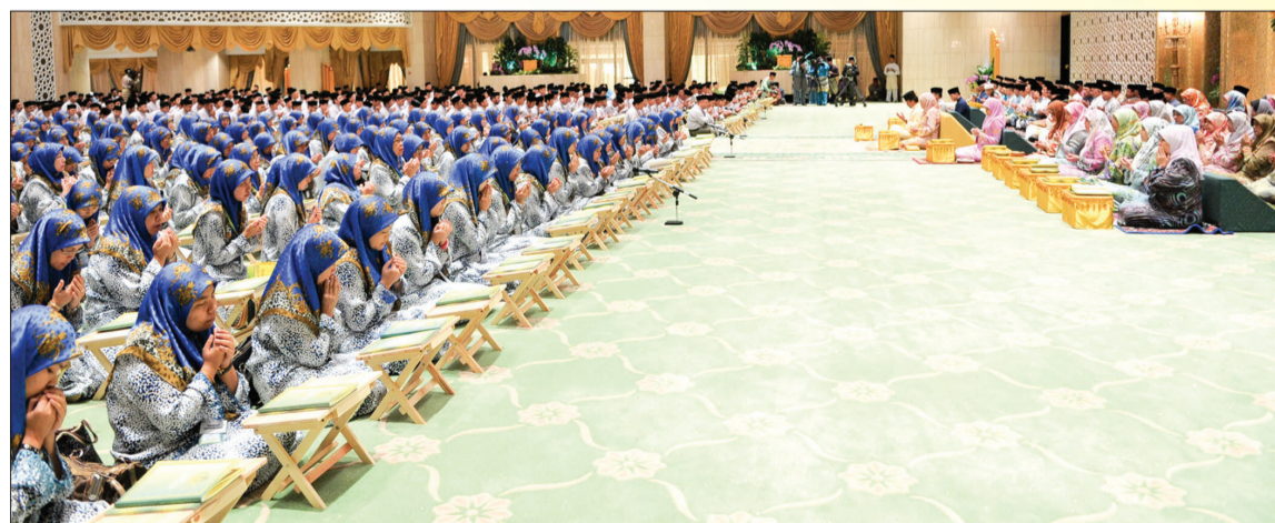
BACAAN Khatam Al-Qur'an beramai-ramai oleh para peserta seramai 1,056 orang pada Majlis Khatam Al-Qur'an 66 Kali Khatam Ahli-Ahli MPMK Seluruh Negara.