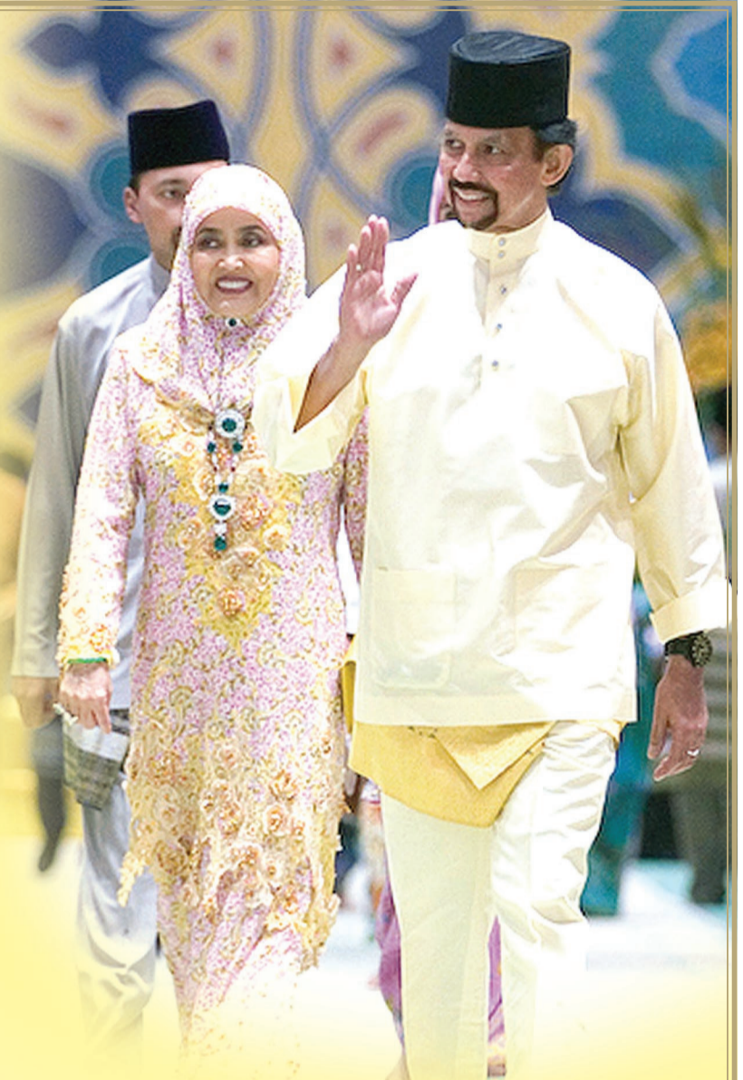
KEBAWAH Duli Yang Maha Mulia Paduka Seri Baginda Sultan Haji Hassanal Bolkiah Mu'izzaddin Waddaulah ibni Al-Marhum Sultan Haji Omar 'Ali Saifuddin Sa'adul Khairi Waddien, Sultan dan Yang Di-Pertuan Negara Brunei Darussalam dan Kebawah Duli Yang Maha Mulia Paduka Seri Baginda Raja Isteri Pengiran Anak Hajah Saleha binti Al-Marhum Pengiran Pemancha Pengiran Anak Haji Mohamed Alam ketika berkenan berangkat ke Majlis Khatam Al-Qur'an 66 Kali Khatam Ahli-Ahli Majlis Perundangan Mukim dan Kampung (MPMK) Seluruh Negara Sempena Sambutan Perayaan Ulang Tahun Hari Keputeraan Kebawah Duli Yang Maha Mulia Ke-66.

Majlis Pelancaran Bagi Memulakan Bacaan Al-Qur'an bagi peserta-peserta berkenaan bagi setiap daerah bermula serentak pada 29 Februari 2012 selepas Sembahyang Fardu Maghrib Berjemaah di masjid-masjid terpilih dan masing-masing telah menyelesaikan pembacaan sebanyak 30 juzuk Al-Qur'an setiap seorang peserta pada 14 Julai 2012.