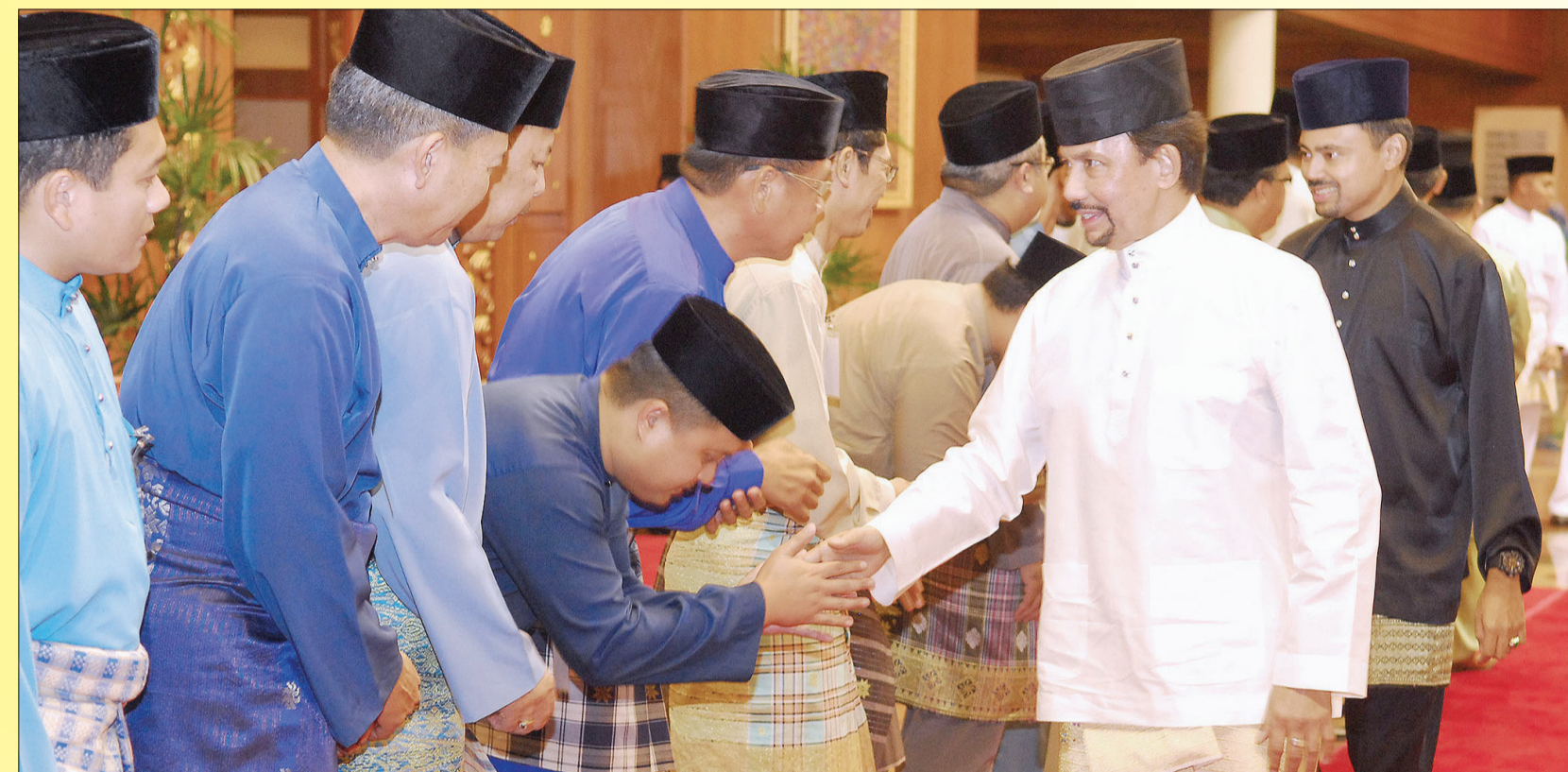
KEBAWAH Duli Yang Maha Mulia Paduka Seri Baginda Sultan Haji Hassanal Bolkiah Mu'izzaddin Waddaulah ibni Al-Marhum Sultan Haji Omar 'Ali Saifuddien Sa'adul Khairi Waddien, Sultan dan Yang Di-Pertuan Negara Brunei Darussalam berkenan berangkat ke Majlis Sambutan Nuzul Al-Qur'an Peringkat Negara Bagi Tahun 1433 Hijriah

BANDAR SERI BEGAWAN , Ahad, 5 Ogos. - Kebawah Duli Yang Maha Mulia Paduka Seri Baginda Sultan Haji Hassanal Bolkiah Mu'izzaddin Waddaulah, Sultan dan Yang Di-Pertuan Negara Brunei Darussalam berkenan menyempurnakan penganugerahan hadiah-hadiah kepada para pemenang Pertandingan Menghafaz Al-Qur'an Berserta Pemahamannya Peringkat Akhir Kebangsaan Tahun 1433 Hijriah dalam Majlis Sambutan Nuzul Al-Qur'an Peringkat Negara berlangsung di Dewan Plenary, Pusat