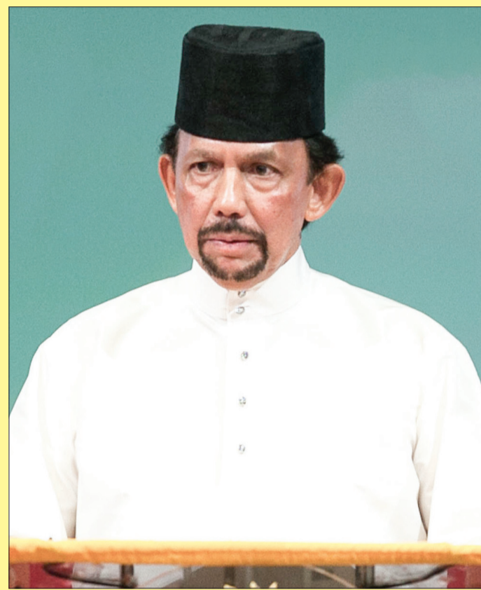
KEBAWAH Duli Yang Maha Mulia Paduka Seri Baginda Sultan Haji Hassanal Bolkiah Mu'izzaddin Waddaulah ibni Al-Marhum Sultan Haji Omar 'Ali Saifuddien Sa'adul Khairi Waddien, Sultan dan Yang Di-Pertuan Negara Brunei Darussalam ketika bertitah dalam Majlis Sambutan Nuzul Al-Qur'an Tahun 1433 Hijriah / 2012 Masihi.