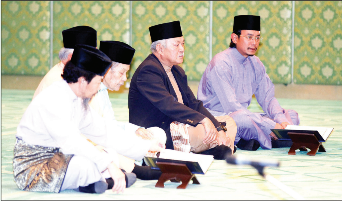
MAJLIS Khatam Al-Qur'an dilangsungkan di hadapan Yang Amat Mulia Pengiran Maharaja Setia Laila Diraja Sahibul Irshad Pengiran Anak Haji Abdul Rahim bin Pengiran Indera Mahkota Pengiran Anak (Dr.) Kemaludin Al-Haj.