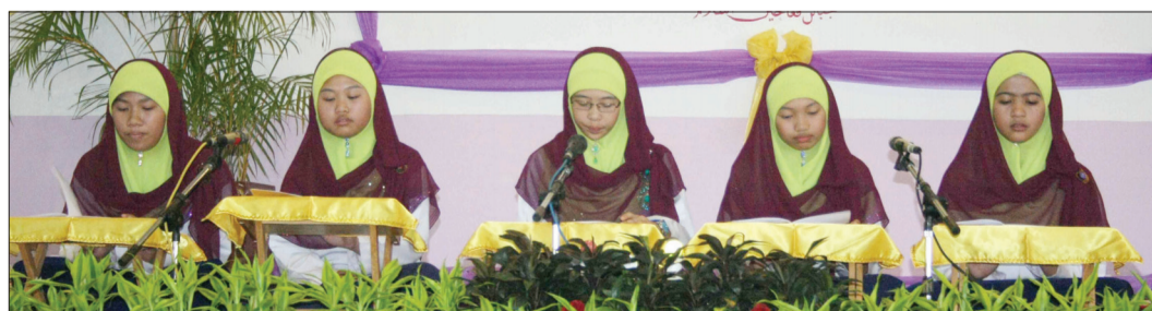
SEBHAGIAN peserta bagi Kategori Kumpulan Perempuan ketika mengumandangkan Dikir Syarafil Anam.

tahunan JPI, Kementerian Hal Ehwal Ugama sejak tahun 1996 bertujuan sebagai usaha untuk mengembangkan Dikir Brunei dan mengenalkannya kepada generasi baru serta menggalakkan pelajar-pelajar untuk membiasakan diri dengan warisan Islam Brunei.