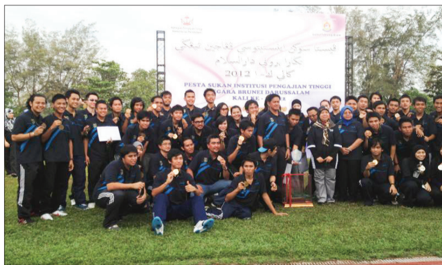
ANTARA pasukan yang menyertai Pesta Sukan Institusi Pengajian Tinggi (IPT) Negara Brunei Darussalam Kali Pertama 2012.

Di samping dapat memberikan kerjasama yang erat dengan institusi-institusi pengajian tinggi yang lain di negara ini terutama dalam bidang akademik, penyediaan dan kepakaran bagi memastikan sektor pengajian tinggi akan terus berkembang maju dan relevan dengan tuntutan semasa dan akan datang.