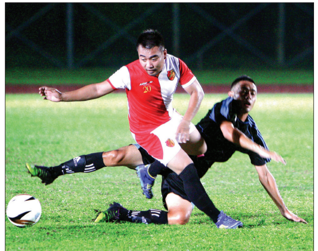
PEMAIN FC Phosphor (jersi merah putih) berjaya merampas bola daripada pemain MS PDB (jersi biru tua) dalam Kejohanan Bola Sepak Piala FA-DST 2011-2012 yang berlangsung di Kompleks Balapan dan Padang.

Pasukan yang menang layak mara ke pusingan kedua namun yang kalah terpaksa bergigit jari.