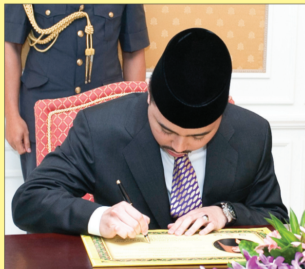
YTM berkenan menandatangani lembaran keberangkatan.

Mu'izzaddin Waddaulah berkenan berangkat merasmikan Pelancaran Persidangan Kebangsaan Ejaan Jawi. Keberangkatan Yang Teramat Mulia di Dewan Indera Samudera, The Empire