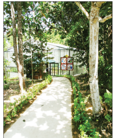
JALAN masuk menuju ke Taman Kulimambang.

Walaupun bagaimanapun lawatan ke taman ini adalah tertakluk kepada kebenaran pengurus taman dan keadaan cuaca pada hari tersebut. Faktor masa dan kebenaran pengurus mesti diambil berat bagi menjaga kesejahteraan semua pihak dan