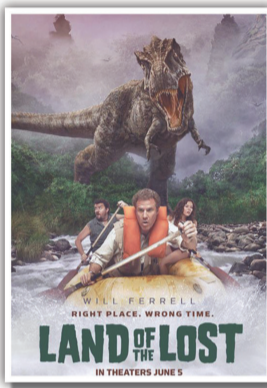
LAND OF THE LOST Mega Movie di RTB3 HD