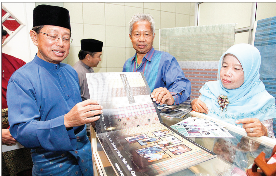
YANG Berhormat semasa menyaksikan kehalusan kain tenunan Brunei yang dibukukan di sebuah petak pameran sempena Hari Pelanggan KPSSU dan Jabatan-Jabatan Di Bawahnya Tahun 2012.