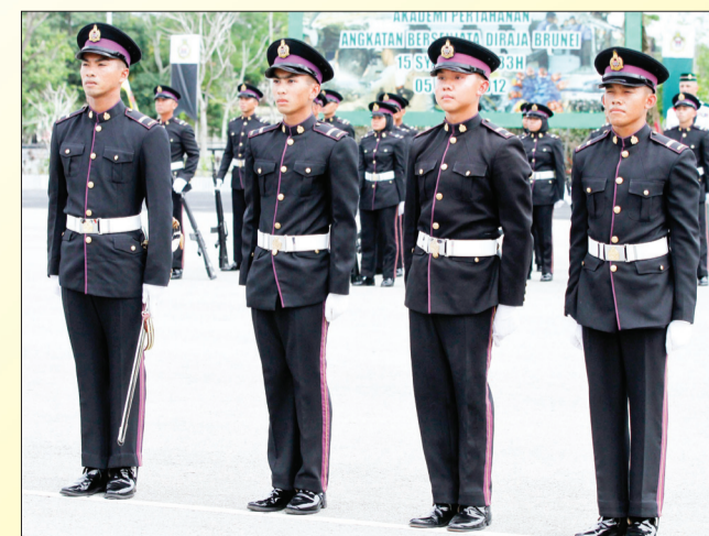
ANTARA Pegawai-pegawai Kadet Terbaik Pengambilan Ketujuh.