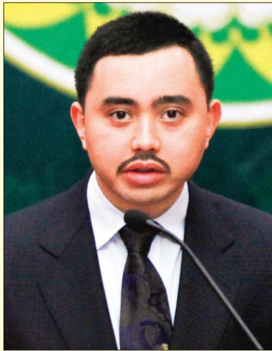
YANG Teramat Mulia Paduka Seri Duli Pengiran Muda 'Abdul Malik ibni Kebawah Duli Yang Maha Mulia Paduka Seri Baginda Sultan Haji Hassanal Bolkiah Mu'izzaddin Waddaulah ketika bersabda pada Majlis Pelancaran Pengagihan Kurma Kurnia Peribadi Kebawah Duli Yang Maha Mulia Paduka Seri Baginda Sultan Haji Hassanal Bolkiah Mu'izzaddin Waddaulah, Sultan dan Yang Di-Pertuan Negara Brunei Darussalam sempena bulan Ramadan 1433 Hijriah 2012 Masih pada hari Selasa, 13 Syaaban 1433H bersamaan 3 Julai 2012M di Dewan Canselor Universiti Brunei Darussalam.

Dengan itu, insya-Allah, kita akan dapat menjalani ibadah puasa dengan penuh bertenaga dan memiliki risiko kesihatan