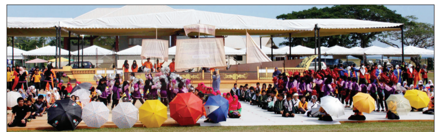
PERSEMBAHAN dari Dearah Belait bertajuk 'Menyusur Tamadun Ilmu'.

Keamanan dan kemakmuran di negara ini setentunya akan dapat sentiasa ditanai dan dipertingkatkan lagi oleh rakyat dan penduduk sebagai tanda syukur ke hadrat Allah Subhanahu Wata'ala dan menjunjung kasih ke hadapan majlis baginda yang adil dan bijaksana, memimpin negara selaku payung tempat seluruh rakyat dan penduduk berlindung.