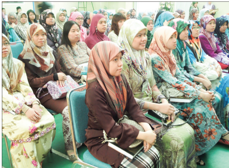
SEBAHAGIAN para mahasiswa yang menghadiri Perkampungan Sivik Mahasiswa Negara Brunei Darussalam Seberang Laut 2012.