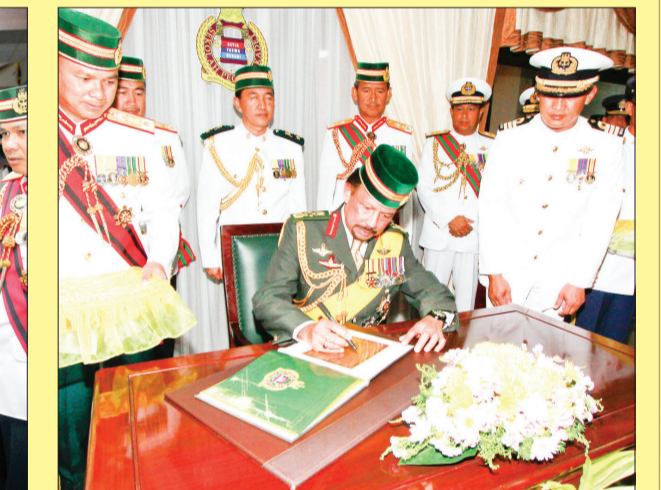
TERTARIK ... Kebawah Duli Yang Maha Mulia berkenan menyaksikan pameran berkonsepkan teknologi moden yang menggambarkan perjalanan Pegawai-pegawai Kadet daripada Pegawai Kadet sehingga menjadi seorang pegawai yang bertauliah (atas kiri dan bawah kiri), sementara gambar atas tengah, baginda berkenan beramah mesra dengan seorang Pegawai Kadet, manakala atas kanan, baginda berkenan menandatangani Lembaran Kenangan Diraja dan buku perjalanan Pegawai-pegawai Kadet. Gambar-gambar bawah tengah dan kanan, baginda berkenan bergambar kenangan dan beramah mesra dengan sebahagian ahli keluarga dan Pegawai-pegawai Kadet.