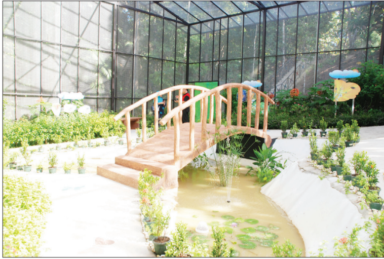
SUASANA di dalam Taman Kulimambang.