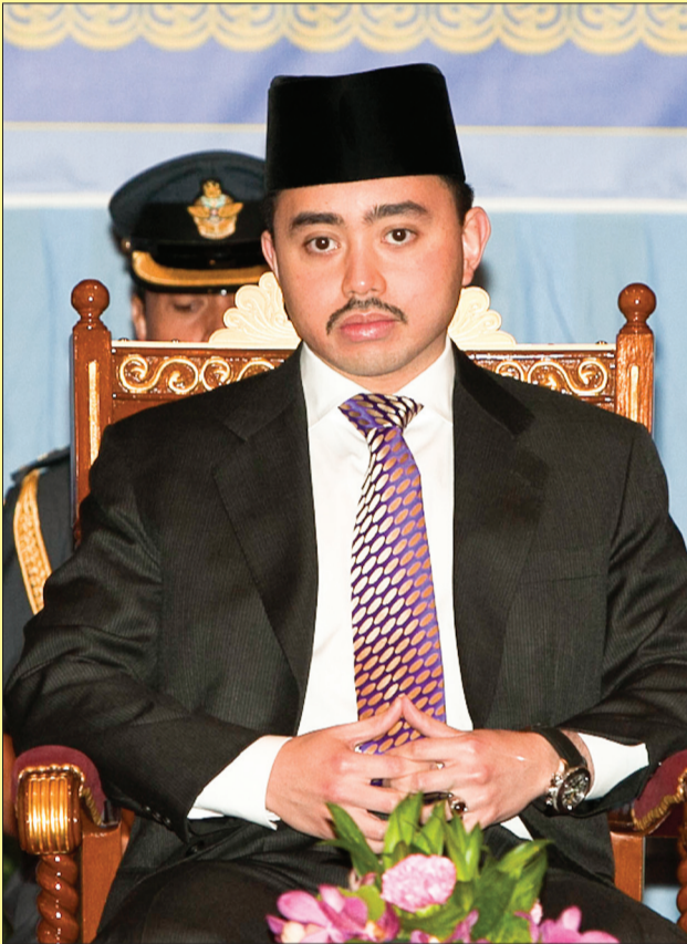
YANG Teramat Mulia berangkat dalam majlis tersebut.

Oleh : Abdullah Asgar