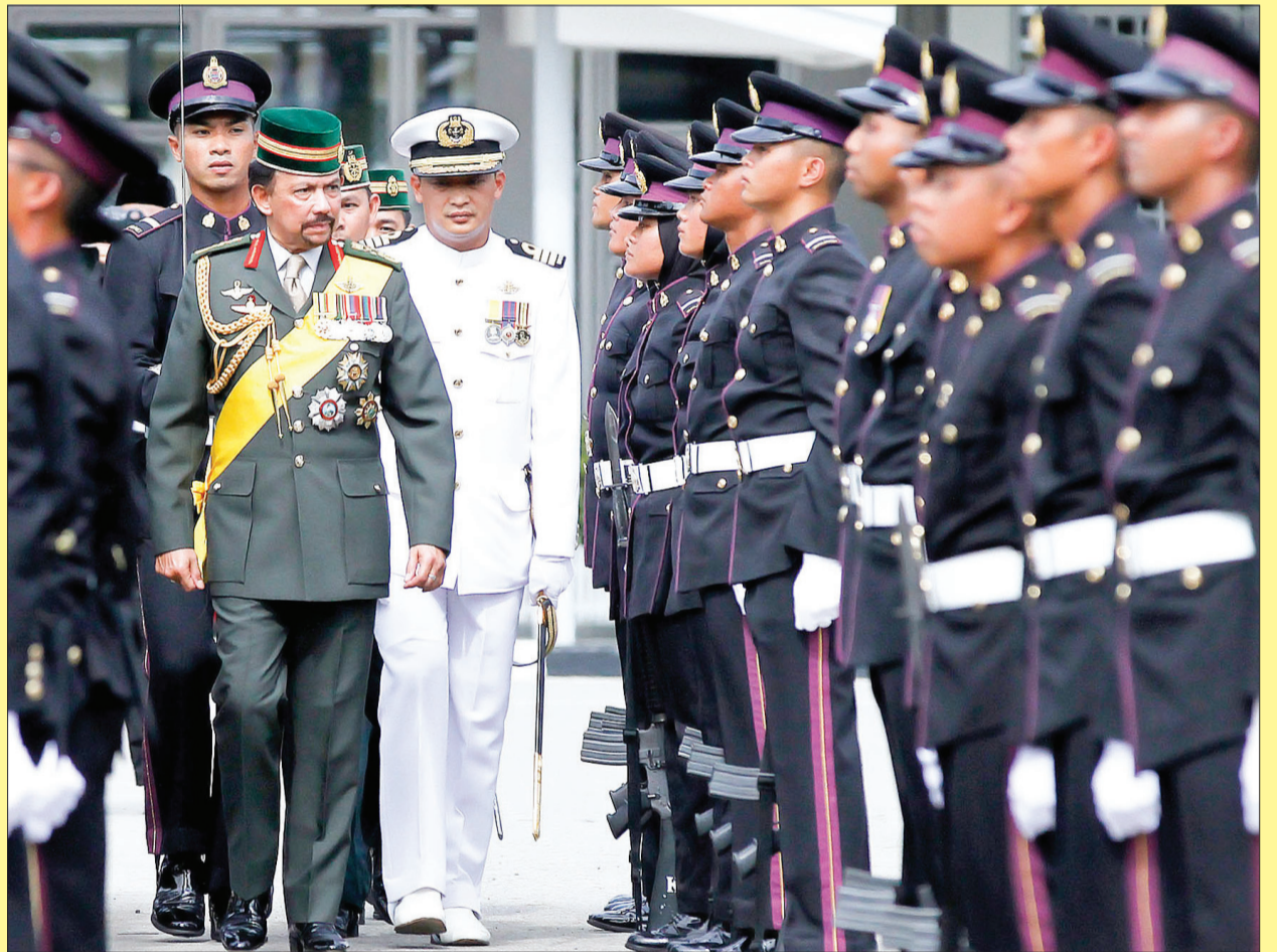
KEBAWAH Duli Yang Maha Mulia Paduka Seri Baginda Sultan Haji Hassanal Bolkiah Mu'izzaddin Waddaulah ibni Al-Marhum Sultan Haji Omar 'Ali Saifuddin Sa'adul Khairi Waddien, Sultan dan Yang Di-Pertuan Negara Brunei Darussalam, Menteri Pertahanan dan Pemerintah Tertinggi Angkatan Bersenjata Diraja Brunei (ABDB) ketika memeriksa barisan Pegawai Kadet Lelaki dan Perempuan dalam Upacara Sovereign's Parade Sekolah Pegawai Kadet Akademi Pertahanan ABDB Pengambilan Ketujuh. - (Lagi berita dan gambar-gambar ke muka 12 & 13.)