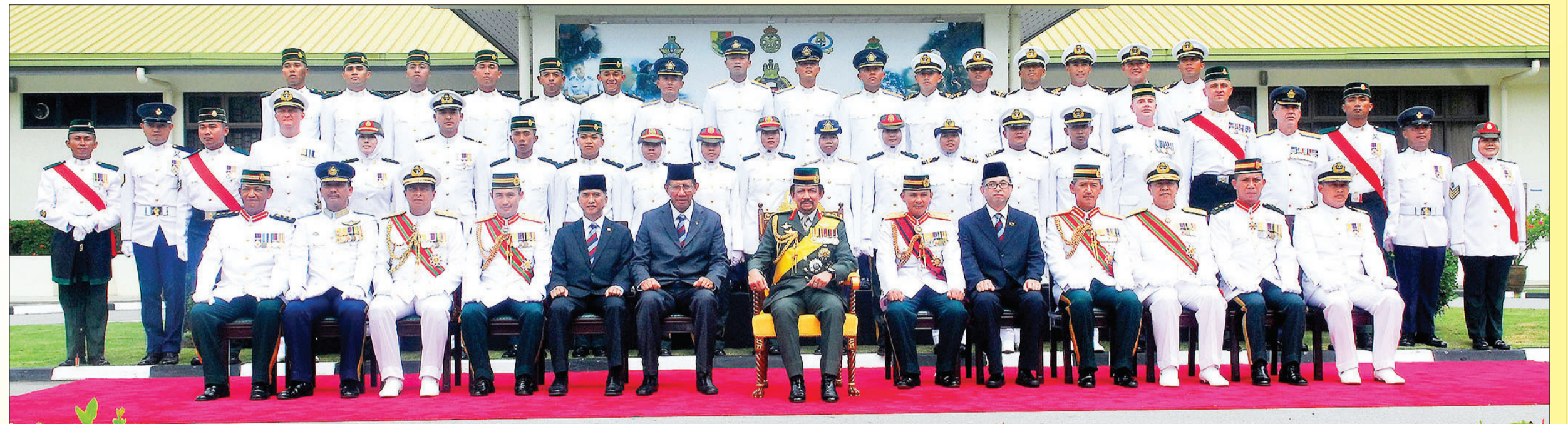
KEBAWAH Duli Yang Maha Mulia Paduka Seri Baginda Sultan dan Yang Di-Pertuan Negara Brunei Darussalam, Menteri Pertahanan dan Pemerintah Tertinggi ABDB merakamkan bergambar ramai bersama pegawai ABDB pada Upacara Sovereign's Parade Sekolah Pegawai Kadet Akademi Pertahanan ABDB Pengambilan Ketujuh.

Selain itu, Pegawai Kadet yang menerima anugerah tersebut juga mempunyai ciri-ciri keseluruhan yang mantap dan contoh terbaik dari segi komitmen, kepimpinan serta menunjukkan keperibadian yang positif dari awal hingga akhir latihan Pegawai Kadet di Sekolah Pegawai Kadet ABDB.