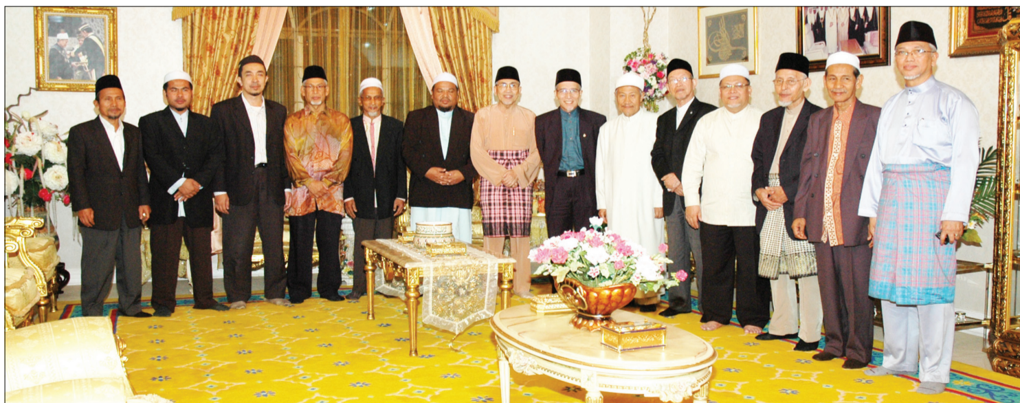
ROMBONGAN delegasi Negeri Kelantan, Darul Naim bergambar ramai bersama Mufti Kerajaan Negara Brunei Darussalam ketika diraikan pada Majlis Jamuan Makan Malam di kediaman rumah Yang Berhormat di Kampung Mulaut.

Jabatan Mufti Kerajaan, Jabatan Perdana Menteri (JPM) selaku tuan rumah lawatan Kerja Ilmiah delegasi JMNK DN ke negara ini menyifatkan lawatan tersebut berjaya meningkatkan jalinan hubungan silaturahim dan akan menjana pelbagai faedah daripada pertukaran fikiran dalam perkara ilmiah dan membuka pintu peluang untuk berkerjasama dalam bidang ilmu dan maklumat Islam yang setentunya akan melahirkan manfaat langsung kepada Jabatan Mufti Kerajaan, JPM, bukan sahaja untuk kefungsiannya, mengeluarkan fatwa dan irsyad, bahkan juga untuk agenda ilmunya iaitu mengumpul, mengembang dan menyebarkan ilmu Islam termasuk fatwanya. Semuanya itu sangat berfaedah kepada kemandapan agama dan kebajikan umat Islam di kedua-dua buah Dar (negara) seperti Negara Brunei Darussalam dan Negeri Kelantan, Darul Naim.