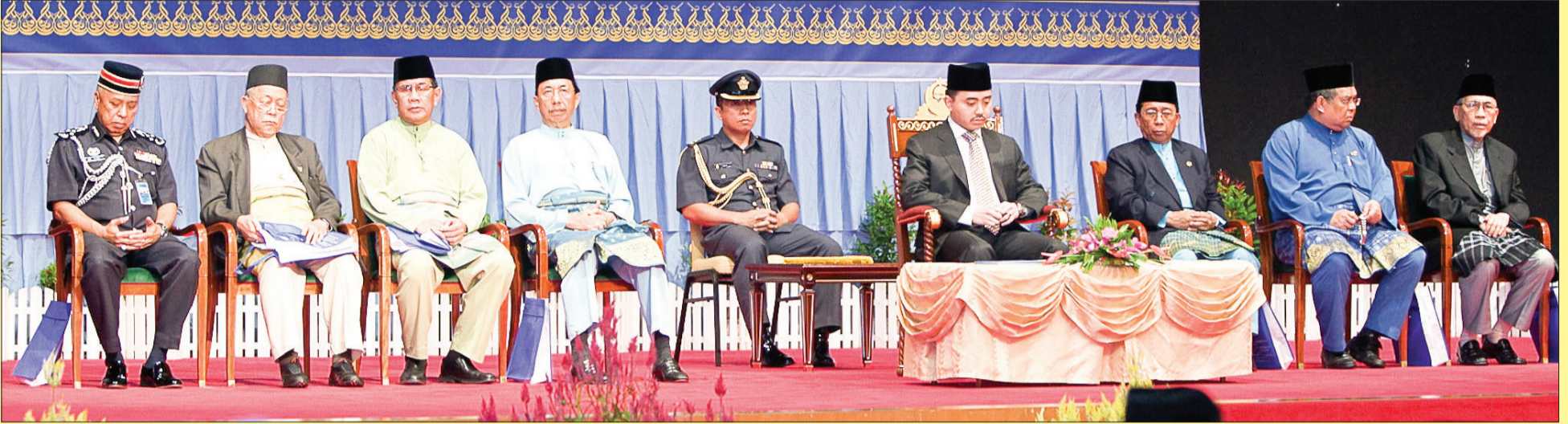
YANG Teramat Mulia Paduka Seri Duli Pengiran Muda 'Abdul Malik ibni Kebawah Duli Yang Maha Mulia Paduka Seri Baginda Sultan Haji Hassanal Bolkiah Mu'izzaddin Waddaulah berkenan berangkat merasmikan Pelancaran Persidangan Kebangsaan Ejaan Jawi.