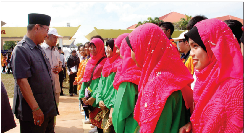
MENTERI Hal Ehwal Dalam Negeri bersama Timbalannya beramah mesra dengan peserta yang mengambil bahagian dalam acara persembahan padang yang terdiri daripada pelajar sekolah.

KUALA BELAIT, Selasa, 3 Julai. - Daerah Belait telah bersiap sedia menjunjung keberangkatan Kebawah Duli Yang Maha Mulia Paduka Seri Baginda Sultan dan Yang Di-Pertua Negara Brunei Darussalam bagi Majlis Ramah Mesra dan Junjung Ziarah Bersama Rakyat dan Penduduk Daerah Belait Sempena Sambutan Ulang Tahun Hari Keputeraan Baginda Ke-66 Tahun.