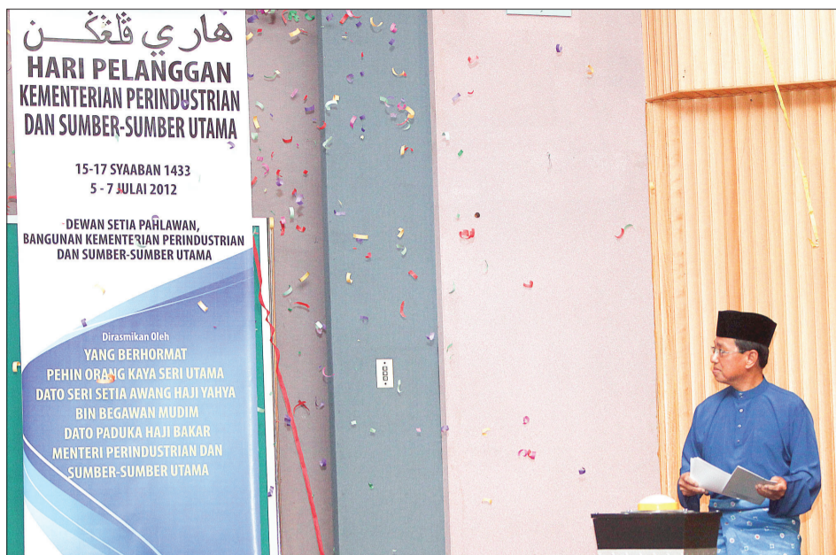
MENTERI Perindustrian dan Sumber-Sumber Utama, Yang Berhormat Pehin Orang Kaya Seri Utama Dato Seri Setia Awang Haji Yahya bin Begawan Mudim Dato Paduka Haji Bakar semasa berucap merasmikan Hari Pelanggan Kementerian Perindustrian dan Sumber-Sumber Utama (KPSSU) dan Jabatan-jabatan di bawahnya Tahun 2012.

Sambutan juga berperanan untuk meningkatkan lagi imej dan persepsi dalam kalangan para pengguna mengenai perkhidmatan-perkhidmatan di bawah kementerian dan mendapatkan maklum balas secara langsung daripada para pengunjung melalui Hari Pelanggan.