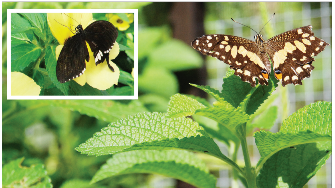
SEBAHAGIAN daripada kulimambang yang sempat dirakamkan.

Sementara itu, Menteri Kebudayaan, Belia dan Sukan ketika ditemui berkata dengan adanya taman kulimambang di taman warisan ia merupakan sebagai satu lagi tambahan tarikan kepada pelancong-pelancong dan generasi muda terutama sekali bagi penuntut sekolah. Yang Berhormat berkata, taman tersebut bukan sahaja untuk bersantai bagi mengisi masa lapang tetapi boleh memberi pelajaran mengenai ekosistem, iaitu kaitan kehidupan manusia, alam sekeliling dengan serangga. Dari taman itu, pengunjung akan dapat merasakan pentingnya kitaran hidup serangga kepada kehidupan manusia. Ilham dalam penubuhan taman ini kata Yang Berhormat merupakan sumbangan yang sangat berharga dan memberikan nilai tambah kepada Tasek Merimbun.