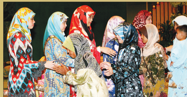
GAMBAR-GAMBAR merakamkan Kebawah Duli Yang Maha Mulia Paduka Seri Baginda Sultan Haji Hassanal Bolkiah Mu'izzaddin Waddaulah ibni Al-Marhum Sultan Haji Omar 'Ali Saifuddien Sa'adul Khairi Waddien, Sultan dan Yang Di-Pertuan Negara Brunei Darussalam dan Kebawah Duli Yang Maha Mulia Paduka Seri Baginda Raja Isteri Pengiran Anak Hajah Saleha berserta kerabat-kerabat diraja yang lain berkenan menerima mengadap dan junjung ziarah para pengunjung yang menyebarkan ucapan Selamat Hari Raya Aidilfitri ke hadapan majlis baginda serta kerabat diraja di hari ketiga Istana Nurul Iman bagi kunjungan orang ramai di sebelah pagi dan petang.