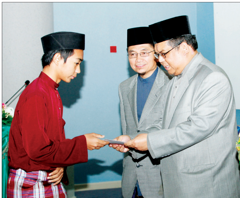
TIMBALAN Menteri Hal Ehwal Ugama, Yang Mulia Pengiran Haji Bahrom bin Pengiran Haji Bahar semasa menyampaikan sumbangan kepada seorang penerima.

Di samping itu, ianya juga membantu meringankan beban perbelanjaan anak-anak yatim dan keluarga mereka bagi membuat persediaan sambutan Hari Raya Aidilfitri yang akan menjelang tiba.