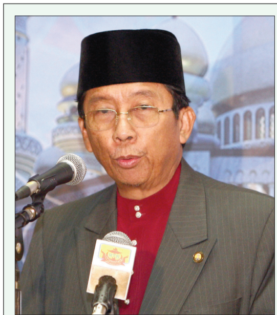
UCAPAN Menteri Hal Ehwal Ugama, Yang Berhormat Pengiran Dato Seri Setia Dr. Haji Mohammad bin Pengiran Haji Abdul Rahman di Majlis Muzakarah Kepimpinan Pegawai Masjid Seluruh Negara di Jame' 'Asr Hassanil Bolkia, Kampung Kiarong pada 8 Ramadan 1431 Hijriah / 18 Ogos 2010 Masihi.

Kita bersyukur ke hadirat Allah Subhanahu Wata'ala kerana dengan perkenan baginda untuk membuat perubahan dalam acara sambutan Israk Mikraj pada tahun ini iaitu dengan mengenalkan 'Anugerah Imam Cemerlang' dan 'Anugerah Bilal Cemerlang', mudah-mudahan dua anugerah ini akan menjadi satu motivasi yang kuat kepada para imam dan para bilal bagi meningkatkan kualiti masing-masing yang tentunya bukan sahaja untuk dicalonkan sebagai penerima-penerima anugerah tersebut di masa hadapan, tetapi yang lebih penting ialah untuk berjaya membawa angin perubahan yang diharap-harapkan supaya prestasi imam dan bilal terserlah di negara ini. Ini bukan sahaja akan turut menaikkan imej imam-imam dan bilal-bilal berkenaan, tetapi juga imej masjid berkenaan, imej kampung berkenaan di mana masjid itu berada, imej daerah berkenaan,