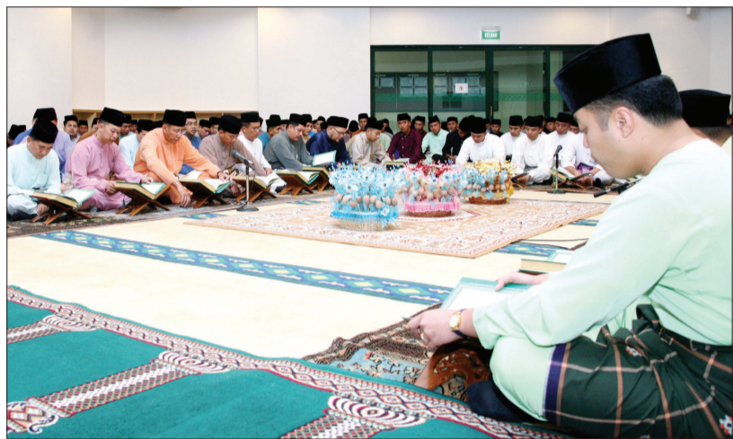
TIMBALAN Menteri Pertahanan, Yang Mulia Dato Paduka Awang Haji Mustappa antara yang hadir di Majlis Khatam Al-Qur'an bagi Kementerian Pertahanan bertempat di Surau MinDef Bolkih Garrison.

Amalan ini juga bertepatan dengan hasrat titah Kebawah Duli Yang Maha Mulia Paduka Seri Baginda Sultan dan Yang Di-Pertuan Negara Brunei yang setentunya dapat meningkatkan pengetahuan dan kemahiran dalam pembacaan Al-Qur'an serta dapat melahirkan rakyat dan penduduk yang celik Al-Qur'an.