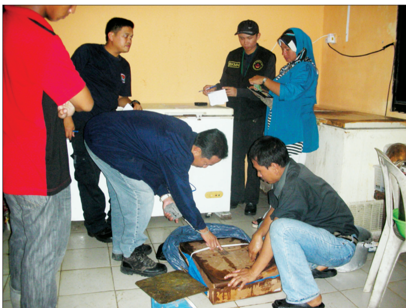
BAHAGIAN Penguatkuasaan Undang-Undang Imigresen semasa membuat serbuan ke atas sebuah restoran yang mendapati daging tongkeng ayam yang diragui kehalalannya.

Sementara Bahagian Pencegah Jabatan Kastam dan Bahagian Kawalan Makanan Halal, Jabatan Hal Ehwal Syariah telah pun mendapati kira-kira 63.5 kilo daging tongkeng ayam mentah di bahagian dapur bagi penyediaan catering, pihak restoran gagal untuk memperlihatkan