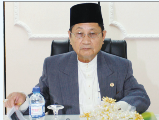
MENTERI Hal Ehwal Dalam Negeri, Yang Berhormat Pehin Udana Khatib Dato Paduka Seri Setia Ustaz Haji Awang Badaruddin bin Pengarah Dato Paduka Haji Othman ketika memberikan cadangan dan saranan di Agensi Pekerjaan Tempatan dan Pembangunan Tenaga Kerja, Jabatan Buruh.