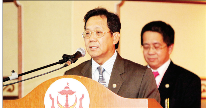
MENTERI Pembangunan, Yang Berhormat Pehin Orang Kaya Indera Pahlawan Dato Seri Setia Awang Haji Suyoi ketika berucap merasmikan Seminar Ukur Tanah Asas Pembangunan (UTAP).

Seminar kali ke-9 ini menumpukan pada beberapa metodologi menerokai teknologi geospacial untuk memaksimumkan nilai data seperti perlunya untuk berkongsi dan mengguna-