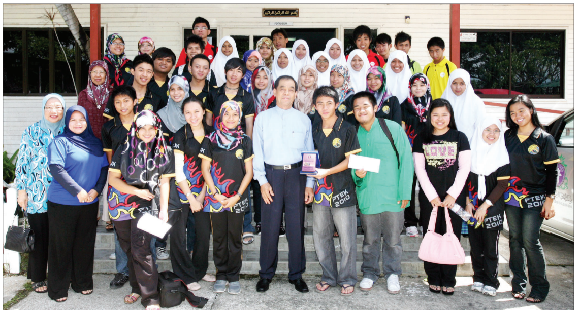
BERGAMBAR RAMAI ... Pusat Tingkatan Enam Katok ketika mengabdikan gambar kenangan semasa membuat lawatan ke Pusat Ehsan Bengkurong.

Terdahulu itu, kedua-dua pihak penyumbang telah mendengarkan taklimat ringkas mengenai latar belakang Pusat Ehsan yang disampaikan oleh Ketua Pentadbirannya, Haji Abd. Hamid bin Maaruf yang kemudian diikuti dengan melawat dan bersemuka bersama ahli-ahli anak-anak istimewa Pusat Ehsan.