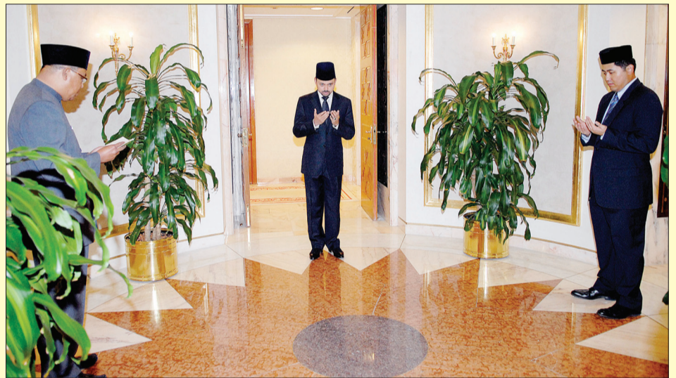
DULI Yang Teramat Mulia menadah tangan mengaminkan doa sejurus sebelum berangkat balik.

Sepanjang berada di Kuwait, DYTM telah mengadakan perjumpaan dengan beberapa orang pembesar negara, melawat mercu tanda dan berangkat melawat ke sektor perekonomian Kuwait.