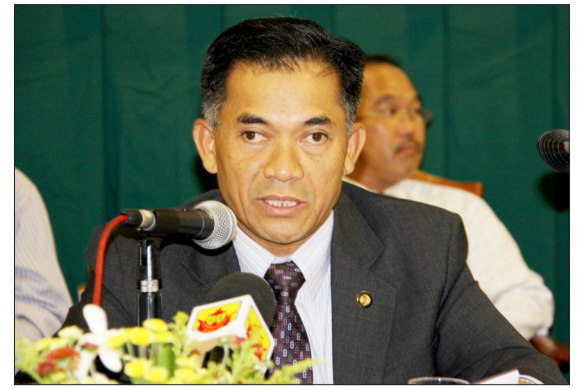
TIMBALAN Menteri Pembangunan, Yang Mulia Dato Paduka Awang Haji Ali bin Haji Apong menyampaikan ucapan di majlis tersebut.

kenakan membayar wang pendahuluan tersebut bagi menghindarkan dari bayaran tunggakan dan meringankan beban mereka membayar setiap bulan.