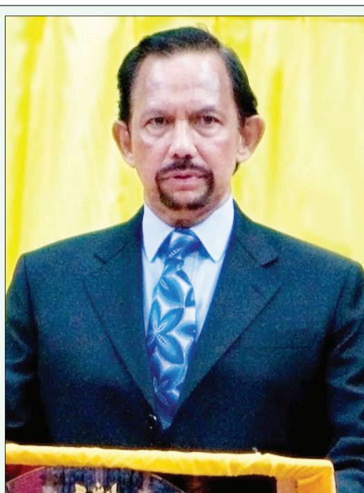
TITAH Kebawah Duli Yang Maha Mulia Paduka Seri Baginda Sultan Haji Hassanah Bolkiah Mu'izzaddin Waddaulah ibni Al-Marhum Sultan Haji Omar 'Ali Saifuddin Sa'adul Khairi Waddien, Sultan dan Yang Di-Pertuan Negara Brunei Darussalam Sempena Hari Belia Kebangsaan 2010 pada hari Isnin, 21 Syaaban 1431 H / 2 Ogos 2010 bertempat di Pusat Persidangan Antarabangsa Berakas.

Dalam pada itu, jangan lupakan garispanduan syarak, yang terimbas di dalam etika keusahawanan dan perniagaan Nabi kita, Sayyidina Muhammad Sallallahu Alaihi Wasallam. Baginda itu menangani semua ini