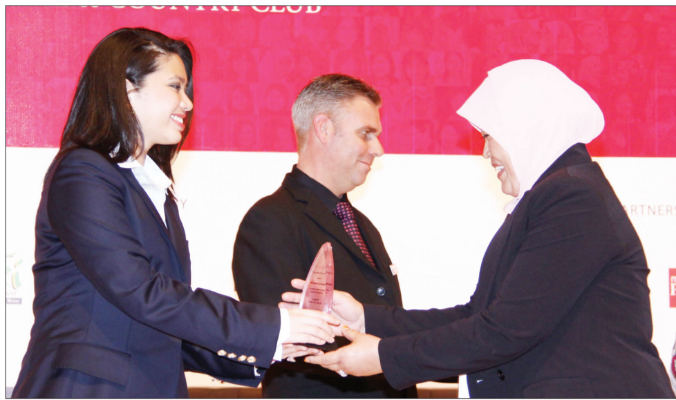
YANG Teramat Mulia Paduka Seri Pengiran Anak Puteri Fadzillah Lubabul Bolkihah menyampaikan anugerah kepada seorang pemenang.