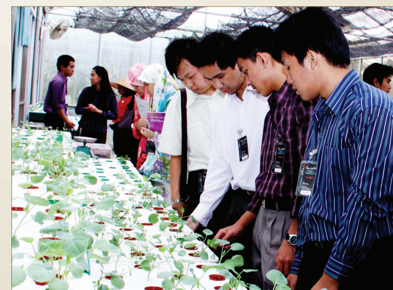
PARA mahasiswa sedang menyaksikan hasil-hasil yang terdapat di Pusat Ehsan dan melihat secara dekat kerja-kerja penghuni pusat berkenaan.

Pusat Ehsan sangat mengalu-alukan lawatan orang ramai kerana ianya dapat mendedahkan kanak-kanak istimewa berhadapan dengan para pelawat bagi meningkatkan tahap pergaulan mereka.