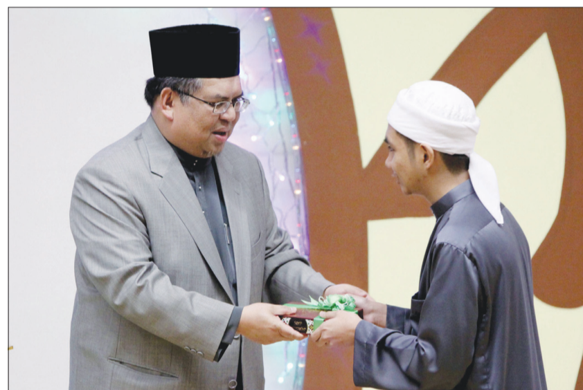
TMBALAN Menteri Hal Ehwal Ugama, Yang Mulia Pengiran Haji Bahrom bin Pengiran Haji Bahar ketika menyampaikan hadiah kepada wakil pelajar daripada Institut Tahfiz Al-Quran Sultan Haji Hassanal Bolkiah yang memperolehi keputusan cemerlang di Darul Quran, Jabatan Kemajuan Islam Malaysia, JAKIM.

Oleh itu, mereka nanti akan diterima masuk meneruskan pengajian di Tahun Pertama peringkat Takhassus di Ma'had Qiraat Shobra bagi lelaki