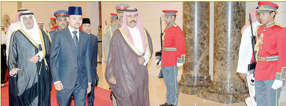
BERANGKAT ke Lapangan Terbang Antarabangsa Kuwait bagi mengucapkan selamat belayar kepada DYTM ialah Duli Yang Teramat Mulia Sheikh Nawaf Al-Ahmad Al-Jaber Al-Sabah, Putera Mahkota Kuwait.