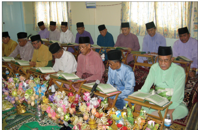
PELAJAR-PELAJAR Kelas Menghalusi Bacaan Al-Qur'an, Persatuan Bekas Kakitangan Kerajaan (PAKATAN) diraikan di Majlis Khatam Al-Qur'an berlangsung di ibu pejabat persatuan berkenaan.

EBLF yang ditubuhkan pada bulan Februari 2009 atas perkenan Kebawah Duli Yang Maha Mulia Paduka Seri Baginda Sultan dan Yang Di-Pertuan Negara Brunei Darussalam bertujuan untuk meningkatkan aktiviti e-Perniagaan di negara ini dengan menyebarkan minat semua sektor dan agensi yang berkaitan dengan e-Perniagaan.