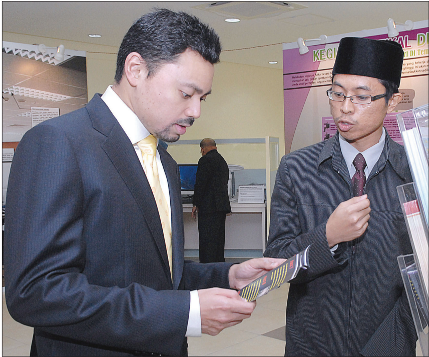
DULI Yang Teramat Mulia Paduka Seri Pengiran Muda Mahkota Pengiran Muda Haji Al-Muhtadee Billah, Menteri Kanan di Jabatan Perdana Menteri ketika disebarkan penerangan mengenai beberapa katalog yang mendidik orang ramai ke arah pemakanan yang sihat.

JERUDONG, Isnin, 3 Mei. - Warga Perkhidmatan Awam disarankan berganding bahu menandai tanggungjawab dengan mengamalkan gaya hidup sihat dan pengambilan pemakanan yang seimbang, di samping menjauhi diri daripada tabiat-tabiat yang memudaratkan kesihatan seperti merokok, yang terbukti mengancam kesihatan perokok itu sendiri dan orang-orang di sekelilingnya.