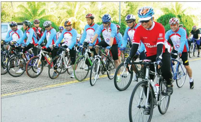
YANG Berhormat Menteri Perindustrian dan Sumber-Sumber Utama semasa menyertai acara berbasikal sejauh 50 kilometer.

Para peminat sukan berbasikal dan penggemar basikal gunung dan basikal lumba ( road bike ) menyertai ekspedisi riadah tersebut yang antara lain menggunakan Jalan Kebangsaan, Lebuhraya Mentiri, Penghubung Jalan Muara-Mentiri, Kawasan Perumahan Lambak Kanan, Jalan Berakas dan berpatah semua di KPSSU.