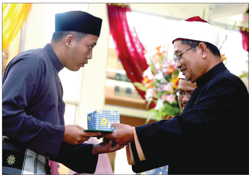
TIMBALAN Menteri Hal Ehwal Ugama, Yang Berhormat Pehin Udana Khatib Dato Paduka Seri Setia Ustaz Haji Awang Badaruddin menyampaikan sijil dan hadiah kepada seorang pelajar di majlis berkenaan.

La juga sebagai motivasi kepada para pelajar enam atas khususnya dan pelajar Pra U-1 amnya supaya belajar bersungguh-sungguh untuk mencapai keputusan yang cemerlang dan dapat dibanggakan dalam peperiksaan STUPB.