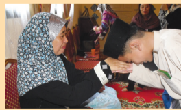
MELIBATKAN diri dengan kehidupan anak-anak