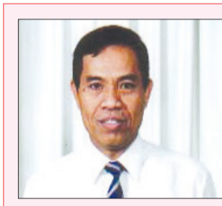
Oleh : Haji Mohd. Salleh bin Abdul Latif, Penerima Anugerah Penulis Asia Tenggara 1990 (The S.E.A. Write Award)

Benar, di kalangan manusia di bumi ini, tiada terdapat yang bersih unggul. Ya, tidak terdapat di dunia ini manusia yang serba sempurna. Tetapi itu bukanlah alasan untuk kita bersikap sambil lewa. Lalu berserah bu-