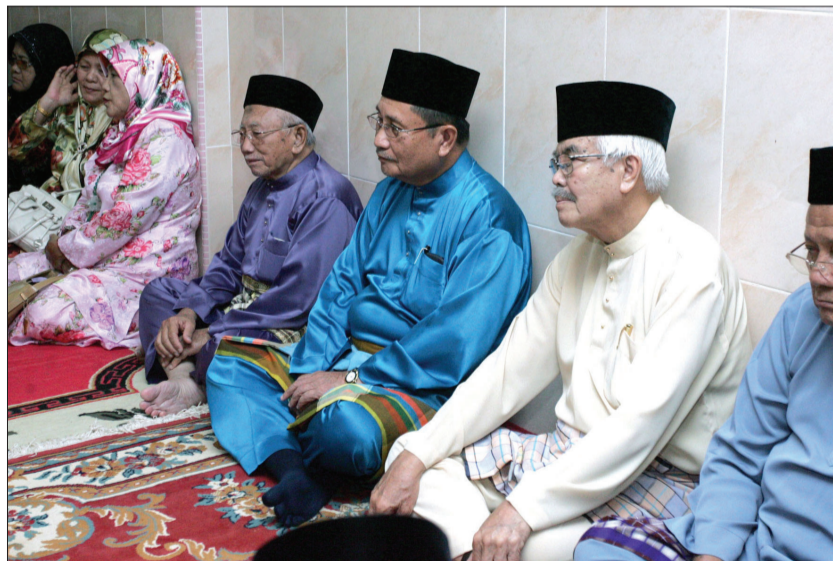
TIMBALAN Menteri Hal Ehwal Ugama, Yang Berhormat Pehin Udana Khatib Dato Paduka Seri Setia Ustaz Haji Awang Badaruddin antara yang hadir menyaksikan Majlis Pengislaman empat warga Filipina berlangsung di Kampung Burong Pinggai Berakas.

Keempat-empat saudara baru tersebut telah melafazkan ikrar pengislaman mereka di hadapan para pegawai dari Unit Pengislaman Pusat Da'wah