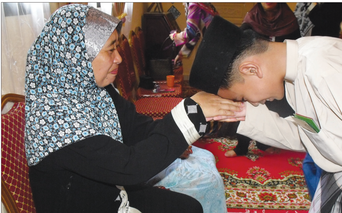
GAMBAR HIASAN ... Komunikasi dalam sebuah keluarga perlu diberi perhatian sewajarnya. Ini termasuk perhubungan mesra dan kasih sayang.

Dalam dunia serba moden sekarang ini, tanggungjawab sebagai ibu bapa semakin besar dan berat dalam mendidik anak bagi melahirkan generasi cemerlang pada masa akan datang. Justeru, ibu bapa juga seharusnya menambah ilmu dari semasa ke semasa bagi menangani kerosakan anak-anak remaja yang semakin terkehadapan sekarang ini. Lakukanlah yang wajar terhadap amanah yang diberikan kepada kita semua. Sayangilah mereka.