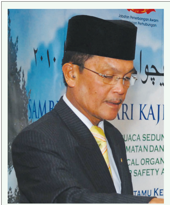
UCAPAN Menteri Perhubungan, Yang Berhormat Pehin Orang Kaya Seri Kerna Dato Seri Setia Haji Awang Abu Bakar bin Haji Apong di Majlis Sambutan Hari Kaji cuaca Sedunia 2010, pada Hari Selasa, 7 Rabiulakhir 1431 Hijriah bersamaan 23 Mac 2010 Masihi, bertempat di Bumbungan Dua Belas, Bandar Seri Begawan.

Sehubungan ini, Kementerian Perhubungan, melalui Bahagian Perkhidmatan Kaji cuaca, Jabatan Penerbangan Awam, sememangnya prihatin dan mempunyai komitmen tinggi dalam menyediakan maklumat cuaca dan iklim bagi membantu orang ramai serta pihak-pihak yang berwajib bertindak menangani se-