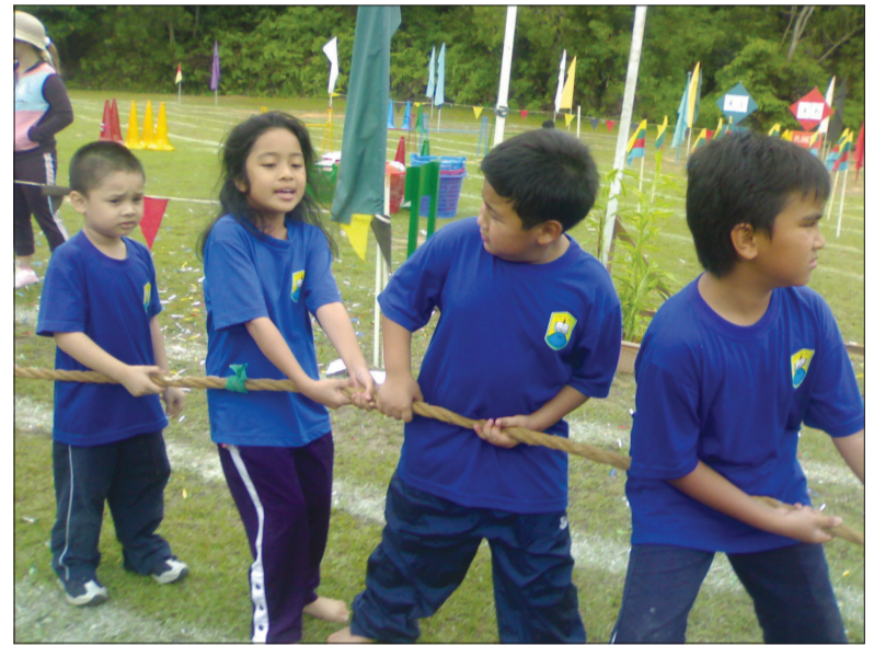
GALAKAN perlu diberikan kepada kanak-kanak untuk melibatkan diri mereka dalam kerja-kerja sukarela dalam komuniti awda menjadi ahli kumpulan belia atau turut serta dalam aktiviti kesenian atau sukan.

ngan mereka sering bertanya khabar dan mengambil tahu akan masalah mereka.