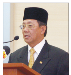
MENTERI Kesihatan, Yang Berhormat Pehin Orang Kaya Indera Pahlawan Dato Seri Setia Haji Awang Suyoi semasa berucap di Majlis Pelancaran Simposium Tempat Kerja Sihat Perkhidmatan Awam 2010 dan Pelancaran Buku ‘Tempat Kerja: Penyajian dan Penjualan Makanan dan Minuman’.

Seterusnya Yang Berhormat berharap dengan adanya simposium dan pelancaran buku makanan sihat itu akan meningkatkan kesedaran dan komitmen kita semua untuk mewujudkan dasar dan tata kerja yang menjurus kepada persekitaran yang