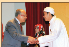
PELAJAR cemerlang terima anugerah