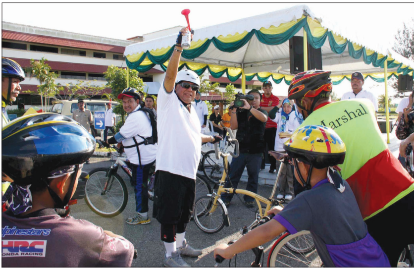
MENTERI Pembangunan, Yang Berhormat Pehin Orang Kaya Hamzah Pahlawan Dato Seri Setia Haji Awang Abdullah semasa melancarkan Ekspedisi Berbasikal 37 kilometer.