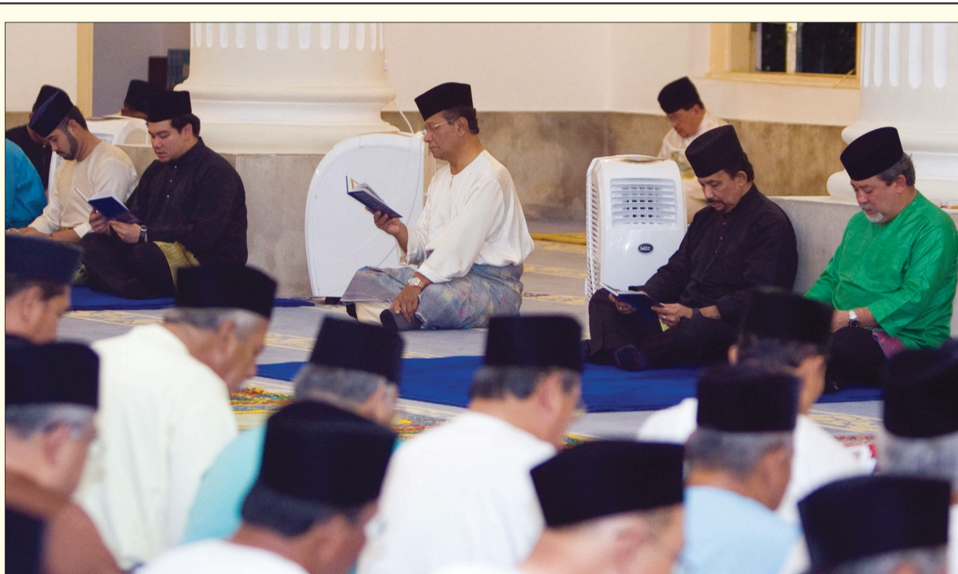
KEBAWAH Duli Yang Maha Mulia Paduka Seri Baginda Sultan Haji Hassanal Bolkiah Mu'izzaddin Waddaulah ibni Al-Marhum Sultan Haji Omar 'Ali Saifuddin Sa'adul Khairi Waddien, Sultan dan Yang Di-Pertuan Negara Brunei Darussalam bersama-sama Duli Yang Maha Mulia Sultan Ibrahim Ismail, Sultan Johor Darul Takzim ketika membaca Surah Yaa Siin di Majlis Membaca Yaa Siin dan Tahliil Sempena 100 Hari Kemangkatan Almarhum Al-Mutawakal Allallah Sultan Iskandar Alhaj ibni Almarhum Sultan Ismail yang berlangsung di Masjid Sultan Abu Bakar, Johor Baharu, Malaysia. Berangkat sama di majlis itu ialah anakanda baginda, Yang Teramat Mulia Paduka Seri Duli Pengiran Muda Haji 'Abdul 'Azim. (Berita lanjut dan foto dimuatkan di muka 12 dan 13).