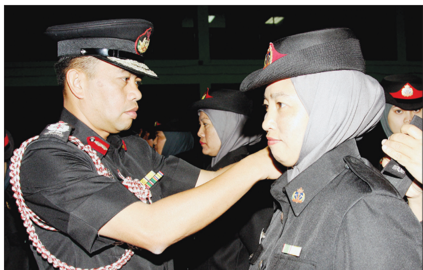
PENGARAH Bomba dan Penyelamat, Awang Yahya bin Haji Abd. Rahman menyampaikan tanda pangkat Pegawai Balai kepada seorang penerima di Majlis Penyampaian Tanda Pangkat Bagi Penolong Penguasa Bomba dan Pegawai Balai.

BANDAR SERI BEGAWAN, Sabtu, 29 Mei. - Seramai lapan orang Pegawai Balai, sebelas orang Timbalan Pegawai Balai dan seorang Penolong Pegawai Balai menerima tanda pangkat masing-masing di Majlis Penyampaian Tanda Pangkat Bagi Penolong Penguasa Bomba dan Pegawai Balai di Dewan Serbaguna, Ibu Pejabat Bomba dan Penyelamat, Lapangan Terbang Lama, Berakas, di sini.