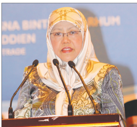
YANG Teramat Mulia Paduka Seri Pengiran Anak Puteri Hajah Masna, Ambassador-at-Large di Kementerian Hal Ehwal Luar Negeri dan Perdagangan semasa mengurniakan sabda di Majlis Perasmian Persidangan Pasaran Halal Antarabangsa (IHMC) Ke-5.

BANDAR SERI BEGAWAN, Sabtu, 5 Jun. - Yang Teramat Mulia Paduka Seri Pengiran Anak Puteri Hajah Masna, Ambassador-at-Large di Kementerian Hal Ehwal Luar Negeri dan Perdagangan ber-sabda agensi-agensi kerajaan di negara ini menerokai bidang-bidang baru