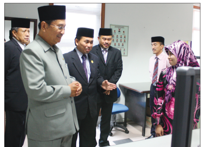
MENTERI Hal Ehwal Dalam Negeri, Yang Berhormat Pehin Udana Khatib Dato Paduka Seri Setia Ustaz Haji Awang Badaruddin bin Pengarah Dato Paduka Haji Othman semasa melawat Pejabat Daerah/Pejabat Bandaran Tutong.