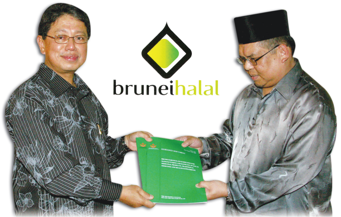
MENTERI Perindustrian dan Sumber-Sumber Utama, Yang Berhormat Pehin Orang Kaya Seri Utama Dato Seri Setia Awang Haji Yahya ketika menyerahkan buku Garis Panduan Pengilangan dan Pengendalian Produk-Produk Ubat, Ubat Tradisional dan Tambahan Kesihatan Halal Brunei Darussalam kepada Timbalan Menteri Hal Ehwal Ugama, Yang Mulia Pengiran Haji Bahrom.

Menteri Perindustrian dan Sumber-Sumber Utama, Yang Berhormat Pehin Orang Kaya Seri Utama Dato Seri Setia Awang Haji Yahya, menekankan masyarakat bukan Islam kini juga menerima pembuatan produk-produk halal khususnya pembuatan produk-produk pengguna di mana produk yang diiktiraf halal oleh organisasi yang boleh dipercayai ( credible and reliable organizations ) sen-