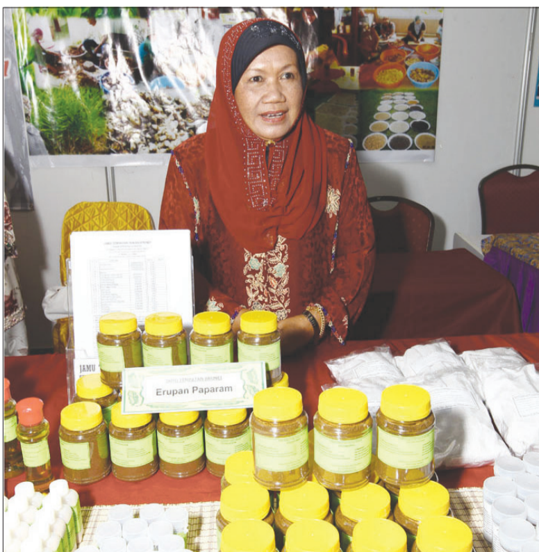
GAMBAR HIASAN ... Peluang-peluang terbuka luas bagi membuka jalan penubuhan syarikat-syarikat perubatan halal yang akan menghasilkan produk-produk perubatan yang halal secara tempatan (kiri dan kanan).

Pada keseluruhannya, penduduk Islam dunia adalah sekitar 1.8 bilion dan jumlah itu dijangka bertambah 2.9 peratus setahun. Industri halal adalah sebanyak USD600 bilion di mana sektor makanan halal dianggarkan berjumlah USD150 bilion.