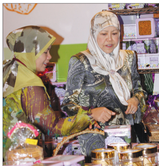
YANG Teramat Mulia semasa melawat pameran IHMC Ke-5, berlangsung di ICC, Berakas.