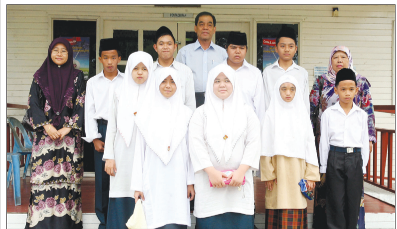
BERGAMBAR RAMAI. - Penuntut-penuntut Sekolah Menengah Sayyidina Hussain mengabadikan gambar kenangan semasa mengadakan lawatan sambil belajar ke Pusat Ehsan, Kampung Bengkurong.

Pusat Ehsan sentiasa bersedia mengalu-alukan lawatan-lawatan daripada mana-mana pihak sama ada peringkat kanak-kanak ataupun dewasa kerana ianya merupakan salah satu wadah bagi pusat ini untuk menyalurkan maklumat dan memberikan kesedaran serta tanggungjawab untuk sama-sama menangani kebajikan dan hal ehwal insan-insan istimewa di Pusat Ehsan khasnya dan di Negara Brunei Darussalam amnya.