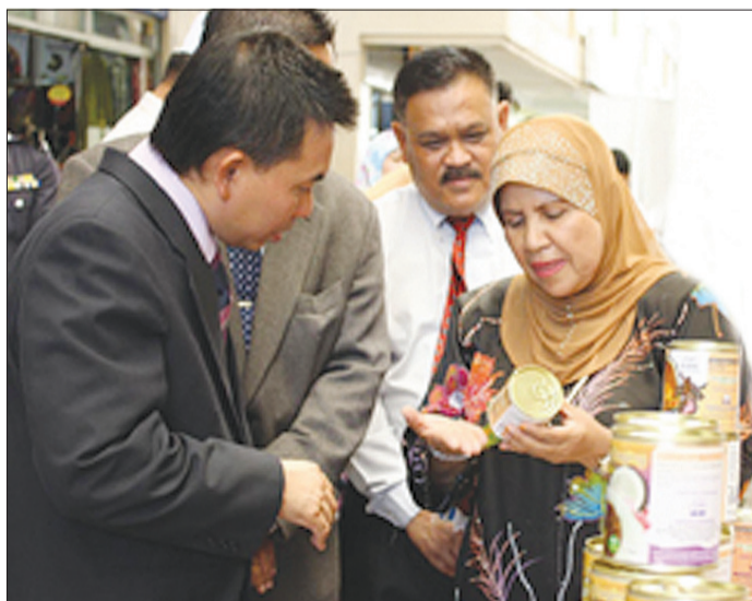
PEMANGKU Pegawai Daerah Tutong, Awang Haji Muhammad Suffian bin Haji Bungsu semasa diberi penerangan mengenai salah satu produk yang dipamerkan di Majlis Perasmian Pesta Produk Tempatan 2010 bagi Daerah Tutong, bertempat di Tutong Central Mall.

TUTONG, Sabtu, 29 Mei. - Perusahaan kecil dan sederhana (PKS) adalah antara komponen utama dalam menunjangi kepelbagaian ekonomi dan ke arah itu, pembangunan berterusan sektor PKS yang berdaya saing dan berdaya tahan adalah satu asas matlamat kerajaan untuk mencapai tahap pembangunan dan kemajuan ekonomi yang seimbang dan taraf hidup yang lebih tinggi bagi setiap lapisan masyarakat selaras dengan Wawasan Negara 2035.