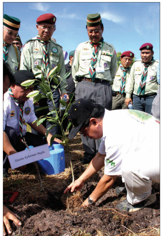
MENTERI Perindustrian dan Sumber-Sumber Utama, Yang Berhormat Pehin Orang Kaya Seri Utama Dato Seri Setia Awang Haji Yahya menanam pokok di kawasan tanah Kilometer 12 Kampung Sungai Mau.

Pihak Kerajaan Kebawah Duli Yang Maha Mulia Paduka Seri Baginda Sultan dan Yang