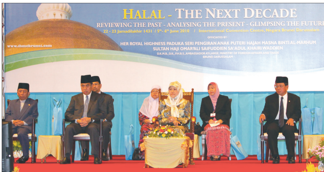
YANG Teramat Mulia Paduka Seri Pengiran Anak Puteri Hajah Masna, Ambassador-at-Large di Kementerian Hal Ehwal Luar Negeri dan Perdagangan semasa berangkat ke Persidangan Pasaran Halal Antarabangsa (IHMC) Ke-5, berlangsung di Pusat Persidangan Antarabangsa (ICC), Berakas.

Selama dua hari IHMC diadakan beberapa tokoh paling inovatif dalam industri halal dari dalam dan luar negara diundang bagi membentangkan tajuk-tajuk berkaitan dengan syarikat-syarikat makanan yang mendominasi industri halal, di samping perkembangan - perkembangan dalam kewangan, pengembaraan dan pelancongan Islam serta kesedaran media secara online dan pengguna.