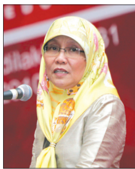
PENSYARAH Kanan di Universiti Brunei Darussalam selaku Setiausaha Bersama ICE 2010 semasa berucap di Majlis Penutup Persidangan ICE Ke-15.

Tema Persidangan Pendidikan Ke-15 pada tahun ini yang dikendalikan oleh IPSHB ialah 'Challenging Models, Challenging Minds: Initiating Effective Educational Reform and Development' antara lainnya bertujuan untuk menghasilkan peningkatan kualiti para guru dan prestasi pelajar dan juga keputusan pendidikan yang lebih ting-