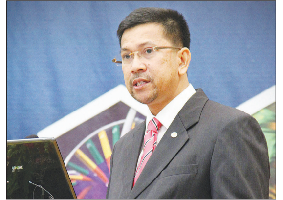
SETIAUSAHA Tetap Kementerian Kesihatan, Dato Paduka Awang Haji Abd. Salam semasa memberi ucapan di Mesyuarat Tahunan Ke-2 dan Simposium Asian Forensic Sciences Network di Grand Hall, The Empire Hotel and Country Club.

Lebih 130 peserta menghadiri mesyuarat dan simposium tersebut yang terdiri dari Republik Indonesia, Kemboja, Malaysia, Myanmar, Republik Filipina, Republik Singapura, Thailand, Viet Nam, Australia, Austria, Bangladesh, Hong Kong, Jepun Korea, Macau, Republik Rakyat China dan