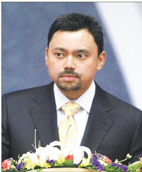
SABDA Duli Yang Teramat Mulia Paduka Seri Pengiran Muda Mahkota Pengiran Muda Haji Al-Muhtadee Billah ibni Kebawah Duli Yang Maha Mulia Paduka Seri Baginda Sultan Haji Hassanal Bolkiah Mu'izzaddin Waddaulah, Menteri Kanan di Jabatan Perdana Menteri di Majlis Konvokesyen Ke-19, bertempat di Pusat Persidangan Antarabangsa, Berakas. Pada hari Sabtu, 15 Jamadilakhir 1431 Hijrah / 29 Mei 2010 Masihi.

Sehubungan itu, adalah menjadi tanggungjawab bagi institusi pengajian tinggi di negara ini bagi menggiatkan lagi aktiviti-aktiviti penyelidikan dan membina kapasiti ke arah mempelbagaikan lagi