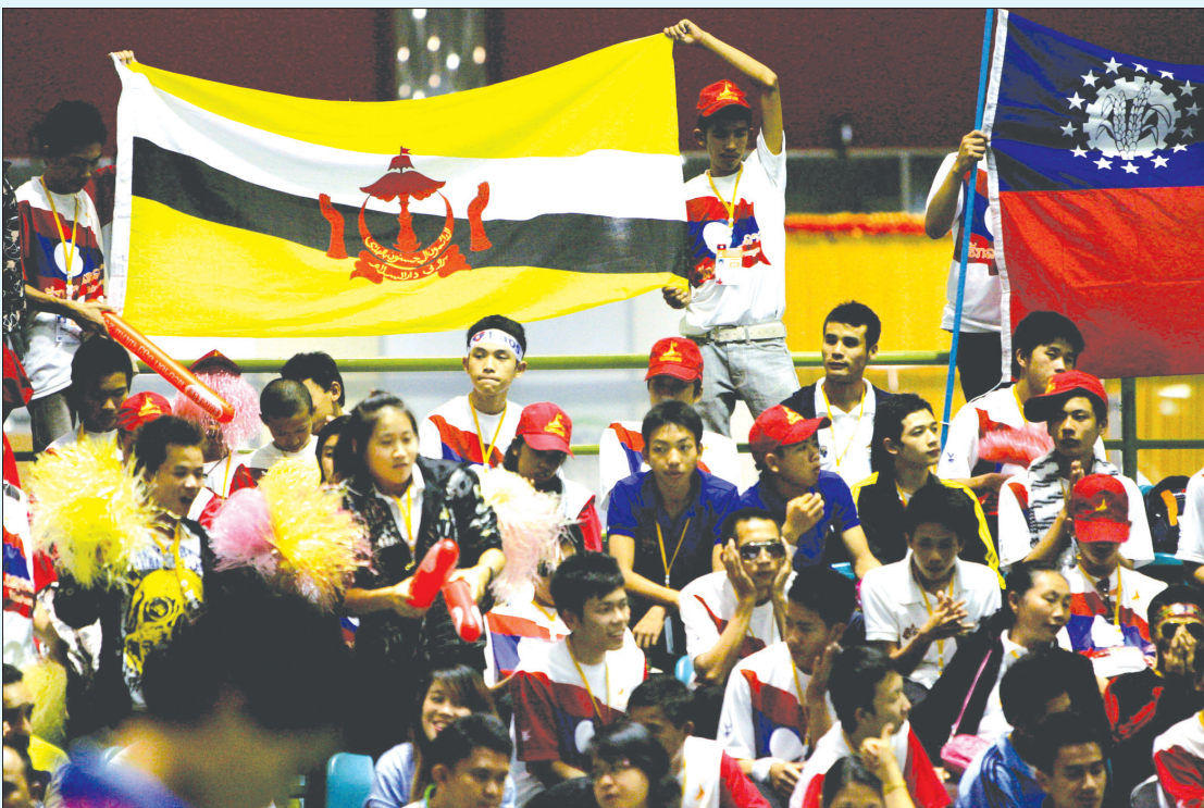
PENYOKONG-PENYOKONG Brunei yang turut memberikan semangat semasa skuad sepak takraw beraksi dalam temasya Sukan SEA Ke-25 Laos.

Laporan : Samle Haji Jait, Abdullah Asgar Foto : Masmaleh Haji Mohd. Ali, Ampuan Haji Mahmud Ampuan Haji Tengah dari Vientiane, Republik Demokratik Rakyat Lao