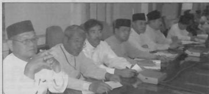
PARA penghulu dan ketua kampung Daerah Brunei dan Muara ketika menghadiri taklimat memperkemaskini kedudukan sempadan mukim dan kampung. Majlis berlangsung di Pejabat Daerah Brunei dan Muara (kiri).