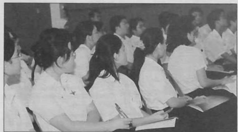
PELAJAR-PELAJAR Menengah 2 Sekolah Menengah Chung Ching, Seria ketika mendengar Forum Dadah yang diadakan di sekolah tersebut.

Selepas Hari Gotong-Royong itu nanti pengerusi mesyuarat berharap pihak berkenaan akan sentiasa menjaga kebersihan alam sekitar secara berterusan kerana menjaga kebersihan alam sekitar adalah tanggungjawab bersama.