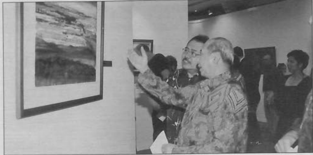
MENTERI Kebudayaan, Belia dan Sukan, Yang Berhormat Pehin Orang Kaya Digadong Seri Lela Dato Seri Paduka (Dr.) Haji Awang Hussain menyaksikan Pameran Forum Seni Brunei 2004, yang dihasilkan oleh pelukis-pelukis tempatan dan luar negara sejurus merasmikannya. Majlis berlangsung di Balai Pameran, Pusat Latihan Kesenian dan Pertukangan Tangan Brunei di Jalan Residency.

Selain penyertaan yang menggalakkan dari pelukis tanah air, pameran ini juga melibatkan pelukis-pelukis dari luar negara seperti Kanada, Republik Indonesia, New Zealand, Sweden dan Amerika Syarikat.