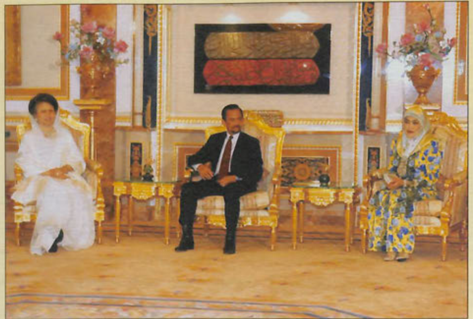
BAGINDA ketika berkenan mengurniakan titah (kiri).