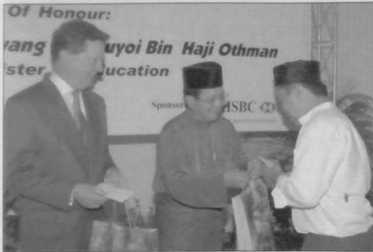
TIMBALAN Menteri Pendidikan, Yang Mulia Dato Paduka Awang Haji Suyoi bin Haji Othman menyampaikan bantuan peralatan sekolah sumbangan HSBC dan PSW kepada seorang pelajar.