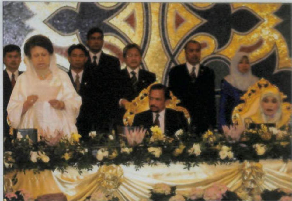
KEBAWAH Duli Yang Maha Mulia Paduka Seri Baginda Sultan Haji Hassanal Bolkiah Mu'izzaddin Waddaulah, Sultan dan Yang Di-Pertuan Negara Brunei Darussalam dan Kebawah Duli Yang Maha Mulia Paduka Seri Baginda Raja Isteri Pengiran Anak Hajah Saleha ketika meraikan Perdana Menteri Republik Rakyat Bangladesh, Puan Yang Terutama Begum Khaleda Zia di Majlis Santap Malam di Istana Nurul Iman. Dalam gambar kelihatan Perdana Menteri Bangladesh semasa menyampaikan ucapan belas.

Brunei Darussalam, Puan Yang Terutama menyatakan penduduk di negara ini kini berada di dalam suasana yang betul-betul aman dan selesa dengan kemudahan yang diberikan seperti pendidikan, kesihatan dan juga kesejahteraan kehidupan yang moden. Nyata sekali, jelas Puan Yang Terutama apa yang dicapai oleh penduduk di