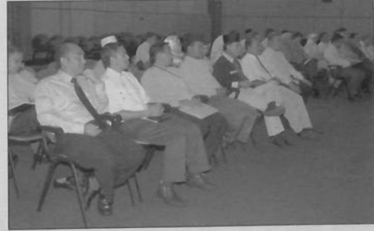
SEBAHAGIAN para pengusaha bas pengangkutan awam yang menghadiri majlis berkenaan.

Skim berkenaan dibukakan kepada rakyat dan penduduk tetap yang berumur di antara 18 hingga 35 tahun