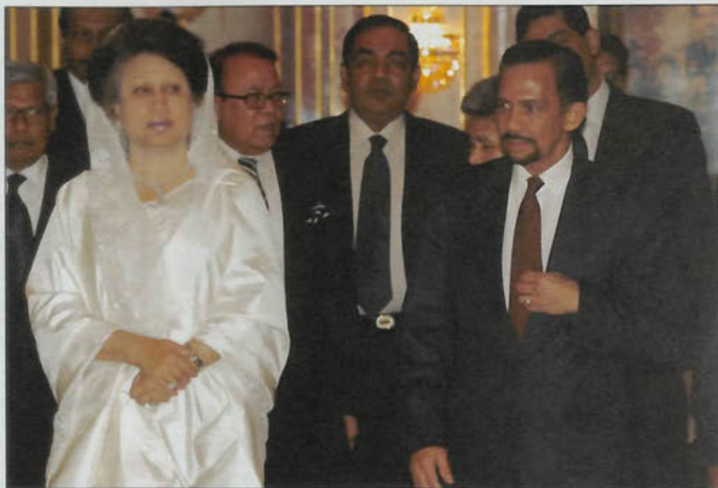
KEBAWAH Duli Yang Maha Mulia Paduka Seri Baginda Sultan Haji Hassanah Bolkiyah Mu'izzuddin Waddaulah, Sultan dan Yang Di-Pertuan Negara Brunei Darussalam dan Perdana Menteri Republik Rakyat Bangladesh, Puan Yang Terutama Begum Khaleda Zia sejeurus sebelum kedua-dua pemimpin mengadakan rundingan dua hala di Istana Nurul Iman.

Terdahulu baginda bertitah mengucapkan tahniah kepada Puan Yang Terutama dan rakyat Bangladesh atas pencapaian negara tersebut setelah mencapai kemerdekaan lebih dari 30 tahun lampau dan ketika ini mampu menawarkan sumbangan besar kepada hal-ehwal serantau dan dunia antarabangsa.