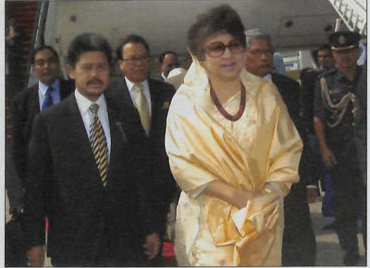
MENGALU-ALUKAN ... Duli Yang Teramat Mulia Paduka Seri Pengiran Perdana Wazir Sahibul Himmah Wal-Waqar Pengiran Muda Mohamed Bolkiah, Menteri Hal Ehwal Luar Negeri ketika berangkat mengalu-alukan ketibaan Perdana Menteri Republik Rakyat Bangladesh, Puan Yang Terutama Begum Khaleda Zia di Lapangan Terbang Antarabangsa Brunei (atas).

Hubungan dua hala Negara Brunei Darussalam dengan Bangladesh telah dibentuk pada 5 Mei 1984, sementara negara Bangladesh menubuhkan misi