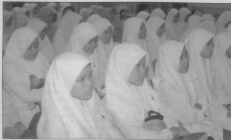
PARA penuntut yang berdaftar di bawah Program 'Save Our Children' ketika hadir bagi menerima wang dan peralatan sekolah sumbangan HSBC dan PSW.

Usaha memantau status penyakit tersebut di negara-negara berkenaan akan terus dilakukan sehingga keadaan menjadi pulih dan selamat. Dalam hubungan tersebut, jabatan akan terus memperketatkan langkah-langkah pengawalan supaya berjaga-jaga bagi menangani kemungkinan berlakunya penyakit 'selesema ayam' di ladang-ladang ayam di seluruh negara melalui pemantauan yang berterusan.