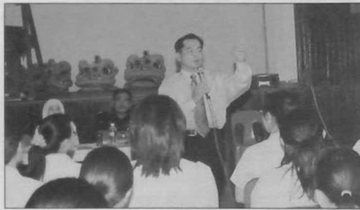
WAKIL Bahagian Kaunseling dan Bimbingan Bakat Kerja, Jabatan Sekolah-Sekolah ketika menyampaikan taklimat di Forum Dadah berlangsung di Sekolah Menengah Chung Ching, Seria.

Mesyuarat yang dipengerusikan oleh Jabatan Daerah Belait dan dihadiri oleh wakil bahagian jabatan-jabatan kerajaan daerah ini antara lain membincangkan kawasan yang akan dibersihkan, peralatan yang tidak disusun dengan sempurna, menggunakan alat pemadam kebakaran bagi penghadang pintu keluar masuk pejabat, melantik ahli jawatankuasa hari gotong-royong, penetapan tarikh diadakan, membincangkan tugas dan peralatan yang diperlukan serta