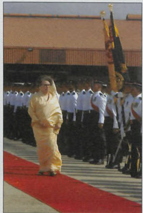
MEMERIKSA PERBARISAN ... Puan Yang Terutama ketika memeriksa perbarisan kehormatan.