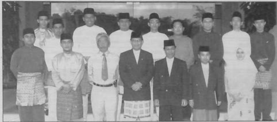
PEMANGKU Setiausaha Tetap Kementerian Hal Ehwal Ugama dan Pengiran Penerangan, Awang Haji Bujang bergambar kenangan bersama sepuluh pelajar universiti yang terpilih menyertai Perkhemahan Pelajar Universiti Antarabangsa di Arab Saudi sejurus selepas mendengarkan taklimat kenegaraan.