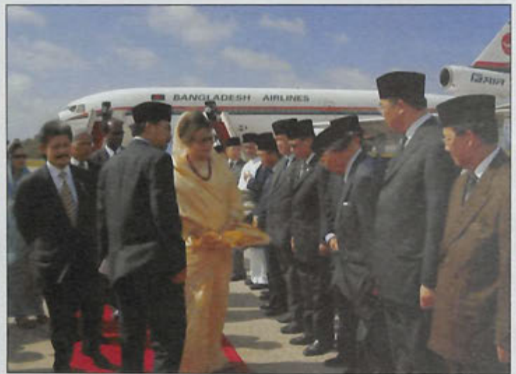
BERSALAMAN ... Perdana Menteri Republik Rakyat Bangladesh ketika bersalaman bersama pembesar-pembesar negara (atas).