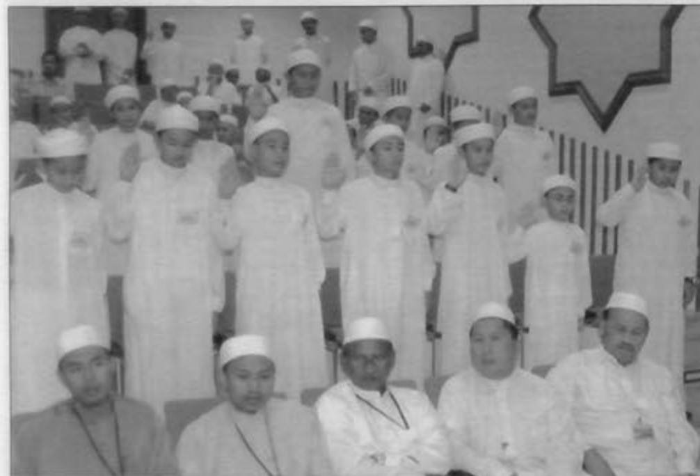
PELAJAR-PELAJAR baru Institut Tahfiz Al-Quran Sultan Haji Hassanah Bolkiah terdiri dari 15 orang pelajar lelaki dan 23 orang perempuan ketika membaca ikrar pelajar.