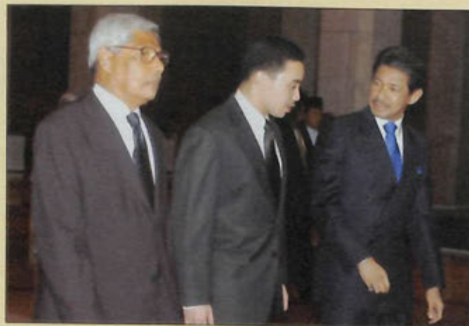
BERANGKAT sama bagi menghadiri Majlis Santap itu ialah putera-putera dan puteri baginda, adinda-adinda baginda serta kerabat-kerabat diraja (atas kiri, atas, kiri sekali dan kiri).