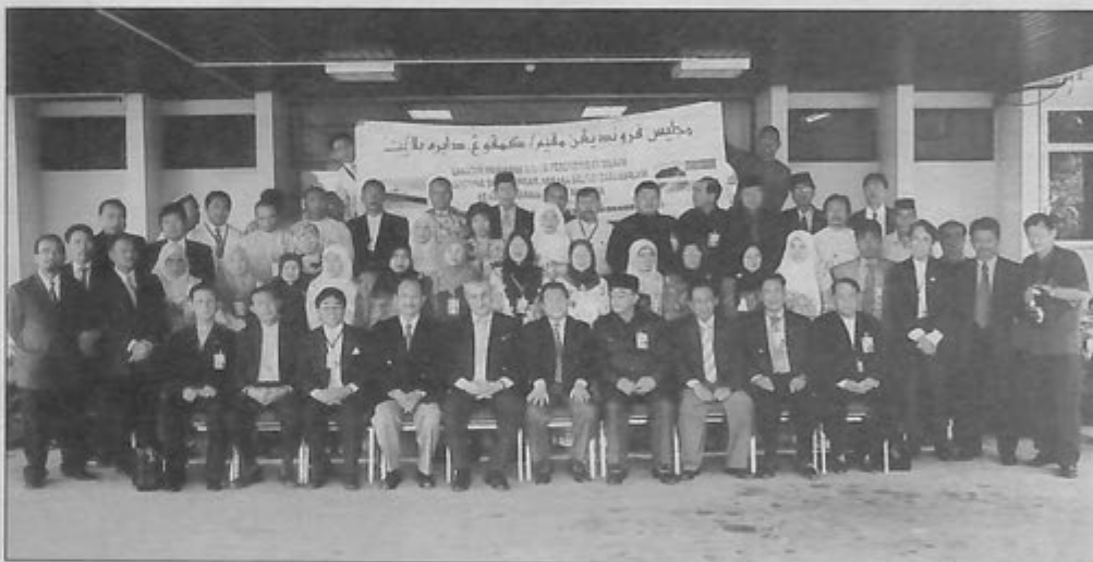
LAWATAN Muhibah ke Kota Kinabalu, Sabah anjuran Badan Kesenian dan Kebudayaan Majlis Perundingan Mukim dan Kampung Daerah Belait.

PELITA BRUNEI akhbar rasmi kerajaan, diberikan percuma kepada rakyat; rajin membaca luas pengetahuan, Alai jawablah soalan tercatat.