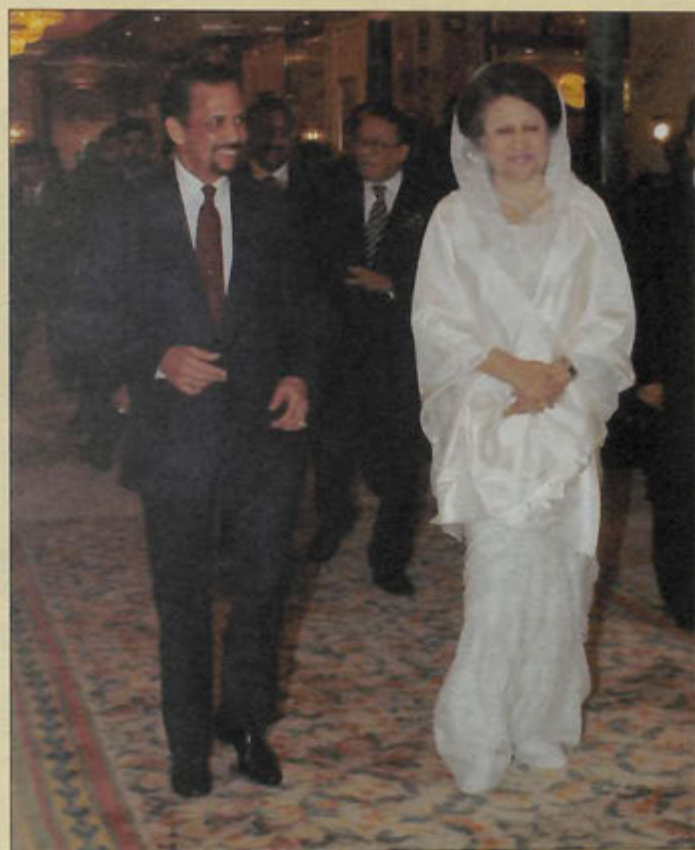
BAGINDA bersama Perdana Menteri Republik Rakyat Bangladesh berjalan beriringan sejurus sebelum mengadakan rundingan dua hala (atas).