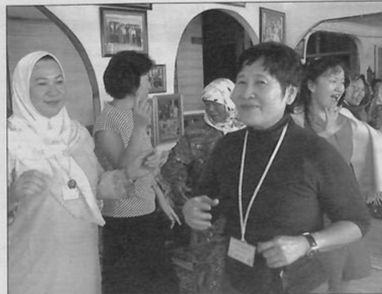
PARA delegasi dengan penuh komitmen mencuba joget Brunei.

ACWW adalah dihasratkan bagi memperbaiki taraf kehidupan wanita, keluarga dan masyarakat melalui sokongan jaringan kerja yang meluas dan projek-projek dari akar umbi.