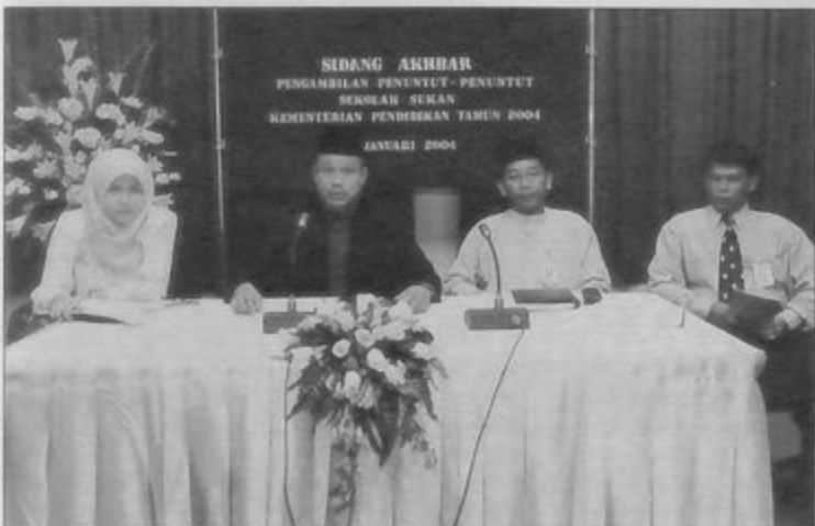
PEGAWAI-PEGAWAI Jabatan Pendidikan Ko-Kurikulum menyampaikan taklimat mengenai penerimaan penuntut baru Sekolah Sukan.