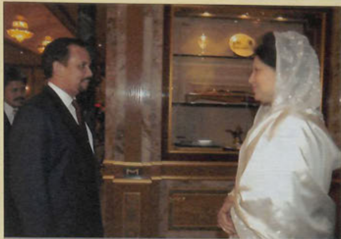
KEBAWAH Duli Yang Maha Mulia Paduka Seri Baginda Sultan Haji Hassanal Bolkiah Mu'izzaddin Waddaulah, Sultan dan Yang Di-Pertuan Negara Brunei Darussalam dan Perdana Menteri Bangladesh, Puan Yang Terutama Begum Khaleda Zia semasa mengadakan rundingan dua hala di Istana Nurul Iman (kanan).