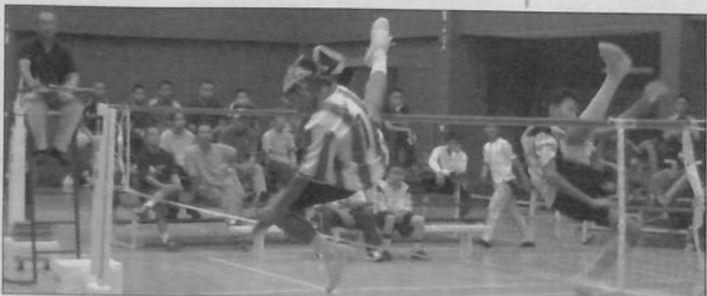
ANTARA aksi pemain-pemain muda yang menyertai Kejohanan Sepak Takraw Regu Belia tahun lalu.

Kejohanan tahunan peringkat kebangsaan ini merupakan langkah PESTABARU ke arah mempertingkatkan mutu permainan sepak takraw di kalangan belia-belia negara ini