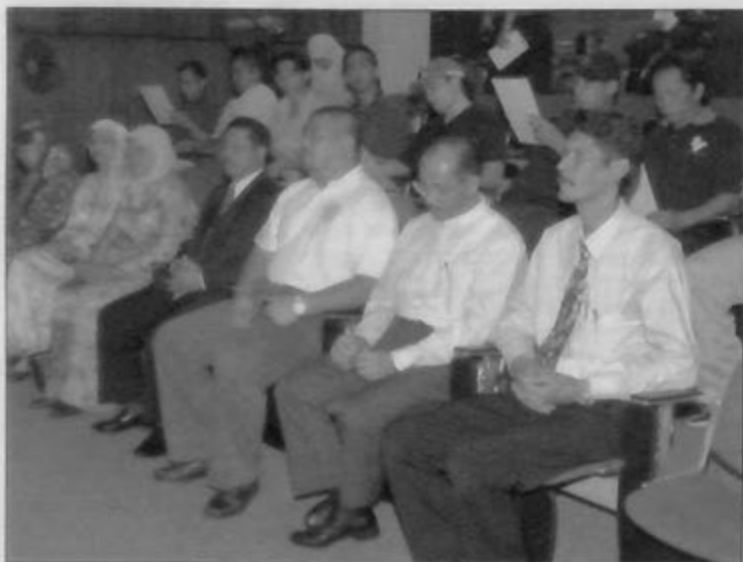
PENGARAH Belia dan Sukan dan lain-lain pegawai serta para belia yang menyertai Program BA'ATH Siri Pertama.