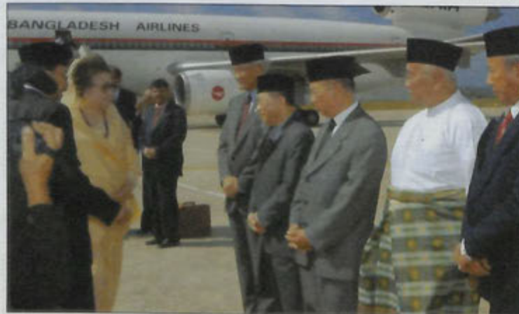
PERDANA Menteri Republik Rakyat Bangladesh ketika berangkat turun dari pesawat khas se-jurus tiba di lapangan terbang (kiri).