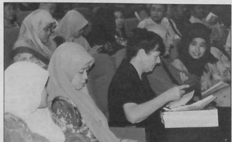
GURU-GURU Bahagian Kaunseling dan Bimbingan Bakat Kerja seluruh negara menghadiri taklimat Skim Biasiswa dan Kerjaya di BSP, BLNG dan BST.

Sebelum itu syarikat-syarikat berkenaan telah mengadakan pelbagai sesi perjumpaan, acara jerayawara kerja dan majlis-majlis taklimat di sekolah-sekolah menengah di seluruh negara sejak beberapa tahun lalu bagi memberi penerangan mengenai peluang-peluang kerjaya kepada pelajar-pelajar sekolah.