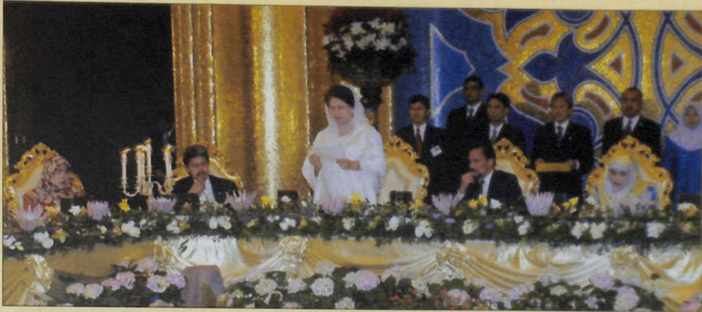
KEBAWAH Duli Yang Maha Mulla Paduka Sultan Haji Hassanat Bolkiah Mu'izzaddin dan Yang Di-Pertuan Negara Brunei Darussalam Kebawah Duli Yang Maha Mulla Paduka Seri Pengiran Anak Hajah Saleha ketika berhadapan Perdana Menteri Republik Rakyat Bangladesh Terutama Begum Khaleda Zia di Majlis Iman (kiri).