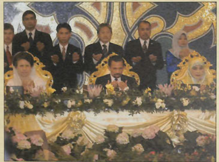
MENGAMINKAN DOA... Baginda berdua berserta Puan Yang Terutama Begum Khaleda Zia ketika menadah tangan mengaminkan doa (kanan).