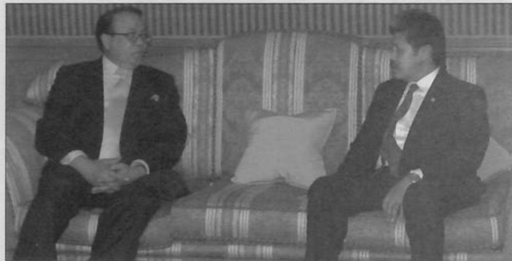
DULI Yang Teramat Mulia Paduka Seri Pengiran Perdana Wazir Sahibul Himmah Wal-Waqar Pengiran Muda Mohamed Bolkiah, Menteri Hal Ehwal Luar Negeri, hari ini berkenan menerima mengadap Menteri Hal Ehwal Luar Republik Rakyat Bangladesh, Tuan Yang Terutama M. Morshed Khan, M.P, yang berlangsung di Balai Penghadapan, Bukit Kayangan.

Terutama berada di negara ini sebagai sebahagian daripada delegasi Perdana Menteri Republik Rakyat Bangladesh, Puan Yang Terutama Begum Khaleda Zia yang dalam lawatan rasmi dua hari ke negara ini.