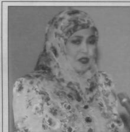
TITAH Kebawah Duli Yang Maha Mulia Paduka Seri Baginda Raja Isteri Pengiran Anak Hajah Saleha binti Al-Marhum Pengiran Pemancha Pengiran Anak Haji Mohamed Alam di Majlis Pembukaan Rasmi Persidangan Serantau Kali Ketujuh Perkumpulan Wanita Sedunia (ACWW) Bagi Asia Tenggara dan Timur Jauh berlangsung di Pusat Persidangan Antarabangsa, Berakas pada 11 Januari 2004.

Wanita sewajarnya hendaklah berwaspada dengan bahaya ke atas kesihatan akibat pencemaran, kerana dalam rumah tangga, kaum wanita bertanggungjawab menyediakan makanan untuk keluarga dan juga menjaga kesihatan anak-anak yang masih kecil.