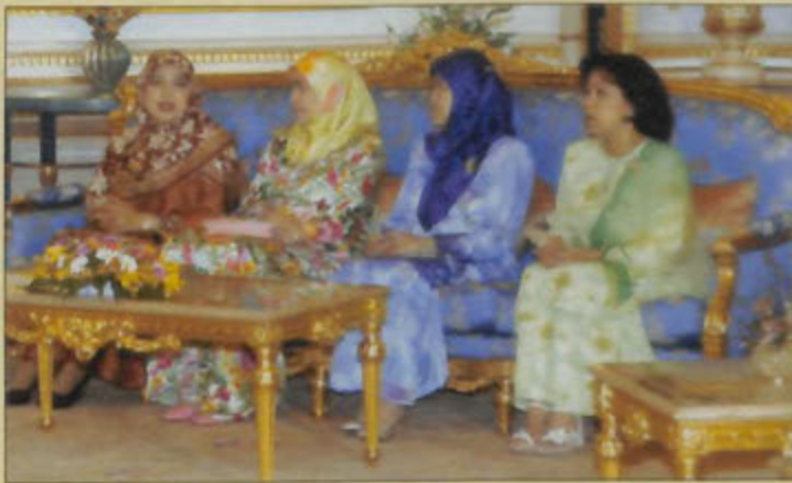
DULI Yang Teramat Mulla Paduka Seri Pengiran Anak Puteri Hajah Sa'adatul Bolkiah, Yang Teramat Mulla Paduka Seri Pengiran Anak Puteri Hajah Masna dan Yang Teramat Mulla Paduka Seri Pengiran Anak Puteri Hajah Kalthum Al-Islami ketika berhadapan Perdana Menteri Republik Rakyat Bangladesh Terutama Begum Khaleda Zia (kiri).