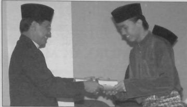
PEMANGKU Setiausaha Tetap Kementerian Hal Ehwal Ugama, Awang Haji Yusoff bin Haji Ismail menyampaikan cenderamata kepada seorang pelajar universiti yang terpilih mengikuti Perkhemahan Pelajar Universiti Antarabangsa di Arab Saudi.