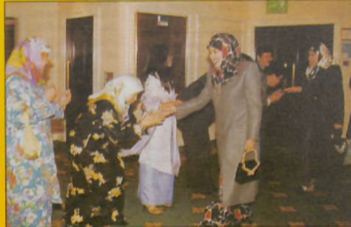
KEBAWAH Duli Yang Maha Mulla Paduka Seri Baginda Raja Isteri dan Duli Yang Teramat Mulla Pengiran Isteri berkenan menerima pesembah daripada wakil para penuntut di United Kingdom (gambar atas kiri dan atas kanan).