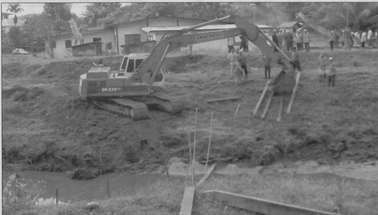
JAMBATAN kayu dibina menyeberangi sungai ini bagi menggantikan jambatan bailey yang telah rosak akibat sungai banjir dan hujan lebat.

Kehadiran penduduk-penduduk kampung berkenaan adalah sangat-sangat diharapkan.