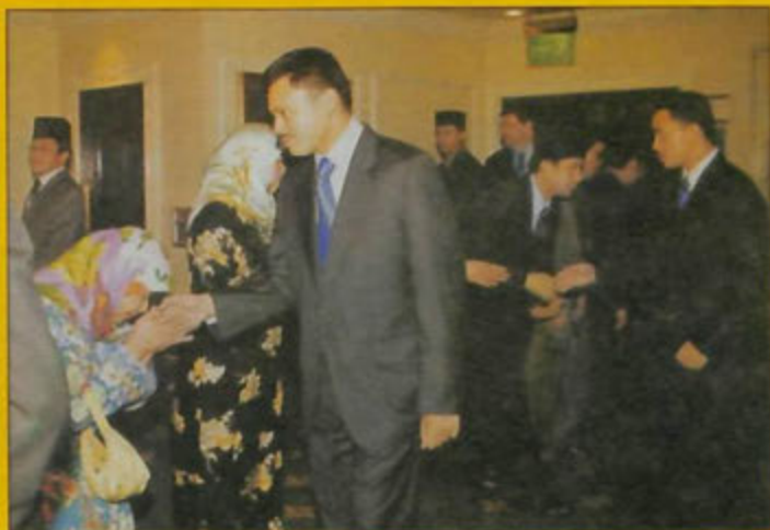
DULI Yang Teramat Mulia Paduka Seri Pengiran Muda Mahkota Pengiran Muda Haji AJ-Muhtadee Billah dan Yang Teramat Mulia Paduka Seri Duli Pengiran Muda 'Abdul Malik berkenan menerima junjung ziarah para pegawai dan kakitangan Suruhanjaya Tinggi Negara Brunei Darussalam di London sejurus keberangkatan tiba di majlis itu (kanan).