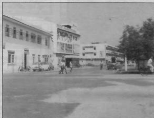
PERSIMPANGAN Jalan Sultan/Jalan Pemancha dalam tahun 1970-an

PEMBANGUNAN negara turut mengubah persekitaran Bandar Seri Begawan khususnya persimpangan Jalan Sultan/Jalan Pemancha, salah satu persimpangan utama di ibu negara. Ketika ini di bekas tapak bangunan Syarikat Limbang Trading berdiri megah sebuah bangunan yang memertipkan Syarikat Pemasaran Brunei Shell (BSM), manakala di bekas tapak bangunan panggung wayang New Boon Pang didirikan pula bangunan Ibu Pejabat Bank Islam Brunei Berhad (IBB), dua sektor ekonomi yang sama-sama berperanan dalam menjana ekonomi negara.