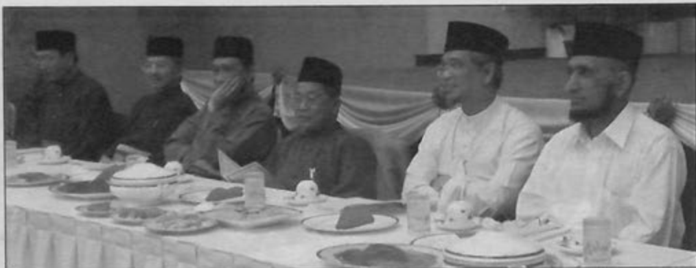
TIMBALAN Menteri Hal Ehwal Ugama, Yang Dimuliakan Pehin Siraja Khatib Dato Paduka Seri Setia Ustaz Haji Awang Yahya bersama-sama para pegawai kanan yang lain ketika hadir di Majlis Doa Selamat Meraikan Bakal Jemaah Haji Kementerian Hal Ehwal Ugama.

Majlis juga diteruskan dengan sumbangan ikhlas kepada bakal-bakal jemaah haji yang berupa wang dan buku-buku panduan menunaikan ibadat haji.