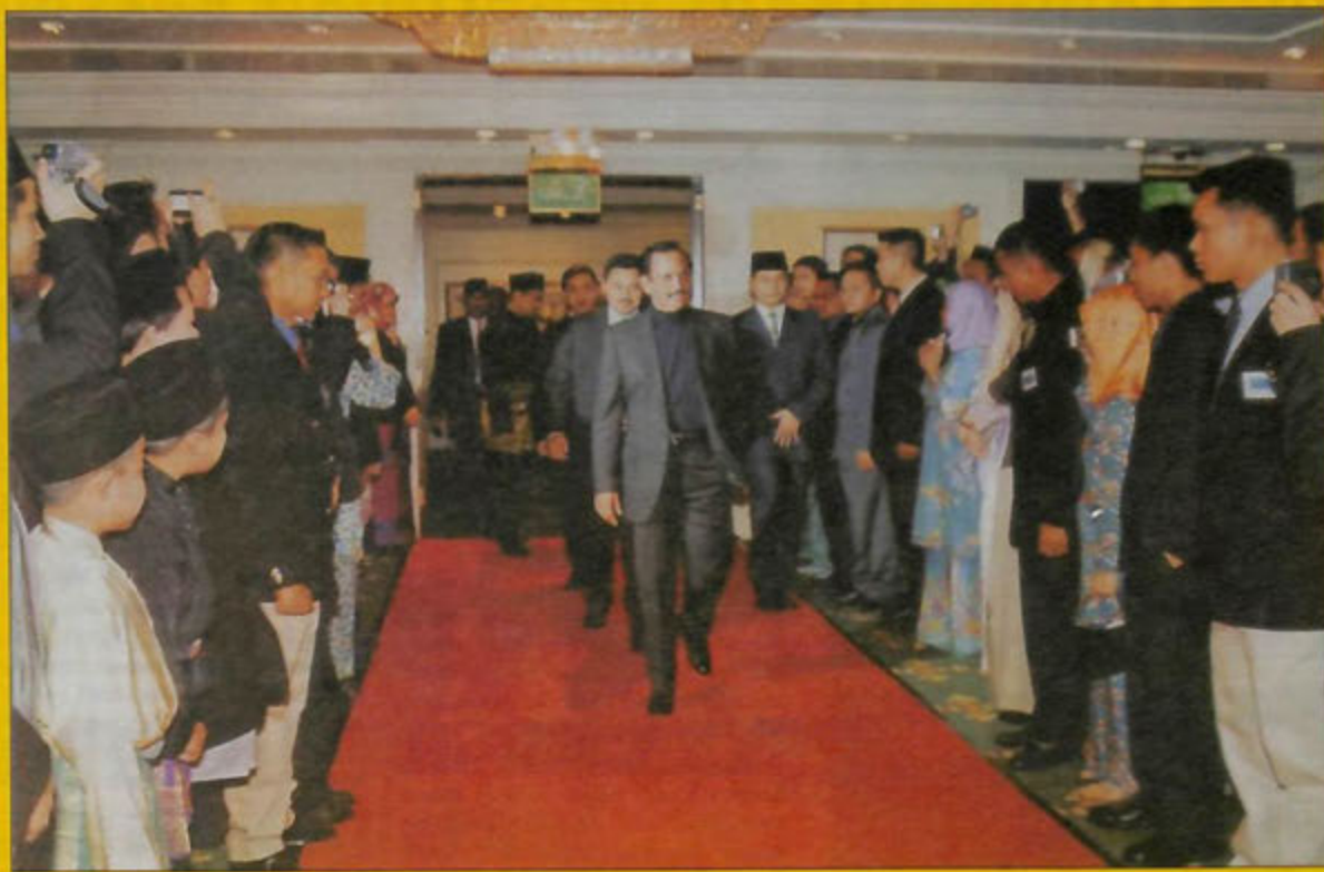
KEBAWAH Duli Yang Maha Mulia Paduka Seri Baginda Sultan Haji Hassanal Bolkiah Mu'izzaddin Waddaulah, Sultan dan Yang Di-Pertuan Negara Brunei Darussalam bersama putera-putera baginda ketika berangkat tiba di sebuah hotel di London bagi Majlis Ramah Mesra Bersama Penuntut-penuntut dan Rakyat Negara Brunei Darussalam di United Kingdom dan Republik Ireland (atas).