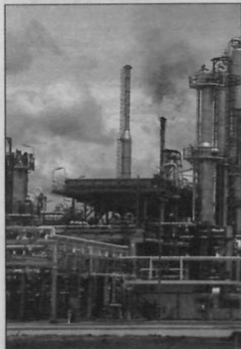
PEMBEKALAN minyak mentah yang berlebihan di pasaran telah mengakibatkan kejatuhan harga minyak dunia pada tahun 1997.