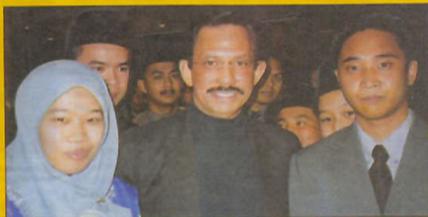
KEBAWAH Duli Yang Maha Mulla berkenan mengabadikan gambar kenangan bersama para penuntut Negara Brunei Darussalam di United Kingdom (bawah). Sementara gambar bawah sekali, Kebawah Duli Yang Maha Mulla Paduka Seri Baginda Raja Isteri dan Duli Yang Teramat Mulla Pengiran Isteri berkenan menerima junjung ziarah para pegawai dan kakitangan Suruhanjaya Tinggi Negara Brunei Darussalam di London sejourus tiba di majlis tersebut.

Surat lebih ber- kian ton. Se- lagi yang baya dari 60 sedang selu- 49 adalah sentera kursus Pejabat 24 angan.