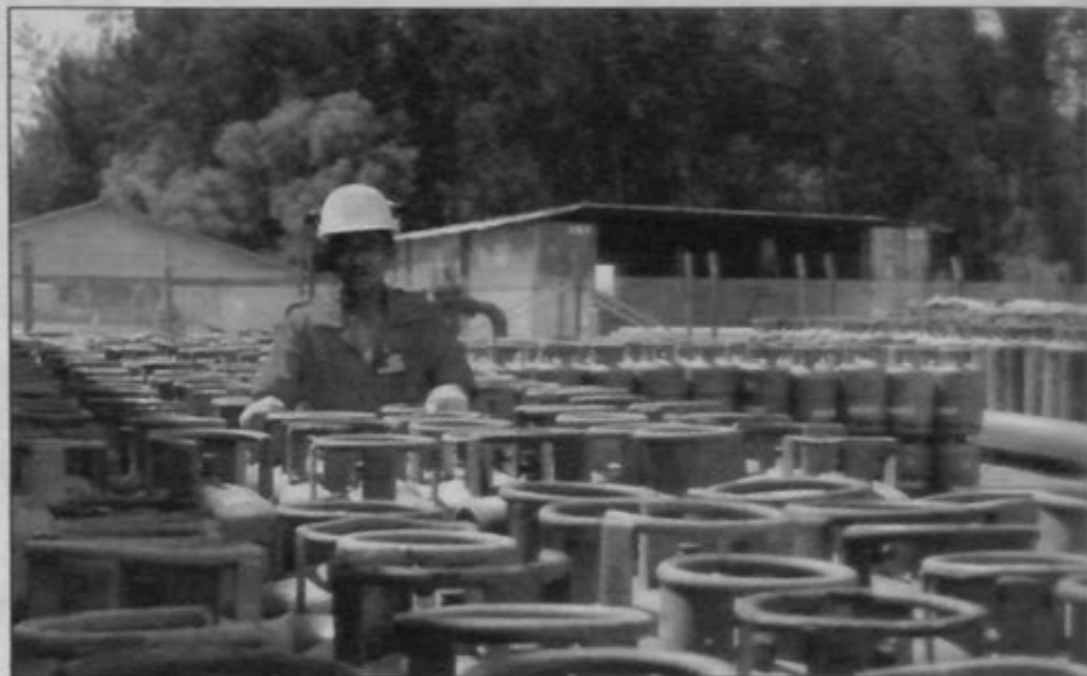
GAS masih memainkan peranan penting dalam sektor tenaga. Bagi bahan ini, Negara Brunei Darussalam telah mengeluarkan gas cecair asli (LNG) sebanyak 6.64 peratus pada tahun 1999.

BDEC telah merangka dua strategi untuk dilaksanakan dalam dua fasa, strategi pertama mengandungi