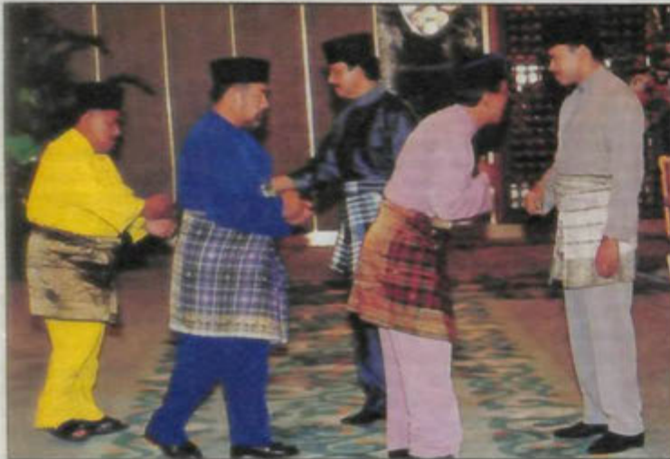
KEBAWAH Duli Yang Maha Mulia Paduka Seri Baginda Sultan Haji Hassanal Bolkiah Mu'izzaddin Waddaulah, Sultan dan Yang Di-Pertuan Negara Brunei Darussalam, Kebawah Duli Yang Maha Mulia Paduka Seri Baginda Raja Isteri Pengiran Anak Hajah Saleha dan Duli Yang Teramat Mulia Pengiran Isteri Hajah Mariam serta Duli Yang Teramat Mulia Paduka Seri Pengiran Muda Mahkota Pengiran Muda Haji Al-Muhtadee Billah berkenan menerima junjung ziarah bakal-bakal jemaah haji Negara Brunei Darussalam yang akan menunaikan ibadat haji pada tahun ini. Majlis berlangsung di Istana Nurul Iman.