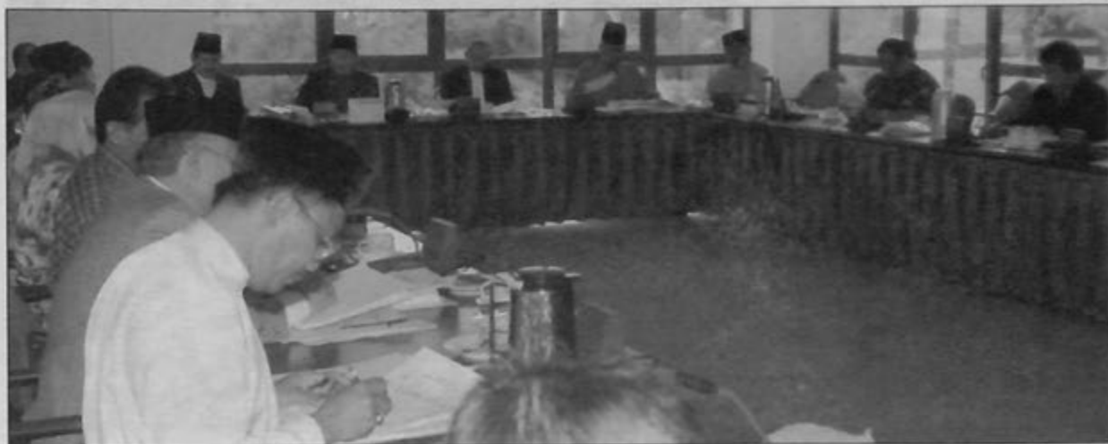
MENTERI Kebudayaan, Belia dan Sukan, Yang Berhormat Pehin Orang Kaya Digadong Seri Lela Dato Seri Paduka (Dr.) Haji Awang Hussain ketika memengerusikan mesyuarat kedua Pengerusi-pengerusi Jawatankuasa Kerja Ulang Tahun Hari Kebangsaan Ke-18.