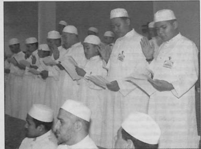
PENUNTUT-PENUNTUT baru Institut Tahfiz Al-Quran Sultan Haji Hassanal Bolkiah membaca Ikrar di Majlis Minggu Pendaftaran dan Taaruf Pelajar Baru Sesi Pengajian 1422 Hijrah/2002 Masihi institut berkenaan.

Sesi taaruf yang diadakan itu antara lain bertujuan bagi melatih dan membiasakan pelajar-pelajar baru dengan kehidupan berasrama.