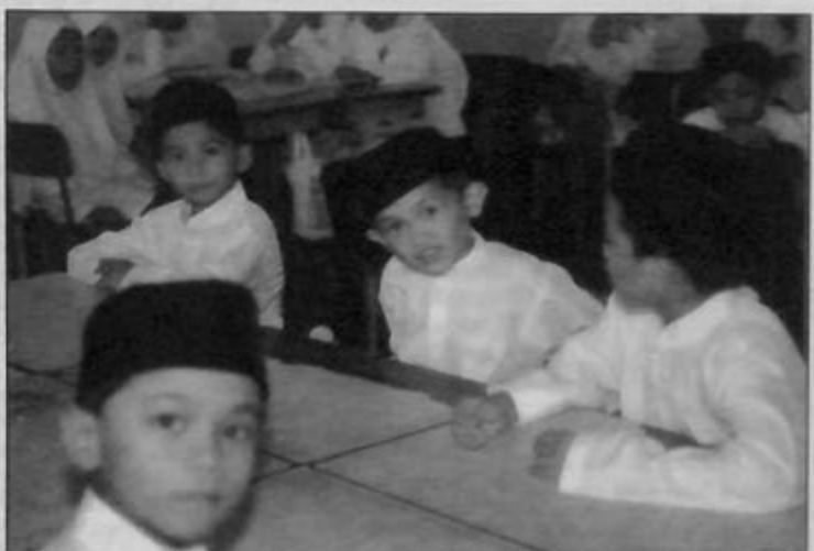
SKIM Rintis Sekolah Sehari Suntut mula dilaksanakan secara serentak pada 14 Januari lalu di 13 buah sekolah rendah dan menengah di negara ini.