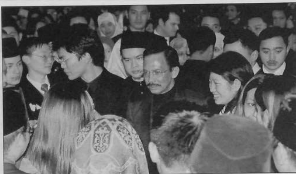
PENUH KESEMBERAN ... Baginda dengan penuh riang gembira beramah mesra bersama sebahagian penuntut Negara Brunei Darussalam yang menuntut di United Kingdom.

SOROTAN titali Kebawah Duli Yang Maha Mulia Paduka Seri Baginda Sultan Haji Hassanal Bolkiah Mu'izzaddin Waddaulah, Sultan dan Yang Di-Pertuan Negara Brunei Darussalam sempena Majlis Ramah Mesra Bersama Penuntut-penuntut dan Rakyat Negara Brunei Darussalam di United Kingdom dan Republik Ireland pada 20 Januari, 2002.