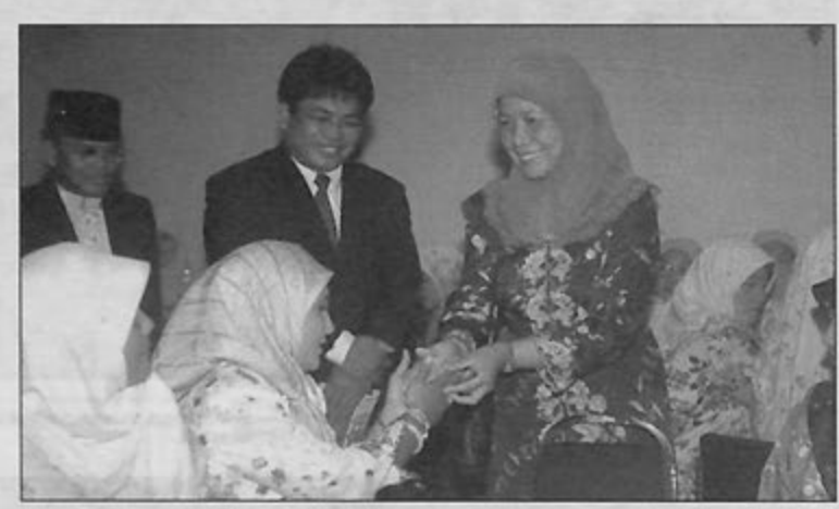
PENGARAH Sekolah-Sekolah ketika beramah mesra bersama guru-guru dan ibu bapa yang menghadiri Majlis Kesyukuran dan Penghargaan Sekolah-sekolah Rendah Daerah Belait.