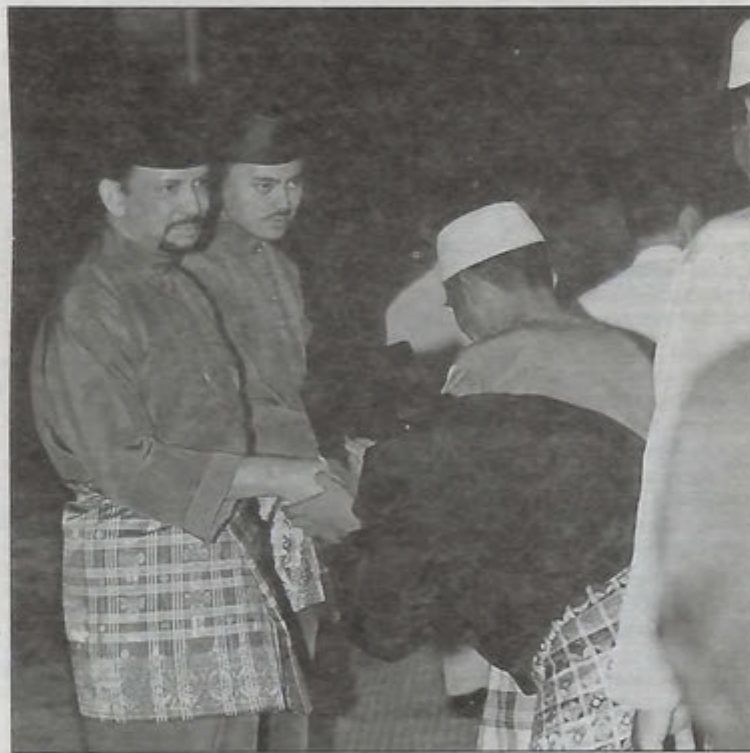
GAMBAR HIASAN ... Berkat kepimpinan Kebawah Duli Yang Maha Mulia Paduka Seri Baginda Sultan dan Yang Di-Pertuan Negara Brunei Darussalam menitikberatkan ajaran agama Islam, keutuhan kebudayaan dan adat resam masyarakat Brunei yang sihat, menjadikan masyarakat Brunei dipuji oleh masyarakat dalam dan luar negara.

Peradaban dan budaya Melayu itu sendiri banyak bersumberkan dari intisari ajaran Islam itu sendiri sebab itu kita lihat orang tua-tua Brunei, mereka itu mempunyai peradaban yang halus/sopan dan cantik dipandang mata seperti hormat-menghormati di antara satu sama lain.