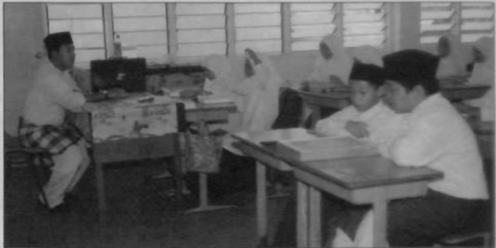
Rencana dan gambar-gambar oleh Dk. Hjh Saidah PHOA

Memang menjadi kebiasaan atau kelaziman setiap pembaharuan yang dilaksanakan itu, walaupun ianya mendatangkan kebaikan namun tidak semua orang boleh menerimanya. Begitu juga dengan Skim Rintis Sekolah Sehari Suntut yang baru dilaksanakan itu. Walhal ianya dapat mem-