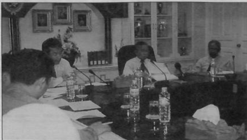
TIMBALAN Menteri Hal Ehwal Dalam Negeri, Yang Mulia Dato Seri Paduka Awang Haji Abidin ketika mengadakan perbincangan semasa mengunjungi Lembaga Bandaran Kuala Belait dan Seria.