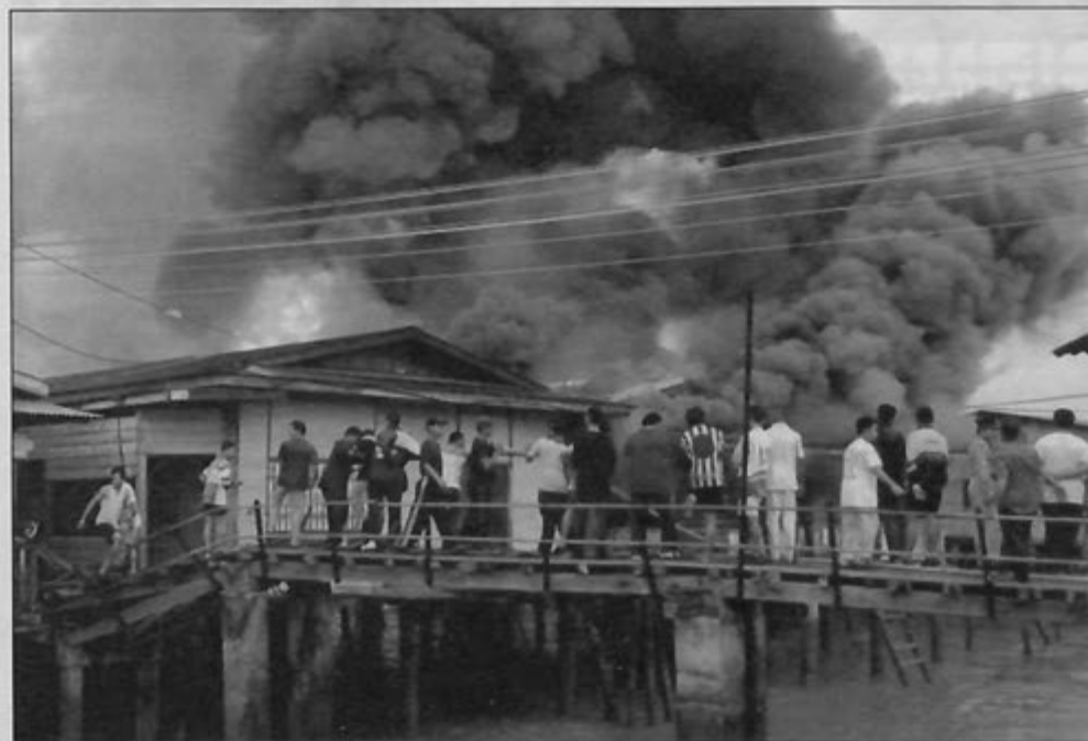
KEJADIAN kebakaran di Kampong Ayer yang berlaku hampir setiap tahun telah banyak memusnahkan harta benda dan lain-lain lagi.

"BERPANDUKAN dari kajian hasil penyiasatan kejadian kebakaran bangunan/rumah berkenaan, punca-punca utama kebakaran bangunan/rumah berlaku adalah disebabkan oleh sikap cuai dan lalai serta sikap kurang prihatin terhadap keselamatan umum," jelas Pengarah Perkhidmatan Bomba semasa sidang akhbar mengenai statistik panggilan kecemasan pada tahun 2001 di ibu pejabat jabatan berkenaan, 22 Januari lalu.