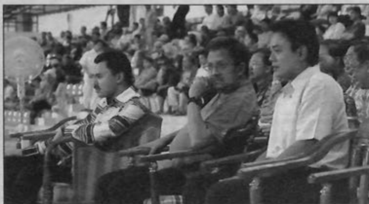
BERANGKAT... Duli Yang Teramat Mulia Paduka Seri Pengiran Muda Mahkota Pengiran Muda Haji Al-Muhadee Billah, Duli Yang Teramat Mulia Paduka Seri Pengiran Bendahara Seri Maharaja Permaisura Pengiran Muda Haji Sufri Bolkiah dan kerabat-kerabat diraja yang lain berangkat menyaksikan Kejohanan Bola Sepak Liga Perdana Dua antara Negara Brunei Darussalam dengan Angkatan Tentera Malaysia.