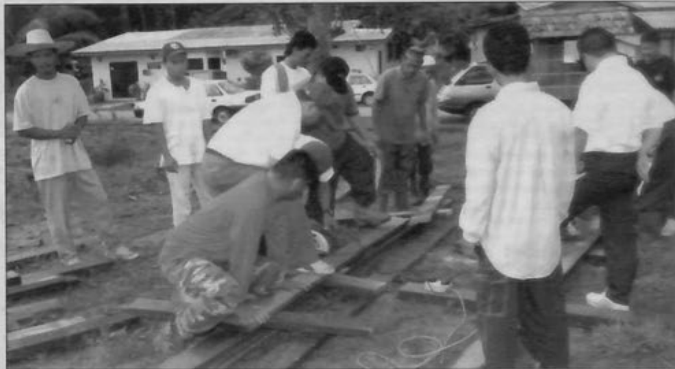
PENDUDUK Kampong Kulapis dan sekitarnya bergotong-royong menyediakan pelbagai peralatan untuk membina jambatan kayu bagi kemudahan mereka dan penduduk kampung-kampung sekitarnya dengan kerjasama Jabatan Daerah Brunei dan Muara.

Dengan siapnya jambatan sementara tersebut senangnya anak-anak murid yang belajar di Sekolah Rendah Katimahar menyeberangi sungai dan pihak ibu bapa