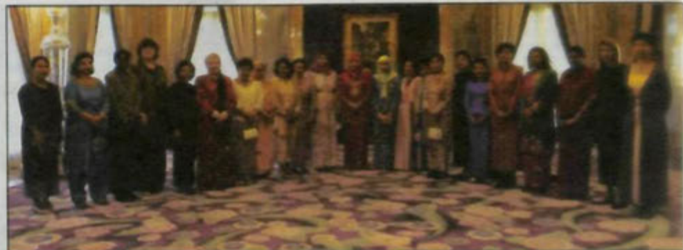
SELAMAT PUJA USIA.... Duli Yang Teramat Mulia Pengiran Isteri Hajah Mariam berkenan menerima mengadap dan bergembira bersama serombongan para isteri perwakilan asing ke negara ini sempena Sambutan Hari Puja Usia Duli Yang Teramat Mulia yang berlangsung di Istana Nurul Izzah, Jerudong. Berangkat sama Yang Teramat Mulia Paduka Seri Pengiran Anak Puteri Fadzilah Lubabul Bulqiah.

Duli Yang Teramat Mulia Pengiran Isteri Hajah Mariam merupakan Penasihat Majlis Wanita Negara Brunei Darussalam.