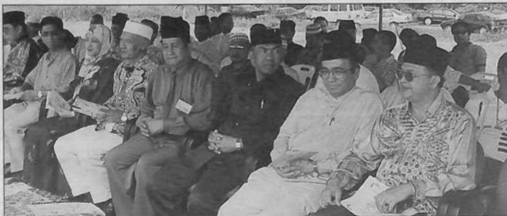
PEGAWAI Daerah Belait, para pengulu, ketua kampung dan jemputan khas ketika hadir di Majlis Perletakan Tiang Asas Stesen Minyak Koperasi Peladang Kampung Sungai Teraban.