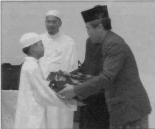
PEGAWAI Tugas-Tugas Khas Kementerian Pendidikan, Dato Seri Setia Awang Haji Kassim ketika menyampaikan Al-Quran kepada seorang penuntut lelaki yang baru diterima belajar di Institut Tahfiz Al-Quran Sultan Haji Hassanal Bolkiah.