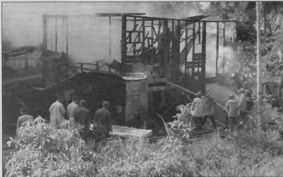
KEBAKARAN bangunan ataupun rumah mencatat panggilan yang kedua tertinggi, iaitu meningkat enam peratus pada tahun lepas jika dibandingkan dengan 94 panggilan tahun 2000.

Jabatan Perkhidmatan Bomba merupakan agensi kerajaan yang dimandatkan dan dipertanggungjawabkan bagi melaksanakan tugas-tugas memadam, menyelamat, mencegah dan perlindungan keselamatan termasuk tugas-tugas peri kemanusiaan.