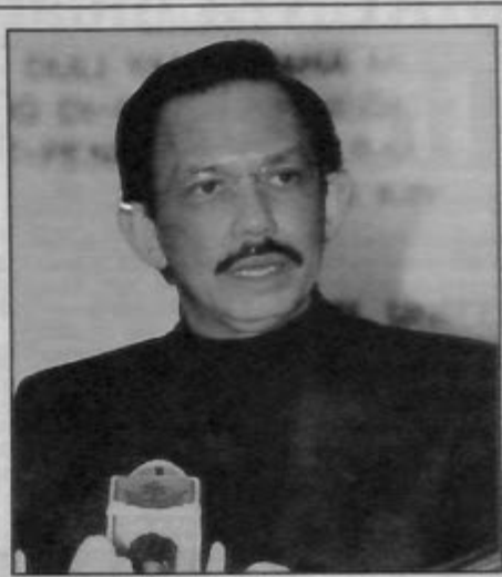
TITAH Kebawah Duli Yang Maha Mulia Paduka Seri Baginda Sultan Haji Hassanali Bolkiah Mu'izzaddin Waddaulah ibni Al-Marhum Sultan Haji Omar 'Ali Saifuddin Sa'adul Khairi Waddien, Sultan dan Yang Di-Pertuan Negara Brunei Darussalam sempena Majlis Ramah Mesra Bersama Penuntut-penuntut dan Rakyat Negara Brunei Darussalam di United Kingdom dan Republik Ireland pada 6 Zulkaedah, 1422/20 Januari, 2002.

Inilah satu contoh kemurahan Allah Subhanahu Wataala kepada kita. Kita patut bersyukur serta