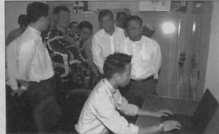
ROMBONGAN pelawat berkesempatan meninjau secara dekat Bahagian Fotografi Jabatan Penerangan.