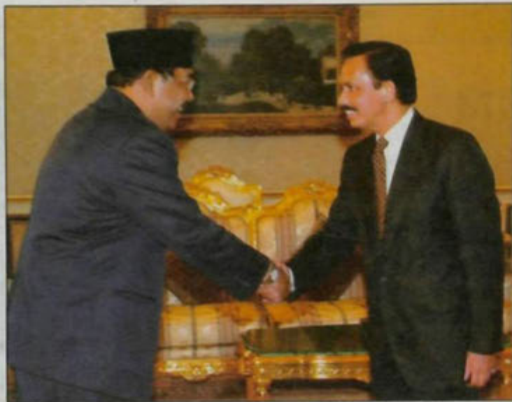
KEBAWAH Duli Yang Maha Mulia Paduka Seri Baginda Sultan Haji Hassanal Bolkiah Mu'izzaddin Waddaulah, Sultan dan Yang Di-Pertuan Negara Brunei Darussalam ketika berkenan menerima mengadap Menteri Pertahanan Republik Indonesia, Yang Berhormat Bapak Haji Matori Abdul Djailil di Istana Nurul Iman.

Baginda merakamkan perasaan gembira di atas hubungan mesra dan persefahaman yang erat yang sentiasa terjalin sejak sekian lamanya di antara Negara Brunei Darussalam dengan Republik India. Baginda seterusnya percaya keadaan sedemikian akan berkekalan dan dipertingkatkan lagi di masa-masa yang akan datang demi kepentingan kedua-dua buah negara serta rakyat masing-masing. Seterusnya baginda berharap semoga Tuan Yang Terutama Tuan Atal Bihari Vajpayee, Perdana Menteri Republik Rakyat India sentiasa sihat sejahtera dan semoga rakyat Republik India akan sentiasa menikmati kemakmuran dan kesejahteraan.