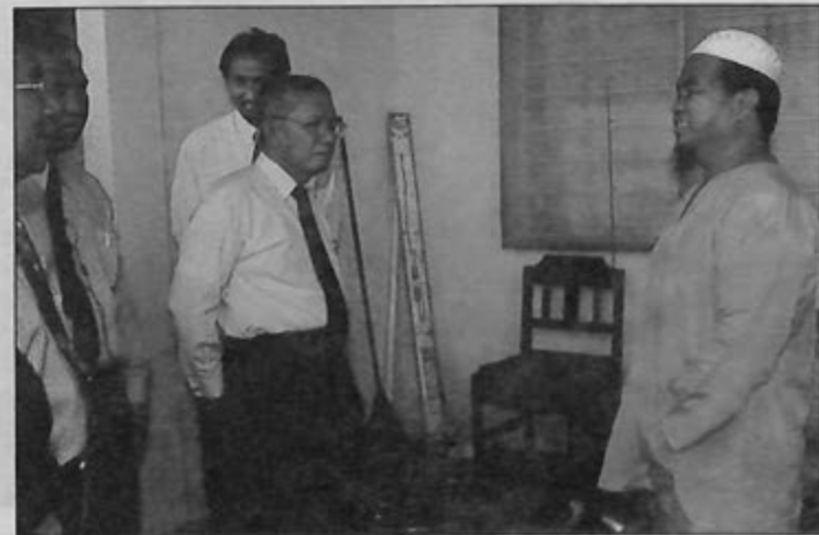
YANG Mulia ketika berbual bersama seorang mangsa kebakaran Berek Lorong Tiga Selatan, Seria yang kini ditempatkan sementara di berek kerajaan, Jalan Bolkiah.

Sebelum peniaga-peniaga yang terlibat di pasar itu dipindahkan semula ke tempat asal mereka, beberapa siri taklimat telah diadakan di antara Jabatan Bandaran Kuala Belait dan Seria dengan beberapa agensi yang lain serta semua peniaga yang terlibat.