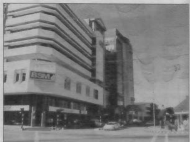
PERSIMPANGAN Jalan Sultan/Jalan Pemancha ketika ini.