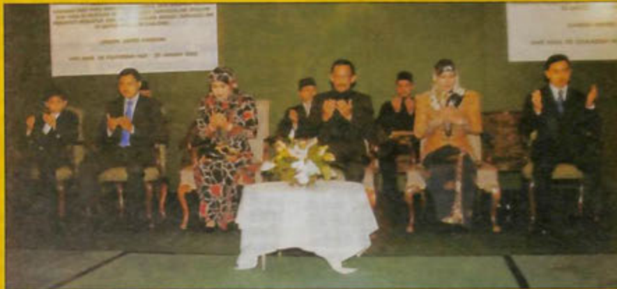
KEBAWAH Duli Yang Maha Mulia, Kebawah Duli Yang Maha Mulia Paduka Seri Baginda Raja Isteri Pengiran Anak Hajah Saleha dan Duli Yang Teramat Mulia Pengiran Isteri Hajah Mariam serta putera-putera baginda menadah tangan ketika doa dibacakan oleh Mufti Kerajaan bagi memberkati majlis (kanan).