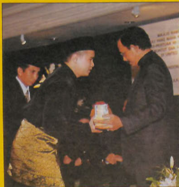
KEBAWAH Duli Yang Maha Mulla Paduka Seri Baginda Sultan Haji Hassanah Bolkiah Mu'izzaddin Waddaulah, Sultan dan Yang Di-Pertuan Negara Brunei Darussalam berkenan menerima pesembah sebagai tanda taat setia ke hadapan majlis baginda oleh Yang Dipertua Persatuan Penuntut-penuntut Negara Brunei Darussalam di United Kingdom (kiri).