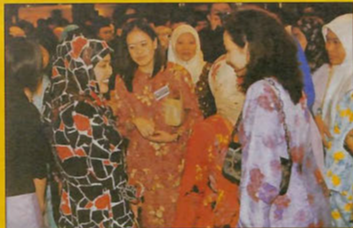
KEBAWAH Duli Yang Maha Mulia Paduka Seri Baginda Raja Isteri Pengiran Anak Hajah Saleha dan Duli Yang Teramat Mulia Pengiran Isteri Hajah Mariam berkenan beramah mesra bersama para penuntut perempuan dari Negara Brunei Darussalam yang mengikuti pengajian di United Kingdom dan Republik Ireland (atas dan atas kanan).