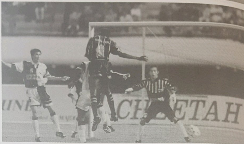
HEBAT.... Kedah jersi gelap bertindak cemerlang dengan membolos pintu gol tuan rumah 4 - 2 dalam perlawanan kedua Liga Perdana Malaysia di Stadium Negara Hassanal Bolkliah Berakas.

Kesemua borang penyertaan itu hendaklah dihantar sebelum 19 April depan, manakala cabutan undi bagi kejuhan ini akan diadakan pada 19 April jam 2 petang bertempat di Padang Menglait.