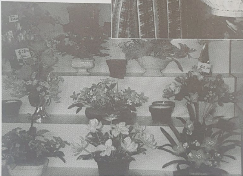
BUNGA-BUNGA yang telah siap digubah dengan beraneka corak yang sangat menarik.

RENCANA DAN GAMBAR-GAMBAR OLEH DK. SAIDAH POA