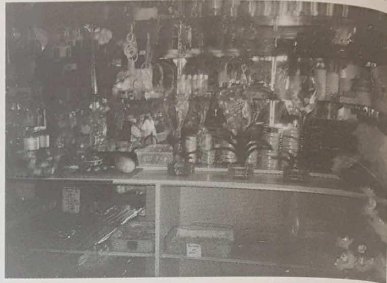
BUNGA yang telah siap sedia berharga antara $30.00 hingga $150.00.

Sementara itu tambahnya, kedainya juga sentiasa menerima kunjungan