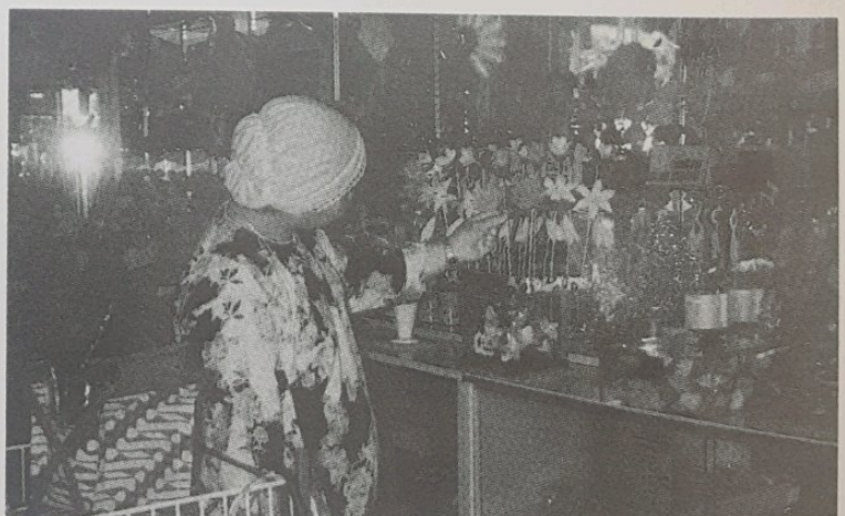
ANTARA jenis gubahan bunga yang banyak menerima tempahan ialah seperti bunga dikir, bunga penyambut, bunga telur, bunga kedudukan dian, bunga tangan dan gubahan bunga perhiasan rumah.