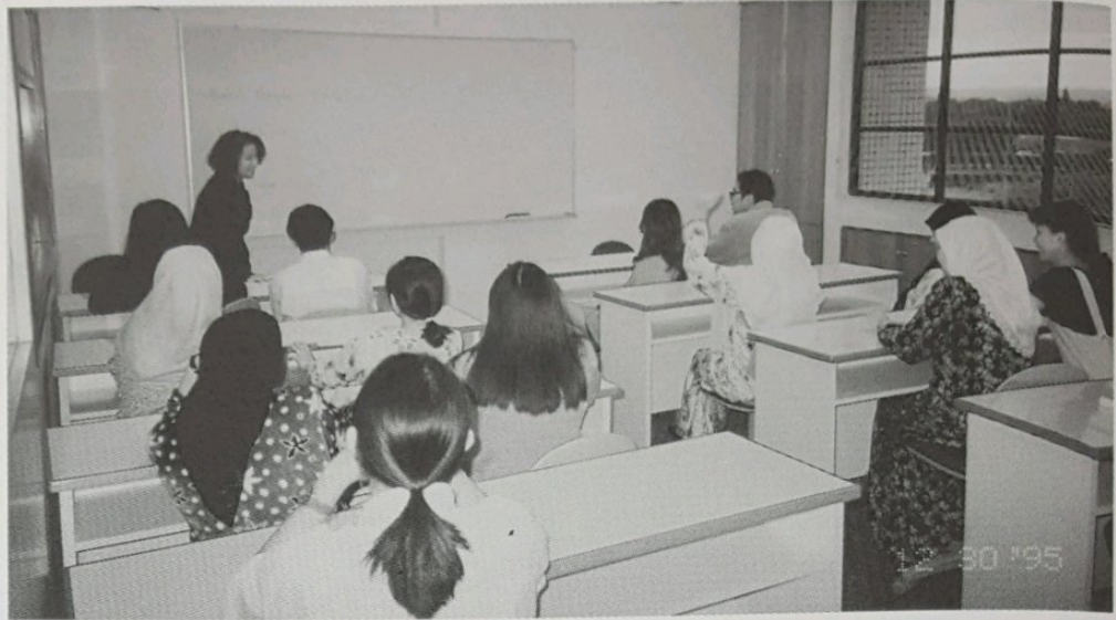
SALAH sebuah sekolah komputer bertempat di Gadong telah diiktiraf oleh Kementerian Pendidikan sebagai sebuah sekolah komputer yang terbaik di negara ini.

Bagi bayaran lain seperti kursus perseorangan dan kumpulan akan dikenakan dengan biaya cara lain. Selalunya peserta yang