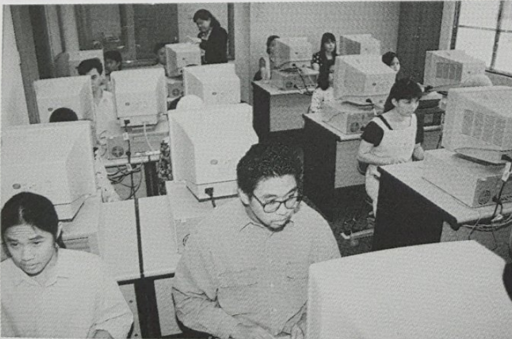
SEBAGIAN daripada pelajar yang menghadiri kelas komputer di salah sebuah sekolah komputer swasta.

Dalam pengajian yang terkini, pihak sekolah juga akan memulakan kelas-kelas Internet dan BruNet yang telah diperkenalkan oleh pihak kerajaan seawat-lewatnya bulan Mac ini. Ini adalah bagi menarik lebih banyak minat dari kalangan orang ramai yang ingin mempelajari khidmat ini.