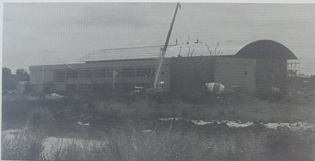
KOMPLEKS sukan juga turut dibina di Daerah Tutong dalam usaha meningkatkan taraf kesukanan negara.

Kemajuan Daerah Tutong tidak dapat disangkalkan lagi, malah kemajuan dan pembangunannya juga sama sepertimana yang dijalankan di daerah-daerah lain. Daerah Tutong juga merupakan daerah penghubung antara Daerah Brunei dan Muara dan Daerah Belait melalui lebuh raya yang kini sedang digunakan.