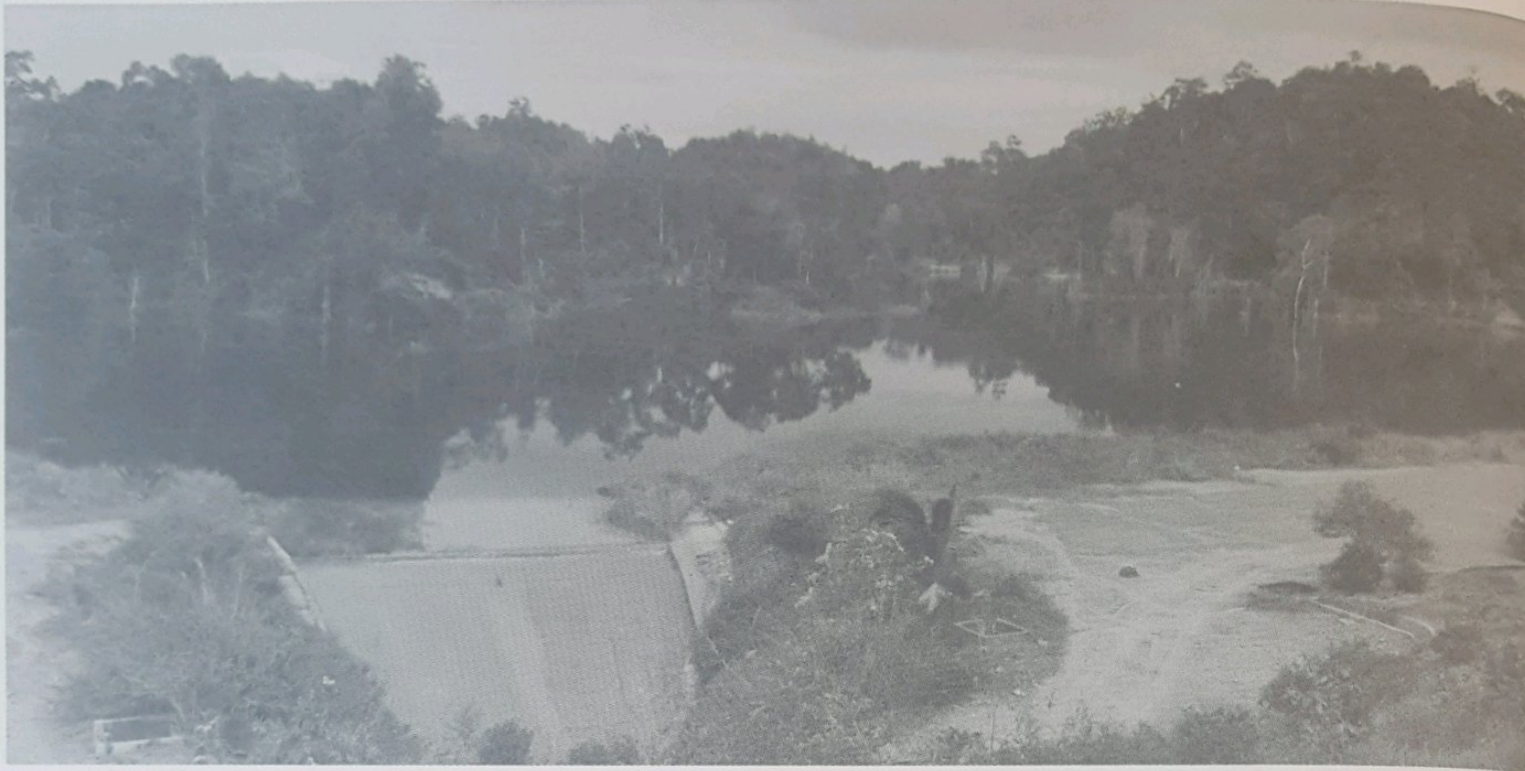
SALAH sebuah taman rekreasi yang baru sedang diusahakan bagi menarik para pelancong ke Daerah Tutong.