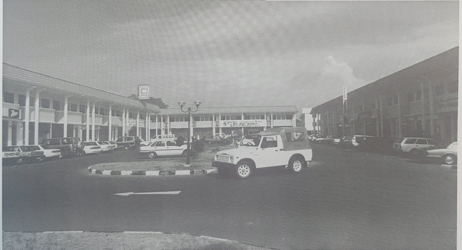
BANGUNAN tambahan Rumah Sakit Tutong, akan dapat mengurangkan kesesakan dan memberikan keselesaan para pesakit dan orang ramai yang berkunjung ke rumah sakit tersebut (atas sekali). Sementara gambar atas memperlihatkan sebahagian Kompleks Membeli-belah Daerah Tutong yang terdapat di Pekan Tutong.