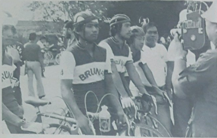
GAMBAR kiri atas sekali dan berikut-nya menunjukkan pasukan lumba basikal dari Brunei di-garisan permulaan perlumbaan dan sedang menerima penerangan manakala gambar yang satu lagi di-ambil ketika pelumba basikal Brunei sedang mengayoh basikal mereka dalam perlawanan uji masa berpasokan.