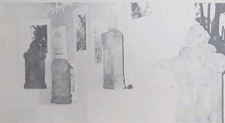
'PAMERAN kesan2 Islam' ia-lah antara achara dalam sambutan tahun 1400 Hijrah. Jawatankuasa yang di-pengerusikan oleh Pengarah Muzium, Pengiran Dato Sharifuddin telah merancang persiapan-nya dengan teliti bagi memperlihatkan aspek2 ke-Islaman di-negeri ini. Pameran tersebut akan di-tempatkan di-Dewan Bandaran, Bandar Seri Begawan.

Kalau orang menyebut2 fasal kebangkitan semula Islam (Islamic Revival) seperti yang di-hebohkan oleh ajensi2 berita luar negeri, hal itu pada kita — dalam konteks negeri kita dengan suasana iklim kita — ia bererti sa-bagai arus kembali kepada berchara hidupkan chara Islam. Dan al-hamduillah, kita telah pun menyatakan hasrat sa-demikian itu. Kita perlu yakin yang kita tidak tersalah pilih sebab yang demikian itu-lah yang di-tuntut Allah kepada kita. Tentu Allah tidak akan menсия2kan masa depan kita. — Ketua Pegawai Penerangan.