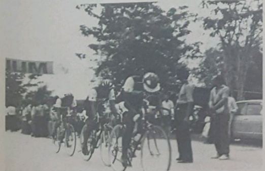
BRUNEI and other 13 countries took part in the Asian Cycling Championships held in Shah Alam, Kuala Lumpur, on Oct 7. The picture shows Brunei's 3 cyclists participating in the 100 kilo-metre "Team Time Trial" race in which Brunei won a 10th place.

The Regiment hopes to complete its tanks squadron with the addition of thirteen Scorpions and one Samson tank in the near future.