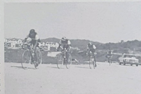
Pelumba2 dari negeri Jepun.