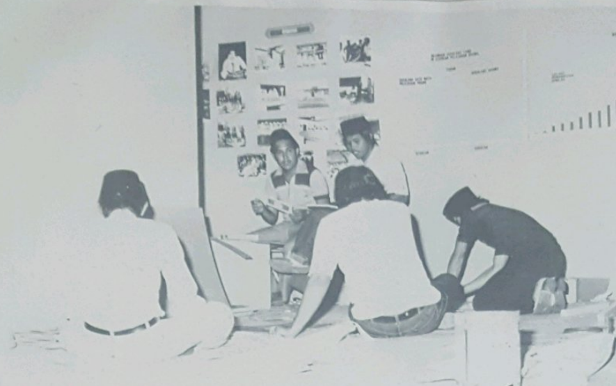
GAMBAR atas kelihatan kakitangan2 Jabatan Muzium, sedang membuat dan menyusun persediaan2 pameran bagi memperingati 1400 Hijrah, yang akan di-mulakan pada 21hb Nobember, 1979 depan. Antara perkara2 yang akan di-pamerkan itu termasuk-lah: Sejarah kedatangan Islam ka-Brunei, Kesan dan Kebudayaan berchorak Islam di-Brunei, Islam dalam pentadbiran negara, Al-Kor'an dan kitab2 Ugama dan Jabatan Hal Ehwal Ugama sa-bagai Pusat Pentadbiran-nya.

Ada-lah di-fahamkan Radio Talivishen Brunei akan membuat siaran terus menerus bagi pembukaan rasmi Pameran Sejarah Perkembangan Islam di-Brunei dari Dewan Bandaran pada jam 9.00 hingga 10.00 pada 21hb Nobember.