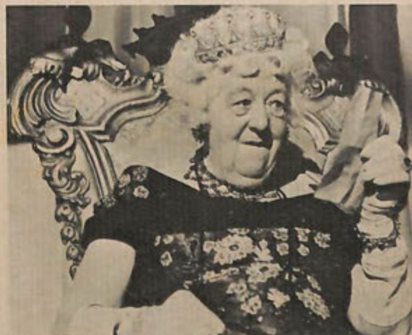
Margaret Rutherford, one of the stars of the Saturday Movie, "The Mouse On The Moon", at 10.20 p.m.