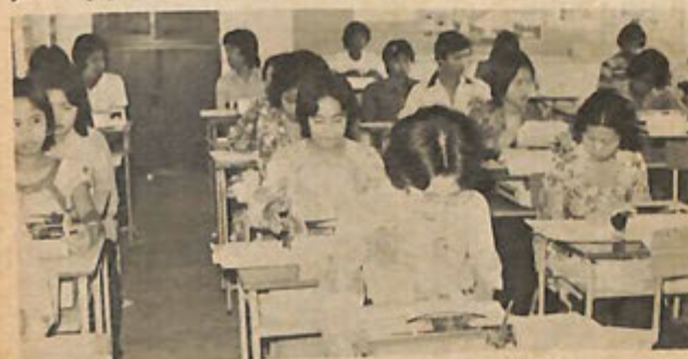
Sa-bahagian dari pelajar kelas menaip yang menduduki peperiksaan TMI dalam menaip permulaan di-pusat peperiksaan Bandar Seri Begawan.

Kalau dalam perengkat ini Kerajaan telah mengeluarkan perbelanjaan purata $60.00 bagi sa-tiap bayaran masuk, maka untuk keseluruhan-nya bayaran masuk peperiksaan tersebut berjumlah $30,840 dan nampak kerugian yang di-tanggung tidak kurang dari $25,700.00.