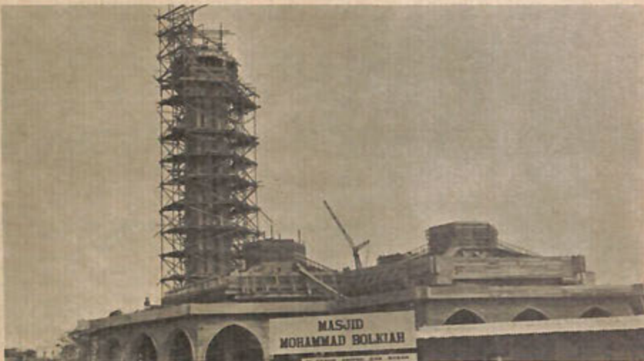
Gambar atas memperlihatkan bangunan Masjid Mohammad Bolkiyah yang letak-nya di-Kampung Delima Satu Berakas, Jalan Muara, sedang dalam pembenaan. Masjid tersebut di-anggarkan menelan belanja sa-banyak $2.8 juta.

Saya selalu menekankan tentang keazaman kita untuk memastikan bahawa ekonomi negara akan di-berikan pendorong yang sa-banyak2-nya untuk membolehkannya bertumbuh dengan subur dan bahawa faedah2 yang men-churah2 datang-nya dari hasil pertumbuhan ini akan dapat di-nekmati oleh semua. Ber bez dengan kebanyakan negeri2 di-dunia yang sedang dalam keadaan porak-peranda oleh perbalahan2 politik dan kedudukan ekonomi yang bergonchang. Negeri Brunei di-rahmati dengan sumber2 asli yang terkaya dengan satu suasana politik yang tenang dalam mengusahakan-nya untuk kebaikan kita bersama. Saya berharap kita akan senantiasanya mengembang tempoh pengusahaan kita ini dengan perasaan penuh kebanggaan.