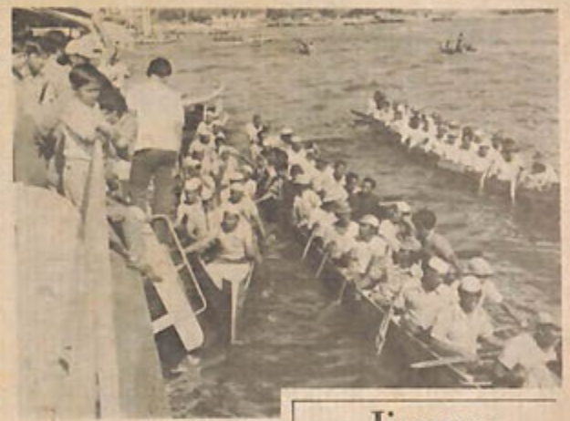
Gambar atas (kanan) menunjukkan pekayoh2 dalam achara perlum-baan 25 orang terbuka, sementara gambar di-sabelah kiri pula me-nunjukkan pelumba dalam achara motor sangkut, pada tahun lalu.