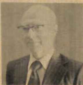
Y.B. Pegawai Kewangan Negara

Kajian kemungkinan bagi sa-buah kilang membuat baja Ammonia/Urea yang di-chadangkan telah pun selesai dan sedang di-pertimbangkan oleh Kerajaan. Ada-lah menjadi tujuan Kerajaan supaya projek2 sa-umpama ini akan dapat di-tubuhkan di-kawasan Perindustrian Muara yang mana sedang di-perluangkan dengan perkhidmatan2 yang penting untuk