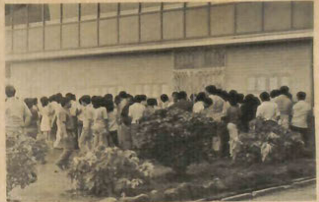
Bersesak2 melihat keputusan peperiksaan seperti gambar di-atas melahirkan sa-ribu tanda-tanya di-hati sa-tiap chalun yang mengambil satu2 peperiksaan itu.

Dengan ini kemajuan pelajaran di-sa-tiap negeri ada-lah juga ber-