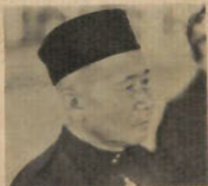
Y.B. Awang Haji Hanafiah

Mengenai dengan peruntukan ganti-rugi Pejabat Letrik, Yang Amat Berhormat itu menjelaskan bahawa yang di-maksudkan dengan ganti-rugi itu ia-lah ganti-rugi ka-atas harta benda orang ramai seperti menebang pokok buah2an yang terlibat dalam kerja2 melalukan wire atau kabel letrik yang mana kebanyakan-nya terdapat di-kampung2.